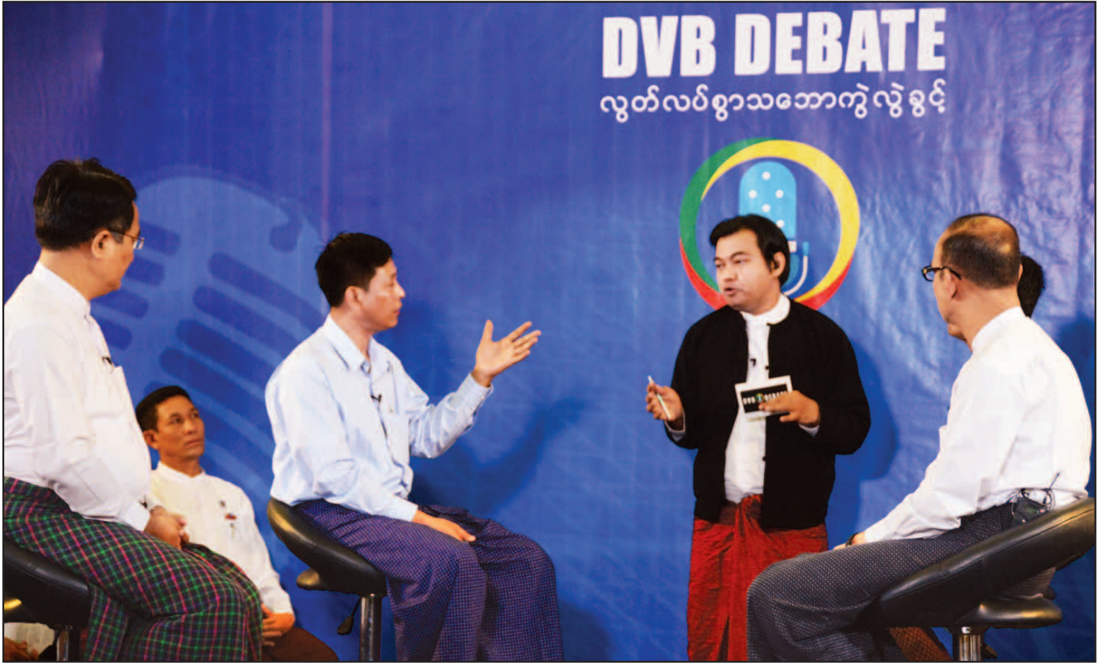
DVB DEBATE အစီအစဉ်ကို နေပြည်တော်ရှိ Excel Capital Hotel တွင် ဧပြီ ၂ ရက်က ကျင်းပစဉ်။

ရှင်မင်း အစိုးရသစ်လက်ထက် ရက်ပေါင်း ၁၀၀ အတွင်း ဘာတွေ ဦးစားပေး ဆောင်ရွက် သွားမလဲ၊ ဘယ်လို ဆောင်ရွက်သွားမလဲဆိုတာ ပြည်သူ စိတ်အဝင်စားဆုံး ကိစ္စရပ် အနေနဲ့ ရပ်တည်လျက်ရှိပါတယ်။ မျှော်လင့်ချက်များစွာကို အကောင် အထည်ဖော်ရမယ့် အစိုးရသစ်အတွက် စိန်ခေါ်မှုတွေများစွာ ကျော်ဖြတ်ရမှာ ဖြစ်တဲ့အတွက် ရင်မောစရာ အခြေ အနေလို့လည်း ပြောနိုင်ပါတယ်။ ဒီမိုကရေစီရင့်ကျက်တဲ့ အနောက် အုပ်စုနိုင်ငံတွေမှာ အစိုးရသစ်တက်ပြီး ရက်ပေါင်း ၁၀၀ ကို ပျားရည်ဆမ်း ကာလလို့ တင်စားသော်လည်း ဒီမို ကရေစီ လျှောက်လှမ်းစ မြန်မာနိုင်ငံ မှာတော့ အစိုးရသစ်ဟာ လိုအပ်ချက် များစွာအတွက် အနာနဲ့ ဆေး တည့်အောင်ပေးနိုင်ဖို့ ကြိုးစားရမှာ ဖြစ်ပါတယ်။ အစိုးရသစ်ရဲ့ ရက်ပေါင်း ၁၀၀ အတွင်း ဆောင်ရွက်ရမှာတွေအပေါ် သုံးသပ် ပြောကြားချက်တွေ ထင်မြင် ယူဆချက်တွေ မြန်မာ့ နိုင်ငံရေး လောကအတွင်းနဲ့ လူမှုထုတ်ကုန်ရက် ပေါ်မှာ အမျိုးမျိုးပေါက်နေပြီး တော့ ပြည်သူတွေရဲ့ ရင်ခုန်သံတွေနဲ့ စာမျက်နှာ ၈ ကော်လံ ၁ သို့