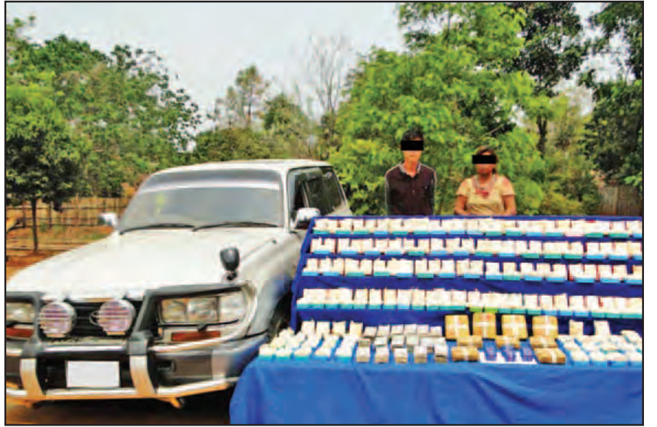
လီလောက်အယ်နှင့် ရန်ရွှေချင့်တို့အား သိမ်းဆည်းရမိ မူးယစ်ဆေးဝါးများနှင့်အတူ တွေ့ရစဉ်။