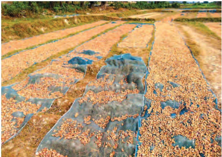
ဧပြီလဝက်လောက်အထိ တစ်လခန့်သာ လုပ်ငန်းလုပ်ကိုင်ရပြီး ပေါင်မြို့နယ်အတွင်းထွက်ရှိသော မရမ်းခြောက်များကို ရန်ကုန်ခိုင်းများသို့ မရမ်းယိုထုတ်လုပ်ရန် အများဆုံး တင်ပို့ရကာ အခြောက်တစ်ပိဿာလျှင် ယခင်နှစ်က ကျပ် ၂၆၀၀ မှ ၃၀၀၀ ဝန်းကျင်သာရရှိခဲ့ပြီး ယခုနှစ်တွင် ကျပ် ၃၅၀၀ ဝန်းကျင်ခန့်ရရှိရန် မျှော်မှန်းနေကြောင်း မရမ်းခြောက်လုပ်ငန်း လုပ်ကိုင်သူများထံမှ သိရသည်။ သက်ဦး(သထုံ)

ယုံကပြောသည်။ ယခင်နှစ်က မရမ်းသီးအစိမ်း တစ်ပိဿာလျှင် ကျပ် ၄၀၀ ခန့်ဖြင့် ဝယ်ယူရပြီး အလုပ်သမားတစ်ဦးလျှင် နေ့တွက်စရိတ် ကျပ် ၃၈၀၀ နှင့် ၄၀၀၀ ဝန်းကျင်ခန့်သာ ပေးရသော်လည်း ယခုနှစ်တွင် မရမ်းသီးအစိမ်း တစ်ပိဿာ ကျပ် ၅၀၀ ဈေးပေါက်နေကာ အလုပ်သမားတစ်ဦးလျှင် နေ့တွက်စရိတ် ကျပ် ၄၀၀၀ မှ ၅၀၀၀ ဝန်းကျင် ပေးနေရကြောင်း မရမ်းသီးအစိမ်း ငါးပိဿာတွင် အခြောက် တစ်ပိဿာ ခန့်သာထွက်ရှိပြီး မရမ်းအခြောက်များ ဈေးနှုန်းမတက်ဘဲ ထုတ်လုပ်နိုင်မှုလည်းနည်းသဖြင့် တွက်ခြေမကိုက်ခြင်းဖြစ်ကြောင်း ၎င်းက ဆက်လက်ပြောသည်။ ကုန်ဈေးနှုန်းများ မြင့်တက်နေပြီး အိမ်အသုံးစရိတ်များ မြင့်နေရာ နေ့တွက်စရိတ် ကျပ် ၄၀၀၀ နှုန်းမှာ မိသားစု စားဝတ်နေရေးအတွက် လောက်ငှရုံသာရှိကြောင်း မရမ်းခြောက်လုပ်ငန်းတွင် နေ့စားလုပ်ကိုင်သူ အလုပ်သမားတစ်ဦးက ပြောသည်။ မရမ်းအခြောက် တစ်ပိုင်တစ်နိုင် လုပ်ငန်းများမှာ မတ်လဆန်းပိုင်းမှ