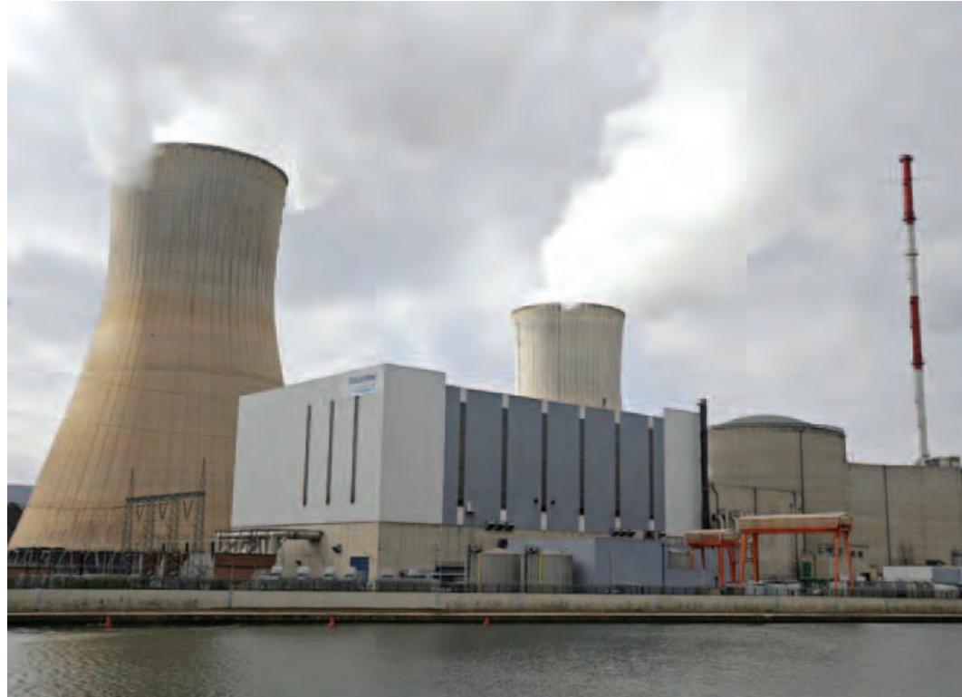
ဘယ်ဂျီယံနိုင်ငံရှိ တီဟန်းနျူကလိယစက်ရုံကို တွေ့မြင်ရစဉ်။

စည်ရာ တွေးတောလျက်ရှိကြသည်ဟု လုံခြုံရေးပညာရှင်များက သတိပေးကြလေသည်။ 'နဂါးတို့မျက်စောင်း အကြောင်းမရွေးဘူး' ဟု အကြမ်းဖက်သမားတို့က ဟန်ပန်လေလန်ထားကြသည်။ အကြမ်းဖက်သမားများ၏ ခြိမ်းခြောက်သံများကို ကျွန်ုပ်တို့ ကြားရဖန်များ၍ ဟုံသွားခြင်းမရှိအပ်။ အကြောင်းမူကား အတင့်ရဲသောကျားသည် ရွာထဲသို့ဝင်၍ လူ၊ ခွေး၊ ဝက်တို့ကို ကိုက်ရန် စောင့်စားတတ်ဘိသကဲ့သို့ အကြမ်းဖက်သမားကလည်း သာယာခြိမ်းချမ်းသော လူ့အဖွဲ့အစည်းအတွင်း စီးနင်းတိုက်ခိုက်ရန် ကျားချောင်း ချောင်းနေသောကြောင့်တည်း။