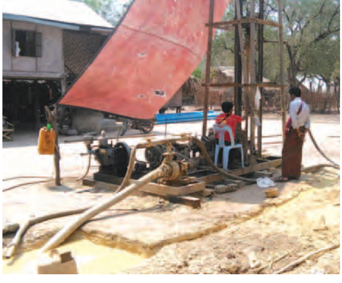
ကိုနေ(ကျောက်ပန်းတောင်း)

တောင်တွင်းကြီး ဧပြီ ၂ မကွေးတိုင်းဒေသကြီး တောင်တွင်းကြီးမြို့နယ်စည်ပင်သာယာရေးအဖွဲ့ဝင် မြို့မဈေးကြီးအတွင်းရှိ ဈေးဆိုင်ခန်းများ မီးဘေးအန္တရာယ်ကြိုတင်ကာကွယ်ရေးအတွက် မတ် ၃၀ ရက် မွန်းတည့် ၁၂ နာရီက ကွင်းဆင်းစစ်ဆေးခဲ့ကြောင်း သိရသည်။ ယင်းနေ့က မြို့နယ်စည်ပင်သာယာရေးကော်မတီဥက္ကဋ္ဌနှင့်အဖွဲ့ဝင်များ၊ မြို့နယ်အထောက်အကူပြုကော်မတီများ၊ မြို့နယ်မီးသတ်ဦးစီးမှူးနှင့် မီးသတ်တပ်ဖွဲ့ဝင်များက မြို့မဈေးကြီးအတွင်း အပြင်မှ ဈေးဆိုင်ခန်းများ မီးသတ်ဆေးဘူးစသည် မီးငြိမ်းသတ်ရေးပစ္စည်းများရှိ မရှိ မီးသတ်ရေလျှောင့်ကန်နှင့် မီးငြိမ်းသတ်ရေးကိရိယာများ ပြည့်စုံလုံလောက်မှု ရှိ မရှိ ဆိုင်ခန်းများ၌ သွယ်တန်းထားသည့် လျှပ်စစ်ဝါယာကြိုးများအားစစ်ဆေးခဲ့ကြသည်။