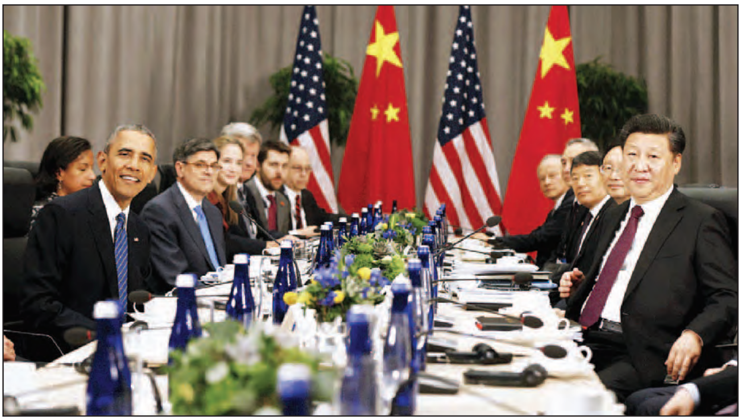
အမေရိကန်သမ္မတ အိုဘားမားနှင့် တရုတ်သမ္မတ ရှီကျင့်ဖျင်တို့ နျူကလီးယားလုံခြုံရေး ထိပ်သီးအစည်းအဝေးအပြီး သီးခြားတွေ့ဆုံစဉ်။

ပြင်းအားမျိုးမရှိခဲ့တာကို တွေ့ရပါတယ်။ ရရှိခဲ့တဲ့ အချက်အလက်တွေအရ ဇန်နဝါရီ ၆ ရက် နျူကလီးယားဗုံးစမ်းသပ်ဖောက်ခွဲမှု ပြင်းအားဟာ ၁၀ ကီလိုတန်ပဲရှိလို့ ဟိုက်ဒရို ဂျင်ဗုံးမှာရှိရမယ့် ပုံမှန်ပြင်းအားထက်အများ ကြီးနည်းနေပါတယ်။ ဒါကြောင့် ကျွမ်းကျင်သူ ပညာရှင်တွေကတော့ မြောက်ကိုရီးယားရဲ့ ဇန်နဝါရီ ၆ ရက် နျူကလီးယားဗုံး စမ်းသပ် ဖောက်ခွဲမှုကို ဟိုက်ဒရိုဂျင်ဗုံးလို့ မယူဆကြ ပါဘူး။ ဖေဖော်ဝါရီ ၇ ရက်ပြိုဟ်တုတ်လုံးထုတ်မှုကို နျူကလီးယားဗုံး ထိပ်ဖူးသယ်နိုင်စွမ်းအား စမ်းသပ်တာလို့ ရှုမြင်ကြပါတယ်။ ရရှိထားတဲ့ အချက်အလက်တွေအရ ဖေဖော်ဝါရီ ၇ ရက် က ပြိုဟ်တုတ်လုံးထုတ်တဲ့ ခုံးပျံ့ဟာ အလေး ချိန် ကီလိုဂရမ် ၅၀၀ (ပေါင် ၁၀၀၀) ကို သယ်ဆောင်နိုင်ပြီး အကွာအဝေး ကီလိုမီတာ ၁၃၀၀၀ (မိုင် ၈၀၀၀) လောက် ရောက်အောင် သွားနိုင်ပါတယ်။ တာဝေးပစ် နျူကလီးယား ထိပ်ဖူးတပ် ခုံးပျံ့တွေဟာ အနည်းဆုံး ကီလိုမီတာ ၅၅၀၀ အထက် ပစ်လွှတ်နိုင်ရမှာဖြစ်လို့ ဖေဖော်ဝါရီ ၇ ရက်က ပြိုဟ်တုတ်လုံးထုတ်တဲ့ ခုံးပျံ့ဟာ ကီလိုမီတာ ၁၃၀၀၀ ပစ်လွှတ်နိုင်လို့ တာဝေးပစ်ဗုံးပျံလို့ ပြောနိုင်ပါတယ်။ ကီလို မီတာ ၁၃၀၀၀ ပစ်လွှတ်နိုင်တယ်ဆိုတဲ့ အဓိပ္ပာယ်က အမေရိကန် နိုင်ငံရဲ့ ဘယ်ဒေသ ကိုမဆို ပစ်ခတ်နိုင်စွမ်းရှိတယ်ဆိုတဲ့ အဓိပ္ပာယ်ပါ။ သယ်ယူနိုင်တဲ့ အလေးချိန် ကီလိုဂရမ် ၅၀၀ ဆိုတာကလည်း နျူကလီးယား ဟာ ထိပ်ဖူးကို သယ်ယူနိုင်တယ်ဆိုတဲ့ အဓိပ္ပာယ်မျိုးပါ။ မြောက်ကိုရီးယားနိုင်ငံရဲ့ အဓိကအားနည်းချက်ကတော့ ဖေဖော်ဝါရီ ၇ ရက်က ပစ်လွှတ်လိုက်တဲ့ ခုံးပျံ့ကို အင်မတန် ကြီးမားတဲ့ ခုံးပျံ့ပစ်စင် (Launch Pad) ကို နေရာတစ်နေရာမှာ ရက်အတော်များများ အချိန်ယူပြီး အသေတည်ဆောက်ထားရတာ ပါ။ ဒီလိုကြီးမားတဲ့ ခုံးပျံ့ပစ်စင်မျိုးကို အချိန်မီ ထောက်လှမ်းဖျက်ဆီးဖို့က အတော်ကြီးကို လွယ်ကူပါတယ်။ မြောက်ကိုရီးယားနိုင်ငံဟာ