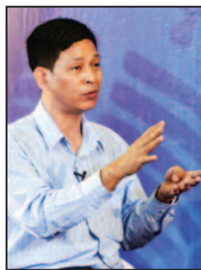
သမ္မတရုံး ဒုတိယညွှန်ကြားရေးမှူးချုပ် ဦးဇော်ဌေး