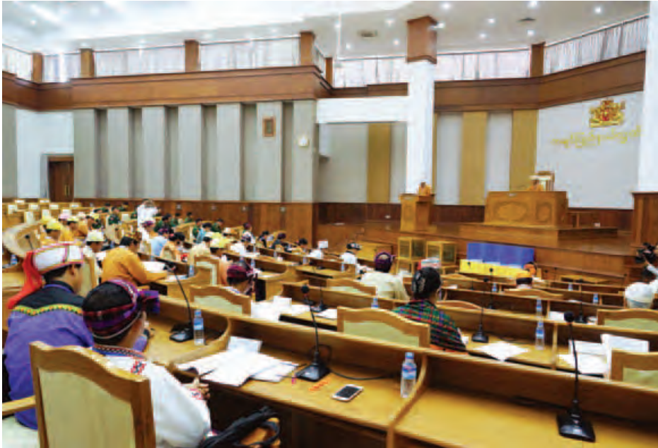
ဒုတိယအကြိမ် ကချင်ပြည်နယ်လွှတ်တော် ပထမပုံမှန်အစည်းအဝေး (၁၁)ရက်မြောက်နေ့ ကျင်းပစဉ်။