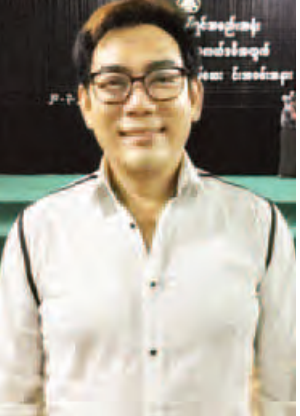
အကယ်ဒမီရန်အောင်