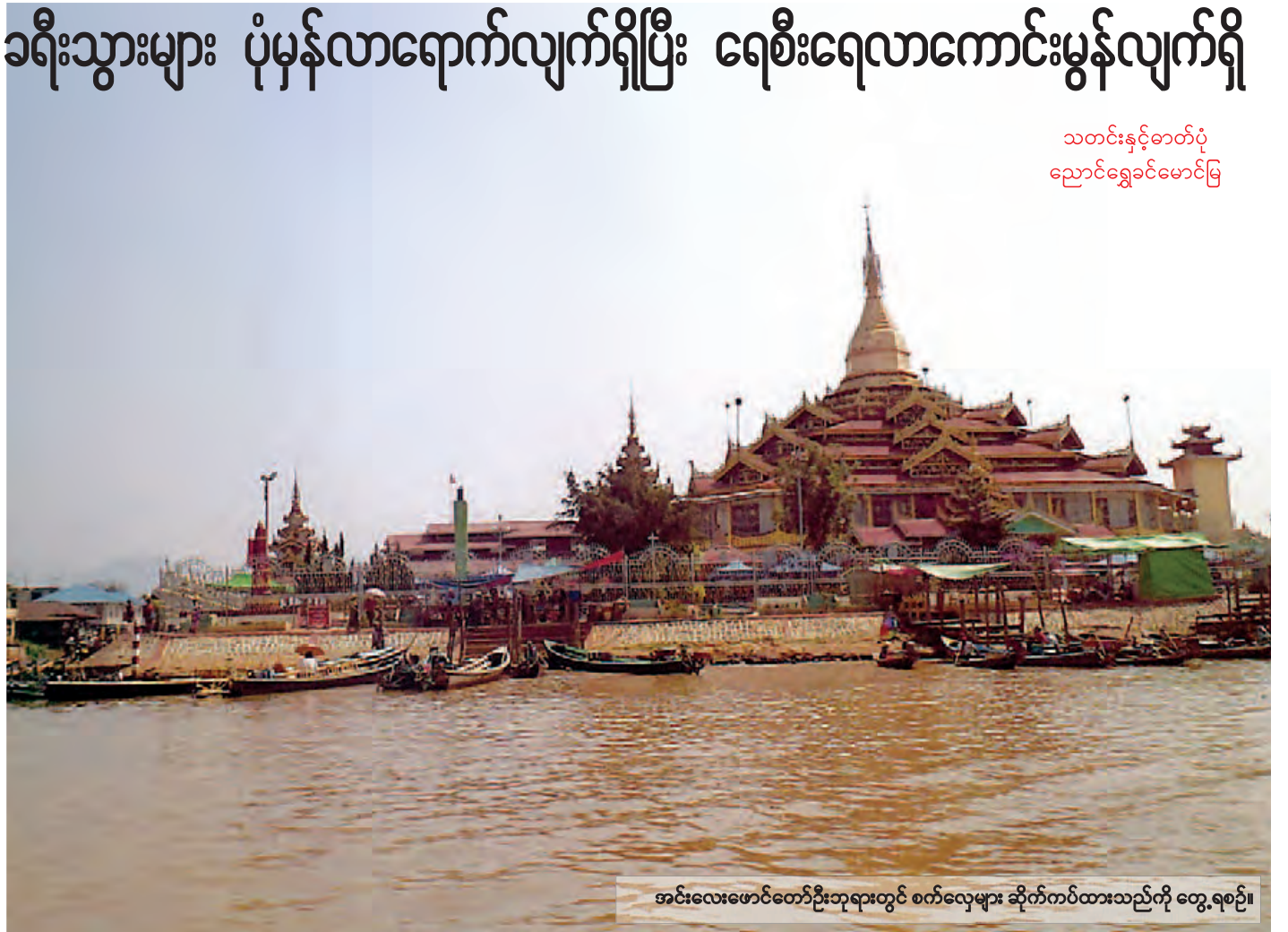
အင်းလေးဖောင်တော်ဦးဘုရားတွင် စက်လေ့များ ဆိုက်ကပ်ထားသည်ကို တွေ့ရစဉ်။

မန္တလေးသင်္ကြန်တွင် ရွှေခြေချင်းဝတ်ပြီး ရွှေပလား၊ ငွေပလားကိုကာ သပြေခက်နှင့် ရေကစားမည်