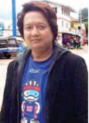
အကယ်ဒမီ ဒါရိုက်တာပိုင်