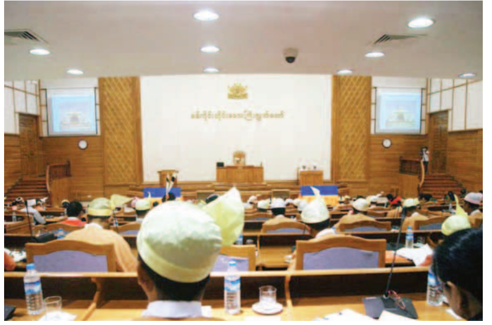
ဒုတိယအကြိမ် စစ်ကိုင်းတိုင်းဒေသကြီးလွှတ်တော် ပထမပုံမှန်အစည်းအဝေး သတ္တမနေ့ ကျင်းပစဉ်။