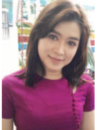
အကယ်ဒမီ အိန္ဒြာကျော်ဇင်

အတွက်ပဲ စေတနာထားပြီး အစ်ကိုတို့ သရုပ်ဆောင်ခဲ့ကြတာချည်းပါပဲလေ။ အဲလိုကိုယ်ရဲ့ သရုပ်ဆောင်မှုကို အသိအမှတ်ပြုပြီးတော့ ဒီလိုအကယ်ဒမီထင်ကြေးပေးခံရတယ်ဆိုတာလည်း အနုပညာရှင်တိုင်းပါပဲ။ အစ်ကို့မှမဟုတ်ပါဘူး။ ပရိသတ်ရဲ့ အားပေးသံကြားတာနဲ့တင် အားလုံးက ပျော်နေကြပါပြီ။ အကယ်ဒမီရန်အောင် အကယ်ဒမီနဲ့ပတ်သက်ပြီး အစ်ကို့က ရင်ခုန်ရမှာလား။ ခုန်တယ်။ (ရယ်လျက်) ဘယ်လိုပဲဖြစ်ဖြစ်လေ နှစ်နှစ်ပေါင်းပေးတယ် ဆိုတော့ အစ်ကို့တို့ကားလေးလည်း ပါတယ်လေ။ ပါတဲ့အခါကျတော့ အစ်ကို့တို့လည်း ရင်ခုန်ရပါတယ်။ အစ်ကို့မှ