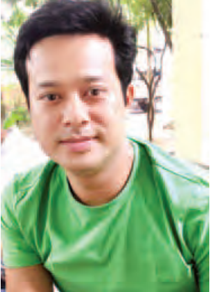
အကယ်ဒမီ ပြေတီဦး