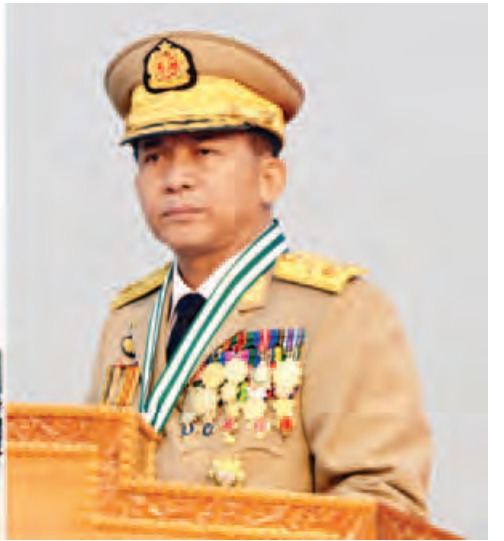
တပ်မတော်ကာကွယ်ရေးဦးစီးချုပ် ဗိုလ်ချုပ်မှူးကြီး မဟာသရေစည်သူ မင်းအောင်လှိုင် မိန့်ခွန်းပြောကြားစဉ်။