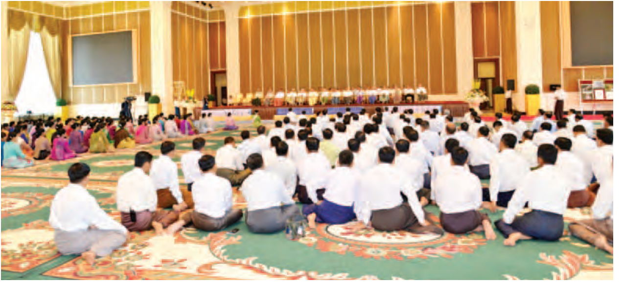
(၇၁)နှစ်မြောက် တပ်မတော်နေ့အခမ်းအနားသို့ တက်ရောက်ခဲ့ကြသော တပ်မတော်တွင် တာဝန်ထမ်းဆောင်ခဲ့သည့် အငြိမ်းစားအရာရှိကြီးများအား တပ်မတော် (ကြည်း၊ ရေ၊ လေ)မိသားစုများက ဂါရဝပြု ကျင်းပစဉ်။

ထို့နောက် တပ်မတော်အငြိမ်းစားအရာရှိကြီးများကိုယ်စား ဗိုလ်ချုပ်