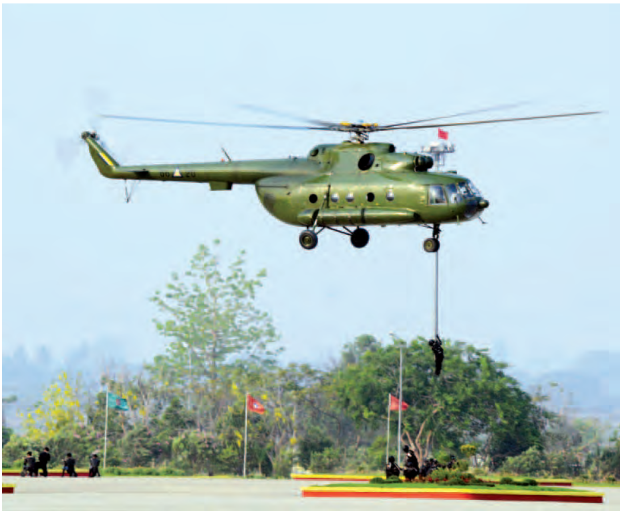
တပ်မတော်(ရေ)မှ ရေတပ်စစ်ဆင်ရေးအထူးတပ်ဖွဲ့ (Navy SEALs)မှ အရာရှိစစ်သည်များ။ (သတင်းစဉ်)

အခြေခံဥပဒေအရ အပ်နှင်းထားသည့် တပ်မတော်၏ အမျိုးသားနိုင်ငံရေးတာဝန်များ ကို လေ့လာကြည့်မည်ဆိုလျှင် မိမိတို့နိုင်ငံ၏ အမျိုးသားအကျိုးစီးပွားကို ထိန်းသိမ်း စောင့်ရှောက် အကောင်အထည်ဖော်ရန် အတွက်သာဖြစ်သည်ကို ရှင်းရှင်းလင်းလင်း တွေ့မြင်နိုင်မည်ဖြစ်