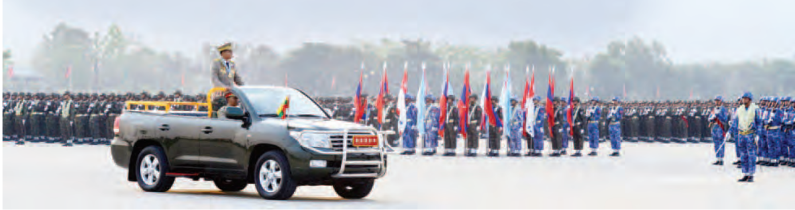
တပ်မတော်ကာကွယ်ရေးဦးစီးချုပ် ဗိုလ်ချုပ်မှူးကြီး မဟာသရေစည်သူ မင်းအောင်လှိုင် စစ်ရေးပြစစ်ကြောင်းကြီးများအား စစ်ဆေးစဉ်။ (သတင်းစဉ်)

(၇၁)နှစ်မြောက်တပ်မတော်နေ့ စစ်ရေးပြအခမ်းအနားကျင်းပ