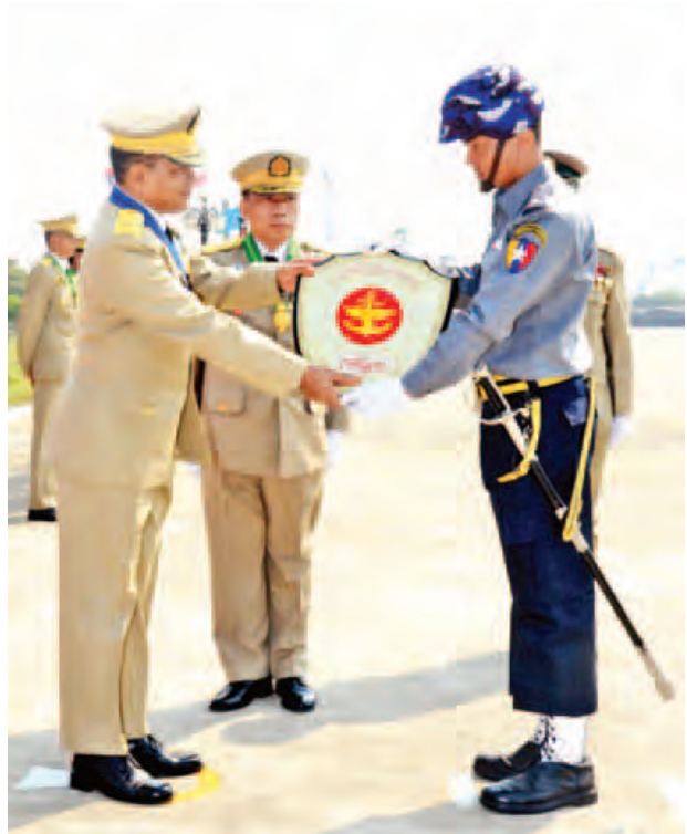
တပ်မတော်လေ့ကျင့်ရေးအရာရှိချုပ် ဗိုလ်ချုပ်မောင်မောင်အေး စစ်ရေးပြဂုဏ်ပြုဆုရ မြန်မာနိုင်ငံရဲတပ်ဖွဲ့ကိုယ်စားပြု စစ်ရေးပြတပ်ခွဲအား ဆုပေးအပ်ချီးမြှင့်စဉ်။ (မြဝတီ)