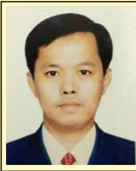
(တက္ကသိုလ် ဟန်စိုးဦး)

၂၀ ရာစု ပင်လယ်ရေကြောင်း ပိုးလမ်းမဟု လူသိများပြီး နိုင်ငံပေါင်းစုံကျယ်ကျယ်ပြန့်ပြန့်ပါဝင်သော စီးပွားရေးလမ်းကြောင်းတစ်ခုကို တရုတ်ပြည်သူ့သမ္မတနိုင်ငံ သမ္မတရွှေတောင်တောင်စုတို့က စတင်အဆိုပြုခဲ့ပြီး တောင်တရုတ်ပင်လယ်၊ တောင်ပစိဖိတ်သမုဒ္ဒရာ၊ အိန္ဒိယသမုဒ္ဒရာများနှင့် တစ်ဆက်တစ်စပ်တည်းရှိနေသည့် အရှေ့တောင်အာရှဒေသနိုင်ငံများ၊ ပင်လယ်သမုဒ္ဒရာကျွန်းနိုင်ငံများ၊ အရှေ့အာဖရိကနိုင်ငံများ မြေထဲပင်လယ် မြောက်ပိုင်းနိုင်ငံများအကြား ပူးပေါင်းဆောင်ရွက်မှုများ ပြုလုပ်သွားမည့် အစီအစဉ်ဖြစ်ပါသည်။ အဆိုပါ ပိုးလမ်းမကြီးအကြောင်းကို စာရေးဆရာ တက္ကသိုလ်ဟန်စိုးဦးက ရုပ်ဝန်းတစ်ခု လမ်းကြောင်းတစ်ခုအမည်ဖြင့် ရေးသားထား သည့်များကို ကြေးမုံစာဖတ်ပရိသတ်များအတွက် အခန်းဆက်ဆောင်းပါးများအဖြစ် ဖော်ပြလိုက်ပါသည်။ (စာတည်း)