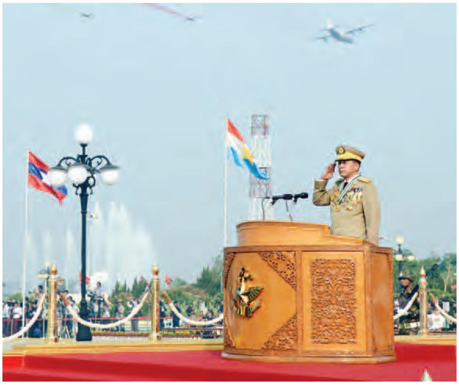
တပ်မတော်ကာကွယ်ရေးဦးစီးချုပ် ဗိုလ်ချုပ်မှူးကြီး မဟာသရေစည်သူ မင်းအောင်လှိုင်အား စစ်ကြောင်းကြီးများမှ တပ်မတော်သားများ၊ မြန်မာနိုင်ငံရဲတပ်ဖွဲ့ဝင်များ၊ ယန္တရားတပ်ဖွဲ့များ ချီတက်အလေးပြုကြစဉ်။ (သတင်းစဉ်)

ဖိနှိပ်ခဲ့သည့် ဖက်ဆစ်တို့ကို ၁၉၄၅ ခုနှစ် မတ် ၂၇ ရက် ယခုလိုနေ့မျိုးတွင် တပ်မတော်နှင့် ပြည်သူလူထုပူးပေါင်း၍ တစ်ခဲနက်အံ့ကြွတော်လှန်ခဲ့ရာမှ တော်လှန်ရေးနေ့ကြီးပေါ်ပေါက်ခဲ့ခြင်းဖြစ်ကြောင်း၊ နိုင်ငံတကာ တပ်မတော်များနည်းတူ (ကြည်း၊ ရေ၊ လေ)တပ်မတော်တစ်ရပ်လုံးနှင့်သက်ဆိုင်သည့် တပ်မတော်နေ့သတ်မှတ်ရန်လိုအပ်လာသည့်အတွက် လွတ်လပ်ရေးကြိုးပမ်းမှုသမိုင်းတွင် အထူးခြားဆုံးနှင့် အမွန်မြတ်ဆုံးဖြစ်သည့် တော်လှန်ရေးနေ့ကို အထူးဝိသေသပြုသည့်အနေဖြင့် ၁၉၅၅ ခုနှစ် မတ် ၂၇ ရက်တွင် ကျင်းပခဲ့သည့် စစ်ရေးပြအခမ်းအနားမှ စတင်၍ တပ်မတော်နေ့ဟု ပြောင်းလဲခေါ်ဝေါ်ခဲ့ခြင်း ဖြစ်ပါကြောင်း။ ၁၉၄၈ ခုနှစ် လွတ်လပ်ရေးရပြီး သုံးလမတိုင်မီ အာဏာရ ဖဆပလအစိုးရနှင့် ကွန်မြူနစ်ပါတီတို့ မသင့်မမြတ်ဖြစ်ရာမှ ကွန်မြူနစ်များတောခိုပြီး ပြည်တွင်းဆူပူသောင်းကျန်းမှုများ စတင်ခဲ့ပါကြောင်း။ လွတ်လပ်ရေးရပြီး ၁၀ နှစ်အတွင်း