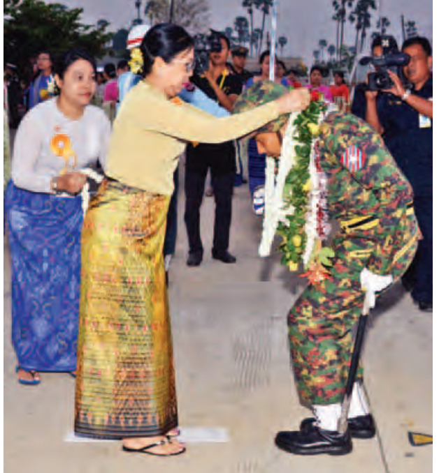
တပ်မတော်ကာကွယ်ရေးဦးစီးချုပ် ဗိုလ်ချုပ်မှူးကြီး မဟာသရေစည်သူ မင်းအောင်လှိုင်၏ ဇနီး ဒေါ်ကြူကြူလှ ဂုဏ်ပြုပန်းကုံးစွပ်၍ ကြိုဆိုစဉ်။ (သတင်းစဉ်)

နှင့်အတူ စီးပွားရေးကျဆင်းမှုများနှင့် တိုင်းရင်းသားလက်နက်ကိုင်ပြဿနာများကို အပြည့်အဝ ဖြေရှင်းနိုင်ခြင်း မရှိခဲ့သည့်အတွက် အဘက်ဘက်မှ ဖွံ့ဖြိုးမှုနောက်ကျခဲ့ရပါကြောင်း။