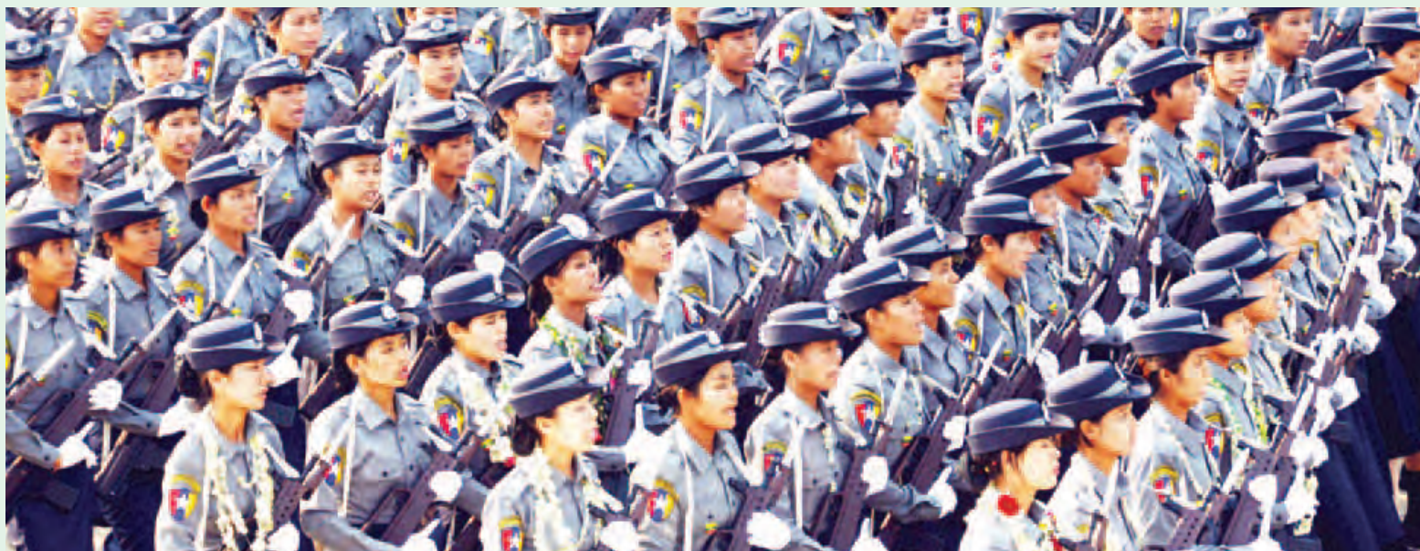
၂၀၁၆ ခုနှစ် (၇၁)နှစ်မြောက် တပ်မတော်နေ့ စစ်ရေးပြအခမ်းအနား၌ ယန္တရားတပ်ဖွဲ့များ၊ တပ်မတော်(ကြည်း)၊ ရေ လေ စစ်သည်များ၊ တပ်မတော်(ကြည်း) အမျိုးသမီးစစ်ရေးပြတပ်ခွဲ၊ မြန်မာနိုင်ငံ ရဲတပ်ဖွဲ့ဝင်များနှင့် မြန်မာနိုင်ငံ ရဲတပ်ဖွဲ့အမျိုးသမီး စစ်ရေးပြတပ်ခွဲတို့ ချီတက်လာကြစဉ်။ (သတင်းစဉ်)