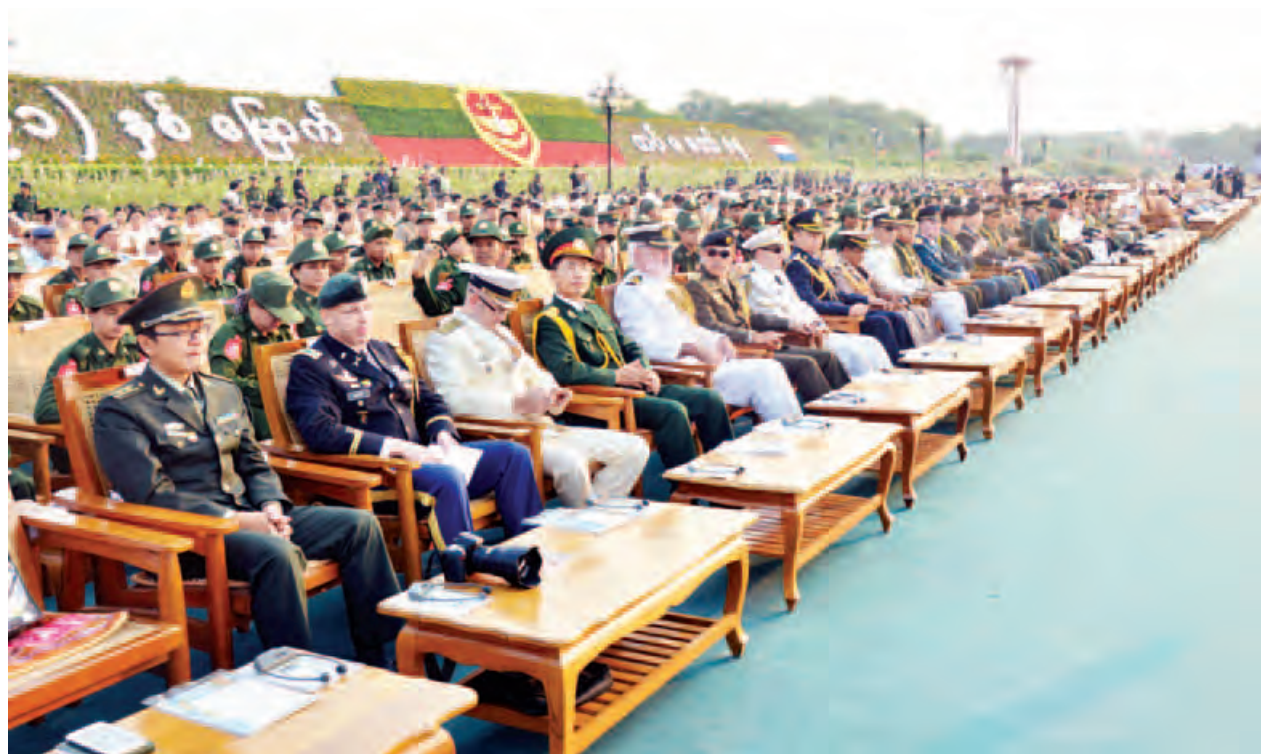
(၇၁)နှစ်မြောက် တပ်မတော်နေ့ စစ်ရေးပြအခမ်းအနားသို့ တက်ရောက်လာကြသူများကို တွေ့ရစဉ်။

မိမိတို့နိုင်ငံ ဒီမိုကရေစီဖော်ဆောင်ရာတွင် အဓိကနှောင့်ယှက်ဟန့်တားမှု နှစ်ခုမှာ စည်းကမ်း၊ လုပ်ထုံးလုပ်နည်းနှင့် ဥပဒေကို လေးစားလိုက်နာမှုအားနည်းခြင်းနှင့် လက်နက်ကိုင်သောင်းကျန်းမှုများ ရှိနေခြင်းပင်ဖြစ်။ ၎င်းတို့သည် ပရမ်းပတာဒီမိုကရေစီကို ဦးတည်သွားစေနိုင်