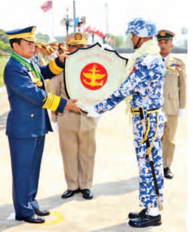
ညွှန်ကြားကွပ်ကဲရေးမှူး(ကြည်း၊ ရေ၊ လေ)ပူးတွဲတာဝန် ကာကွယ်ရေး ဦးစီးချုပ်(လေ) ဗိုလ်ချုပ်ကြီးခင်အောင်မြင့် စံပြတပ်ခွဲ ပထမဆုရ ကာကွယ်ရေး ဦးစီးချုပ်ရုံး(လေ)ကိုယ်စားပြုတပ်ခွဲအား ဆုပေးအပ်ချီးမြှင့်စဉ်။