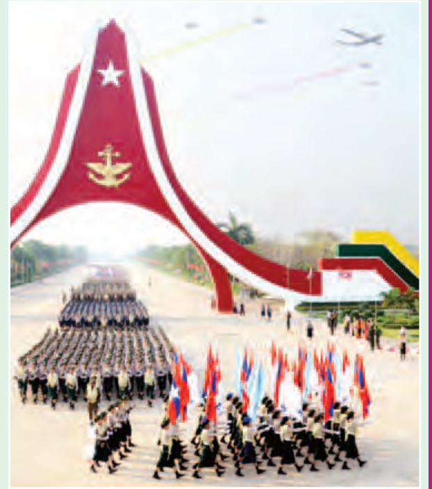
၂၀၁၆ ခုနှစ် (၇၁)နှစ်မြောက် တပ်မတော်နေ့ စစ်ရေးပြအခမ်းအနား၌ လေကြောင်းချီတပ်ဖွဲ့ကိုယ်စားပြု စစ်ရေးပြတပ်ခွဲ ချီတက်လာစဉ်။ (သတင်းစဉ်)