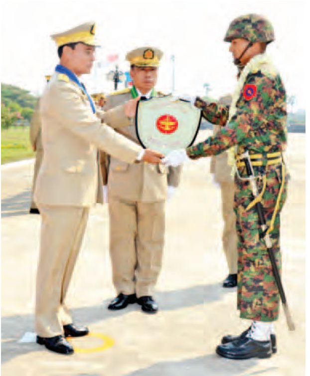
စစ်ရေးချုပ် ဒုတိယဗိုလ်ချုပ်ကြီး ဆန်းဦး စစ်စည်းကမ်းအကောင်းဆုံး ဒုတိယဆုရ လျှပ်စစ်နှင့် စက်မှုအင်ဂျင်နီယာ ညွှန်ကြားရေးမှူးရုံး ကိုယ်စားပြု စစ်ရေးပြတပ်ခွဲအား ဆုပေးအပ်ချီးမြှင့်စဉ်။