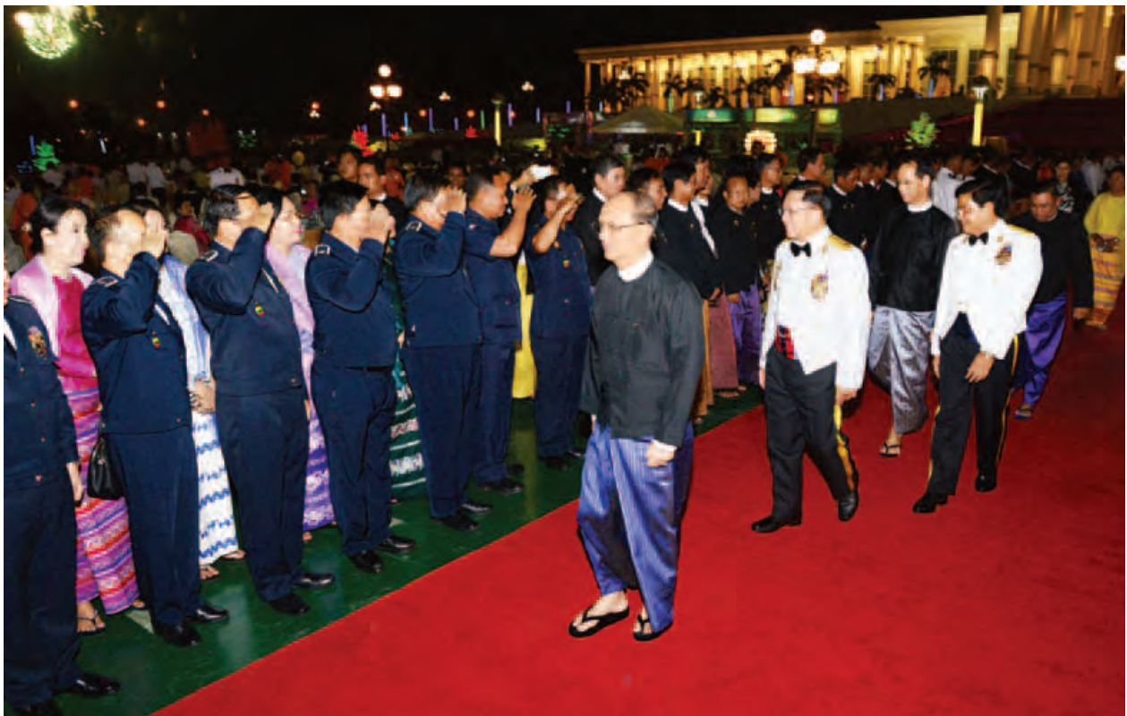
နိုင်ငံတော်သမ္မတ ဦးသိန်းစိန် (၇၁)နှစ်မြောက် တပ်မတော်နေ့အထိမ်းအမှတ် ဧည့်ခံပွဲနှင့် ဂုဏ်ပြုညစာစားပွဲသို့ တက်ရောက်လာသူများအား ရင်းရင်းနှီးနှီး နှုတ်ဆက်စဉ်။ (သတင်းစဉ်)

ဖော်ပြတင်ဆက်မှုအပြီးတွင် နိုင်ငံတော်သမ္မတ၊ တပ်မတော်ကာကွယ်ရေးဦးစီးချုပ်နှင့် ဇနီးတို့က ကပြဖော်ပြကြသည့် အနုပညာရှင်များ၊ နယ်လှည့်ပြည်သူ့ဆက်ဆံရေးတပ်ခွဲများမှ စစ်သည်၊ စစ်သမီးများနှင့် ယဉ်ကျေးမှုအဖွဲ့များအား ဂုဏ်ပြုပန်းခြင်းများ ပေးအပ်ကြသည်။ (သတင်းစဉ်)