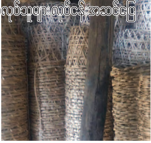
“အခုလိုတော့ရွာတွေမှာ တောင်သူရိုးရာအလုပ်အပြင် ကွမ်းခြင်း ရက်လုပ်ပြီး တစ်ဖက်တစ်လမ်းက ဝင်ငွေရှာတော့ မိသားစု စားဝတ်နေရေးလည်း ပိုအဆင်ပြေပြီး မိသားစုများရင်များသလို ဝင်ငွေ ကောင်းပါတယ်” ဟု ယင်းက ဆက်လက်ပြောသည်။

“ကျွန်တော်တို့ကျေးရွာဟာ အခုလို အိမ်ထဲမှာပဲ ကွမ်းခြင်းများကို ကိုယ့်အိမ်မိသားစုနဲ့ပဲ ရက်လုပ်ပြီးဝင်ငွေရှာရတာပါ။ အခြားတောင်သူရိုးရာလည်း လုပ်ကိုင်ကြပါတယ်။ ဒါပေမယ့်လို့ အခုကွမ်းခြင်းရက်လုပ်တာဟာ အရိပ်ထဲဆိုတော့ လူလည်းသက်သာတာပေါ့။ ဝင်ငွေလည်းကောင်းပါတယ်။ အထူးသဖြင့် ယခုနှစ်မျိုးဟာ အယ်နီညို ဖြစ်ပေါ်တဲ့နှစ်တွေမှာ အရိပ်ထဲဆိုတော့ ကျန်းမာရေးအတွက်လည်း အထူးစိုးရိမ်စရာမလိုတော့ဘူးပေါ့ဗျာ။ မဲတင်းခါးဝါးတစ်လုံးကို ငါးရာကျပ်ပေးရပြီး ဝါးတစ်လုံးခွဲပြီးရက်လုပ်ရင် ခြင်းအလုံးပေါင်း ၁၅ လုံးကျော်လောက်ရပါတယ်။ ခြင်းတစ်လုံးကိုပြန်ရောင်းရင် ကျပ် ၂၀၀ ရောင်းရတယ်။ အဲဒီတော့ ကျွန်တော်တို့အတွက်တော့ မိသားစုများရင် ဝင်ငွေပိုကောင်းတာပေါ့ဗျာ။ ကွမ်းခြင်းဆိုပေမယ့် အခြားမုန့်ခြင်း၊ ပန်းသီးခြင်းများအဖြစ်လည်း အသုံးပြုလို့ရတဲ့အတွက်ကွမ်းခြင်း ရက်လုပ်ငန်းဟာ ကျွန်တော်တို့အတွက် တော်တော်များများ အသုံးဝင်ပြီး အဆင်ပြေပါတယ်” ဟု ကွမ်းခြင်းရက်လုပ်သူတစ်ဦးကပြောသည်။