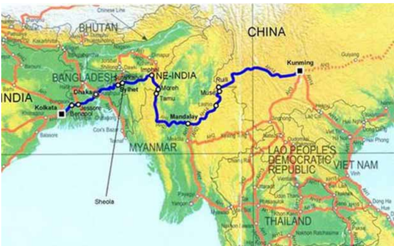
(ဘင်္ဂလားဒေ့ရှ်-တရုတ်-အိန္ဒိယ-မြန်မာ ၄-နိုင်ငံ စီးပွားရေးစင်္ကြံ အခြေပြမြေပုံ)

ရုပ်ဝန်းတစ်ခု လမ်းကြောင်းတစ်ခု အစီအစဉ်ကို ဖော်ထုတ်လာတဲ့ အချိန်မှာတော့ BCIM Economic Corridor ဟာ တရုတ်နိုင်ငံနဲ့ တောင်အာရှဒေသကို မြန်မာနိုင်ငံက နေတစ်ဆင့် ပေါင်းစည်းဆက်သွယ်လာစေမယ့် Southern Silk Road Economic Corridor အဖြစ် အဓိကနေရာကနေ ပါဝင်လာ