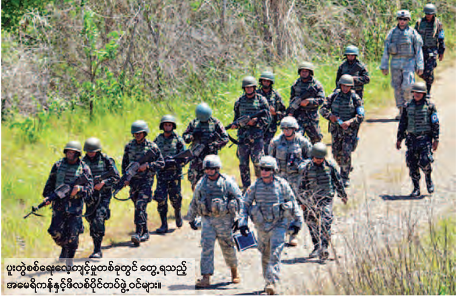
ပူးတွဲစစ်ရေးလေ့ကျင့်မှုတစ်ခုတွင် တွေ့ရသည့် အမေရိကန်နှင့်ဖိလစ်ပိုင်တပ်ဖွဲ့ဝင်များ။