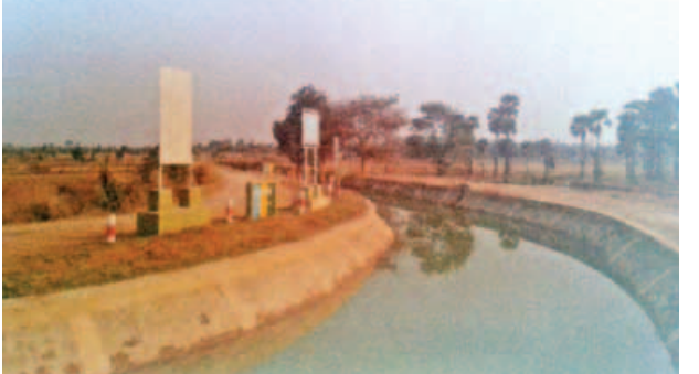
ဘုတလင်မြို့နယ် သောက်သုံးရေကန် ၅၁ ကန်ကို တိုးချဲ့တူးမြောင်းမှ ရေပြည့်ထူးစဉ်။