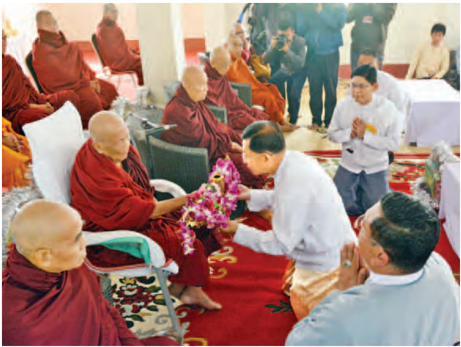
တပ်မတော်ကာကွယ်ရေးဦးစီးချုပ် ဗိုလ်ချုပ်မှူးကြီး မင်းအောင်လှိုင် မဟာတေဇဝန္တ ရွှေစည်းခုံစေတီတော်တွင် တင်လှူပူဇော်မည့် ငှက်မြတ်နားတော်အား ဆရာတော်ထံ ဆက်ကပ်လှူဒါန်းစဉ်။ (သတင်းစဉ်)