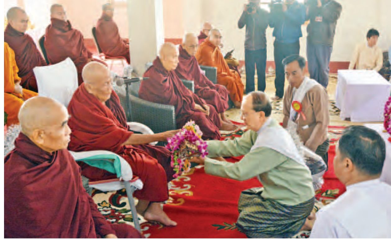
နိုင်ငံတော်သမ္မတ ဦးသိန်းစိန် မဟာတေဇဝန္တ ရွှေတိဂုံစေတီတော်တွင် တင်လှူပူဇော်မည့် ငှက်မြတ်နားတော်အား ဆရာတော် ဘဒ္ဒန္တ သီလဝံသထံ ဆက်ကပ်လှူဒါန်းစဉ်။ (သတင်းစဉ်)

ဆရာတော် သံဃာတော်များထံ လှူဖွယ်ပစ္စည်းများကို ဆက်ကပ်လှူဒါန်းကြသည်။ ယင်းနောက် နိုင်ငံတော်သမ္မတနှင့် ဧည့်ပရိသတ်များက နိုင်ငံတော်ဩဝါဒါစရိယ ဝန်းသိုကျောင်းတိုက်ဆရာတော် အဘိဓဇမဟာရဋ္ဌဂုရု ဘဒ္ဒန္တသီလဝံသထံမှ အနုမောဒနာတရားနာယူကြပြီး လှူဒါန်းမှုအစုစုတို့အတွက် ရေစက်သွန်းချအမျှပေးဝေကြသည်။