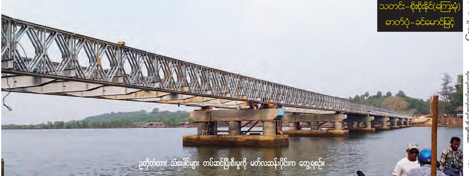
ဥတိုတံတား သံပေါင်များ တပ်ဆင်ပြီးစီးမှုကို မတ်လဆန်းပိုင်းက တွေ့ရစဉ်။