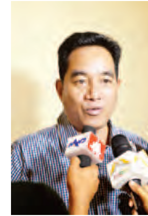
ဦးဇော်သက်ထွေး (မြန်မာနိုင်ငံစာနယ်ဇင်း သမဂ္ဂဦးဆောင်သူ)

မေး/ရေး ရဲခေါင်ညွန့်၊ မြတ်စန္ဒီသင်းဇော် တတ်ပုံ-ဇော်မင်းလတ်