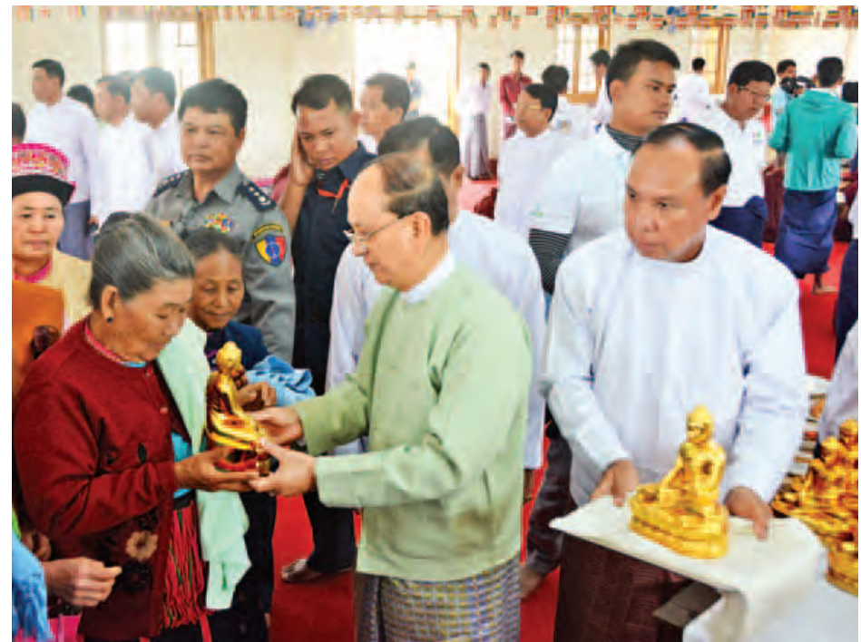
နိုင်ငံတော်သမ္မတ ဦးသိန်းစိန် ဒေသခံပြည်သူများထံ ဗုဒ္ဓဆင်းတုတော်များ ပေးအပ်လှူဒါန်းစဉ်။ (သတင်းစဉ်)

ထို့နောက် ရတနာစိန်ဖူးတော်နှင့် ငှက်မြတ်နားတော်တို့အား အမွှေးနံ့သာရည်ဖြင့် ပက်ဖျန်းပူဇော်ကြပြီး စေတီတော်အထွတ်တွင် တင်လှူပူဇော်ကြသည်။ စာမျက်နှာ ၉ ကော်လံ ၁ သို့ □