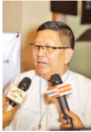
ဦးဝင်းကြည် (ဒုတိယညွှန်ကြားရေးမှူးချုပ်) မြန်မာ့အသံနှင့် ရုပ်မြင်သံကြား

ဖြေ။ ။ ပြည်သူ့ဝန်ဆောင်မှု ရုပ်သံထုတ်လွှင့်မှု (PSB)ဆိုတာက ပြည်သူ့အကျိုးကို ဦးတည်ဆောင်ရွက် သွားကြမှာဖြစ်တဲ့အတွက် ယေဘုယျ အားဖြင့် နိုင်ငံတော်တော်များများမှာ တော့ အလေးထားလာကြတယ်။ ပြည်သူ့အကျိုးကို အဓိကထား သယ်ပိုး လုပ်ဆောင်တဲ့အတွက် အောင်မြင်တဲ့ Broadcaster တွေဖြစ် လာတယ်။ PSB ဆိုတာ ကောင်းမွန်တဲ့ အစီအစဉ်ထုတ်လွှင့်ဖို့နဲ့ကဏ္ဍပေါင်းစုံ က အကြောင်းအရာတွေ အစုံအလင် ပါဝင်လာဖို့ဖြစ်တယ်။ ကျွန်တော် တို့အနေနဲ့ အားလုံးကိုစတင် ပြင်ဆင်ပြီးသားပါ။ လောလောဆယ် ဝန်ထမ်းတွေကို သင်တန်းတွေပေး