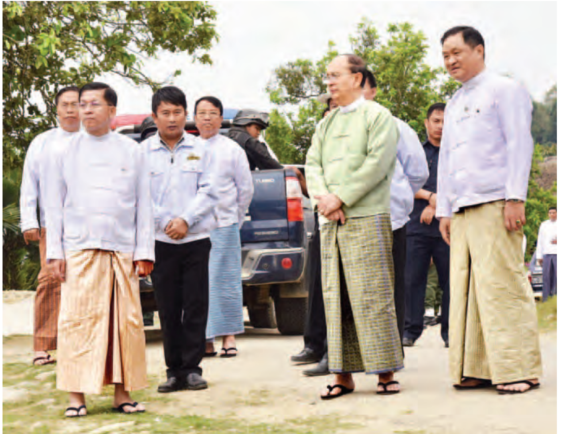
နိုင်ငံတော်သမ္မတ ဦးသိန်းစိန် မလိခ(မချမ်းဘော)တံတားသစ် တည်ဆောက်နေမှုကို ကြည့်ရှုစစ်ဆေးစဉ်။ (သတင်းစဉ်)