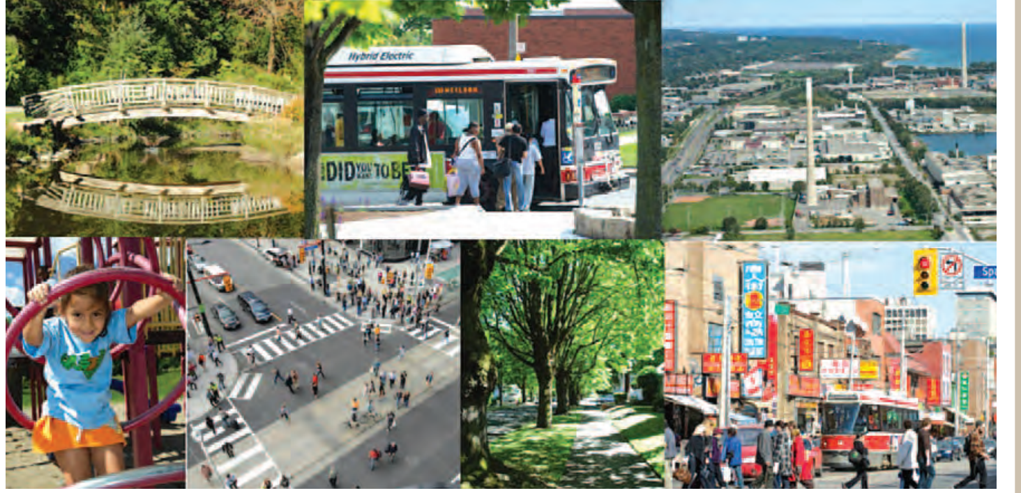
ပတ်ဝန်းကျင် မပျက်ယွင်းစေဘဲ မြို့ကြီးများကို ဖွံ့ဖြိုးတိုးတက်စေသင့်သည်။

ရှိကြပြီး အသင့်စား အစားအစာများကို ပိုမိုစားသုံးလာခြင်းဖြင့် ကိုယ်ခန္ဓာပိုင်လာကာ ရောဂါဖြစ်တတ်ခြင်းသည်လည်း ယဉ်ကျေးမှုဆိုင်ရာ ဘေးဥပဒ်တစ်မျိုးဖြစ်သည်။ ပတ်ဝန်းကျင်ဆိုင်ရာ ဖိစီးမှုခံရမှုများ ကျွန်ုပ်တို့သည် နေ့စဉ်နှင့်အမျှ ပတ်ဝန်းကျင်ဆိုင်ရာ ဖိစီးခံနေကြရသည်။ နှိုးစက်နာရီမြည်သံ၊ ဘက်စကားပေါ် တယ်လီဖုန်းစကားပြောသံများ၊ နွေရာသီအပူလှိုင်းများ၊ မော်တော်ကားဟွန်းသံများ၊ လူပြည်ကျပ်နေသော နေရာများ၊ ဆူညံသံများ စသည်တို့မှာ ပတ်ဝန်းကျင်ကပေးစွမ်းနိုင်သော စိတ်ဖိစီးခံရမှုများဖြစ်သည်။ ပတ်ဝန်းကျင် ကောင်းမွန်ခြင်းသည်