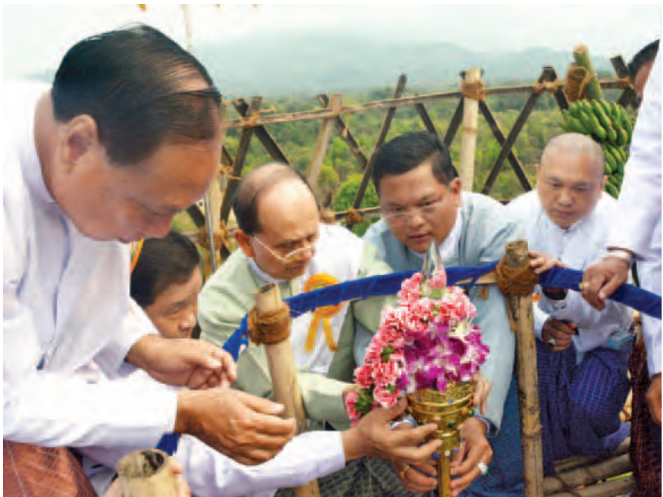
နိုင်ငံတော်သမ္မတ ဦးသိန်းစိန် မဟာတေဇဝန္တ ရွှေတိဂုံစေတီတော်အထွတ်တွင် စိန်ဖူးတော်အား တင်လှူပူဇော်စဉ်။ (သတင်းစဉ်)