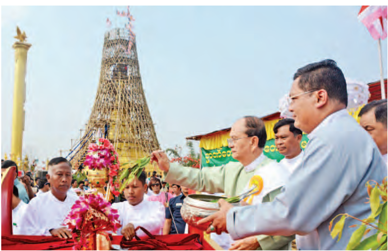
နိုင်ငံတော်သမ္မတ ဦးသိန်းစိန် မဟာတေဇဝန္တ ရွှေတိဂုံစေတီတော်တွင် တင်လှူပူဇော်မည့် စိန်ဖူးတော်အား အမွှေးနံ့သာရည်ဖြင့် ပက်ဖျန်းပူဇော်စဉ်။

ထို့နောက် ပြည်ထောင်စုဝန်ကြီးများနှင့် အလှူရှင်ဧည့်ပရိသတ်များက