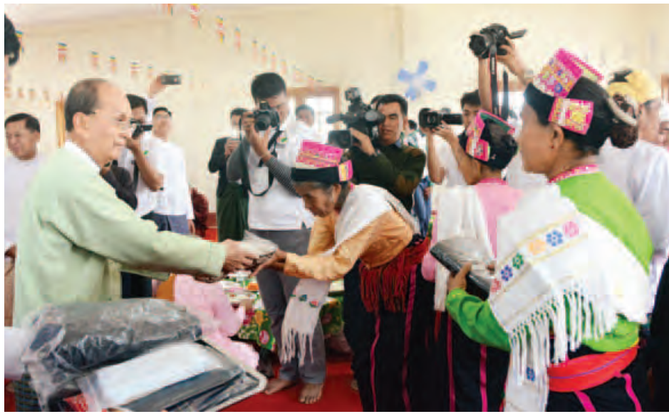
နိုင်ငံတော်သမ္မတ ဦးသိန်းစိန် ဒေသခံပြည်သူများအား အဝတ်အထည်များ ပေးအပ်လှူဒါန်းစဉ်။ (သတင်းစဉ်)