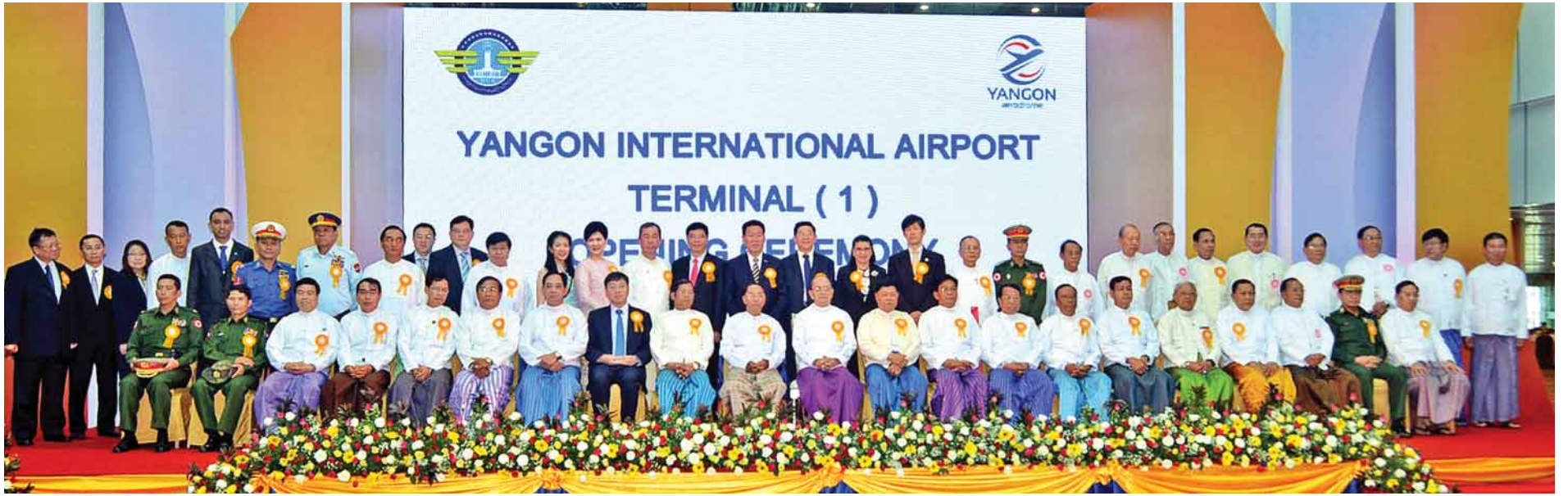
နိုင်ငံတော်သမ္မတ ဦးသိန်းစိန် ရန်ကုန်အပြည်ပြည်ဆိုင်ရာလေဆိပ် ခရီးသည်အဆောက်အအုံသစ်ဖွင့်ပွဲအခမ်းအနားသို့ တက်ရောက်လာကြသူများနှင့်အတူ မှတ်တမ်းတင်ဓာတ်ပုံရိုက်စဉ်။