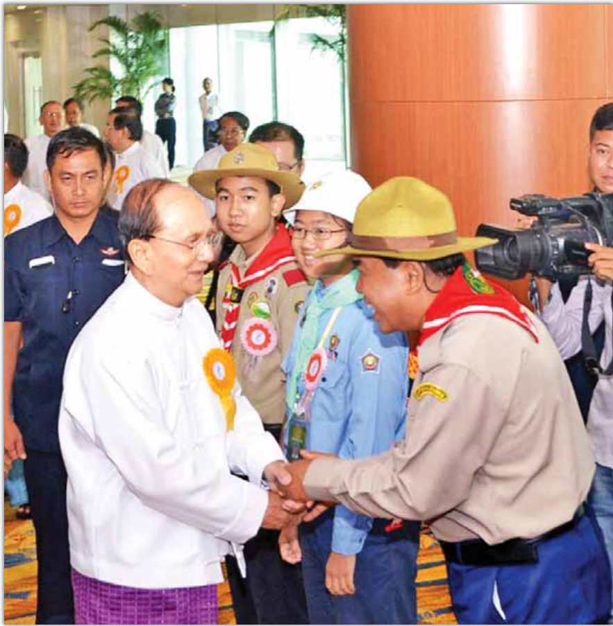
နိုင်ငံတော်သမ္မတ ဦးသိန်းစိန် ရန်ကုန်အပြည်ပြည်ဆိုင်ရာလေဆိပ် ခရီးသည်အဆောက်အအုံသစ်ဖွင့်ပွဲတွင် ကင်းထောက်အဖွဲ့ဝင်များအား ရင်းရင်းနှီးနှီးနှုတ်ဆက်စဉ်။ (သတင်းစဉ်)