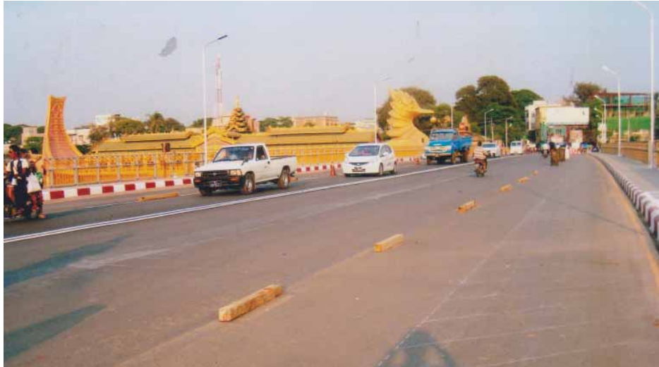
ပေးရန် လွှတ်တော်သို့ တင်ပြတောင်းဆိုခဲ့သည်။ လွှတ်တော်မှ ကန်ကူးတံတားသစ်တစ်စင်းတည်ဆောက် ရန် ခွင့်ပြုခဲ့သည်။

မိတ္ထီလာမြို့မလေးရပ်ကွက်နှင့် နန်းတော်ကုန်းရပ်သို့ ဆက်သွယ်ထားသော မိတ္ထီလာ-ကျောက်ပန်းတောင်းသွား ကန်ကူးတံတားရှိသည်။ ကန်ကူးတံတားမှာ အလျားပေ ၂၀၀၊ အကျယ် ၂၄ ပေ နှစ်လမ်းသွားနှင့် လူသွားလမ်း တစ်ဖက် သုံးပေရှိသည်။ တံတားအနောက်ဘက် ချဉ်းကပ် လမ်းမှာ ပေ ၆၀၀ အရှည်ရှိသည်။ ကန်ကူးတံတားမှာ ဖဆပလခေတ်က ဘေလီတံတား၊ မဆပလခေတ်တွင် ခေတ်မီသံကူကွန်ကရစ်တံတားဖြစ်သည်။