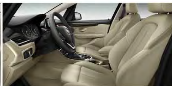
Leather 'Dakota' with sport seat