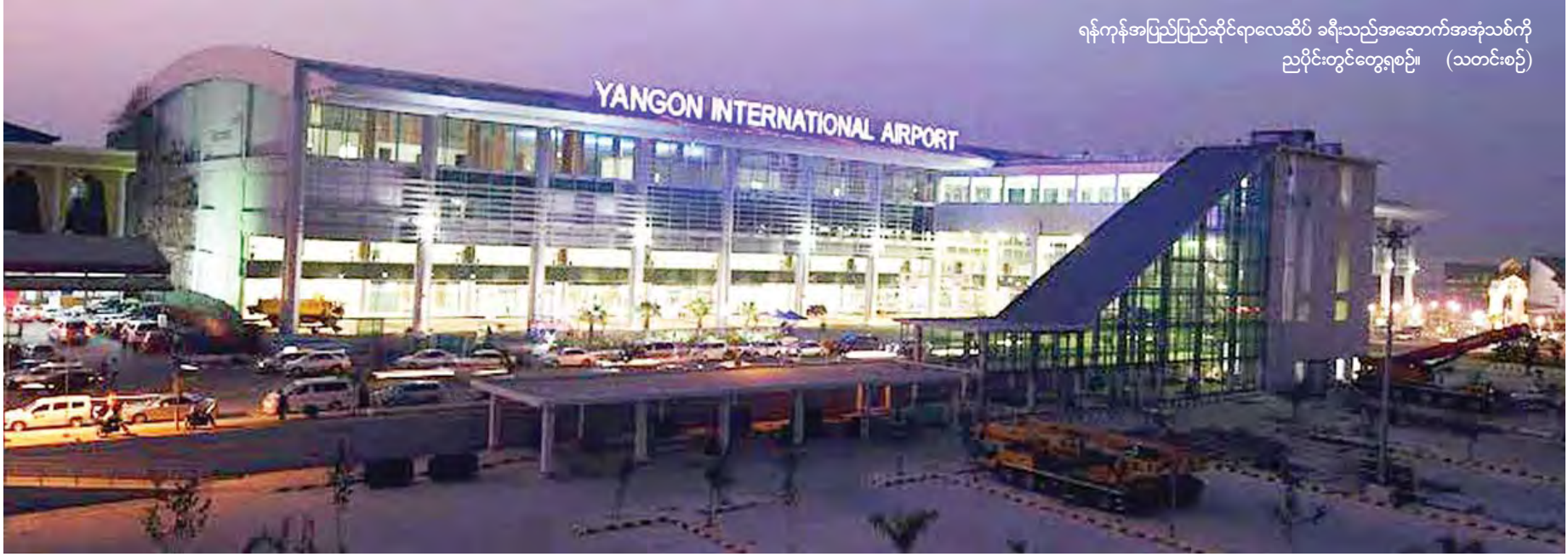
ရန်ကုန်အပြည်ပြည်ဆိုင်ရာလေဆိပ် ခရီးသည်အဆောက်အအုံသစ်ကို ညပိုင်းတွင်တွေ့ရစဉ်။ (သတင်းစဉ်)