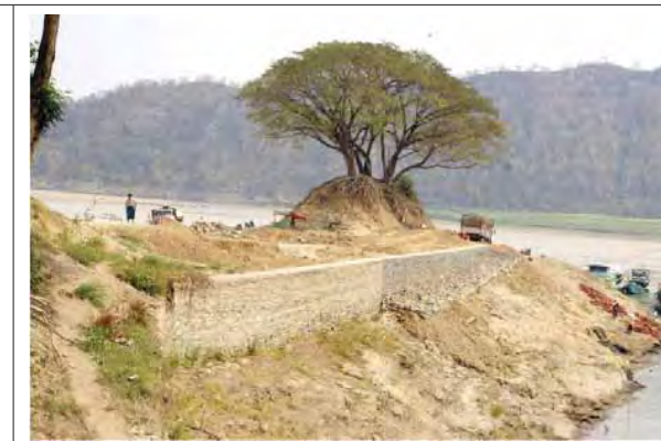
ရွှေမုဋ္ဌောဘုရားဆိပ်ကမ်း ကုန်းကမူထိန်းသိမ်းကာကွယ်ခြင်းနှင့် ပြေသားလမ်းတိုးချဲ့ခြင်းလုပ်ငန်း ရုန်းပြည်ပြီးစီး

နစ်တွင် မျှော်မှန်းထားသော လူဦးရေ ၁၀ သန်းကျော်အတွက် ပြီးပြည့်စုံသည့် ကာလရှည်ဖွံ့ဖြိုးရေးစီမံကိန်းဖြစ်သည်ဟု သိရသည်။ အဆိုပါစီမံကိန်းနှင့်ပတ်သက်၍ ရန်ကုန်တိုင်းဒေသကြီး လွှတ်တော် ကိုယ်စားလှယ်များနှင့် ဆွေးနွေးပွဲတစ်ရပ်ကျင်းပခဲ့ပြီး JICA မြန်မာ့ရုံးမှ Chief Representative Mr. Keiichiro Nakazawa က အဖွင့်အမှာစကား ပြောကြားခဲ့ကာ မြို့ပြဖွံ့ဖြိုးတိုးတက်မှုလွှမ်းမိုးဆွဲဆောင်သောစီမံချက်အပေါ် JICA လေ့လာရေးအဖွဲ့၏သုံးသပ်တင်ပြမှုကိုအကျဉ်းချုပ်ပြောကြားသွားခဲ့ သည်။ ယင်းသို့ရှင်းလင်းပြောကြားခဲ့ရာတွင် မဟာရန်ကုန်မြို့ပြဖွံ့ဖြိုးရေး မဟာဗျူဟာစီမံကိန်း၊ မြို့ပြသယ်ယူပို့ဆောင်ရေးစီမံကိန်း၊ ရေပေးဝေမှုစီမံ ကိန်းတို့အပေါ် အကျဉ်းချုပ်ပြောကြားခဲ့ပြီး စီမံကိန်းတစ်ခုချင်းစီအပေါ် JICA မြန်မာ့ရုံးမှ ရှင်းလင်းတင်ပြခဲ့သည်ဟု သိရသည်။