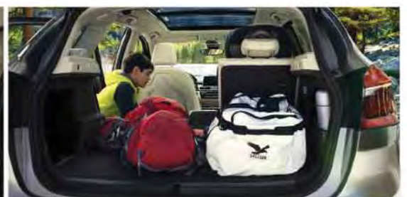
Large tailgate luggage compartment

Prestige Automobiles Co.,Ltd. The Exclusive Authorised BMW Dealer in Myanmar. Phone : 01 - 230 6133, Service Hotline : 01 - 2306144