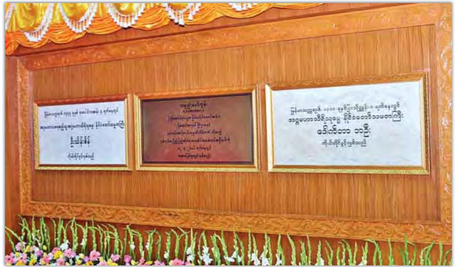
ရန်ကုန်အပြည်ပြည်ဆိုင်ရာလေဆိပ်အား ဖွင့်လှစ်ပေးခဲ့သည့် နိုင်ငံတော်အကြီးအကဲများ၏ မော်ကွန်းကမ္မည်း ကျောက်စာများကို တွေ့ရစဉ်။ (သတင်းစဉ်)

ရန်ကုန်လေဆိပ်ဖွံ့ဖြိုးတိုးတက်ရေးစီမံကိန်းကို ပုဂ္ဂလိက အများပိုင် ရင်းနှီးမြုပ်နှံမှုကဏ္ဍ တိုးတက်လာစေရန် ရည်ရွယ်ချက်ဖြင့် ပွင့်လင်းမြင်သာ မှုရှိသည့်စနစ်ဖြင့် တင်ဒါခေါ်ယူခဲ့ရာတွင် PAS Consortium သည် ၂၀၁၃ ခုနှစ် ဩဂုတ် ၁၀ ရက်တွင် တင်ဒါအောင်မြင်ခဲ့။