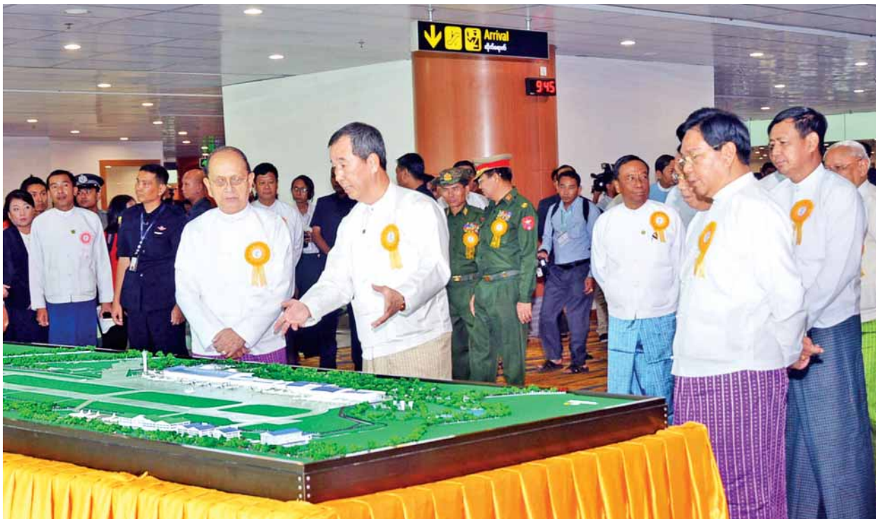
နိုင်ငံတော်သမ္မတ ဦးသိန်းစိန် ရန်ကုန်အပြည်ပြည်ဆိုင်ရာလေဆိပ်ပုံစံငယ်ကို ကြည့်ရှုစဉ်။

ယခုဖွင့်လှစ်သည့် လေဆိပ်အဆောက်အအုံသစ်သည် အလျား မီတာ ၂၄၀၊ အကျယ် မီတာ ၉၇ ဒသမ ၇ ရှိ RC & Steel Building ဖြစ်ပြီး