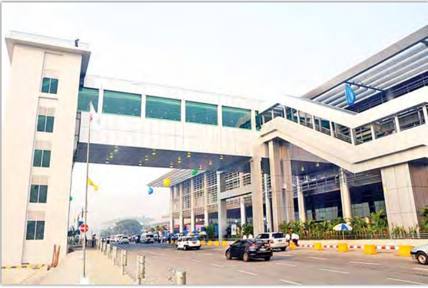
ရန်ကုန်အပြည်ပြည်ဆိုင်ရာလေဆိပ် ခရီးသည်အဆောက်အအုံသစ်အဝင်ကို တွေ့ရစဉ်။ (သတင်းစဉ်)

ရန်ကုန်လေဆိပ်ဖွံ့ဖြိုးတိုးတက်ရေးစီမံကိန်းကို ပုဂ္ဂလိက အများပိုင် ရင်းနှီးမြုပ်နှံမှုကဏ္ဍ တိုးတက်လာစေရန် ရည်ရွယ်ချက်ဖြင့် ပွင့်လင်းမြင်သာ မှုရှိသည့်စနစ်ဖြင့် တင်ဒါခေါ်ယူခဲ့ရာတွင် PAS Consortium သည် ၂၀၁၃ ခုနှစ် ဩဂုတ် ၁၀ ရက်တွင် တင်ဒါအောင်မြင်ခဲ့။