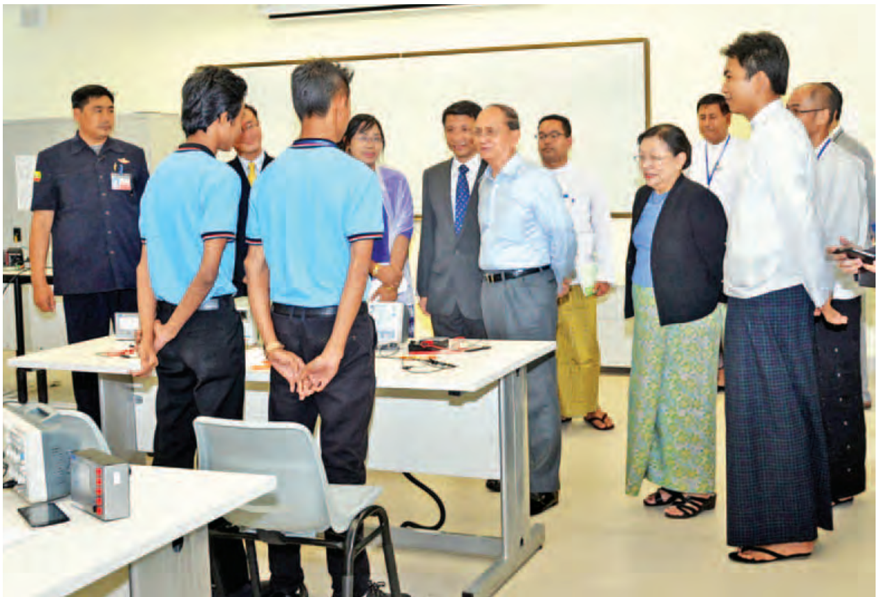
၂၀၁၄ ခုနှစ် အောက်တိုဘာ ၁၀ ရက်က ကျင်းပခဲ့သည့် ထို့အပြင် SMVTI အောင်မြင်စွာဖွင့်လှစ်နိုင်ရေးအတွက် ၂၀၁၄ ခုနှစ် စက်တင်ဘာလမှ စတင်၍ Task Force Meeting (၁၅)ကြိမ်နှင့် Management Committee (၄)ကြိမ်ကျင်းပခဲ့သည်။

စင်ကာပူ-မြန်မာ သက်မွေးပညာသင်တန်းကျောင်း(Singapore-Myanmar Vocational Training Institute - SMVTI) တည်ဆောက်ရေး အတွက် နားလည်မှုစာချွန်လွှာကို ၂၀၀၄ ခုနှစ် ဧပြီ ၇ ရက်က သိပ္ပံနှင့်နည်းပညာ ဝန်ကြီးဌာန၌ နည်းပညာနှင့်သက်မွေးပညာဦးစီးဌာနမှ ညွှန်ကြားရေးမှူးချုပ်နှင့် မြန်မာနိုင်ငံဆိုင်ရာ စင်ကာပူသံအမတ်ကြီးတို့ လက်မှတ်ရေးထိုးခဲ့ပြီး သိပ္ပံနှင့် နည်းပညာဝန်ကြီးဌာန ပြည်ထောင်စုဝန်ကြီးနှင့် စင်ကာပူသမ္မတနိုင်ငံ Senior Minister of State for Education and Law မှ H.E. Ms. Indrance Rajah တို့ ဦးဆောင်သော Board of Institute (BOI) အစည်းအဝေးကို