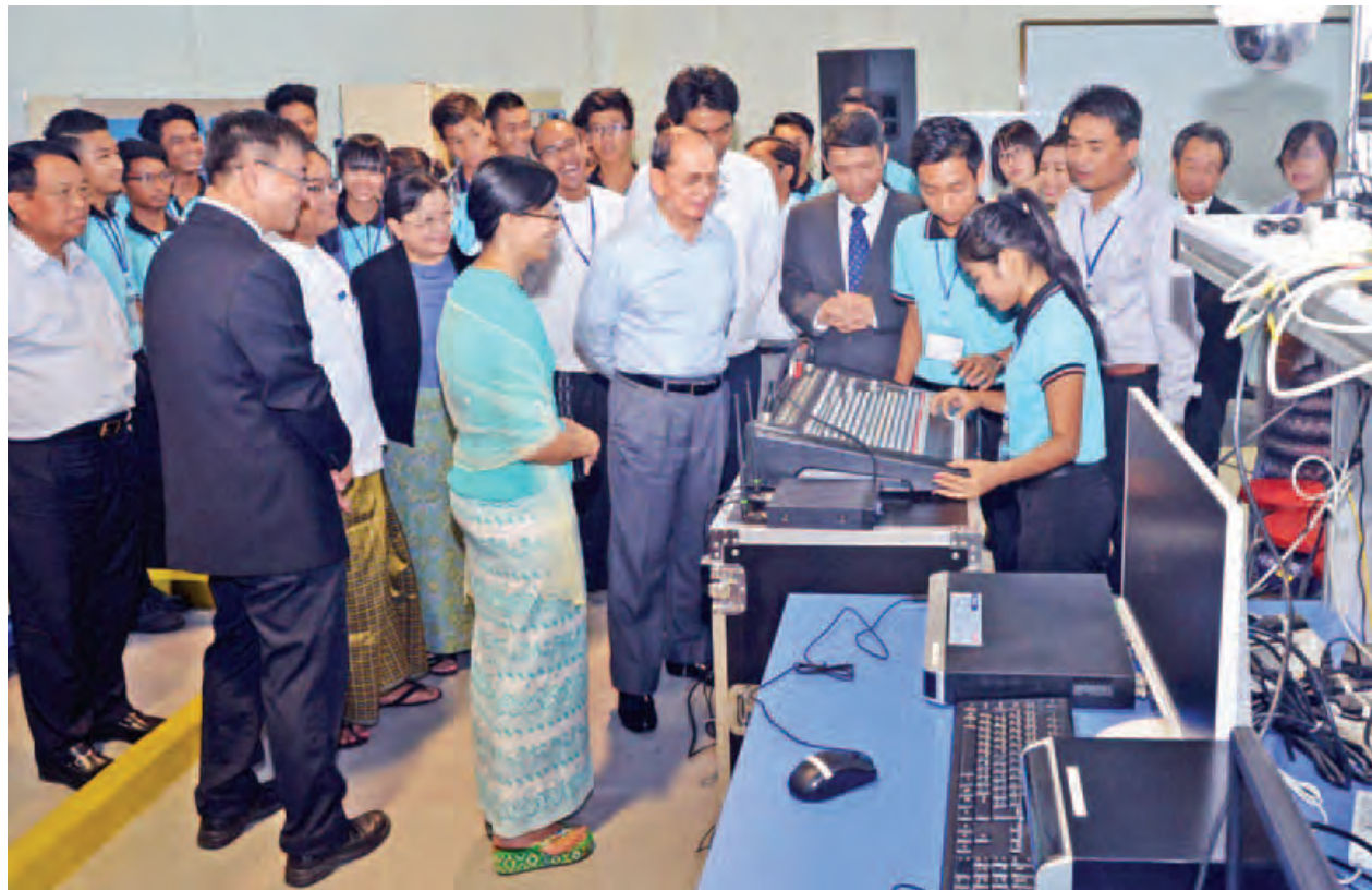
နိုင်ငံတော်သမ္မတ ဦးသိန်းစိန် စင်ကာပူ-မြန်မာ သက်မွေးပညာသင်တန်းကျောင်း(ရန်ကုန်)အလုပ်ရုံကို ကြည့်ရှုစဉ်။ (သတင်းစဉ်)

ယခုသင်တန်းများသည် ပထမအကြိမ်ဖွင့်လှစ်ခြင်းဖြစ်ပြီး ၂၀၁၆ ခုနှစ် နှစ်လယ်တွင် မြန်မာ-စင်ကာပူ နှစ်နိုင်ငံ သံတမန်ဆက်သွယ်မှု နှစ်(၅၀)ပြည့် အထိမ်းအမှတ်အဖြစ် ကျောင်းဖွင့်ပွဲအခမ်းအနားပြုလုပ်ရန် လျာထားဆောင်ရွက် လျက်ရှိကြောင်း သိရသည်။