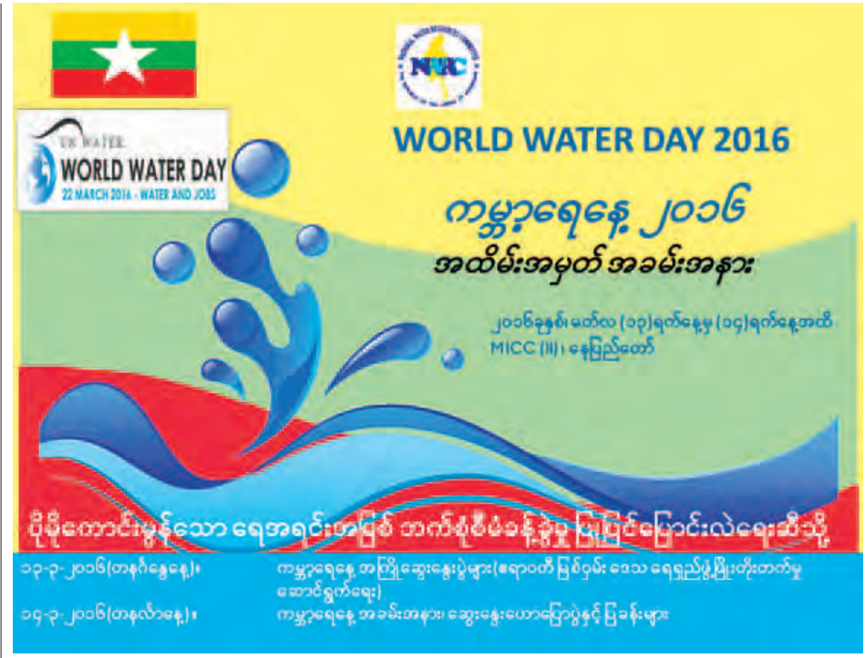
ပိုမိုကောင်းမွန်သော ရေအရင်းအမြစ် တက်စုံစီမံခန့်ခွဲမှု ပြုပြင်ပြောင်းလဲရေးဆိုသည့် ၁၃-၃-၂၀၁၆(တနင်္ဂနွေနေ့)၊ ကမ္ဘာ့ရေနေ့ အကြိုဆွေးနွေးပွဲများ(ဧရာဝတီ မြစ်ဝှမ်း ဒေသ ရေရရှိမှု ပြီးတိုးတက်မှု ဆောင်ရွက်ရေး)၊ ၁၄-၃-၂၀၁၆(တနင်္လာနေ့)၊ ကမ္ဘာ့ရေနေ့ အခမ်းအနား ဆွေးနွေးပွဲများပြုလုပ်ခဲ့ခြင်းဖြစ်သည်။

ဦးနှောက်ရောင်ရောဂါဖြစ်ပွားခဲ့သော သာစည်မြို့နယ် မကျီးကန်ကျေးရွာအုပ်စု ပြွန်ကန်ကျေးရွာသို့ မန္တလေးတိုင်းဒေသကြီး ကျန်းမာရေး