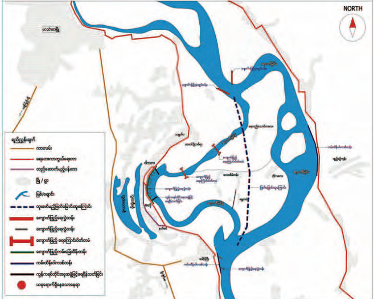
ဧရာဝတီမြစ်ဖြတ်မြောင်းဖောက်လုပ်ခြင်းနှင့် မြစ်ကမ်းထိန်းလုပ်ငန်းများပြပုံ။

သီးနှံနှင့်မြေယာလျော်ကြေးပေးအပ်ပြီးစီးမှုအခြေအနေမှာ ဧရာဝတီရေလွှဲဖြတ်မြောင်းအကြောင်းတွင် ကျရောက်သည့် မြေယာနှင့်သီးနှံလျော်ကြေးငွေကျပ်သိန်း ၂၀၀၀ကို မတ် ၃ ရက်တွင် လည်းကောင်း၊ ကျပ်သိန်း ၅၀၀၀ ကို မတ် ၁၀ ရက်တွင်လည်းကောင်း စုစုပေါင်း ကျပ်သိန်း ၇၀၀၀ ကို အပြည့်