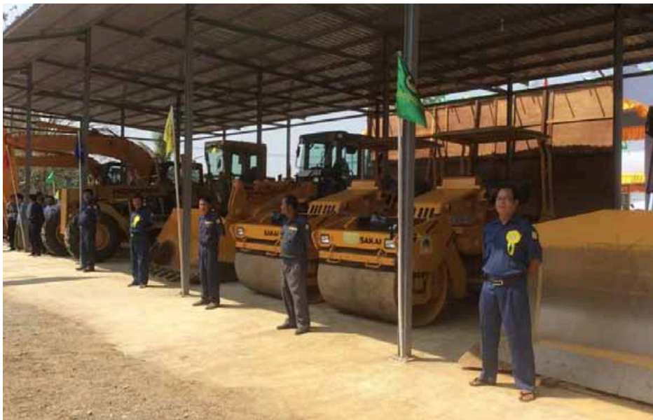
ဆိုင်ရာ စက်၊ ယာဉ်၊ ယန္တရားပေါင်း ၅၇ ခုကို JICA မှ ဆောက်လုပ်ရေးဝန်ကြီးဌာနသို့ လွှဲပြောင်းပေးအပ်ခြင်း အခမ်းအနားကို မတ် ၇ ရက်တွင် ပြုလုပ်ကာ လွှဲပြောင်းပေးအပ်ခဲ့ပြီး ရခိုင်ပြည်နယ်အတွင်း လမ်းကွန်ရက်များ ဖွံ့ဖြိုးတိုးတက်စေရန် ဆောင်ရွက်သွားမည်ဖြစ်ကြောင်း သိရသည်။

အဆိုပါ စီမံကိန်းအား ထောက်ပံ့ပေးအပ်ရန် ဂျပန်နိုင်ငံနှင့် မြန်မာနိုင်ငံတို့ သဘောတူလက်မှတ်ရေးထိုးမှုကို ၂၀၁၄ ခုနှစ် ဖေဖော်ဝါရီ ၂၀ ရက်က နေပြည်တော်၌ ဆောက်လုပ်ရေးဝန်ကြီးဌာနနှင့် ဂျပန်နိုင်ငံ ဂျပန်အပြည်ပြည်ဆိုင်ရာပူးပေါင်းဆောင်ရွက်ရေး အေဂျင်စီ (JICA) တို့မှ လက်မှတ်ရေးထိုးဆောင်ရွက်ခဲ့ကြပြီး တစ်ဖိုးငွေ ဂျပန်ယန်း ၇၂၈ သန်းကို ထောက်ပံ့ပေးအပ်ရန် သဘောတူညီခဲ့ကြသည်။ အဆိုပါ စီမံကိန်းသဘောတူညီမှုအရ လမ်းဆောက်လုပ်ရေးနှင့် ပြုပြင်ထိန်းသိမ်းမှု