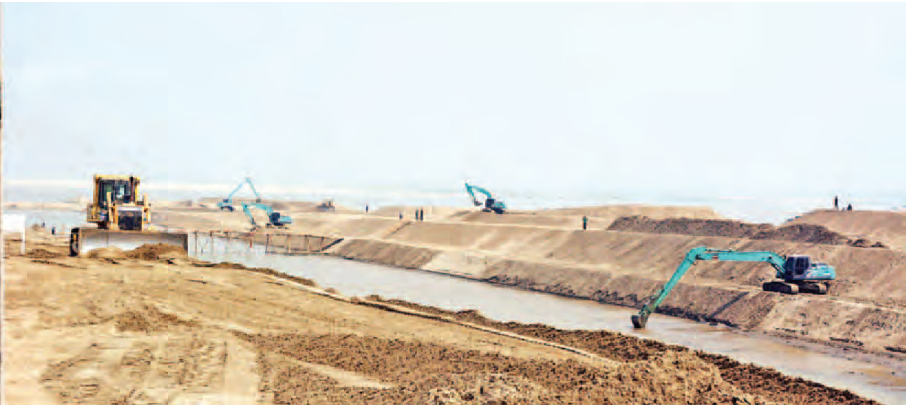
နိုင်ငံတော်သမ္မတ ဦးသိန်းစိန် ဇလွန်မြို့နယ် ဝါသလ-မေဒုံရွာအနီး မြစ်ကမ်းစားခြင်းနှင့် ရေဘေးအန္တရာယ် ကာကွယ်ခြင်းလုပ်ငန်းများအား စက်ယန္တရားများဖြင့် ဆောင်ရွက်နေမှုကို ကြည့်ရှုစစ်ဆေးစဉ်။ (သတင်းစဉ်)