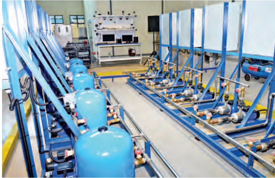
စင်ကာပူ-မြန်မာ သက်မွေးပညာသင်တန်းကျောင်း(ရန်ကုန်)အလုပ်ရုံများကို တွေ့ရစဉ်။ (သတင်းစဉ်)