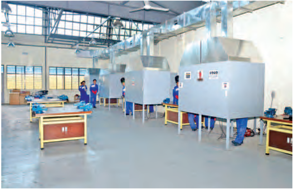
စင်ကာပူ-မြန်မာ သက်မွေးပညာသင်တန်းကျောင်း(ရန်ကုန်)အလုပ်ရုံများကို တွေ့ရစဉ်။ (သတင်းစဉ်)