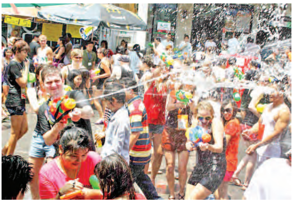
၂၀၁၅ ခုနှစ် ထိုင်းရိုးရာရေသဘင်ပွဲတော်တွင် ခရီးသွားဧည့်သည်များ ပါဝင်ဆင်နွှဲနေကြစဉ်။