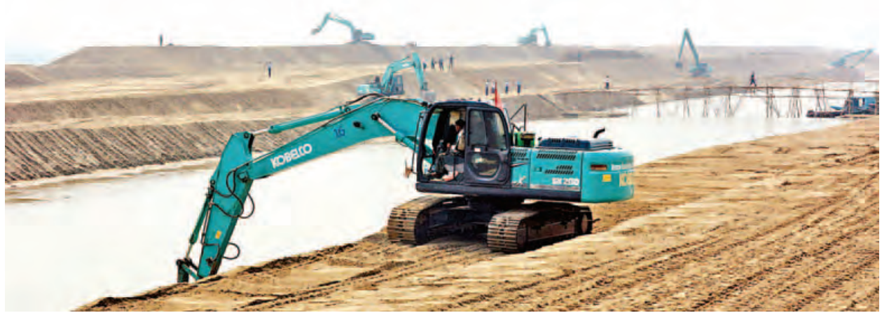
စက်ယန္တရားများဖြင့် ဖြတ်မြောင်းတူးဖော်မှုကို တွေ့ရစဉ်။