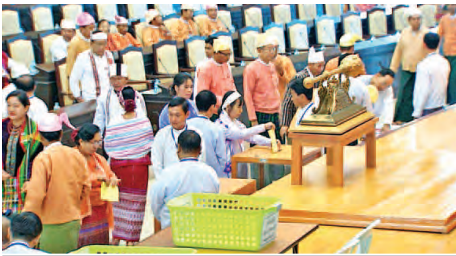
ရွေးကောက်ပွဲအမျိုးသားလွှတ်တော်ကိုယ်စားလှယ်များ လျှို့ဝှက်ဆန္ဒမဲပေးကြစဉ်။ (သတင်းစဉ်)

ယင်းနောက် အမျိုးသားလွှတ်တော်ဥက္ကဋ္ဌ မန်းဝင်းခိုင် သန်းက ထောက်ခံဆန္ဒမဲ (၁၄၈)မဲရရှိသည့် ချင်းပြည်နယ် မဲဆန္ဒနယ်အမှတ်(၃)မှ ဦးဟင်နရီဗန်ထီးယူကို ဒုတိယ သမ္မတအဖြစ် ရွေးချယ်တင်မြှောက်ကြောင်းကြေညာပြီး