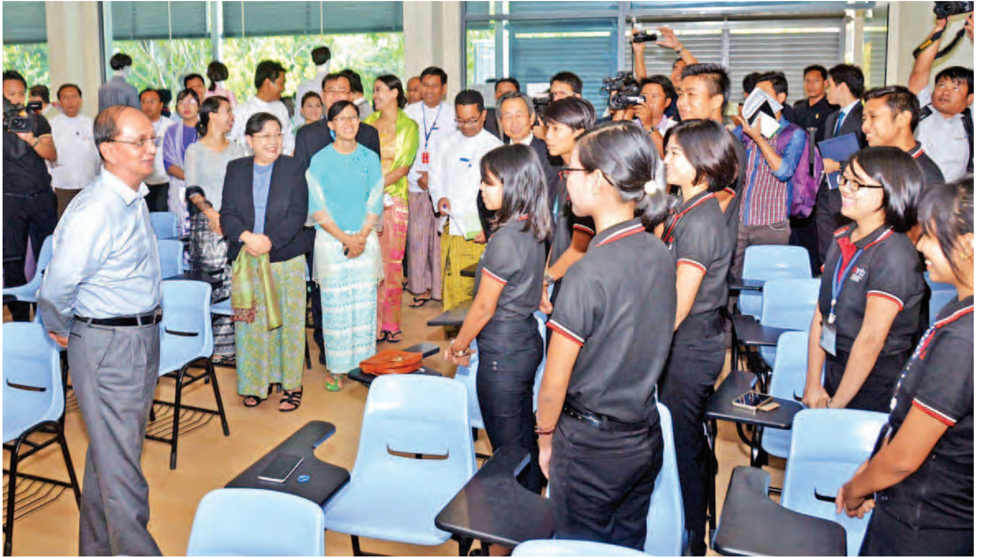
နိုင်ငံတော်သမ္မတ ဦးသိန်းစိန် စင်ကာပူ-မြန်မာ သက်မွေးပညာသင်တန်းကျောင်း(ရန်ကုန်)မှ ကျောင်းသား ကျောင်းသူများအား ရင်းရင်းနှီးနှီးနှုတ်ဆက်စဉ်။ (သတင်းစဉ်)

နေပြည်တော် မတ် ၁၁ ပြည်ထောင်စုသမ္မတမြန်မာနိုင်ငံတော် နိုင်ငံတော်သမ္မတ ဦးသိန်းစိန်သည် ယနေ့ နံနက်ပိုင်းတွင် ဧရာဝတီတိုင်းဒေသကြီး ဟင်္သာတခရိုင် လွန်မြို့နယ် ဝါသလ-မေခုံ ရွာအနီး မြစ်ကမ်းစားခြင်းနှင့် ရေဘေးအန္တရာယ်ကာကွယ်ခြင်း လုပ်ငန်းစီမံကိန်းနှင့် ရန်ကုန်မြို့၊ ပဟန်းမြို့နယ် နတ်မောက်လမ်းရှိ စင်ကာပူ-မြန်မာသက်မွေးပညာသင်တန်းကျောင်းတို့ကို သွားရောက်ကြည့်ရှုစစ်ဆေးသည်။ စာမျက်နှာ ၈ ကော်လံ ၁ သို့ ၁၆