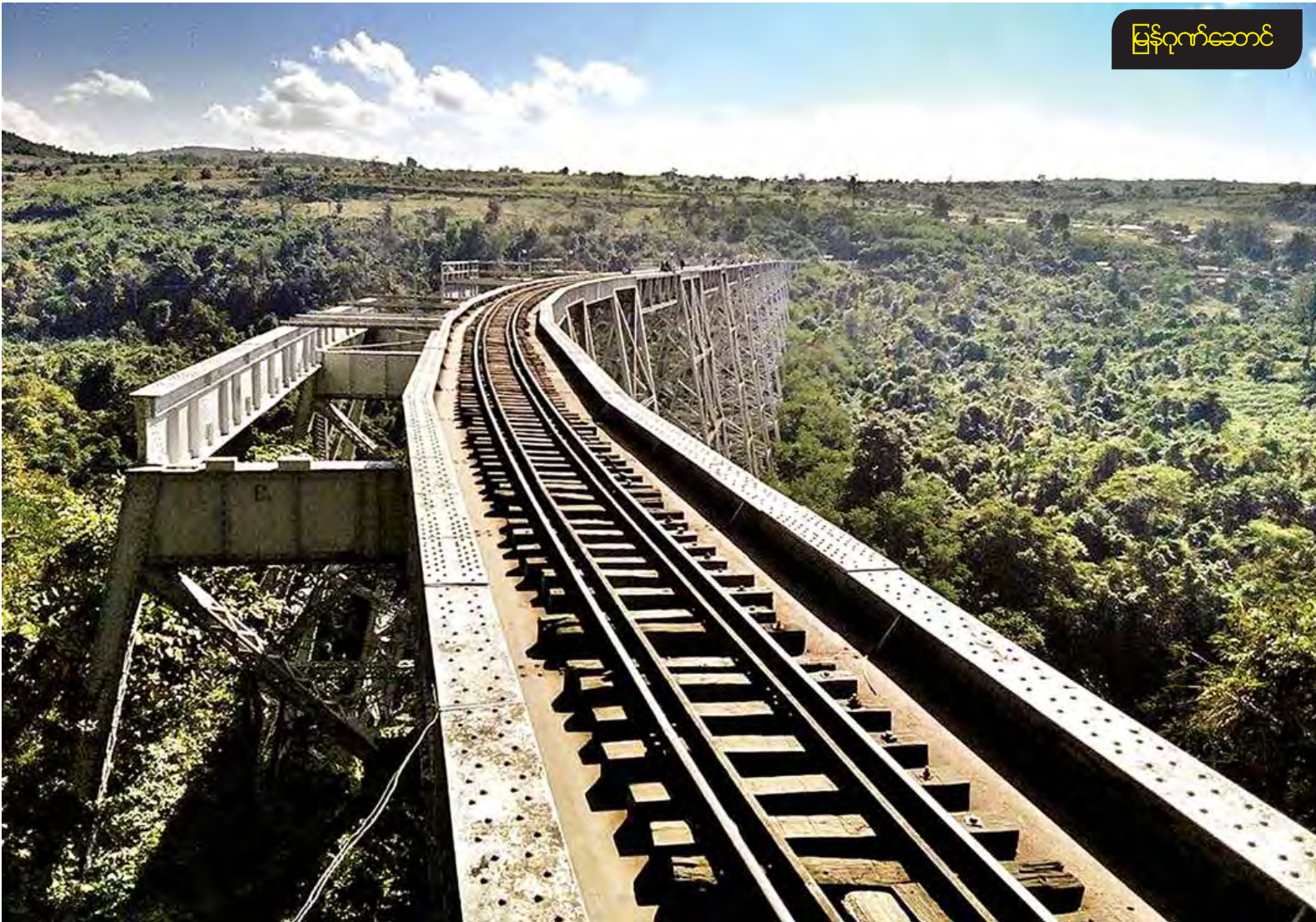
မြန်ဂုတ်ဆောင်

ကမ္ဘာပေါ်တွင် အမြင့်မားဆုံးရထား လမ်းဖြစ်လာမည့် ဂုတ်ထိပ်တံတားကို တာဝန်ယူတည်ဆောက်ရန် ဗြိတိသျှ အစိုးရက အမေရိကန်နိုင်ငံ ပင်ဆဲလ် ဗေးနီးယားနှင့် မေရီလန်စတီးကွမ်ဘီ တို့ကိုငှားရမ်းခဲ့သည်။ သို့ရာတွင် တံတားကြီးကို ဦးစီးတည်ဆောက် သူမှာ မြန်မာ့မီးရထားဌာနမှ အင်ဂျင် နီယာ Sir Arthur Rendel နှင့် ဗြိတိသျှ မြန်မာအင်ဂျင်နီယာများ သာဖြစ်သည်။ တံတားအတွက် စာမျက်နှာ ၉ ကော်လံ ၁ သို့