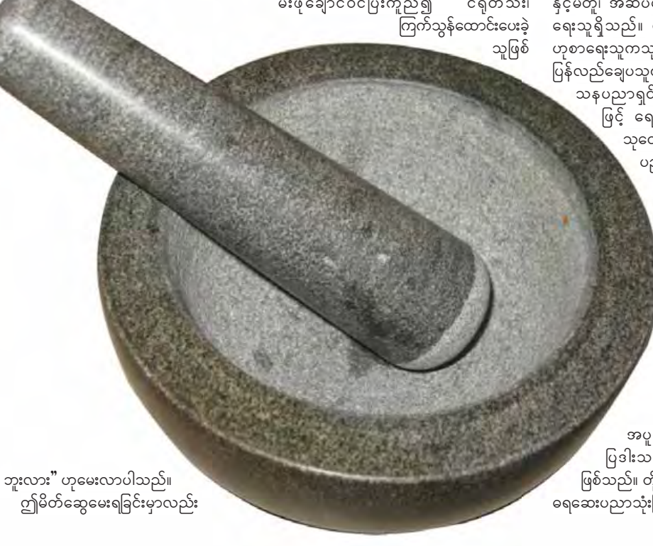
ဘူးလား” ဟုမေးလာပါသည်။ ဤမိတ်ဆွေမေးရခြင်းမှာလည်း

နှစ်နှစ်ခန့်က အထက်မြန်မာပြည်သို့ ဘုရားဖူးလာကြသည်။ လည်ရင်းပတ်ရင်း ဘုရားဖူးရင်း မိမိတို့နှစ်သက်ရာအသုံးအဆောင်များလည်း ဝယ်ကြသည်။ စစ်ကိုင်းမြို့သို့ရောက်သောအခါ ကောင်းမှုတော်ဘုရားကြီးဖူးရင်း အိမ်အတွက် ကျောက်ပျဉ်နှင့် ကျောက်ငရုတ်ဆုံများ ဝယ်သွားကြသည်။ သူတို့အောက်အရပ်တွင် ရှားပါးသဖြင့် အလေးခံပြီး ဝယ်ယူသယ်ဆောင်သွားကြခြင်းဖြစ်သည်။ မိတ်ဆွေက သတိထားမိသည်မှာ သူ့ကိုယ်တိုင်ဝယ်ပေးလိုက်သည့် ကျောက်ငရုတ်ဆုံသည် တိမ်တိမ်လေးဖြစ်သည်။ သူ့ကိုယ်တိုင်က အရာရှိကြီးဖြစ်သော်လည်း မီးဖိုချောင်ဝင် ချက်ပြုတ်ရသည်ကို ဝါသနာပါသည်။ ငယ်စဉ်ကတည်းက မိဘကူရင်းမီးဖိုချောင်ဝင်ပြီးကူညီ၍ ငရုတ်သီး၊ ကြက်သွန်ထောင်းပေးခဲ့သူဖြစ်