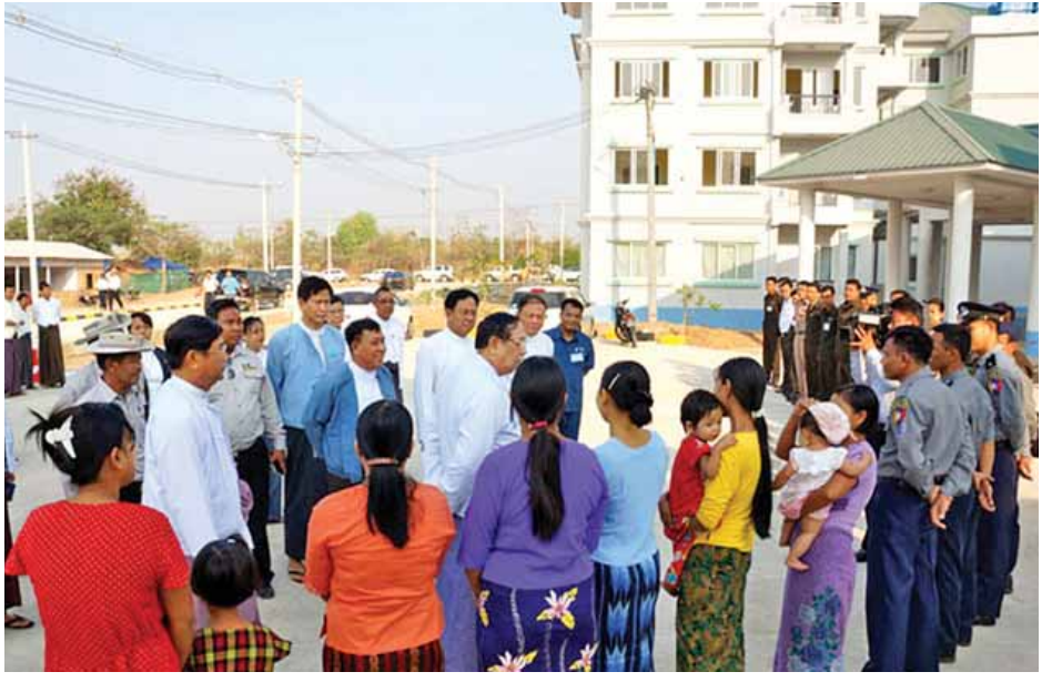
နှစ်အတွင်း ဆောက်လုပ်ပြီးစီးခဲ့သည့် ဝန်ထမ်း ၁၄၄၀၊ အမှုထမ်းအိမ်ထောင်စုဝန်ထမ်းအိမ်ရာများတွင် လူပျို အပျို သည် ၅၀၄ ဦး စုစုပေါင်း ၁၉၄၄ ဦးတို့ကို နေရာချထားပေးနိုင်ခဲ့ကြောင်း သိရသည်။ ခရိုင်(ပြန်/ဆက်)

၂၀၁၅-၂၀၁၆ ဘဏ္ဍာရေးနှစ်အတွင်း ဆောက်လုပ်ခဲ့သည့် နှစ်ထပ်လူပျိုဆောင်ငါးလုံး၊ နှစ်ထပ် အပျို