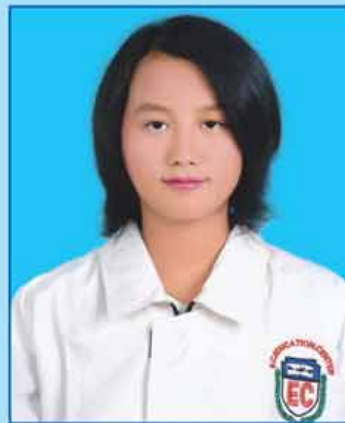
မမြင့်မြတ်လော် (ဆဗဟ-၆၂၂) ရန်ကုန်မြို့