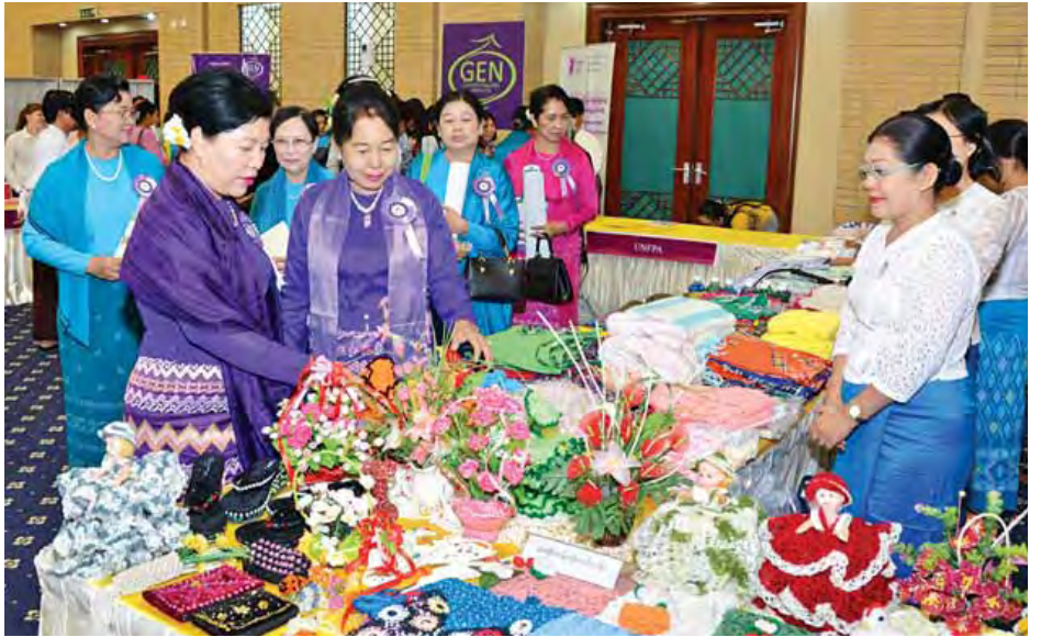
ဒုတိယသမ္မတ ဦးညွှန်ထွန်း၏ဇနီး ဒေါ်ခင်အေးမြင့် အပြည်ပြည်ဆိုင်ရာအမျိုးသမီးများနေ့ အထိမ်းအမှတ်ခင်းကျင်းပြသထားမှုများကို လှည့်လည်ကြည့်ရှုစဉ်။ (သတင်းစဉ်)

၂၀၁၄ ခုနှစ် ဒီဇင်ဘာအတွင်း ထုတ်ဝေပြန်ချိခဲ့သည့် မြန်မာနိုင်ငံ လူမှုကာကွယ်စောင့်ရှောက်ရေးဆိုင်ရာ အမျိုးသားအဆင့် မဟာဗျူဟာစီမံချက် (Myanmar National Strategic Plan on Social Protection)တွင်လည်း အမျိုးသမီးများအတွက် လူမှုကာကွယ်စောင့်ရှောက်ရေး လုပ်ငန်းများကို ထည့်သွင်းရေးဆွဲထားပြီးဖြစ်ပါကြောင်း။ ၂၀၁၅ ခုနှစ်အတွင်းတွင် လှမူဝန်ထမ်း၊ ကယ်ဆယ်