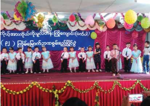
ကိုယ့်အားကိုယ်ကိုးမူလတန်းကြိုကျောင်း(ဝက်ပါ) ကြိုပြင်ဆင်ဉာဏစွမ်းရည်ပြိုင်ပွဲ

ရန်ကုန် မတ် ၈ ရန်ကုန်မြို့ ဗဟန်းမြို့နယ် မြန်မာအမျိုးသမီးများဖွံ့ဖြိုးတိုးတက်ရေးအသင်း (ဝက်ပါ) ကိုယ့်အားကိုယ်ကိုး မူလတန်းကြိုကျောင်း (ဝက်ပါ) မှ ရင်သွေးငယ်များ၏ (၃၂)ကြိမ်မြောက် ဉာဏစွမ်းရည်ပြိုင်ပွဲကို အဆိုပါ ကျောင်းခန်းမ၌ ဖေဖော်ဝါရီ ၂၈ ရက် နံနက် ၉ နာရီ၌ ကျင်းပသည်။