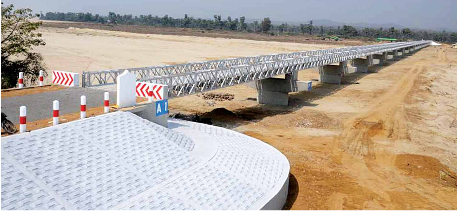
မကြာမီ ဖွင့်လှစ်တော့မည့် ကနီမြို့နယ်ရှိ ရေဝါချောင်းကူးတံတားအား တွေ့ရစဉ်။