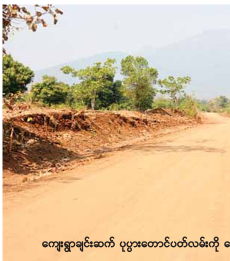
ကျေးရွာချင်းဆက် ပုပ္ပားတောင်ပတ်လမ်းကို တွေ့ရစဉ်။

လုပ်ငန်းများကို ၂၀၀၀ ပြည့်နှစ်မှစတင်ကာ လုပ်ဆောင် ခဲ့ပြီး ယခုအခါ ဒေသတွင်း ကျန်းမာရေးစောင့်ရှောက်မှု၊ ပညာသင်ကြားမှုနှင့် လမ်းပန်းဆက်သွယ်ရေးမှာ အဆင့် မြင့်ခဲ့ပြီဖြစ်ကြောင်း မွေးမြူရေး၊ ရေလုပ်ငန်းနှင့် ကျေးလက် ဒေသဖွံ့ဖြိုးရေးဝန်ကြီးဌာန၊ မြို့နယ်ကျေးလက်ဒေသ ဖွံ့ဖြိုးတိုးတက်ရေးဦးစီးဌာန လက်ထောက်ညွှန်ကြား ရေးမှူးထံမှ သိရသည်။