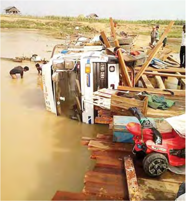
(မောင်ချစ်လင်း)

ဖြစ်စဉ်မှာ မတ် ၆ ရက် နံနက် ၉ နာရီတွင် ရဲအုပ်စိုးလှိုင်သည် မဲဇာ ရဲကင်းစခန်းမှူး တာဝန်ဆောင်ရွက် နေစဉ် နတ်ရေတွင်းရွာနှင့် မဲဇာရွာ ကြား မဲဇာချောင်းကူးတံတားပေါ်တွင် ယာဉ်တစ်စီးတိမ်းမှောက်နေကြောင်း သတင်းအရ သက်သေများနှင့်အတူ သွားရောက်စစ်ဆေးရာ ဝန်းသို- နန်းခမ်း-မဲဇာ ကားလမ်းအတိုင်း ယာဉ်မောင်း တင်ငွေမောင်းနှင့်သည့် ခြောက်ဘီး အဖြူရောင်ယာဉ်သည် စိုးမိုးအောင် (ချားရဟတ်)အဖွဲ့မှ ပစ္စည်းများ တင်ဆောင်မောင်းနှင်လာ စဉ် မဲဇာချောင်းပေါ်ရှိ ယာရီကားကူး တံတားအား ဖြတ်သန်းမောင်းနှင်စဉ် တံတား အလယ်အရောက်တွင် တံတားကျိုးကျပြီး ယာဉ်မှာယာဘက် အခြမ်းသို့ တစောင်းလဲကျကာ မဲဇာချောင်းအတွင်းသို့ ပြုတ်ကျ သွားခြင်းဖြစ်ကြောင်း၊ လူတစ်ဦး တစ်ယောက်မျှ ထိခိုက်ဒဏ်ရာရရှိမှုမရှိ ကြောင်း သိရသည်။