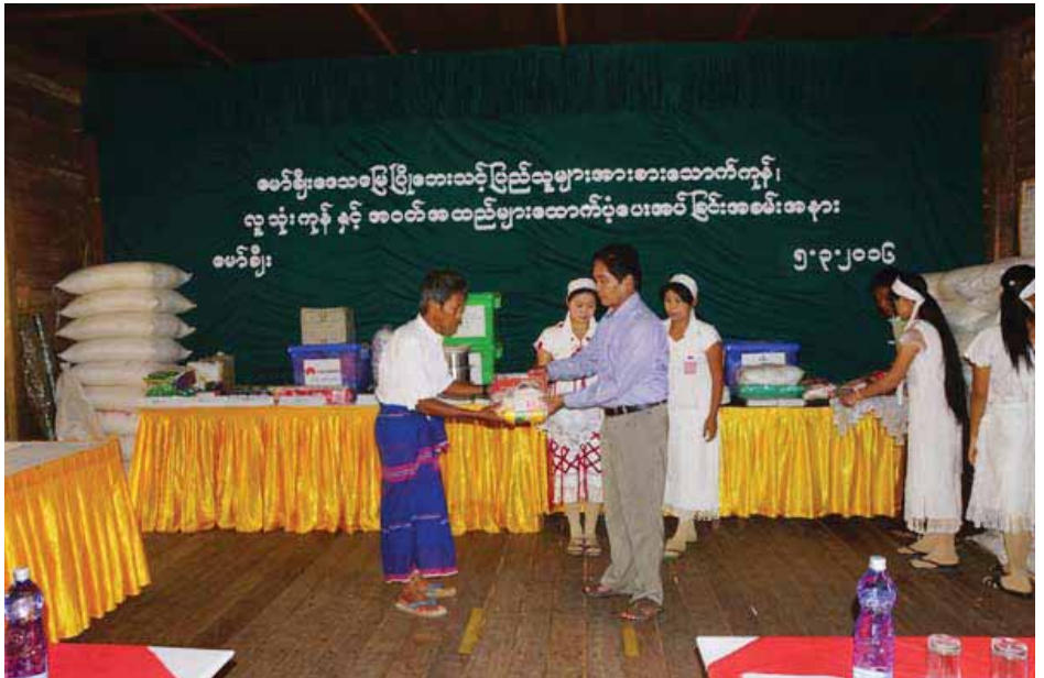
ယင်းနောက်ပြည်နယ် ဝန်ကြီးများနှင့် တာဝန်ရှိသူများက ကမ္ဘောဇအနာဂတ်အလင်းတန်းမြန်မာ ဖောင်ဒေးရှင်းမှ လှူဒါန်းသည့် သဘာဝဘေးအန္တရာယ်နှင့် ရင်ဆိုင် ကြုံတွေ့ခဲ့ရသော မော်ချီးဒေသပြန်လည်ထူထောင် ရေးနှင့် အနာဂတ်အလင်းတန်းကျေးရွာ တည်ဆောက်ရေး စီမံကိန်းသို့ ရောက်ရှိပြီး လူနေအိမ်များ၊ စာသင်ဆောင်များနှင့် စာကြည့်တိုက်၊ အားကစားကွင်းဆောက်လုပ်ခြင်း၊ ရေသွယ်ယူရေး ဆောင်ရွက်ခြင်း၊ လျှပ်စစ်မီးသွယ်တန်းခြင်း စသည့်လုပ်ငန်းများ ဆောင်ရွက်နေမှုအား သွားရောက် ကြည့်ရှုစစ်ဆေးပြီး လိုအပ်သည်များ မှာကြားခဲ့ကြောင်း သိရသည်။

စားသောက်ကုန်၊ လူသုံးကုန်နှင့် အဝတ်အထည်များကို ဘေးဒဏ်သင့်ပြည်သူများအား အကြိမ်ကြိမ်ထောက်ပံ့ပေးအပ်ခဲ့ရာ ယခုဆိုလျှင် စတုတ္ထအကြိမ်မြောက် ရောက်ရှိခဲ့ပြီဖြစ်ကြောင်း စီမံကိန်းဆေးရုံဟောင်းတွင် ရှိသည့် ဒုက္ခသည်များကိုလည်း နေ့စဉ်ထောက်ပံ့ပေးလျက် ရှိကြောင်း၊ ယနေ့ပေးအပ်သည့် ပစ္စည်းများကတော့ ကယ်ဆယ်ရေးပစ္စည်းရုံဒေါင် တို့တွင် ထိန်းသိမ်းထားရှိသည့် လက်ကျန်ပစ္စည်းများကို ဒုက္ခသည်များလက်ဝယ် အရောက် လူဦးရေအလိုက် အချိုးကျ ပေးအပ်သွားမည် ဖြစ်ကြောင်း၊ ပေးအပ်မည့်ပစ္စည်းများမှာ ဆန် ၂၃၅၁၅ ပြည်၊ ဆီ ကျပ်သား ၁၀၇၀၀၊ ဆား ၄၉၅ ထုပ်၊ ခေါက်ဆွဲ ၂၅၀၇ ထုပ်၊ ပြောင်းဖူးဘူး ၅၈၀၀ တို့ကို ဘေးဒဏ်သင့် အိမ်ထောင်စု ၁၃၅၇ (လူဦးရေ ၄၅၃၃ ဦး)အားအချိုးကျ ခွဲဝေပေးသွားမည်ဖြစ်ကြောင်း အဝတ် အထည်များ၊ ရိက္ခာခြောက်အိတ်များ၊ ကြွေရည်စိမ်ပစ္စည်းများ၊ ငပိထောင်း၊ ဆပ်ပြာ၊ ဒန့်အိုး/ဒယ်အိုး၊ စတီး ဇလုံ၊ မိုးကာ အင်္ကျီစသည့်ပစ္စည်းများကို မဲစနစ်ဖြင့် ခွဲဝေပေးသွားမည် ဖြစ်ကြောင်း ပြောသည်။