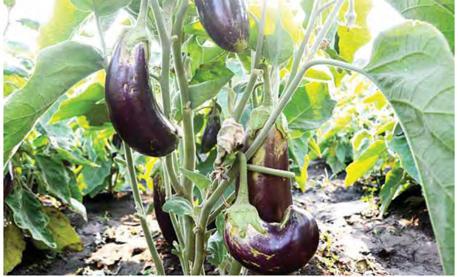
အောင်မြင်ဖြစ်ထွန်းနေသော ခရမ်းသီးပင်များကို တွေ့ရစဉ်။

သေးတာကြောင့်ပါ။ အော်ဂဲနစ်သီးနှံဖြစ်ဖို့ ကြိုးစားနေ တယ်။ နောက်ဆိုရင် ကျွန်တော်တို့ဆီကထွက်တဲ့ စိန် တစ်လုံးရော၊ ပတ္တမြားငမောက်ရော ခူးစားဖို့မတန်အောင် လှကြတယ်။ ဝင်းပြီး အစိမ်းရောင်ကကို အမှည့်နဲ့တူလွန်းလို့ အော်ဒါများတယ်။ ပတ္တမြားငမောက်ဆို သင်္ဘောသီး ရှုံးတယ်။ အသားချည်းပဲမို့ ဝယ်လက်တွေက အပင်တန်း