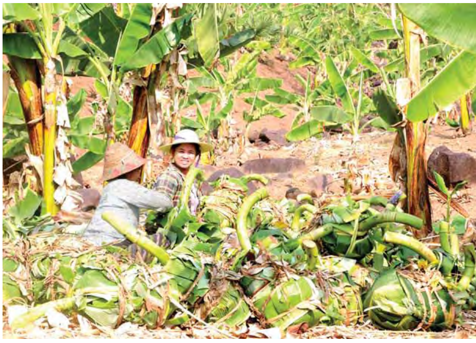
လျှော်တောရွာသူမများ ခုတ်ယူပြီးသော ငှက်ပျောခိုင်းများကို ရောင်းချရန်အတွက် ထုပ်ပိုးနေသည်ကို တွေ့ရစဉ်။

“သရက်ပင် ၆၀၀ ရှိတယ်။ အားလုံးကိုင်းဆက်ထား တာတွေပါ။ ဒီနှစ်အပွင့်များပေမယ့် အသီးထွက်နှုန်း