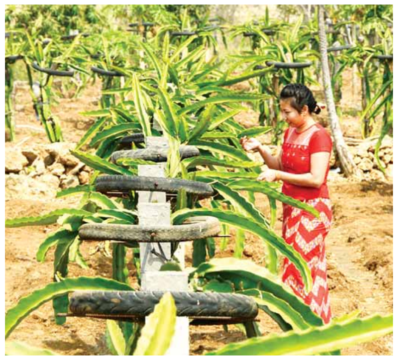
ပုပ္ပားဒေသ နတ်ကန်လည်ရွာတွင် ဖူးပွင့်နေသည့်သရက်များ (အပေါ်ပုံ)နှင့် အသီးစတင်တော့မည့် နဂါးမောက်ပင်များ (အောက်ပုံ)ကို တွေ့ရစဉ်။

လူငယ်တစ်ဦး မိမိကိုယ်မိမိ အဆုံးစီရင်မှုဖြစ်ပွား စာမျက်နှာ - ၃