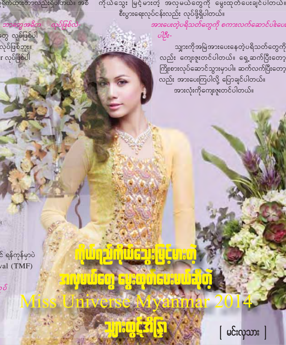
ကိုယ်ရည်ကိုယ်သွေးမြင့်မားစွာ အလှမယ်တွေ ပွေးထုတ်ပေးမယ်ဆိုတဲ့ Miss Universe Myanmar 2014 သွားထွင့်အိန္ဒြာ [ မင်းလှသား ]

သွားကိုအမြဲအားပေးနေတဲ့ပရိသတ်တွေကိုလည်း ကျေးဇူးတင်ပါတယ်။ ရှေ့ဆက်ပြီးတော့ ကြိုးစားလုပ်ဆောင်သွားမှာပါ။ ဆက်လက်ပြီးတော့လည်း အားပေးကြပါလို့ ပြောချင်ပါတယ်။ အားလုံးကိုကျေးဇူးတင်ပါတယ်။