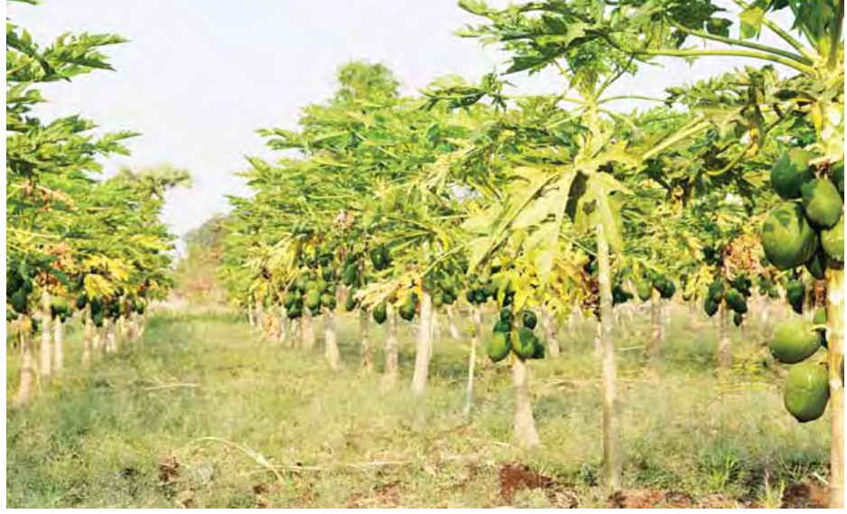
အပင်တိုင်းတွင် အသီးတင်နေသော သင်္ဘောပင်များ အောင်မြင်ဖြစ်ထွန်းနေသည်ကို တွေ့ရစဉ်။

ပုပ္ပားဧရိယာများတွင် ကြိုးဝိုင်းဧရိယာ ၃၁၇၆၃ ဒသမ ၂ ဧကရှိပြီး ကြိုးပြင်ကာကွယ်တော ဧရိယာမှာ ဧက ၂၅၆၀၀ ခန့်ရှိကြောင်း သိရသည်။ ပုပ္ပားတောင် ဥယျာဉ်အား ၁၉၀၂ ခုနှစ်တွင် စတင်ထိန်းသိမ်းခဲ့ခြင်းဖြစ်ပြီး ဒေသခံပြည်သူများ၏ ငှက်ပျောတိုးချဲ့စိုက်ပျိုးမှုများ ကြောင့် သဘာဝရေထွက်စမ်းအချို့ ပိတ်သွားခဲ့ပြီး တောတောင်စိမ်းလန်းမှုလည်း အားလျော့လာခြင်းကြောင့် ယခင်တပ်မတော်အစိုးရလက်ထက် ၁၉၉၆ ခုနှစ်မှ စတင်ကာ ငှက်ပျောစိုက်ခင်းများအား ဖယ်ရှားခဲ့သည့် အတွက် သဘာဝရေထွက် ၉၉ ခုမှ ၁၁၁ ခုအထိ ပြန်လည် မြင့်မားလာခဲ့သည်။ ထို့ပြင် ပုပ္ပားတောင်အရှေ့ဘက်ခြမ်းရှိ ငှက်ပျောစိုက်ခင်း ၅၄၇၅ ဧကကို သစ်တောသီးနှံ နှစ်ရှည် သီးနှံများဖြင့် ပြောင်းလဲစိုက်ပျိုးခဲ့ရာ ယင်းအသီးအပွင့်များ သည် ယနေ့ ပုပ္ပားဒေသခံများ ခံစားရယူနိုင်ကြပြီဖြစ်သည်။ ထို့ပြင် ပုပ္ပားတောင်အရှေ့ခြမ်း စိမ်းလန်းစိုပြည်ရေး