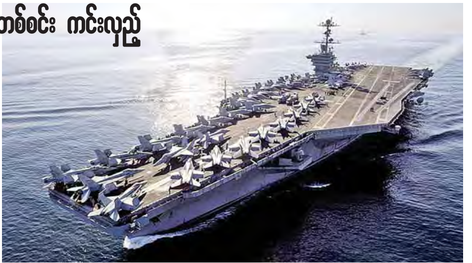
သင်္ဘောများနှင့်လေယာဉ်များ တပ်ဖြန့်ထားခြင်းမှာ တရုတ်နိုင်ငံအတွက် သိသာထင်ရှားသော စိန်ခေါ်မှုတစ်ရပ်ပင်ဖြစ်ကြောင်း လေ့လာစောင့်ကြည့်သူများက ဆိုသည်။ အင်န်အိတ်ချ်ကေ။

ရက်သတ္တပတ်ကတည်းက ကင်းလှည့်လျက်ရှိသည်ဟု ကာကွယ်ရေးဌာနက ဆိုသည်။ ထိုသို့စစ်သင်္ဘောများ ကင်းလှည့်ခြင်းမှာ လွန်ခဲ့သော လက တရုတ်နိုင်ငံက တောင်တရုတ်ပင်လယ်အတွင်းရှိ အငြင်းပွားကျွန်းများပေါ်တွင် ရေဒါစနစ်များ တပ်ဆင်ထားခြင်းကြောင့်ဖြစ်သည်။ အမေရိကန်အစိုးရက တောင်တရုတ်ပင်လယ်အတွင်းတွင် ကာကွယ်ရေးအဆောက်အအုံများ ထပ်မံတိုးချဲ့ခြင်း မပြုရန် ပေးကျင့်ကို တောင်းဆိုထားသည်။ အမေရိကန်အနေဖြင့် တရုတ်တည်ဆောက်ထားသော ကျွန်းတုများ အနီးရှိ နိုင်ငံတကာလေကြောင်းပိုင်နက်အတွင်းတွင် လေယာဉ်များလွတ်လပ်စွာပျံသန်းမည်ဖြစ်ကြောင်းကို လည်း ကာကွယ်ရေးဌာနက ဆက်လက်ပြောသည်။ တောင်တရုတ်ပင်လယ်အတွင်းသို့ အမေရိကန်