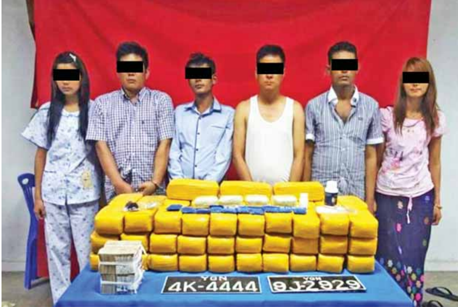
ရန်ကုန်မြို့၊ မရမ်းကုန်းမြို့နယ်တွင် ဖမ်းဆီးရမိသူများအား မူးယစ်ဆေးဝါးများနှင့်အတူ တွေ့ရစဉ်။