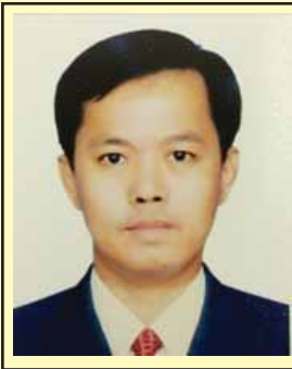
(တက္ကသိုလ် ဟန်စိုးဦး)

၂၁ ရာစု ပင်လယ်ရေကြောင်း ပိုးလမ်းမဟု လူသိများပြီး နိုင်ငံပေါင်းစုံကျယ်ကျယ်ပြန့်ပြန့်ပါဝင်သော စီးပွားရေးလမ်းကြောင်းတစ်ခုကို တရုတ်ပြည်သူ့သမ္မတနိုင်ငံ သမ္မတရှီကျင့်ဖျင်က စတင်အဆိုပြုခဲ့ပြီး တောင်တရုတ်ပင်လယ်၊ တောင်ပစိဖိတ်သမုဒ္ဒရာ၊ အိန္ဒိယသမုဒ္ဒရာများနှင့် တစ်ဆက်တစ်စပ်တည်းရှိနေသည့် အရှေ့တောင်အာရှဒေသနိုင်ငံများ၊ ပင်လယ်သမုဒ္ဒရာကျွန်းနိုင်ငံများ၊ အရှေ့အာဖရိကနိုင်ငံများ မြေထဲပင်လယ် မြောက်ပိုင်းနိုင်ငံများအကြား ပူးပေါင်းဆောင်ရွက်မှုများ ပြုလုပ်သွားမည့် အစီအစဉ်ဖြစ်ပါသည်။ အဆိုပါ ပိုးလမ်းမကြီးအကြောင်းကို စာရေးဆရာ တက္ကသိုလ်ဟန်စိုးဦးက ရုပ်ဝန်းတစ်ခု လမ်းကြောင်းတစ်ခုအမည်ဖြင့် ရေးသားထား သည့်များကို ကြေးမုံစာဖတ်ပရိသတ်များအတွက် အခန်းဆက်ဆောင်းပါးများအဖြစ် ဖော်ပြလိုက်ပါသည်။ (စာတည်း)