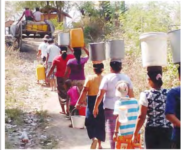
တပ်ကုန်း မတ် ၆

နေပြည်တော်ကောင်စီနယ်မြေ တပ်ကုန်းမြို့နယ် ထုံးတမ်းကျေးရွာအုပ်စုရှိ ထုံးတမ်းကျေးရွာသည် သောက်သုံးရေရှားပါးသည့်အတွက် ယခုနှစ်နေရာသီ၌ သောက်သုံးရေ မလုံလောက်မည်ကို စိုးရိမ်နေကြောင်း သိရသည်။ ထုံးတမ်းကျေးရွာတည်ရှိသည့် ရွာမြေများမှာ ကျောက်စရစ်ကုန်းမြေဖြစ်၍ အုတ်ရေတွင်း၊ လက်နီတုံကင်ရေတွင်း၊ စက်ရေတွင်းများတူးဖော်ရာတွင် ကျောက်ဆောင်များခံနေပြီး ရေထွက်ရှိမှုမရှိကြောင်း သိရသည်။ ယင်းကြောင့် ရွာ၏မြောက်ဘက် လယ်ယာမြေအနီး၌ တစ်တွင်းတည်းသာ ရှိသော ပေ ၁၄၀ အနက်ရှိ စက်ရေတွင်းမှရေကိုသာ တစ်ရွာလုံးအားထားသောက်သုံးနေရသည်။ ယင်းကြောင့် ကျေးရွာပြည်သူများနှင့် ကျွဲ၊ နွားများအတွက် နွေရာသီတွင် သောက်သုံးရေ လုံလောက်စွာရရှိရေးအတွက် ရေတွင်း၊ ရေကန် အလှူရှင်များ လိုအပ်နေကြောင်း ဒေသပြည်သူများက ပြောသည်။ ယင်းကျေးရွာတွင် ဘုန်းတော်ကြီးကျောင်းတစ်ကျောင်း၊ အခြေခံပညာ အထက်တန်းကျောင်း(ခွဲ) တစ်ကျောင်း၊ ကျန်းမာရေးဆေးခန်းတစ်ခုရှိပြီး အိမ်ခြေ ၃၂၉ အိမ်၊ လူဦးရေ ၁၆၄၇ ဦးနေထိုင်ကြောင်း သိရသည်။ တင်စိုးလွင်