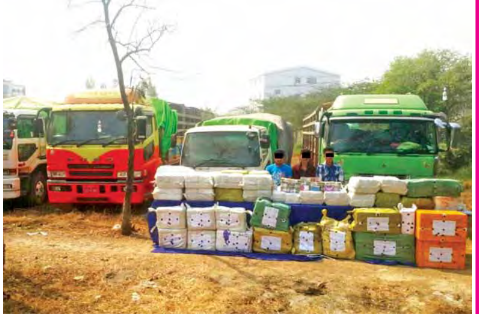
မန္တလေးမြို့၊ ပြည်ကြီးတံခွန်မြို့နယ်တွင် ဖမ်းဆီးရမိသူများအား မူးယစ်ဆေးဝါးများ၊ ထိန်းချုပ်ဓာတုပစ္စည်းများနှင့်အတူ တွေ့ရစဉ်။