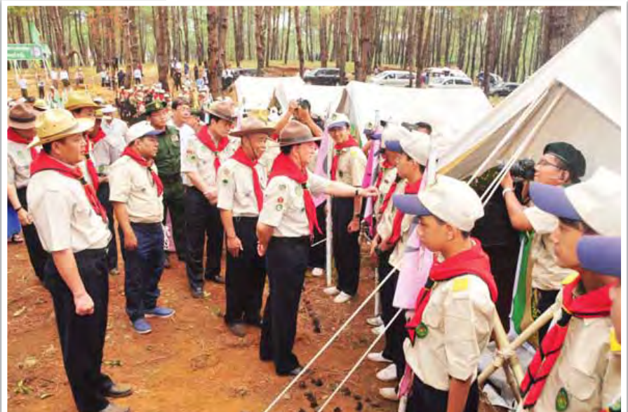
၂၀၁၅ ခုနှစ် တတိယအကြိမ် ကင်းထောက်စခန်းချတွေ့ဆုံမှုကို ပြင်ဦးလွင်၌ ကျင်းပခဲ့ရာ နိုင်ငံတော်သမ္မတ ဦးသိန်းစိန် ကင်းထောက်မောင်မယ်များ၏ ကင်းစိတ်အလိုက် စခန်းချစွမ်းဆောင်ထားမှုကို ကြည့်ရှုအားပေးစဉ်။