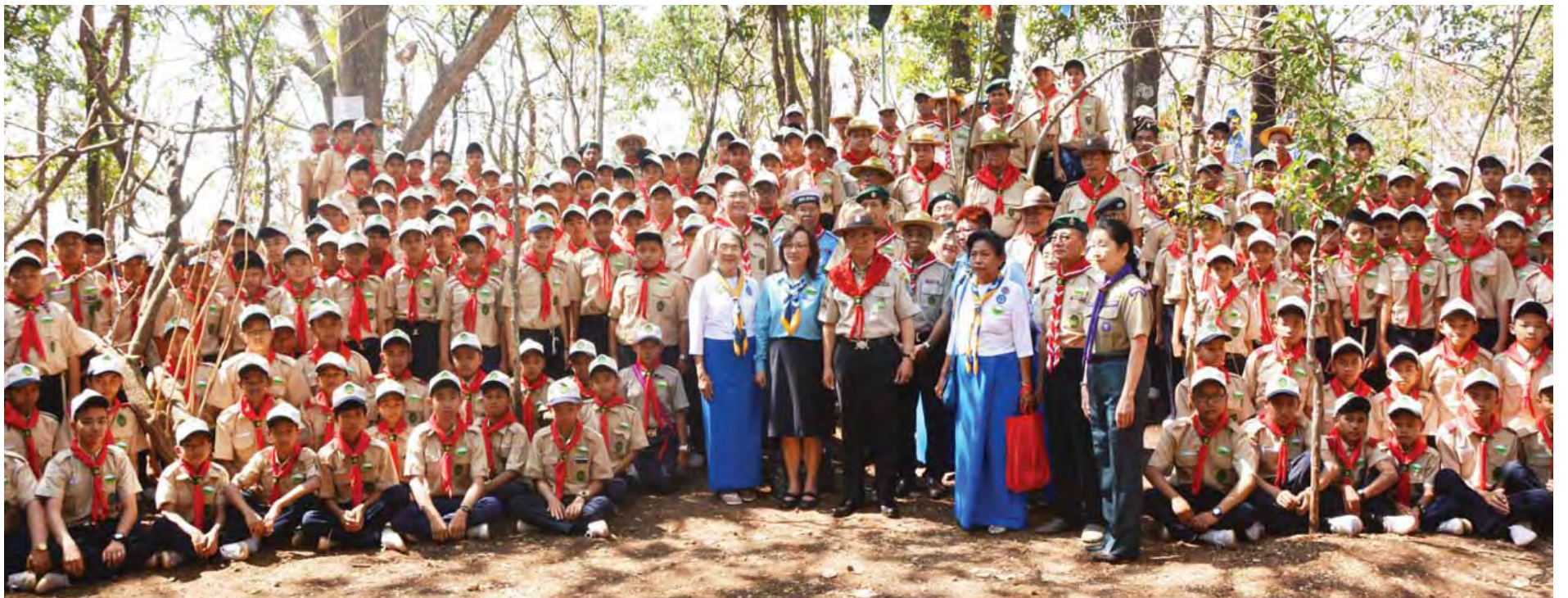
နိုင်ငံတော်သမ္မတ ဦးသိန်းစိန် ကင်းထောက်ကြီးများ၊ ကင်းထောက်လူငယ်များ၊ ကမ္ဘာ့ကင်းထောက်အဖွဲ့၊ အာရှ-ပစိဖိတ်ဒေသဆိုင်ရာ ကင်းထောက်အဖွဲ့ချုပ်မှတာဝန်ရှိသူများနှင့်အတူ စုပေါင်းမှတ်တမ်းတင်ဓာတ်ပုံရိုက်စဉ်။

မည်ဖြစ်ကြောင်း။ ယခုလူငယ် နောင်ဝယ်လူကြီးဆို သကဲ့သို့ မောင်တို့မယ်တို့သည် တစ်ချိန်တွင် တိုင်းပြည်၏တာဝန်များကို စာမျက်နှာ ၉ ကော်လံ ၁ သို့ *