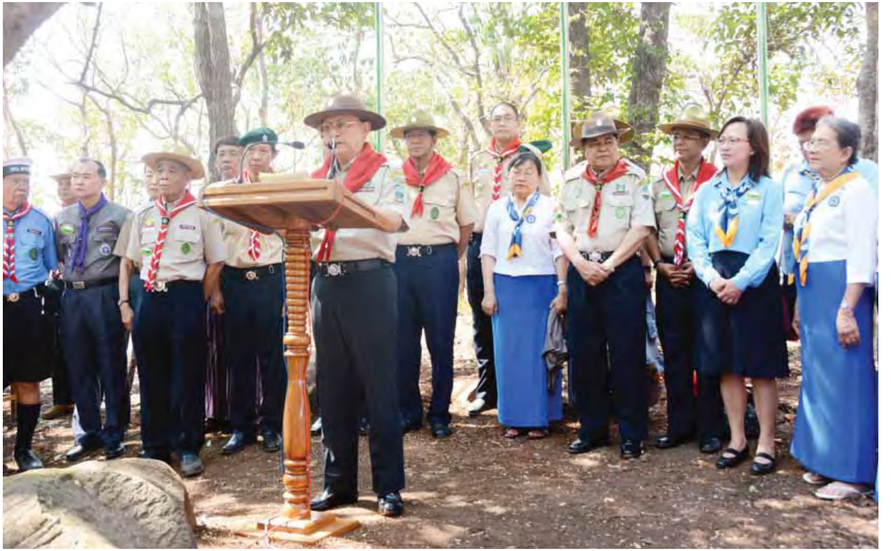
နိုင်ငံတော်သမ္မတ ဦးသိန်းစိန် ကင်းထောက်လူငယ်များအား အမှာစကားပြောကြားစဉ်။

မောင်တို့မယ်တို့အဖွဲ့တွင် မြန်မာ နိုင်ငံအနှံ့အပြား တိုင်းဒေသကြီးနှင့် ပြည်နယ်အသီးသီးတို့မှ အခြေခံ ပညာအဆင့်၊ အထက်တန်းအဆင့်နှင့် တက္ကသိုလ်အဆင့်တို့မှ တိုင်းရင်းသား