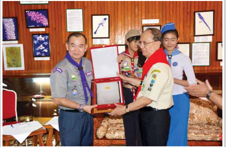
နိုင်ငံတော်သမ္မတ ဦးသိန်းစိန် အာရှပစိဖိတ်ဒေသဆိုင်ရာ ကင်းထောက်အဖွဲ့ ဒါရိုက်တာ Mr.Thian Hiong-Boon အား ပုပ္ဖားသစ်တောဥယျာဉ် ညှော်ခန်းမ၌ အမှတ်တရလက်ဆောင်ပေးအပ်စဉ်။