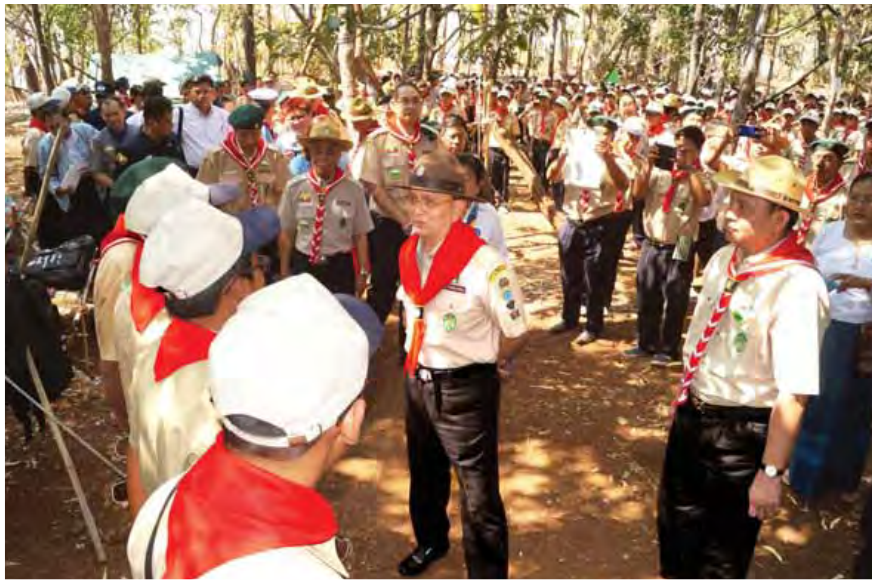
နိုင်ငံတော်သမ္မတ ဦးသိန်းစိန် ပုပ္ဖားကင်းထောက်စခန်း၌ ကင်းထောက်လူငယ်များအား ရင်းရင်းနှီးနှီး နှုတ်ဆက်စဉ်။