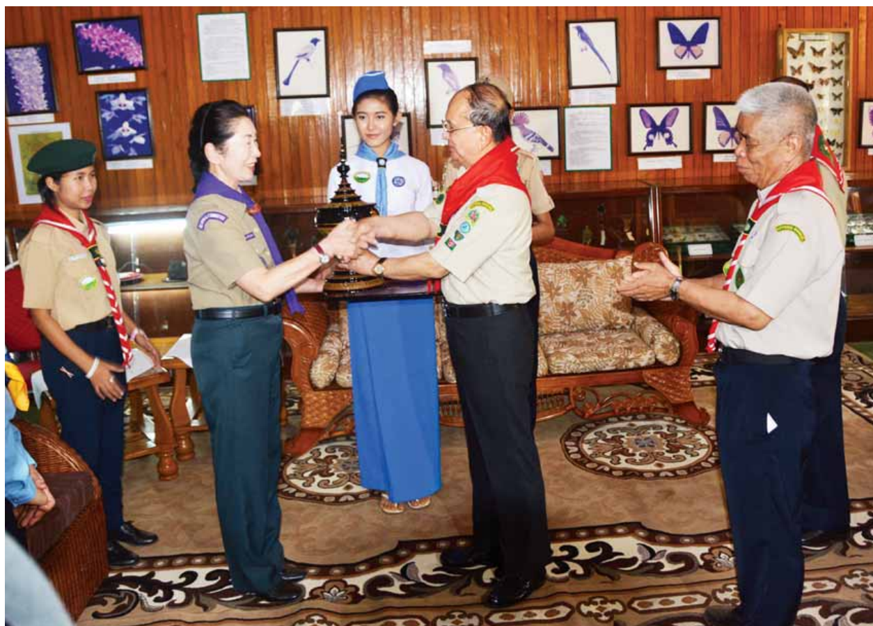
နိုင်ငံတော်သမ္မတ ဦးသိန်းစိန် ကမ္ဘာ့ကင်းထောက်အဖွဲ့ အာရှ-ပစိဖိတ်ဒေသဆိုင်ရာ ကင်းထောက်အဖွဲ့ချုပ် ဒုတိယဥက္ကဋ္ဌအား အမှတ်တရလက်ဆောင်ပစ္စည်းပေးအပ်စဉ်။ (သတင်းစဉ်)