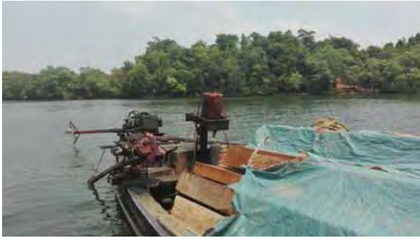
သစ်ပိုင်ရှင်တို့အား ဆက်လက်စုံစမ်းဖော်ထုတ်ကာ သစ်တောဥပဒေအရ အရေးယူဆောင်ရွက်သွားမည်ဖြစ်ကြောင်း သိရသည်။