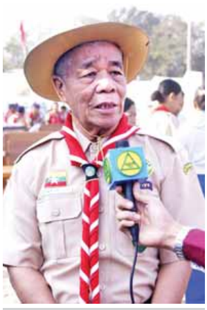
ဒေါက်တာတင်ညို

ဒီနေ့ နိုင်ငံတော်သမ္မတကြီး ဦးသိန်းစိန်နဲ့အဖွဲ့ ကင်းထောက်လူငယ်များနဲ့ လာရောက်တွေ့ဆုံတဲ့အတွက် ဒီပုပ္ပားစခန်းတွေ့ဆုံပွဲတက်ရောက်နေသူ အားလုံးအတွက် ဝမ်းသာဂုဏ်ယူရတဲ့ နေ့ဖြစ်ပါတယ်။ နိုင်ငံတော်သမ္မတကြီးနဲ့ အနီးကပ်တွေ့ဆုံရ၊ စကားပြောရ၊ ဓာတ်ပုံအတူတကွ ရိုက်ကူးခွင့်ရတာက