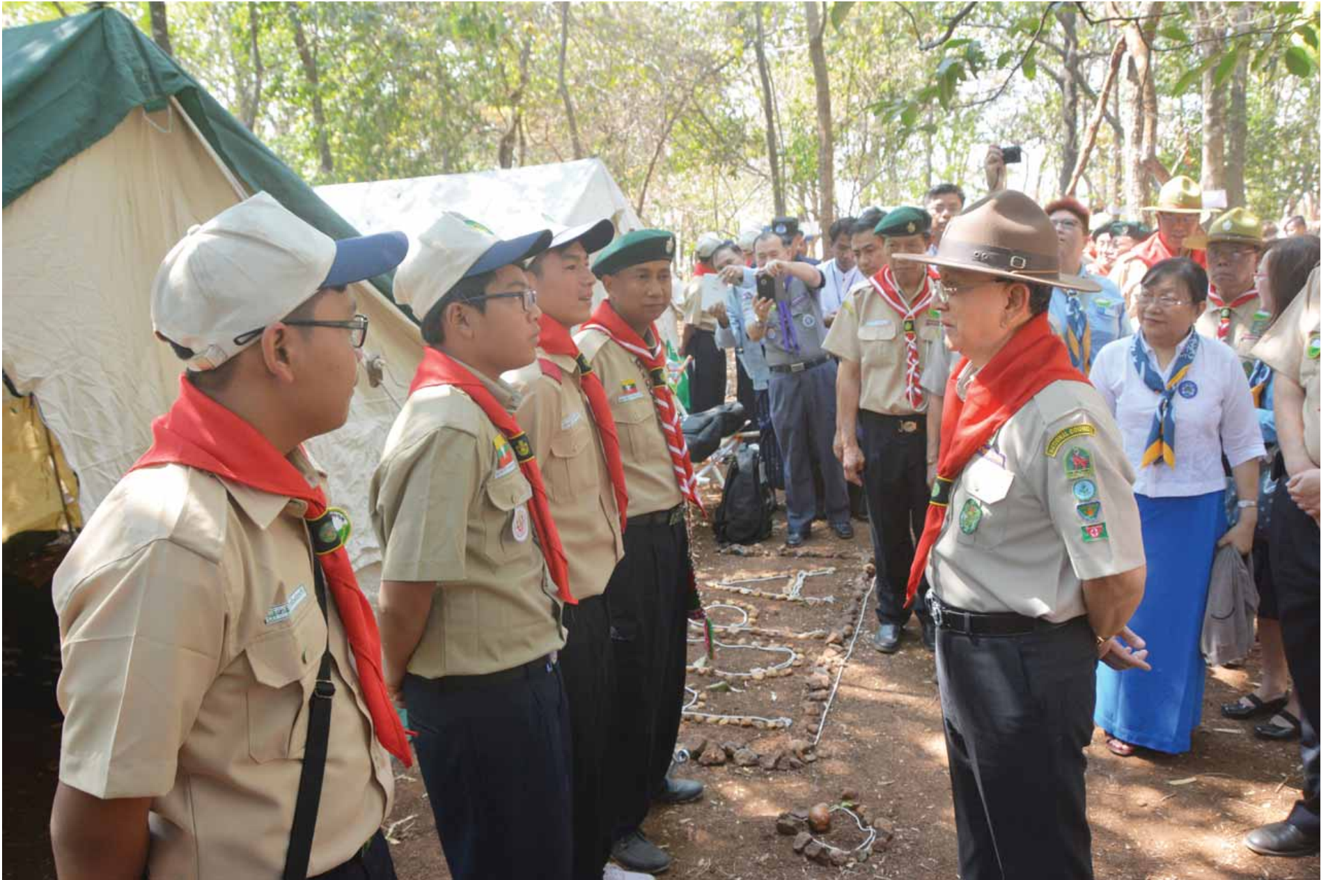
မြန်မာနိုင်ငံ ကင်းထောက်အဖွဲ့၏ ကင်းထောက်ချုပ်ကြီး နိုင်ငံတော်သမ္မတ ဦးသိန်းစိန် ကင်းထောက်လူငယ်များ၏ ကင်းစိတ်အလိုက် စခန်းချစွမ်းဆောင်ထားမှုများကို ကြည့်ရှုအားပေးစဉ်။