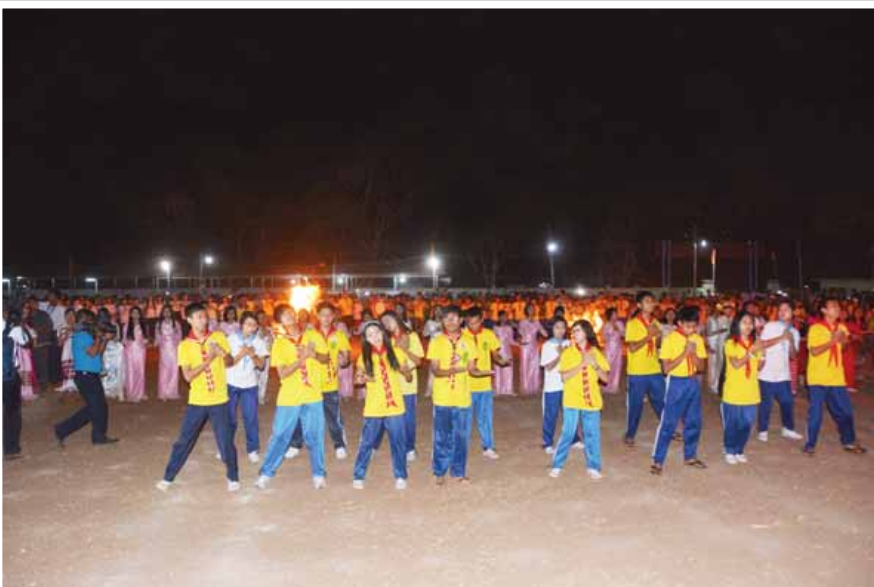
ကင်းထောက်လူငယ်များစခန်းချ တွေ့ဆုံပွဲ အထိမ်းအမှတ် မီးပုံပွဲကို ပုပ္ဖားအခြေခံပညာအထက်တန်းကျောင်း၌ ကျင်းပစဉ်။