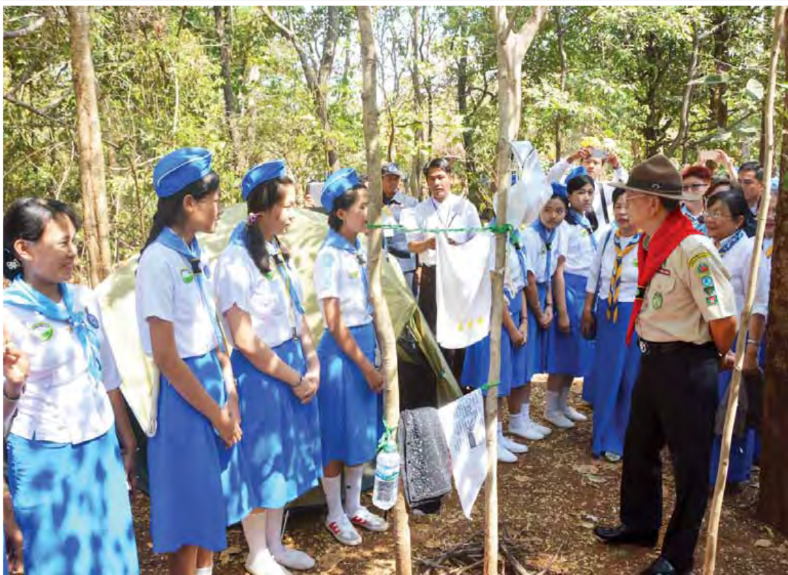
နိုင်ငံတော်သမ္မတ ဦးသိန်းစိန် ပုပ္ဖားကင်းထောက်စခန်း၌ ကင်းထောက်မောင်မယ်များ၏ ကင်းစိတ်အလိုက် စခန်းချစွမ်းဆောင်ထားမှုကို ကြည့်ရှုအားပေးစဉ်။