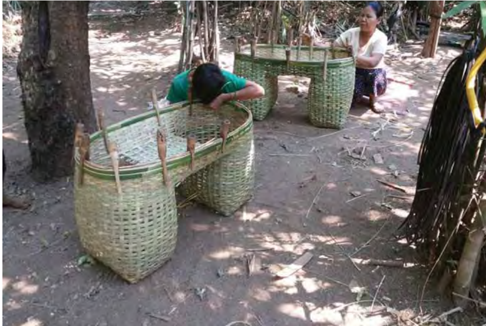
ခြင်းတောင်းများကို ဒေသထွက်ကုန်ရာသီပေါ်သီးနှံများနှင့် တစ်ပိုင်တစ်နိုင်ပစ္စည်းများ တင်ဆောင်ရာတွင်လည်း အထောက်အကူပြုလျက်ရှိရာ ရေးမြို့နယ်ဈေးကွက်အတွင်းတွင် ကျပ် ၁၂၀၀၀ မှကျပ် ၁၅၀၀၀ အထိ ဈေးရရှိကြကြောင်း၊ သိဖြူဇော်၊ မုဒုံနှင့် တနင်္သာရီတိုင်းဒေသကြီး ထားဝယ်မြို့အထိ တင်ပို့ရောင်းချလျက်ရှိကြောင်း သိရသည်။ ထွန်းထွန်း(ရေး)

အဆိုပါကျေးရွာတွင် ဆိုင်ကယ်တင်တွဲဆိုင်းခြင်းတောင်းရက်လုပ်သူမှာ လွန်ခဲ့သော ၁၅ နှစ်ဝန်းကျင်လောက်ကတည်းက စတင်လုပ်ကိုင်ကြပြီး ယနေ့အချိန်အထိ တစ်ပိုင်တစ်နိုင်ရက်သူမှာ ၁၅ ဦးခန့်ရှိနေကြောင်း သိရသည်။