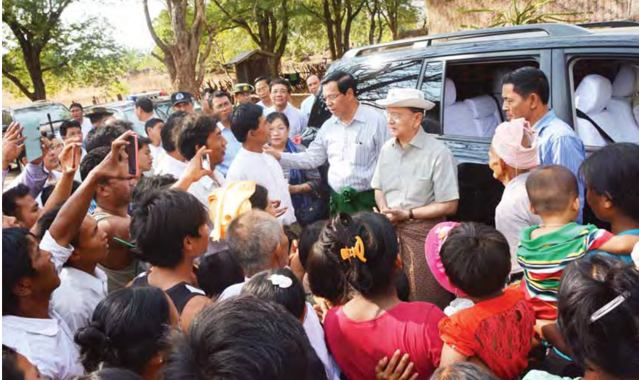
နိုင်ငံတော်သမ္မတ ဦးသိန်းစိန် ပုပ္ပားတောင်ပတ်လမ်းရှိ ဒေသခံပြည်သူများအား ရင်းရင်းနှီးနှီးတွေ့ဆုံစဉ်။ (သတင်းစဉ်)

အဆိုပါ ကင်းထောက်လူငယ်များစခန်းချတွေ့ဆုံပွဲ (ပုပ္ပားစခန်း)တွင် နိုင်ငံတော်ဝန်ရိက္ခာသိုလ်များနှင့် အခြေခံပညာကျောင်းများမှ ကင်းထောက်