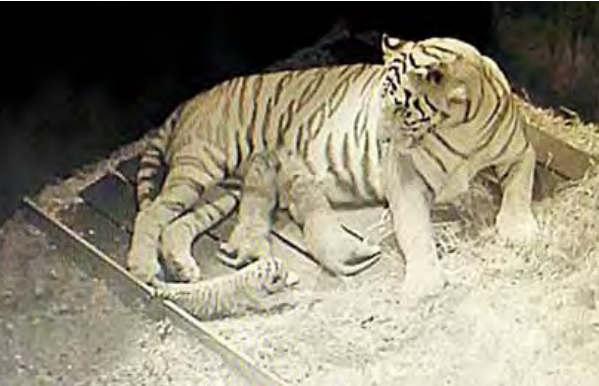
ကျားဖြူအမ(ရီစီ)မှ ကျားဖြူ သုံးကောင်ပေါက်ဖွား

နေပြည်တော် မတ် ၄ မတ် ၄ ရက်မွန်းလွဲ ၁၂ နာရီခွဲအချိန်တွင် ထွာချက်များအရ ရောဝတီမြစ်ရေသည် မြစ်ကြီးနားမြို့၊ ပန်းမော်မြို့နှင့် ကသာမြို့တို့တွင် ရှစ်ရက်မှ ၁၁ ရက်အတွင်း ခုနစ်ပေမှ ၁၁ ပေခန့်၊ မန္တလေးမြို့၊ စစ်ကိုင်းမြို့၊ မြင်းမူမြို့၊ ပခုက္ကူမြို့နှင့် ညောင်ဦးမြို့တို့တွင် နှစ်ရက်မှပိုင်းရက်အတွင်း နှစ်ပေမှ လေးပေခွဲခန့်၊ ချောက်မြို့၊ မင်းဘူးမြို့၊ မကွေးမြို့နှင့်အောင်လံမြို့တို့တွင် တစ်ရက်မှ နှစ်ရက်အတွင်း ပေဝက်မှ တစ်ပေခွဲခန့်ကျဆင်းခဲ့ပြီးဖြစ်ပါသည်။ အဆိုပါမြစ်ရေများသည် ပြည်မြို့၊ ဆိပ်သာမြို့၊ ဟင်္သာတမြို့နှင့် လွန်မြို့တို့တွင် တစ်ရက်မှ လေးရက်အတွင်း နှစ်ပေမှ လေးပေခန့်မြင့်တက်ခဲ့သည်။ ရောဝတီမြစ်အလယ်ပိုင်းတွင် မြင့်တက်ခဲ့သောမြစ်ရေများသည် နောက်တစ်ရက်မှ နောက်နှစ်ရက်အတွင်း ဟင်္သာတမြို့နှင့် လွန်မြို့တို့တွင် တစ်ပေမှ တစ်ပေခွဲခန့်လက်ရှိရေမှတ်များထက် မြင့်တက်လာနိုင်သည်။ သို့ဖြစ်ပါ၍ မြစ်ကြောင်းများအတွင်းသွားလာနေကြသည့် ရေယာဉ်၊ လှေ၊ သင်္ဘောများအနေဖြင့် ဂရုပြုသင့်ပါကြောင်းနှင့် မြစ်ရေနည်းစဉ်သဲသောင်ခံရမှုများတွင် စိုက်ပျိုးရေးထိုင်ကြသူများအနေဖြင့်လည်း မြစ်ရေတိုးလာနိုင်မှုကို ဂရုပြုနေထိုင်သင့်ပါကြောင်း မိုးလေဝသနှင့်ဇလဗေဒဌာနကြားမှ ဦးစီးဌာနက သတင်းထုတ်ပြန်သည်။ (ကြေးမုံ)