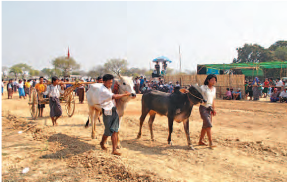
ပြိုင်ပွဲဝင်နွားမောင်းသည့် ရောက်များ ကောင်းမွန်မှသာ အနိုင်ရသောဒုန်း နွားတစ်ကောင် ဖြစ်လာမည်ဖြစ်သည်။ နွားပြိုင်ပွဲများသို့ ပရိသတ်များ စိတ်ဝင်စားစွာ လာရောက်ကြည့်ရှု ကြသလို နွားဝါသနာရှင် တောင်သူ ဦးကြီးများ ညအိပ်လာရောက်ကာ နွားပြိုင်ပွဲကို ပါဝင်ဆင်နွှဲကြကြောင်း သိရသည်။ (တိတ်တမန်)

သားခန့်ကို နွားငယ်စဉ်တွင် ကျွေးပေး ရသည်။ နွားကြီးလာသည်နှင့် ဆန်ကွဲ နို့ဆီဘူးငါးလုံးနှင့် ကောက်ရိုးနပ်နပ် စဉ်းပြီးသား ခြောက်ပြည်ခန့် ကျွေးပေး ရသည်။ ညနေတိုင်းနွားကို လမ်းလျှောက်ပေးရပြီး သုံးရက်ခြား ငါးရက်ခြား နွားလှည်းဖြင့် အပြေး လေ့ကျင့်ပေးရသည်။ လက်ရှိကာလတွင် ခုံးနွားပြိုင်ပွဲဝင် နွားများမှာ ပြိုင်ပွဲကွင်းလမ်း ပေ ၈၀၀ အကွာကို စက္ကန့် ၂၀ ပြင်ပုံချိန်တင် ပြေးနိုင်ကြသည်။ ပြိုင်ပွဲတွင်အနိုင်ရရှိ သော ခုံးနွားတစ်ကောင်ဖြစ်ရေး အတွက် နွားပိုင်ရှင်၏ မွေးမြူမှု ကောင်းခြင်း၊ လေ့ကျင့်မှုကောင်းခြင်း၊