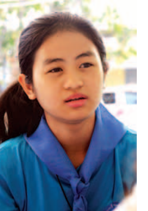
မသီရိရည်မွန်