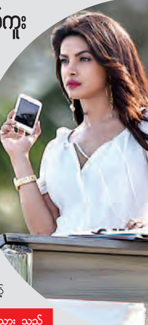
အေး ပြည့် - ရေး သား သည်

ဘောလိဝုဒ်ရဲ့ နာမည်ကျော်တစ်ဦးဖြစ်သူ မင်းသမီး ပရိယန်ကာချော်ပရာဟာ သူ့ရဲ့အနုပညာလှုပ်ရှားမှုတွေကို ဟောလိဝုဒ်အထိ ခြေဆန့်နိုင်ခဲ့ပြီဖြစ်ပါတယ်။ သူဟာ ပြီးခဲ့တဲ့ ဖေဖော်ဝါရီ ၂၈ ရက်ကကျင်းပခဲ့တဲ့ ဟောလိဝုဒ်ရဲ့ သရုပ် ဆောင်ထူးချွန်ဆုပေးပွဲကြီးဖြစ်တဲ့ အော်စကာဆုပေးပွဲကြီးကို တက်ရောက်ခဲ့ရာ သူ့ရဲ့ထူးခြားပြီး ဆွဲဆောင်မှုရှိတဲ့ ဝတ်စုံနဲ့အပြင်အဆင်တွေကြောင့် ဟောလိဝုဒ်မီဒီယာတွေရဲ့ ချီးကျူးခြင်းကို ခံခဲ့ရပါတယ်။