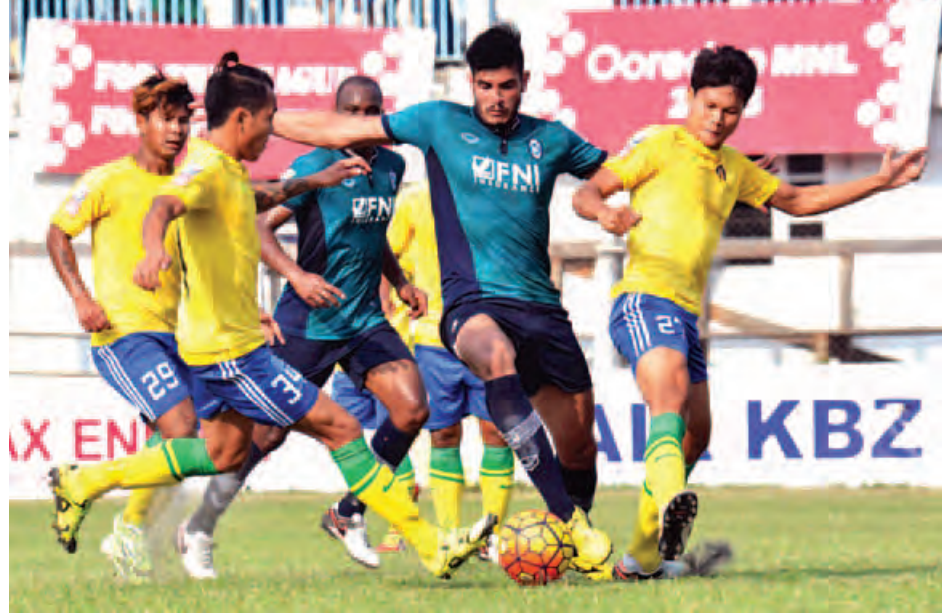
ရန်ကုန်အသင်းနှင့် ဇေယျာရွှေမြေအသင်းယှဉ်ပြိုင်နေစဉ်။

သာပါဝင်ခဲ့ပြီး ပြည်တွင်းကစားသမား များဖြင့် အဓိကပွဲထွက်ခဲ့သည်။ ရန်ကုန် အသင်း ပွဲအစတစ်မိနစ်မှာပင် အဖွင့် ပိုင်းရခဲ့ပြီး ထောင့်ကန်ဘောမှတစ်ဆင့် မာဆယ်လိုက ခေါင်းတိုက်သွင်းခဲ့ခြင်း ဖြစ်သည်။ ရန်ကုန်အသင်းပိုင်းစောစီးစွာ ရခဲ့၍ ပွဲကိုထိန်းချုပ်သွားခဲ့ပြီး ၃၂ မိနစ် တွင် ကျော်ကိုကိုက ပြစ်ဒဏ်ဘောကို စာမျက်နှာ ၈ ကော်လံ ၃ သို့ ၀