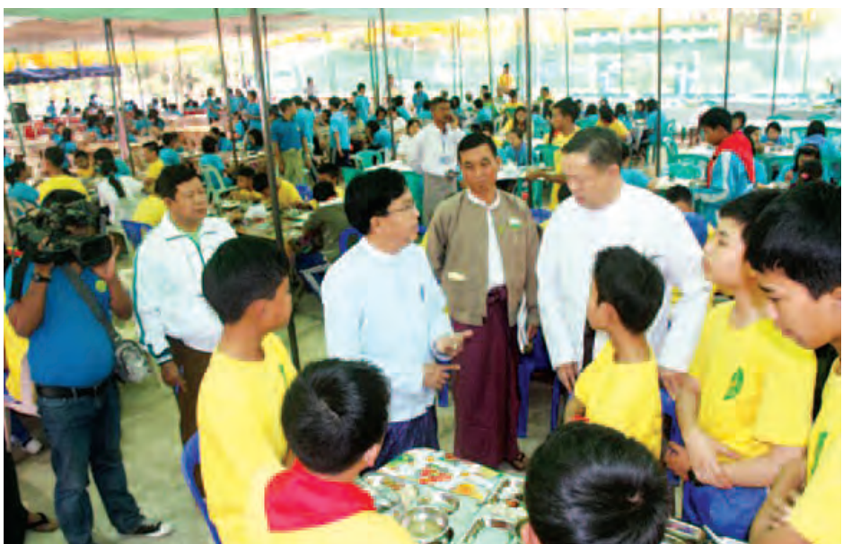
ပညာရေးဝန်ကြီးဌာန ဒုတိယဝန်ကြီး ဒေါက်တာဇော်မင်းအောင် ကင်းထောက်လူငယ်များစခန်းချတွေ့ဆုံပွဲ (ပုပ္ပားစခန်း)မှ ကင်းထောက်လူငယ်မောင်မယ်များအား စားသောက်ဆောင်တွင် တွေ့ဆုံအားပေးစဉ်။ (သတင်းစဉ်)

ထိုသို့လေ့လာရေးခရီးထွက်ခွာရာတွင် အမျိုးသား ကင်းထောက်အဖွဲ့အစည်းအား ၂၇၁ ဦးသည် ပုပ္ပားတောင်မ ကြီးပေါ်ရှိ ထူပါရုံစေတီကို ဖူးမြော်ကြည့်ညိကြပြီး ကင်းထောက်စခန်းချပညာများကို ကင်းထောက်ကြီးများ က သင်ကြားပေးကြသည်။ အလားတူ အမျိုးသမီးကင်းထောက်အဖွဲ့အစည်း ၂၄၉ ဦးသည် ပုပ္ပားတောင်ကလပ်ပေါ်ရှိ စေတီပုထိုးများ ကို ဖူးမြော်ကြပြီးနောက် ကင်းထောက်လုပ်ငန်းများကို လေ့လာသင်ကြားသည်။ ညပိုင်းတွင် ကင်းထောက်လူငယ်မောင်မယ်များသည် တိုင်းရင်းသားစည်းလုံးညီညွတ်ရေးကိုရည်ရွယ်၍ မိမိတို့ နေထိုင်ရာ တိုင်းဒေသကြီး/ပြည်နယ်အသီးသီးမှ ဒေသ ထွက်ကုန်များကို အမှတ်တရလေ့လာကြသည်။ တို့လတ်(သတင်းစဉ်)