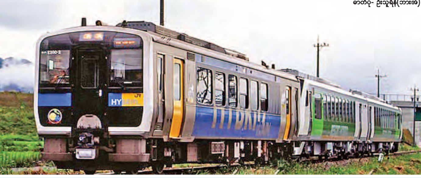
ဂျပန်နိုင်ငံမှ မှာယူတင်သွင်းပြီး မြန်မာ့မီးရထားလမ်းပိုင်းများတွင် ပြေးဆွဲမည့် DEMU ရထားတွဲသစ်များကို တွေ့ရစဉ်။

မှန်ပါတယ်။ ရထားသံလမ်း၊ စက်ခေါင်း၊ တွဲဆိုင်၊ အချက်ပြဆက်သွယ်ရေးကိရိယာစတဲ့ ဝတ္ထုပစ္စည်းအမျိုးမျိုး ပြည့်စုံကောင်းမွန်နေဖို့လိုသလို ကိုင်တွယ်မယ့်၊ ဝန်ဆောင် မယ့် ကျွမ်းကျင်ဝန်ထမ်းများ ပြည့်ပြည့်စုံစုံရှိနေပါမှ "ဂျိုးဂျိုးဂျိုးအော်သံပေး ရထားလေးသည် ခရီးဆက်ကာ