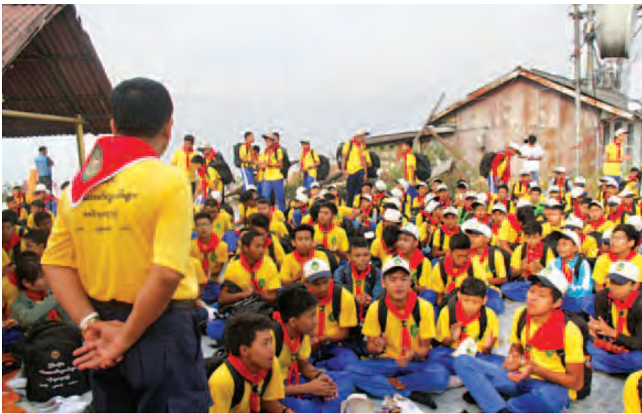
ကင်းထောက်မောင်မယ်များ ပုပ္ပားတောင်မကြီးပေါ်သို့ တက်ရောက်ကာ ကင်းထောက်တို့၏ စိတ်ဓာတ်ကို ပြသခဲ့ကြသည်။

တူညီဝတ်စုံလေးများဖြင့် ငယ်ရွယ် နုပျို ဟန်ပန်ကိုယ်စီရှိသော ကင်းထောက်မောင်မယ်လေးများမှာ အစိမ်းရောင်ဝန်းကျင်တစ်ခုနှင့် လိုက်ဖက်တင့်တယ်လှသည်။ အေး ချမ်းသော ထိုနေရာ ထိုဒေသတွင် စခန်းတစ်ထောက်ချ၍ အပန်းဖြေ လေ့လာဆည်းပူးခြင်းများနှင့်အတူ ကင်းထောက်ကြီးများ၊ သင်တန်း ဆရာများ၊ တာဝန်ရှိသူများ၊ မြန်မာ နိုင်ငံတစ်ဝန်းမှ ကင်းထောက် မောင်မယ်များ အချင်းချင်းတွေ့ဆုံကြ၊ အမြင်ချင်းဖလှယ်ကြ၊ လေ့လာအပန်း ဖြေကြနှင့် ပျော်ရွှင်ဖွယ်ကောင်းသော ဆုံဆည်းမှုဟု ဆိုနိုင်သည်။