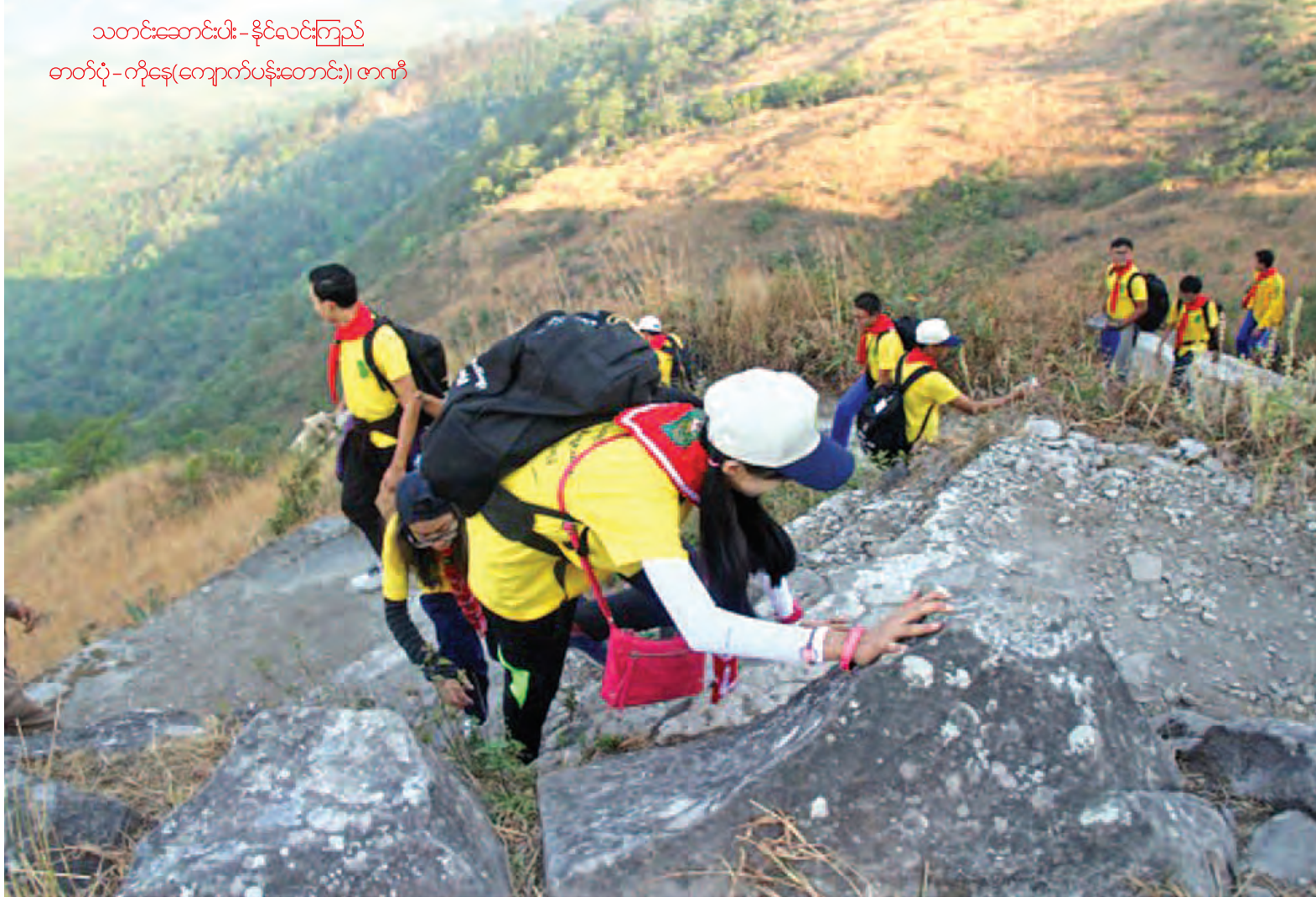
သတင်းဆောင်းပါး - နိုင်လင်းကြည်

မန္တလေး မတ် ၃ မလေးရှားနိုင်ငံက အိမ်ရှင်အဖြစ် လက်ခံကျင်းပမည့် (၂၉)ကြိမ်မြောက် အရှေ့တောင်အာရှအားကစားပြိုင်ပွဲ (ဆီးဂိမ်း)တွင် မြန်မာ့ရိုးရာခြင်းလုံးအားကစားနည်းကို အမျိုးသမီးပွဲစဉ် ပြိုင်ပွဲအပြင် အမျိုးသမီးပွဲစဉ် ပြိုင်ပွဲများပါ ထည့်သွင်းယှဉ်ပြိုင်ခွင့်ရရှိခဲ့ကြောင်း မြန်မာနိုင်ငံခြင်းလုံးအဖွဲ့ချုပ်မှ သိရသည်။ (၂၇)ကြိမ်မြောက် အရှေ့တောင်အာရှ အားကစားပြိုင်ပွဲမှ စတင်၍ မြန်မာ့ရိုးရာခြင်းလုံးအားကစားနည်းကို ထည့်သွင်းယှဉ်ပြိုင်ပွဲခွင့် မြန်မာနိုင်ငံအတွက် ရွှေတံဆိပ်ဆုများကို ရယူပေးနိုင်ခဲ့သည်။ ထို့အပြင် ဖေဖော်ဝါရီလအတွင်း မြန်မာနိုင်ငံ မန္တလေးမြို့တွင် ဒုတိယအကြိမ်မြောက် အာရှဖိတ်ခေါ်ခြင်းလုံးပြိုင်ပွဲကို အောင်မြင်စွာကျင်းပနိုင်မှုအပေါ် ကမ္ဘာ့ပိုက်ကျော်ခြင်းအဖွဲ့ချုပ်နှင့် မလေးရှားပိုက်ကျော်ခြင်းအဖွဲ့ချုပ်တို့မှ ထောက်ခံအသိအမှတ်ပြုမှုကြောင့် အိုလံပစ်ကော်မတီ၏ အစည်းအဝေးကို ဖေဖော်ဝါရီနောက်ဆုံးပတ်က မလေးရှားနိုင်ငံ ကွာလာလမ်ပူမြို့ရှိ Mandarin Oriental ဟိုတယ်၌ ကျင်းပခဲ့ရာ နိုင်ငံတကာ အိုလံပစ်ကော်မတီ၊ အာရှအဖွဲ့ချုပ် အိုလံပစ်ကော်မတီ၊ မလေးရှားနိုင်ငံအိုလံပစ်ကော်မတီ ဥက္ကဋ္ဌ၊ မလေးရှားပိုက်ကျော်ခြင်းအဖွဲ့ချုပ်ဥက္ကဋ္ဌ၊ အာဆီယံနိုင်ငံများမှ စာမျက်နှာ ၉ ကော်လံ ၆ သို့ *