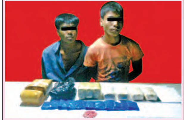
ဟာမီတူရောင်းအာမတ် နှင့် မာမတ်ရော်ဖီးတို့အား သိမ်းဆည်းရမိ မူးယစ်ဆေးဝါးများနှင့်အတူ တွေ့ရစဉ်။