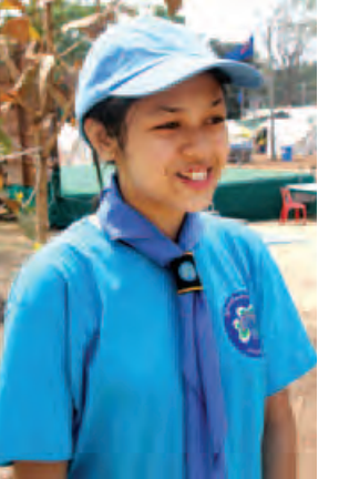
မအိမ့်သက်စု