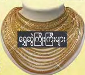
ရွှေဆွဲကြိုးကြီးများ