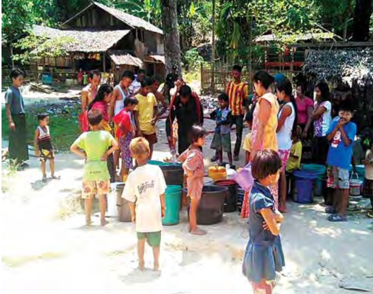
မြိုင်ဦး(မြိတ်)