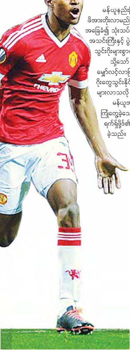
ရွှင်ယန်ဟောဒင်ရေးသားသည်

မန်ယူနည်းပြ ပန်ဟားလ်က ရက်ရှုဖို့ခိုင် ပွဲဦးထွက်ပွဲစဉ်နှစ်ပွဲတွင် ပြသခဲ့သောခြေစွမ်းကြောင့် ဖိအားတိုးလာမည်ဖြစ်ပြီး အနာဂတ်တွင် ခက်ခဲမှုများ ကြုံတွေ့လာနိုင်ကြောင်း သူ၏ အတွေ့အကြုံအပေါ် အခြေခံ၍ သုံးသပ်ခဲ့သည်။ အသက်(၁၈)နှစ်အရွယ် လူငယ်ကစားသမားလေး ရက်ရှုဖို့ခိုင်မှာ မန်ယူပထမ အသင်းကြီးနှင့် ပွဲဦးထွက်စတင်ကစားခွင့်ရခဲ့သည့် ပွဲစဉ်နှစ်ပွဲတွင် လေးဂိုးသွင်းယူနိုင်ခဲ့ပြီးနောက် သူ၏ သွင်းဂိုးများစွာကို မန်ယူပရီသတ်များက ပိုမိုမျှော်လင့်လာကြသည်။