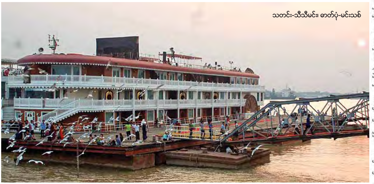
သတင်း-သီသီမင်း၊ ဓာတ်ပုံ-မင်းသစ်

အဆိုပါ အနော်ရထာအမည်ရှိ သင်္ဘောကြီးကို ၂၀၁၄ ခုနှစ်တွင် Heritage Line ကုမ္ပဏီမှ ပီယက်နမ်နိုင်ငံ၌ တည်ဆောက်ခဲ့ပြီး ၂၀၁၅ ခုနှစ် ဇူလိုင်လတွင် မြန်မာနိုင်ငံသို့ရောက်ရှိခဲ့ကြောင်း၊ ပြည်တွင်းရေကြောင်း ပို့ဆောင်ရေးဌာန၏ ခွင့်ပြုချက်ဖြင့် မြန်မာနိုင်ငံ၏ အဓိကမြစ်ကြီးများဖြစ်သော ရောဝတီမြစ်နှင့် စာမျက်နှာ ၉ ကော်လံ ၄ သို့