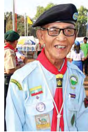
ဦးကျော်။