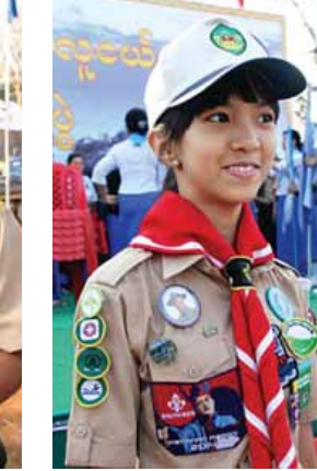
မအေးဘုန်းပြည့်ချို။

၁၉၁၆ ခုနှစ်က စတင်ဖွဲ့စည်းခဲ့တဲ့ မြန်မာနိုင်ငံ ကင်းထောက်အဖွဲ့ဟာ ၂၀၁၆ ခုနှစ်မှာ နှစ်တစ်ရာပြည့်ပြီ ဖြစ်တဲ့အတွက် ရာပြည့်အခမ်းအနား ကျင်းပနိုင်ဖို့ စီစဉ်နေပါတယ်။