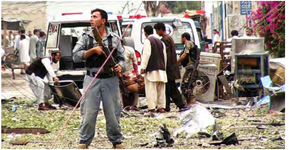
နန်ဂါလာပြည်နယ် အုပ်ချုပ်ရေးမှူး၏ ပြောရေးဆိုခွင့်ရှိသူ သေဆုံးခဲ့ရပြီး ၁၉ဦး ဒဏ်ရာရရှိကြောင်း ၎င်းက ပြောကြားသည်။ ရဲအရာရှိတစ်ဦးနှင့် အရပ်သူအမျိုးသမီးတစ်ဦးတို့ ရိုက်တာ။

မနည်း ပျက်စီးခဲ့ရကြောင်း၊ အခင်းဖြစ်ပွားရာနေရာတွင် ပေါက်ကွဲသံများနှင့် သေနတ်သံများ ပေါ်ထွက်ခဲ့ကြောင်း မျက်မြင်တွေ့ရှိသူများက ပြောကြားကြသည်။ အကြမ်းဖက်တိုက်ခိုက်မှု ဖြစ်ပွားခဲ့ပြီးနောက် လုံခြုံရေးတပ်ဖွဲ့များက နယ်မြေရှင်းလင်းခဲ့ပြီး စစ်သည်တင် သံချပ်ကာကားများကို တွေ့မြင်ရကြောင်း၊ အရပ်သားများ ထွက်ပြေးခဲ့ကြရကြောင်း မျက်မြင်တွေ့ရှိသူများက ပြောကြားကြသည်။ အိန္ဒိယကောင်စစ်ဝန်ရုံး၏ ခြံဝင်းအတွင်းသို့ ဝင်ရောက်နိုင်ရန် အကြမ်းဖက်သမားလေးဦးက ကြိုးပမ်းခဲ့ကြပြီး ၎င်းတို့ကို ပစ်ခတ်ဖမ်းဆီးခဲ့ရာ သေဆုံးခဲ့ကြောင်း ရရှိထားသဖြင့်ဖြစ်သည်။