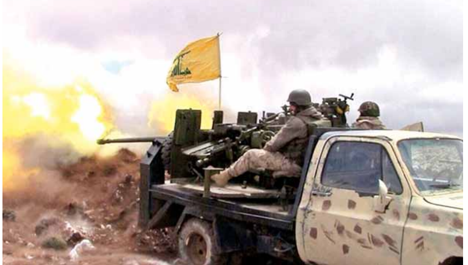
အင်န်အိတ်ချီကော။

ပြည်ထောင်စု၊ ကူဝိတ်၊ ကာတာ၊ ဘာရိန်းနှင့် အိုမန်နိုင်ငံတို့က ဟစ်ဇ်ဘိုလာအဖွဲ့အား အကြမ်းဖက်အဖွဲ့အဖြစ် ကြေညာရန် ဆုံးဖြတ်ချက်ချခဲ့ခြင်း ဖြစ်သည်။ ဆေယက်ဟက်ဆန် နာဘာလာ ခေါင်းဆောင်သည့် ဟစ်ဇ်ဘိုလာအဖွဲ့သည် အကြမ်းဖက်တိုက်ခိုက်မှုများ ပြုလုပ်ခြင်း၊ လက်နက်များနှင့် ဖောက်ခွဲရေးပစ္စည်းများ မှောင်ခိုသယ်ဆောင်ခြင်း၊ နိုင်ငံတော်အား အကြည်ညိုပျက်စေရန် မြှောက်ပင့်ပေးခြင်းနှင့် အကြမ်းဖက်မှုများ ဖြစ်ပေါ်စေရန် လှုံ့ဆော်ခြင်းတို့ပြုလုပ်နေသည်ဟု ဤဂျီစီစီက ပြောကြားသည်။ ပင်လယ်ကွေ့နိုင်ငံများသည် ဆီးရီးယားအုပ်စိုးသူများအား ဟစ်ဇ်ဘိုလာအဖွဲ့ဝင်များက ထောက်ပံ့မှုများ ပြုလုပ်ခြင်းကြောင့် ၂၀၁၃ ခုနှစ်အတွင်း ယင်းအဖွဲ့အပေါ် အရေးယူပိတ်ဆို့မှုများ ပြုလုပ်ခဲ့သည်။