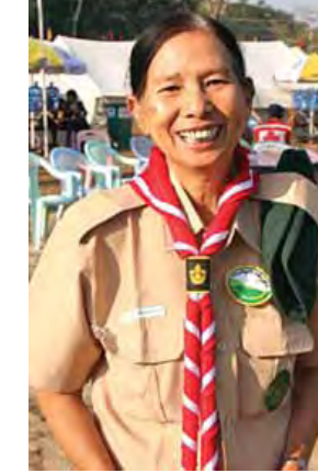
ဒေါ်အိအိအိ။