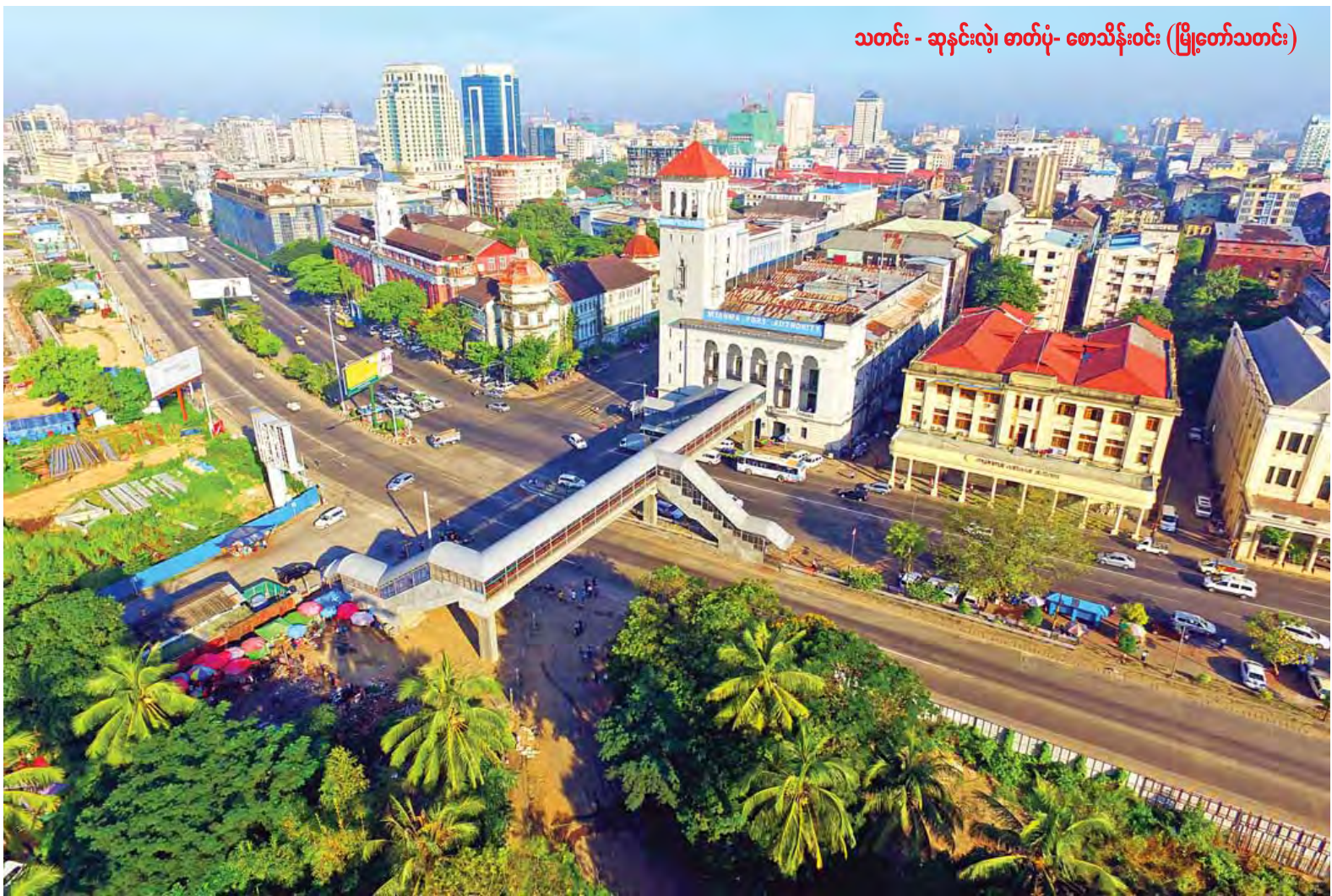
သတင်း - ဆုန်းလုံ၊ ဓာတ်ပုံ - စောသိန်းဝင်း (မြို့တော်သတင်း)

ရွှေတိဂုံစေတီတော်နှင့် ဆူးလေ စေတီတော်ကို ဖူးမြော်လိုပါက သစ်တပ်မြို့ပြင်သို့ထွက်၍ ဖူးရမည် ဖြစ်သည်။ အဆိုပါ ရန်ကုန်မြို့သည် နိုင်ငံခြားသားပေါင်းစုံတို့ ကုန်စည်ကူးသန်းဖွယ်ရာ အဓိက ဆိပ်ကမ်းမြို့ ဖြစ်လာခဲ့လေသည်။ ၁၈၂၄-၁၈၂၆ အင်္ဂလိပ်-မြန်မာပထမ စစ်ပွဲဖြစ်ပွားပြီး ရန်ကုန်သည် အင်္ဂလိပ် လက်အောက်သို့ ကျရောက်ခဲ့သည်။ ၁၈၅၂ ခုနှစ် အင်္ဂလိပ်-မြန်မာ ဒုတိယ စစ်ပွဲအပြီးတွင် အင်္ဂလိပ်လက်အောက် ကျရောက်သွားခဲ့သော ရန်ကုန်ကို အင်္ဂလိပ်တို့က ခေတ်မီမြို့တစ်မြို့ အဖြစ် တည်ဆောက်ခဲ့သည်။ အလောင်းမင်းတရားကြီးတည်ဆောက် ခဲ့သော ရန်ကုန်ကို ခြုံငုံ၍ ဝိုင်းရံရေဇာ က မြို့သစ်တည်၍ ပုံစံရေးဆွဲခဲ့၏။ ၁၈၅၄ ခုနှစ်မှစ၍ ရန်ကုန်မြို့တွက်သစ် ကို ရိုက်ခဲ့သည်။ မြို့တွက်သစ်၏ စာမျက်နှာ ၃ ကော်လံ ၁ သို့