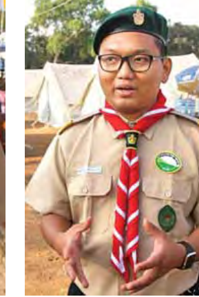
မောင်ကောင်းဆက်ဟိန်း။