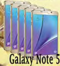
Galaxy Note 5