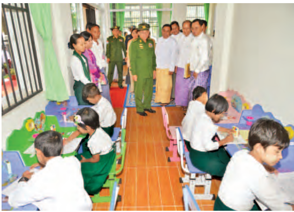
ချုပ်ငြိမ်းရေးအတွက် နိုင်ငံတော်အစိုးရနှင့် တပ်မတော် တို့ ပူးပေါင်းဆောင်ရွက်လျက်ရှိရာ တစ်နိုင်ငံလုံး ပစ်ခတ် တိုက်ခိုက်မှုရပ်စဲရေးစာချုပ် (NCA)အား တိုင်းရင်းသား လက်နက်ကိုင်အဖွဲ့ (၈)ဖွဲ့ဖြင့် လက်မှတ်ရေးထိုးနိုင်ခဲ့ပြီး ပြည်ထောင်စုငြိမ်းချမ်းရေးညီလာခံကျင်းပခြင်း၊ ထာဝရ ငြိမ်းချမ်းရေးဖော်ဆောင်ခြင်းလုပ်ငန်းစဉ်များ ဆက်လက် လုပ်ဆောင်နေကြောင်း၊ တရားဥပဒေစိုးမိုးရေးတွင် စည်းကမ်းလိုက်နာမှုသည် အရေးကြီးသဖြင့် ယင်း၏ အခြေခံဖြစ်သည့် အသိပညာ၊ အတတ်ပညာများအား စာဖတ်ခြင်းမှ ရရှိနိုင်ကြောင်း၊ မိမိဘဝတိုးတက်ရေးကို လည်း အထောက်အကူပြုစေနိုင်ကြောင်း၊ ထားဝယ်ဒေသရှိ လူငယ်လူရွယ်များ၊ ဒေသခံပြည်သူများ အသိပညာ တိုးပွားစေရန် ရွှေဝယ်သီရိပညာဝိမာန် စာကြည့်တိုက်အား ရည်ရွယ်ချက်ကြီးမားစွာဖြင့် ဆောက်လုပ်ခဲ့ခြင်းဖြစ် ကြောင်း၊ တနင်္သာရီတိုင်းဒေသကြီးအတွင်း ဆက်သွယ်ရေး လမ်းများ တစ်နှစ်ထက်တစ်နှစ် တိုးတက်ကောင်းမွန်မှု ရှိလာသည်ကို တွေ့မြင်ရကြောင်း၊ ထို့အတွက် မြို့သန့်ရှင်း သာယာလှပရေးအတွက် အထိုက်အလျောက် အထောက်

ယင်းနောက် တပ်မတော်ကာကွယ်ရေးဦးစီးချုပ်က ယနေ့ခေတ်သည် ပညာခေတ်ဖြစ်သည်နှင့်အညီ ပညာ တတ်ရန်၊ ခေတ်နှင့်အညီလိုက်နိုင်ရန် လိုကြောင်း၊ ပြည်သူ တို့၏ ပကတိလိုအပ်ချက်ဆန္ဒမှာ တည်ငြိမ်အေးချမ်းရေး နှင့် ဖွံ့ဖြိုးတိုးတက်ရေးပင်ဖြစ်ကြောင်း၊ တည်ငြိမ်အေးချမ်း ရေးအတွက် တရားဥပဒေစိုးမိုးရေးနှင့် တိုင်းရင်းသား လက်နက်ကိုင်ပဋိပက္ခများ ချုပ်ငြိမ်းရေးတို့မှာ မရှိမဖြစ် လိုအပ်ကြောင်း၊ တိုင်းရင်းသားလက်နက်ကိုင်ပဋိပက္ခများ