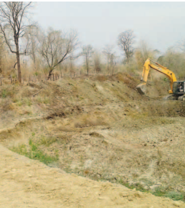
စော်ထက်(သရက်)

ယင်းနောက်မြို့နယ်ကျေးလက်ဒေသဖွံ့ဖြိုးတိုးတက်ရေးဦးစီးဌာန မြို့နယ်ဦးစီးမှူးမြို့နယ်အထောက်အကူပြုကော်မတီ အတွင်းရေးမှူးနှင့် အဖွဲ့ဝင်များ၊ ကျေးရွာအုပ်ချုပ်ရေးမှူးနှင့် ကျေးရွာရပ်မိရပ်ဖများမှ ရေရှည်ရေပြတ်လပ်မှုမရှိစေရေး၊ မကျီးရုံကျေးရွာ မြေသားရေကန် တူးဖော်နေမှုနှင့် သံပုရာကိုင်းကျေးရွာ မြေသားရေကန် တူးဖော်မည့် မြေနေရာတို့အား ဆောင်ရွက်နေမှုတို့ကို ကွင်းဆင်းကြည့်ရှု၍ ဖြည့်ဆည်းဆောင်ရွက်ခဲ့ကြောင်း သိရသည်။