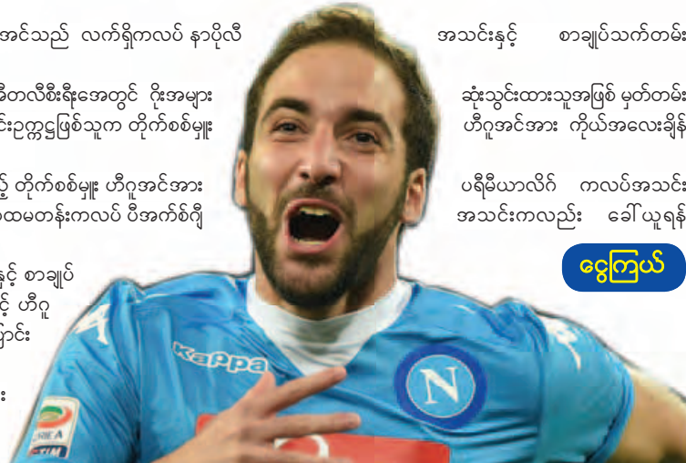
ရှေးကြယ်

အသင်းနှင့် စာချုပ်သက်တမ်း ဆုံးသွင်းထားသူအဖြစ် မှတ်တမ်း ဟီဂူအင်အား ကိုယ်အလေးချိန် ပရီမီယာလိဂ် ကလပ်အသင်း အသင်းကလည်း ခေါ်ယူရန်