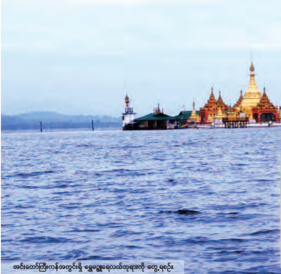
အင်းတော်ကြီးကန်အတွင်းရှိ ရွှေမဂ္ဂရေလယ်ဘုရားကို တွေ့ရစဉ်။