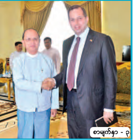
စာမျက်နှာ - ၃

နိုင်ငံတော်သမ္မတ ဦးသိန်းစိန် တာဝန်ပေးဆုံး၍ ပြန်လည် ထွက်ခွာတော့မည့် အမေရိကန်သံအမတ်ကြီးနှင့် အဖွဲ့အား လက်ခံတွေ့ဆုံ