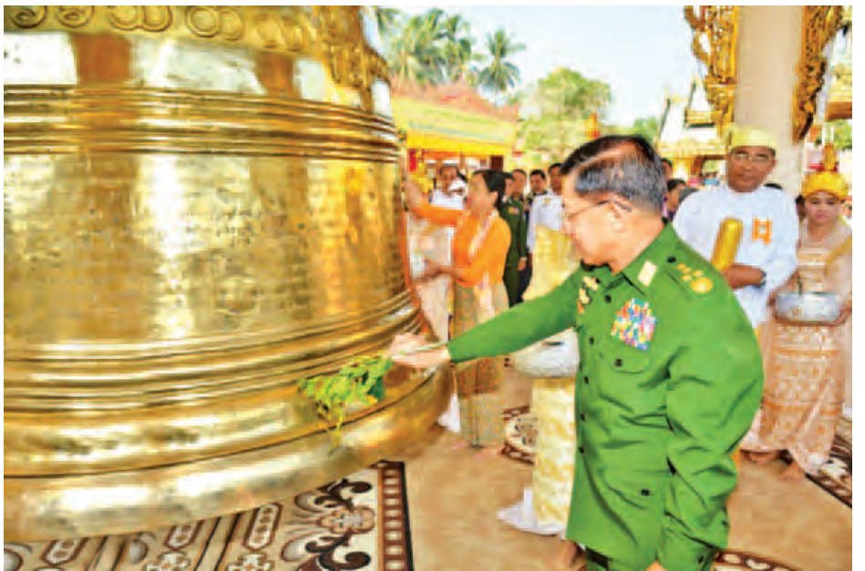
စေတီတော်မြတ်ကြီးရှိ သာယာဝတီမင်း တည်ထားခဲ့သော ခေါင်းလောင်းတော်ကြီးနှင့် အရွယ်တူ၊ ပုံစံတူဖြစ်ပြီး ဒုတိယကမ္ဘာစစ်နောက်ပိုင်း မြန်မာနိုင်ငံတွင် သွန်းလောင်း သည့် ခေါင်းလောင်းတော်များတွင် ဒုတိယအကြီးဆုံး ခေါင်းလောင်းတစ်ခုဖြစ်သည်။ အခမ်းအနားအပြီးတွင် တပ်မတော်ကာကွယ်ရေး ဦးစီးချုပ်နှင့် အဖွဲ့ဝင်များသည် ရွှေတောင်စား

ရွှေတောင်စားစေတီတော် နှစ်(၂၅၀)ပြည့် အထိမ်းအမှတ်မော်ကွန်းအဖြစ် စေတီတော်ကြီးတွင် ထားရှိ ပူဇော်ရန်အတွက် အမြင့် ၁၂ ပေ၊ အချင်း ၅ ပေ ၇ လက်မရှိပြီး ကြေးပိဿာချိန် ၁၁၇၇၇ ဒဿမ ၄ ရှိသော မဟာဝိဇယ ခေမသီတလ နိဗ္ဗုတ ယောသ မဟာ ခေါင်းလောင်းတော်ကြီးကို တပ်မတော်(ကြည်း၊ ရေ၊ လေ) မိသားစုများနှင့် စေတနာရှင်အလှူရှင်များ၏ လှူဒါန်းမှု များမှရရှိသည့် ကြေးစင်များဖြင့် ၂၀၁၅ ခုနှစ် မတ် ၂၀ ရက်တွင် မန္တလေးမြို့ တမ္ပဝတီရပ်၌ စတင်သွန်းလောင်း ခဲ့ပြီး ဇွန် ၄ ရက်တွင် ရွှေတောင်စားစေတီတော်၏ ရင်ပြင်တော် အရှေ့တောင်ထောင့်အရပ်တွင် ရေစက်ချ လှူဒါန်းပူဇော်ခဲ့ခြင်းဖြစ်သည်။ ရွှေတောင်စားစေတီတော် တွင် တည်ထားသည့် မဟာဝိဇယ ခေမသီတလ နိဗ္ဗုတ ယောသ မဟာခေါင်းလောင်းတော်ကြီးသည် ရွှေတိဂုံ