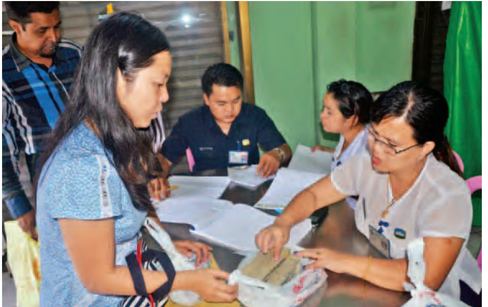
နိုင်ငံတော်အစိုးရကပေးအပ်သည့်ထောက်ပံ့ငွေကို မတ် ၁ ရက်ညနေက ဈေးသူ ဈေးသားများ လာရောက်ထုတ်ယူနေသည်ကိုတွေ့ရစဉ်။

ထို့အပြင် ရန်ကုန်မြို့တော်စည်ပင်သာယာရေးကော်မတီအနေဖြင့် ဖေဖော်ဝါရီလအတွင်းက စည်ပင်ဘက်မှ ငွေကျပ် တစ်ဘီလီယံကို မီးဘေးသင့် ဈေးသူဈေးသားများအား ချေးငွေချပေးခဲ့ရာ ချေးငွေထုတ်ယူသူ ၃၂၂ ဦး ရှိခဲ့ပြီး တစ်ဦးလျှင် ငွေကျပ် ၃၀ သိန်းကျော် ရရှိခဲ့ကြောင်းသိရသည်။