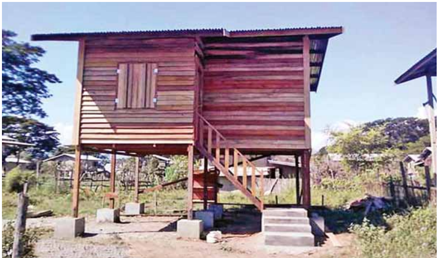
ပြင်သာကျေးရွာ၌ တည်ဆောက်ထားသော အိမ်အမှတ်(၇)ကို ၁၂-၁၁-၂၀၁၅ ရက်က တွေ့ရစဉ်။