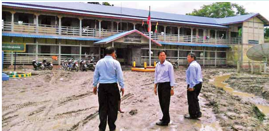
အထက(၁)ကလေး ကျောင်းဝင်းအတွင်း ကျောင်းရှေ့တွင်းပြင်တွင် ကွန်ကရစ်ခင်းခြင်းလုပ်ငန်း မဆောင်ရွက်မီ ၂၀-၈-၂၀၁၅ ရက်က တွေ့ရစဉ်။