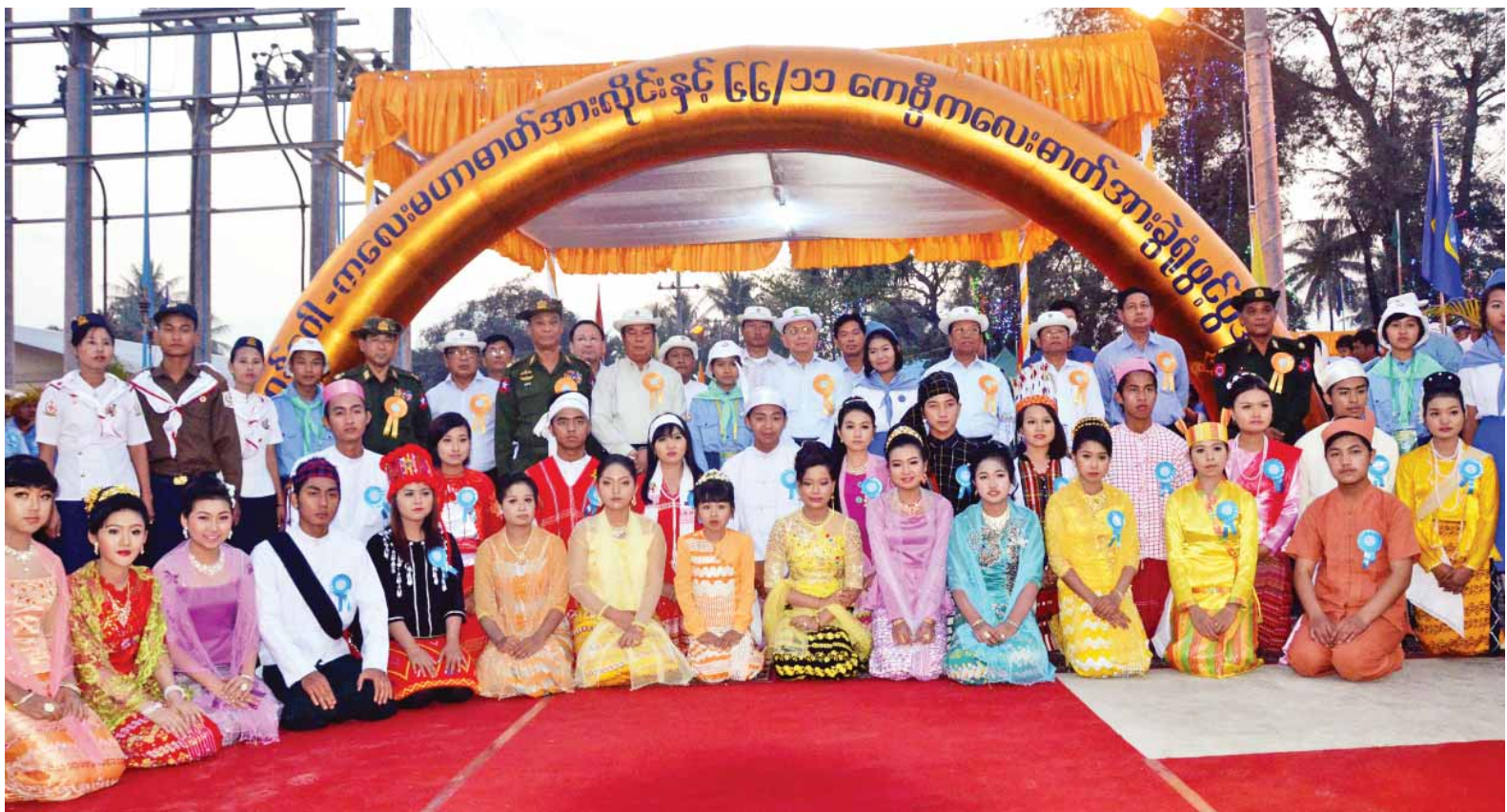
နိုင်ငံတော်သမ္မတ ဦးသိန်းစိန် ၂၃၀ကေပီဂန့်ဂေါ-ကလေးမဟာဓာတ်အားလိုင်းနှင့် ၆၆/၁၁ကေပီကလေးဓာတ်အားခွဲရုံဖွင့်ပွဲအခမ်းအနားသို့တက်ရောက်လာကြသူများနှင့်အတူ စုပေါင်း မှတ်တမ်းတင်ဓာတ်ပုံရိုက်စဉ်။ (သတင်းစဉ်)

၁၉၄၈ ခုနှစ် နောက်ပိုင်းတွင် နိုင်ငံတော် မဟာဓာတ်အားလိုင်းမှ လျှပ်စစ်ဓာတ်အားကို ကလေးဒေသ သို့ ပထမဦးဆုံး ဖြန့်ဖြူးပေးနိုင်ခြင်း ဖြစ်ပြီး စတင်အသုံးပြုနိုင်ခြင်းဖြစ်ရာ ကလေးဒေသရှိ ဒေသခံပြည်သူတို့၏ လူမှုစီးပွားဘဝမှာ ပိုမိုဖွံ့ဖြိုးတိုးတက် လာတော့မည်ဖြစ်သည်။ (သတင်းစဉ်)