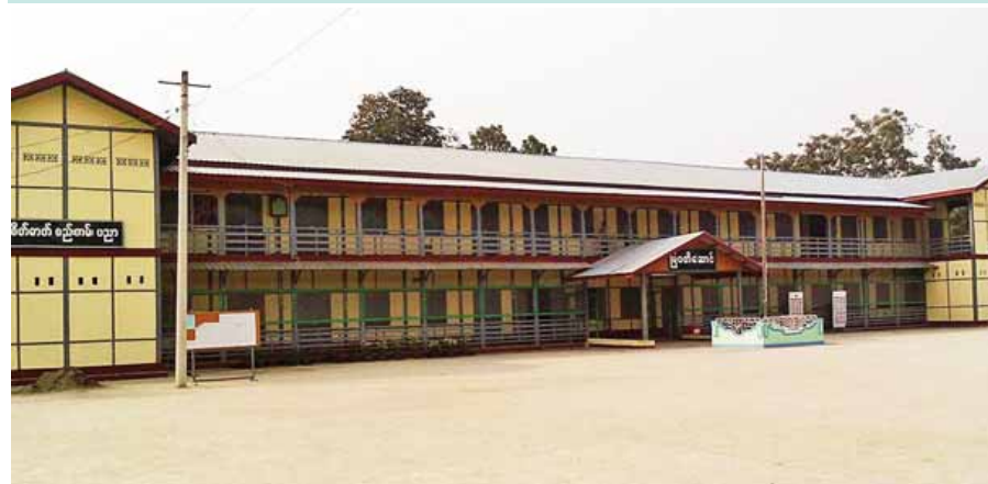
အထက(၁)ကလေး ကျောင်းဝင်းအတွင်း ကျောင်းရှေ့တွင်းပြင်တွင် ကွန်ကရစ်ခင်းခြင်းလုပ်ငန်း ဆောင်ရွက်ပြီး ၂၄-၁၁-၂၀၁၅ ရက်က တွေ့ရစဉ်။