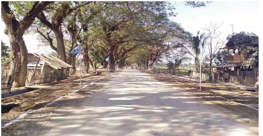
ကလေး-ပြင်သာ ကွန်ကရစ်လမ်းခင်းပြီး ၂၅-၁၂-၂၀၁၅ ရက်က တွေ့ရစဉ်။