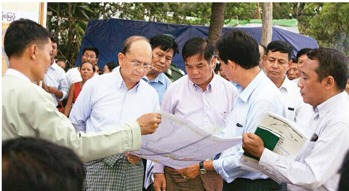
နိုင်ငံတော်သမ္မတ ဦးသိန်းစိန် ပြင်သာကျေးရွာ ထူထောင်ရေးအတွက် ၂၂-၉-၂၀၁၅ ရက်က လမ်းညွှန်မှာကြားနေစဉ်။