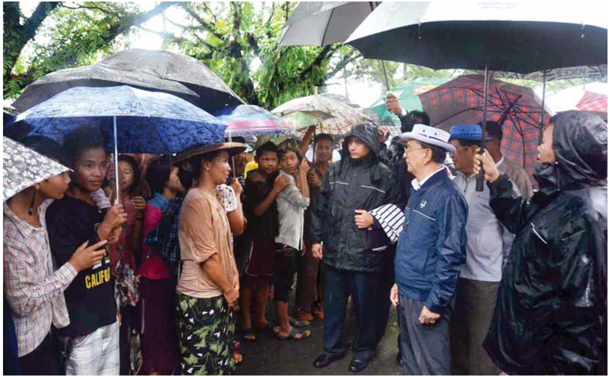
နိုင်ငံတော်သမ္မတ ဦးသိန်းစိန် တမူးခရိုင်အတွင်းရှိ ရေဘေးသင့်ပြည်သူများအား ၂၂-၈-၂၀၁၅ ရက်က နှုတ်ဆက်အားပေးစဉ်။