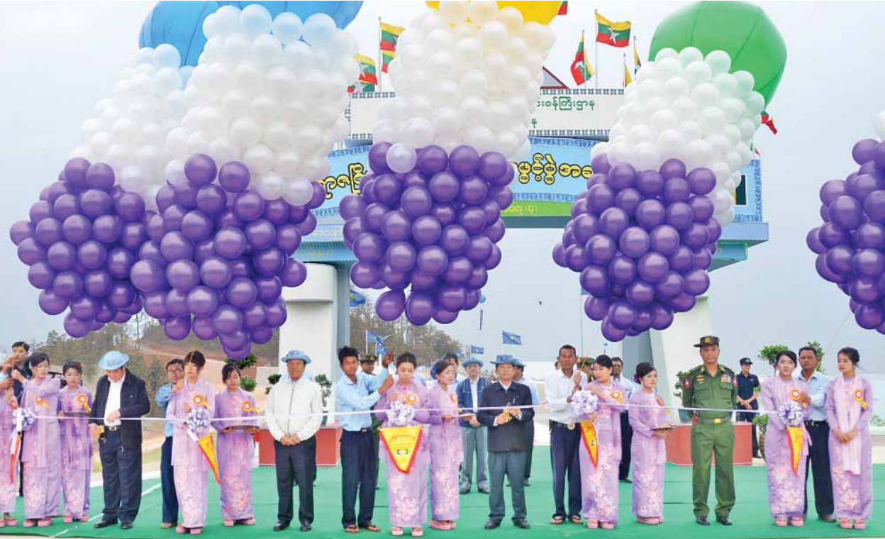
ပြည်ထောင်စုဝန်ကြီး ဒုတိယဗိုလ်ချုပ်ကြီးကျော်ဆွေ ဦးမြင့်လှိုင်၊ ဦးခင်မောင်စိုးနှင့် တိုင်းဒေသကြီးဝန်ကြီးချုပ် ဦးသာအေးတို့က ရာဇဂြိုဟ်ရေလှောင်တံခွင့်ပွဲမှခွင့်အား ဖဲကြိုးဖြတ်ဖွင့်လှစ်ပေးစဉ်။ (သတင်းစဉ်)

လိုအပ်ချက် ဖြည့်ဆည်းပေးနိုင်ရန်၊ ဒေသ၏ ကျန်းမာရေးစောင့်ရှောက်မှု အဆင့်အတန်းကို မြှင့်တင်နိုင်ရန်နှင့် ဒေသခံများ ပညာဆည်းပူးနိုင်မည့် အခွင့်အလမ်းနှင့် အလုပ်အကိုင် အခွင့်အလမ်းများ ပိုမိုရရှိနိုင်ရန် စသည့် ရည်ရွယ်ချက်များဖြင့် ၂၀၁၄-၂၀၁၅ ဘဏ္ဍာရေးနှစ် ခွင့်ပြုရန်ပုံငွေ ၂၉၈၄ ဒသမ ၃၃၀ သန်း အကုန်အကျခံကာ အကောင်အထည်ဖော်ဆောင်ရွက်ခြင်း ဖြစ်ကြောင်း သိရသည်။ (သတင်းစဉ်)