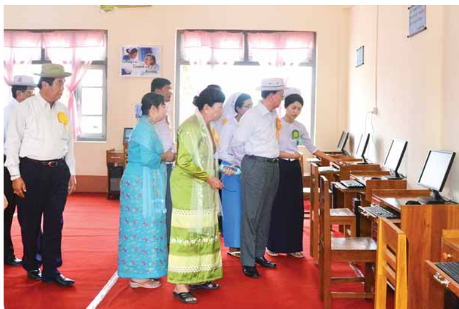
နိုင်ငံတော်သမ္မတ ဦးသိန်းစိန် သူနာပြုနှင့် သားဖွားသင်တန်းကျောင်းတွင် ကြည့်ရှုစစ်ဆေးစဉ်။ (သတင်းစဉ်)