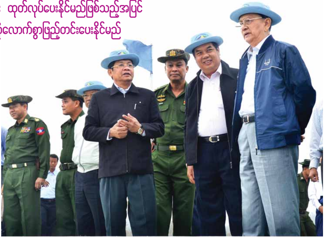
နိုင်ငံတော်သမ္မတ ဦးသိန်းစိန် ရာဇဂြိုဟ် ရေလှောင်တံစီမံ ကြည့်ရှုစစ်ဆေးစဉ်။ (သတင်းစဉ်)