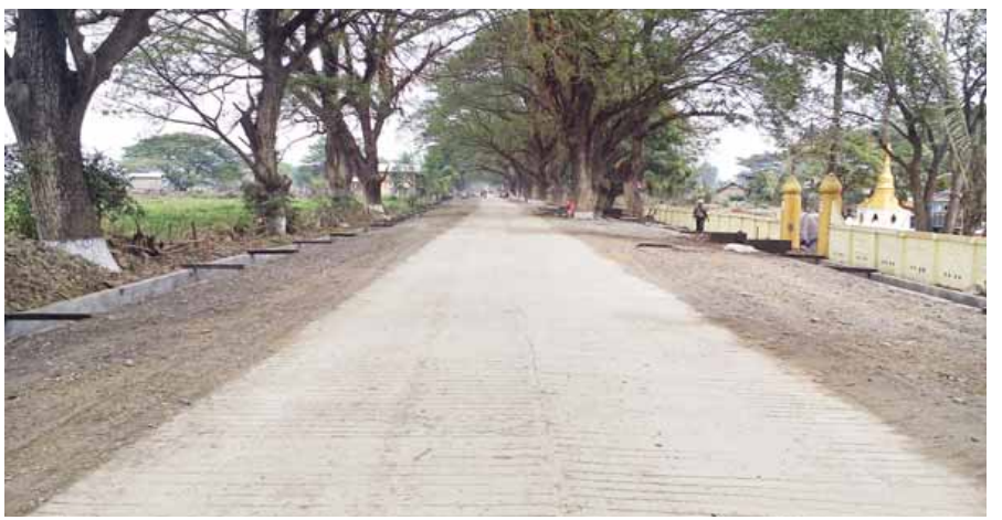
ကလေး-ပြင်သာ ကွန်ကရစ်လမ်းခင်းပြီး ၂၁-၁-၂၀၁၆ ရက်က တွေ့ရစဉ်။