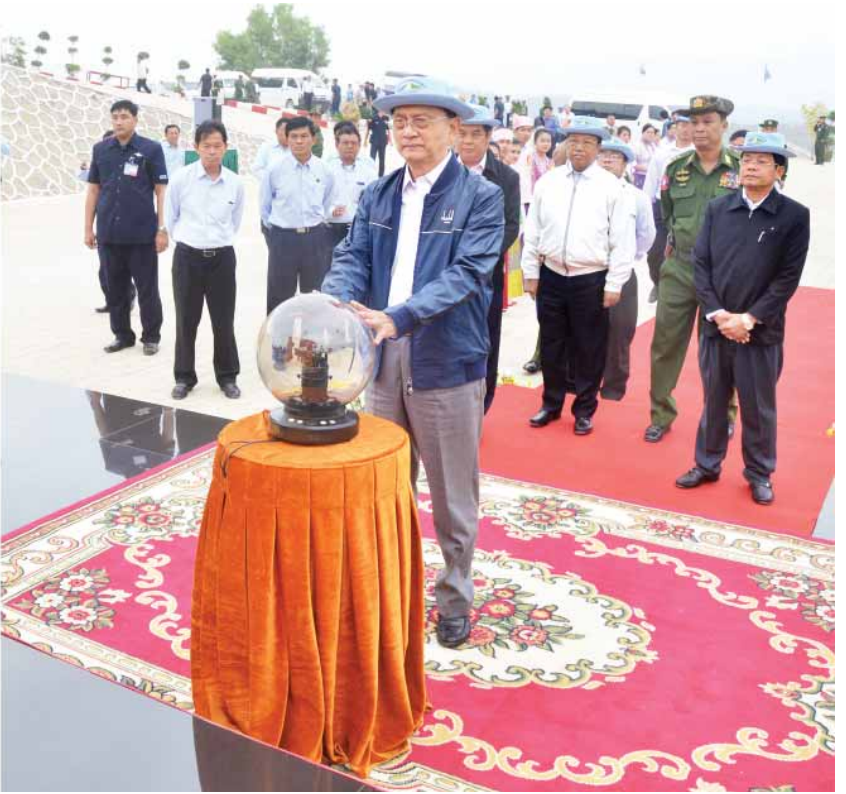
နိုင်ငံတော်သမ္မတ ဦးသိန်းစိန် ရာဇဂြိုဟ်ရေလျှောင်တံ မွှေးနှံ့ရာတွင် စက်ခလုတ်နှိပ်ဖွင့်လှစ်ပေးစဉ်။ (သတင်းစဉ်)