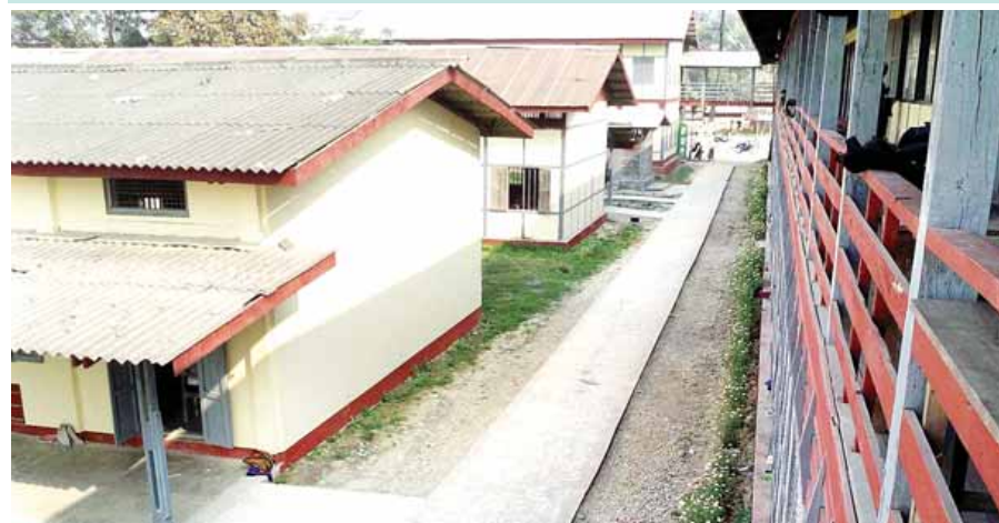
အထက(၁) ကလေး ကျောင်းဆောင်များအကြား ကွန်ကရစ်မခင်းအပြီး ၃၁-၁-၂၀၁၆ ရက်က တွေ့ရစဉ်။ (သတင်းစဉ်)