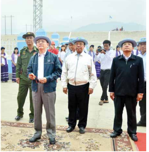
နိုင်ငံတော်သမ္မတ ဦးသိန်းစိန် ရာဇဂြိုဟ်ရေအားလျှပ်စစ်ဓာတ်အားပေးစက်ရုံဆိုင်းဘုတ်ကို စက်ခလုတ်နှိပ်ဖွင့်လှစ်ပေးစဉ်။