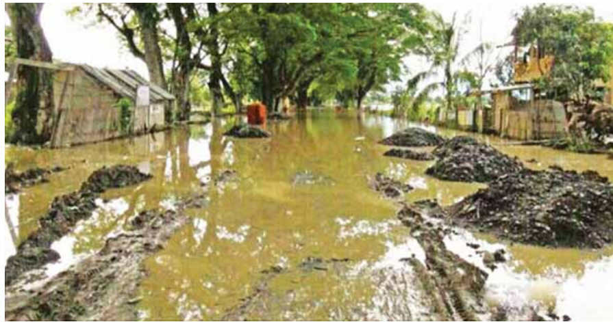
ကလေး-ပြင်သာ ကွန်ကရစ်လမ်းမခင်းမီ ၉-၁၀-၂၀၁၅ ရက်က တွေ့ရစဉ်။