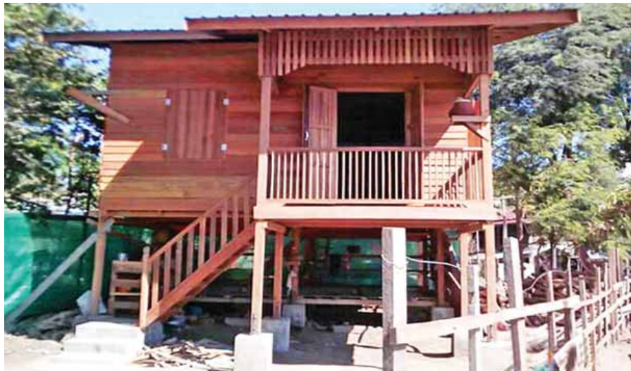
ပြင်သာကျေးရွာ၌ တည်ဆောက်ထားသော အိမ်အမှတ်(၂)ကို ၁၂-၁၁-၂၀၁၅ ရက်က တွေ့ရစဉ်။ (သတင်းစဉ်)