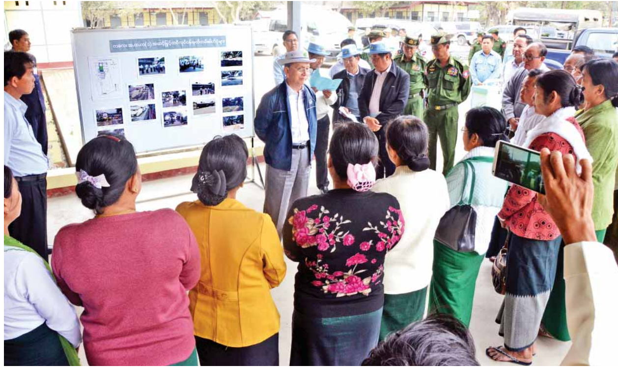
နိုင်ငံတော်သမ္မတ ဦးသိန်းစိန် ကလေးမြို့ အမှတ်(၁)အခြေခံပညာအထက်တန်းကျောင်း၌ ဆရာ ဆရာမများနှင့် ရင်းရင်းနှီးနှီးတွေ့ဆုံစဉ်။ (သတင်းစဉ်)

သီးညှပ်စိုက်ပျိုးစွမ်းအားများ တိုးတက်လာစေနိုင်မည် ဖြစ်သည့်အတွက် မိသားစုတစ်စုချင်းစီ၏ ဝင်ငွေနှင့် လူမှုစီးပွားဘဝများ ကြီးစားကြလျှင် ကြီးစားသလောက် တိုးတက်ရရှိတော့မည်မှာ မလွဲကွန်ဖြစ်ပါကြောင်း။ နိုင်ငံတော်အစိုးရအနေဖြင့် နိုင်ငံသားအားလုံးတို့၏ ရေရှည် “အမျိုးသားရေးအကျိုးစီးပွား အခြေခံလိုအပ်ချက်”အတွက် ရင်းနှီးမြုပ်နှံတည်ဆောက်အကောင်အထည်ဖော်ပေးနိုင်ခဲ့သော နိုင်ငံတော်၏ကျေးဇူးတရားတို့ကို တုံ့ပြန်သောအားဖြင့် မိမိတို့နေထိုင်မိမိအားထားကြရာ နယ်မြေဒေသအသီးသီး တိုးတက်ရေးအတွက်လည်းကောင်း၊ နိုင်ငံနှင့်အဝန်းပြည်နယ်နှင့် တိုင်းဒေသကြီးအလိုက် ဟန်ချက်ညီ ဖွံ့ဖြိုးတိုးတက်လာရေးအတွက်လည်းကောင်း၊ အပြန်အလှန် ရိုင်းပင်းကူညီကြပြီး တစ်လှူတည်းစီး တစ်ခရီးတည်းသွား ပြည်ထောင်စုစိတ်ဓာတ်ဖြင့် စည်းစည်းလုံးလုံး ညီညီညွတ်ညွတ်၊ ခိုင်ခိုင်မြဲမြဲ အတူလက်တွဲကြလျက် နိုင်ငံသားအားလုံး ကျရာအခန်းကဏ္ဍမှ ဦးထမ်းပဲ့ထမ်း ကြိုးပမ်းပါဝင်တည်ဆောက်