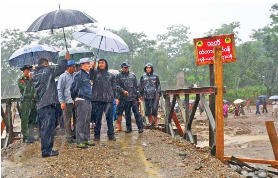
နိုင်ငံတော်သမ္မတ ဦးသိန်းစိန် ကလေးဒေသသို့ရောက်ရှိစဉ် ကလေး-တမူး လမ်းတံတားများကို ၂၂-၈-၂၀၁၅ ရက်က ကြည့်ရှုစစ်ဆေးစဉ်။