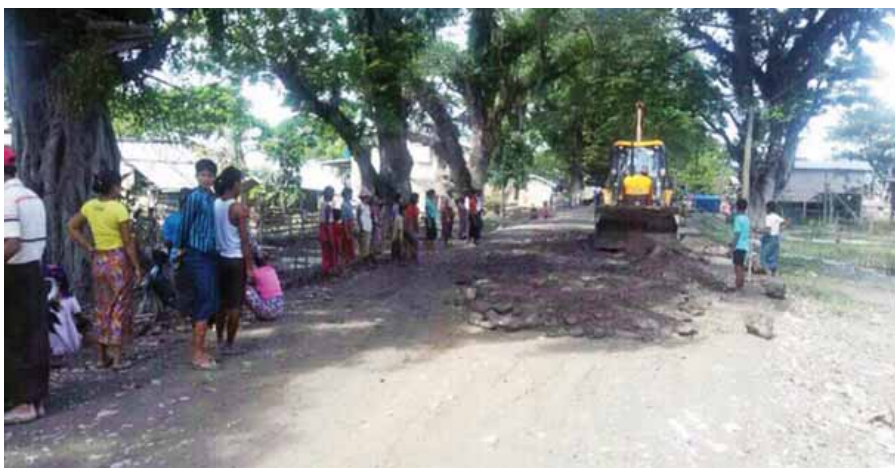
ကလေး-ပြင်သာ ကွန်ကရစ်လမ်းခင်းကျင်းရန် ၁၈-၉-၂၀၁၅ ရက်က ဆောင်ရွက်နေစဉ်။