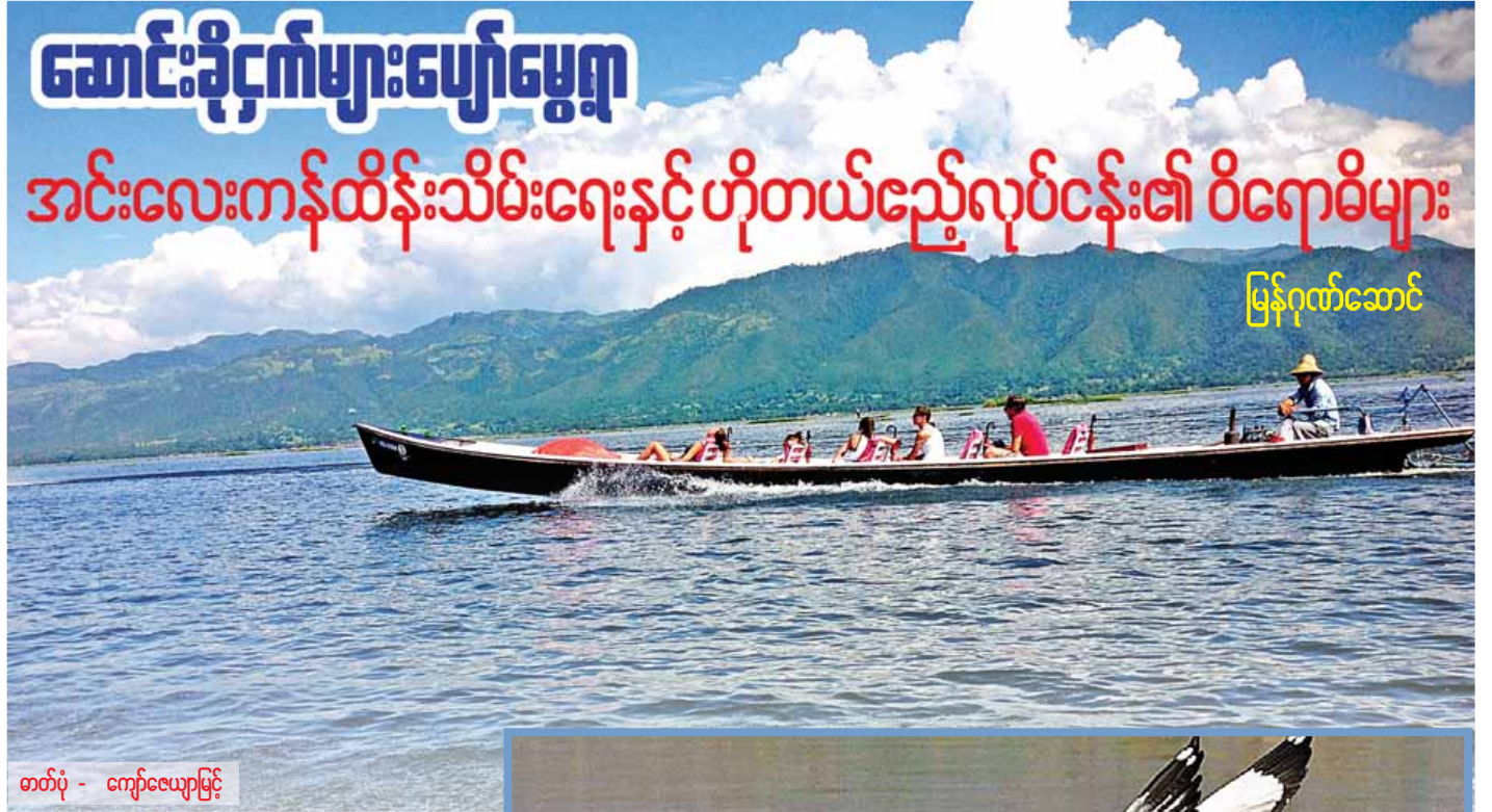
တစ်ပုံ - ကျော်လှေပြင်