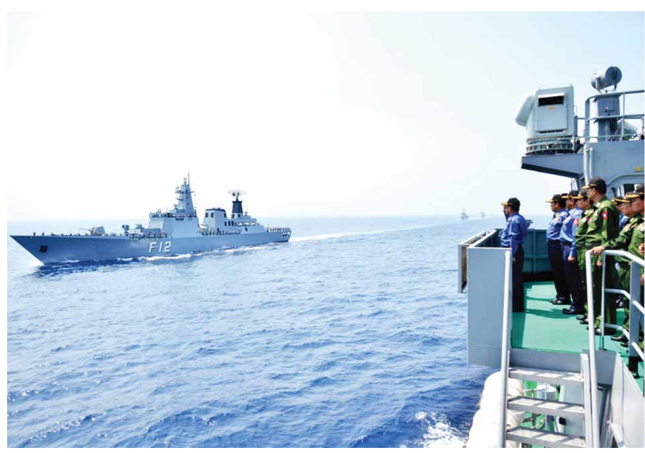
တပ်မတော်ကာကွယ်ရေးဦးစီးချုပ် ဗိုလ်ချုပ်မှူးကြီးမင်းအောင်လှိုင်အား လေ့ကျင့်ခန်းတွင်ပါဝင်ခဲ့ကြသည့် စစ်ရေယာဉ်များက Fleet Review ဖြင့် ချီတက်အလေးပြုကြစဉ်။ (သတင်းစဉ်)

တာဝန်ရေတပ်မမှူးက လေ့ကျင့်ခန်း နှင့်ပတ်သက်၍ ဖြစ်စဉ်အကြောင်း အရာကို ရှင်းလင်းတင်ပြ၍ တိုက်စစ် နှုတ်မိန့်ပေးသည်။ ယင်းနောက် တာဝန်ရေတပ်မမှူး နှင့် စစ်ရေယာဉ်မှူးများသည် သက် ဆိုင်ရာ စစ်ရေယာဉ်များသို့ ပြန်လည် ထွက်ခွာပြီး စစ်ရေယာဉ်တပ်ပေါင်းစု ပင်လယ်ပြင် စစ်ဆင်မှုလေ့ကျင့်ခန်းကို အစီအစဉ်အတိုင်း လုပ်ဆောင်ကြ သည်။ ဦးစွာ တပ်မတော်(ရေ) အထူး စစ်ဆင်ရေးတပ်ဖွဲ့(NAVY SEALs) က ချေမှုန်းရေးစက်တပ် ရော်ဘာလေ့ လေးစင်း၊ ရဟတ်ယာဉ် နှစ်စင်းတို့ဖြင့် ရန်သူရေယာဉ် တစ်စင်းအားဝင်ရောက် စီးနင်း၍ ဖမ်းဆီးခံ ဓားစာခံနှစ်ဦးကို ကယ်ဆယ်ခြင်း၊ ရန်သူစစ်ရေယာဉ်ကို ဖောက်ခွဲနှစ်မြုပ်ခြင်းတို့ကို သရုပ်ပြ ဆောင်ရွက်ကြသည်။ ယင်းနောက် ရန်သူပစ်ခတ်မှု ကြောင့် မီးလောင်နေသော ကုန်သွယ် ရေယာဉ်တစ်စင်းကို ဘက်စုံသုံးတွဲဆွဲ စစ်ရေယာဉ် နှစ်စင်းဖြင့် ပင်လယ်ပြင် မီးငြိမ်းသတ်ခြင်း လေ့ကျင့်ခန်းကို ဆောင်ရွက်သည်။ လေ့ကျင့်ခန်းများ အပြီးတွင် လေ့ကျင့်ခန်း၌ပါဝင်ကြသော ရဟတ် ယာဉ်နှင့် တပ်မတော်(ရေ) အထူး စစ်ဆင်ရေး တပ်ဖွဲ့ဝင်များက တပ်မတော်ကာကွယ်ရေးဦးစီးချုပ်ကို ချီတက်အလေးပြုကြသည်။ ထို့နောက် လေ့ကျင့်ခန်းအစီအစဉ် အရ စစ်ရေယာဉ်များသည် သတ်မှတ် ပုံပြု Formation 5 ပုံစံဖြင့် မောင်း နှင်ချီတက်ကြသည်။ ချီတက်စဉ် Circular Formation ပုံစံပြောင်းလဲ ချီတက်ပြီး ရေအောက်ရန်ကာကွယ် ရေး စစ်ဆင်မှုလေ့ကျင့်ခန်းကို လည်း ကောင်း၊ Diamond Formation ပုံစံပြောင်းလဲ၍ ရန်သူလေယာဉ်များ အား လေကြောင်းရန်ကာကွယ်ရေး လက်နက်များဖြင့် လက်တွေ့လေ့ကျင့် ပြီး Arrow Head Formation ပုံစံ သို့ပြောင်းလဲ၍ အီလက်ထရွန်နစ် စစ်ဆင်မှုလေ့ကျင့်ခန်းနှင့် လေကြောင်း ရန်ကာကွယ်ရေး လက်နက်များ ပစ်ခတ်မှု လေ့ကျင့် ခန်းကို လည်း ကောင်း အသီးသီးဆောင်ရွက်ခဲ့ကြပြီး ရည်မှန်းချက်ဖြစ်သည့် ရန်သူပင်မ စစ်ရေယာဉ်အုပ်ကို တိုက်ခိုက်ချေမှုန်း