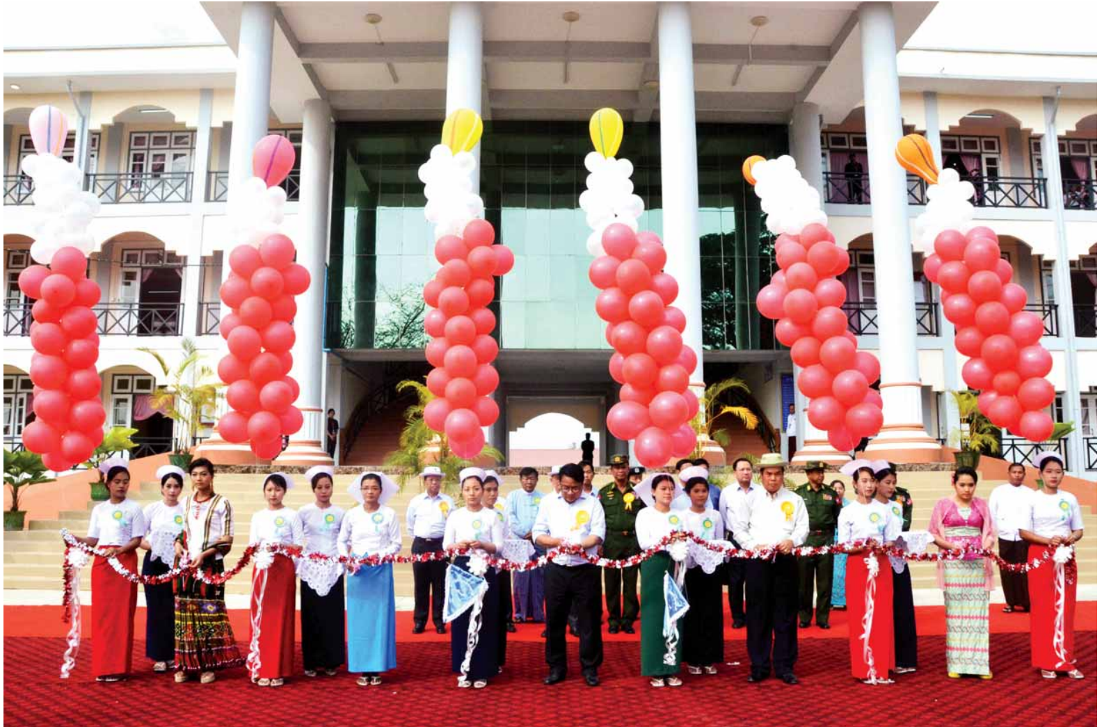
ပြည်ထောင်စုဝန်ကြီး ဒေါက်တာသန်းအောင်၊ တိုင်းဒေသကြီးဝန်ကြီးချုပ် ဦးသာအေး၊ သင်တန်းကျောင်းအုပ် ဒေါက်တာဝေဝေလွင်၊ ချင်းတိုင်းရင်းသူလေးတစ်ဦးနှင့် မြန်မာတိုင်းရင်းသူလေး တစ်ဦးတို့က သူနာပြုနှင့် သားဖွားသင်တန်းကျောင်းကို ဖဲကြိုးဖြတ်ဖွင့်လှစ်ပေးစဉ်။ (သတင်းစဉ်)

ဆက်လက်၍ နိုင်ငံတော်သမ္မတနှင့် အဖွဲ့ဝင်များသည် သူနာပြုနှင့်