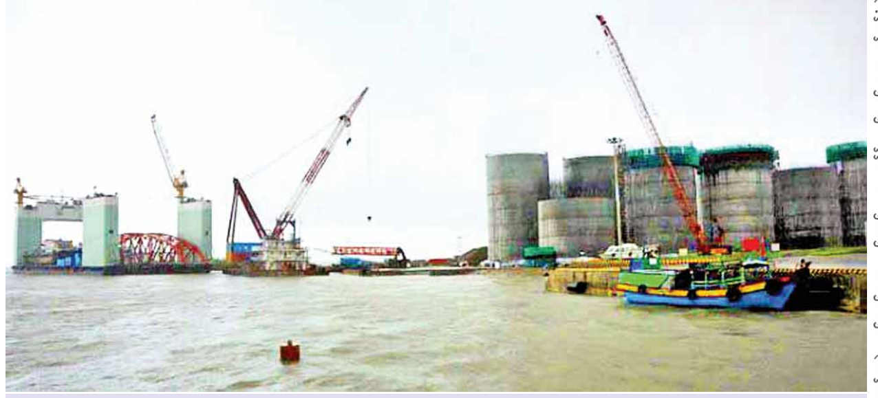
ရန်ကုန်မြစ်ဝ စက်သုံးဆီတင်သွင်းသိုလှောင်သည့် ကုမ္ပဏီပိုင် ဆိပ်ကမ်းတစ်နေရာကို တွေ့ရစဉ်။

စွမ်းအင်ကဏ္ဍသည် နိုင်ငံ၏ အရေးပါသည့်ကဏ္ဍတစ်ခုဖြစ်သည့်အပြင် နိုင်ငံမှထွက်ရှိသည့် သဘာဝဓာတ်ငွေ့အပါအဝင် အခြားလောင်စာများကို ပြည်ပသို့ ထုတ်နုတ်ရောင်းချသကဲ့သို့ စာမျက်နှာ ၁၀ ကော်လံ ၁ သို့ ❖