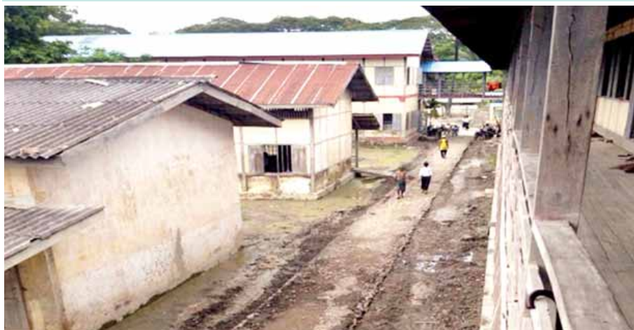
အထက(၁)ကလေး ကျောင်းဆောင်များအကြား ကွန်ကရစ်မခင်းမီ ၁-၁၀-၂၀၁၅ ရက်က တွေ့ရစဉ်။