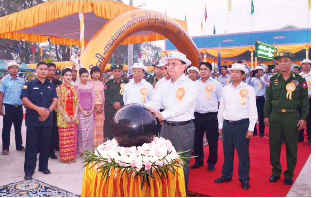
နိုင်ငံတော်သမ္မတ ဦးသိန်းစိန် ကလေးဓာတ်အားခွဲရုံ ကမ္ပည်းကျောက်စာတိုင်အား စက်ခလုတ်နှိပ်ဖွင့်လှစ်ပေးစဉ်။