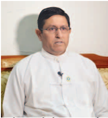
လျှပ်စစ်စွမ်းအား ဝန်ကြီးဌာန ခုတ်ယူဝန်ကြီး ဦးကျော်ဖွား

ဖြေ။ ။ အရင်းအမြစ်မျိုးစုံကိုမသုံးရင် ဓာတ်အားခစျေးနှုန်းပြဿနာ ရှိပါတယ်။ သဘာဝပတ်ဝန်းကျင်ထိခိုက်မှုမှာလည်း မညီမျှမှုတွေရှိလာမယ်။ ဓာတ်အားတည်ငြိမ်မှုကိုလည်း အနှောင့်အယှက်ပေးမယ်။ ဒီနေ့ထုတ်နေတဲ့ လျှပ်စစ်ဓာတ်အားရဲ့ ၆၃ ရာခိုင်နှုန်းဟာ ရေအားလျှပ်စစ်က ရရှိနေတာ ဖြစ်ပါတယ်။ ရေအားလျှပ်စစ်က ရာသီဥတုနဲ့ဆိုင်ပါတယ်။ ရေလျှောင့်ကန်မှာရေနည်း