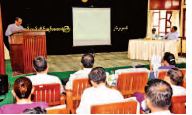
က ဆွေးချီးဆီးချီးရောဂါနှင့် တိုင်းရင်းဆေးပညာခေါင်းစဉ်ဖြင့် စာတမ်းကို ဖတ်ကြားဆွေးနွေးရာ တက်ရောက်လာကြသည့် တိုင်းရင်းဆေးဆရာကြီးများ နှင့် တိုင်းရင်းဆေးရုံမှ ဝန်ထမ်းများက သိလိုသည်များကို မေးမြန်းဆွေးနွေး ကြကြောင်း သိရသည်။ (ကြေးမုံ)

တစ်နှစ်မှတစ်ခါ၊ ရက်ရှည်ထူးခြားစွာ ကျင်းပမြဲဖြစ်သော အညာမြေ မင်းဘူးမြို့မှ မန်းရွှေစက်တော်ရာ ဗုဒ္ဓပူဇော် ဘုရားပွဲတော်ကြီးကျင်းပသည့် ရက်များနှင့် ကြုံကြိုက်သည့်အခိုက် မြတ်ဗုဒ္ဓ၏ ပါဒခြေတော်ရာမြတ် နှစ်ဆူကို စိတ်အေးချမ်းသာစွာဖူးမြော်၍ တောတောင်သဘာဝ ရှုခင်းအလှများနှင့် ရိုးရာဓလေ့ အထူးအဆန်းများကို ကြည့်ရှုလေ့လာရင်းဖြင့် နမူဒါမန်းချောင်းရေ အေးအေးလေးမှာ ပျော်ရွှင်ချမ်းမြေ့စွာ ရေကစားနိုင်ကြပါရန် တစ်ခေါက် တစ်ခါလောက် လာရောက်လှည့်ကြပါဟု နှိုးဆော်တိုက်တွန်းလိုက်ရပါသည်။ တင်ထွန်းဦး(မင်းဘူး)