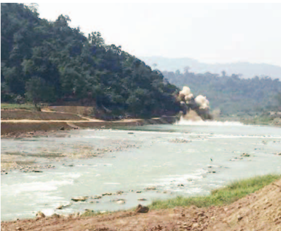
မြစ်ကျဉ်း(၂) တူးဖော်ခြင်းလုပ်ငန်းတွင် ဝိုင်းခွဲဆောင်ရွက်နေစဉ်။