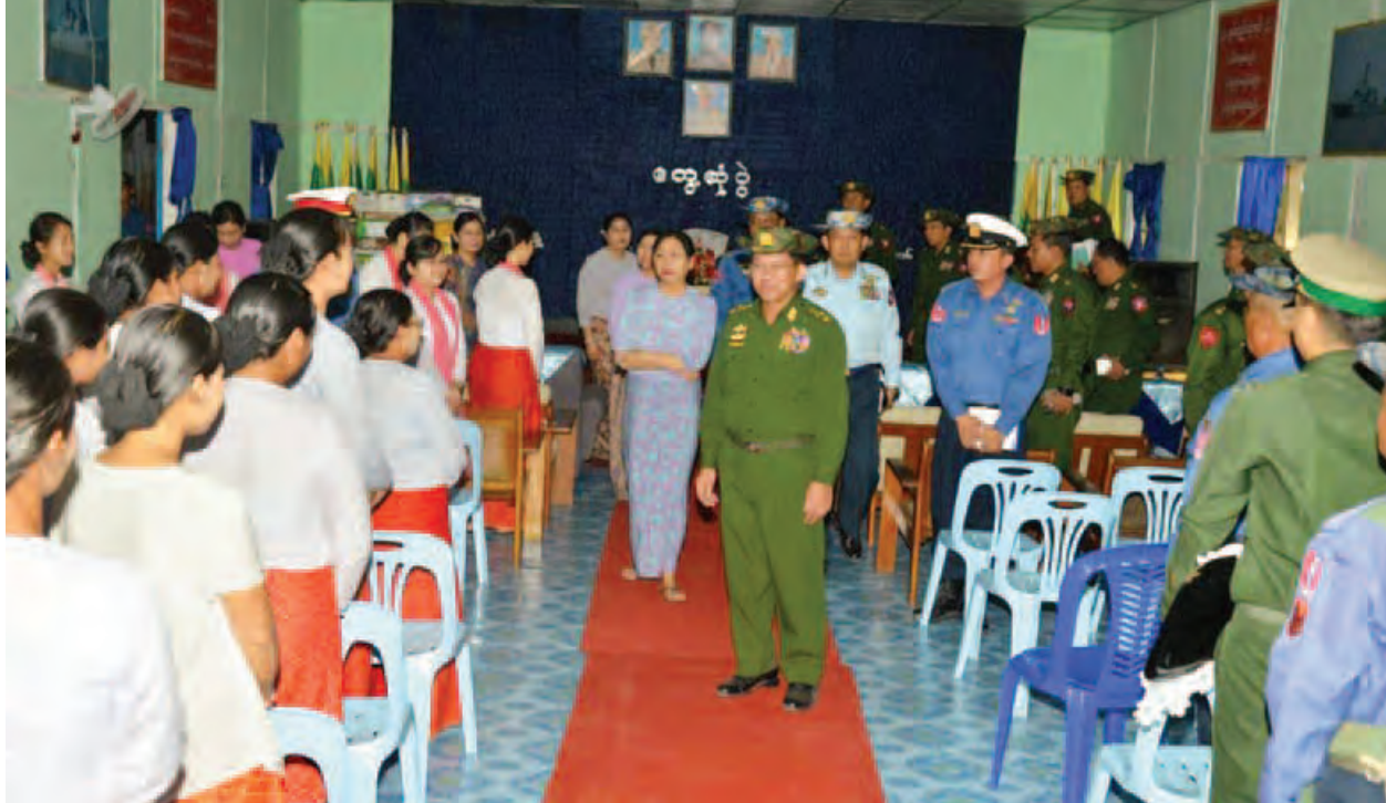
နေပြည်တော် ဖေဖော်ဝါရီ ၂၆

မိမိအနေဖြင့် ကိုကိုးကျွန်းသို့ ၆ ကြိမ်မြောက် ရောက်ရှိခြင်းဖြစ်ပြီး ကိုကိုးကျွန်းအနေဖြင့် တစ်ကြိမ်ထက် တစ်ကြိမ် ပိုမိုပံ့ပိုးတိုးတက်မှုများ ရှိလာသည်ကို တွေ့မြင်ရကြောင်း တပ်မတော်ကာကွယ်ရေးဦးစီးချုပ် ဗိုလ်ချုပ်မှူးကြီးမင်းအောင်လှိုင်က ယနေ့ညနေပိုင်းတွင် ကိုကိုးကျွန်းရှိ တပ်မတော်(ရေ) တပ်စခန်းမှ အရာရှိ၊ စစ်သည်များ၊ မိသားစုဝင်များနှင့် မြို့နယ်ဌာနဆိုင်ရာများ၊ မြို့မိ မြို့ဖများ၊ ဒေသခံပြည်သူများအား သီးခြားစီတွေ့ဆုံ၍ အမှာစကားပြောကြားရာတွင် ထည့်သွင်းပြောကြားသည်။