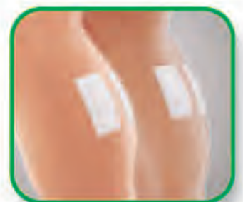
ငြိသလုံးကြွက်သားများ နာကျင်တိုက်ခဲခြင်း