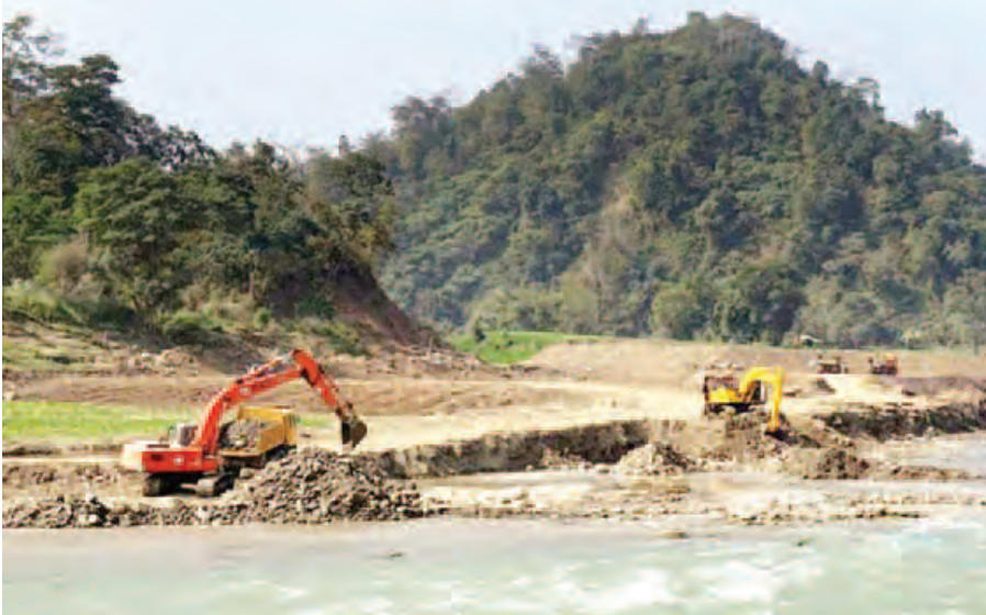
သောင်ခုံ(၂) တူးဖော်ခြင်းလုပ်ငန်း ဆောင်ရွက်နေစဉ်။