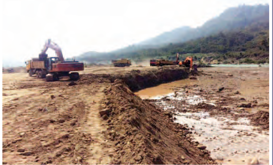
သောင်ခုံ(၁) တူးဖော်ခြင်းလုပ်ငန်း ဆောင်ရွက်နေစဉ်။