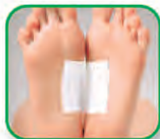
ငြိစမ်းများ နာကျင်တိုက်ခဲခြင်း