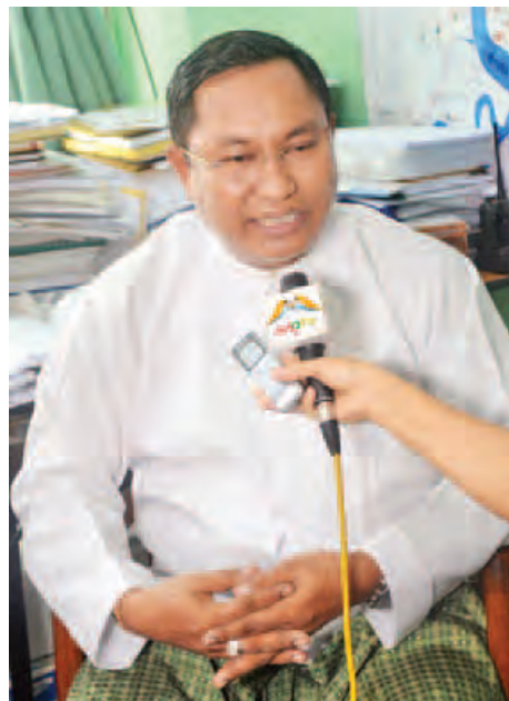
ရန်ကုန်တိုင်းဒေသကြီး သစ်တောနှင့်စွမ်းအင်ဝန်ကြီး ဦးကျော်စိုး။

ဖြေ။ ။ နှစ်ပိုင်းရှိပါတယ်။ ဒေသခံပြည်သူအများစုက ဒီစီမံကိန်းကို လိုလားတယ်လို့ သိရတယ်။ ဒါတွေနဲ့ပတ်သက်ပြီး သိသာထင်ရှားတဲ့အချက်တွေက ဒေသခံပြည်သူတွေအနေနဲ့ ဒီစီမံကိန်းဖော်ဆောင်ပေးပါဆိုပြီး ဆန္ဒဖော်ထုတ်တာတွေ ရှိတယ်။