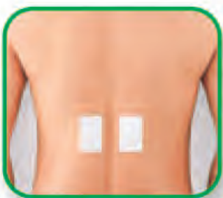
ခါးနာခြင်း၊ ကျောအောင့်ခြင်း