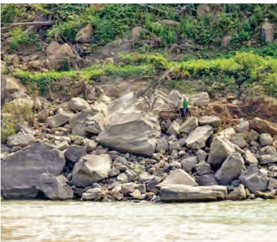
မြစ်ကျဉ်း(၃) တူးဖော်ခြင်းလုပ်ငန်းတွင် ဝိုင်းခွဲရန် လွန်တူးနေစဉ်။

မြစ်သာမြစ်ကျဉ်းများ ချဲ့ထွင်တူးဖော်ခြင်းလုပ်ငန်းကို ဆောင်ရွက်နိုင်ခြင်းဖြင့် မိုးရာသီတွင် မြစ်သာမြစ်၏ ရေစီးဆင်းမှုကောင်းမွန်စေပြီး မြစ်သာမြစ်ကမ်းဘေးတစ်လျှောက်ရှိ ကလေးလွင်ပြင်ဒေသမှ ကျေးရွာများနှင့် စိုက်ပျိုးမြေများ ရေကြီးနစ်မြုပ်မှုမှ လျော့နည်းသက်သာစေနိုင်မည်ဖြစ်ရာ ဒေသနေပြည်သူများ၏ လူမှုစီးပွားဘဝ ဖွံ့ဖြိုးတိုးတက်လာမည်။