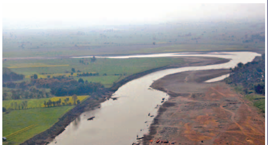
မြစ်ကျဉ်းအား ဝေဟင်မှ တွေ့ရစဉ်။

မြစ်သာမြစ်ကျဉ်းများ ချဲ့ထွင်တူးဖော်ခြင်းလုပ်ငန်းကို ဆောင်ရွက်နိုင်ခြင်းဖြင့် မိုးရာသီတွင် မြစ်သာမြစ်၏ ရေစီးဆင်းမှုကောင်းမွန်စေပြီး မြစ်သာမြစ်ကမ်းဘေးတစ်လျှောက်ရှိ ကလေးလွင်ပြင်ဒေသမှ ကျေးရွာများနှင့် စိုက်ပျိုးမြေများ ရေကြီးနစ်မြုပ်မှုမှ လျော့နည်းသက်သာစေနိုင်မည်ဖြစ်ရာ ဒေသနေပြည်သူများ၏ လူမှုစီးပွားဘဝ ဖွံ့ဖြိုးတိုးတက်လာမည်။