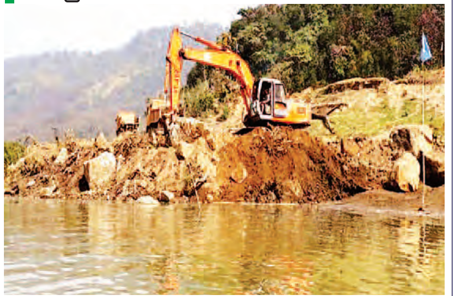
မြစ်ကျဉ်း(၁) တူးဖော်ခြင်းလုပ်ငန်း ဆောင်ရွက်နေစဉ်။