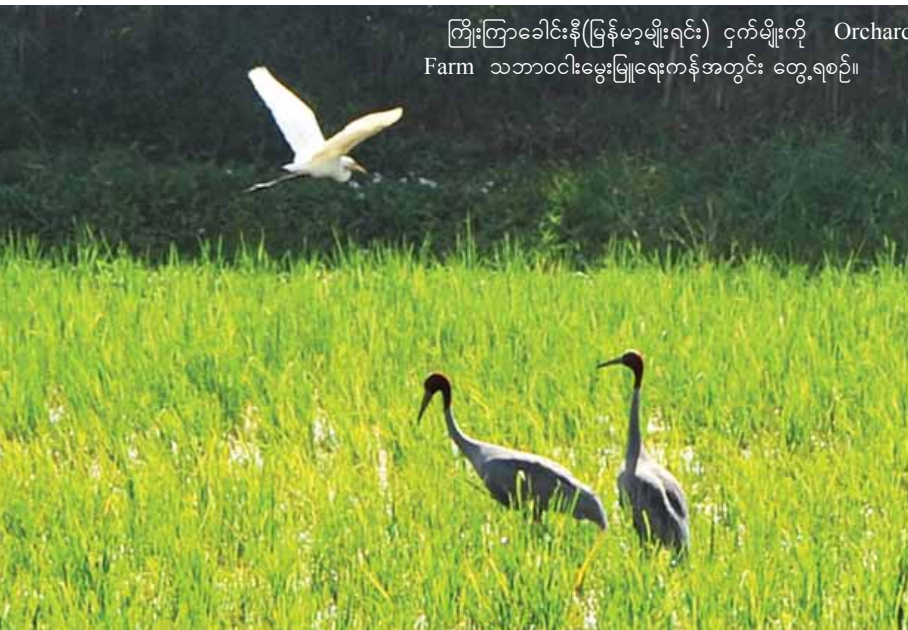
ကြိုးကြာခေါင်းနီ(မြန်မာ့မျိုးရင်း) ငှက်မျိုးကို Orchard Farm သဘာဝငါးမွေးမြူရေးကန်အတွင်း တွေ့ရစဉ်။

ကြိုးကြာခေါင်းနီတွေ တွေ့ရတယ်ဆို လို့ စာရင်းကောက်ဖို့ လာခဲ့တာ။ ဧရာဝတီတိုင်းဒေသကြီးက ကြိုးကြာ ကောင်ရေအများဆုံးပဲ။ ကြိုးကြာ ခေါင်းနီကတော့ မြန်မာ့မျိုးရင်းပဲ။ မြန်မာနိုင်ငံမှာပဲ အဓိကတွေ့ရတယ်။ ကြိုးကြာက မျိုးသုဉ်းတော့မယ့်