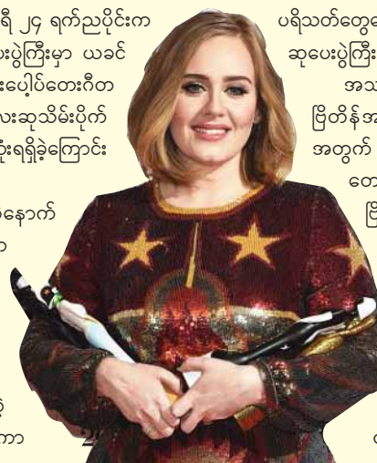
အေးပြည့် စုစည်းသည်

ပရိသတ်တွေပေးတဲ့ မဲအရေအတွက်အရ ဆုတွေရွေးချယ်ချီးမြှင့်ပေးတဲ့ ဆုပေးပွဲကြီးလည်း ဖြစ်ပါတယ်။ အသက် (၂၇)နှစ်အရွယ် အဒဲလ်ရရှိခဲ့တဲ့ ဆုလေးဆုကတော့ ပြတိန်အမျိုးသမီးဆုလိုတေးသံရှင်ဆု၊ "Hello" တေးသီချင်း အတွက် ရရှိခဲ့တဲ့ ပြတိန်တစ်ကိုယ်တော်တေးသီချင်းဆု၊ "25" တေးအယ်လ်ဘမ်အတွက် တစ်နှစ်တာရဲ့အကောင်းဆုံး ပြတိန်ပေါ်တေးအယ်လ်ဘမ်ဆုနဲ့ ကမ္ဘာလုံးဆိုင်ရာ အောင်မြင်မှုဆုတို့ပဲ ဖြစ်ကြပါတယ်။ ယင်းဆုပေးပွဲကြီးမှာအဒဲလ်က အဆိုတော် ကတ်ရှာရင်ဆိုင်နေရတဲ့အမှုနဲ့ ပတ်သက်ပြီး ကတ်ရှာဘက်ကရပ်တည်ကြောင်းနဲ့ ကတ်ရှာ အတွက် အားပေးစကားကိုလည်း (၃၆)ကြိမ်မြောက် ပြတိန်ဆုပေးပွဲစင်မြင့်ပေါ်ကနေ ပြောကြားခဲ့ပါတယ်။