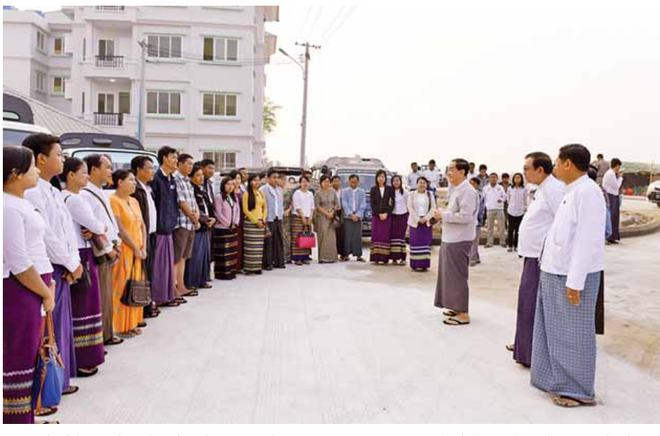
အမှုထမ်းအိမ်ထောင်သည် ၂၆၄ ဦးအား ထပ်မံနေရာ ချထားပေးနိုင်မည်ဖြစ်ကြောင်းနှင့် ၂၀၁၅-၂၀၁၆ ဘဏ္ဍာ ရေးနှစ်တွင် ဆောက်လုပ်သည့် ဝန်ထမ်းအိမ်ရာများ အားလုံး ပြီးစီးသွားပါက စုစုပေါင်း အပျို၊ လူပျို ဝန်ထမ်း ၁၄၄၀၊ အမှုထမ်းအိမ်ထောင်သည် ၅၀၄ ဦးတို့အား ဝန်ထမ်းအိမ်ရာများတွင် နေရာချထားပေးနိုင်မည်ဖြစ် ကြောင်း သိရသည်။