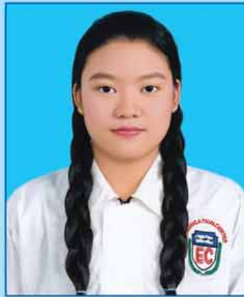
မယဉ်ယဉ်မိုးဦး (ဆဗဟ-၇၀၄) ပဲခူးကုန်းမြို့