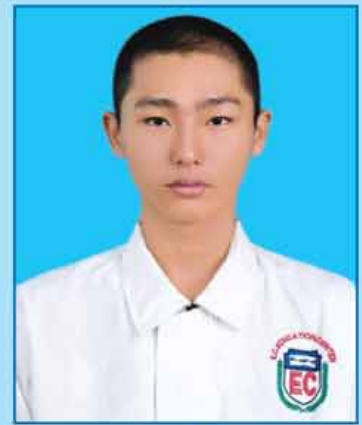
မောင်ရဲရင့်ပိုင်ဦး (ဆဗဟ-၇၀၃) ရန်ကုန်မြို့