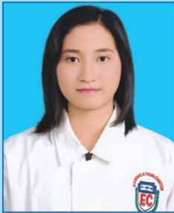
မဟန်နီချို (ဆဗဟ-၆၁၃) ရန်ကုန်မြို့