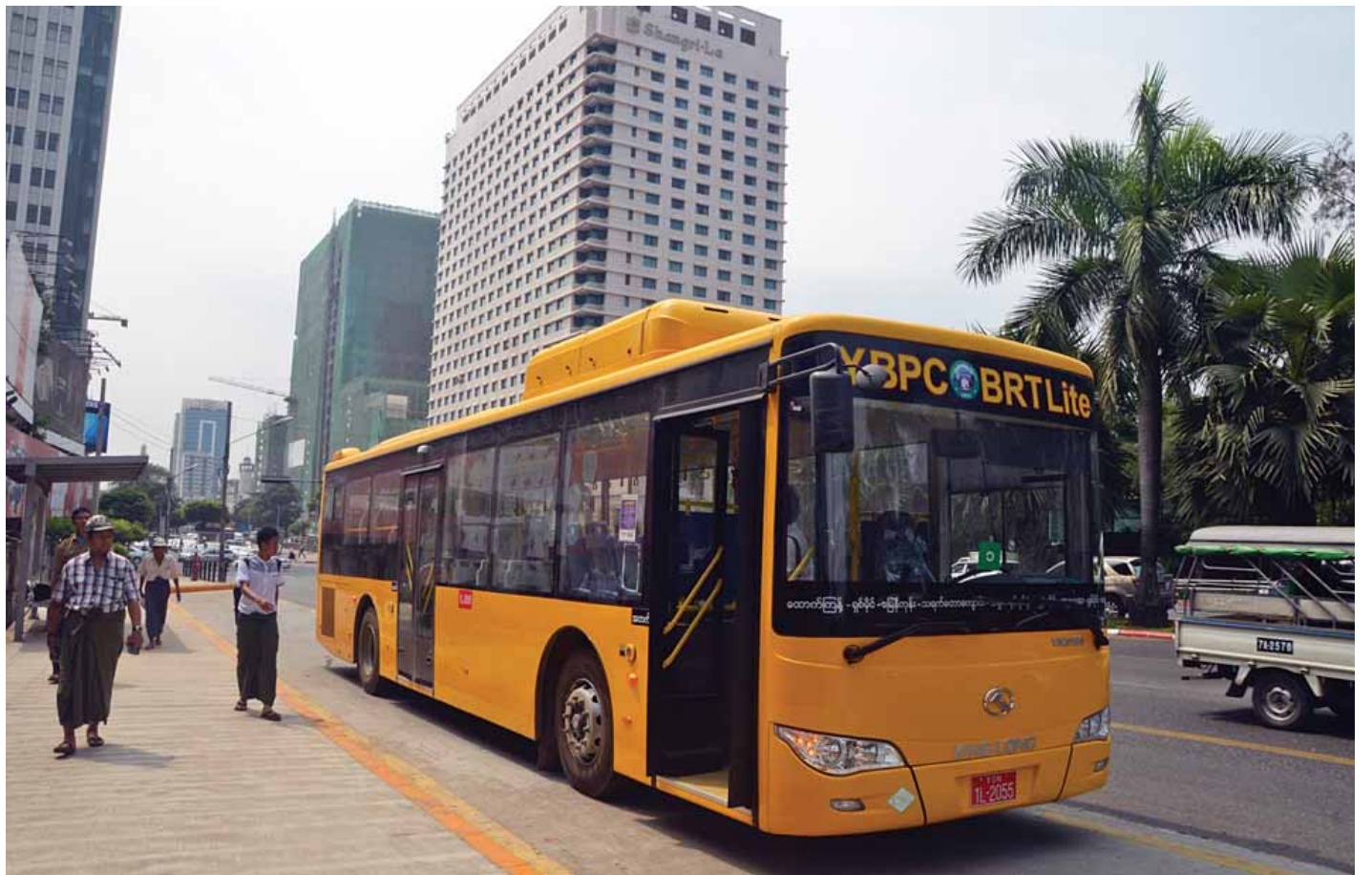
ရန်ကုန်မြို့တွင် BRT Lite စနစ်ဖြင့် စမ်းသပ်ပြေးဆွဲနေသည့် ဘတ်စ်ကားတစ်စီးကို တွေ့ရစဉ်။