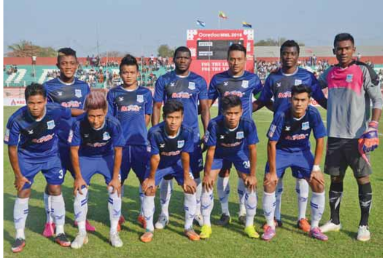
ထိပ်ဆုံးတွင် ဦးဆောင်နေသည့် ရတနာပုံအသင်း။