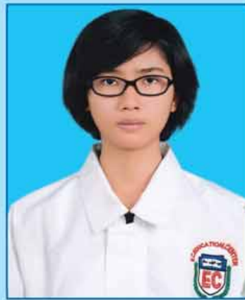
မမေထက်သာ (ဆဗဟ-၆၇၇) ရန်ကုန်မြို့