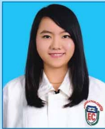
မယွန်းရတနွယ် (ဆဗဟ-၆၅၂) တောင်ကြီးမြို့