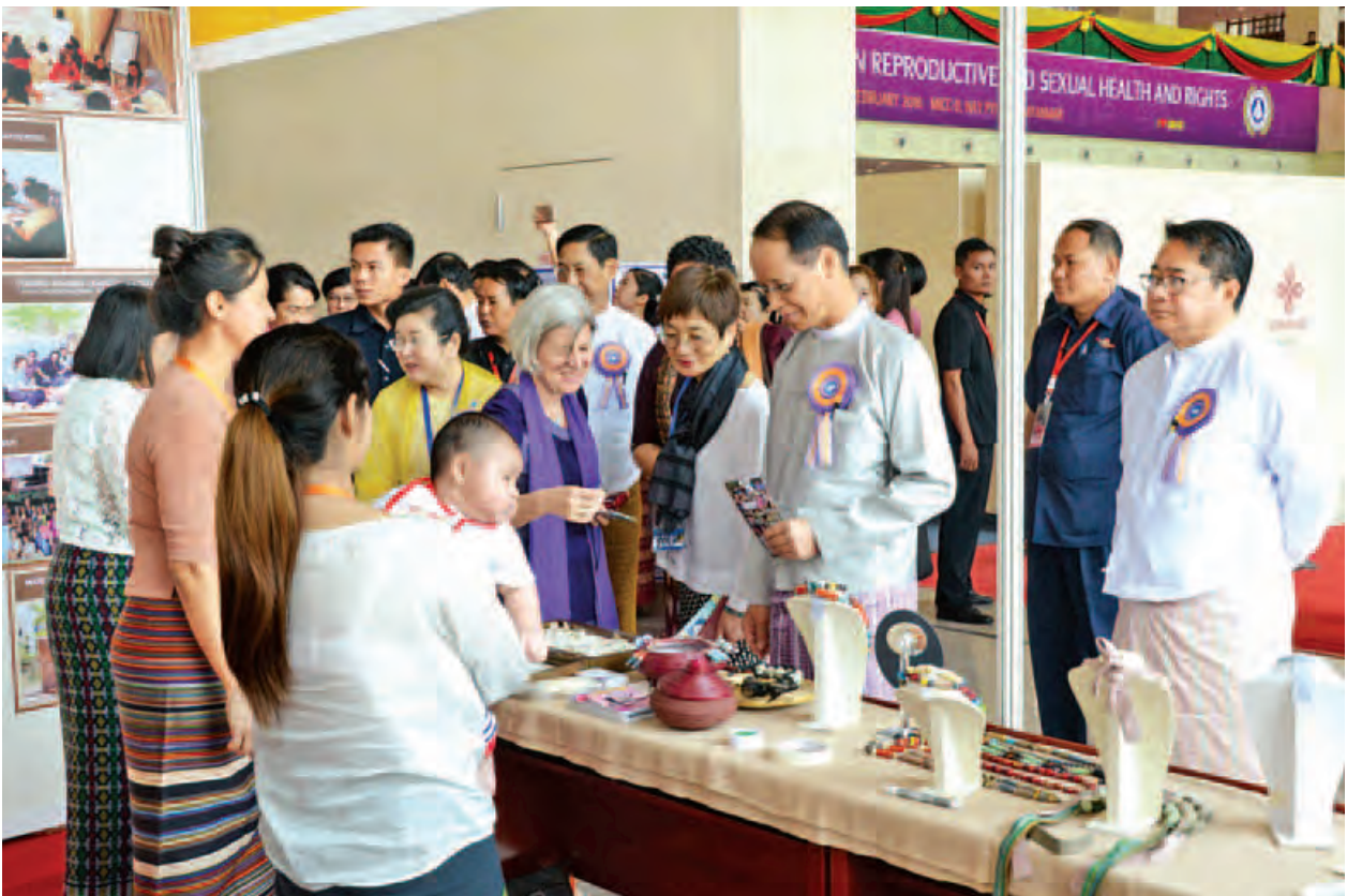
ဒုတိယသမ္မတ ဒေါက်တာစိုင်းမောင်ခမ်း ခင်းကျင်းပြသထားသည့် ပြခန်းများအား လှည့်လည်ကြည့်ရှုစဉ်။ (သတင်းစဉ်)

(၈)ကြိမ်မြောက် အာရှပစိဖိတ်ဒေသ မျိုးဆက်ပွားကျန်းမာရေးနှင့် အခွင့် အရေးဆိုင်ရာ ညီလာခံကို ဒေသတွင်းနိုင်ငံများအချင်းချင်း မျိုးဆက်ပွားကျန်းမာ ရေးနှင့် အခွင့်အရေးဆိုင်ရာကိစ္စရပ်များကို အပြန်အလှန်ဆက်သွယ်ဆောင်ရွက် ခြင်းနှင့် အတွေ့အကြုံဖလှယ်ခြင်း၊ အစိုးရမဟုတ်သော ပြည်တွင်း/ပြည်ပ လူမှုအဖွဲ့အစည်းက ဦးဆောင်ကျင်းပရန်ရှိခြင်းနှင့် လတ်တလောဖြစ်ပေါ်နေသော