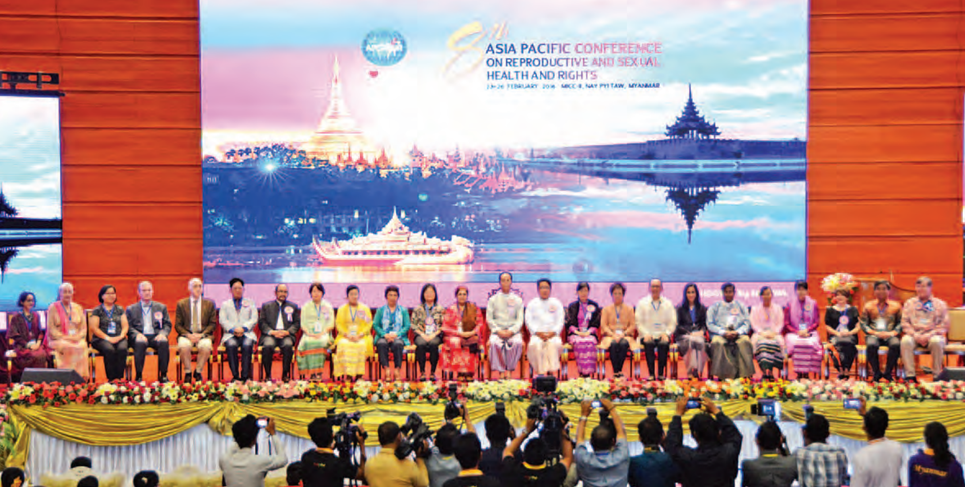
ဒုတိယသမ္မတ ဒေါက်တာစိုင်းမောက်ခမ်း (၈) ကြိမ်မြောက် အာရှပစိဖိတ်ဒေသ မျိုးဆက်ပွားကျန်းမာရေးနှင့် အခွင့်အရေးဆိုင်ရာ ညီလာခံစာတမ်းဖတ်ပွဲတွင် ဦးဆောင်ဆွေးနွေးမည့်သူများ၊ အမျိုးသားကျန်းမာရေးကော်မတီ ဝင်များ၊ နိုင်ငံတကာအဖွဲ့အစည်းများမှ ကိုယ်စားလှယ်များ၊ တာဝန်ရှိသူများနှင့် စုပေါင်း၍ မှတ်တမ်းတင်ဓာတ်ပုံရိုက်စဉ်။ (သတင်းစဉ်)

နေပြည်တော် ဖေဖော်ဝါရီ ၂၄ (၈) ကြိမ်မြောက် အာရှပစိဖိတ်ဒေသ မျိုးဆက်ပွားကျန်းမာရေးနှင့် အခွင့်အရေးဆိုင်ရာ ညီလာခံဖွင့်ပွဲအခမ်းအနားကို ယနေ့နံနက် ၉ နာရီတွင် နေပြည်တော်ရှိ မြန်မာအပြည်ပြည်ဆိုင်ရာကွန်ပဏီဗဟိုဌာန-၂၅၅ ကျင်းပရာ