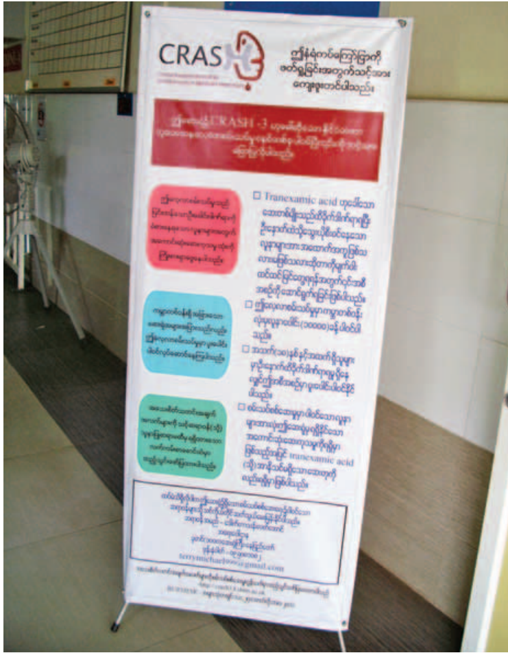
ခုတင် (၁၀၀၀) ပြည်သူ့ဆေးရုံ အရေးပေါ်ဆေးကုသမှုဌာနရှေ့တွင် အများပြည်သူ မြင်သာအောင်ထားရှိသော ကြော်ငြာ