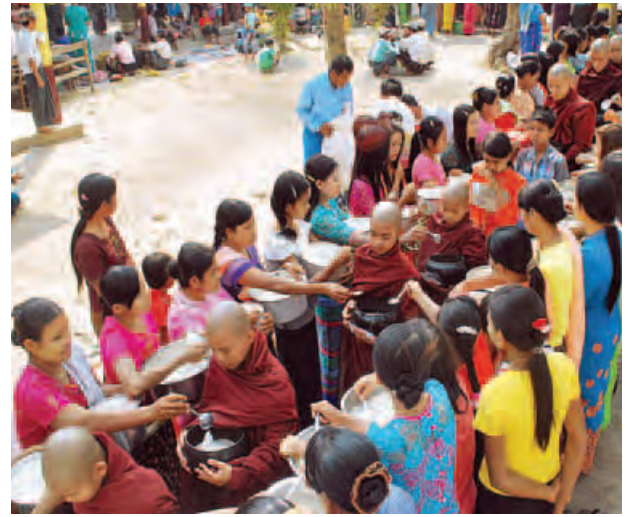
ရမည်းသင်းတွင် သံဃာအပါး ၆၇၀ ကျော်အား ဆွမ်းဆန်စိမ်းလောင်းလှူ

မြရည်နန္ဒာ တန်ဖိုးမျှတအိမ်ရာ များမှာ လေးထပ်လေးခန်းတွဲတိုက် ခန်းများဖြစ်ပြီး တိုက်ခန်းတစ်ခန်း လျှင် စတုရန်းပေ ၆၅၀ ကျယ်ပြီး အိပ်ခန်းနှစ်ခန်း၊ ဧည့်ခန်း၊ ရေချိုးခန်း၊ ရေလောင်းအိမ်သာ၊ မီးဖိုခန်းတို့ ပါဝင်သည်။ တိုက်ခန်းစေ့နှုန်းမှာ မြေညီထပ် ၁၆၅ သိန်း၊ ဒုတိယထပ် ၁၅၅ သိန်း၊ တတိယထပ် ၁၄၅ သိန်း၊ စတုတ္ထထပ် ၁၃၅ သိန်း ခန့်ဖြင့် ရောင်းချ ပေးရန်စီစဉ်လျက်ရှိပြီး မြို့ပြအိမ်ရာ နှင့်ဖွံ့ဖြိုးရေးဘဏ်တို့ ချိတ်ဆက်၍ အရစ်ကျစနစ်၊ လက်ငင်းငွေချစနစ် များဖြင့် ရောင်းချပေးမည်ဖြစ်ကြောင်း သိရသည်။ သီဟကိုကို(မန္တလေး)