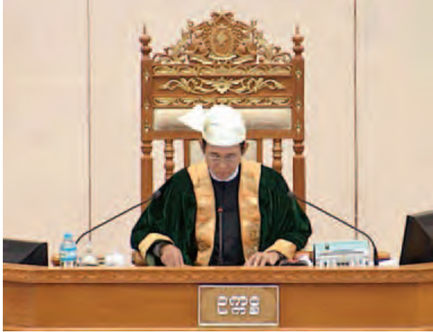
ပြည်သူ့လွှတ်တော်ဥက္ကဋ္ဌ ဦးဝင်းမြင့်။