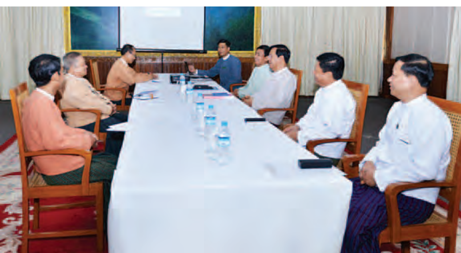
အကဲတာဝန်လွှဲပြောင်းမှု အထောက်အကူပြုကော်မတီဥက္ကဋ္ဌ ပြည်ထောင်စုဝန်ကြီး ဦးလှထွန်း၊ ကော်မတီဝင်များဖြစ်ကြသည့် ပြည်ထောင်စုဝန်ကြီး ဦးရဲထွန်း၊ နိုင်ငံတော်သမ္မတရုံး ညွှန်ကြားရေးမှူးချုပ် ဦးလှထွန်း၊ ဆောက်လုပ်ရေးဝန်ကြီးဌာန ဒုတိယ ညွှန်ကြားရေးမှူးချုပ် ဦးမောင်မောင် အုန်းနှင့် နိုင်ငံတော်သမ္မတရုံး ဒုတိယ ညွှန်ကြားရေးမှူးချုပ် ဦးဇော်ဌေးတို့ တက်ရောက်ခဲ့ကြပြီး အမျိုးသားဒီမိုကရေစီအဖွဲ့ချုပ် အသွင်ကူးပြောင်းရေးအဖွဲ့မှ အဖွဲ့ခေါင်းဆောင် ဗဟိုအလုပ်အမှုဆောင်အဖွဲ့ဝင် ဦးဝင်းထိန်၊ အဖွဲ့ဝင်များဖြစ်ကြသည့် ဒေါက်တာမျိုးအောင်နှင့် ဒေါက်တာ အောင်သူတို့ တက်ရောက်ခဲ့ကြသည်။ (သတင်းစဉ်)

နေပြည်တော် ဖေဖော်ဝါရီ ၂၄ ပြည်ထောင်စုသမ္မတ မြန်မာနိုင်ငံတော်အစိုးရ နိုင်ငံတော်အကြီးအကဲတာဝန်လွှဲပြောင်းမှု အထောက်အကူပြုကော်မတီနှင့် အမျိုးသားဒီမိုကရေစီအဖွဲ့ချုပ် အသွင်ကူးပြောင်းရေးအဖွဲ့အကြား တတိယအကြိမ် ညှိနှိုင်းအစည်းအဝေးကို ယနေ့ မွန်းလွဲ ၂ နာရီတွင် နေပြည်တော်ရှိ ရုံးအမှတ် (၁၈) အစည်းအဝေးခန်းမ၌ ကျင်းပသည်။ (ယာဝု) အစည်းအဝေးတွင် သမ္မတအိမ်တော်၌ ကျင်းပမည့် နိုင်ငံတော်အကြီးအကဲ တာဝန်လွှဲပြောင်းသည့် အခမ်းအနား အစီအစဉ် လျာထားချက်များကို အသေးစိတ် ရှင်းလင်းဆွေးနွေးကြပြီး စတုတ္ထအကြိမ် ညှိနှိုင်းအစည်းအဝေးကို လာမည့် မတ်လဆန်းအတွင်း နှစ်ဖက် ညှိနှိုင်းကျင်းပရန် သဘောတူညီကြသည်။ အစည်းအဝေးသို့ နိုင်ငံတော်အကြီး