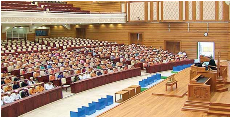
ဒုတိယအကြိမ် ပြည်သူ့လွှတ်တော် ပထမပုံမှန် အစည်းအဝေး ဒသမနေ့ ကျင်းပစဉ်။