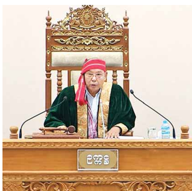
အမျိုးသားလွှတ်တော်ဥက္ကဋ္ဌ မန်းဝင်းခိုင်သန်း

ဆက်လက်၍ အမျိုးသားလွှတ်တော်ဥက္ကဋ္ဌက စိုက်ပျိုးရေး၊ မွေးမြူရေးနှင့် ရေလုပ်ငန်းဖွံ့ဖြိုးတိုးတက်ရေးကော်မတီ၌ ကော်မတီဥက္ကဋ္ဌအဖြစ် ကချင် ပြည်နယ် မဲဆန္ဒနယ်အမှတ်(၁၁)မှ ဒေါက်တာခွန်ဝင်းသောင်း၊ အတွင်းရေးမှူး အဖြစ် ပဲခူးတိုင်းဒေသကြီးမဲဆန္ဒနယ် အမှတ်(၁၁)မှ ဒေါက်တာဝင်းမြင့်တို့ အပါအဝင် အဖွဲ့ဝင် ၁၅ ဦးဖြင့် ဖွဲ့စည်းရန် လျာထားကြောင်း လွှတ်တော်သို့ အသိပေးကြေညာသည်။