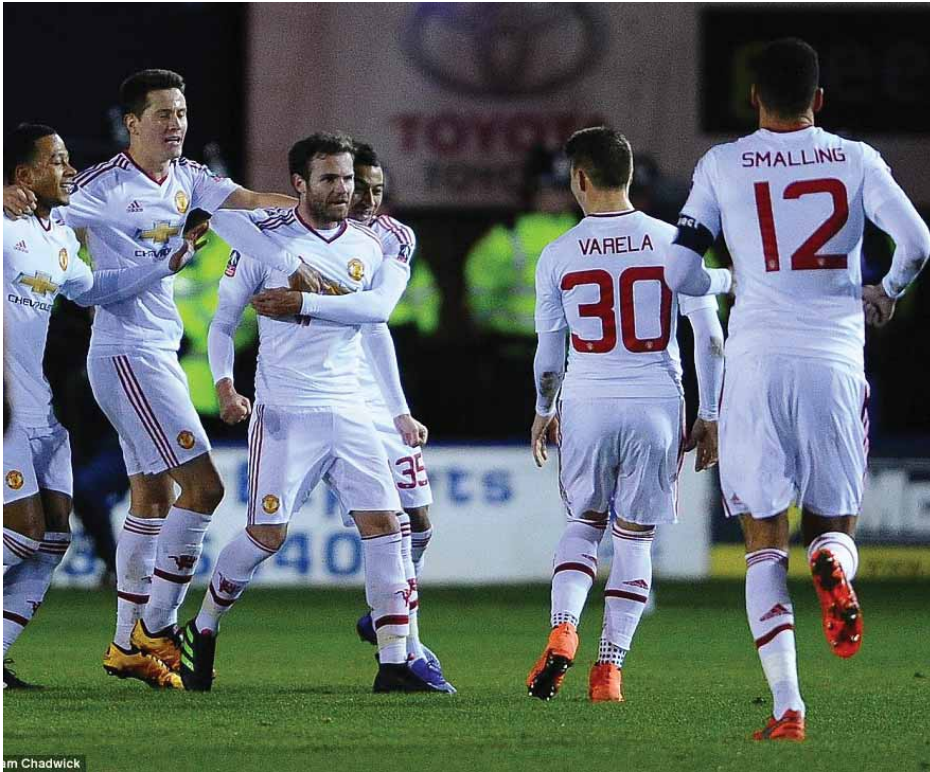
အာဆင်နယ်အသင်းနှင့် ဟာလ်စီးတီး အသင်းတို့ပြန်ကန်ပွဲမှ အနိုင်ရရှိသည့် အသင်းနှင့်လည်းကောင်း ယှဉ်ပြိုင် ကစားရမည်ဖြစ်သည်။

မန်ယူအသင်းသည် အက်ဖ်အေဖလား ၁၆ သင်း အဆင့်မြင့်ပွဲတွင် ရှုရှူးဘူရီတောင်းအသင်းအား သုံးဂိုး ပြတ်ဖြင့် အနိုင်ရရှိခဲ့ခြင်းကြောင့် ကွာတားပိုင်နယ်အဆင့်သို့ လွယ်ကူစွာပင် တက်လှမ်းနိုင်ခဲ့ပြီဖြစ်သည်။ ထို့ကြောင့် အက်ဖ်အေဖလားကွာတားပိုင်နယ်အဆင့်တွင် ပရီမီယာလိဂ် ပြိုင်ဘက် ဝက်စ်ဟမ်းအသင်းအား အိမ်ကွင်းအိမ်ထုတ်ဖို့ခွင့် နည်းခံကစား ရမည်ဖြစ်သည်။ ရှုရှူးဘူရီတောင်း အသင်းအား သုံးဂိုးပြတ်ဖြင့် အနိုင်ရရှိ ခဲ့သည့် ပွဲစဉ်တွင် မန်ယူအသင်း အတွက် သွင်းဂိုးများကို စမောလင်း၊ မာတာနှင့် လင်းဂတ်တို့က သွင်းယူ ပေးခဲ့ခြင်းဖြစ်သည်။ အက်ဖ်အေဖလားကွာတားပိုင်နယ် ပွဲစဉ်များကို မဲခွဲဆုံးဖြတ်ပြီးချိန်တွင် ရိုးဝင်းအသင်းသည် ခရစ္စတယ်ပဲလေ အသင်းနှင့်လည်းကောင်း၊ မန်ယူ အသင်းသည် ဝက်စ်ဟမ်းအသင်းနှင့် လည်းကောင်း၊ အဲဗာတန်အသင်း သည် ချယ်လ်ဆီးအသင်းနှင့်လည်း ကောင်း၊ ဝက်ဖီးဒ်အသင်းသည်