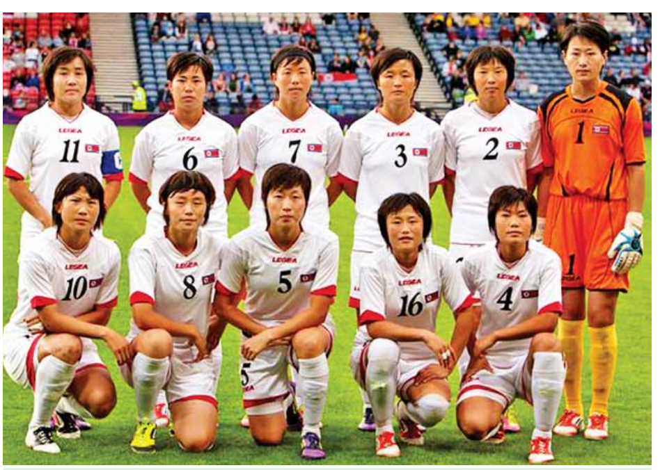
၂၀၁၂ ခုနှစ် လန်ဒန်အိုလံပစ်ပြိုင်ပွဲဝင် မြောက်ကိုရီးယားအမျိုးသမီးဘောလုံးအသင်းကို တွေ့ရစဉ်။

ဆိုက်ရောက်လာခဲ့သည်။ ပေကျင်းလေဆိပ်သို့ ရောက်ရှိလာသည့် အားကစားသမားများသည် သတင်းထောက်များ၏ မေးမြန်းချက်များကို တစ်စုံတစ်ရာပြန်လည်ဖြေကြားခြင်းမရှိဘဲ လေယာဉ်ပေါ်မှ ဆင်းပြီးနောက် မြောက်ကိုရီးယားသံရုံးက စီစဉ်ထားသည့် ဘတ်စ်ကားပေါ်သို့ တက်ရောက်သွားခဲ့ကြသည်။ ပေကျင်းမြို့ရှိ ဂျပန်သံရုံးက မြောက်ကိုရီးယားအမျိုးသမီးဘောလုံးအသင်းနှင့် အသင်းတာဝန်ရှိသူများအတွက် ပြည်ဝင်ခွင့်ဗီဇာ ထုတ်ပေးသွားမည်ဖြစ်သည်။ မြောက်ကိုရီးယား အမျိုးသမီးဘောလုံးအသင်းသည် ဂျပန်၊ တရုတ်၊ တောင်ကိုရီးယား၊ ဩစတြေးလျ၊ ဗီယက်နမ် အသင်းတို့နှင့် ယှဉ်ပြိုင်သွားရမည်ဖြစ်သည်။ အဆိုပါအသင်းများအနက် ထိပ်ဆုံးနှစ်သင်းသာလျှင် အိုလံပစ်ပြိုင်ပွဲတွင် ယှဉ်ပြိုင်ခွင့်ရရှိမည်ဖြစ်သည်။ ဂျပန် အမျိုးသမီးဘောလုံးအသင်းသည် မြောက်ကိုရီးယား အမျိုးသမီးဘောလုံးအသင်းနှင့် မတ် ၉ ရက်တွင် ယှဉ်ပြိုင်ကစားရမည်ဖြစ်သည်။ အင်န်အိတ်ချ်ကော။