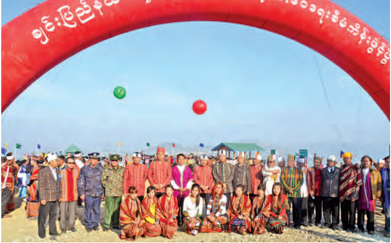
ပြည်ထောင်စုဝန်ကြီး ဦးစိုးသိန်းနှင့် တာဝန်ရှိသူများ၊ ဟားခါးမြို့ ရေပေးဝေရေးစီမံကိန်းဖွင့်ပွဲအခမ်းအနားသို့ တက်ရောက်လာကြသူများ မှတ်တမ်း တင်ဓာတ်ပုံရိုက်စဉ်။ (သတင်းစဉ်)

ပြည်ထောင်စုဝန်ကြီး ဦးစိုးသိန်း၏ ချင်းပြည်နယ်ခရီးစဉ်တွင် အဖွဲ့ဝင် များအဖြစ် မွေးမြူရေး၊ ရေလုပ်ငန်းနှင့် ကျေးလက်ဒေသဖွံ့ဖြိုးရေးဝန်ကြီးဌာန ပြည်ထောင်စုဝန်ကြီး ဦးအုန်းမြင့်၊ ပတ်ဝန်းကျင်ထိန်းသိမ်းရေးနှင့် သစ်တော ရေးရာဝန်ကြီးဌာန ပြည်ထောင်စုဝန်ကြီး ဦးဝင်းထွန်း၊ နယ်စပ်ရေးရာဝန်ကြီးဌာန ဒုတိယဝန်ကြီး ဗိုလ်ချုပ်သန်းထွန်းနှင့် ဌာနဆိုင်ရာတာဝန်ရှိသူများလိုက်ပါကြ သည်။ (သတင်းစဉ်)