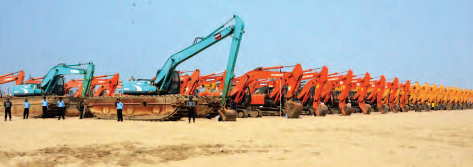
ဧရာဝတီတိုင်းဒေသကြီး ဇလွန်မြို့နယ်အတွင်း မြစ်ကမ်းပါးတိုက်စားခြင်းနှင့် ရေဘေးအန္တရာယ်ကာကွယ်ခြင်းလုပ်ငန်းများ ဆောင်ရွက်ရန် စက်ယန္တရားများစုစည်းထားမှုကို တွေ့ရစဉ်။ (သတင်းစဉ်)

ယင်းနောက် နိုင်ငံတော်သမ္မတ သည် ဝါသလ-မေခုံရွာများအနီး မြစ်ကမ်းပါးတိုက်စားခြင်းနှင့် ရေ ဘေးအန္တရာယ်ကာကွယ်ခြင်းလုပ်ငန်း စီမံကိန်းနယ်မြေအတွင်း စက်ယန္တရား များအသုံးပြု၍ လုပ်ငန်းဆောင် ရွက်နေမှု၊ လုပ်ငန်းပြီးစီးမှုနှင့် စက် ယန္တရားများ ရောက်ရှိမှုအခြေအနေ များကို လှည့်လည်ကြည့်ရှုစစ်ဆေး ပြီး လိုအပ်သည်များကို တာဝန်ရှိသူ များအား မှာကြားသည်။