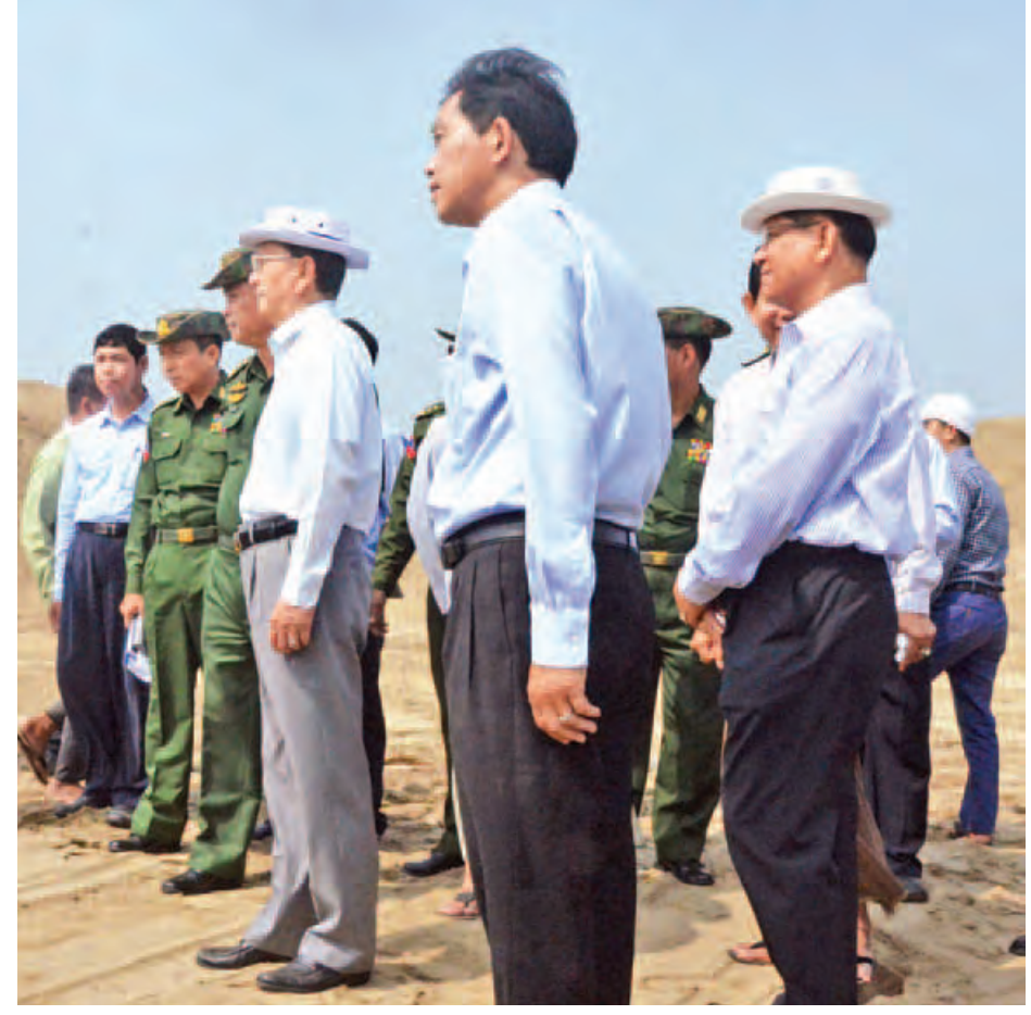
နိုင်ငံတော်သမ္မတ ဦးသိန်းစိန် လေ့ရှိမြို့နယ်အတွင်း ဧရာဝတီမြစ်ရေတိုက်စားမှုကာကွယ်ခြင်းလုပ်ငန်းများ ဆောင်ရွက်ရန် စက်ယန္တရားများစုဖွဲ့ထားမှုကို ကြည့်ရှုစစ်ဆေးစဉ်။ (သတင်းစဉ်)

နေပြည်တော် မေဖော်ဝါရီ ၂၁ ပြည်ထောင်စုသမ္မတမြန်မာနိုင်ငံတော် နိုင်ငံတော်သမ္မတ ဦးသိန်းစိန်သည် ယနေ့နံနက်ပိုင်းတွင် ဧရာဝတီတိုင်း ဒေသကြီး လေ့ရှိမြို့နယ်အတွင်း ဧရာဝတီမြစ်ရေတိုက်စားမှုကြောင့် မြစ်ကမ်းပါးတိုက်စားမှုအခြေအနေ၊ တာတမံပြိုကျ ပျက်စီးပြီး ဖြစ်ပေါ်လာနိုင်သည့်အန္တရာယ်နှင့် မြေရေယာများ ပျက်စီးဆုံးရှုံးနိုင်သည့်အခြေအနေများမှ ကာကွယ်နိုင်ရန် ရေလွှဲဖြတ်မြောင်းတူးဖော်ခြင်းနှင့် မြစ်ကမ်းပါးတိုက်စားမှု ကာကွယ်ခြင်းလုပ်ငန်းများကို ကြည့်ရှုစစ်ဆေးသည်။ စာမျက်နှာ ၈ ကော်လံ ၁ သို့ ☆