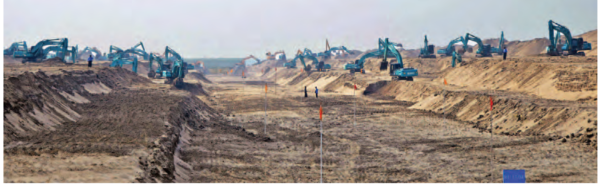
ဧရာဝတီတိုင်းဒေသကြီး လွန်ခဲ့သည့် ဝါသလနှင့် မေခုံရွာများအနီး မြစ်ကမ်းစားခြင်းနှင့် ရေဘေးအန္တရာယ်ကာကွယ်ခြင်းလုပ်ငန်းများကို စက်ယန္တရားများဖြင့် ဆောင်ရွက်နေစဉ်။ (သတင်းစဉ်)