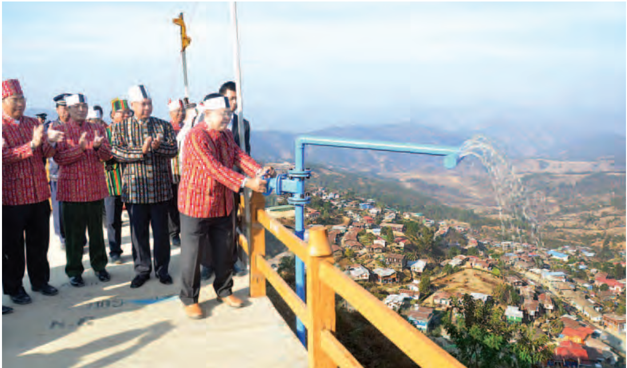
ပြည်ထောင်စုဝန်ကြီး ဦးစိုးသိန်း ဟားခါးမြို့ ရေပေးဝေရေးအတွက် ရေပိုက်လိုင်းကို ဖွင့်လှစ်ပေးစဉ်။ (သတင်းစဉ်)

ဖေဖော်ဝါရီ ၂၀ ရက် နံနက်ပိုင်းတွင် ပြည်ထောင်စုဝန်ကြီး ဦးစိုးသိန်းနှင့် အဖွဲ့သည် ဟားခါးမြို့ ရှုခင်းသာရပ်ကွက်၌ကျင်းပသည့် (၆၈)နှစ်မြောက်