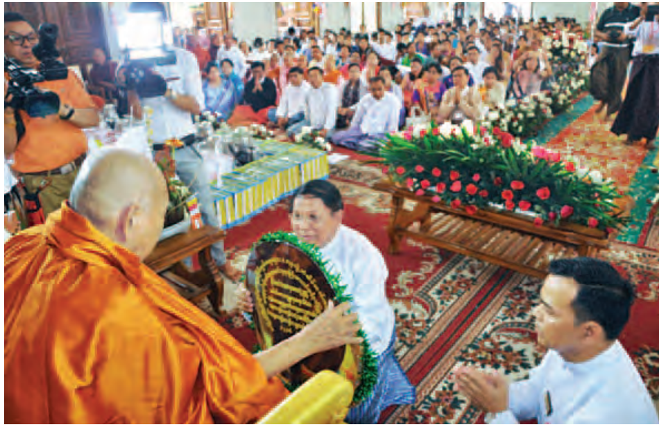
ဘာသာရေးအသင်းအဖွဲ့များ၊ အလှူရှင်မိသားစုများ၊ မြို့မိမြို့ဖများနှင့် ဖိတ်ကြားထားသူများ တက်ရောက်ကြည့်ကြည့်ကြသည်။ ရှေးဦးစွာ ပန်းမော်ဆရာတော်ကြီးထံမှ ဧည့်ပရိသတ်

နိုင်ငံတော် သံယမဟာနာယကအဖွဲ့ဥက္ကဋ္ဌ အဘိဓဇမဟာဂရုဋ္ဌဂုရု၊ အဘိဓဇအဂ္ဂမဟာ သဒ္ဓမ္မဇောတိက၊ အဂ္ဂမဟာပဏ္ဍိတ သက္ကသီဟ ဝဋ်သကာ၊ ပါဠိသိရောမဏိ၊ ဘိဒေအ၊ အဂ္ဂမဟာဂန္ထဝါစကပဏ္ဍိတ ဗုဒ္ဓစာပေ ပါရဂူ (Ph.D, D.Lit) ပန်းမော်ဆရာတော် ဒေါက်တာ ဘဒ္ဒန္တကုမာရာဘိဝံသအား အမေရိကန်နိုင်ငံ ကမ္ဘာ့ငြိမ်းချမ်းရေး ဆုချီးမြှင့်ရေးကောင်စီ၏ အကဲဖြတ်အဖွဲ့က ညီညွတ်စွာ သဘောတူရွေးချယ်၍ ၂၀၁၅ ခုနှစ် နိုဝင်ဘာ ၁ ရက်တွင် ဆက်ကပ်ခဲ့သည့် “ကမ္ဘာ့လူသားများ ယဉ်ကျေးမှုဂုဏ်ရည်ဘွဲ့”အတွက် ထပ်ဆင့်ချီးကျူးဂုဏ်ပြု ပူဇော်ပွဲ အခမ်းအနားကို ယနေ့မုန်းလွဲ ၁၂ နာရီခွဲက မဟာအောင်မြေမြို့နယ် ပန်းမော်ကျောင်းတိုက်ရှိ အေးကမ္ဘာသာသနာ့ဗိမာန်တော်ကြီးတွင် ကျင်းပသည်။