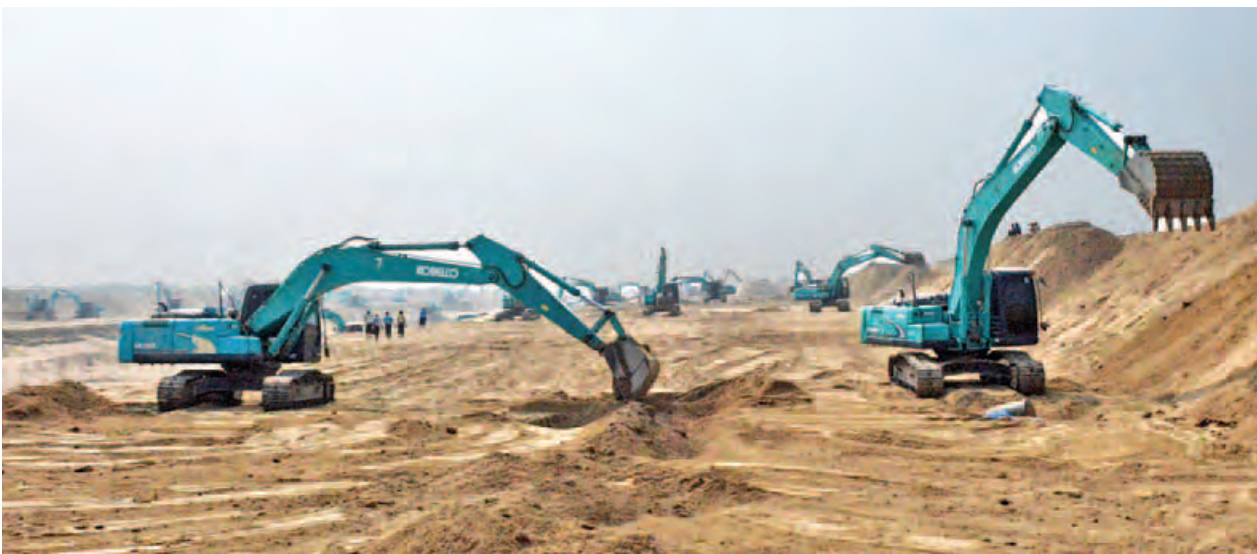
ဧရာဝတီတိုင်းဒေသကြီး လွန်ခဲ့သည့် ဝါသလနှင့် မေခုံရွာများအနီး မြစ်ကမ်းစားခြင်းနှင့် ရေဘေးအန္တရာယ်ကာကွယ်ခြင်းလုပ်ငန်းများကို စက်ယန္တရားများဖြင့် ဆောင်ရွက်နေစဉ်။ (သတင်းစဉ်)

ရှိ မေခုံပန်းတာတည်ဆောက်ခြင်းတို့ဖြစ်သည်။ လွန်ခဲ့သည့် ဝါသလနှင့် မေခုံရွာများအနီး မြစ်ကမ်းစားခြင်းနှင့် ရေဘေးအန္တရာယ်ကာကွယ်ခြင်းလုပ်ငန်းများဖြစ်သည့် ရေလွှဲဖြတ်မြောင်းတူးဖော်ခြင်း၊ မေခုံပန်းတာတည်ဆောက်ခြင်းနှင့် ဗျဉ်စဉ်ကုန်းမြစ်ကမ်းကာကွယ်ခြင်း စသည့်လုပ်ငန်းများ ဆောင်ရွက်ရန် မြေတူးစက် ၂၄၄ စီး၊ ကုန်း၊ ရေနှစ်သွယ်မြေတူးစက်နှစ်စီး၊ မြေထိုးစက် ၃၃ စီးနှင့် မြေသယ်ယာဉ် ၁၀၆ စီး စုစုပေါင်းစက်ယန္တရား ၃၈၅ စီးတို့မှာ ၂၀၁၆ ခုနှစ် ဇန်နဝါရီ ၂၉ ရက်မှ စတင်၍ လုပ်ငန်းခွင်သို့ ရောက်ရှိပြီး လုပ်ငန်းများ ဆောင်ရွက်လျက်ရှိရာ အဆိုပါစီမံကိန်းကို ယခုနှစ် မိုးရာသီမတိုင်မီ အပြီးဆောင်ရွက်သွားမည်ဖြစ်ကြောင်း သိရသည်။ (သတင်းစဉ်)