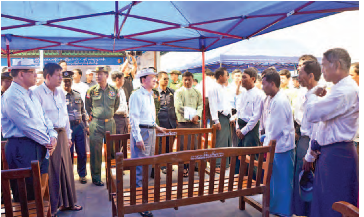
နိုင်ငံတော်သမ္မတ ဦးသိန်းစိန် ဒေသခံပြည်သူများအား မြစ်ကမ်းပါးတိုက်စားမှုအခြေအနေ၊ ဖြစ်ပေါ်လာနိုင်သည့်အန္တရာယ်နှင့် ဆိုးကျိုးများ၊ နိုင်ငံတော်အစိုးရမှ ဆောင်ရွက်ပေးမည့် အခြေအနေများကို ရှင်းလင်းပြောကြားစဉ်။ (သတင်းစဉ်)

ရေလွှဲဖြတ်မြောင်းဖြတ်သန်းတူး ဖော်ရမည့် လယ်ယာမြေများနှင့် ပတ်သက်ပြီး စိုက်ပျိုးစေရိတ်နှင့်မြေ တန်ဖိုး၊ စိုက်ပျိုးထားသည့် သီးနှံများ ရောင်းချပါက ရရှိမည့်ငွေတန်ဖိုးတို့