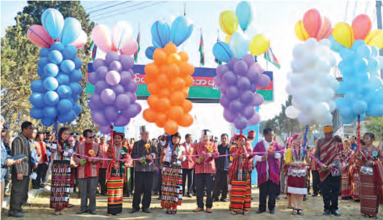
ပြည်ထောင်စုဝန်ကြီး ဦးစိုးသိန်းနှင့် တာဝန်ရှိသူများ ချင်းအမျိုးသားနေ့အထိမ်းအမှတ် မုခ်ဦးကို ဖဲကြိုးဖြတ်၍ ဖွင့်လှစ်ပေးစဉ်။ (သတင်းစဉ်)

ချင်းအမျိုးသားနေ့ အခမ်းအနားသို့ သမ္မတရုံးဝန်ကြီးဌာန ပြည်ထောင်စုဝန်ကြီးဦးစိုးသိန်း၊ မွေးမြူရေး၊ ရေလုပ်ငန်းနှင့် ကျေးလက်ဒေသဖွံ့ဖြိုးရေးဝန်ကြီးဌာန ပြည်ထောင်စုဝန်ကြီး ဦးအုန်းမြင့်၊ ပတ်ဝန်းကျင်ထိန်းသိမ်းရေးနှင့် သစ်တောရေးရာဝန်ကြီးဌာန ပြည်ထောင်စုဝန်ကြီး ဦးဝင်းထွန်း၊ ချင်းပြည်နယ်ဝန်ကြီးချုပ် ဦးဟုန်းဝင်း၊ နယ်စပ်ရေးရာဝန်ကြီးဌာန ဒုတိယဝန်ကြီး ဗိုလ်ချုပ်သန်းထွဋ်နှင့် ဌာနဆိုင်ရာတာဝန်ရှိသူများ၊ ချင်းရိုးရာယဉ်ကျေးမှုအဖွဲ့များနှင့် ဒေသခံတိုင်းရင်းသားများ တက်ရောက်ကြသည်။ (သတင်းစဉ်)