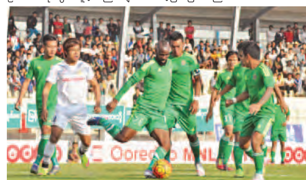
ရှမ်းယူနိုက်တက်နှင့် ချင်းယူနိုက်တက်အသင်းတို့ ယှဉ်ပြိုင်နေစဉ်။

ဦးဆောင်မှုမှာ နှစ်မိနစ်သာကြာခဲ့ပြီး ၆၁ မိနစ်တွင် အလီကာမာရာက ရှမ်းအတွက် ချေပဂိုး ပြန်သွင်းခဲ့သည်။ ဂိုးရပြီးနောက်ပိုင်းတွင် ရှမ်းယူနိုက်တက် အသင်း ပိုမိုကစားနိုင်ခဲ့ပြီး အခွင့် အရေးအချို့ရခဲ့သော်လည်း အသုံးမချ နိုင်၍ သရေတစ်မှတ်ဖြင့်သာ ကျေနပ် ခဲ့ခြင်းဖြစ်သည်။ ချင်းယူနိုက်တက် အသင်းမှာ အသင်းကြီးတစ်သင်း ဖြစ်သည့် ရတနာပုံအသင်းပြီးနောက် ရှမ်းအသင်းကို သရေထပ်မံကစား ခဲ့ခြင်းဖြစ်သည်။