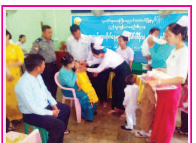
အမျိုးသားကာကွယ်ဆေးတိုက်နေ့များ ရက်သတ္တပတ်အဖြစ် မွေးကင်းစ မှ အသက်ငါးနှစ်အောက် ကလေးသူငယ်များအား ပိုလီယိုကာကွယ်ဆေး တိုက်ကျွေးခြင်းကို ဖေဖော်ဝါရီ ၂၀ ရက်က ပဲခူးတိုင်းဒေသကြီး ပညောင်လေးပင်မြို့ ပြည်သူ့ဆေးရုံအစည်းအဝေးခန်းမ၌ ကျင်းပရာ ကာကွယ် ဆေးတိုက်နေ့ ကွင်းဆင်းကြီးကြပ်ရေးအဖွဲ့များက ကလေးငယ်များအား ကာကွယ်ဆေးတိုက်ကျွေးစဉ်။