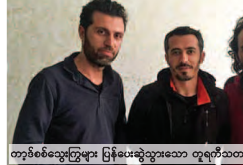
ကာနစ်သွေးကြွများ ပြန်ပေးဆွဲသွားသော တူရကီသတင်းထောက်သုံးဦး။

တူရကီနိုင်ငံ အနာတိုလီယာသတင်းအေဂျင်စီမှ သတင်းထောက်သုံးဦးအား စစ်သွေးကြွ ကာနစ်အလုပ်သမား ပါတီက ဖေဖော်ဝါရီ ၂၀ ရက်တွင် ပြန်ပေးဆွဲသွားကြောင်း ဒိုဂန်သတင်းအေဂျင်စီ၏ ထုတ်ပြန်ချက်အရ သိရသည်။ စစ်မြေပြင်သတင်းလိုက်ရန်အထူးလေ့ကျင့်ပေးထား သော အဆိုပါသတင်းထောက် သုံးဦးအား ဆီးရီးယား- တူရကီနယ်စပ် မာဒင်ပြည်နယ် နှစ်ဆောင်မြို့တွင် သတင်း ရယူနေစဉ် စစ်သွေးကြွများက ပြန်ပေးဆွဲခဲ့ခြင်းဖြစ် ကြောင်း အစီရင်ခံစာတစ်ရပ်တွင် ဖော်ပြထားသည်။