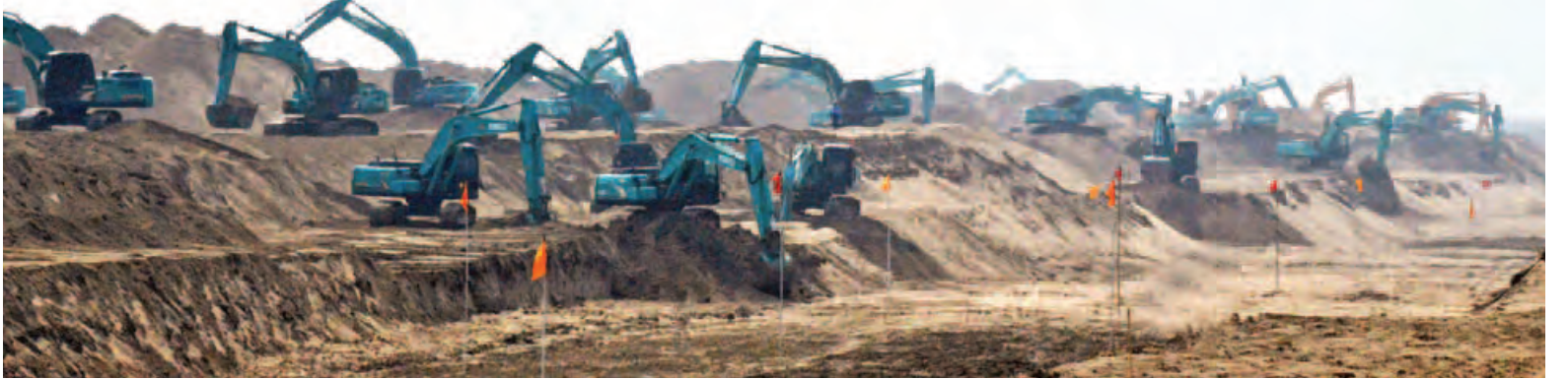
ဧရာဝတီတိုင်းဒေသကြီး ဇလွန်မြို့နယ်အတွင်း ဧရာဝတီမြစ်ရေတိုက်စားမှုကာကွယ်နိုင်ရန် ရေလွှဲဖြတ်မြောင်းတူးဖော်ခြင်းနှင့် မြစ်ကမ်းပါးတိုက်စားမှုကာကွယ်ခြင်းလုပ်ငန်းများကို စက်ယန္တရားများဖြင့် ဆောင်ရွက်နေစဉ်။ (သတင်းစဉ်)

ကို တွက်ချက်ပြီး လျော်ကြေးပေးမည့် အပြင် နိုင်ငံတော်မှသင့်တော်သည့် ကရုဏာကြေးလည်း ထပ်ဆောင်း ပေးမည်ဖြစ်ကြောင်း၊ ထို့ပြင်ရေလွှဲ ဖြတ်မြောင်းဖောက်လုပ်ခြင်းကြောင့် အသစ်ပေါ်ထွန်းလာမည့် မြေနေရာ များတွင် မူလလုပ်ကိုင်ခဲ့သည့် တောင်သူလယ်သမားများကို ပြန်လည် နေရာချထားပေးရမည်ဖြစ်ကြောင်း။