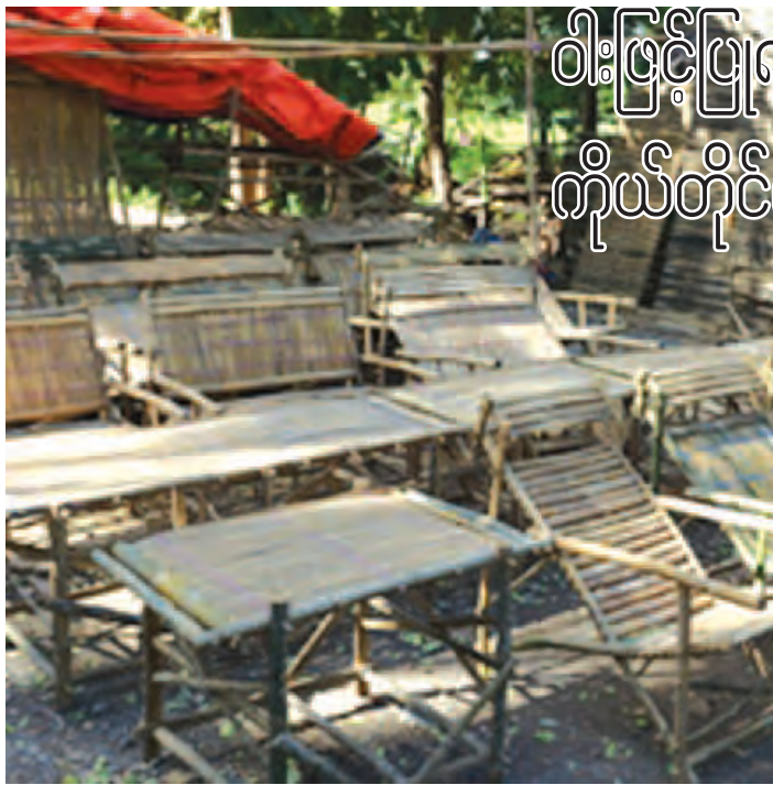
ပုသိမ်ကြီး ဖေဖော်ဝါရီ ၂၁

မန္တလေးတိုင်းဒေသကြီး ပုသိမ်ကြီး မြို့နယ် ကျောက်တံတားကျေးရွာနှင့် ထုံးတိုကျေးရွာအနီးတွင် ဝါးဖြင့်ပြုလုပ်သော မြန်မာ့ရိုးရာ လက်မှုပစ္စည်းများကို