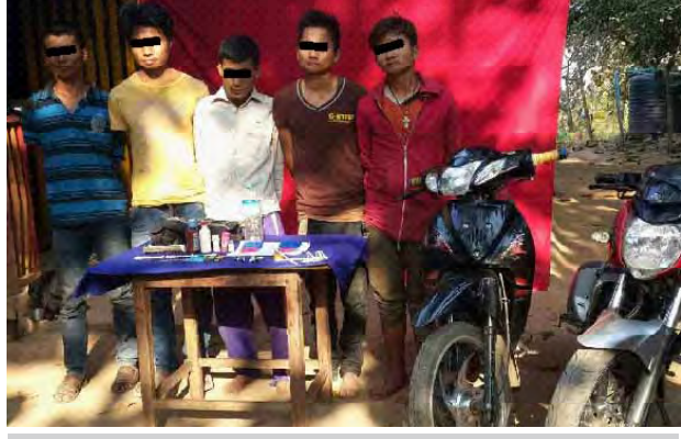
ပေါင်မင်းလင်၊ လက်ခိုလမ်း၊ ထောင်ခိုဆေး၊ လားပဲ့လှံနာနှင့် လားဘင်တို့ ငါးဦးအား သိမ်းဆည်းရမိ မူးယစ်ဆေးဝါးများနှင့်အတူ တွေ့ရစဉ်။

အား မူးယစ်ဆေးဝါးနှင့် စိတ်ကို ပြောင်းလဲစေသော ဆေးဝါးများ ဆိုင်ရာဥပဒေအရ အရေးယူထား ကြောင်း သိရသည်။