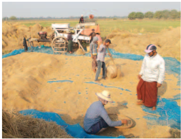
စစ်ကိုင်း၊ ဖေဖော်ဝါရီ ၁၉

စစ်ကိုင်းတိုင်းဒေသကြီးရွှေဘိုခရိုင် ဝက်လက်မြို့နယ်တွင် ဖေဖော်ဝါရီ ၁၅ ရက်မှစ၍ ရေတောင်ပေးခြင်းကြောင့် နောက်ကျနေသော လယ်ကွက်များမှာ အမြန်ရိတ်သိမ်း