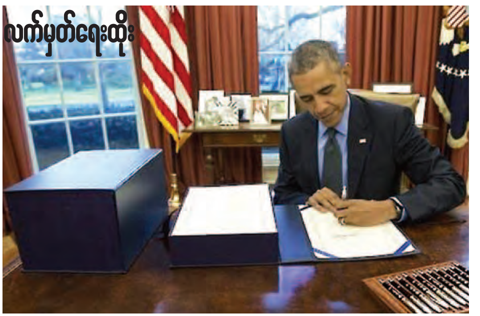
ရပ်တန့်သွားစေရန်ရည်ရွယ်ပြီး အကျိုးသက်ရောက်မှုရှိ စေသည့်နည်းလမ်းများကို ချမှတ်ကျင့်သုံးရန် တိုက်တွန်း ထားသည်။ သမ္မတအိုဘားမားအစိုးရအဖွဲ့က ပြုယမ်းနှင့်ပတ်သက် ပြီး ယခုထက်ပြင်းထန်သည့် စီးပွားရေးပိတ်ဆို့မှုများ ချမှတ်မည်ဖြစ်ကြောင်း သိရသည်။ အင်န်အိတ်ချ်ကော့

ဝါရှင်တန် ဖေဖော်ဝါရီ ၁၉ မြောက်ကိုရီးယားနိုင်ငံအနေဖြင့် မကြာသေးမီက တာဝေးပစ်ခတ်မှုလက်နက်ဟု နိုင်ငံတကာကယူဆသည့် ပြိတ်တု ပစ်ခတ်မှုခြင်းနှင့်ပတ်သက်ပြီး အမေရိကန်သမ္မတ အိုဘားမားက ပြုယမ်းအပေါ် စီးပွားရေးပိတ်ဆို့အရေးယူ သည့် ဥပဒေကို ဖေဖော်ဝါရီ ၁၈ ရက်တွင် အတည်ပြု လက်မှတ်ရေးထိုးလိုက်ပြီဖြစ်ကြောင်း အင်န်အိတ်ချ်ကော့ သတင်းတစ်ရပ်အရ သိရသည်။ လွန်ခဲ့သည့်ရက်သတ္တပတ်တွင် ကွန်ဂရက်နှစ်ခုစလုံးက အတည်ပြုခဲ့သည့် မြောက်ကိုရီးယားနိုင်ငံအပေါ် စီးပွား ရေးပိတ်ဆို့မည့်ဥပဒေကို ဖေဖော်ဝါရီ ၁၈ ရက်က သမ္မတ အိုဘားမားက အတည်ပြုလက်မှတ်ရေးထိုးခဲ့သည်ဟု အိမ်ဖြူတော်ကဆိုသည်။ မြောက်ကိုရီးယားနိုင်ငံ၏ လက်နက်ခဲယမ်းများ၊ လူ့ အခွင့်အရေးဖောက်ဖျက်မှုများနှင့် ဆိုက်ဘာတိုက်ခိုက်မှုများ တွင် ပါဝင်ပတ်သက်မှုရှိခဲ့သူမည်သူ့ကိုမဆို အမေရိကန် နိုင်ငံသို့ လာရောက်ခွင့်ပြုမဟုတ်ကြောင်း အဆိုပါ