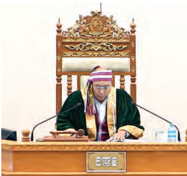
ပြည်ထောင်စုလွှတ်တော်နာယက၊ အမျိုးသားလွှတ်တော်ဥက္ကဋ္ဌ မန်းဝင်းခိုင်သန်း

အလားတူ အမျိုးသားလွှတ်တော်ဥက္ကဋ္ဌက နိုင်ငံသားများ၏ မူလအခွင့်