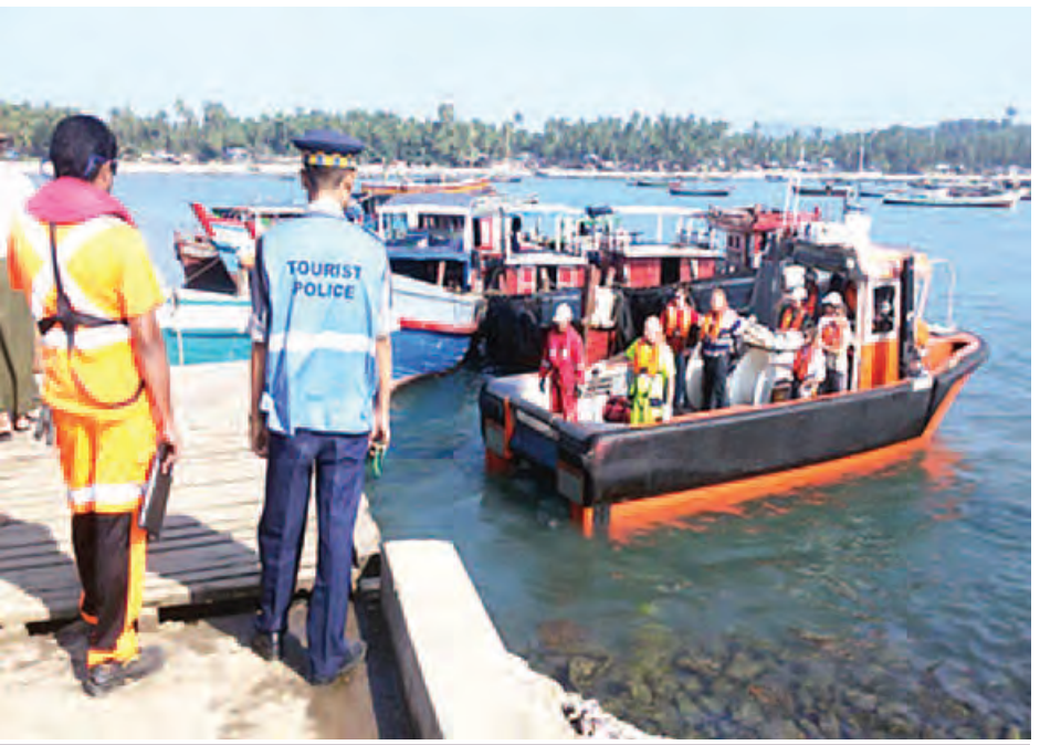
တပ်ဖွဲ့စု(ငယ်)က လုံခြုံရေးဆောင်ရွက်နေမှု မှတ်တမ်းဓာတ်ပုံများ။

ကမ္ဘာလှည့်ခရီးသွားလုပ်ငန်းလုံခြုံရေးရဲတပ်ဖွဲ့သည် ကမ္ဘာလှည့်ခရီးသည်များနှင့် ပတ်သက်၍ ကူညီစောင့် ရှောက်မှုများ ဆောင်ရွက်ပေးရာတွင် လုံခြုံရေးလိုက်ပါ ဆောင်ရွက်မှု၊ ကျန်းမာရေးကူညီစောင့်ရှောက်မှု၊ ပစ္စည်း ပျောက်/ပြန်ရ ကူညီစောင့်ရှောက်မှု၊ မော်တော်ယာဉ်