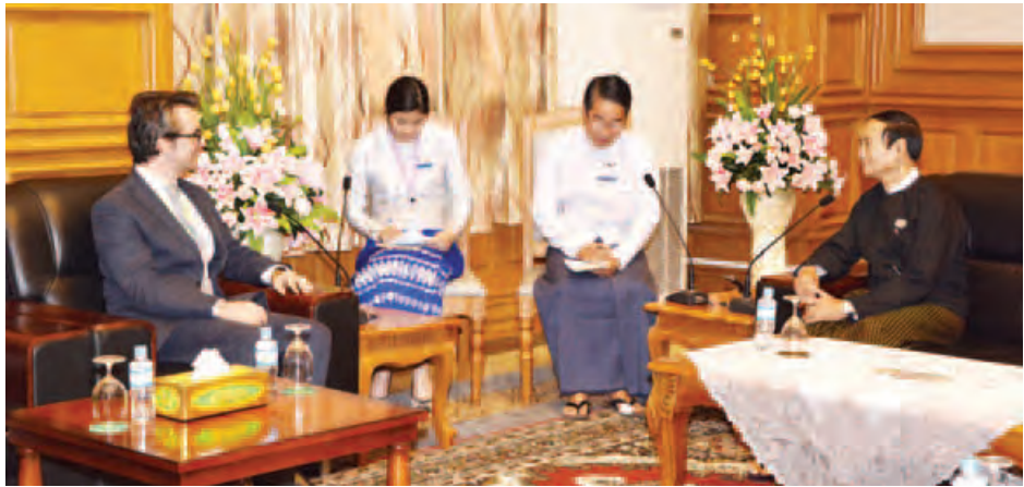
(သတင်းစဉ်)

နေပြည်တော် ဖေဖော်ဝါရီ ၁၉ ပြည်သူ့လွှတ်တော်ဥက္ကဋ္ဌ ဦးဝင်းမြင့်သည် မြန်မာနိုင်ငံ ဆိုင်ရာ အီတလီနိုင်ငံသံအမတ်ကြီး H.E.Mr. Pier Giorgio ALIBERTI (ယာဂျို)အား ယနေ့မနက် ၁ နာရီခွဲတွင် လည်းကောင်း၊ နော်ဝေနိုင်ငံ နိုင်ငံခြားရေး ဝန်ကြီးဌာန ဒုတိယဝန်ကြီး H.E.Mr. Tore Hattrem ဦးဆောင်သော ကိုယ်စားလှယ်အဖွဲ့အား ယနေ့မနက် ၂ နာရီခွဲတွင် လည်းကောင်း နေပြည်တော်ရှိ လွှတ်တော် အဆောက်အအုံ ပြည်သူ့လွှတ်တော်ဦးစီးဌာန သီးခြားစီ လက်ခံတွေ့ဆုံသည်။ ထိုသို့တွေ့ဆုံရာတွင် နှစ်နိုင်ငံချစ်ကြည်ရင်းနှီးမှုနှင့် ပူးပေါင်းဆောင်ရွက်ရေးဆိုင်ရာ ကိစ္စရပ်များနှင့် ပတ်သက်၍ ဆွေးနွေးကြသည်။ တွေ့ဆုံပွဲသို့ ပြည်သူ့လွှတ်တော် ဒုတိယဥက္ကဋ္ဌ ဦးတီခွန်မြတ်၊ ပြည်သူ့လွှတ်တော် နိုင်ငံတကာဆက်ဆံရေး ကော်မတီဥက္ကဋ္ဌနှင့် အဖွဲ့ဝင်များနှင့် ပြည်သူ့လွှတ်တော်ရုံးမှ တာဝန်ရှိသူများ တက်ရောက်ကြပြီး မြန်မာနိုင်ငံဆိုင်ရာ နော်ဝေနိုင်ငံသံအမတ်ကြီး H.E.Ms. Ann Ollestad လည်း တက်ရောက်သည်။