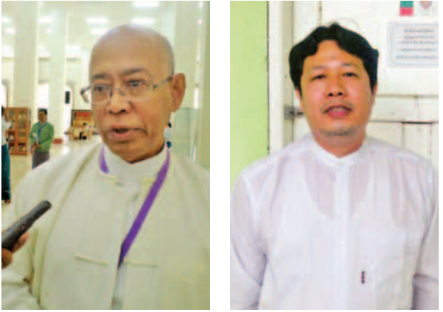
ဦးတင်အောင်ချို။

အဲဒီလိုဆွေးနွေးတယ်ဆိုတဲ့နေရာမှာ နိုင်ငံအသီးသီးက ဖိတ်ကြားထားတဲ့ သူတွေနဲ့ အတွေ့အကြုံတွေ ဖလှယ်ကြတယ်။ မရှင်းလင်းတာတွေရှိရင် အပြန်အလှန် မေးမြန်းဖြေကြားကြတယ်။ လူမျိုးတွေ၊ ဘာသာတွေ တွက်နေတာထက် လွှတ်တော်ကိုယ်စားလှယ်တွေအနေနဲ့ သူတို့ရဲ့လုပ်ငန်းတွေ ဘယ်လိုအမြန်ဆုံး ထိရောက်အောင် လုပ်ဆောင်နိုင်မလဲဆိုတာကိုပဲ ကြည့်ပါတယ်။ သူတို့ဆောင်ရွက်