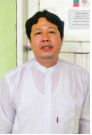
စိုင်းသီဟကျော်(ခ)စိုင်းဟပ်။