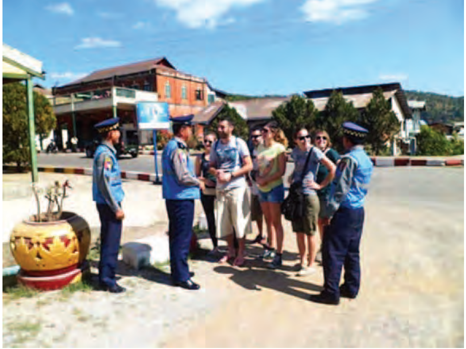
တပ်ဖွဲ့စု(ရှမ်း)က ကမ္ဘာလှည့်ခရီးသွားနိုင်ငံခြားသားများ၏ လုံခြုံရေးဆောင်ရွက်နေပုံ။

မြန်မာနိုင်ငံရေးအပြောင်းအလဲ အပါအဝင် မြန်မာ့ ပြုပြင်ပြောင်းလဲရေး ဒီလှိုင်းနှင့်အတူ မြန်မာ့ခရီးသွား လုပ်ငန်း၏ ဒီရေကလည်း တစ်နှစ်ထက်တစ်နှစ်ပို၍ မြင့်တက်လာသည်။ လာမည့် ၂၀၂၀ ခုနှစ်တွင် ကမ္ဘာလှည့် ခရီးသည် ခုနစ်သန်းကျော် ဝင်ရောက်နိုင်မည်ဟု သက်ဆိုင်ရာက ခန့်မှန်းထားရာ ကမ္ဘာလှည့်ခရီးသွား လုပ်ငန်း လုံခြုံရေးရဲတပ်ဖွဲ့၏လုပ်ငန်းတာဝန်ပမာဏမှာ ပို၍ပို၍ မြားမြောင်ကျယ်ပြန့်လာမည်ဖြစ်သကဲ့သို့ တပ်ဖွဲ့ ၏ကောင်းမြတ်သော ဂုဏ်သတင်းမှာလည်း ဖော်ပြပါ ဆောင်ရွက်ချက်အကြောင်းတရားများကြောင့် ကမ္ဘာလှည့် ခရီးသွားများနှင့် ကမ္ဘာ့အလယ်တွင် ပို၍ပို၍ သင်းယုံ့မွှေး ကြိုင်လာမည်ဖြစ်ကြောင်း သုံးသပ်တင်ပြလိုက်ရပါ သည်။