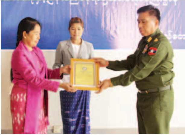
ဘေးအန္တရာယ်ဆိုင်ရာ စီမံခန့်ခွဲမှုလုပ်ငန်း လက်ခံ၍ ဂုဏ်ပြုမှတ်တမ်းလွှာ ကော်မတီဥက္ကဋ္ဌ ပြည်ထောင်စုဝန်ကြီး ဖြန့်လှူပေးအပ်ခဲ့ကြောင်း သိရ ဒေါက်တာ ဒေါ်မြတ်မြတ်အုန်းခင်က သည်။ (သတင်းစဉ်)

မီးဘေးသင့်ဒေသများ ပြန်လည် ထူထောင်ရေးအတွက် အလှူငွေ ပေးအပ်ပွဲအခမ်းအနားကို ဖေဖော်ဝါရီ ၁၉ ရက် မွန်းလွဲ ၂ နာရီတွင် လှူမှုဝန်ထမ်း၊ ကယ်ဆယ်ရေးနှင့် ပြန်လည်နေရာချထားရေး ဝန်ကြီးဌာန နေပြည်တော်၌ ကျင်းပရာ နမ့်ဆန်မြို့ မီးဘေးသင့်ပြည်သူများ အတွက် ကျပ်သိန်း ၁၈၀ နှင့် လပွတ္တာ မြို့ မီးဘေးသင့်ပြည်သူများအတွက် ကျပ်သိန်း ၁၂၀ စုစုပေါင်း ကျပ်သိန်း ၃၀၀ ကို တပ်မတော်(ကြည်း၊ ရေ၊ လေ) မိသားစုများကိုယ်စား တွဲဖက် စစ်ရေးချုပ် ဗိုလ်ချုပ်နေလင်းက ပေးအပ်ရာ အမျိုးသားသဘာဝ