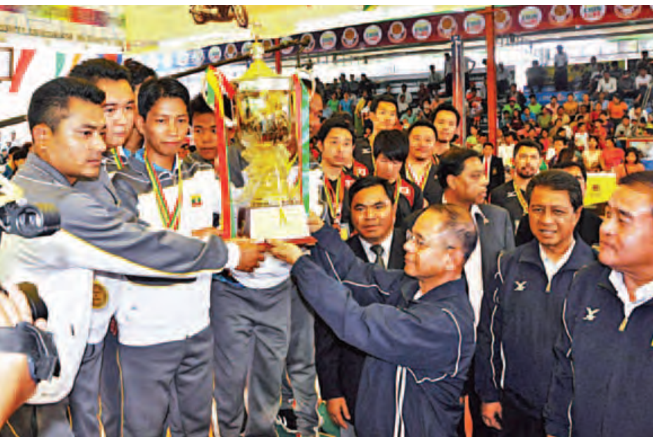
ခြင်းလုံးအဖွဲ့ချုပ်ဥက္ကဋ္ဌ မြန်မာနိုင်ငံ အမျိုးသမီးအားကစား အဖွဲ့ချုပ် ဒုတိယဥက္ကဋ္ဌ၊ အာရှပိုက်ကျော်ခြင်းအဖွဲ့ချုပ် ဥက္ကဋ္ဌနှင့် တာဝန်ရှိသူများက ပြိုင်ပွဲအသီးသီးတွင် ဆုရရှိ သည့်အသင်းများမှ အားကစားသမားများအားလည်း ကောင်း ဆုတံဆိပ်နှင့် တံခွန်စိုက်ဆုဖလားတို့ကို အသီးသီး ပေးအပ်ချီးမြှင့်ကြသည်။ အဆိုပါပြိုင်ပွဲကို ဖေဖော်ဝါရီ ၁၆ ရက်မှ ၁၉ ရက် အထိ ကျင်းပခဲ့ခြင်းဖြစ်ပြီး အာရှနိုင်ငံ ၁၂ နိုင်ငံမှ ပြိုင်ပွဲဝင် အားကစားသမားများ ပါဝင်ယှဉ်ပြိုင်ခဲ့ကြရာ အမျိုးသား သုံးယောက်တွဲ ပိုက်ကျော်ခြင်းပြိုင်ပွဲတွင် မလေးရှားအသင်း

အားကစားဝန်ကြီးဌာနနှင့် မန္တလေးတိုင်းဒေသကြီး အစိုးရအဖွဲ့တို့ကကြီးမား၍ အာရှခြင်းလုံးအဖွဲ့ချုပ်နှင့် မြန်မာနိုင်ငံပိုက်ကျော်ခြင်း၊ ရိုးရာခြင်းလုံးအဖွဲ့ချုပ်တို့ ပူးပေါင်းကာ မြန်မာနိုင်ငံတွင် အိမ်ရှင်အဖြစ် လက်ခံ ကျင်းပသည့် ၂၀၁၆ ခုနှစ် 2nd Asian Chinlone Championship & Sepaktakraw Friendly Match ပြိုင်ပွဲ ဆုချီးမြှင့်ပွဲအခမ်းအနားကို ယနေ့ ညနေ ၄ နာရီခွဲက အမရပူရမြို့နယ်ရှိ ဝေရာစုကျောက်စိမ်းစေတီတော်မြတ် ပရိဝုဏ်ရုံ မိုးလုံလေလုံအားကစားပြိုင်ကွင်း၌ ကျင်းပ သည်။