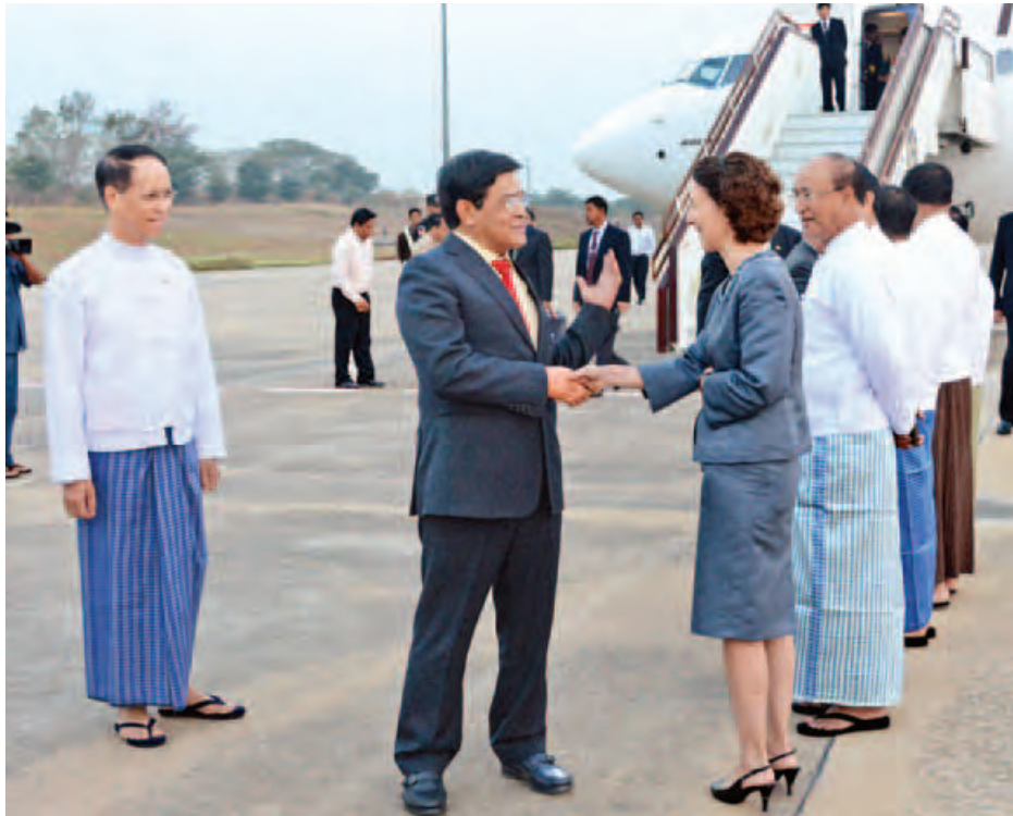
ဒုတိယသမ္မတဦးညွှန်ထွန်း အမေရိကန်-အာဆီယံခေါင်းဆောင်များ ထိပ်သီးအစည်းအဝေးတက်ရောက်ပြီး နေပြည်တော်သို့ ပြန်လည်ရောက်ရှိလာရာ တာဝန်ရှိသူများက နေပြည်တော်လေဆိပ်တွင် ကြိုဆိုနှုတ်ဆက်စဉ်။

သို့ဖြစ်၍ ရရှိထားပြီးသော တည်ငြိမ်အေးချမ်းမှု၊ စည်းလုံးညီညွတ်မှု၊ ဖွံ့ဖြိုးတိုးတက်မှုအခြေခံကောင်းများနှင့်အတူ ခေတ်မီဖွံ့ဖြိုးတိုးတက်သည့် ဒီမိုကရေစီနိုင်ငံတော်သစ်ဆီသို့ လျှောက်လှမ်းရာတွင် ချင်းပြည်နယ်အတွင်းရှိ တိုင်းရင်းသားပြည်သူများအားလုံးက ဝိုင်းဝန်းပူးပေါင်းဆောင်ရွက်သွားကြ ရန်တိုက်တွန်းလျက် သဝဏ်လွှာပေးပို့လိုက်ပါသည်။