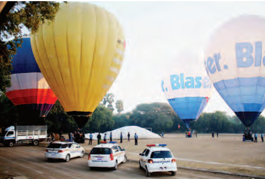
တပ်ဖွဲ့စု(ပုဂံ)က မီးပုံးပုံခရီးစဉ် လုံခြုံရေးဆောင်ရွက်မှု မှတ်တမ်းဓာတ်ပုံ။

တစ်နှစ်ထက်တစ်နှစ် တိုးတက် သို့နှင့် ရွှေနိုင်ငံသို့ ကမ္ဘာလှည့်ခရီးသွားများဝင်ရောက်မှုမှာလည်း ၂၀၁၁ ခုနှစ်နောက်ပိုင်းမှစပြု၍ တစ်နှစ်ထက်တစ်နှစ် တိုးတက်များပြားလာသည်။ ၂၀၁၁ ခုနှစ်တွင် သုည ဒသမ ၈ သန်း၊ ၂၀၁၂ ခုနှစ်တွင် ၁ ဒသမ ၅ သန်း၊ ၂၀၁၃ ခုနှစ်တွင် ၂ ဒသမ ၀၄ သန်း၊ ၂၀၁၄ ခုနှစ်တွင် ၃ ဒသမ ၀၈ သန်းနှင့် ၂၀၁၅ ခုနှစ်တွင် ၄ ဒသမ ၆၈ သန်းအထိ တိုးတက်ဝင်ရောက်လာကြောင်း သက်ဆိုင်ရာမှတ်တမ်းများအရ သိရသည်။