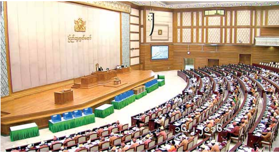
ဒုတိယအကြိမ် ပြည်သူ့လွှတ်တော် ပထမပုံမှန်အစည်းအဝေး ပဉ္စမနေ့ ကျင်းပစဉ်။ (သတင်းစဉ်)

ထို့နောက် ပြည်သူ့လွှတ်တော်ဥက္ကဋ္ဌ ဦးဝင်းမြင့်က နိုင်ငံတကာဆက်ဆံရေးကော်မတီ ဖွဲ့စည်းရေးနှင့်စပ်လျဉ်း