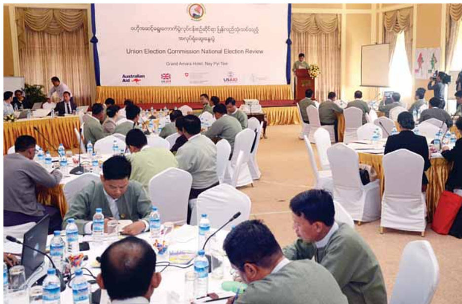
ရွေးကောက်ပွဲများကို ပိုမိုပြည့်စုံကောင်းမွန်သည့် ရွေးကောက်ပွဲများဖြစ်စေရန် အားနည်းချက်များကို ဖော်ထုတ်၍ မည်သို့ပြင်ဆင်ဆောင်ရွက်သင့်သည်ကို ပြန်လည်သုံးသပ်အကြံပြုကြရန်လိုကြောင်း၊ ၂၀၂၀ ပြည့်နှစ်

နေပြည်တော် ဖေဖော်ဝါရီ ၁၆ ပြည်ထောင်စုရွေးကောက်ပွဲ ကော်မရှင်နှင့် ရွေးကောက်ပွဲနှင့်သက်ဆိုင်သည့် ဝန်ကြီးဌာနများအကြား ရွေးကောက်ပွဲလွန်ကာလ ပြန်လည်သုံးသပ်ခြင်းဆိုင်ရာ အလုပ်ရုံဆွေးနွေးပွဲကို နေပြည်တော်ရှိ Grand Amara ဟိုတယ်၌ ယနေ့နံနက် ၉ နာရီတွင်ကျင်းပရာ(ယာပုံ) ပြည်ထောင်စုရွေးကောက်ပွဲကော်မရှင်ဥက္ကဋ္ဌ ဦးတင်အေးနှင့် ကော်မရှင်အဖွဲ့ဝင်များ၊ သက်ဆိုင်ရာဝန်ကြီးဌာနများမှ တာဝန်ရှိသူများနှင့် ပြည်ထောင်စုရွေးကောက်ပွဲကော်မရှင် ရုံးမှ တာဝန်ရှိသူများ တက်ရောက်ကြသည်။ ရွေးဦးစွာ ပြည်ထောင်စုရွေးကောက်ပွဲကော်မရှင် ဥက္ကဋ္ဌက အမှာစကားပြောကြားရာတွင် ၂၀၁၅ ခုနှစ် အထွေထွေရွေးကောက်ပွဲကို တည်ငြိမ်အေးချမ်းအောင်မြင် စွာ ကျင်းပနိုင်ခဲ့ခြင်းသည် သက်ဆိုင်ရာဝန်ကြီးဌာနများ၏ ပူးပေါင်းကူညီဆောင်ရွက်မှုကြောင့်ဖြစ်ကြောင်း၊ ရွေး ကောက်ပွဲကာလအတွင်း ရွေးကောက်ပွဲဆိုင်ရာလုံခြုံရေး ကော်မတီနှင့် ရွေးကောက်ပွဲဆိုင်ရာစေတနာ့ဝန်ထမ်းရေး ကော်မတီတို့ကို ဖွဲ့စည်းဆောင်ရွက်နိုင်ခဲ့ခြင်းသည် ရွေးကောက်ပွဲတည်ငြိမ်အေးချမ်းရေးအတွက် များစွာ အကျိုးကျေးဇူးရရှိခဲ့ကြောင်း၊ နောင်ကျင်းပမည့်