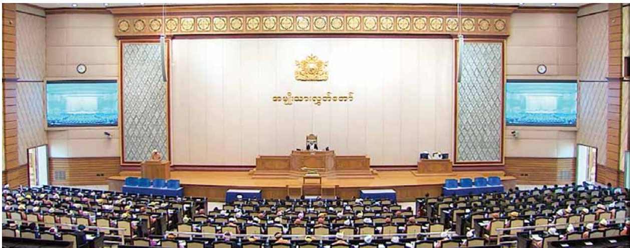
ဒုတိယအကြိမ် အမျိုးသားလွှတ်တော်ပထမပုံမှန်အစည်းအဝေး ပဉ္စမနေ့ ကျင်းပစဉ်။ (သတင်းစဉ်)

ဆက်လက်၍ အမျိုးသားလွှတ်တော်ဥက္ကဋ္ဌက အစိုးရမဟုတ်သော ပြည်တွင်း ပြည်ပ အဖွဲ့အစည်းများဆိုင်ရာကော်မတီကို ကော်မတီဥက္ကဋ္ဌအဖြစ် ပဲခူးတိုင်း