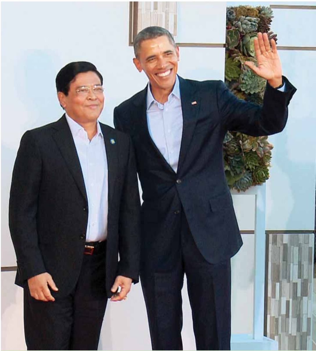
ဒုတိယသမ္မတ ဦးညွှန်ထွန်းအား အမေရိကန်သမ္မတ ဘားရက် အိုဘားမားက ခင်မင်ရင်းနှီးစွာ ကြိုဆိုနှုတ်ဆက်ပြီး မှတ်တမ်းတင်ဓာတ်ပုံရိုက်ကြစဉ်။ (သတင်းစဉ်)

ယခု ထိပ်သီးအစည်းဝေးကို အမေရိကန်နိုင်ငံတွင် ပထမဆုံးကျင်းပနိုင်သည့် အခြေအနေမှတစ်ဆင့် အမေရိကန်-အာဆီယံဆက်ဆံရေးကို ပိုမိုတိုးမြှင့်နိုင်ရေး၊ တစ်ခုတည်းသော အာဆီယံစီးပွားရေးအသိုက်အဝန်းတွင် အပြည့်အဝပါဝင်နိုင်ရေးအတွက် မြန်မာနိုင်ငံ၏ ကြိုးပမ်းဆောင်ရွက်မှုအခြေအနေ၊ မြန်မာနိုင်ငံမှ အသေးစားနှင့် အလတ်စား စီးပွားရေးလုပ်ငန်းရှင်များအနေဖြင့် အာဆီယံ စီးပွားရေးအသိုက်အဝန်းတွင် ပေါ်ပေါက်လာသည့် အခွင့်အလမ်းများကို အသုံးပြုပြီး အခြားအဖွဲ့ဝင်နိုင်ငံများမှ စီးပွားရေးလုပ်ငန်းရှင်များနည်းတူ နိုင်ငံတကာဈေးကွက်တွင် ယှဉ်ပြိုင်နိုင်ရေး ကြိုးပမ်းဆောင်ရွက်မှုများ ဆွေးနွေး။