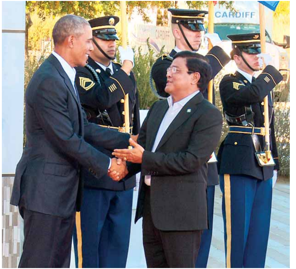
ဒုတိယသမ္မတ ဦးညွှန်ထွန်းအား အမေရိကန်သမ္မတ ဘားရက်အိုဘားမားက ခင်မင်ရင်းနှီးစွာ ကြိုဆိုနှုတ်ဆက်စဉ်။ (သတင်းစဉ်)

ညပိုင်းတွင် ဒုတိယသမ္မတ ဦးညွှန်ထွန်းသည် အာဆီယံနိုင်ငံများမှ အကြီးအကဲများ၊ အစိုးရအဖွဲ့အကြီးအကဲများနှင့်အတူ အမေရိကန်သမ္မတ ဘားရက်အိုဘားမားက အမေရိကန်-အာဆီယံ ခေါင်းဆောင်များ ထိပ်သီးအစည်းအဝေးသို့ တက်ရောက်လာကြသည့် ခေါင်းဆောင်များအား တည်ခင်းဧည့်ခံသည့် ညစာစားပွဲသို့ တက်ရောက်သည်။ (သတင်းစဉ်)