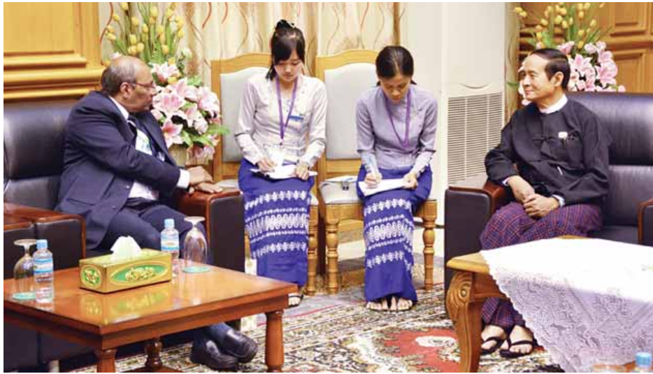
ပြည်သူ့လွှတ်တော်ဥက္ကဋ္ဌ ဦးဝင်းမြင့် အိန္ဒိယသမ္မတနိုင်ငံ သံအမတ်ကြီး H.E. Mr. Gautam Mukhopadhaya အား လက်ခံတွေ့ဆုံစဉ်။ (သတင်းစဉ်)