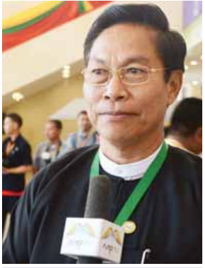
ပြည်ထောင်စုဝန်ကြီး ဦးအုန်းမြင့်