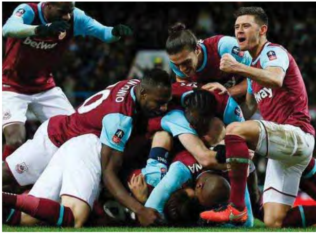
တစ်ပွဲဖြစ်ပြီး နောက်ဆုံးမိနစ်ရောက်မှ အနိုင်ဂိုးသွင်းယူနိုင်ခဲ့တာကလည်း တကယ့်ကို စိတ်လှုပ်ရှားစရာကောင်းလှပါတယ်” ဟု ဘီလစ်ဂျူက ပြောကြားခဲ့သည်။

အက်ဖ်အေပလား စတုတ္ထအဆင့်တွင် ဝက်စ်ဟမ်းက လီဟာပူးအား နှစ်ဂိုး-တစ်ဂိုးဖြင့် အနိုင်ရရှိခဲ့ပြီး ပဉ္စမအဆင့်သို့ တက်ရောက်နိုင်ခဲ့ခြင်းမှာ ဝက်စ်ဟမ်းအသင်းအတွက် ကြီးမားသည့်အောင်မြင်မှု ဖြစ်ကြောင်း ဝက်စ်ဟမ်း နည်းပြ ဘီလစ်ဂျူက ပြောကြားလိုက်သည်။