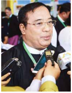
ဒေါက်တာလှမြင့်

၂၀၁၁ ခုနှစ် အစိုးရစတင်ကတည်းက ငြိမ်းချမ်းရေး လုပ်ဆောင်ခဲ့တာဖြစ်ပါ တယ်။ အခုဆိုရင် ငါးနှစ်ထဲ ရောက်ရှိ ခဲ့ပြီးတော့ ဒီကာလမှာ ကြီးစားပြီး တိုင်းရင်းသားလက်နက်ကိုင်အဖွဲ့ အစည်းတွေနဲ့ အန်စီအေလက်မှတ် ရေးထိုးနိုင်ခဲ့ပါတယ်။ ဒီအပေါ်မှာ မူတည်ပြီး မူဘောင်တွေ ရေးဆွဲနိုင်ခဲ့ တယ်။ ပြီးတော့ ပြည်ထောင်စု ငြိမ်းချမ်းရေးညီလာခံ လုပ်ဆောင်ခဲ့ တယ်။ ဒါတွေအားလုံးဟာ တောက် လျှောက် ဆောင်ရွက်ခဲ့တာဖြစ်ပါတယ်။ ငြိမ်းချမ်းရေးကတော့ ဒီနေရာမှာ ရပ်ထားလို့ မရပါဘူး။ ဆက်ပြီးတော့ လုပ်ဆောင်ရမှာဖြစ်ပါတယ်။ ဘယ် အစိုးရပဲတတ်တက် လူတိုင်းမှာ တာဝန်ရှိပါတယ်။ ဘယ်သူပဲဖြစ်ဖြစ် ဆက်လက်ပြီးတော့ လုပ်ဆောင်သွား ရမှာပါ။