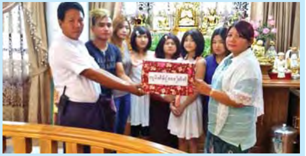
ရန်ကုန်မြို့ ဒေါ်ပုံမြို့နယ် သာသနာ့ပံ့ပိုးမှုဌာနမှ အသင်းအဖွဲ့ဝင်များက အသက်ကယ်ဆယ်ရေးအဖွဲ့ (RESUCE) မှ သင်တန်းနည်းပြ ၂၅ ဦးတို့ကို ဖေဖော်ဝါရီ ၇ ရက် မွန်းလွဲ ၁ နာရီက ကျင်းပရာ ရွှေမြင့်မိုရ်ကျောင်း ဆရာတော်နှင့် မြို့နယ်အုပ်ချုပ်ရေးမှူးတို့က သင်တန်းဆင်းအမှာစကား ပြောကြားခဲ့သည်။

ချောင်းဆုံ ဖေဖော်ဝါရီ ၁၀ မွန်ပြည်နယ်၊ ချောင်းဆုံမြို့နယ် ရွှေမြင့်မိုရ်ကျောင်း၌ ရွှေမြင့်မိုရ်နာရေးကူညီမှုအသင်းနှင့် မြန်မာနိုင်ငံလူမှုကယ်ဆယ်ရေးအဖွဲ့ (မြဝတီ) တို့ ပူးပေါင်းပြီး အရေးပေါ်ကယ်ဆယ်ရေးနှင့် အသက်ကယ်သင်တန်းဆင်းပွဲ ဆုပေးပွဲကို ဖေဖော်ဝါရီ ၇ ရက် မွန်းလွဲ ၁ နာရီက ကျင်းပရာ ရွှေမြင့်မိုရ်ကျောင်း ဆရာတော်နှင့် မြို့နယ်အုပ်ချုပ်ရေးမှူးတို့က သင်တန်းဆင်းအမှာစကား ပြောကြားခဲ့သည်။ သင်တန်းတွင် သဘာဝဘေးန္တရာယ်နှင့် ယာဉ်တိုက်မှုဖြစ်ပွားလာပါက အချိန်မီ အသက်ကယ်ဆယ်နိုင်ရန်အတွက် နိုင်ငံတကာအဆင့်မီ အရေးပေါ် အသက်ကယ်ဆယ်ရေးနည်းဖြင့် မြန်မာနိုင်ငံလူမှုကယ်ဆယ်ရေးအဖွဲ့ (RESUCE) မှ သင်တန်းနည်းပြ ၂၅ ဦးတို့က ငါးရက်ကြာ စာတွေ့လက်တွေ့ သင်ကြားပေးခဲ့ရာ သင်တန်းသား၊ သင်တန်းသူ ၇၀ တက်ရောက်ခဲ့ကြောင်း သိရသည်။ ဇူးဆီမ် (IPRD)