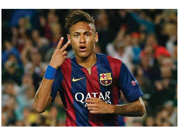
ကြောင်းလည်း သိရသည်။ ထို့ကြောင့် တိုက်စစ်မှူး နေမာသည် ဘာစီလိုနာ၏ ဒုတိယဦးစားပေးအဆင့်သာရှိသည့် တိုက်စစ်မှူးဟုလည်း သတင်းများတွင် ဖော်ပြကြသည်။

ပရီမီယာလိဂ်၏ မန်ချက်စတာမြို့ခံပြိုင်ဘက် နှစ်သင်းဖြစ်သည့် မန်စီးတီး အသင်းနှင့် မန်ယူအသင်းတို့သည် ဘာစီလိုနာအသင်းမှ ဘရာဇီးတိုက်စစ်မှူး နေမာအား ခေါ်ယူရန် အပြိုင်ကြိုးပမ်းလျက်ရှိကြောင်း သိရသည်။