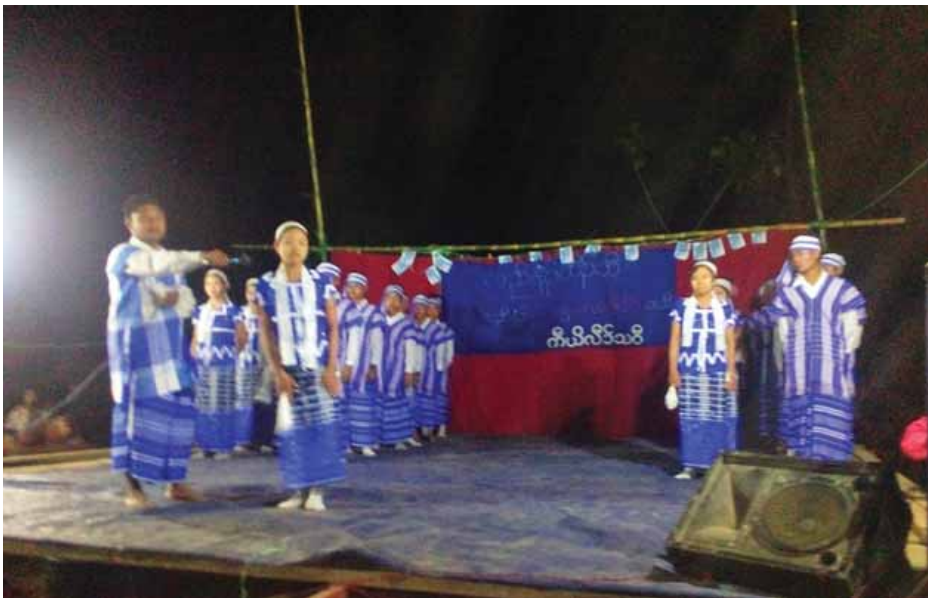
စဉ်ဆက်မပြတ် ကျင်းပလာတာကြာပါပြီ။ မြို့နယ်အဆင့် တာဝန်ရှိသူတွေကို ဖိတ်ကြားပြီး ကရင်ရိုးရာစားသောက်ဖွယ်ရာတွေ ရိုးရာဓလေ့

ပဲခူးတိုင်းဒေသကြီး အတွင်းရှိ ကျောက်တံခါး၊ ဖြူး၊ ကျောက်ကြီးမြို့နယ်များတွင် ဖေဖော်ဝါရီလအတွင်း၌ ကရင်တိုင်းရင်းသားများ၏ နွယ်သစ်ကူးပွဲတော်ကို စည်ကားသိုက်မြိုက်စွာ ကျင်းပလှုပ်ရှားကြောင်း သိရသည်။ “နွယ်သစ်ကူးပွဲတော်ပါ။ နွယ်သစ်ကူးပွဲတော်လှည့်ဆန်း ၁ ရက်ရောက်တိုင်း ကျွန်တော်တို့ ဖြူးမြို့နယ် ဖျဉ်းမပင်ကျေးရွာမှာ ကျင်းပတာပါ။ ကျောက်တံခါးမြို့နယ်မှာကတော့ ဖခိုမြို့မှာ ကျင်းပပါတယ်။ ကျောက်ကြီးမြို့နယ်မှာလည်း လုပ်ပါတယ်။ ရိုးရာဓလေ့ထုံးတမ်းအစဉ်အလာများအတိုင်း ကရင်ရိုးရာအမွေအနှစ်တွေကို မျိုးဆက်သစ်လူငယ်တွေကို လက်ဆင့်ကမ်းပေးတဲ့သဘောပါ”ဟု ကရင်အမျိုးသားစောနီခွဲက ပြောသည်။ “ကျွန်တော်တို့ ဖခိုမှာကတော့