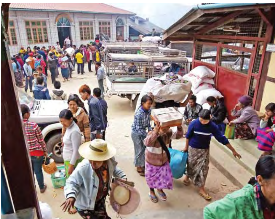
ယခုကဲ့သို့ အနယ်နယ်အရပ်ရပ်မှ စေတနာရှင်များကားကြီးကားငယ်အသွယ်သွယ်ဖြင့် တောင်တန်းကြီးများကို ကျော်ဖြတ်ကာ ဝေးလံသောအရပ်ဒေသများမှ လာရောက်ကူညီလှူဒါန်းကြသည့်အတွက် မိမိတို့အိမ်ရာများ မီးသင့်သွားလင့်ကစား ကျေးဇူးတင်ဝမ်းမြောက်ပါကြောင်း မီးလောင်ပြင်ကိုရှင်းလင်းနေသည့် အိမ်ရှင်ပလောင်တိုင်းရင်းသူနှစ်ဦးက ပြောသည်။ လက်ဖက်အိမ်ကထွက်ရှိသော နှစ်ဆန်မြို့နယ်တွင် လက်ဖက်ပွဲရုံအချို့သာမီးလောင်ကျွမ်းခဲ့ပြီး လက်ဖက်ခြံများသို့ မီးကူးစက်လောင်ကျွမ်းခြင်းမရှိ၍ လက်ဖက်အထွက်ကျဆင်းခြင်းမရှိကြောင်းသိရသည်။