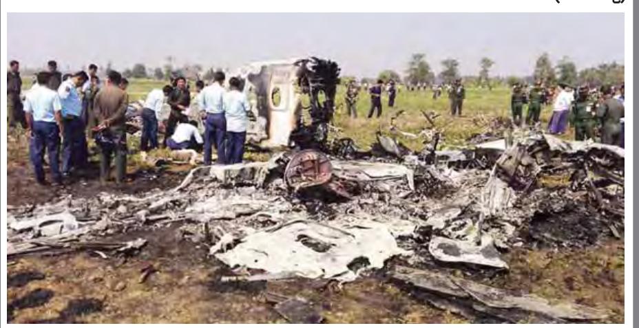
တပ်မတော်လေယာဉ်တစ်စင်း နေပြည်တော်လေဆိပ်အနီး၌ ပျက်ကျမီးလောင်ပြီးနောက် ကျန်ရှိသည့် အစိတ်အပိုင်းများကို တွေ့ရစဉ်။ (သတင်းစဉ်)

တပ်မတော်(လေ)မှ BEECH-1900 D အမျိုးအစား အလတ်စားသယ်ယူပို့ဆောင်ရေးလေယာဉ် တစ်စင်းသည် ပုံမှန်စစ်ဆေးသပ်ယူသန့်မှု (Flight Check) ပြုလုပ်ရန် ယနေ့နံနက် ၉ နာရီ ၄၅ မိနစ်တွင် နေပြည်တော် လေဆိပ်မှ ပျံတက်စဉ် စက်ချွတ်ယွင်း၍ နေပြည်တော်လေဆိပ်အနီး၌ ပျက်ကျပြီး မီးလောင်ပျက်စီးခဲ့သည်။ အဆိုပါ လေယာဉ်သည် နေပြည်တော်လေဆိပ် လေယာဉ်ပြေးလမ်း၏ မြောက်ဘက်ထိပ်မှ ပေ ၂၀၀၀ ခန့် အကွာ လယ်ဝေးမြို့နယ် သဲကောကျေးရွာနှင့် ကြံခင်းကျေးရွာအနီးရှိ လယ်ကွင်းအတွင်းသို့ ပျက်ကျ၍ မီးလောင် ကျွမ်းခဲ့သဖြင့် နေပြည်တော်လေဆိပ်မှ တာဝန်ရှိသူများ၊ မီးသတ်တပ်ဖွဲ့ဝင်များ၊ နေပြည်တော်တိုင်းစစ်ဌာနချုပ် တိုင်းမှူးနှင့် တာဝန်ရှိသူများ၊ တပ်မတော်(လေ)မှ အရာရှိ စစ်သည်များသည် ဒေသခံပြည်သူများနှင့်အတူ ပူးပေါင်း၍ မီးငြိမ်းသတ်ခဲ့ကြပြီး လေယာဉ်မီးလောင်ပျက်စီးမှု အခြေအနေအား ကာကွယ်ရေးဦးစီးချုပ်(လေ) ဗိုလ်ချုပ်ကြီး ခင်အောင်မြင့်နှင့် အဖွဲ့လည်း ကြည့်ရှုစစ်ဆေးသည်။ ဖြစ်စဉ်တွင် လေယာဉ်ပေါ်၌ လိုက်ပါလာသည့် တပ်မတော်(လေ)မှ လေသူရဲဗိုလ်မှူး တစ်ဦး၊ တွဲဖက်လေသူရဲ ဗိုလ်ကြီး နှစ်ဦးနှင့် လေယာဉ်အဖွဲ့သား အုပ်ခွဲတပ်ကြပ်ကြီး တစ်ဦး ပေါင်းလေးဦးသေဆုံးပြီး လေယာဉ်အဖွဲ့သား ဒုတိယတပ်ကြပ်တစ်ဦးမှာ ဒဏ်ရာရရှိခဲ့သဖြင့် နေပြည်တော် တပ်မတော်ဆေးရုံကြီးသို့ ပို့ဆောင်ကုသမှုခံယူစဉ် မွန်းတည့် ၁၂ နာရီခန့် တွင် ရရှိဒဏ်ရာဖြင့် သေဆုံးခဲ့သည်။ အဆိုပါ လေယာဉ်ပျက်ကျခြင်း အကြောင်းအရင်းနှင့်ပတ်သက်၍ လေယာဉ်တွင်ပါရှိသည့် Cockpit Voice Recorder(CVR) နှင့် Flight Data Recorder(FDR) တို့မှတစ်ဆင့် စုံစမ်းဖော်ထုတ်နိုင်ရေး ဆောင်ရွက်လျက် ရှိကြောင်း ကာကွယ်ရေးဝန်ကြီးဌာနမှ သတင်းရရှိသည်။