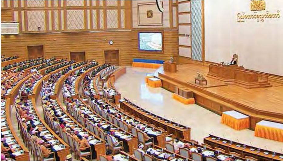
ဒုတိယအကြိမ် ပြည်ထောင်စုလွှတ်တော် ပထမပုံမှန်အစည်းအဝေး တတိယနေ့ ကျင်းပစဉ်။