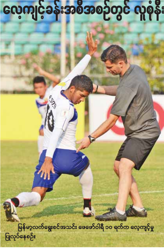
မြန်မာ့လက်ရွေးစင်အသင်း ဖေဖော်ဝါရီ ၁၀ ရက်က လေ့ကျင့်မှု ပြုလုပ်နေစဉ်။