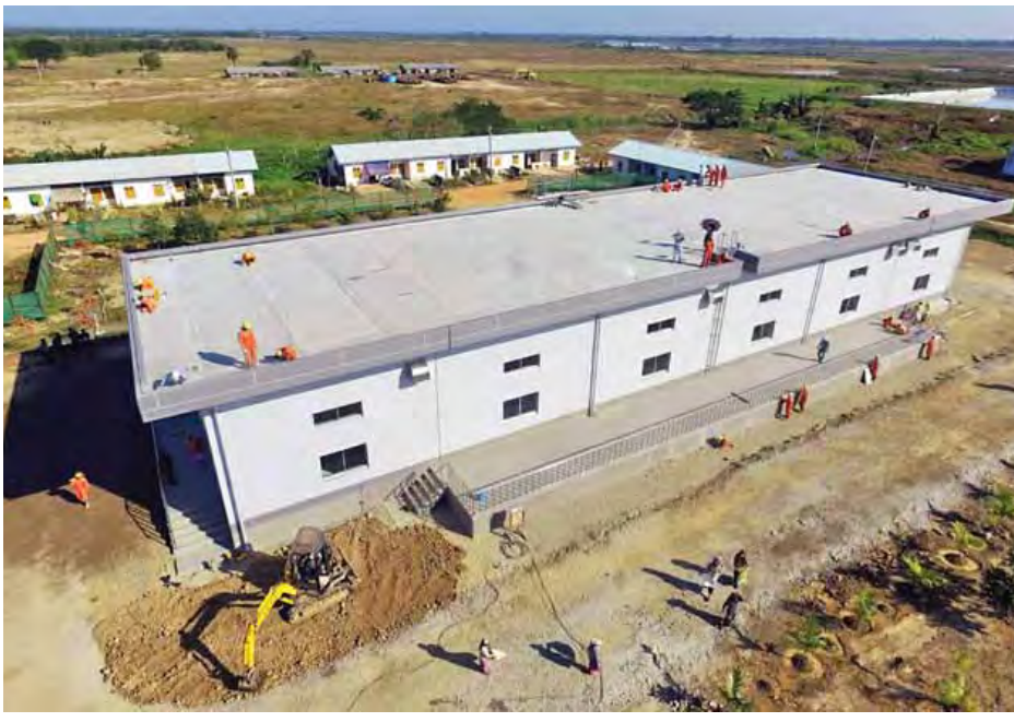
ငမိုးရိပ်ရေသန့်စင်စက်ရုံ(ညောင်နှစ်ပင်)ရှိ ရေတွန်းစက်ရုံအား တွေ့ရစဉ်။

ရွှေဖုံးမှ စီမံကိန်းအဆင့် နှစ်ဆန်မြို့ ဆောင်ရွက်ခဲ့ရာ စီမံကိန်းပထမအဆင့်ကို ၂၀၀၄ ခုနှစ် ဧပြီ ၂၅ ရက်တွင် စတင်ဆောင်ရွက်ပြီး ၂၀၀၅ ခုနှစ် ဒီဇင်ဘာ ၂၃ ရက်တွင် ပြီးစီးကာ တစ်နေ့လျှင် ရေဂါလန် ၄၅ သန်း ပေးဝေခဲ့သဖြင့် ရန်ကုန်မြို့အား တစ်နေ့လျှင် ရေဂါလန် ၁၆၀ အထိ တိုးမြှင့်ဖြန့်ဖြူးနိုင်ခဲ့သည်။ ငမိုးရိပ်ရေသန့်စင်စက်ရုံ(ညောင်နှစ်ပင်) စီမံကိန်းဒုတိယအဆင့်ကို ၂၀၀၆ ခုနှစ် ဖေဖော်ဝါရီ ၉ ရက်တွင် စတင်ဆောင်ရွက်ခဲ့ပြီး ၂၀၁၃ ခုနှစ် မတ် ၂၆ ရက်တွင် ပြီးစီး၍ တစ်နေ့လျှင် ရေဂါလန် ၄၅ သန်း ပေးဝေခဲ့သည့်အခါ ရန်ကုန်မြို့တော်အား တစ်နေ့လျှင် ရေဂါလန် ၂၀၅ သန်းထိ ထပ်မံဖြည့်တင်းပေးနိုင်ခဲ့သည်။ လှည်းကူးမြို့နယ်ရှိ ငမိုးရိပ်ဆည်မှ ၂၁ ဒသမ ၄၅ မိုင်ရှည်သော ရေခေါ်တူးမြောင်းများဖြင့် ငမိုးရိပ်ရေသန့်စင်စက်ရုံ (ညောင်နှစ်ပင်)သို့ အဆင့်ဆင့် သွယ်ခဲ့သည်။ ယင်းရေသန့်စင်စက်ရုံမှ တစ်ဆင့် ရန်ကုန်အရှေ့ပိုင်းခရိုင်၊ တောင်ပိုင်းခရိုင်နှင့် အနောက်ပိုင်းခရိုင်တို့ရှိ မြို့နယ်များသို့ ရေအားဖြည့်ပေးဝေခဲ့သည်။ ထို့ပြင် ရန်ကုန်စည်ပင်သာယာနယ်နိမိတ်အတွင်း ရေအားနည်းသော