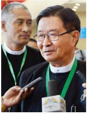
ပြည်ထောင်စုဝန်ကြီး ဦးအောင်မင်း