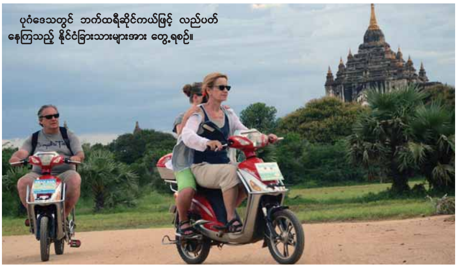
ပုဂံဒေသတွင် ဘက်ထရီဆိုင်ကယ်ဖြင့် လည်ပတ် နေကြသည့် နိုင်ငံခြားသားများအား တွေ့ရစဉ်။

၁၀၀၀ ကျော်တို့ဖြင့် ဝန်ဆောင်ပေး လျက်ရှိရာ အခြားအသင်းအဖွဲ့များ ရှိသော်လည်း E-Bike အသင်းမှာ ယခုမှ စတင်ဖွဲ့စည်းနိုင်ရန် ဆွေးနွေး ကြခြင်းဖြစ်သည်။ E-Bike ဆိုင်ကယ် အငှား ဝန်ဆောင်မှုများကို ပုဂံရှေးဟောင်း ယဉ်ကျေးဒေသတွင် ညောင်ဦး၊ ပုဂံ မြို့ဟောင်းမြို့သစ်၊ ဝက်ကျင်းအင်း နေရာများတွင်ငှားရမ်းနိုင်ပြီး တစ်ရက် ငှားရမ်းခ ယခင်က ငွေကျပ် ၁၀၀၀၀ ကျော်မှ ယခုနှစ်တွင် ငွေကျပ် ၈၀၀၀ ခန့်ဖြင့်သာ ငှားရမ်းပြီး ပုဂံဒေသအနှံ့ စိတ်တိုင်းကျ လည်ပတ်ကြည်ရွ