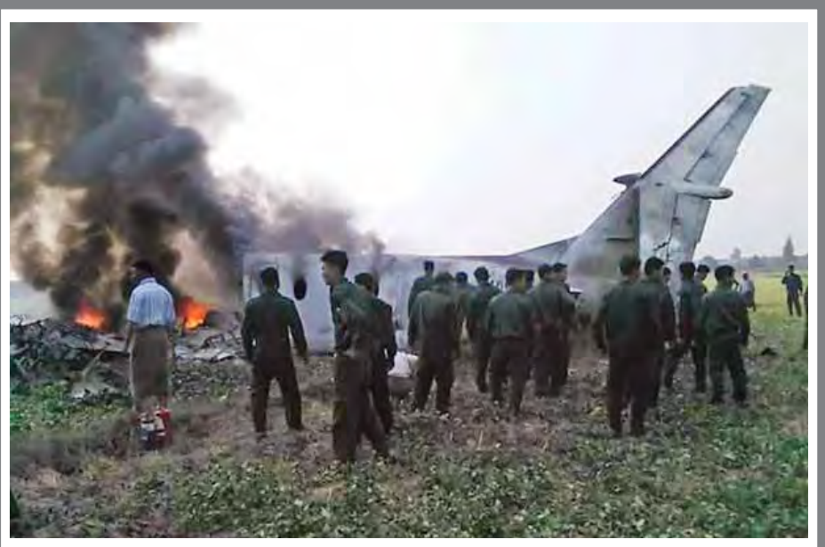
တပ်မတော်(လေ)မှ BEECH-1900D အမျိုးအစား အလတ်စားသယ်ယူပို့ဆောင်ရေးလေယာဉ် ပျက်ကျပြီး မီးလောင်နေစဉ်။

တဲ့ အခြေအနေတွေ သိပါရစေ။ ဖြေ။ ။ ဘရာဇီးနိုင်ငံမှာ ဇီကာဗိုင်းရပ်စ်ရောဂါ ကူးစက်ခံရတဲ့ မိခင်တွေကနေ ဦးနှောက်နဲ့ ဦးခေါင်း သေးငယ်တဲ့ ကလေးငယ်တွေမွေးဖွားပြီး ရောဂါကူးစက်ခံရ သူတွေမှာ အာရုံကြောဆိုင်ရာ ရောဂါဖြစ်ပွားမှုတွေ များပြားလာတဲ့ အတွက် ကမ္ဘာ့ကျန်းမာရေးအဖွဲ့က ကျန်းမာရေးဆိုင်ရာ အရေးပေါ် ပြဿနာတစ်ရပ်အဖြစ် သတ်မှတ်ဆောင်ရွက်ဖို့ ၂၀၁၆ ခုနှစ် ဖေဖော်ဝါရီ ၁ ရက် က ထုတ်ပြန်ကြေညာခဲ့တယ်။ မြန်မာနိုင်ငံမှာလည်း စာမျက်နှာ ၉ ကော်လံ ၁ သို့