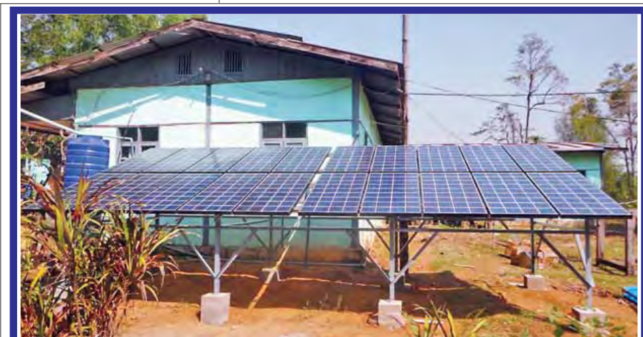
ကရင်ပြည်နယ် ကော့ကရိတ်ခရိုင် ကျိုက်ခွဲမြို့ တိုက်နယ်ဆေးရုံမီးလင်းရေးအတွက် နေရောင်ခြည်စွမ်းအင်သုံး ဆိုလာပြားနှင့်ဆက်စပ်ပစ္စည်းများကို ဂျပန်နိုင်ငံ BHA အဖွဲ့၏ လှူဒါန်းမှုဖြင့် ဆေးရုံနှင့် ဝန်ထမ်းအိမ်ရာများကို စတင်၍ ဆိုလာစနစ်ဖြင့် မီးလင်းခဲ့ပြီးဖြစ်ကြောင်း သိရသည်။ မြို့နယ်(ပြန်/ဆက်)