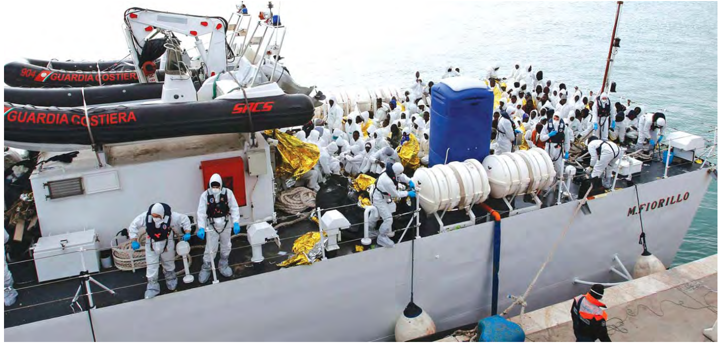
လူမှောင်ခို မော်တော်ဘုတ်ပေါ် လိုက်ပါလာသူများကို ကယ်တင်ပေးခဲ့သော အီတလီ ကမ်းရိုးတန်းစောင့်တပ်ဖွဲ့သင်္ဘော စစ္စလီကျွန်းသို့ ဆိုက်ရောက်လာသည့် မှတ်တမ်းပုံ။

စုံစမ်းစစ်ဆေးရေးမှူးများက ပြောကြသည်။ ခြုံငုံသုံးသပ်လျှင် အမေရိကန်နိုင်ငံအတွင်း၌ အိုင်အက်စ်၏ ဝါဒသဘောတရားရေးရာ မှိုင်းမိနေသူများရှိတန်ရာသည်ဟု ဆိုနိုင်ပေလိမ့်မည်။ ၂၀၁၄ ခုနှစ် ဇွန်လတွင် အစ္စလာမ္မစ်နိုင်ငံတော် ထူထောင်ကြောင်း အိုင်အက်စ်အဖွဲ့က တစ်ဖက်သတ်ထုတ်ပြန်ကြေညာခဲ့ချိန်နောက်ပိုင်း ကမ္ဘာ့နိုင်ငံ ၂၀ တွင် အကြမ်းဖက်တိုက်ခိုက်မှု ၆၀ ကျော် ပြုလုပ်နိုင်ရန် ယင်းအဖွဲ့က စီစဉ်ညွှန်ကြားခြင်း၊ သို့မဟုတ် ဝါဒသဘောတရားရေးအရ မှိုင်းတိုက်ခြင်းတို့ရှိသည်ဟု ကျွန်ုပ်လေ့လာသိရှိရလေသည်။ ယနေ့ကာလတွင် ကမ္ဘာ့နိုင်ငံများအနေဖြင့် အကြမ်းဖက်မှုပြဿနာ ဖိစီးခံနေရသည်။ မျက်ကန်း အမျိုးသားရေးဝါဒီ နာဇီတို့ကြောင့် ကမ္ဘာကြီးတစ်ခုလုံး မှောက်ခဲ့ရသည်ကို ကျွန်ုပ်တို့ သင်ခန်းစာရရှိခဲ့ကြပြီးဖြစ်ပါသည်။ အစွန်းရောက်သမားများသည် ကမ္ဘာကြီးတစ်ခုလုံးကို ဘေးဥပဒ်ပေးနိုင်ကြောင်း ကျွန်ုပ်တို့ အစဉ်သတိမူကြရပေလိမ့်မည်။ အစွန်းရောက်သမားများသည်ကား လောက၏အလှကို ဖျက်ဆီးတတ်သူများဖြစ်ကြလေသည်။ ဤလူ့ဘုံတွင် အကောင်းနှင့်အဆိုး ခွန်တွဲနေတတ်သည်မှာ ဓမ္မတာဖြစ်သည်။ လူသား အကျိုးပြုသူအဖြစ် ရပ်တည်နိုင်ရန် အမြဲထာဝစဉ် အကောင်းအဆိုး၊ အကြောင်းအကျိုး ဝေဖန်ပိုင်းခြားတတ်ရပေမည်။ အစွန်းရောက်မှုသည် မိမိဘဝအတွက်၊ မိမိပတ်ဝန်းကျင်အတွက်၊ မိမိနိုင်ငံအတွက်၊ မိမိကမ္ဘာကြီးအတွက် အဆိပ်အတောက်များဖြစ်ပေရာ 'ဟုတ်သောအကြံ၊ မှန်သောအကျင့်၊ သင့်သောအယူ၊ ဖြူသောနှလုံး' သူတော်ထုံး' ကို လိုက်နာကျင့်သုံးအပ်သည်ဟု ကျွန်ုပ်တို့တွေးတောဆင်ခြင်မိပါသတည်း။ ။