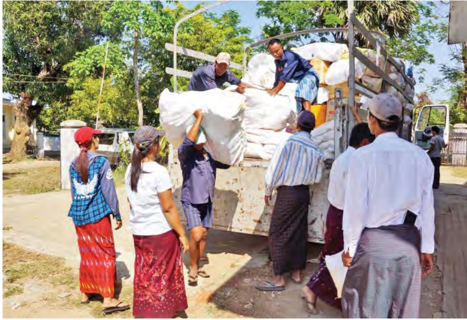
အတွက် ငွေကျပ်သိန်း ၁၀၀၊ အားကစားဝန်ကြီးဌာနမှ အနွေးဝတ်စုံ ၂၁၇ ထည်၊ တီရှပ် ၆၆၆၆ ထည်၊ အားကစား အင်္ကျီ ၁၀၈၉ ထည်တို့ကို အမျိုးသားသဘာဝဘေးအန္တရာယ် ဆိုင်ရာ စီမံခန့်ခွဲမှုကော်မတီ၊ လူမှုဝန်ထမ်း၊ ကယ်ဆယ်ရေး

ထိုသို့လှူဒါန်းလျက်ရှိရာ ယနေ့တွင် မွေးမြူရေး၊ ရေလုပ်ငန်းနှင့် ကျေးလက်ဒေသဖွံ့ဖြိုးရေးဝန်ကြီးဌာနမှ လပွတ္တာမြို့ မီးဘေးသင့်ပြည်သူများအတွက် ငွေကျပ် ၃၃ သိန်း၊ ယမ်ယမ်ကြာဆံထုပ် ၃၀ ပါ အထုပ် ၃၀၊ ယမ်ယမ် ခေါက်ဆွဲထုပ် ၃၀ ပါ အထုပ် ၇၀ နှင့် နမ့်ဆန်မီးဘေးသင့် ပြည်သူများအတွက် ငွေကျပ် ၄ ဒသမ ၄၅သိန်း၊ ရေသန့် တစ်လီတာဘူး ၄၉၅၀၊ ခေါက်ဆွဲခြောက်ထုပ် ၇၃၈၀၊ အမျိုးသမီးဝတ်အင်္ကျီ အထည် ၂၀၊ ပုဆိုး ၁၈ ထည်၊ လုံချည် ၆၀ ထည်၊ ယမ်ယမ်ကြာဆံထုပ် ၃၀ပါ အထုပ် ၅၀၊ ယမ်ယမ်ခေါက်ဆွဲထုပ် ၃၀ ပါ ၄၆ ထုပ်တို့ကို ပေးပို့ လှူဒါန်းခဲ့ပြီး သိပ္ပံနှင့်နည်းပညာဝန်ကြီးဌာန ဝန်ကြီးရုံးမှ အလှူငွေကျပ် ၄၆သိန်း၊ ဆက်သွယ်ရေးနှင့်သတင်းအချက် အလက်နည်းပညာဝန်ကြီးဌာန မြန်မာ့ဆက်သွယ်ရေး လုပ်ငန်းမှ နမ့်ဆန်မြို့ မီးဘေးသင့်ပြည်သူများအတွက် ငွေကျပ်သိန်း ၁၀၀ နှင့် လပွတ္တာမြို့ မီးဘေးသင့်ပြည်သူများ