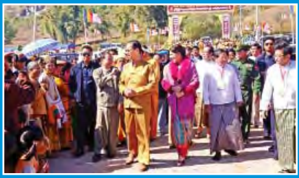
သတင်း စာမျက်နှာ- ၃