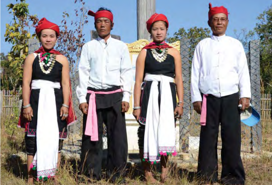
ကယားတိုင်းရင်းသား၊ တိုင်းရင်းသူများ၏ ဝတ်စားဆင်ယင်မှုကို တွေ့ရစဉ်။

ယခင်ကတောင်စဉ်တောင်တန်းများ အထပ်ထပ် စည်းခြားလျက်ရှိသော်လည်း ယနေ့ကာလတွင် ခရီးလမ်းကွန်ရက်များ တိုးတက်လာပြီဖြစ်ရာ ကယားသွေးချင်းတို့မြေသို့ တစ်ခါတစ်ခေါက်သွားရောက်လေ့လာ လည်ပတ်နိုင်ပြီဖြစ်ပါကြောင်း...။