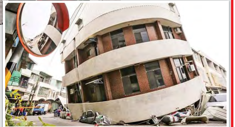
ကြောင့် အထပ်၁၆ ထပ်ရှိ အဆောက်အအုံ တစ်လုံး ပြိုကျပျက်စီးသည်ကို ပြသခဲ့သည်။ ယခုအချိန်ထိ တိုင်ပေပြိုကျပျက်စီးခဲ့သည့် အဆောက်အအုံများအောက်မှ ကယ်ဆယ်နိုင်သူဦးရေ ၂၃၃ ဦးခန့်ရှိပြီဖြစ်ကြောင်း ကယ်ဆယ်ရေးအဖွဲ့များက ဆိုသည်။ ပြိုကျလူပေါင်း ၂၃၀၀ ကျော် သေဆုံးခဲ့သည်။ တိုင်ပေ မော်တော်ကားအပျက်အစီးများရှိ ဆင်ယူ။