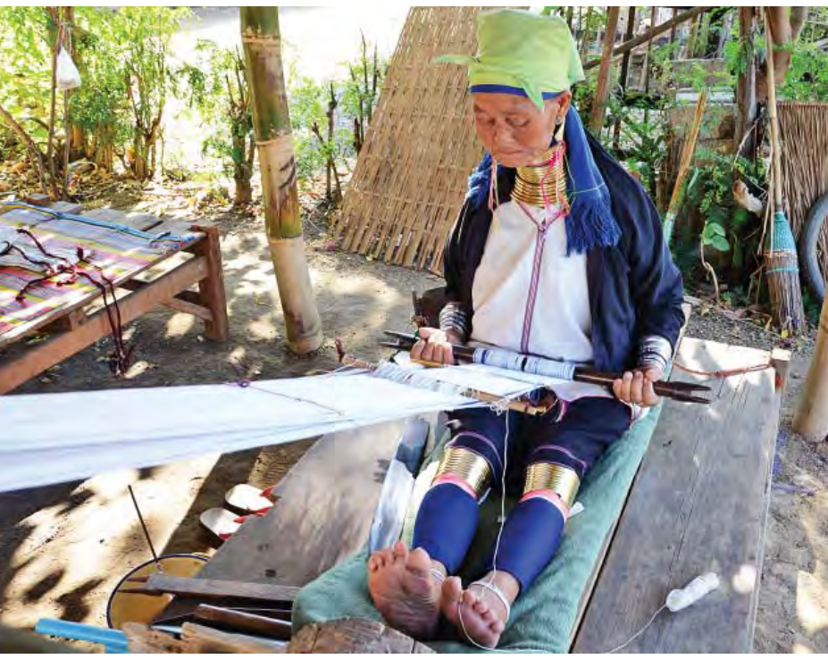
ကယားမျိုးနွယ်စုတွင် ပါဝင်သော ကယန်း(ပဒေါင်) အမျိုးသမီးကြီးတစ်ဦး ရိုးရာလက်မှုလုပ်ငန်းတစ်ခုဖြစ်သော ဂျပ်ခတ်ထည်ရက်လုပ်နေသည်ကို တွေ့ရစဉ်။