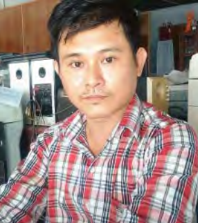
ကိုထွန်းထွန်းသူ (ကွန်ပျူတာပညာရှင်)

“အခုအချိန်အထိ တချို့က ကယ်ဆယ်ရေးစခန်းကို လာတဲ့သူတွေ ရှိသလို မလာတဲ့သူတွေလည်း ရှိနေပါ တယ်။ အဲဒီလိုမလာတဲ့သူတွေအတွက်