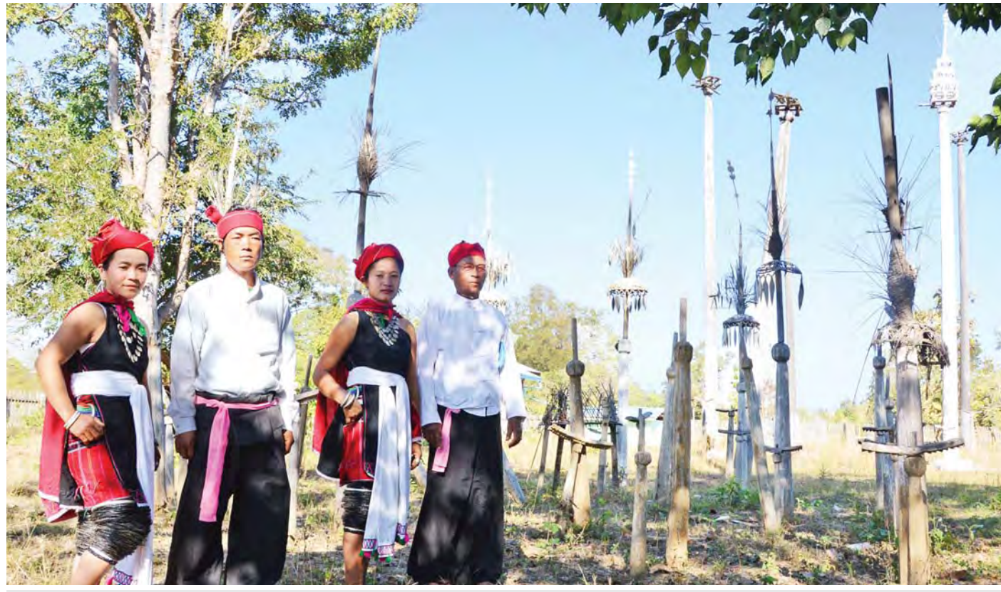
မိုးလေဝသ ကောင်းမွန်စေရန်၊ ရောဂါဘယကင်းဝေးစေရန်၊ ဆန်ရေစပါးပေါများစေရန်၊ တိုင်းပြည်ငြိမ်းချမ်းသာယာပြောစေရန် ဆုတောင်းသည့်အနေဖြင့် ကျင်းပသည့် တံခွန်တိုင်ပွဲတော်တွင်းနှင့် ကယားတိုင်းရင်းသား တိုင်းရင်းသူများကို တွေ့ရစဉ်။

ပြည်ထောင်စုသမ္မတမြန်မာနိုင်ငံတော်အတွင်း တိုင်းရင်းသားလူမျိုး ၁၃၇ မျိုး စုပေါင်းနေထိုင်ကြသည်။ ယခင်ကရာသီဥတုနှင့် လမ်းပန်းဆက်သွယ်ရေးအခက် အခဲများကြောင့် တစ်ဦးနှင့်တစ်ဦး တွေ့ဆုံရန်ခက်ခဲသော အချိန်ကာလများရှိခဲ့သည်။ ယနေ့ကာလတွင်မူ ခရီး လမ်းပန်းအခက်အခဲများ လျော့ပါးလာခဲ့ပြီဖြစ်သည့် အားလျော်စွာ သွေးချင်းညီအစ်ကိုမောင်နှမများ၏ ဒေသန္တရ သဘာဝအလှအပများ၊ ဝတ်စားဆင်ယင်မှုနှင့် ဓလေ့ ထုံးတမ်းများကို ပိုမိုထိတွေ့ခွင့်ရရှိလာပြီဖြစ်သည်။ တစ်ချိန်တည်းမှာပင် ယနေ့နည်းပညာခေတ်၏ အမျိုးမျိုးသော တိုးတက်မှုများကြားမှ ဘေးထွက်ဆိုးကျိုး များဖြစ်သော အမျိုးသားကိုယ်ပိုင်ယဉ်ကျေးမှု ပွန်းပဲ့ တိုက်စားခြင်းများသည် သွေးချင်းတို့၏ လူငယ်များ တွင်လည်း သက်ရောက်လျက်ရှိနေပြီဖြစ်သည်။ မိမိတို့ မျိုးနွယ်စု၏ ဝတ်စားဆင်ယင်မှုနှင့် ဓလေ့ထုံးတမ်းများ၊ ယဉ်ကျေးမှုအမွေအနှစ်များကို အရှည်တည်တံ့အောင် မြတ်နိုးသောစိတ်ဓာတ်ဖြင့် ထိန်းသိမ်းရန်အရေးကြီးသကဲ့သို့ မျိုးနွယ်စုတစ်ခုမှ လူကြီး၊ လူငယ်တို့၏ လက်ဆင့်ကမ်းအမွေ ပေးအပ်ရန်လည်း အထူးလိုအပ်ပေသည်။ ပြည်ထောင်စုသမ္မတမြန်မာနိုင်ငံတော်အတွင်း မှီတင်း နေထိုင်ကြသော တိုင်းရင်းသားညီအစ်ကိုမောင်နှမများ အနက် ကယားပြည်နယ်အတွင်းရှိ ကယားတိုင်းရင်းသား ညီအစ်ကိုမောင်နှမများ၏ ဝတ်စားဆင်ယင်မှုနှင့် ဓလေ့ ထုံးတမ်းများ၊ ပွဲလမ်းသဘင်များအကြောင်းကို စေ့ငုတင်ပြ လိုပါသည်။ ကယားတိုင်းရင်းသားတို့သည် ပြည်နယ်၏ မြို့တော် လျှိုင်ကော်နှင့် ဒီးမော့ဆို၊ ဖရူဆို၊ ဘောလခဲ၊ ဖားဆောင်း၊ မယ်စွဲဒေသများတွင် အများဆုံးနေထိုင်ကြ သည်။ ကယားမျိုးနွယ်စုတိုင်းမျိုးရှိပြီး ကယား၊ ဇယ်မ်း၊ ကယန်း(ပဒေါင်)၊ ကဲ့ခို၊ ဂေဘား၊ ဘရုံ(ကယော)၊ မနုမနော၊ ယင်းတလဲ၊ ယင်းတော်တို့ဖြစ်ကြောင်း သိရသည်။ စာမျက်နှာ ၆ ကော်လံ ၁ သို့ ✪