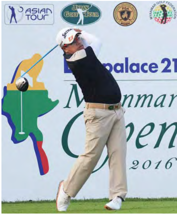
ငါးချက်လျှော့ရိုက်ထားသည့် ပရာယတ်မာဆောင်(ထိုင်း) ယှဉ်ပြိုင်နေစဉ်။