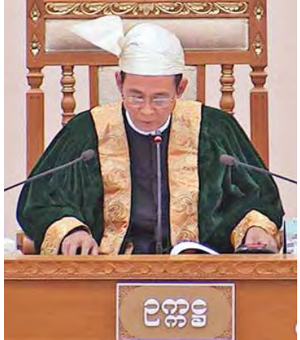
ပြည်သူ့လွှတ်တော် ဥက္ကဋ္ဌ ဦးဝင်းမြင့်။

နေပြည်တော် ဖေဖော်ဝါရီ ၄ ဒုတိယအကြိမ် ပြည်သူ့လွှတ်တော် ပထမပုံမှန်အစည်းအဝေး ဒုတိယနေ့ကို ယနေ့ နံနက် ၁၀ နာရီတွင် လွှတ်တော်အဆောက်အအုံ ပြည်သူ့လွှတ်တော်အစည်းအဝေးခန်းမ၌ ကျင်းပရာ ဥပဒေကြမ်းကော်မတီနှင့် ပြည်သူ့ ငွေစာရင်းကော်မတီတို့ ဖွဲ့စည်းရေးနှင့် စပ်လျဉ်း၍ လွှတ်တော်သို့တင်ပြခြင်းတို့ကို ဆောင်ရွက်ကြသည်။ အစည်းအဝေးတွင် ပြည်သူ့လွှတ်တော် ဥက္ကဋ္ဌ ဦးဝင်းမြင့်က ဥပဒေကြမ်း ကော်မတီ ဖွဲ့စည်းရေးနှင့်စပ်လျဉ်း၍ ရှင်းလင်းပြောကြား သည်။