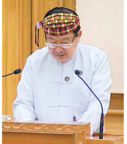
ပြည်သူ့လွှတ်တော်ဒုတိယဥက္ကဋ္ဌဦးတီခွန်မြတ်။

ဒုတိယအကြိမ် ပြည်သူ့လွှတ်တော် ပထမပုံမှန်အစည်း အဝေးဒုတိယနေ့တွင် ဥပဒေကြမ်းကော်မတီနှင့် ပြည်သူ့ငွေစာရင်းကော်မတီတို့ကို (၁၅)ဦးစီဖြင့် ဖွဲ့စည်းရန်၊ ဥပဒေကြမ်းကော်မတီတွင် ဥက္ကဋ္ဌအဖြစ် ဦးထွန်းအောင်(၁) ဦးထွန်းထွန်းဟိန်၊အတွင်းရေးမှူး အဖြစ် ဦးစတီဖန်နှင့် ပြည်သူ့ငွေစာရင်းကော်မတီ တွင် ဥက္ကဋ္ဌအဖြစ် ဦးအောင်မင်း၊ အတွင်းရေးမှူးအဖြစ် ဦးခင်မောင်သန်းတို့ကို တာဝန်ပေးအပ်ရန် လွှတ်တော် သို့တင်ပြ