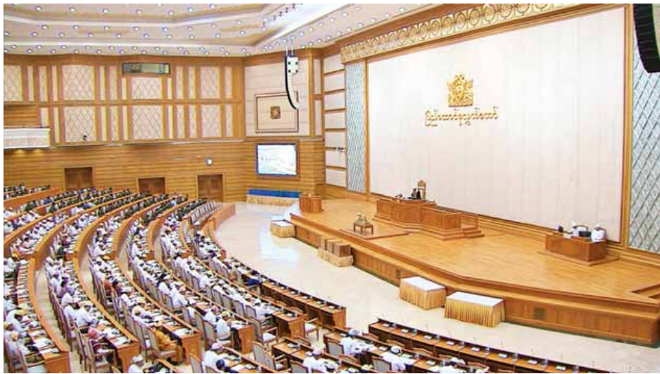
ပထမအကြိမ် ပြည်ထောင်စုလွှတ်တော် (၁၃)ကြိမ်မြောက်ပုံမှန်အစည်းအဝေး ၃၉ ရက်မြောက်နေ့ ကျင်းပစဉ်။ (သတင်းစဉ်)

နေပြည်တော် ဇန်နဝါရီ ၂၇ ပထမအကြိမ် ပြည်ထောင်စုလွှတ်တော် (၁၃) ကြိမ်မြောက် ပုံမှန်အစည်းအဝေး ၃၉ ရက်မြောက်နေ့ကို ယနေ့မနန်းလွဲ ၁ နာရီခွဲတွင်ကျင်းပရာ ပြည်သူ့ငွေစာရင်း ပူးပေါင်းကော်မတီ၏ လေ့လာတွေ့ရှိချက်နှင့် သဘောထားမှတ်ချက်အစီရင်ခံစာ အပါအဝင် အစီရင်ခံစာ ၃ ခု ဆွေးနွေးအတည်ပြုခြင်းနှင့် ဥပဒေကြမ်း ၂ ခု ဆွေးနွေးအတည်ပြုခြင်းတို့ကို ဆောင်ရွက်ကြသည်။