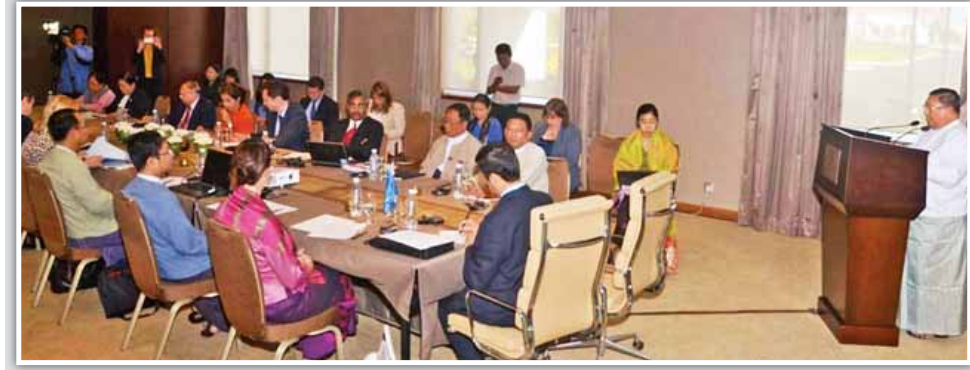
၂၀၁၄ ခုနှစ် ဒီဇင်ဘာ ၉ ရက် က ကျင်းပသော မြန်မာနိုင်ငံ ဖွံ့ဖြိုးမှု အနည်းဆုံးနိုင်ငံအဖြစ် မှ လွတ်မြောက်ရေးအတွက် နည်းပညာ အကူအညီပေးရေး ဆိုင်ရာ အလုပ်ရုံဆွေးနွေးပွဲ တွင် နိုင်ငံခြားရေးဝန်ကြီးဌာန ပြည်ထောင်စုဝန်ကြီး ဦးဝဏ္ဏမောင်လွင် အဖွင့်အမှာစကား ပြောကြားစဉ်။

၂၀၁၁ ခုနှစ် တူရကီနိုင်ငံတွင် ကျင်းပခဲ့သည့် စတုတ္ထအကြိမ်မြောက် ညီလာခံတွင် အစ္စတန်ဘူလ်လုပ်ငန်းအစီအစဉ် (Istanbul Programme of