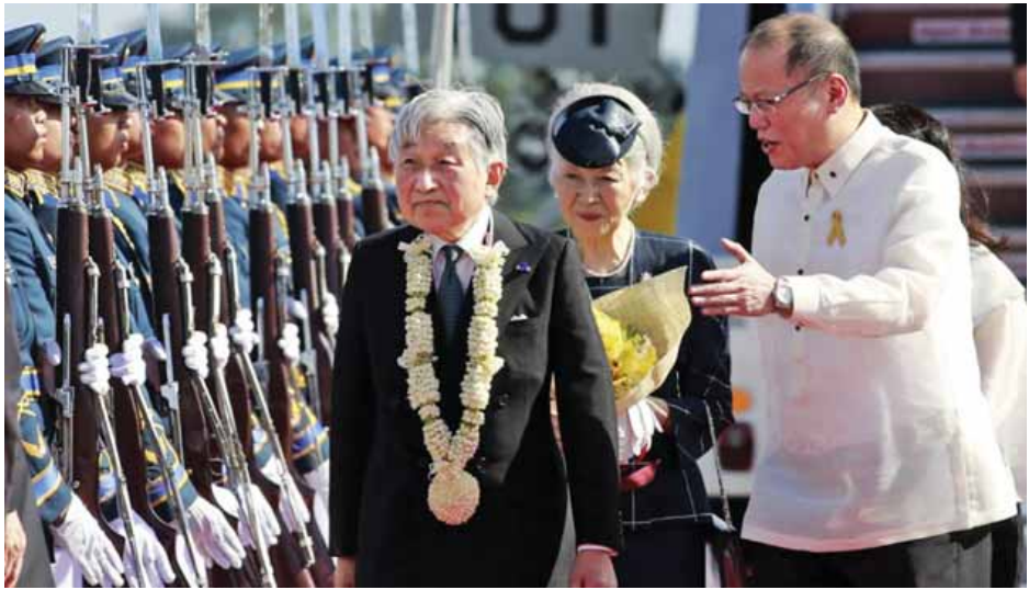
တို့ကို မိမိမေ့ပျောက်နိုင်မည်မဟုတ်ကြောင်း ဘုရင် အာကီဟီတိုက ပြောကြားသည်။ ရိုက်တာ။

လွန်ခဲ့သည့် နှစ်ပေါင်း ၇၀ က ဂျပန်တပ်ဖွဲ့က ဒေသတွင်းရှိနိုင်ငံများတွင် ရက်စက်ကြမ်းကြုတ်မှုများ ပြုလုပ်ခဲ့ခြင်းအတွက် မိမိနောင်တရမိကြောင်း ဘုရင် အာကီဟီတိုက ပြောကြားသည်။ စစ်ပွဲကာလကို ဖြတ်သန်းဖူးသည့်အတွေ့အကြုံမရှိကြသူ မျိုးဆက်သစ်လူငယ်လူရွယ်များသည် ကမ္ဘာစစ်၏ သင်ခန်းစာများ၊ အနိဋ္ဌာရုံများကို မေ့ပျောက်ခြင်းမပြုကြဘဲ သင်ခန်းစာရယူရန် လိုအပ်သည်ဟု ဘုရင်အာကီဟီတိုက ပြောကြားကြောင်း ပြန်ကြားရေးအဖွဲ့ဝန် ဟတ်ဆုဟိဆာ တာကာရီးမားက သတင်းထုတ်ပြန်သည်။ ဘုရင်အာကီဟီတိုသည် ဖိလစ်ပိုင်နိုင်ငံ၏အကြီးဆုံးသော စစ်သင်္ချိုင်းသို့ ဇန်နဝါရီ ၂၇ ရက်က သွားရောက်ခဲ့သည်။ ကမ္ဘာစစ်ကာလအတွင်းသေဆုံးခဲ့ရသော ဖိလစ်ပိုင်