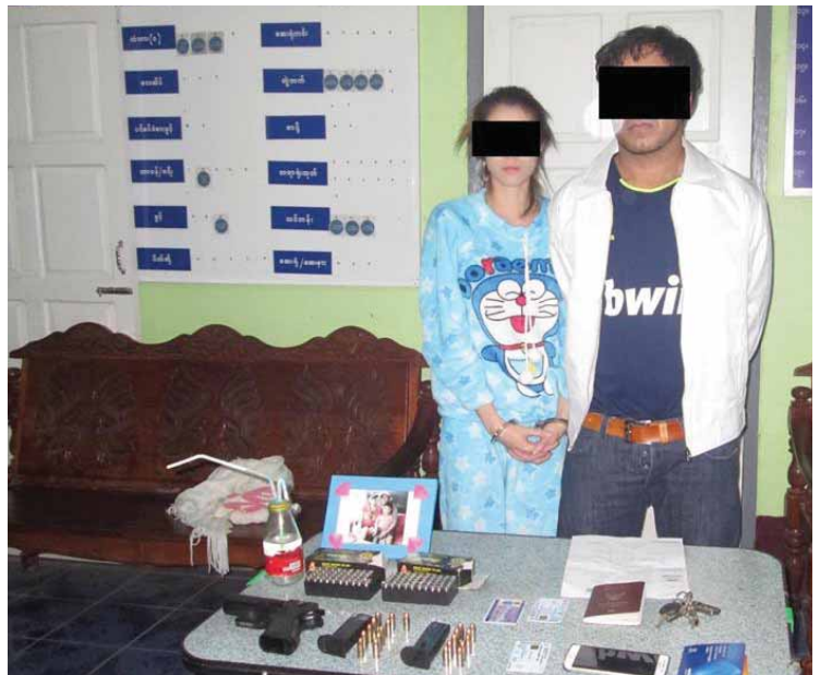
ဟန်ဌေး(လားရှိုး)

၂၀၁၄-၂၀၁၅ ခုနှစ် လားရှိုးမြို့နယ်အတွင်း သိမ်းဆည်းရမိသည့် လောင်းကစားပစ္စည်းများမှာ ငါးမန်းစက် ခြောက်လုံး၊ အကြွေစေ့ဖြင့် ထည့်၍ ကစားရသော ဝိမ်းစက် ၁၃၃ လုံး စုစုပေါင်း ၁၃၉ လုံးဖြစ်ပြီး ယင်းပစ္စည်းများအား ရှမ်းပြည်နယ် ဒုတိယရဲတပ်ဖွဲ့မှူး၊ ခရိုင်တရားသူကြီး၊ ခရိုင်ဥပဒေအရာရှိနှင့် မြို့နယ်အုပ်ချုပ်ရေးမှူးတို့က မီးရှို့ဖျက်ဆီးခဲ့ကြောင်း သိရသည်။