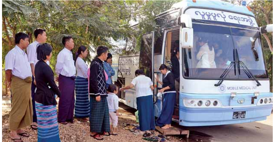
ရွေ့လျားဆေးကုရေးယာဉ်ဖြင့် ပြန်ကြားရေးဝန်ကြီးဌာန၌ ကျန်းမာရေးစောင့်ရှောက်မှုများ ဆောင်ရွက်ပေးစဉ်။

အထူးသဖြင့် အင်စတီကျူးရှင်းတည်ဆောက်နိုင်ရေးသည် မြန်မာနိုင်ငံ ကဲ့သို့ စနစ်သစ်ကူးပြောင်းစ အုပ်ချုပ်ရေးစနစ်တွင် အထူးပင်အရေးကြီး လှသည်။ The Voice Daily တွင် ဖော်ပြခဲ့သော ဘာသာပြန်ဆောင်းပါးများကို ပြန်လည်စုစည်းထုတ်ဝေခြင်းဖြစ်သည်။ စာအုပ်ကို ညီနောင်စာပေ အမှတ်(၁၆/၁၈) အခန်း A-2 လမ်း(၂၀)အရှေ့ ရန်ပြေရပ်ကွက် သာကေတမြို့နယ် ရန်ကုန်မြို့၊ ဖုန်း-၀၉-၂၅၀၀၀၄၄၄၊ ၀၉-၄၂၅၀၂၆၆၁၉ မှ တန်ဖိုးငွေကျပ် ၂၅၀၀ ဖြင့် ဖြန့်ချိသည်။