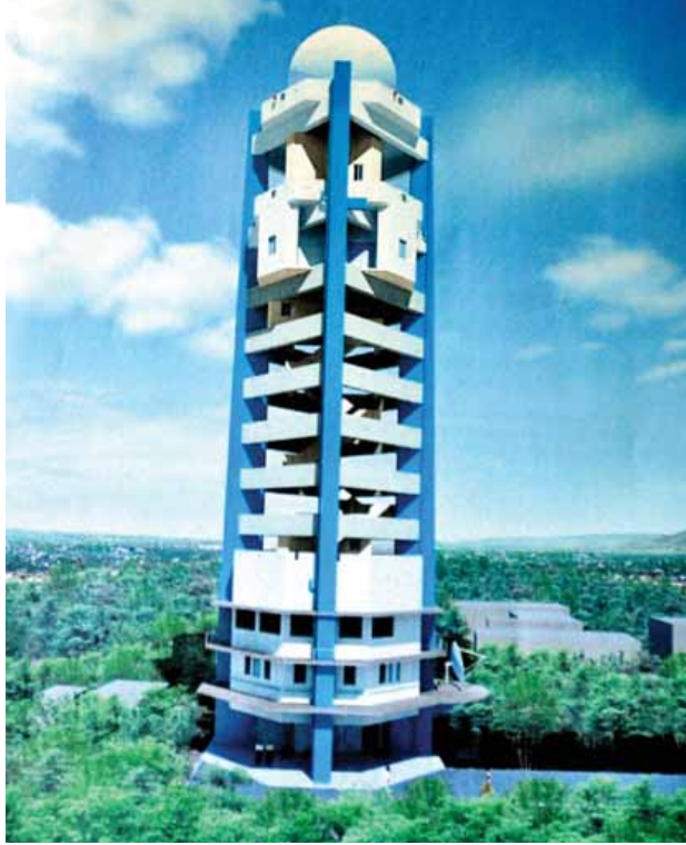
တံတားဦးမြို့နယ် လေဆိပ်အနီးတွင် တည်ဆောက်လျက်ရှိသည့် မိုးလေဝသရေဒါခန်းပုံစံငယ်ကို တွေ့ရစဉ်။