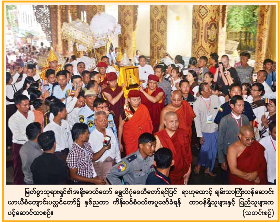
မြတ်စွာဘုရားရှင်၏အနိဗ္ဗာန်တော် ရွှေတိဂုံစေတီတော်ရင်ပြင် ရာဟုထောင့် ချမ်းသာကြီးတန်ဆောင်း ယာယီစံကျောင်းပလ္လင်တော်၌ နှစ်ညတာ ကိန်းဝပ်စံပယ်အပူဇော်ခံရန် တာဝန်ရှိသူများနှင့် ပြည်သူများက ပင့်ဆောင်လာစဉ်။ (သတင်းစဉ်)

ဘဏ္ဍာတော်ထိန်းဂေါပကအဖွဲ့နှင့် မကွေးမြို့သူ မြို့သား များကိုယ်စား ကျေးဇူးတင်ဝမ်းမြောက်ပါကြောင်း ပြောကြား သည်။ ယင်းနောက် တပ်မတော်ကာကွယ်ရေးဦးစီးချုပ် ဗိုလ်ချုပ်မှူးကြီးမင်းအောင်လှိုင်သည် နေပြည်တော် မှတ်တမ်းတွင် လက်မှတ်ရေးထိုးပြီး အဖွဲ့ဝင်များနှင့်အတူ မြသလွန်စေတီတော်မြတ်ကြီးအား လက်ယာရစ်ဖူးမြော် ကြည်ညိုကြသည်။ မွန်းလွဲပိုင်းတွင် တပ်မတော်ကာကွယ်ရေးဦးစီးချုပ် နှင့် အဖွဲ့ဝင်များသည် မကွေးစက်မှုနယ်မြေရှိ အမှတ်(၁၃) အကြီးစားစက်ရုံသို့ သွားရောက်ပြီး လုပ်ငန်းလည်ပတ်မှု အခြေအနေများကို လှည့်လည်ကြည့်ရှုကြသည်။ တပ်မတော် ကာကွယ်ရေးဦးစီးချုပ်နှင့်အဖွဲ့ကို Assembly Plant တွင် ဒုတိယစက်ရုံမှူး ဦးကျော်ကျော်ဝင်းက လည်းကောင်း၊ Gear and Transmission Plant တွင် ဌာနမှူး ဦးကြည်မြင့် ကလည်းကောင်း အသီးသီးလိုက်လံရှင်းလင်း ပြသခဲ့ကြပြီး တပ်မတော်ကာကွယ်ရေးဦးစီးချုပ်က သိရှိ လိုသည်များကို မေးမြန်းခဲ့ကြောင်း သတင်းရရှိသည်။ (မြဝတီ)