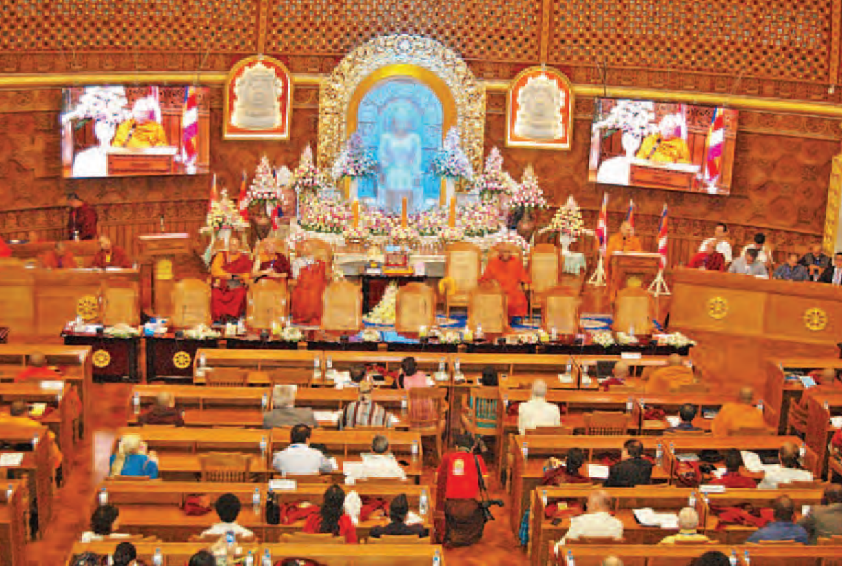
ကမ္ဘာ့ဗုဒ္ဓဘာသာငြိမ်းချမ်းရေးညီလာခံကြီးမှ သီတဂူကမ္ဘာ့ဗုဒ္ဓဘာသာ ငြိမ်းချမ်းရေးကြေညာစာတမ်းကို ထုတ်ပြန်ကြေညာခဲ့ကြောင်း သိရသည်။ တင်မောင်(မန်းကိုယ်ပွား)မင်းထက်အောင်(မန်းကိုယ်ပွား)