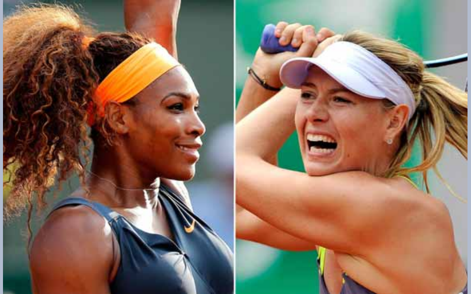
၁၀၀၀နှစ်တစ်ခုကျော် ကြာမြင့်ခဲ့ပြီဖြစ်ပါတယ်။ သူတို့ နှစ်ဦး နောက်ဆုံးတွေ့ဆုံခဲ့တာကတော့ ၂၀၁၅ ခုနှစ် ဝင်ဘယ်လ်ဒန်အိုးပင်း အကြိုဗိုလ်လုပွဲအဆင့်ပွဲစဉ်မှာ ဖြစ်ပြီး အဲဒီပွဲစဉ်မှာလည်း ဝီလျံကပ် ၆-၄၊ ၆-၂ နဲ့

ဇန်နဝါရီ ၁၈ ရက်မှ ၃၁ ရက်အထိ ကျင်းပလျက်ရှိ တဲ့ ဩစတြေးလျ အိုးပင်းတိုက်ပွဲမှာ လက်ရှိ ချန်ပီယံလည်းဖြစ် ဦးစားပေးအဆင့်(၁) သတ်မှတ်ခံရသူ လည်းဖြစ်သူ အမေရိကန်တိုင်းနစ်မယ်ဆီလာရီယာနှင့် ရုရှားတိုင်းနစ်မယ် ဟရီယာဂျာနယ်တို့ နှစ်ဦးဟာ ကွာဟခြင်းပေါ်ပေါက်လာခြင်းနှင့် တွေ့ဆုံကြရတော့မှာ ဖြစ်ပါတယ်။ ပြီးခဲ့တဲ့နှစ် ဩစတြေးလျအိုးပင်း ဗိုလ်လုပွဲ မှာလည်း သူတို့နှစ်ဦးတွေ့ဆုံခဲ့ကြသေးပြီး ဆီလာရီယာက သာ အနိုင်ယူပိုင်ဆိုင်ခဲ့ပါတယ်။ ဆီလာရီယာက လက်ရှိတက္ကသိုလ်အဆင့်(၁)ကစားသမား ဖြစ်တာနဲ့အညီ စတုတ္ထအဆင့် ပွဲစဉ်မှာလည်း ပြိုင်ဘက်တိုင်းနစ်မယ် ဝတ်စပီရန်ကို ၅၅ မိနစ်အတွင်း ၆-၂၊ ၆-၁ နဲ့ နှစ်ပွဲ ပြတ်အနိုင်ကစားပြီး ကွာဟခြင်းပေါ်ပေါက်ခဲ့တဲ့ အလွယ် တကူပဲ တက်ရောက်လာနိုင်ခဲ့ပါတယ်။ ဟရီယာ ဂျာနယ်ဟာ ကွာဟခြင်းပေါ်ပေါက်လာခြင်းပေါ်ပေါက်ခဲ့တဲ့ အလွယ် တကူပဲ တက်ရောက်လာနိုင်ခဲ့ပါတယ်။