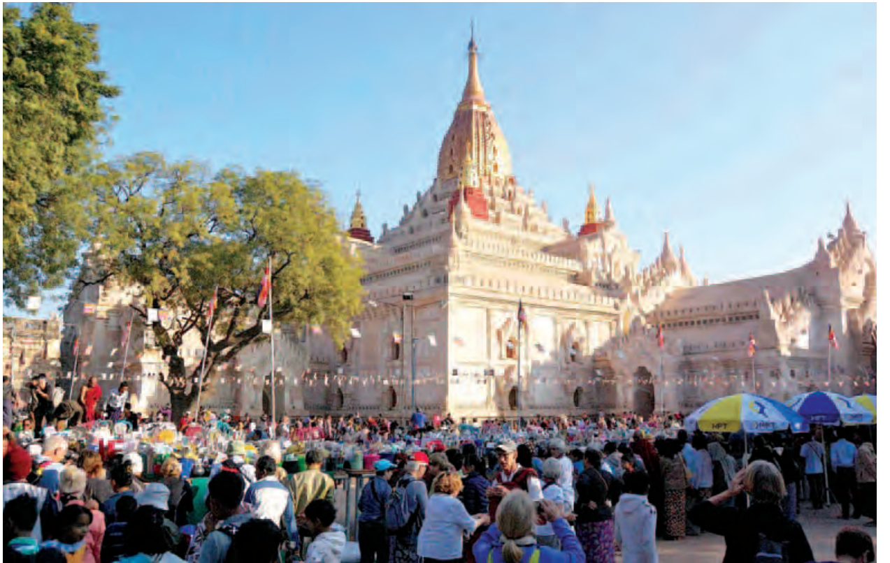
လာရောက်လေ့လာကြည့်ရှုကြကာ အံ့ဩမင်တက်ချီးကျူးကြရသည့် ပွဲတော် တစ်ခုလည်းဖြစ်ပေသည်။ အာနန္ဒာဘုရားကြီးမှာ ဂူဘုရားအမျိုးအစားဖြစ်ပြီး သက္ကရာဇ် ၄၅၂ခုနှစ် တွင် ထီးလှိုင်ရှင်ကျန်စစ်သားမင်းကြီး တည်ထားကိုးကွယ်တော်မူခဲ့ခြင်း ဖြစ်ကြောင်း၊ ပုဂံခေတ်အနုပညာလက်ရာများ အမြောက်အမြားရှိခြင်းကြောင့် ကမ္ဘာလှည့်ခရီးသွားဧည့်သည်များ အထူးစိတ်ဝင်စားလေ့လာရန် လာရောက် သည့် နေရာတစ်ခုဖြစ်ကြောင်း သိရသည်။

အဆိုပါဆွမ်းသပိတ်လုံးဆက်ကပ်လှူဒါန်းပွဲသို့ ညောင်ဦးမြို့နယ်တစ်ဝိုက်ရှိ ကျေးရွာများမှ ပြည်သူများသည် ဆွမ်းသပိတ်လုံး ကပ်လှူပူဇော်နိုင်ရန်အတွက် လပြည့်နေ့မတိုင်မီ လဆန်း ၁၀ ရက်၊ ၁၁ ရက်မှစတင်ကာ ၎င်းတို့၏ရွာမှ ဘုရားပွဲတော်ကြီးသို့ ပေါင်းမိုးလှည်းယာဉ်များဖြင့်စီတန်း၍ တညီတညွတ် လာရောက်ကြသည်မှာလည်း စိတ်ဝင်စားစရာ မြန်မာ့ရိုးရာဓလေ့တစ်ခုအဖြစ် ရှိနေပေသည်။ ထိုသဘာဝဓလေ့များကို ပြည်တွင်းဓာတ်ပုံပညာရှင်များ၊ ပြည်ပမှခရီးသွားဧည့်သည်နှင့် ဓာတ်ပုံပညာရှင်များသည် လက်လွတ်မခံဘဲ ယင်းလှည်းယာဉ်များအလာလမ်းနှင့် အပြန်လမ်းများတွင် အမိအရစောင့်၍ ဓာတ်ပုံများလာရောက်ရိုက်ကူးကြသည်ကို မြင်တွေ့ရသည်။ ပြာသိုလသည် အညာဒေသရှိ ကျေးရွာများ၏ ပဲဖော်ချိန်၊ နှမ်းဖော်ချိန်ဖြစ်၍ ဖော်ပြီးခါစ ဦးဦးဖျားဖျားသီးနှံများကို အာနန္ဒာဘုရားကြီးဗုဒ္ဓပူဇော်ယုတ္တရား ဆွမ်းသပိတ်လုံး ဆက်ကပ်လှူဒါန်းပွဲတွင် ဦးခိုက်၍ နှစ်စဉ်လာရောက် ဆက်ကပ်လှူဒါန်းကြရာ ဆန်သပိတ်လုံး၊ မြေပဲ၊ အသီးအနှံသပိတ်လုံးများနှင့်အတူ ငွေပဒေသာပင် ပုံစံအမျိုးမျိုးနှင့်အတူ မြင်တွေ့ရသည်။ ယင်းသပိတ်လုံးများနှင့် ငွေပဒေသာပင် များကို မြို့နယ်အတွင်းရှိ သံဃာတော်များအား စာရေးတံမဲစနစ်ဖြင့် ဆက်ကပ် လှူဒါန်းကြသည်ကို ကြည့်နူးဖွယ်တွေ့မြင်ရသည်။ ထို့ပြင် မြန်မာတို့၏ သဒ္ဒါ တရားထက်သန်မှု၊ အလှူအတန်းရက်ရာမှုကို ပြည်ပခရီးသွားဧည့်သည်များ