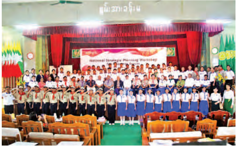
မြောက် စီမံချက်ရေးဆွဲရန်များ ဆွေးနွေးကြမည်ဖြစ် မြောက်ဥမှ ၂၄ ဦး၊ မြန်မာနိုင်ငံကင်းထောက်ကြီးများ ၁၆ ဦး၊ တက္ကသိုလ်များမှ ကင်းထောက်ဆရာနှင့် ကင်းထောက်

ထို့နောက် အဖွဲ့လေးဖွဲ့ခွဲပြီး ကမ္ဘာ့ကင်းထောက် အဖွဲ့ချုပ်၊ အာရှ-ပစိဖိတ်ဒေသဆိုင်ရာ ကင်းထောက်အဖွဲ့ချုပ် နှင့် မြန်မာနိုင်ငံကင်းထောက်အဖွဲ့ချုပ်တို့ ကင်းထောက် လုပ်ငန်းများပူးပေါင်းဆောင်ရွက်နိုင်ရေးနှင့် မြန်မာ ကင်းထောက်များ၏ စဉ်ဆက်မပြတ် စနစ်တကျတိုးတက်ရေးအတွက် ထိရောက်စွာ အကောင်အထည်ဖော်လုပ် ဆောင်နိုင်ရန်အတွက် လိုအပ်သော ရေရှည် မဟာဗျူဟာ