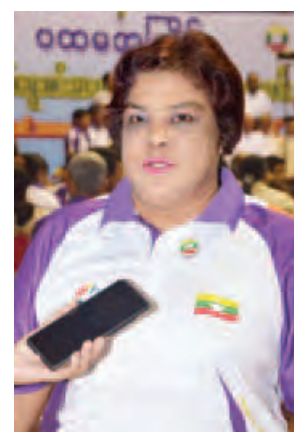
ဒု-ရဲမှူးကြည်ကြည်ဝေ

ဒီအသင်းလေးကို ပထမ စတင် ထောင်မယ်ဆိုတော့ နည်းနည်းလေးနဲ့ အကျဉ်းချိုးပြီးလုပ်မယ်။ နောက်