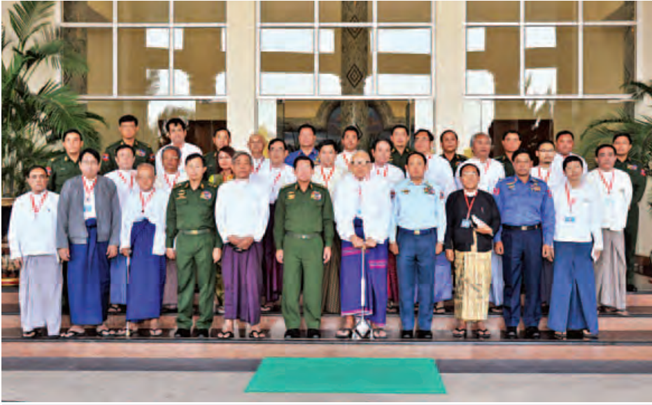
တပ်မတော်ကာကွယ်ရေးဦးစီးချုပ် ဗိုလ်ချုပ်မှူးကြီးမင်းအောင်လှိုင်နှင့် မြန်မာနိုင်ငံသတင်းမီဒီယာကောင်စီဥက္ကဋ္ဌ ဦးခင်မောင်လေးနှင့်အဖွဲ့ဝင်များ အမှတ်တရဓာတ်ပုံရိုက်ကြစဉ်။ (မြဝတီ)

မီဒီယာသည် တိုင်းပြည်အတွက် လွန်စွာအရေးကြီးကြောင်း၊ အထူးသဖြင့် တိုင်းပြည်တည်ဆောက်ရေးကာလတွင် ပိုမိုအရေးကြီးကြောင်း၊ နိုင်ငံတိုင်းတွင် တိုင်းပြည်တည်ဆောက်ရေးသည် ပြီးဆုံးသည့်ဟူ၍ မရှိနိုင်သကဲ့သို့ မီဒီယာ၏ကဏ္ဍသည်လည်း ထာဝရရှိနေမည်ဖြစ်ကြောင်း၊ ကမ္ဘာတည်သရွေ့ မီဒီယာ၏လှုပ်ရှားမှုများ ရှိနေမည်ဖြစ်ကြောင်း၊ ထိရောက်သည့် လုပ်ဆောင်မှုများဖြင့် တိုင်းပြည်တည်ဆောက်ရေးအတွက် ပိုမိုတန်ဖိုးကြီးစေမည်ဖြစ်ကြောင်း၊ တပ်မတော်၏ကိုယ်စား သတင်းမီဒီယာကောင်စီအား ဂုဏ်ပြုကြိုဆိုပြီး ပူးပေါင်းဆောင်ရွက်သွားမည်ဖြစ်ကြောင်း တပ်မတော်ကာကွယ်ရေးဦးစီးချုပ် ဗိုလ်ချုပ်မှူးကြီးမင်းအောင်လှိုင်က ယနေ့မွန်းလွဲ ၂ နာရီတွင် နေပြည်တော်ရှိ ဘုရင့်နောင်ရိပ်သာ ဧည့်ခန်းမဆောင်၌ မြန်မာနိုင်ငံ သတင်းမီဒီယာကောင်စီဥက္ကဋ္ဌ ဦးခင်မောင်လေးနှင့်အဖွဲ့ဝင်များကိုတွေ့ဆုံစဉ် ထည့်သွင်းပြောကြားသည်။