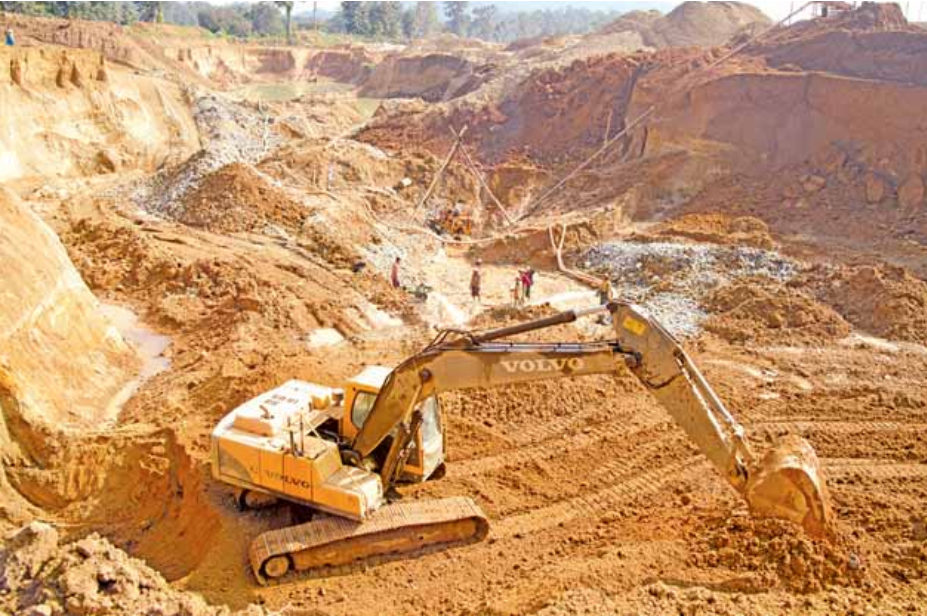
ပန်းမောက်မြို့နယ်အတွင်းမှ ရွှေလုပ်ကွက်တစ်ခုကို တွေ့ရစဉ်။

နဘား ဇန်နဝါရီ ၂၃ - စစ်ကိုင်းတိုင်းဒေသကြီး ပန်းမောက်မြို့နယ်၌ တရားဝင်နှင့် တရားမဝင်ရွှေလုပ်ကွက်များ အလွန်များပြားလာလျက်ရှိနေပြီး အမည်မရှိအချို့ကလည်း နားလည်မှုယူ၍ လုပ်ကိုင်ဆောင်ရွက်လျက်ရှိနေခဲ့သည့် အပြင် လယ်မြေများစွာကို ဖျော့ကြီးပေး၍ ရွှေလုပ်ကွက်များအဖြစ် ပြောင်းလဲဆောင်ရွက်နေသည်ဟု ပန်းမောက်မြို့နယ်ဦးသန်းထွန်းက ပြောသည်။ ပန်းမောက်ဒေသနှင့် နယ်မြေချင်းဆက်စပ်တည်ရှိသော နမ်းခမ်း၊ ဝန်းသို ခရိုင်ချင်းဆက်ကျေးရွာများ၏ အနီး၌ ရွှေတူးဖော်ခွင့်စာချုပ်၍ လုပ်ကွက်(အသေးစား) များရှိရာ ကုမ္ပဏီလုပ်ကွက် ၈၀၀ စီရယူလုပ်ကိုင်နေကြသော ရွှေလင်းအောင်ကုမ္ပဏီ တစ်နေရာ၊ အောင်ဆုမြတ်ကုမ္ပဏီတစ်နေရာ၊ ဦးတင်ရွှေကုမ္ပဏီ နှစ်နေရာ၊ ပြည်ကောင်းကျော်ကုမ္ပဏီ တစ်နေရာ၊ ကောင်းမွန်ရတနာကုမ္ပဏီ တစ်နေရာ၊ ဆုထူးပန်ကုမ္ပဏီ တစ်နေရာ၊ ငွေရောင်လင်းကုမ္ပဏီ တစ်နေရာ၊ ရွှေတုံတုံကုမ္ပဏီ တစ်နေရာ၊ ရွှေနီလှကုမ္ပဏီ တစ်နေရာ၊ ရွှေမိုးရွှေလှကုမ္ပဏီ တစ်နေရာ၊ ကိုမိုးဦးကုမ္ပဏီ တစ်နေရာ၊ ရွှေဝင်းအောင်အောင်ကုမ္ပဏီ တစ်နေရာ၊ ဟိန်းဟိန်းသန်းကုမ္ပဏီ တစ်နေရာ၊ အောင်ပြည့်သာကုမ္ပဏီ တစ်နေရာ၊ အေးငြိမ်းစန်ကုမ္ပဏီ တစ်နေရာ၊ အေးအေးခိုင်ကုမ္ပဏီ နှစ်နေရာ၊ ရွှေအိုးစည်ကုမ္ပဏီ တစ်နေရာ၊ အဂ္ဂရတနာကုမ္ပဏီ သုံးနေရာ၊ ရွှေလက်ဝဲသန္တာကုမ္ပဏီ နှစ်နေရာ၊ ရွှေစည်တိုးကုမ္ပဏီ တစ်နေရာ၊ တံချူရှင်ကုမ္ပဏီ တစ်နေရာ၊ ရွှေဌေးပမာကုမ္ပဏီ တစ်နေရာ၊ တက်လူကုမ္ပဏီ နှစ်နေရာ၊ SKY Work ကုမ္ပဏီ တစ်နေရာ၊ စွမ်းမင်းထက်ကုမ္ပဏီ တစ်နေရာ၊ ကိုလေးနောင်ကုမ္ပဏီတစ်နေရာ၊ စွမ်းရတနာ