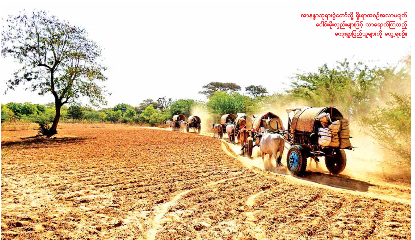
အာနန္ဒာဘုရားပွဲတော်သို့ ရိုးရာအစဉ်အလာမပျက် ပေါင်းမိုးလှည်းများဖြင့် လာရောက်ကြသည့် ကျေးရွာပြည်သူများကို တွေ့ရစဉ်။