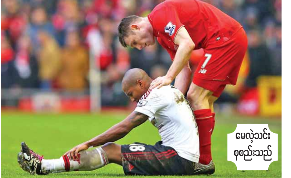
မေလုံသင်း စုစည်းသည်

ဟု ဆိုလိုက်သည်။ မန်ယူအသင်းမှာ လီဗာပူးအားတစ်ဂိုး-ဂိုးမရှိဖြင့် အနိုင်ကစားနိုင်ခဲ့ပြီးနောက် မန်ယူ၏ ပရီမီယာလိဂ် ချန်ပီယံအိမ်မက်မှာ ပြန်လည်ရှင်သန်လာခဲ့ရာ ဗန်ဟားလ်က ဇန်နဝါရီဈေးကွက် ပိတ်သိမ်းရက်ဖြစ်သည့် ဖေဖော်ဝါရီ ၁ ရက်မတိုင်မီ အနည်းဆုံး နောက်ခံကစားသမားနှစ်ဦးခန့်အား ခေါ်ယူရန် ဆန္ဒရှိနေခြင်းဖြစ်သည်။