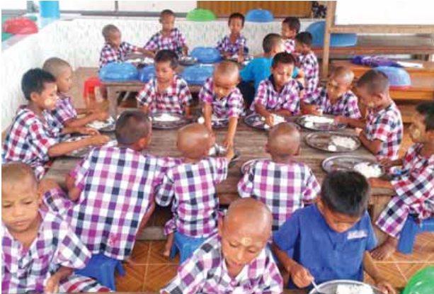
နေပြည်တော် ဇေယျာသိရိမြို့နယ် ခေတ်အေးကျေးရွာရှိ သူနေကာရီ နယ်စပ်ဒေသတိုင်းရင်းသားလူငယ်များ ဖွံ့ဖြိုးရေးပရဟိတဂေဟာ။ ကိုစားရတယ်။ ဒါကြောင့် ခရစ္စမတ်ရဲ့လိမ္မော်သီးဟာ သူတို့ တစ်နှစ်ပတ်လုံးရဲ့ မျှော်လင့်ချက်ဖြစ်ခဲ့ကြတယ်။

သူတို့မိဘမဲ့ကျောင်းသားလေးတွေဟာ တစ်နှစ်မှာ ခရစ္စမတ်နေ့တစ်ရက်ပဲ နားခွင့်ရတယ်။ အဲဒီနေ့မှာ ဘုရားသခင်ကိုပူဇော်တဲ့အနေနဲ့ တစ်ယောက်ကို လိမ္မော်သီးတစ်လုံးစီရကြတယ်။ ခရစ္စမတ်မှာ သူများတွေလို အစားအစာ ကောင်းကောင်းတွေ မရှိဘူး။ ကစားစရာအရပ်မရှိပါဘူး။ သူတို့ တစ်ယောက် ချင်းစီရဲ့ဝေစုဟာ လိမ္မော်သီးတစ်လုံးပဲရကြတယ်။ တစ်နှစ်ပတ်လုံးမှာ အများ မကျူးလွန်တဲ့သူ၊ ပြောသမျှစကားကိုနားထောင်ပြီး လိမ္မော်တဲ့သူမှ လိမ္မော်သီး