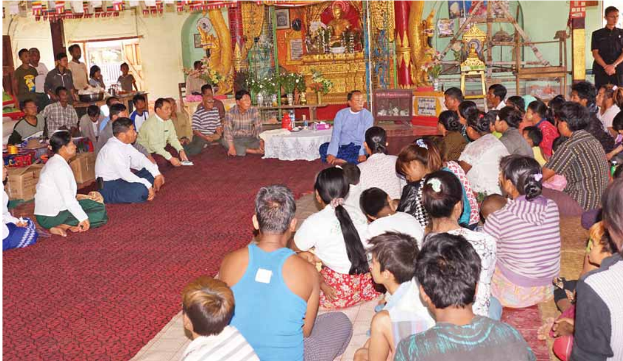
နေပြည်တော် ဇန်နဝါရီ ၂၃

အမျိုးသားလွှတ်တော်ဥက္ကဋ္ဌ ဦးခင်အောင်မြင့်သည် တာဝန်ရှိသူများနှင့်အတူ ယနေ့နံနက်ပိုင်းတွင် ပျော်ဘွယ်မြို့ မှန်နန်းဘုန်းတော်ကြီးကျောင်းသို့ ရောက်ရှိပြီး ကျောင်းတိုက် ပဓာနနာယက ဆရာတော် ဦးကိတ္တိသာရအား ဖူးမြော်ကြည်ညိုကာ လှူဖွယ်ပစ္စည်းများ ဆက်ကပ်လှူဒါန်းသည်။