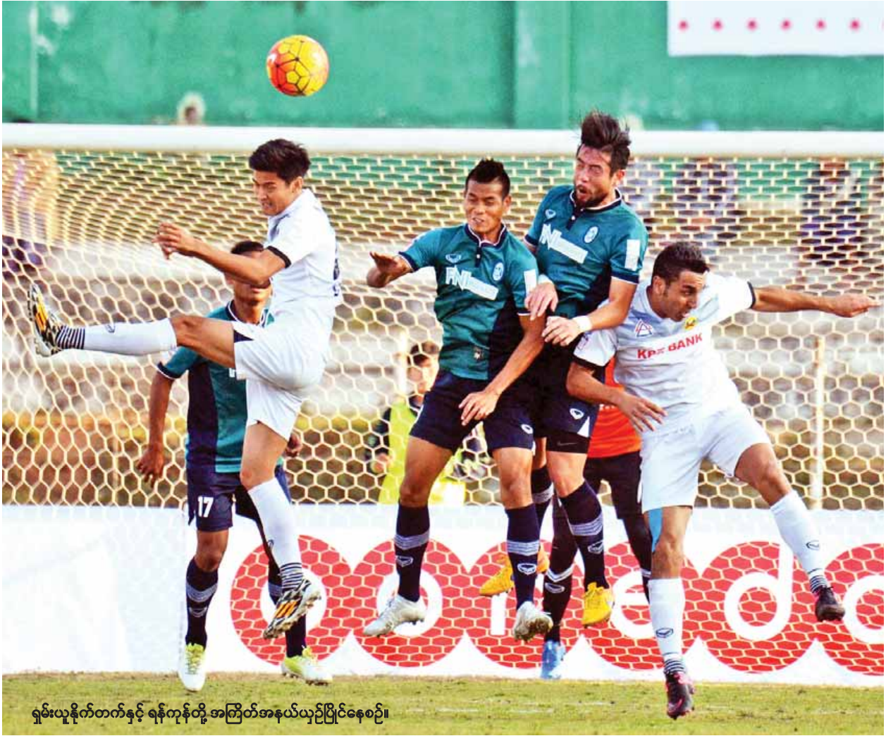
ရှမ်းယူနိုက်တက်နှင့် ရန်ကုန်တို့ အကြိတ်အနယ်ယှဉ်ပြိုင်နေစဉ်။

ရန်ကုန်အသင်းတွင် ကျော်ကိုကို ပြန်လည်ပါဝင်လာပြီး ရှမ်းယူနိုက် တက်အသင်းမှာလည်း အမာခံကစား သမားအများစုဖြင့် ပွဲထွက်ခဲ့သည်။ ပွဲအစပိုင်းတွင် အဓိက ကွင်းလယ် ကစားသမား ဝတ်စတာမို ဒဏ်ရာ ရရှိပြီး လူစားလဲခဲ့ရာ ကစားကွက် တည်မရဖြစ်ခဲ့ပြီး ပွဲချိန်တစ်လျှောက် ပုံစံကောင်းပြသနိုင်ခြင်း မရှိခဲ့ပေ။ မိနစ် ၃၀ လောက်အထိ ရန်ကုန် အသင်း ဖိကစားနိုင်ခဲ့ပြီး ဝိုးသွင်းခွင့် အချို့ကို အသုံးမချနိုင်ခဲ့သလို ရှမ်းအသင်းမှာ ပထမပိုင်းပြီးခါနီးတွင် စာမျက်နှာ ၉ တော်လံ ၁ သို့