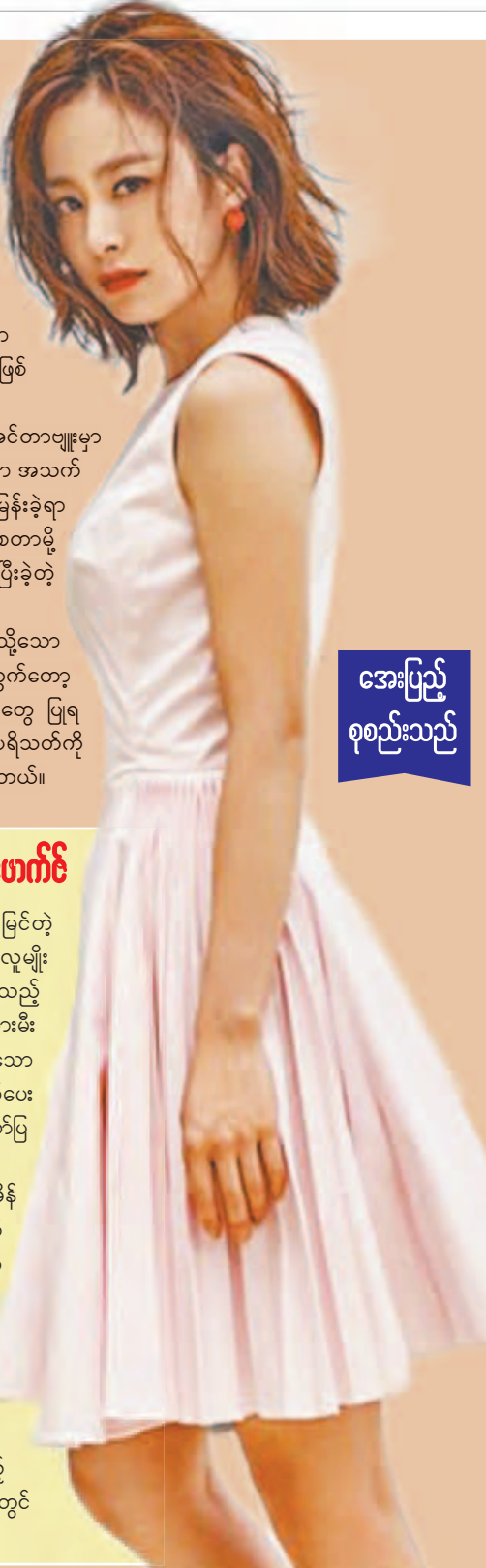
အေးပြည့် စုစည်းသည်

ကင်မ်ဟာ လှပနူးညံ့တဲ့ရုပ်ရည်ကို ပိုင်ဆိုင်ထားသူတစ်ဦးဖြစ်ပေမယ့် ရေငုပ်ခြင်းကဲ့သို့သော ပြင်းထန်တဲ့အားကစားနည်းတွေကို စိတ်ဝင်စားသူတစ်ဦး ဖြစ်ပါတယ်။ ထို့ပြင် သူက သူ့အတွက်တော့ ပရိသတ်ရဲ့အားပေးမှုကိုရရှိလေလေ ယင်းအားပေးမှုနဲ့ ထိုက်တန်တဲ့ ပြန်လည်ပေးဆက်မှုတွေ ပြုလေလေလို့ အနုပညာရှင်တစ်ဦးရဲ့ ဘဝအပေါ်ခံယူထားကြောင်းနဲ့ ယနေ့အချိန်အထိ ပရိသတ်ကို ကျေနပ်သည်အထိ ပြန်လည်ပေးဆပ်နိုင်ခြင်း မရှိသေးကြောင်းလည်း သူက ရင်ဖွင့်ထားပါတယ်။