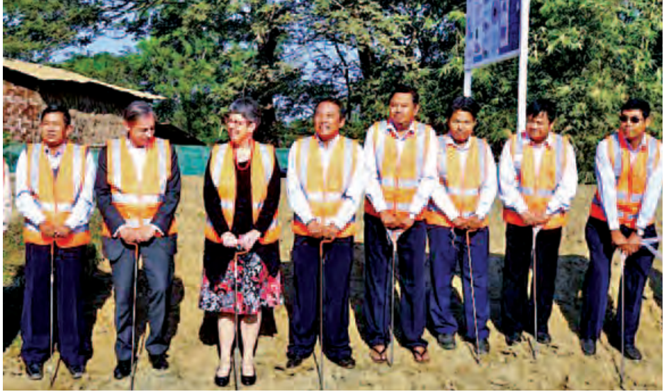
မြေသားအရည်အသွေး ဆန်းစစ်မှုကိရိယာဖြစ်သည့် prikstok အား မဲလီ(၂) ရေထိန်းတံခါးအနီးရှိ ဧရာဝတီ မြစ်ဝကျွန်းပေါ်ဒေသ၌ သရုပ်ပြ စမ်းသပ်ကြစဉ်။

ညောင်တုန်း ဇန်နဝါရီ ၂၀ ရေစိမ့်လွှာများ၊ ကြွက်တွင်းနှင့် နယ်သာလန်နိုင်ငံနှင့် မြန်မာနိုင်ငံ အကြား ရေအရင်းအမြစ်ဆိုင်ရာ အကျိုးတူ ပူးပေါင်းဆောင်ရွက်ရန် အတွက် သဘောတူညီခဲ့ကြသည့် မြေသားအရည်အသွေး ဆန်းစစ်မှု ကိရိယာဖြစ်သည့် Prikstok အချောင်း ၁၅၀ အား ဧရာဝတီမြစ်ဝကျွန်းပေါ် ဒေသရှိ တာတမံများ၏ ကြံ့ခိုင်မှု အနေအထားအတွက် စစ်ဆေးခြင်း များ ပြုလုပ်သွားမည်ဖြစ်ကြောင်း လယ်ယာစိုက်ပျိုးရေးနှင့် ဆည်မြောင်း ဝန်ကြီးဌာနမှ သိရသည်။