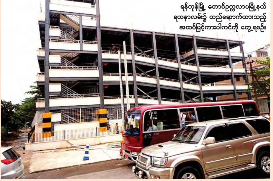
ရန်ကုန်မြို့၊ တောင်ဥက္ကလာပမြို့နယ် ရတနာလမ်း၌ တည်ဆောက်ထားသည့် အထပ်မြင့်ကားပါကင်ကို တွေ့ရစဉ်။