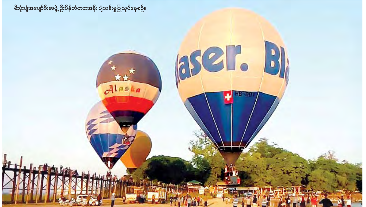
မီးပုံးပျံအပျော်စီးအဖွဲ့ ဦးပိန်တံတားအနီး ပျံသန်းမှုပြုလုပ်နေစဉ်။