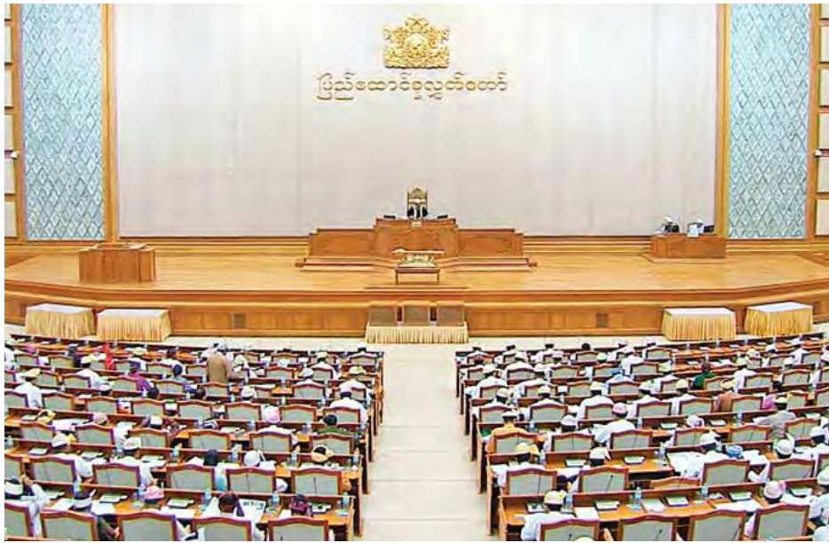
ပထမအကြိမ် ပြည်ထောင်စုလွှတ်တော် (၁၃)ကြိမ်မြောက်ပုံမှန်အစည်းအဝေး (၃၃)ရက်မြောက်နေ့ ကျင်းပစဉ်။ (သတင်းစဉ်)

လာအိုနိုင်ငံတွင် လယ်ယာကဏ္ဍကြီး၌ ၃၂ ဒသမ ၇ ရာခိုင်နှုန်းမှ ၂၇ ဒသမ ၇ ရာခိုင်နှုန်း၊ စက်မှုကဏ္ဍကြီး ၌ ၃၁ ဒသမ ၈ ရာခိုင်နှုန်းမှ ၃၁ ဒသမ ၄ ရာခိုင်နှုန်းနှင့် ဝန်ဆောင်မှုကဏ္ဍကြီး၌ ၃၅ ဒသမ ၅ ရာခိုင်နှုန်းမှ ၄၀ ဒသမ ၉ ရာခိုင်နှုန်းသို့လည်းကောင်း၊ ဗီယက်နမ်နိုင်ငံတွင် လယ်ယာကဏ္ဍကြီး၌ ၁၈ ဒသမ ၉ ရာခိုင်နှုန်းမှ ၁၈ ဒသမ ၁ ရာခိုင်နှုန်း၊ စက်မှုကဏ္ဍကြီး၌ ၃၈ ဒသမ ၂ ရာခိုင်နှုန်းမှ ၃၈ ဒသမ ၅ ရာခိုင်နှုန်းနှင့် ဝန်ဆောင်မှုကဏ္ဍကြီး၌ ၄၂ ဒသမ ၉ ရာခိုင်နှုန်းမှ ၄၃ ဒသမ ၄ ရာခိုင်နှုန်းသို့ လည်းကောင်း၊ ထိုင်းနိုင်ငံအနေဖြင့် ၂၀၁၄ ခုနှစ်တွင် လယ်ယာကဏ္ဍကြီး၌ ၁၀ ဒသမ ၅ ရာခိုင်နှုန်း၊ စက်မှုကဏ္ဍ ကြီး၌ ၃၆ ဒသမ ၈ ရာခိုင်နှုန်းနှင့် ဝန်ဆောင်မှုကဏ္ဍကြီး