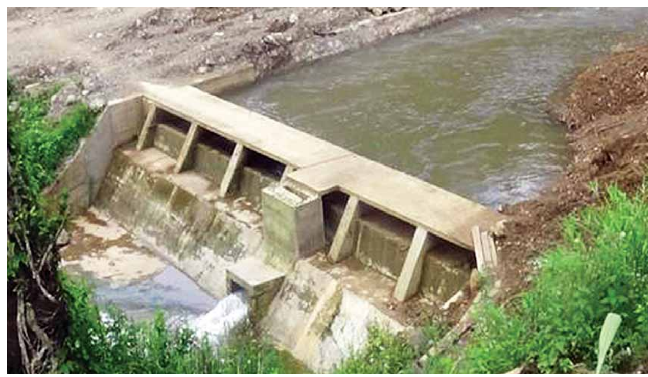
လဟယ်မြို့နယ် ကျလွေချောင်း အသေးစားရေအားလျှပ်စစ်စီမံကိန်း ဆောင်ရွက်ပြီးစီးမှုအခြေအနေကို တွေ့ရစဉ်။ (သတင်းစဉ်)

ရိုးရာဝတ်စုံ၊ ရိုးရာအက၊ ရိုးရာသံစဉ်များဖြင့် သီဆိုကခုန်နေကြသည်။ မီးပုံပွဲတွင် ဆောင်းလေ တသုန်သုန် တိုက်ခတ်လျက်။ ပိုင်းဖွဲ့ပြီး ပျော်ရွှင်စွာ သီဆိုကခုန်နေကြသော နာဂရိုးရာ နှစ်သစ်ကူးပွဲတော်မီးပုံပွဲက ချမ်းအေးမှုကို လွှင့်စဉ်သွားစေ၏။ မြန်မာနိုင်ငံ အနောက်မြောက်ဖျားဒေသ ပင်လယ်ရေမျက်နှာပြင်အထက် အမြင့် ၄၃၁၃ ပေရှိသော နာဂကိုယ်ပိုင်အုပ်ချုပ်ခွင့်ရဒေသရှိ လဟယ်မြို့လေး တွင် ကျင်းပနေသည့် “နာဂရိုးရာ နှစ်သစ်ကူးပွဲတော်”သည် နှစ်ဟောင်းမှ အခက်အခဲနှင့် ပြဿနာများကို ပယ်ဖျောက်၍ ချစ်ကြည်ရင်းနှီးစွာ ပေါင်းစည်း မှုကို ဖော်ဆောင်လျက်ရှိသည်။ တည်ငြိမ်အေးချမ်းမှုနှင့် ဖွံ့ဖြိုးတိုးတက်မှုရလဒ် များစွာထဲမှ “နှစ်သစ်ကူးပုံရိပ်” ပင်။ နာဂတိုင်းရင်းသားများ၏ ရိုးရာပွဲတော်များစွာရှိသည့်အနက် နှစ်သစ်ကူး ပွဲတော်သည် နှစ်စဉ် ရိုးရာမပျက် ပျော်ရွှင်စွာဆင်နွှဲကြသည့် အဓိကပွဲတော်ကြီး ဖြစ်သည်။ နာဂကိုယ်ပိုင်အုပ်ချုပ်ခွင့်ရဒေသသည် စစ်ကိုင်းတိုင်းဒေသကြီး ခန္တီးခရိုင်အတွင်း ပါဝင်လျက်ရှိပြီး အိန္ဒိယနိုင်ငံနှင့် နယ်နိမိတ်ချင်းထိစပ်လျက် ရှိသည်။ စာမျက်နှာ ၈ ကော်လံ ၁ သို့