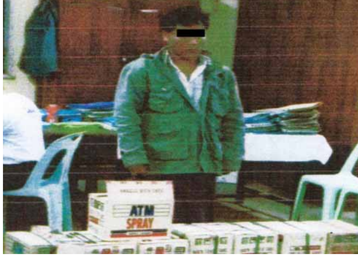
မော်တော်ယာဉ်နံပါတ်ပြားများ အတုပြုလုပ်သူအား ပမ်းဆီးအရေးယူ

နံပါတ်ပြားအတု ဖျိုးစုံ ၄၆၀နှင့် ဆက်စပ်ပစ္စည်း များ၊ နံပါတ်ပြားအတုပြုလုပ်ရန် ဖြတ်တောက်ထားသည့် သွပ်ပြား ၁၇၂ ပြားနှင့် ဖြတ်တောက်ရာတွင်အသုံးပြုသည့် ဆက်စပ်ပစ္စည်းများကို တွေ့ရှိသိမ်းဆည်းရမိ ခဲ့သည်။ စစ်ဆေးချက်အရ အဆိုပါ နံပါတ်ပြား အတုများအား ဆေးမှုတ်ခြင်း၊ စတစ်ကာကပ် ခြင်းနှင့် စာလုံးပုံဖော်ခြင်းတို့ကို ဘားအံ မြို့နယ် ရဲသားကျေးရွာ GTC ကျောင်းနောက် ဘက်ရှိ ဝါးရဲတောအတွင်း၌ ပြုလုပ်ကြောင်း သိရှိရသဖြင့် ပူးပေါင်းအဖွဲ့က သွားရောက် ရှာဖွေရာ နံပါတ်ပြားစာလုံးဖော်၊ ပုံသွင်းရာ တွင် အသုံးပြုသည့် ဆက်စပ်ပစ္စည်းများ၊ နံပါတ်ပြားအတု အကြမ်းထည် ၄၀၀၊ နံပါတ် ပြား ဆေးမှုတ်ရာတွင်အသုံးပြုသည့် KTM စာတန်းပါ မှုတ်ဆေးဘူးများကို ထပ်မံတွေ့ရှိ သိမ်းဆည်းရမိခဲ့သဖြင့် မော်တော်ယာဉ် နံပါတ်ပြားများအတုပြုလုပ်သူ ရန်နိုင်အား ဘားအံမြို့မရဲစခန်းက အမှုဖွင့်အရေးယူထား ပြီး အမှုအား ဆက်လက်စစ်ဆေးဖော်ထုတ် လျက်ရှိကြောင်း သိရသည်။ (ရဲပြန်ကြား)