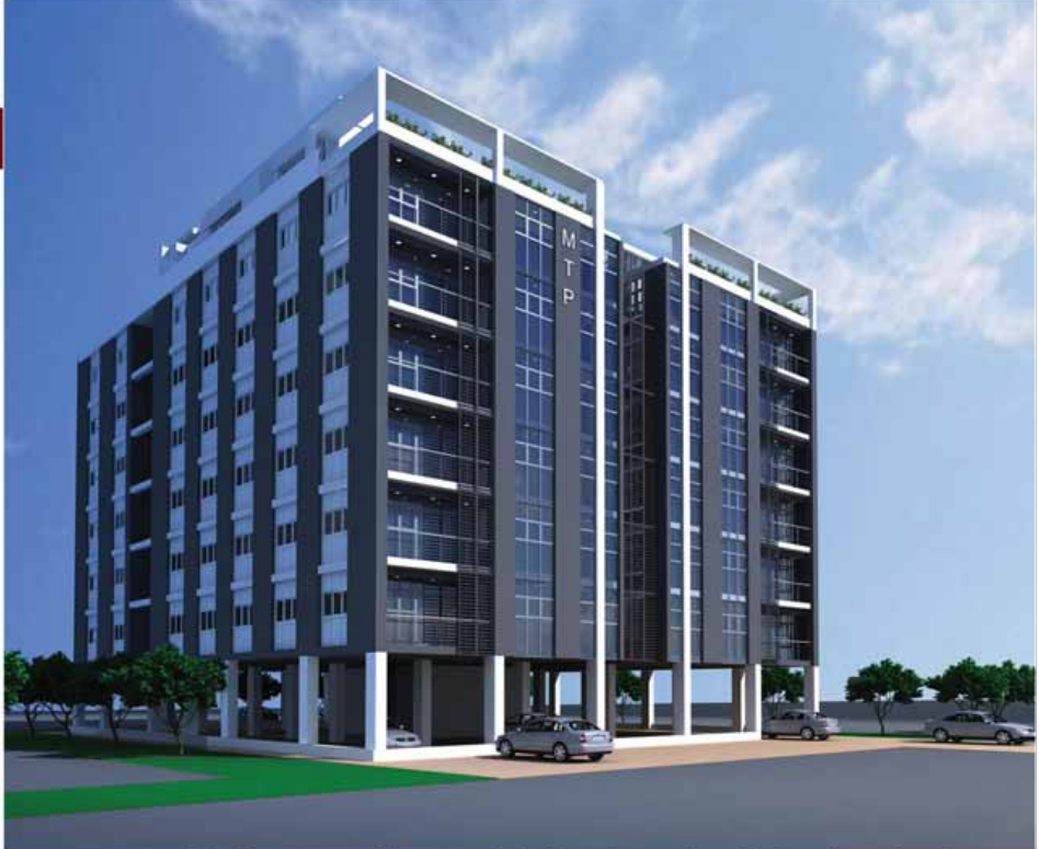
အမှတ်(၂၀) ၊ တောင်သိန္နီလမ်း ၊ (၂)ရပ်ကွက် ၊ မရမ်းကုန်းမြို့နယ် ၊ ရန်ကုန်။

Contact Address No.233/235,32nd St,Pabedan Tsp,Yangon, Myanmar. Office : 01 386802, 01 388415. HP : 09 73204167, 09 5011446 Email : info@mtp-construction.com