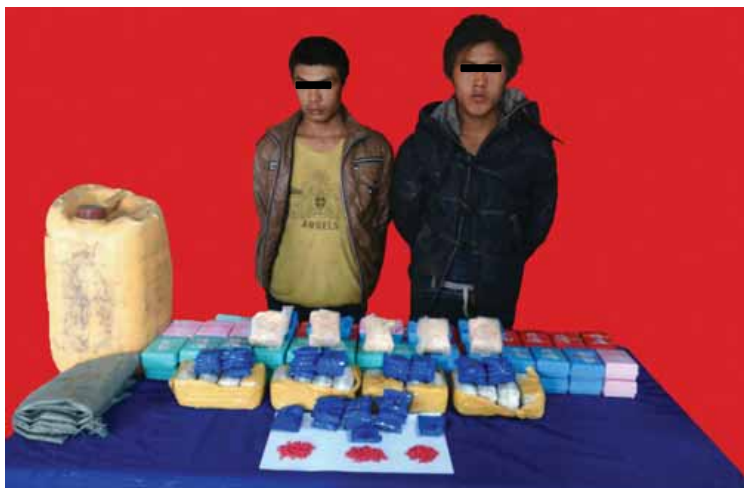
မဘိမ်းမြို့နယ်တွင် စိတ်ကြွေးသွပ်ဆေးပြားနှင့် ဘိန်းဖြူများ သိမ်းဆည်းရမိ