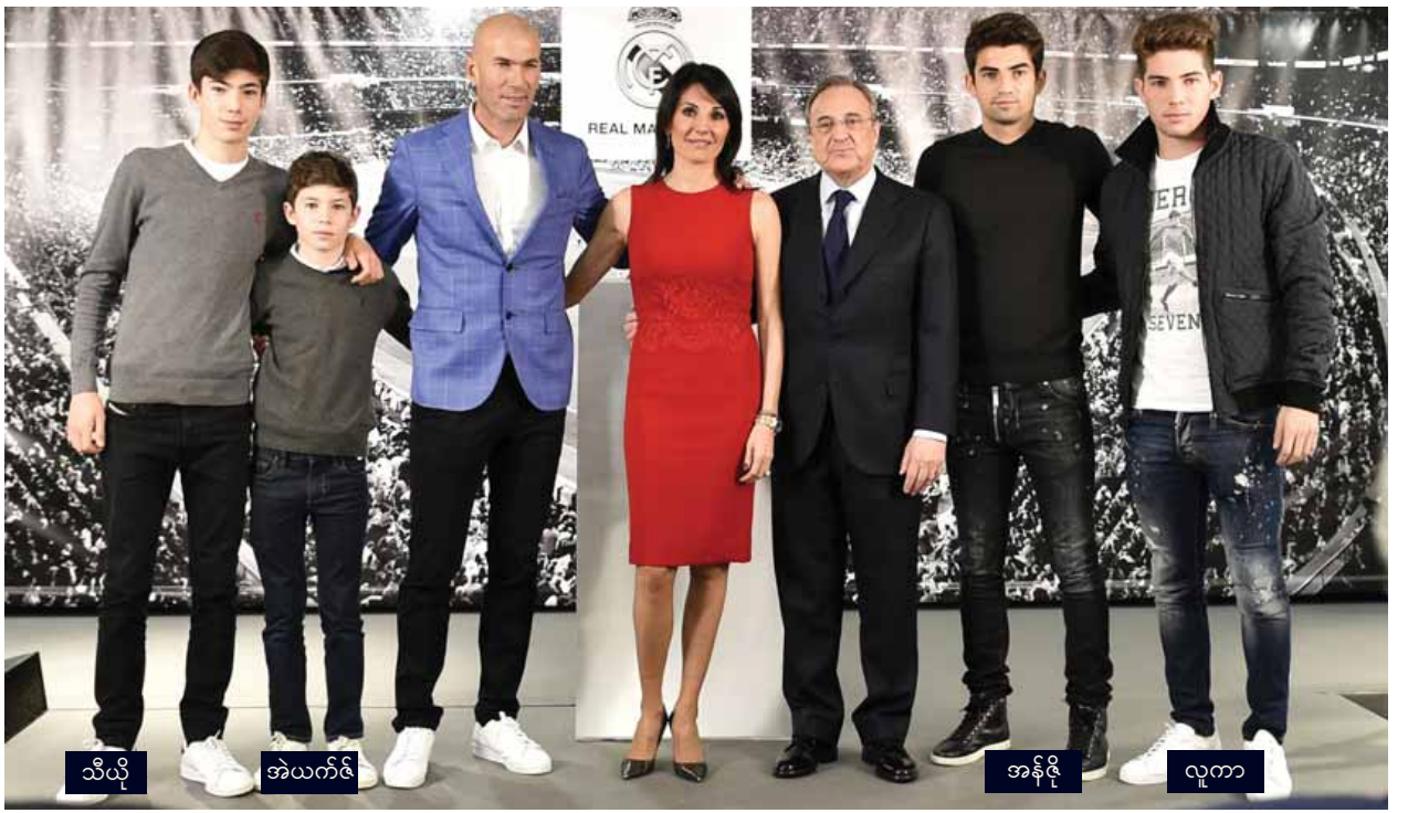
ဇန်နဝါရီ ၄ ရက်က ဂျီယာနီယာလ်အား ပြောင်းအရွှေ့ ခန့်အပ်ခံရသူ ဂျီယာနီယာလ်အား ဖီဖာ၏ ၃၉ ဦး စစ်ဆေးမှုတွင် အမည်စာရင်းပါဝင်နေသူ သားလေးဦးအား အတူ တွေ့ရစဉ်။

ဂျီယာနီယာလ်အား ဖီဖာရဲ့ စုံစမ်းစစ်ဆေးမှုခံနေရပြီး ဒီပြဿနာနောက်ကွယ်မှာ ကစားသမားရပ်စဲရေး အမည်က အဓိကနေရာမှာ ပါဝင်နေတယ်လို့ ဂျီယာနီယာလ်အား ဖီဖာရဲ့ စုံစမ်းစစ်ဆေးမှုခံနေရပြီး ဒီပြဿနာနောက်ကွယ်မှာ ကစားသမားရပ်စဲရေး အမည်က အဓိကနေရာမှာ ပါဝင်နေတယ်လို့