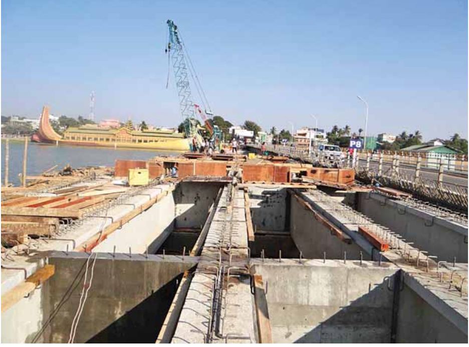
တိုးဝိတ်ထိ)အရှည် ၁၄ မိုင် ၄ ဖာလုံရှိ မိတ္ထီလာမြို့ရှောင် တစ်လမ်းမှ ဖြေလျော့ပေးနိုင်မည်ဖြစ်ပြီး ခရီးသွား လမ်းတို့ပြီးစီးသွားပါက မိတ္ထီလာမြို့တွင်းလမ်း ယာဉ်အန္တရာယ် ပြည်သူများလည်း စိတ်ချမ်းမြေ့စွာ သွားလာနိုင်မည်ဖြစ် ကင်းရှင်းရေးနှင့် ယာဉ်ကြောပိတ်ဆို့မှုတို့ကို တစ်ဖက် ကြောင်း သိရသည်။ (သတင်းစဉ်)

ယင်းနောက် လမ်းဦးစီးဌာန မိတ္ထီလာခရိုင်မှ ကြီးကြပ် ဆောင်ရွက်သော ရန်ကုန်-မန္တလေး ပြည်ထောင်စု လမ်းမကြီး မိုင်တိုင်(၃၃၀/၄) (ရွှေဘုန်းပွင့်ဘုရား)မှ မိုင်တိုင် (၃၄၉/၃) (သပြေဝတိုးဝိတ်ထိ) စုစုပေါင်း အရှည် ၁၄ မိုင် ၄ ဖာလုံရှိ မိတ္ထီလာမြို့ရှောင်လမ်းအား ဖြတ်သန်း ကြည့်ရှုစစ်ဆေးပြီး သော်တာဝင်ဆောင်ရွက်လုပ်နေမှုကို မှ တာဝန်ယူဆောင်ရွက်သော ၉ မိုင် ၂ ဖာလုံ နှင့် ယူဇန ကုမ္ပဏီမှဆောင်ရွက်သော ၅ မိုင် ၂ ဖာလုံ အပိုင်းတို့၏ လမ်းအခြေအနေနှင့် မန္တလေးတိုင်းဒေသကြီး မိတ္ထီလာ- ကျောက်ပန်းတောင်း လမ်းပေါ်ရှိ မိတ္ထီလာကန်ကူးတံတား လေးလမ်းသွား တိုးချဲ့တည်ဆောက်ခြင်းလုပ်ငန်းများနှင့် ရန်ကုန်-မန္တလေး ပြည်ထောင်စုလမ်းမကြီး မိုင်တိုင် (၃၃၀/၄)(ရွှေဘုန်းပွင့်ဘုရား)မှ မိုင်တိုင်(၃၄၉/၃) (သပြေ