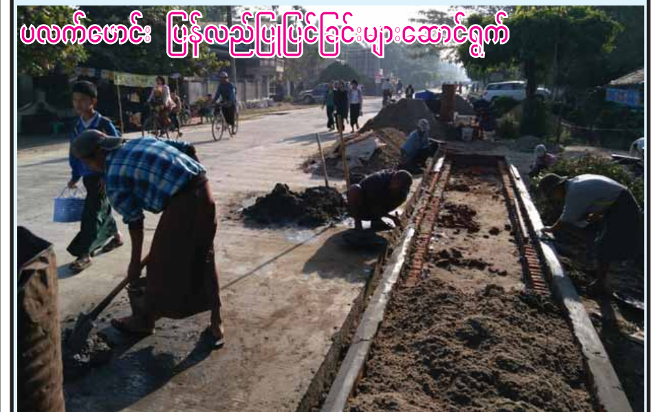
ဧရာဝတီတိုင်းဒေသကြီး ကျုံပျော်မြို့တွင်း သွားလာမှုအဆင်ပြေစေရေးအတွက် မြို့နယ်စည်ပင်သာယာရေးအဖွဲ့က ပလက်ဖောင်းများကို ပြန်လည်ပြုပြင်ခြင်းပျားဆောင်ရွက် ယခင်က မြို့တွင်းလမ်းမှာ ကတ္တရာလမ်းဖြစ်ပြီး ယခုအခါ ရွက်လက်မအမြင့်ရှိ ကွန်ကရစ်လမ်းအဖြစ် အဆင်ပြေ တင်ဆောင်ရွက်ခဲ့သောကြောင့် လမ်းအမြင့်နှင့်အညီ အဆင်ပြေစွာသွားလာနိုင်ရန် ယခုကဲ့သို့ ပလက်ဖောင်းများ ပြန်လည်ပြုပြင်ဆောင်ရွက်ခြင်းဖြစ်ကြောင်း သိရသည်။ နေဝင်းမြင့် (ပြန်/ဆက်)

ရှင်းလင်းပြောကြားသည်။ အဆိုပါချေးငွေပေးအပ်ပွဲတွင် ကနီမြို့နယ်အတွင်းရှိ အခြေခံသမဝါယမအသင်း ၁၇၇ သင်းမှ အသင်းသား ၁၂၅၂၃ ဦးအတွက် ကျပ်သိန်းပေါင်း ၁၅၃၂၉ သိန်းကို (EXIM Bank) ချေးငွေကျပ်သန်း ၄၀၀ မှ ထုတ်ချေးပေးခဲ့ခြင်းဖြစ်ကြောင်း သိရသည်။ အဆိုပါ ချေးငွေပေးအပ်ပွဲတွင် မြို့နယ်အတွင်း ယခင်နှစ် (EXIM Bank) ချေးငွေကျပ်သိန်း ၁၀၀ အထက်၊ ၅၁ သိန်းမှ သိန်း ၁၀၀ အထိနှင့် သိန်း ၅၀ အောက် ထုတ်ချေးမှုတွင် ပြန်လည်ပေးချေနိုင်ခဲ့သည့် အသင်းများထဲမှ ဆုရရှိသောအသင်းများကို မြို့နယ်သမဝါယမအသင်းစုမှ ဆုများပြန်လည်ပေးအပ်ခဲ့ကြောင်း သိရသည်။ သန်းဌေးအောင်(ကနီ)