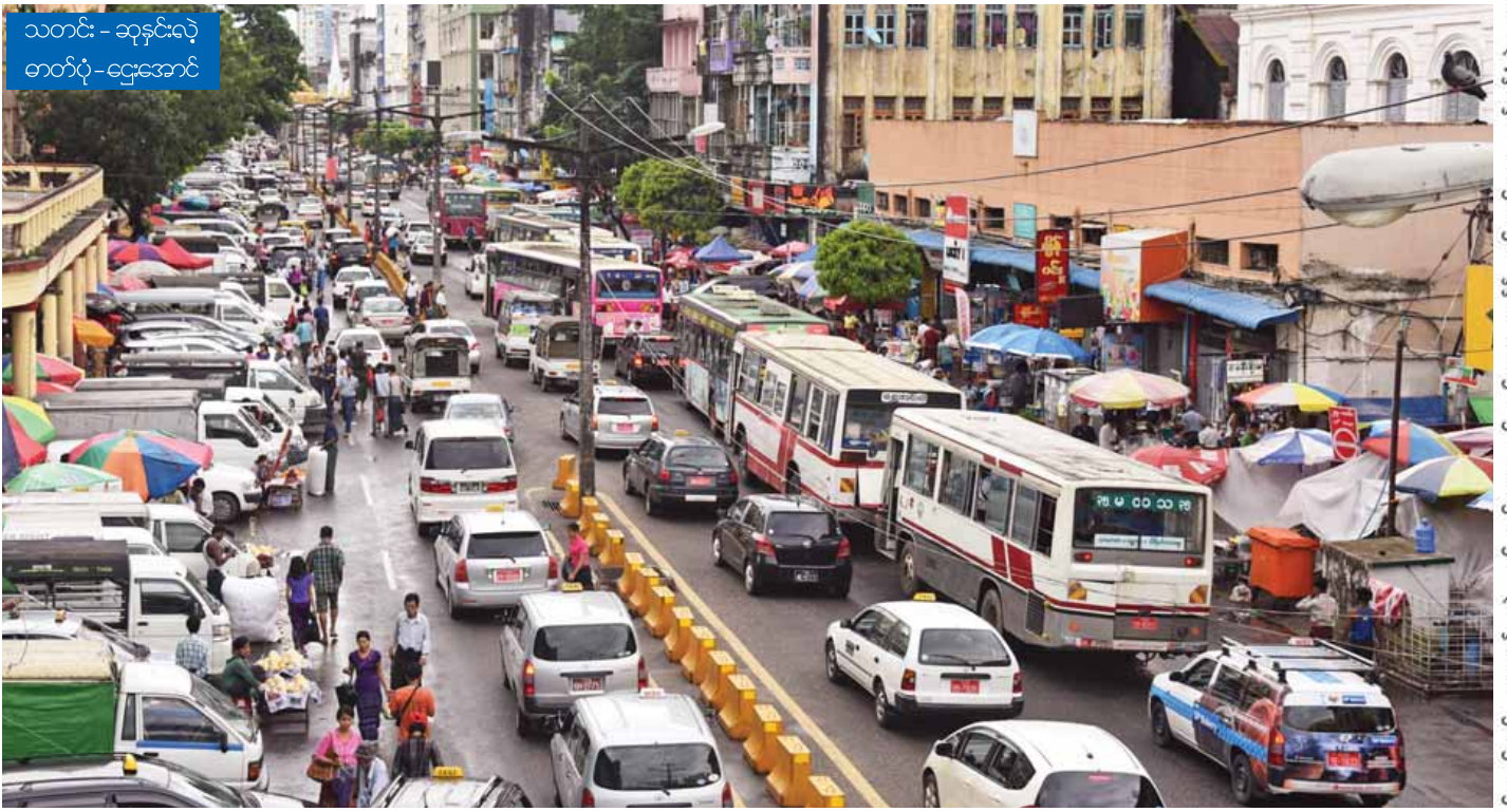
သတင်း - ဆုနှင့်လုံ

“ဘတ်စ်ကားတွေက ရောက်နေပါပြီ။ အရင်က ဘတ်စ်ကားတွေနဲ့မတူဘဲ Brand New တွေဖြစ်ပါတယ်။ အဲကွန်းစနစ်တွေလည်းကောင်းတယ်။ လောလောဆယ် တရုတ်က ကား ၁၅ စီး ရောက်နေပါပြီ။ ယာဉ်မောင်း တွေလည်း ခေါ်ယူထားပြီးဖြစ်သလို ကတ်စနစ်နဲ့ ငွေပေး ချေစနစ်အတွက်လည်း စာမျက်နှာ ၃ ကော်လံ ၅ သို့ ❖