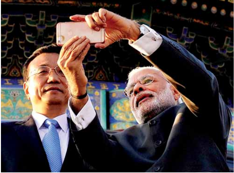
အိန္ဒိယဝန်ကြီးချုပ် နာရိန္ဒြာမိုဒီနှင့် တရုတ်ဝန်ကြီးချုပ် လီအချန်းတို့ ဆယ်စိစာတပ် ရိုက်ကူးနေစဉ်။