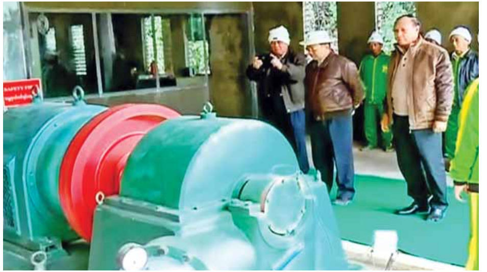
များကို ဝန်ထမ်းများအား မှာကြားသည်။ မှုနှင့် ဝန်ထမ်းအိမ်ရာများကို ကြည့်ရှုစစ်ဆေးခဲ့သည်။ (သတင်းစဉ်)

လဟယ် ဇန်နဝါရီ ၁၅ နိုင်ငံတော်သမ္မတ၏ နာဂဒေသခရီးစဉ်တွင် အဖွဲ့ဝင် များအဖြစ် လိုက်ပါလာသော ပြည်ထောင်စုဝန်ကြီး ဦးလှထွန်း၊ ဦးဝင်းထွန်း၊ ဦးခင်မောင်စိုး၊ တိုင်းဒေသကြီး ဝန်ကြီးချုပ် ဦးသာအေး၊ ဦးရဲမြင့် တို့သည် နာဂကိုယ်ပိုင် အုပ်ချုပ်ခွင့်ရဒေသ ဦးစီးအဖွဲ့၊ ဥက္ကဋ္ဌ ဦးရဲစွဲနှင့် တာဝန်ရှိသူများနှင့်အတူ ယနေ့မုန်းလွဲပိုင်းတွင် နာဂရိုးရာ နှစ်သစ်ကူးအထိမ်းအမှတ် အားကစားပြိုင်ပွဲများ ကျင်းပ သည့် လဟယ်မြို့၊ ရွှေပြည်သာအားကစားကွင်းသို့ သွား ရောက်ကြည့်ရှုအားပေးကြသည်။ နှစ်သစ်ကူးအထိမ်းအမှတ် အားကစားပြိုင်ပွဲအဖြစ် ကျင်းပသည့် သံလုံးပစ်မြိုင်ပွဲ၊ ပိုက်ကျော်ခြင်း၊ ဘော်လီ