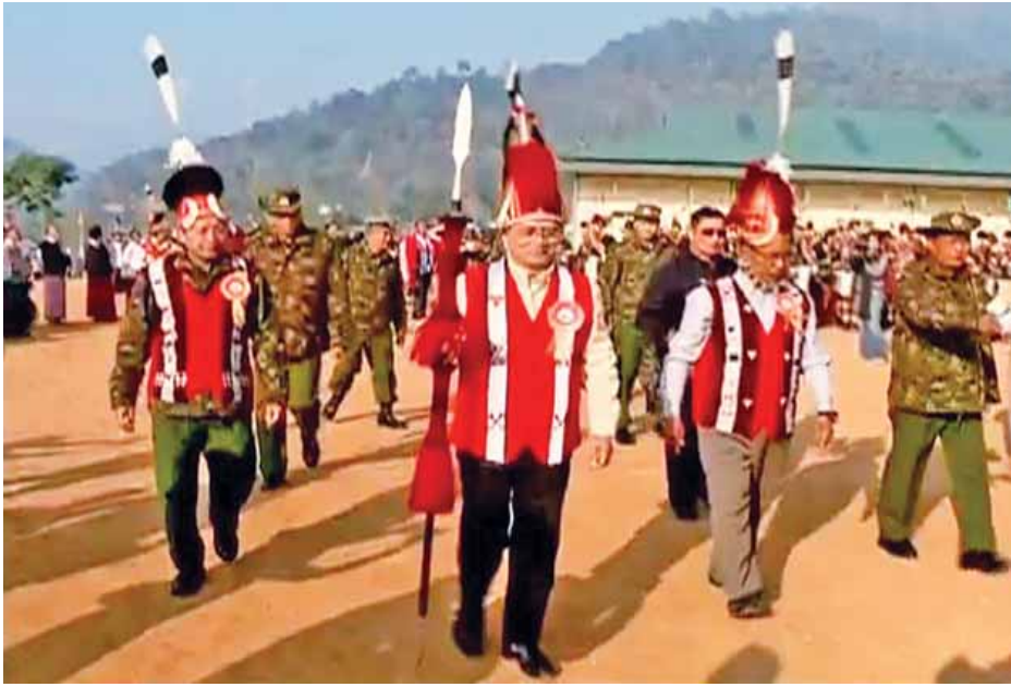
နိုင်ငံတော်သမ္မတ ဦးသိန်းစိန် နာဂရိုးရာနှစ်သစ်ကူးပွဲတော် တက်ရောက်စဉ်။ (သတင်းစဉ်)

ပွဲတော်အတွင်း သီးနှံများတိုးတက်ဖြစ်ထွန်းပြီး ရာသီဥတုကောင်းမွန်စေရန် အိမ်မွေးတိရစ္ဆာန်များ ရောဂါဘယကင်းဝေးစေရန် ဆုမွန်ကောင်းများတောင်းကြ သော ပွဲတော်တစ်ခုလည်းဖြစ်သည့်အတွက် ကောင်းမြတ်တဲ့အစဉ်အလာဖြစ်။