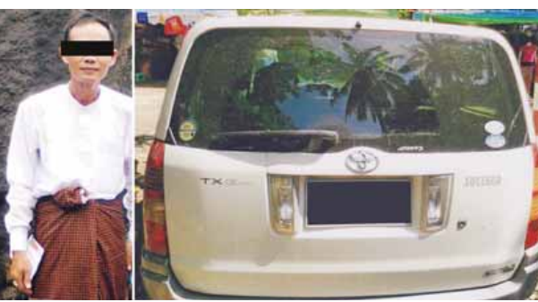
လားရှိုး ဇန်နဝါရီ ၁၅