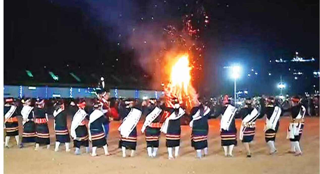
လဟယ်မြို့၌ ၂၀၁၆ ခုနှစ် နာဂရိုးရာနှစ်သစ်ကူးပွဲတော် မီးပုံပွဲကျင်းပစဉ်။ (သတင်းစဉ်)

လဟယ် ဇန်နဝါရီ ၁၅ ၂၀၁၆ ခုနှစ် နာဂရိုးရာနှစ်သစ်ကူးပွဲတော် မီးပုံပွဲအခမ်းအနားကို ယနေ့ ညပိုင်းတွင် လဟယ်မြို့၊ ရွှေပြည်သာအားကစားကွင်း၌ ကျင်းပရာ နိုင်ငံတော် သမ္မတ ဦးသိန်းစိန်နှင့်အဖွဲ့ တက်ရောက်အားပေးသည်။ ရှေးဦးစွာ တိုင်းဒေသကြီးဝန်ကြီးချုပ် ဦးသာအေး၊ နာဂကိုယ်ပိုင်အုပ်ချုပ် ခွင့်ရဒေသ ဦးစီးအဖွဲ့ဥက္ကဋ္ဌ ဦးရဲစံကြီးနှင့် နာဂရိုးရာ ဗဟိုကော်မတီဒုတိယ ဥက္ကဋ္ဌ ဦးနောင်ခွန်တို့က နာဂရိုးရာ မီးထင်းပုံကို မီးထွန်းညှိပေးကြသည်။ ထို့နောက် လဟယ်မြို့၊ နာဂကိုယ်ပိုင်အုပ်ချုပ်ခွင့်ရဒေသ လူငယ်အဖွဲ့က စာရိမေရီ သက်သေအကနှင့် ဟရိုတ်နတ်ညို ရိုးရာယဉ်ကျေးမှုအကတို့ကိုလည်း ကောင်း၊ ယမ်းကြိုး၊ လောနောက်ကုန်းနှင့် စာမျက်နှာ ၃ ကော်လံ ၁ သို့