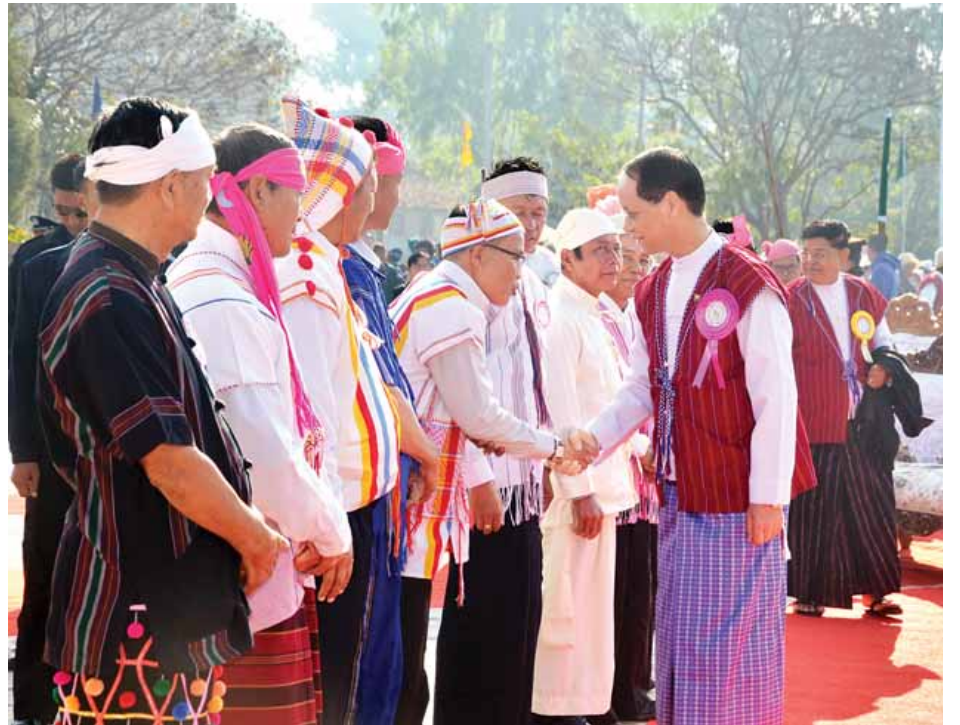
ဒုတိယသမ္မတ ဒေါက်တာစိုင်းမောင်ခမ်း ကယားပြည်နယ်နေ့ အခမ်းအနားသို့ တက်ရောက်လာသည့် ဒေသခံ ပြည်သူများအား ရင်းရင်းနှီးနှီး နှုတ်ဆက်စဉ်။ (သတင်းစဉ်)

ပထမဦးဆုံးသော ကယားပြည်နယ်နေ့ အခမ်းအနား ကို ၁၉၅၂ ခုနှစ် ဇန်နဝါရီ ၁၅ ရက်တွင် ကယားပြည်နယ် ၏ နာမကရဏသဘင်အဖြစ် စည်ကားသိုက်မြိုက်စွာ စတင်ကျင်းပခဲ့ရာ ယနေ့ဆိုလျှင် (၆၄) နှစ်မြောက်ခဲ့ပြီ