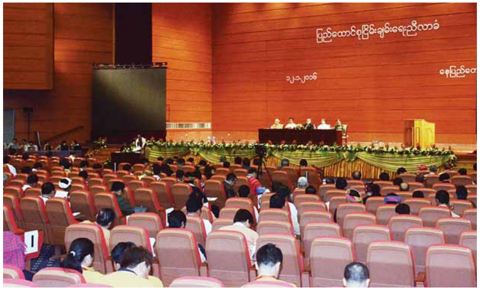
သုံးဦးစီဖြင့် ဖက်ကြားသွားမည်ဖြစ်ပြီး အစိုးရအစုအဖွဲ့မှ အစုအဖွဲ့မှ တစ်ဦး၊ တိုင်းရင်းသားလက်နက်ကိုင် အစုအဖွဲ့မှ နှစ်ဦး၊ လွှတ်တော်အစုအဖွဲ့မှ နှစ်ဦး၊ တပ်မတော်အစုအဖွဲ့မှ သုံးဦး၊ နိုင်ငံရေးပါတီများ အစုအဖွဲ့မှ သုံးဦး၊ တိုင်းရင်းသား ရွေးချယ်မည်ဖြစ်ကြောင်း သိရသည်။ (သတင်းစဉ်)

ပထမအကြိမ် ပြည်ထောင်စုငြိမ်းချမ်းရေး ညီလာခံ စုံညီအစည်းအဝေးနောက်ဆုံးနေ့တွင် ကဏ္ဍအလိုက် ဆွေးနွေးတင်ပြချက်များကို ကဏ္ဍတစ်ခုလျှင် ကိုယ်စားလှယ်