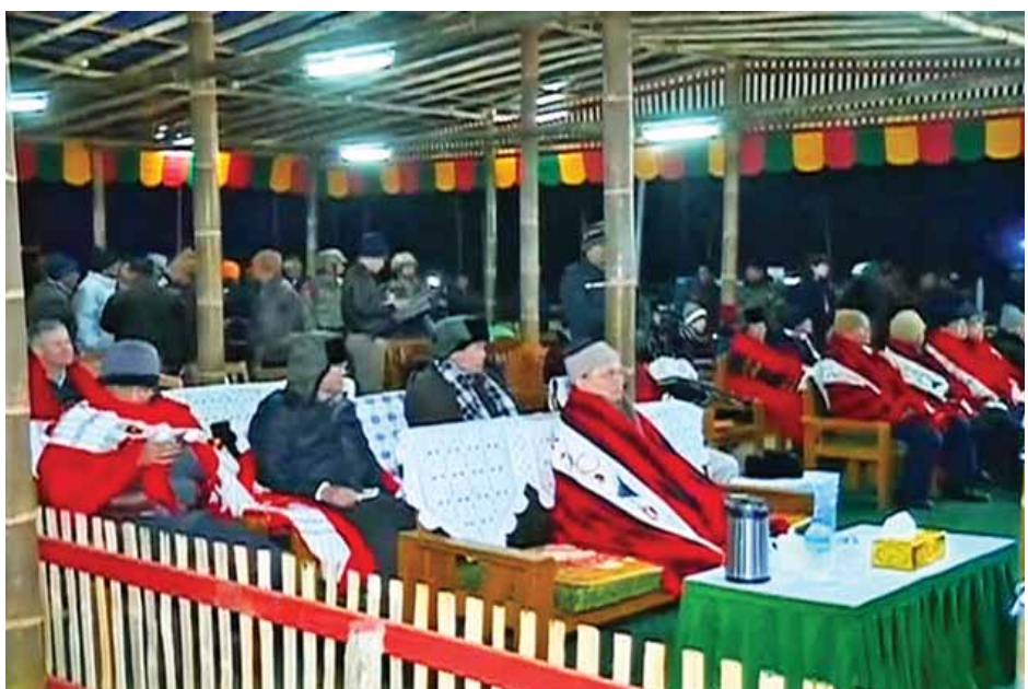
နိုင်ငံတော်သမ္မတ ဦးသိန်းစိန် နာဂရိုးရာနှစ်သစ်ကူးပွဲတော် မီးပုံပွဲကို တက်ရောက်အားပေးစဉ်။