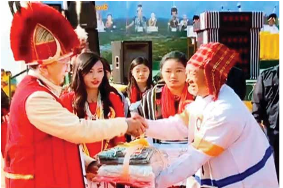
နိုင်ငံတော်သမ္မတ ဦးသိန်းစိန် ဒေသဖွံ့ဖြိုးရေးအတွက် ထောက်ပံ့ပစ္စည်းများ ပေးအပ်စဉ်။ (သတင်းစဉ်)

ထို့နောက် အခမ်းအနား သဘာပတိက နိဂုံးချုပ်စကား ပြောကြားပြီး အခမ်းအနားကို ရုပ်သိမ်းလိုက်သည်။ အခမ်းအနားအပြီးတွင် နိုင်ငံတော်သမ္မတနှင့် အဖွဲ့သည် နာဂရိုးရာခေါင်ရည်နှင့် ရိုးရာအစားအစာများကို