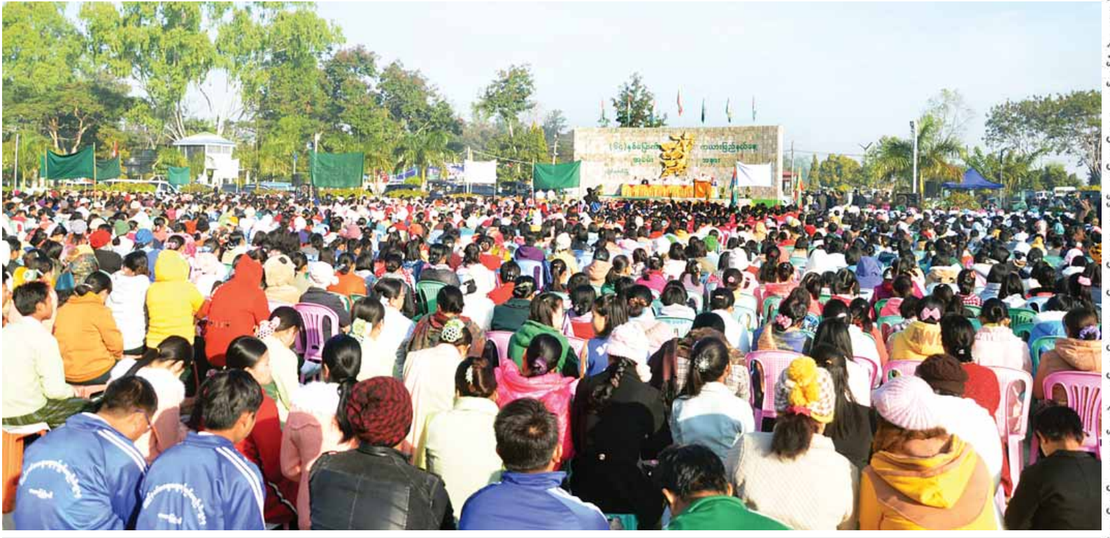
(၆၄)နှစ်မြောက် ကယားပြည်နယ်နေ့အခမ်းအနားကို လွိုင်ကော်မြို့ မင်းစုရပ်ကွက်ရှိ ကျောက်သားရင်ပြင်၌ ကျင်းပစဉ်။ (သတင်းစဉ်)

နေပြည်တော် ဇန်နဝါရီ ၁၅ (၆၄)နှစ်မြောက် ကယားပြည်နယ်နေ့ အခမ်းအနားကို ယနေ့နံနက် ၈ နာရီ တွင် လွိုင်ကော်မြို့ မင်းစုရပ်ကွက်ရှိ ကျောက်သားရင်ပြင်၌ ကျင်းပရာ ဒုတိယသမ္မတ ဒေါက်တာ စိုင်းမောက်ခမ်း တက်ရောက်၍ နိုင်ငံတော်သမ္မတထံမှပေးပို့သည့် သဝဏ်လွှာကို ဖတ်ကြားသည်။ အဆိုပါ အခမ်းအနားသို့ ပြည်ထောင်စုဝန်ကြီး ဒုတိယ ဗိုလ်ချုပ်ကြီးကိုကို ဦးစိုးသိန်း၊ ပြည်နယ် ဝန်ကြီးချုပ် ဦးခင်မောင်ဦး၊ ပြည်နယ် လွှတ်တော်ဥက္ကဋ္ဌ ဒုတိယဝန်ကြီးများ၊ ပြည်နယ်အစိုးရအဖွဲ့ ဝန်ကြီးများ၊ ပြည်နယ်လွှတ်တော်ကိုယ်စားလှယ်များ၊ ငြိမ်းချမ်းရေးအဖွဲ့အစည်း အသီးသီးမှ ကိုယ်စားလှယ်များ၊ ဌာနဆိုင်ရာ တာဝန်ရှိသူများ၊ လူမှုရေးအသင်းအဖွဲ့ များမှ ကိုယ်စားလှယ်များ၊ ကျောင်းသား ကျောင်းသူများ၊ တိုင်းရင်းသားရိုးရာ ယဉ်ကျေးမှုအဖွဲ့များနှင့် ဒေသခံပြည်သူ စုစုပေါင်းအင်အား ၃၄၀၀ ကျော် တက်ရောက်ကြသည်။ စာမျက်နှာ ၉ ကော်လံ ၁ သို့ *