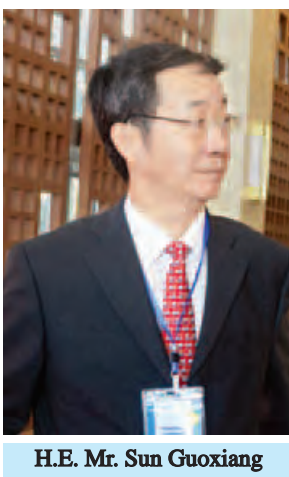
H.E. Mr. Sun Guoxiang

ပြည်ထောင်စု ငြိမ်းချမ်းရေး ညီလာခံကြီးသို့ အစိုးရအဖွဲ့မှ ကိုယ် စားလှယ်များ၊ လွှတ်တော်မှ ကိုယ်စား လှယ်များ၊ တပ်မတော်မှ ကိုယ်စား လှယ်များ၊ တိုင်းရင်းသားလက်နက် ကိုင်အဖွဲ့များမှ ကိုယ်စားလှယ်များ၊ နိုင်ငံရေးပါတီများမှ ကိုယ်စားလှယ် များ၊ တိုင်းရင်းသားကိုယ်စားလှယ်များ၊ တတ်သိပညာရှင်များနှင့် အခြားပါဝင် သင့်ပါဝင်ထိုက်သူများ စုံလင်စွာ တက်ရောက်ခဲ့ကြသည့်အပြင် မြန်မာ နိုင်ငံဆိုင်ရာ သံအမတ်ကြီးများ၊ ကုလသမဂ္ဂအဖွဲ့ရုံးမှ ကိုယ်စားလှယ် များနှင့် တရုတ်နိုင်ငံ၊ ဂျပန်နိုင်ငံနှင့် ကုလသမဂ္ဂမှ အထူးကိုယ်စားလှယ် များလည်း တက်ရောက်ခဲ့သည်။