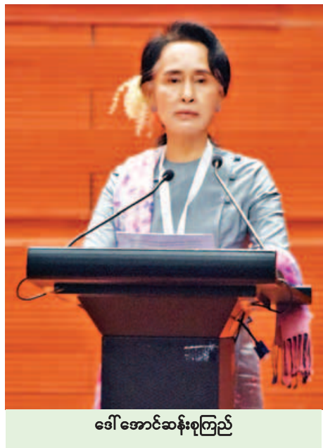
ဒေါ်အောင်ဆန်းစုကြည်

အမျိုးသားပြန်လည်သင့်မြတ်ရေးကို ငြိမ်းချမ်းရေးလုပ်ငန်းစဉ်လမ်းမှ လျစ်လျူရှုထား၍မရ၊ အမျိုးသားပြန်လည်သင့်မြတ်ရေး မရှိဘဲနှင့် တည်တံ့ခိုင်မြဲမည့် ငြိမ်းချမ်းရေးကို ဘယ်လိုမှ မတည်ဆောက်နိုင် ဒေါ်အောင်ဆန်းစုကြည်