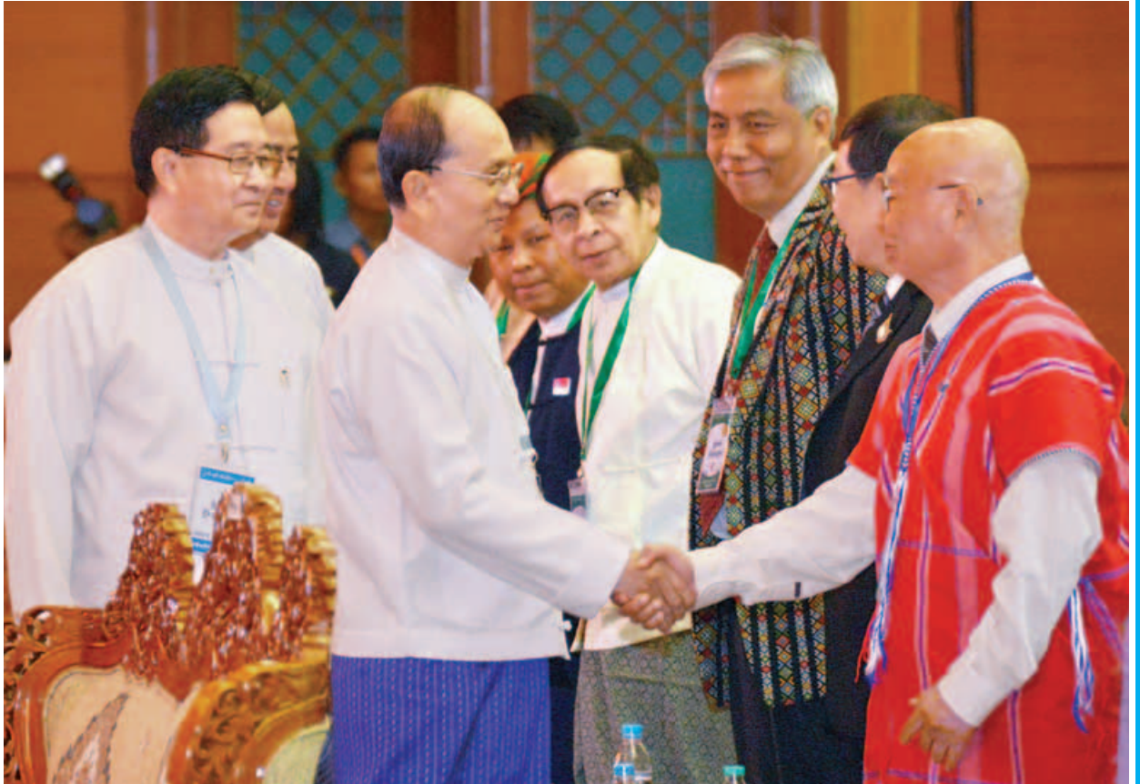
နိုင်ငံတော်သမ္မတဦးသိန်းစိန် ပြည်ထောင်စုငြိမ်းချမ်းရေးညီလာခံဖွင့်ပွဲအခမ်းအနားသို့ တက်ရောက်လာကြသူများအား ရင်းရင်းနှီးနှီးနှုတ်ဆက်စဉ်။

လက်တွေ့ကျပြီး အပြုသဘောဆောင်တဲ့ ဆွေးနွေးမှုများပြုလုပ်ပြီး တိုင်းပြည်အတွက် ရေရှည်အကျိုးဖြစ်ထွန်းစေမယ့် ဆွေးနွေးမှုတွေ၊ နိုင်ငံရေးရွေးချယ်မှုတွေနဲ့ သဘောတူညီမှုတွေရရှိအောင်ကြိုးပမ်းကြဖို့ အလေးအနက်တိုက်တွန်းပြောကြားရင်း နိဂုံးချုပ်အပ်ပါတယ်။