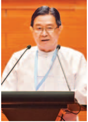
ဦးအောင်မင်း

ဆောင်ရွက်ပေးရန် ဤညီလာခံကြီးတွင် တာဝန်ရှိလာပြီဖြစ်ကြောင်း ပြောကြားသည်။ ထို့နောက် တပ်မတော်ကာကွယ်ရေးဦးစီးချုပ် ဗိုလ်ချုပ်မှူးကြီး မင်းအောင်လှိုင်က နှုတ်ခွန်းဆက်စကားပြောကြားရာတွင် နိုင်ငံတော်၏ သမိုင်း ကြောင်းနှင့် ရင်ဆိုင်ဖြတ်သန်းခဲ့ရသည့် တွေ့ကြုံမှုများအရ တပ်မတော်အနေဖြင့် မြန်မာနိုင်ငံတော်ကြီး ကမ္ဘာနှင့်အညီ ခေတ်နှင့်အမီ ဖွံ့ဖြိုးတိုးတက်လာစေရန် တည်ငြိမ်အေးချမ်းရေး၊ စည်းလုံးညီညွတ်ရေးနှင့် ဖွံ့ဖြိုးတိုးတက်ရေးတို့ကို ဆောင်ရွက်ပေးရန် ဤညီလာခံကြီးတွင် တာဝန်ရှိလာပြီဖြစ်ကြောင်း ပြောကြားသည်။