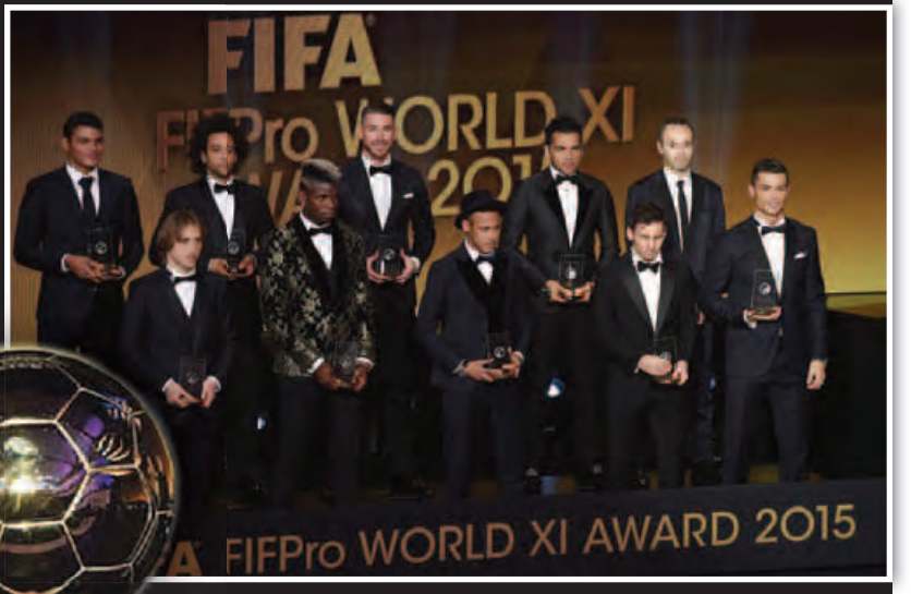
၁၀ နှစ်အတွင်း ဘလွန်းဒီအောဆု ရရှိသူများစာရင်း

ဇန်နဝါရီ ၁၁ ရက် ဇူရစ်မြို့၌ ပြုလုပ်သော ဘလွန်းဒီအောဆု (ကမ္ဘာ့အကောင်းဆုံးကစားသမား) ချီးမြှင့်ပွဲအခမ်းအနားတွင် အာဂျင်တီးနားနှင့် ဘာစီလိုနာတို့ကစားပွဲမှ လီယွန်နယ်မက်ဆီက စီရိုနယ်လ်ဒိုနှင့် နေမာတို့အား ကျော်ဖြတ်ကာ ငါးကြိမ်မြောက် ဆွတ်ခူးအဖြစ် ဆွတ်ခူးနိုင်ခဲ့သည်။ မက်ဆီက မဲအရေအတွက် ၄၁ ဒသမ ၃၃ ရာခိုင်နှုန်းရရှိခဲ့ပြီး စီရိုနယ်လ်ဒိုက ၂၇ ဒသမ ၇၆ ရာခိုင်နှုန်းဖြင့် ဒုတိယ၊ နေမာက ၇ ဒသမ ၈၆ ရာခိုင်နှုန်းဖြင့် တတိယနေရာရရှိခဲ့ကြသည်။