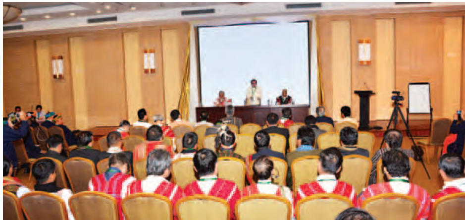
ပြည်ထောင်စုငြိမ်းချမ်းရေးညီလာခံအစုအဖွဲ့အလိုက် ဆွေးနွေးပွဲများ ကျင်းပစဉ်။