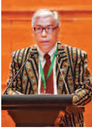
ဒေါက်တာဆလိုင်လျန်မူန်းဆာခေါင်း

အခြေခံလိုအပ်ချက်အဖြစ် အစဉ်တစိုက်တည်ကြည်လေးနက်စွာ ခံယူကျင့်သုံး လျက်ရှိပါကြောင်း၊ ၎င်းအချက်များကို အောင်မြင်စွာ အကောင်အထည်ဖော် နိုင်ရေးအတွက်လည်း တပ်မတော်အနေဖြင့် နိုင်ငံတော်နှင့် ပြည်သူအပေါ်တွင် မယိမ်းယိုင်သည့် သစ္စာတရားဖြင့် ခေတ်အဆက်ဆက် အကောင်အထည်ဖော် ဆောင်ရွက်ခဲ့ပါကြောင်း၊ စစ်မှန်သည့် ဒီမိုကရေစီစနစ်အတွက် မိမိတို့နိုင်ငံ၏ ပထမဦးဆုံးနှင့် အရေးကြီးဆုံးလိုအပ်ချက်မှာ တည်ငြိမ်အေးချမ်းရေး ဖြစ်ပါ ကြောင်း။ တပ်မတော်အနေဖြင့် ငြိမ်းချမ်းရေးအမှန်တကယ်ရရှိစေလိုသော စိတ် ရင်းအမှန်ဖြင့် ပြည်သူလူထုအကျိုးစီးပွားအတွက် ဒီမိုကရေစီအရေးသုံးပါးကို ဦးထိပ်ပန်ဆင် ဆောင်ရွက်လျက်ရှိပါကြောင်း၊ ငြိမ်းချမ်းရေးဆောင်ရွက်သည့် နေရာတွင် ယခင် အတွေ့အကြုံများအရ စစ်မှန်သည့် ထာဝရငြိမ်းချမ်းရေးကို ခိုင်ခိုင်မာမာဆောင်ရွက်နိုင်ရန် တပ်မတော်အနေဖြင့် ငြိမ်းချမ်းရေးဆိုင်ရာမူဝါဒ (၆) ချက်ကို ချမှတ်အကောင်အထည်ဖော်ခဲ့ပါကြောင်း။ တိုင်းရင်းသား လက်နက်ကိုင်အဖွဲ့အစည်း ညီအစ်ကိုများအားလုံး ပြန် လည်သင့်မြတ်ရေးအတွက် အပစ်အခတ်ရပ်စဲရေးဆောင်ရွက်ခဲ့ရာတွင်လည်း တန်းတူအခွင့်အရေးပေးပြီး အပြန်အလှန်ယုံကြည်မှု၊ လေးစားမှု၊ စာနာ ထောက်ထားမှုများနှင့် မိမိဆန္ဒကို ရှေ့တန်းမတင်ဘဲ နိုင်ငံတော်၏အကျိုးကို သယ်ပိုးထမ်းဆောင်လိုသည့် စိတ်နှင့် စိတ်ရှည်သည်းခံစွာ ဆွေးနွေးညှိနှိုင်းခဲ့