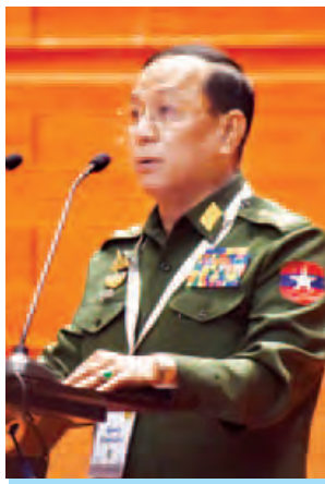
ဒုတိယဗိုလ်ချုပ်ကြီးရဲအောင်

နိုင်ငံ၏ ပြဿနာအရပ်ရပ်ကို ဖြေရှင်းရန် အားလုံးလိုလားကြသော်လည်း ပြဿနာအပေါ်တွင် ရှုမြင်သည့်အမြင်များသည် ကွဲပြားခြားနားမှု ရှိတတ်ကြပါကြောင်း၊ ပြဿနာ၏အဖြေကို ချဉ်းကပ်သည့်လမ်းကြောင်းလည်း မတူညီကြပါကြောင်း၊ နိုင်ငံ၏အရေးပါသည့် Institutions များ၏ အတွေးအခေါ် တည်ဆောက်မှုများ မတူညီကြပါကြောင်း၊ ပထဝီအရကွဲပြားနေကြသကဲ့သို့ တိုင်းရင်းသားလူမျိုးများ၏ သမိုင်းနောက်ခံများနှင့် ရုန်းကန်မှုများ