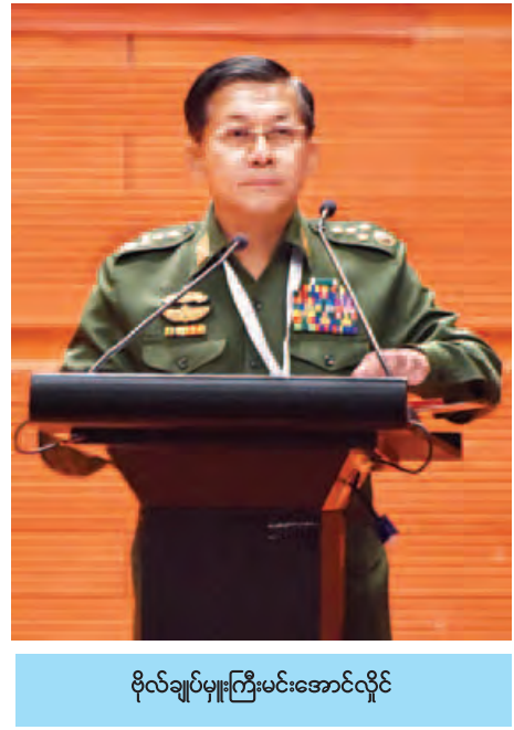
ဗိုလ်ချုပ်မှူးကြီးမင်းအောင်လှိုင်

ခြေရာခံခြင်းချမ်းရေးမှ အခမ်းအနားသို့ ဒုတိယသမ္မတ ဒေါက်တာစိုင်းမောက်ခမ်း၊ ပြည်ထောင်စု လွှတ်တော်နာယက ပြည်သူ့လွှတ်တော်ဥက္ကဋ္ဌ သူရဦးရွှေမန်း၊ အမျိုးသား လွှတ်တော်ဥက္ကဋ္ဌ ဦးခင်အောင်မြင့်၊ ပြည်ထောင်စုတရားသူကြီးချုပ် ဦးထွန်းထွန်းဦး၊ တပ်မတော်ကာကွယ်ရေးဦးစီးချုပ် ဗိုလ်ချုပ်မှူးကြီးမင်းအောင်လှိုင်၊ နိုင်ငံတော်ဖွဲ့စည်းပုံအခြေခံဥပဒေဆိုင်ရာ ခုံရုံးဥက္ကဋ္ဌ ဦးမြသိန်း၊ ပြည်ထောင်စု ရွေးကောက်ပွဲကော်မရှင်ဥက္ကဋ္ဌ ဦးတင်အေး၊ ဒုတိယတပ်မတော်ကာကွယ်ရေး ဦးစီးချုပ် ကာကွယ်ရေးဦးစီးချုပ်(ကြည်း) ဒုတိယဗိုလ်ချုပ်မှူးကြီးစိုးဝင်း၊ ပြည်ထောင်စုဝန်ကြီးများ၊ ပြည်ထောင်စုရှေ့နေချုပ်၊ တပ်မတော်အရာရှိကြီးများ၊ ဒုတိယဝန်ကြီးများ၊ လွှတ်တော်ကိုယ်စားလှယ်များ၊ တိုင်းရင်းသားလက်နက်ကိုင် အဖွဲ့အစည်းများမှ ခေါင်းဆောင်များနှင့် ကိုယ်စားလှယ်များ၊ နိုင်ငံရေးပါတီများမှ ကိုယ်စားလှယ်များ၊ တိုင်းရင်းသားကိုယ်စားလှယ်များ၊ သံအမတ်ကြီးများနှင့် သံတမန်များ၊ ကုလသမဂ္ဂအဖွဲ့အစည်းများနှင့် နိုင်ငံတကာအဖွဲ့အစည်းများမှ ကိုယ်စားလှယ်များ၊ လေ့လာသူများ၊ အထောက်အကူပြုအဖွဲ့များနှင့် အထူး ဖိတ်ကြားထားသူများ တက်ရောက်ကြသည်။ အခမ်းအနားတွင် နိုင်ငံတော်သမ္မတ ဦးသိန်းစိန်က အဖွင့်မိန့်ခွန်း ပြောကြားသည်။ (နိုင်ငံတော်သမ္မတ၏မိန့်ခွန်းကို ရှေးစာဖတ်နာတွင် သီးခြား ဖော်ပြထားပါသည်။) ထို့နောက် နိုင်ငံတော်သမ္မတသည် အခမ်းအနားသို့ တက်ရောက်လာသည့် ဧည့်သည်တော်များနှင့် ကိုယ်စားလှယ်များအား ရင်းရင်းနှီးနှီးလိုက်လံ နှုတ်ဆက်ပြီး အခမ်းအနားမှ ပြန်လည်ထွက်ခွာသွားသည်။