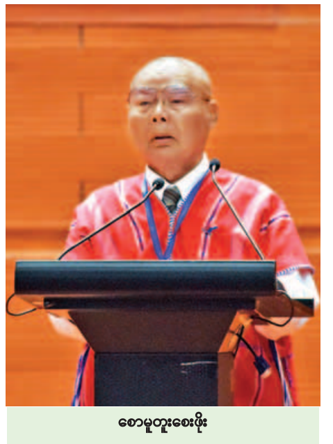
စောမူတူးစေးဖိုး