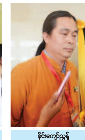
ဦးကျော်ညွန့်

နှာသစ်တစ်ခု ဖွင့်လှစ်ပြန်ခြင်း ဖြစ်သည်။ တစ်နိုင်ငံလုံးပစ်ခတ် တိုက်ခိုက်မှုရပ်စဲရေးစာချုပ် (NCA) ကို တိုင်းရင်းသားလက်နက်ကိုင် အဖွဲ့အစည်း(၈)ဖွဲ့မှ လက်မှတ် ရေးထိုးခဲ့ပြီး (၈၈)ရက်မြောက်နေ့တွင် ယခုကဲ့သို့ ပြည်ထောင်စုငြိမ်းချမ်းရေး ညီလာခံကို ကျင်းပနိုင်ခြင်း ဖြစ်သည်။