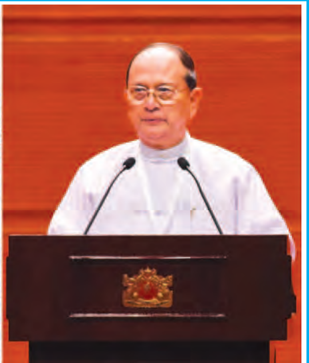
နိုင်ငံတော်သမ္မတ ဦးသိန်းစိန် ပြည်ထောင်စုငြိမ်းချမ်းရေးညီလာခံဖွင့်ပွဲအခမ်းအနားတွင် အဖွင့်မိန့်ခွန်းပြောကြားစဉ်။