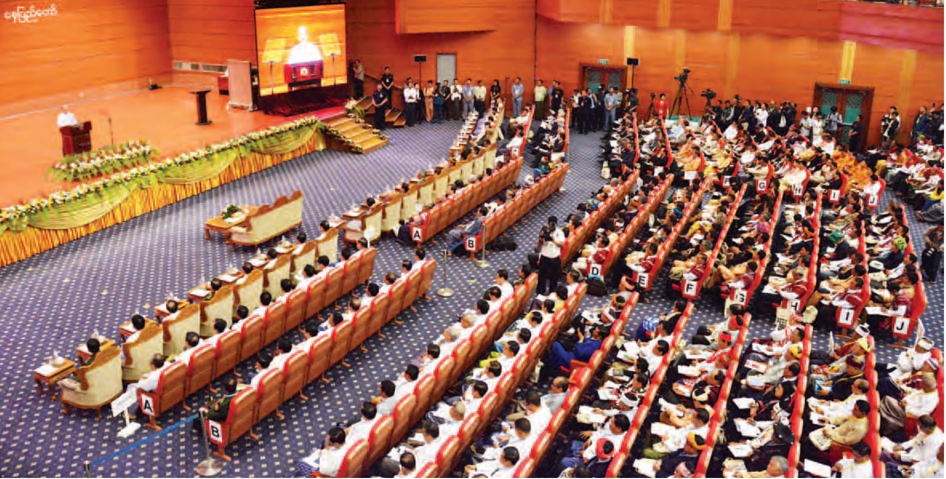
ပြည်ထောင်စုငြိမ်းချမ်းရေးညီလာခံ ဖွင့်ပွဲအခမ်းအနား ကျင်းပစဉ်။ (သတင်းစဉ်)

ပြည်ထောင်စုငြိမ်းချမ်းရေးညီလာခံဖွင့်ပွဲအခမ်းအနားကို ယနေ့နံနက် ၉ နာရီတွင် နေပြည်တော်ရှိ မြန်မာအပြည်ပြည်ဆိုင်ရာ ကွန်ဗင်းရှင်းဗဟိုဌာန - ၂ (MICC-2) ၌ ကျင်းပရာ နိုင်ငံတော်သမ္မတ ဦးသိန်းစိန် တက်ရောက် မိန့်ခွန်းပြောကြားသည်။ စာမျက်နှာ ၈ ကော်လံ ၁ သို့ ၂