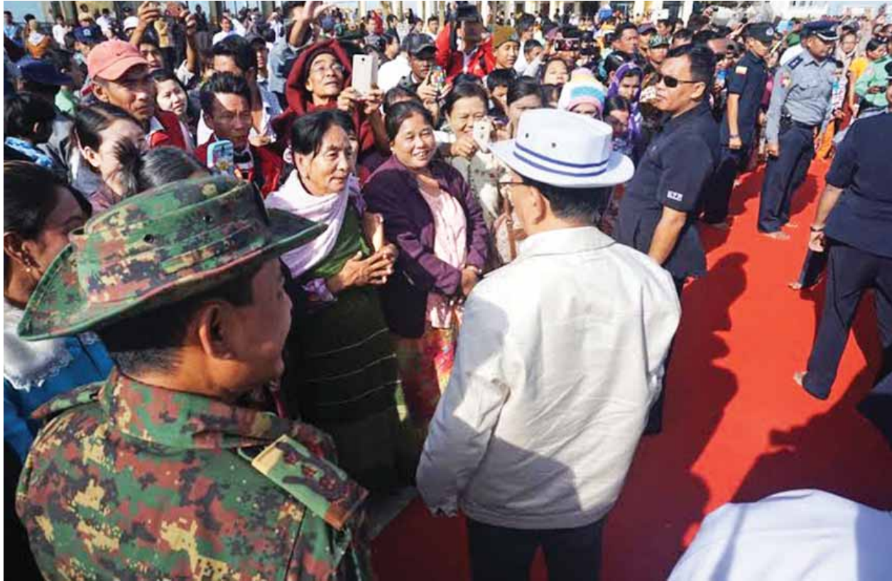
နိုင်ငံတော်သမ္မတ ဦးသိန်းစိန် ဆံတော်ရှင်ကျိုက်ထီးရိုးစေတီတော်မြတ်ကြီးသို့ ဘုရားဖူးလာရောက်ကြသော ပြည်သူများအား ရင်းရင်းနှီးနှီးနှုတ်ဆက်စဉ်။ (ဓာတ်ပုံ-YHT)

ပွင့်လင်းမြင်သာစွာ ဆောင်ရွက်ရန်၊ ဆက်လက်၍ ရဟတ်ယာဉ်များဖြင့် ကျိုက်ထီးရိုးပတ်ဝန်းကျင်ရှိ သစ်တော ရန်ကုန်မြို့သို့ ဆက်လက်ထွက်ခွာများကို စနစ်တကျထိန်းသိမ်းထားရန် ကြသည်။ (သတင်းစဉ်) ဆွေးနွေးမှာကြားသည်။