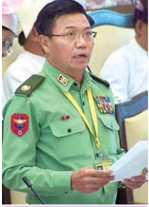
ဒုတိယဝန်ကြီး ဝိုင်းမျိုးချုပ်ကျော်ဖိမြင့်။

နေပြည်တော် ဇန်နဝါရီ ၁၁ ပထမအကြိမ် အမျိုးသားလွှတ်တော် (၁၃)ကြိမ်မြောက် ပုံမှန်အစည်းအဝေး (၂၂)ရက်မြောက်နေ့ကို ယနေ့နံနက် ၁၀ နာရီတွင်ကျင်းပရာ မေးခွန်း(၃)ခု မေးမြန်းဖြေကြားခြင်း၊ ဥပဒေကြမ်း(၃)ခု အတည်ပြုခြင်း၊ အစီရင်ခံစာ(၂)ခု တင်သွင်းခြင်း၊ ပြင်ဆင်ချက်ဖြင့် ပြန်လည်ပေးပို့လာသော ဥပဒေကြမ်း(၁)ခု အသိပေးခြင်း၊ အစီရင်ခံစာ(၁)ခု ဆွေးနွေးခြင်းနှင့် အတည်ပြုခြင်းတို့ကို ဆောင်ရွက်ကြသည်။ အစည်းအဝေးတွင် ရန်ကုန်တိုင်းဒေသကြီး မဲဆန္ဒနယ်အမှတ်(၅)မှ ဦးဝင်းနောင်၏ အုပ်ချုပ်ရေးမြို့တော် နေပြည်တော်၏ အလားအလာကို သိရှိလိုကြောင်း မေးခွန်းနှင့်စပ်လျဉ်း၍ နေပြည်တော်ကောင်စီဝင် ဦးကဲချွန်က နေပြည်တော်တွင် ရာသီဥတုကောင်းမွန်ခြင်း၊ လူနေထူထပ်မှု အသင့်အတင့် ရှိခြင်း၊ ယာဉ်ကြောပိတ်ဆို့မှုမရှိခြင်း၊ လမ်းပန်းဆက်သွယ်မှုကောင်းမွန်ခြင်း၊ ဟိုတယ်၊ တည်းခိုခန်းများ၊ Shopping Mall များ၊ Restaurant များ ရှိခြင်း၊ ပညာရေး၊ ကျန်းမာရေး ပြည့်စုံခြင်းနှင့် အပန်းဖြေစရာများရှိခြင်းတို့ကြောင့် ပြည်တွင်းပြည်ပပညာသည်များ လာရောက်လည်ပတ်နေထိုင်ရန် သင့်တော်ပါကြောင်း။