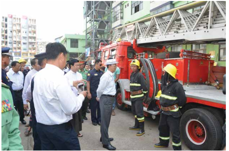
နိုင်ငံတော်သမ္မတ ဦးသိန်းစိန် မင်္ဂလာဈေး မီးလောင်ကျွမ်းမှုတွင် တာဝန်ထမ်းဆောင်ခဲ့ကြသည့် မြန်မာနိုင်ငံ မီးသတ်တပ်ဖွဲ့ဝင်များအား ရင်းရင်းနှီးနှီး နှုတ်ဆက်အားပေးစဉ်။ (သတင်းစဉ်)

ထို့နောက် နိုင်ငံတော်သမ္မတသည် ရန်ကုန်မြို့တော် ဘဏ်မြေညီထပ်၌ ဈေးသူ ဈေးသားများအား တွေ့ဆုံ၍ ဈေးသူ ဈေးသားများတင်ပြသည့် အခက်အခဲများကို