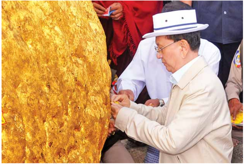
ရန်၊ စိတ်ပါဝင်စားပြီး ကူညီလိုသည့် အဖွဲ့အစည်းများနှင့်လည်း ပူးပေါင်းဆောင်ရွက်ရန်၊ ဂေါပကအဖွဲ့ရန်ပုံငွေများကို စနစ်တကျ စီစဉ်သုံးစွဲရန်နှင့်

ပတ်ဝန်းကျင်တွင် ဟိုတယ်များ၊ တည်းခိုခန်းများ၊ အခမဲ့တည်းခိုခန်းသည် ဇရပ်များဆောက်လုပ်ပေးပြီး ဘုရားဖူးခရီးသည်များ ရင်ပြင်ပေါ်တွင် အိပ်စက်ရန်မလိုဘဲ အေးချမ်းစွာ ဘုရားဖူးနိုင်အောင် စီစဉ်ပေးရန်၊ ကျိုက်ထီးရိုးစေတီတော် ရင်ပြင်ပေါ်ရှိ ဟိုတယ်များ၊ တည်းခိုခန်းများ၊ ဈေးဆိုင်များ သန့်ရှင်းသပ်ရပ်ရေး၊ ဝန်ဆောင်မှု ကောင်းမွန်စေရေးအတွက် ကြီးကြပ်ဆောင်ရွက်ရန်၊ ဘုရားဖူးခရီးသည် များပြားသည်နှင့်အမျှ အညစ်အကြေးနှင့် အမှိုက်များ စနစ်တကျစွန့်ပစ်နိုင်ရေး၊ သဘာဝပတ်ဝန်းကျင် ထိခိုက်မှုမရှိစေရန် စီမံဆောင်ရွက်ရန်၊ ကျိုက်ထီးရိုးစေတီတော်နှင့် ပတ်ဝန်းကျင်ဒေသများ စနစ်တကျ ဖွံ့ဖြိုးတိုးတက်ရေး၊ သဘာဝပတ်ဝန်းကျင်ထိန်းသိမ်းနိုင်ရေး၊ စီမံလမ်းစဉ်ပြင်ရေးတို့အတွက် ပြည်နယ်အစိုးရနှင့် ဂေါပကအဖွဲ့တို့ ပူးပေါင်းပြီး အဖွဲ့ဖွဲ့စည်းဆောင်ရွက်