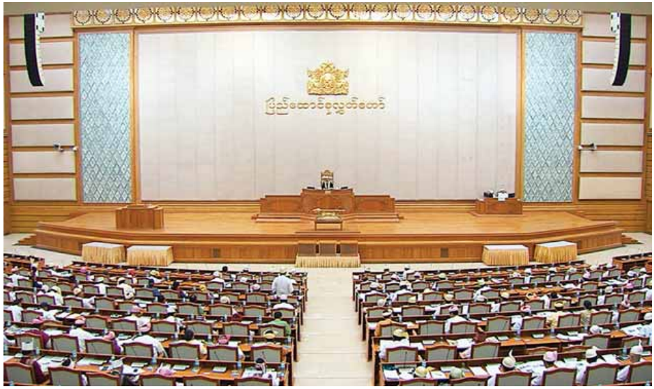
ဆောင်ရန် ပိုမိုစိတ်ဝင်စားလာမည်ဖြစ်ကြောင်း၊ ထို့ကြောင့် ထားဆွေးနွေး ဆောင်ရွက်ပေးကြရန် တိုက်တွန်းလိုကြောင်း နိုင်ငံတော်နှင့် နိုင်ငံသားများအကျိုးစီးပွားအတွက် အလေး ပြောကြားသည်။ (သတင်းစဉ်)

ဥပဒေကြမ်းတို့နှင့်စပ်လျဉ်း၍ ဥပဒေကြမ်း ပူးပေါင်းကော်မတီက ကော်မတီ၏လေ့လာတွေ့ရှိချက်နှင့် သဘောထားမှတ်ချက်အစီရင်ခံစာများကို လွှတ်တော်သို့ဖတ်ကြားတင်ပြသည်။ ထို့နောက် လွှတ်တော်နာယက က ယင်းဥပဒေကြမ်းများနှင့်စပ်လျဉ်း၍ ဆွေးနွေးလိုသည့် လွှတ်တော်ကိုယ်စားလှယ်များ အမည်စာရင်းတင်သွင်းနိုင်ကြောင်း ကြေညာသည်။ ထို့နောက် ၂၀၁၆ ခုနှစ် ပြည်ထောင်စု၏ အခွန်အကောက်ဥပဒေကြမ်းနှင့်စပ်လျဉ်း၍ လွှတ်တော်ကိုယ်စားလှယ်များက ဆွေးနွေးကြပြီး လွှတ်တော်နာယက က အခွန်ဥပဒေကြမ်းနှင့် ဝင်ငွေခွန်စည်းကြပ်မှု နှုန်းထားသတ်မှတ်မှုများကို လက်တွေ့အခြေအနေနှင့် ကိုက်ညီသည့်နှုန်းထားဖြစ်အောင် လွှတ်တော်ကော်မတီများနှင့် သက်ဆိုင်ရာဝန်ကြီးဌာနအဖွဲ့အစည်းများ ဆွေးနွေးညှိနှိုင်းပြီး မှန်မှန်ကန်ကန်အသုံးပြုနိုင်အောင် ဆောင်ရွက်ပေးရမည်ဖြစ်ကြောင်း၊ ထိုသို့ဆောင်ရွက်ခြင်းဖြင့် ဝန်ထမ်းများသာမက အခွန်ထမ်းပြည်သူများအနေဖြင့်လည်း အခွန်