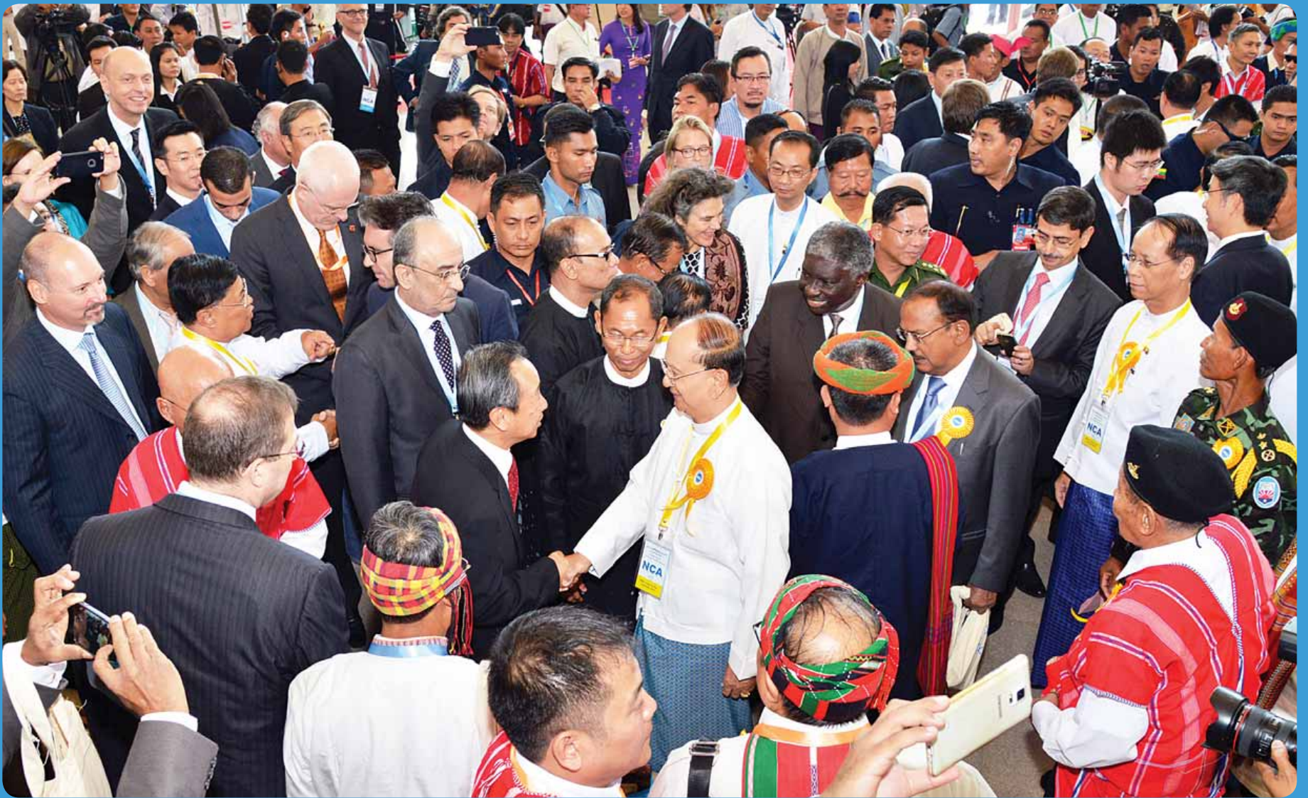
နိုင်ငံတော်သမ္မတ ဦးသိန်းစိန် ၂၀၁၅ ခုနှစ် အောက်တိုဘာ ၁၅ ရက်က တစ်နိုင်ငံလုံးပစ်ခတ်တိုက်ခိုက်မှုရပ်စဲရေးသဘောတူစာချုပ် လက်မှတ်ရေးထိုးပွဲ အခမ်းအနားသို့ တက်ရောက်လာကြသူများအား ရင်းရင်းနှီးနှီးဆက်ဆံစဉ်။ (သတင်းစဉ်)