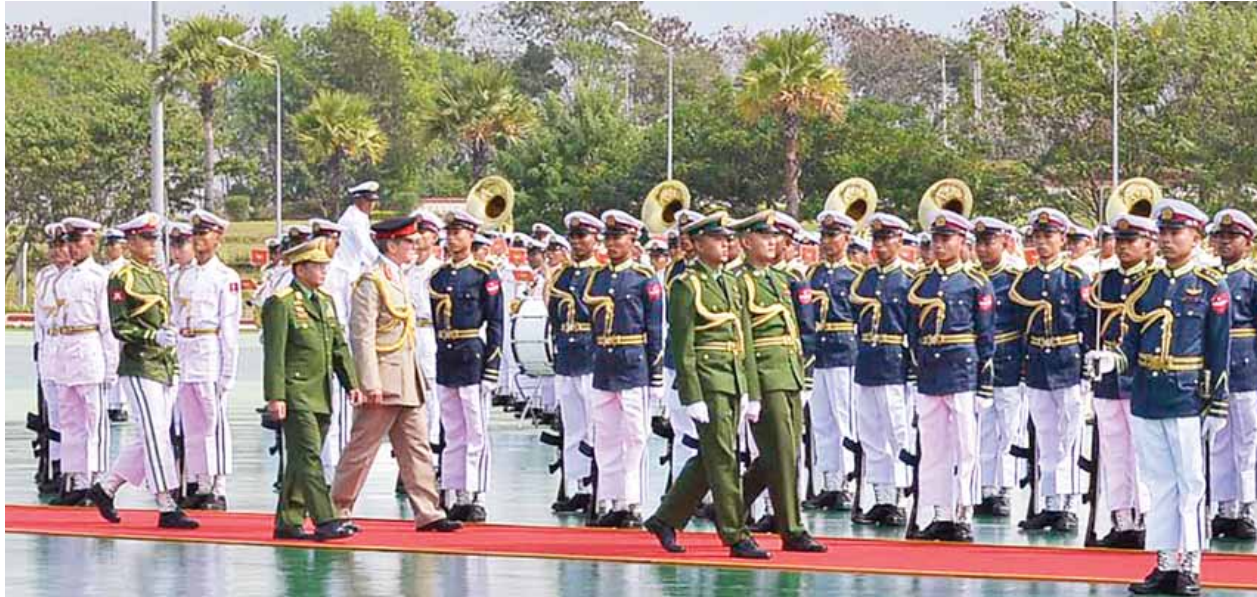
တပ်မတော်ကာကွယ်ရေးဦးစီးချုပ် ဗိုလ်ချုပ်မှူးကြီးမင်းအောင်လှိုင်နှင့် ပြုတ်နီနိုင်ငံ တပ်မတော်ကာကွယ်ရေးဦးစီးချုပ် ဗိုလ်ချုပ်ကြီး ဂျွန်နီကိုလက်စ် ရေနေဒွန်စ်ဟော့တန်တို့ ဂုဏ်ပြုတံဖွဲ့အား စစ်ဆေးစဉ်။

နေပြည်တော် ဇန်နဝါရီ ၁၁ မြန်မာနိုင်ငံနှင့် ပြုတ်နီနိုင်ငံတို့ သည် သမိုင်းကြောင်းအရ တပ်မတော် နှစ်ရပ်အကြား ဆက်စပ်မှု၊ ချစ်ကြည် ရင်းနှီးမှုရှိခဲ့ပြီး ယခုခရီးစဉ် လာရောက် ခြင်းသည် ယင်းချစ်ကြည်ရင်းနှီးမှုကို ပိုမိုမြှင့်တင်ပေးနိုင်မည်ဟု ယုံကြည် ကြောင်း၊ ပြုတ်နီနိုင်ငံအနေဖြင့် နှစ်နိုင်ငံ တပ်မတော်အချင်းချင်း ချစ်ကြည်ရင်းနှီးမှုကို အလေးထား ဆောင်ရွက်မှုအတွက် များစွာ ဝမ်းမြောက်ပါကြောင်း တပ်မတော် ကာကွယ်ရေးဦးစီးချုပ် ဗိုလ်ချုပ်မှူးကြီး မင်းအောင်လှိုင်က ယနေ့နံနက် ၁၁ နာရီခွဲတွင် နေပြည်တော်ရှိ ဇေယျာသီရိဗိမာန် ဧည့်ခန်းမဆောင်၌ ပြုတ်နီနိုင်ငံ တပ်မတော်ကာကွယ်ရေး ဦးစီးချုပ် ဗိုလ်ချုပ်ကြီး ဂျွန်နီကိုလက်စ် ရေနေဒွန်စ်ဟော့တန်နှင့် တွေ့ဆုံ ဆွေးနွေးစဉ် ထည့်သွင်းပြောကြား သည်။