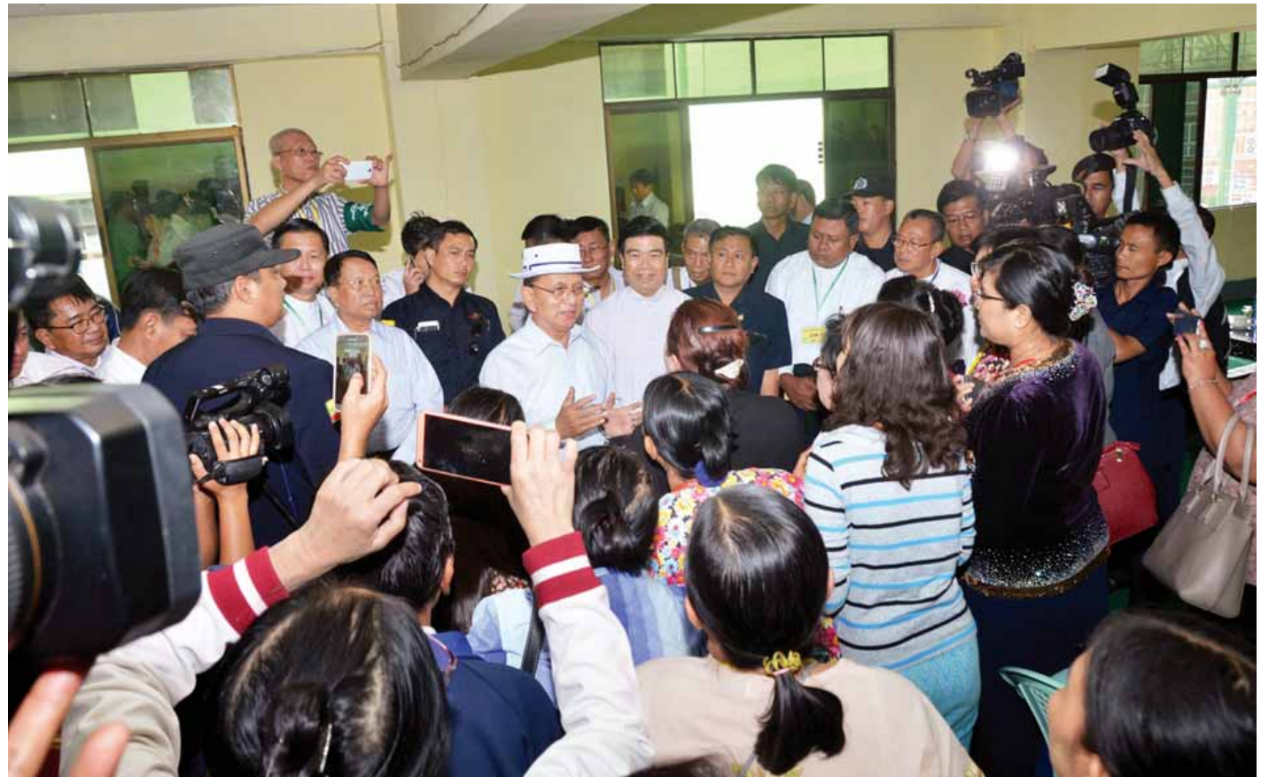
နိုင်ငံတော်သမ္မတ ဦးသိန်းစိန် အဆင့်မြင့်မင်္ဂလာဈေး ဈေးသူ ဈေးသားများနှင့် တွေ့ဆုံအားပေးစကား ပြောကြားစဉ်။ (သတင်းစဉ်)

ဈေးသစ်ပြန်လည် တည်ဆောက်နိုင်ရန်အတွက် မြေညီထပ်မှ ပစ္စထပ်ရှိ ဆိုင်ခန်းပေါင်း ၄၀၆၇ ခန်းကို မင်္ဂလာဈေးဝင်းအတွင်းရှိ ရွှေမင်္ဂလာဈေး တတိယထပ်မှ ပစ္စထပ်ရှိ ယာဉ်ရပ်နားနေရာ၊ ရွှေပြည်စုံဈေး စတုတ္ထထပ်ရှိ လစ်လပ်နေရာနှင့် မင်္ဂလာမွန်ဈေး ရွှေမျက်နှာစာ ယာဉ်ရပ်နားနေရာတို့တွင် ၅ ပေ x ၅ ပေ ဆိုင်ခန်းနေရာများစီစဉ်၍ ယာယီနေရာချထားပေးမည်ဖြစ်ကြောင်း သိရသည်။ (သတင်းစဉ်)