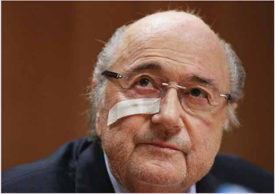
ခြင်းမပြုရန်ပိတ်ပင်မှုကို တိုက်ဖျက်ရန် ပြင်းထန်သော သန့်ဋ္ဌာန်ချထားခဲ့ပြီး ဖေဖော်ဝါရီ ၂၆ ရက်တွင် ကျင်းပမည့် ဖီဖာဥက္ကဋ္ဌရွေးချယ်ပွဲမတိုင်မီ အပြီးဆောင်ရွက်သွားနိုင်ရန်လည်း ပလာတီနီက မျှော်လင့်ထားသည်။ အမေရိကန်တရားရေးဌာနကလည်း အကျင့်ဖျက် ခြစားမှုနှင့်စပ်လျဉ်း၍ စုံစမ်းစစ်ဆေးမှုများပြုလုပ်ကာ ဆပ်ဘလတ္တာနှင့် မိုက်ကယ်ပလာတီနီအပါအဝင် ၃၉ ဦးနှင့် ကုမ္ပဏီနှစ်ခုကို တရားစွဲဆိုထားပြီး ဖီဖာတာဝန်ရှိသူ စုစုပေါင်းကိုးဦးကိုလည်း ဖမ်းဆီးထားခဲ့သည်။ (ငွေကြယ်)

ပေ။ ယင်းသို့ ရုံးထိုင်ကြားနားစဉ်တွင် ဆပ်ဘလတ္တာနှင့် ပလာတီနီတို့ကို ရှစ်နှစ်ကြာပိတ်ပင်ခဲ့ခြင်းဖြစ်သည်။ ထို့ပြင် နိုင်ငံတွင်းရော နိုင်ငံပြင်ပမှာပါ ဘောလုံးနှင့် ဆက်စပ်သည့် ဆောင်ရွက်ချက်မှန်သမျှကို လိုက်ပါ ဆောင်ရွက်ခြင်းမပြုရန်လည်း တားမြစ်ခံခဲ့ရသည်။ ယင်းသို့ ပိတ်ပင်ထားခြင်းကို ခံခဲ့ရသည့်အပြင် အမြင့်ဆုံး ဒဏ်ကြေးငွေအဖြစ် ဆပ်ဘလတ္တာအား ပေါင် ၃၃၀၀၀ နှင့် မိုက်ကယ်ပလာတီနီအား ပေါင် ၅၃၀၀၀ ဒဏ်ရိုက်ခဲ့ကြောင်းလည်း သိရသည်။ ဆပ်ဘလတ္တာသည် ၎င်းအား ဘောလုံးလောကမှ ရှစ်နှစ်ကြာပိတ်ပင်ခံရပြီးနောက် ပြုလုပ်ခဲ့သည့် သတင်းစာ ရှင်းလင်းပွဲတစ်ခုတွင် ဆုံးခန်းတိုင်အောင် တိုက်ပွဲဝင်သွားမည်ဟုဆိုခဲ့ပြီး လက်ရှိတွင် ရှစ်နှစ်ကြာပိတ်ပင်ခံရမှုအား လျှောက်လဲချက်တင်မည်ဟု သတင်းထွက်ပေါ်လာခဲ့ခြင်းဖြစ်သည်။ ဆပ်ဘလတ္တာသည် ဖီဖာအကြီးအကဲအဖြစ် ၁၉၉၈ ခုနှစ်ကတည်းက တာဝန်ယူခဲ့သူဖြစ်သည်။ ယင်းသို့ ရှစ်နှစ်ကြာ ဘောလုံးလောကသို့ ဝင်ရောက်