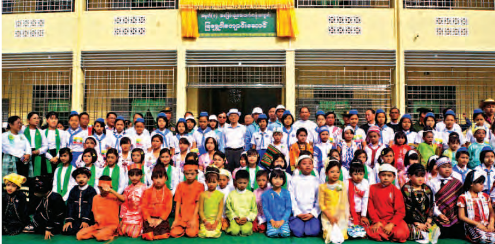
နိုင်ငံတော်သမ္မတ ဦးသိန်းစိန် မြရွှေဝါကျောင်းဆောင်သစ်ဖွင့်ပွဲတွင် ဆရာ ဆရာမများ၊ ကျောင်းသား ကျောင်းသူများနှင့်အတူ စုပေါင်း၍ မှတ်တမ်းတင်ဓာတ်ပုံရိုက်စဉ်။ (ပြန်/ဆက်)

အနားကို ရုပ်သိမ်းလိုက်သည်။ ထို့နောက် နိုင်ငံတော်သမ္မတနှင့် အဖွဲ့သည် အဆိုပါကွင်း၌ ဆက်လက် ကျင်းပသည့် ကရင်အမျိုးသားနှစ်သစ် ကူးနေ့ ဖီဗူးယော် ကောက်သစ်စား ပွဲတော်သို့ တက်ရောက်သည်။ ကောက်သစ်စား ပွဲတော်တွင် နိုင်ငံတော်သမ္မတ ဦးသိန်းစိန်နှင့် ကရင်အမျိုးသားအစည်းအရုံး(KNU) ဥက္ကဋ္ဌတို့က ငြိမ်းချမ်းရေးချီးငှက်များ လွှတ်၍ အခမ်းအနားကို ဖွင့်လှစ်ပေး ကြပြီး တက်ရောက်လာကြသူများက ဖီဗူးယော်ဆုတောင်းတေးသီချင်းကို သီဆိုကြသည်။ နိုင်ငံတော်သမ္မတသည် ကရင် အမျိုးသားနှစ်သစ်ကူးပွဲတော် ကျင်းပ ရေးကော်မတီမှ တာဝန်ရှိသူများအား ရင်းရင်းနှီးနှီးနှုတ်ဆက်ပြီး အမှတ်တရ လက်ဆောင်ပစ္စည်းများ အပြန်အလှန် ပေးအပ်ကြသည်။ ယင်းနောက် နိုင်ငံတော်သမ္မတနှင့် အဖွဲ့ဝင်များသည် တိုင်းရင်းသား ညီအစ်ကို မောင်နှမများနှင့်အတူ ကောက်သစ်စားပွဲတော် အထိမ်း အမှတ်အဖြစ် ကရင်ရိုးရာအစား အသောက်များကို သုံးဆောင်ကြပြီး တက်ရောက်လာကြသည့် ဧည့်သည်