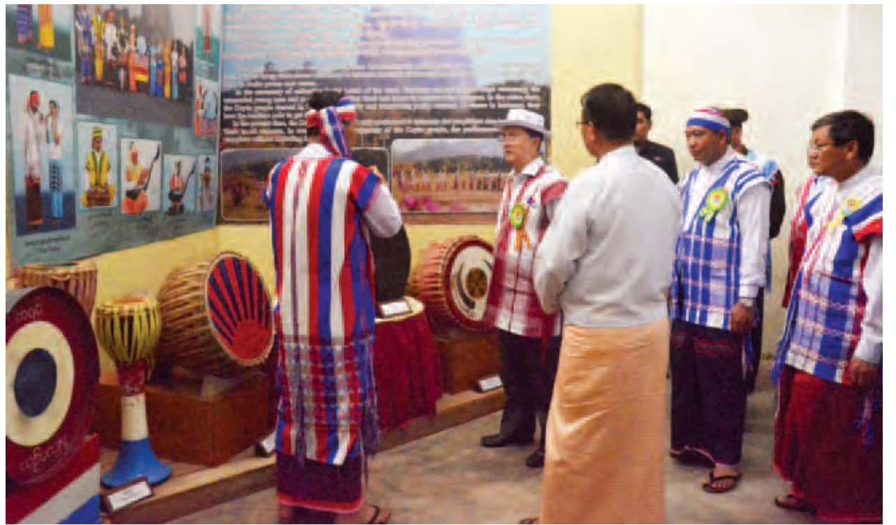
နိုင်ငံတော်သမ္မတ ဦးသိန်းစိန် ကရင်ပြည်နယ် ယဉ်ကျေးမှုပြတိုက်အတွင်း လှည့်လည်ကြည့်ရှုစဉ်။ (သတင်းစဉ်)

တော်များအား ရင်းရင်းနှီးနှီးနှုတ်ဆက် သည်။ ကရင်နှစ်သစ်ကူးနေ့အဖြစ် ပြာသို့ လဆန်း ၁ ရက်နေ့ကို တရားဝင်ရုံး ပိတ်ရက်အဖြစ် သတ်မှတ်ပေးရန် ကရင်အမျိုးသားလွှတ်တော်အမတ် များက ၁၉၃၇ ခုနှစ်မှ စတင်၍ ဗြိတိသျှအစိုးရထံ တောင်းဆိုခဲ့ကြပြီး တောင်ငူအမတ် စောဂျွန်ဆင်ဒီဖိုးမင်း က ၁၉၃၇ ခုနှစ် ဩဂုတ် ၂ ရက်နေ့ တွင် အဆိုကို လက်မှတ်ရေးထိုးကာ ဥပဒေပြုအောက်လွှတ်တော်သို့ တင် သွင်းခဲ့သည်။ ထို့နောက် ဘုရင်ခံက(Negotiable Instrument Act)အရ အများ ပြည်သူ့ အစိုးရရုံးပိတ်ရက်အဖြစ် ၁၉၃၈ ခုနှစ် ဇန်နဝါရီ ၁ ရက် (မြန်မာသက္ကရာဇ် ၁၂၉၉ ခုနှစ် ပြာသို့ လဆန်း ၁ ရက်နေ့)တွင် ထုတ်ပြန် ကြေညာခဲ့သည်။ ထိုမှစ၍ နှစ်စဉ် ပြာသို့လဆန်း ၁ ရက်နေ့ရောက်တိုင်း ကရင်နှစ်သစ်ကူး နေ့ကို ကျင်းပခဲ့ကြခြင်းဖြစ်သည်။ ကောက်ဦးစားပွဲ နှစ်သစ်ကူးခြင်း ကို ရည်ရွယ်ချက်အားဖြင့် သုံးရက် ထားရှိကြောင်း သိရသည်။ ပထမ