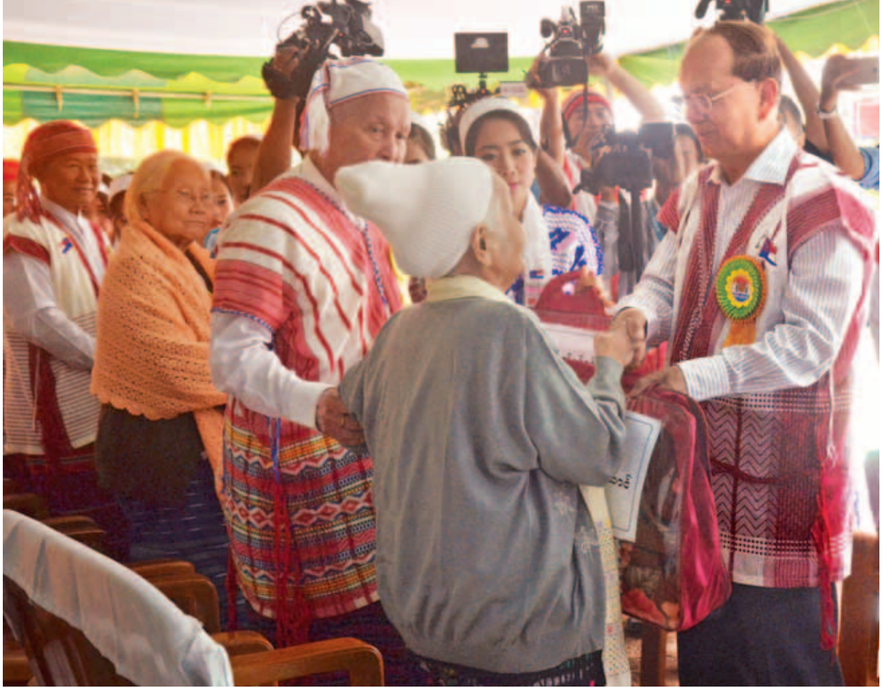
နိုင်ငံတော်သမ္မတ ဦးသိန်းစိန် ဂုဏ်ပြုခံသက်ကြီး ကရင်အဘိုးအဘွားများအား ဂုဏ်ပြုလက်ဆောင်များ ပေးအပ်စဉ်။

ရှောက်ရမည့် စစ်မှန်သော မျိုးချစ်စိတ်ဓာတ်ဖြစ်ကြောင်း ခံယူကာ ပြည်ထောင်စုမပြိုကွဲရေး၊ တိုင်းရင်းသားစည်းလုံးညီညွတ်မှု မပြိုကွဲရေး၊ အချုပ်အခြာအာဏာ တည်တံ့ခိုင်မြဲရေးဟူသော ဒီတောဝန်အရေးသုံးပါးကို အစဉ်အလေးထားပြီး ပြည်ထောင်စုသမ္မတမြန်မာနိုင်ငံတော်၏ အစိတ်အပိုင်းတစ်ခုဖြစ်သည့် ကရင်ပြည်နယ်ကို ဘက်စုံဖွံ့ဖြိုးတိုးတက်သော ပြည်နယ်တစ်ခုဖြစ်အောင် ပြည်နယ်အတွင်းနေထိုင်ကြသော တိုင်းရင်းသားပြည်သူများအားလုံးက စည်းလုံးညီညွတ်စွာဖြင့် ဆောင်ရွက်သွားကြရန် တိုက်တွန်းလိုကြောင်း ပြောကြားသည်။ ဆက်လက်၍ အခမ်းအနားသဘာပတိ ပြည်နယ်လွှတ်တော်ဥက္ကဋ္ဌ စာမျက်နှာ ၉ ကော်လံ ၁ သို့