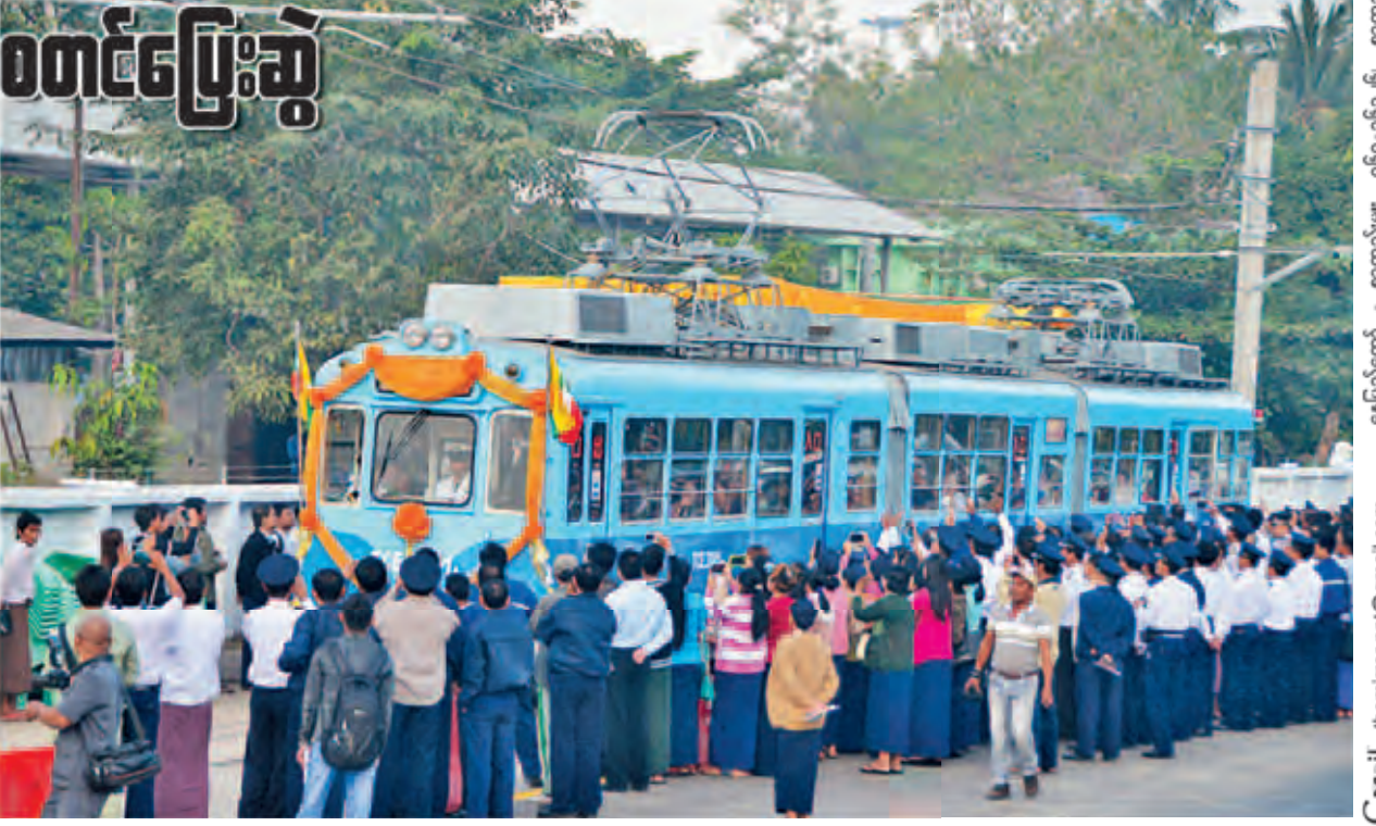
ရန်ကုန်မြို့ ကမ်းနားလမ်းတစ်လျှောက်တွင်ပြေးဆွဲမည့် လျှပ်စစ်ရထား (TRAM) ကို ဇန်နဝါရီ ၁၀ ရက်က တွေ့ရစဉ်။