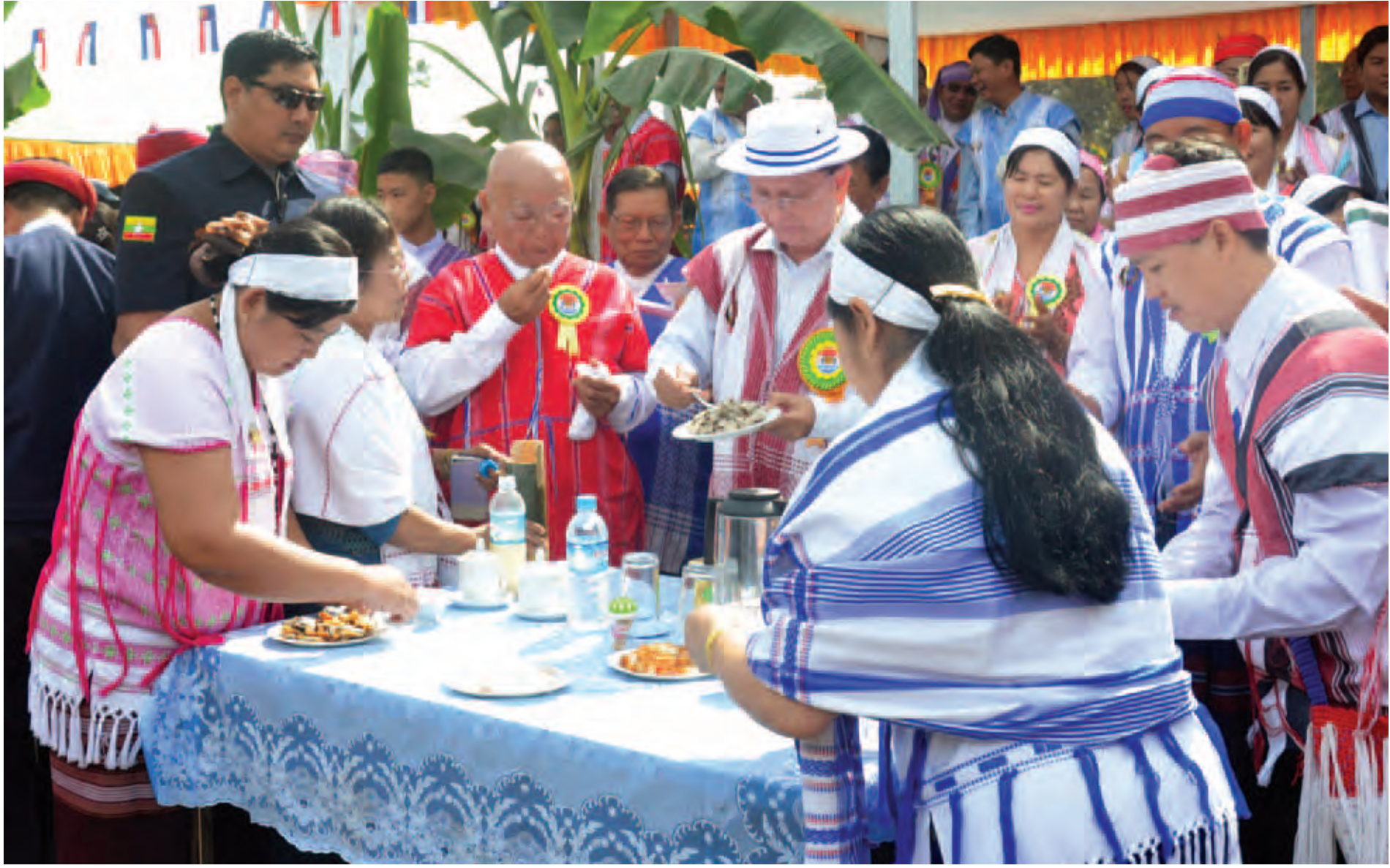
နိုင်ငံတော်သမ္မတဦးသိန်းစိန် ကရင်အမျိုးသားနှစ်သစ်ကူးနေ့ ဖွဲ့ပူးယော်ကောက်သစ်စားပွဲတော်အထိမ်းအမှတ်အဖြစ် ကရင်ရိုးရာအစားအသောက်များ သုံးဆောင်စဉ်။ (သတင်းစဉ်)

မြို့တော်အသံလွှင့်ဌာန နှစ်ပတ်လည်နေ့ ကျင်းပ စာမျက်နှာ - ၃