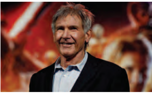
ခဲ့သည့်ရုပ်ရှင် "The Force Awakens" မှ ဝင်ငွေ အမေရိကန်ဒေါ်လာ ၁၅၅ သန်းရရှိခဲ့ပါတယ်။ မင်းသားဆန်မြူရယ်အယ်လ်ဂျက်ဆန်ကတော့ ဝင်ငွေအမေရိကန်ဒေါ်လာ ၄ ဒသမ ၆ ဘီလီယံရရှိထားပြီး ဒုတိယဝင်ငွေအကောင်းဆုံး မင်းသားအဖြစ် ရပ်တည်နေပါတယ်။

ဟယ်ရီဆင်ဖော့ဒ်ဟာ သူ့ရဲ့အနုပညာသက်တမ်းတစ်လျှောက်ရုပ်ရှင် ဇာတ်ကားပေါင်း ၄၁ ကားရိုက်ကူးခဲ့ကာ ယင်းရုပ်ရှင်များမှ ဝင်ငွေအမေရိကန်ဒေါ်လာ ၄ ဒသမ ၇ ဘီလီယံရရှိခဲ့ပါတယ်။