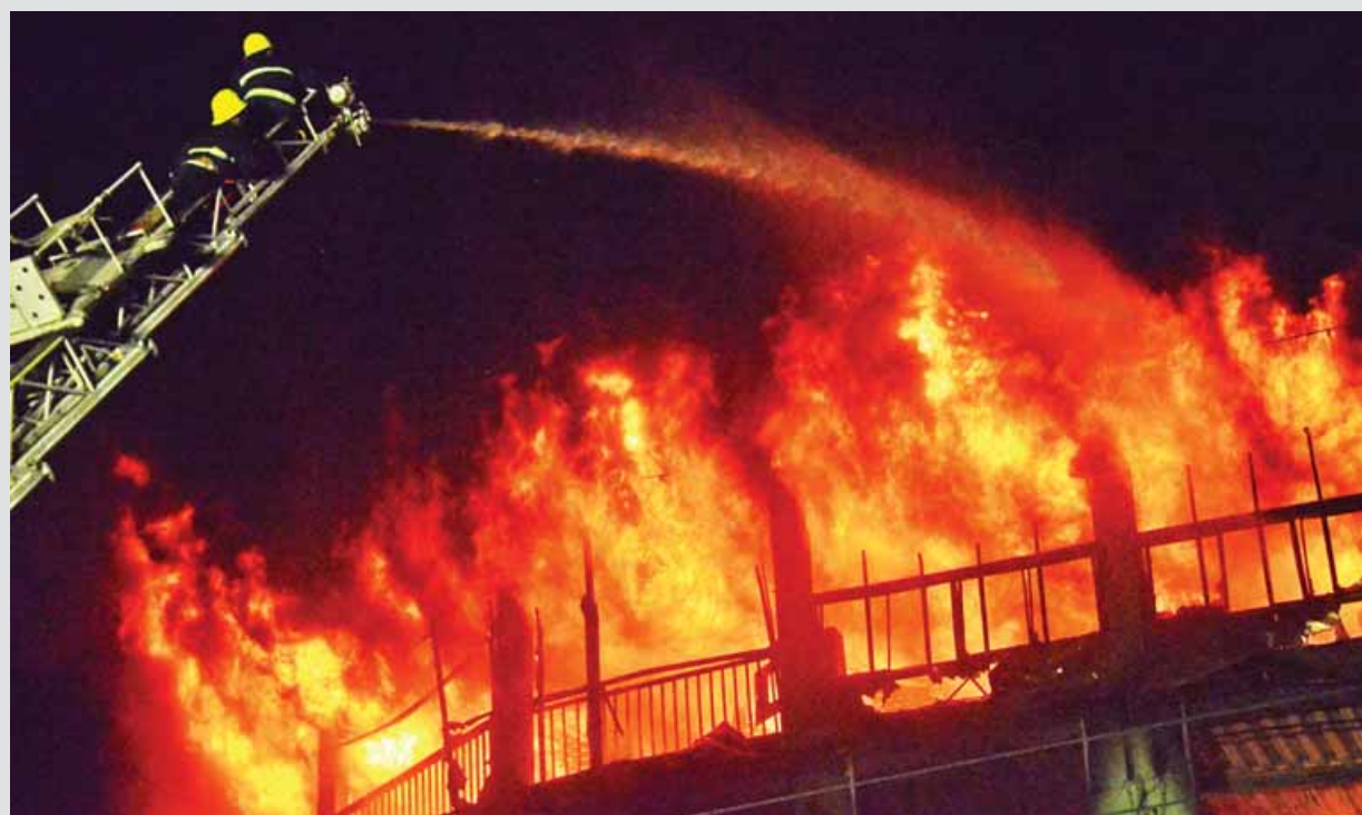
မင်္ဂလာရေးမီးလောင်မှုဖြစ်ပွားစဉ် ရန်ကုန်တိုင်းဒေသကြီး မီးသတ်တပ်ဖွဲ့ဝင်များ အားကြီးမာန်တက် မီးငြိမ်းသတ်နေစဉ်။