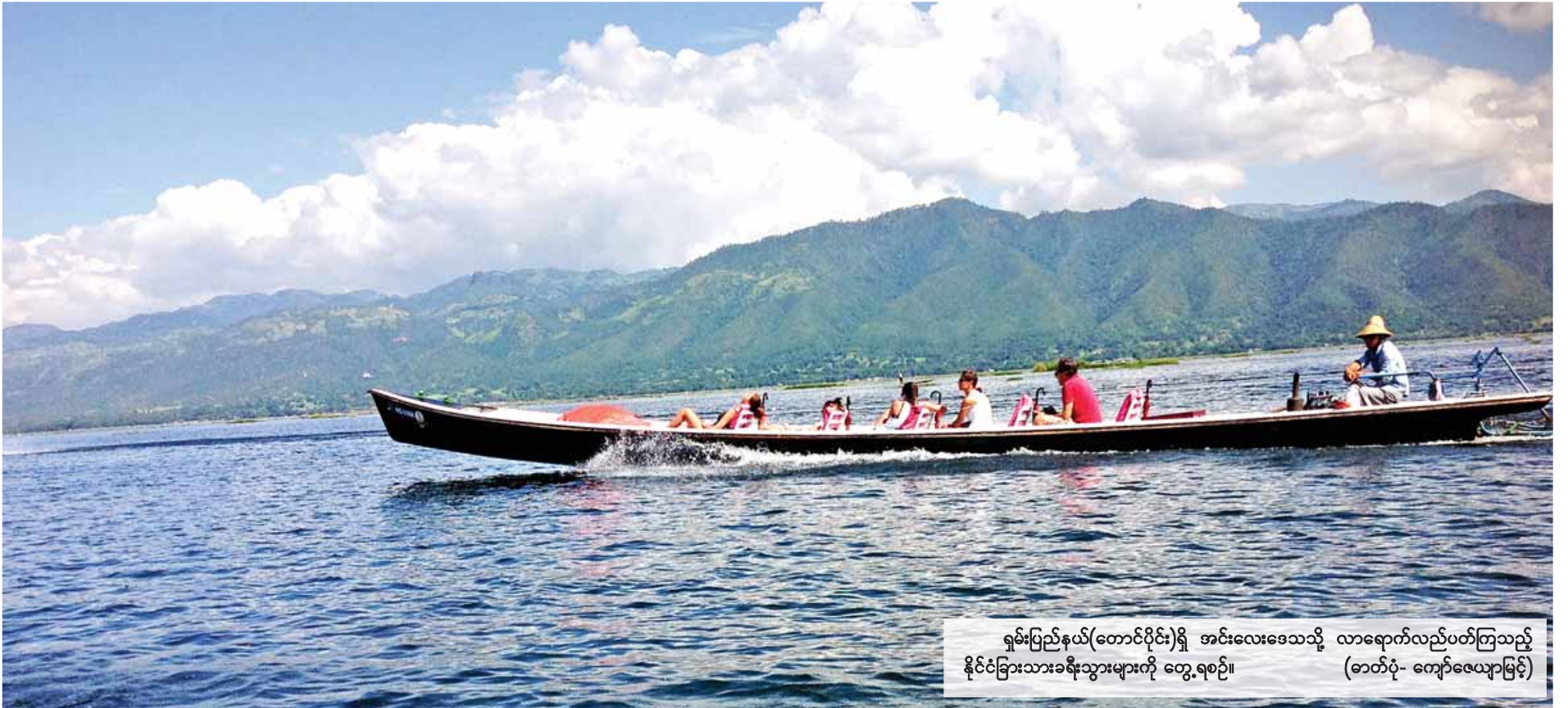
ရှမ်းပြည်နယ်(တောင်ပိုင်း)ရှိ အင်းလေးဒေသသို့ လာရောက်လည်ပတ်ကြသည့် နိုင်ငံခြားသားခရီးသွားများကို တွေ့ရစဉ်။