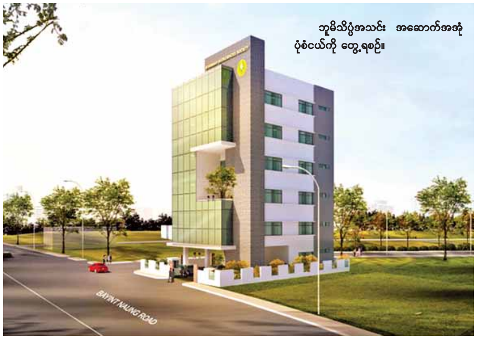
ဘူမိသိပ္ပံအသင်း အဆောက်အအုံ ပုံစံငယ်ကို တွေ့ရစဉ်။

နိုင်ငံတော် ဖွံ့ဖြိုးတိုးတက်လာ သည့်အခါ အဆောက်အအုံများ၊ အခြေခံအဆောက်အအုံများအောက် လုပ်ရာတွင် ရေရှည်တည်တံ့ခိုင်ခံ့မှု အတွက် မြေနေရာစမ်းသပ်ခြင်း အပါအဝင် အခြားနည်းပညာ အသုံးပြုမှုများ၊ နိုင်ငံတော်၏ သယံဇာတများ ရှာဖွေဖော်ထုတ်ခြင်းနှင့် ပတ်သက်သည့်ပညာရပ်များ၊ မြေ ငွေ ကောက်ခံလျက်ရှိကြောင်း၊ အဆောက်အအုံ ဖောင်ဒေးရှင်း ပိုင်ရှင်ကြီးကြားမှု Myanmar V-Pile ကုမ္ပဏီလီမိတက်မှ လျှို့ဝှက်သွားမည် ဖြစ်ကြောင်းနှင့် လျှို့ဝှက်သွားမည့် ဘူမိသိပ္ပံ အသင်း အဆောက်အအုံဖြစ်မြောက် ရေးကော်မတီ ဖုန်းနံပါတ် ၀၉၂၆၀၅၅၇၀၀၂ သို့ဆက်သွယ် လျှို့ဝှက်ရန် ဖိတ်ခေါ်ထားကြောင်း သိရသည်။