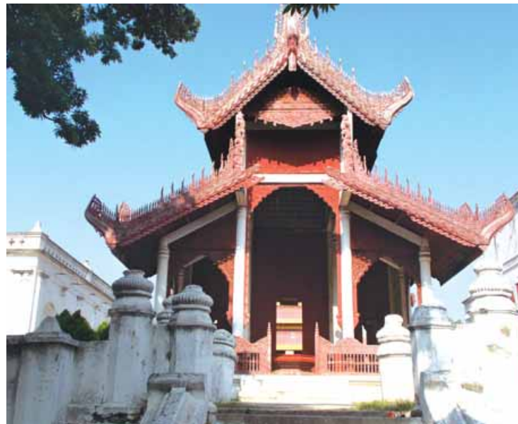
အနေဖြင့်မင်းဧကရာဇ်တို့၏ ရှင်ပြု ပဉ္စင်းခံ၊ ကထိန်အစရှိသော အလှူတော်များပြုလုပ် လှူဒါန်းရာ အဆောင်ပင်ဖြစ်သည်။ တောင် မြောက်အလျား ၃၄ ပေ၊ အရှေ့အနောက် အနံ ၂၇ ပေ၊ အမြင့် ၃၆ ပေရှိသည်။ လက်ရှိကာလတွင် မန္တလေးမြို့မြန်မာ့စံ ကျော် ရွှေနန်းတော်ကြီးအတွင်းရှိ အဆောင် ဆောင်အခန်းခန်းနှင့် လုပ်ငန်းဆောင်တာ အလိုက် နေထိုင်လုပ်ကိုင်မှုများကို အသိပေး ရှင်းပြထားသည့် စာတန်းများဖြင့်အလွယ် တကူ လေ့လာနိုင်သည်။ တိမ်တမန်

ဆောင်အမျိုးအစားဖြစ်ကာ တင့်တယ်သော အဆောင်တစ်ခုပင်ဖြစ်သည်။ ထူးခြားသည်မှာ အရှေ့စမုတ်ဆောင်ကဲ့ သို့ပင် လင်းနီတောင်၊ ပန်းပေါင်ပါရှိသည်။ ပွတ်လက်ရုံးနှင့် အမွမ်းပန်းများ တပ်ဆင် ထားကာ ခုံညားထည်ဝါအောင် တည် ဆောက်ထားသည်။ တောင်စမုတ်ဆောင် မှာ မှန်နန်းတော်ကြီး၏ အလယ်တိုင်နှင့် တည့်တည့် တောင်မြောက်တန်းလျက် တည်ရှိသည်။ အထက်ခေါင်ရိုးအလယ်တွင် အရှေ့ အနောက် မာရဘင်ဆီးတားထားသည်။ တောင်စမုတ် ဆောင်အတွင်းတွင် သမင်ရုပ်ခံ ရေသဖန်းသားဖြင့် ထုလုပ်ထားသည့် မိဂါ သနပလ္လင်တော်ထားရှိရာ အဆောင်ဖြစ် သည်။ ထိုပလ္လင်တော်မှ ရှေးခေတ်မင်း ဧကရာဇ်တို့နိုင်ငံရေးရာကို ဆွေးနွေးတိုင် ပင်လေ့ရှိသည်။ အခြားလုပ်ငန်းဆောင်တာ