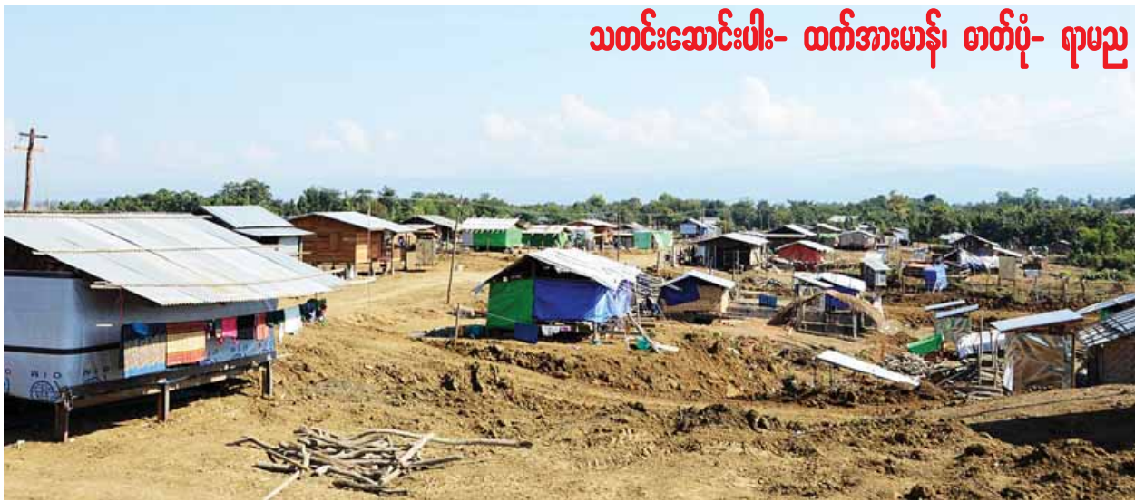
သတင်းဆောင်းပါး- ထက်အားမာန်၊ တတ်ပုံ- ရာမည

ထိုင်ခုံနှင့်တင်ပါးမကပ်နိုင်။ လူ့လွန် ခုန်ဆောင့်နေသော သုံးဘီးဆိုင်ကယ် နောက်တွင်လိုက်ပါရင်း ဖုန်တထောင်း ထောင်းလမ်းကို ဖြတ်သန်းခဲ့သည်။ ဖြတ်သန်းရင်း သတိပြုမိသည်မှာ လမ်းဘေးဝဲယာတွင် စုပုံနေသော သစ်ပင်၊ သစ်ကိုင်းခြောက်များနှင့် အမှိုက်သရိုက်များကို တွေ့လိုက်ရသည်။ ရှေ့သို့ခရီးဆက်ရာတွင် ရွှံ့များဖြင့် ပေကျဲနေသော ဆိုင်းဘုတ်တစ်ခုကို မြင်လိုက်ရသည်။ “ကလေးမြို့နယ် နတ်နန်းရွာမှ ကြိုဆိုပါ၏” ဟု၏။ ယခင်က မျက်နှာပြောင်နှင့် နတ်နန်း ရွာဆိုင်းဘုတ်မှာ ယခုသနပ်ခါး အဖွေး သားနှင့် အသွင်ဆန်းနေသလောက်။