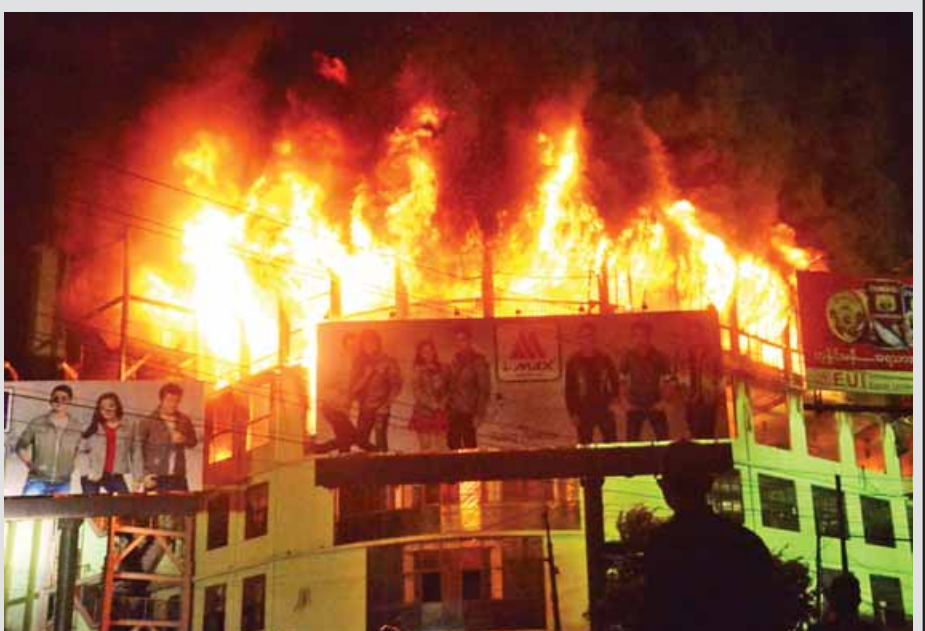
မင်္ဂလာရေးမီးလောင်မှုဖြစ်ပွားစဉ်။