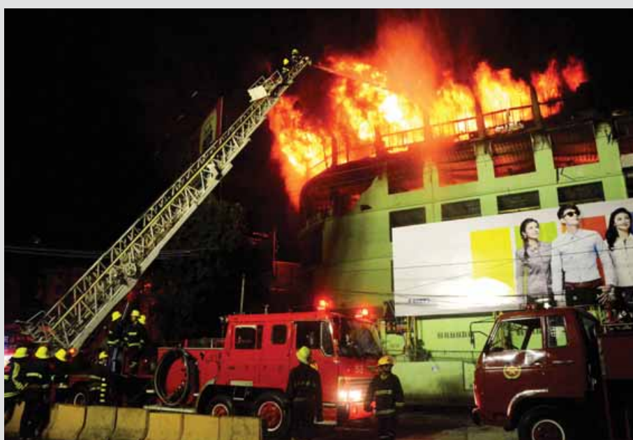
မင်္ဂလာရေးမီးလောင်မှုဖြစ်ပွားစဉ် ရန်ကုန်တိုင်းဒေသကြီး မီးသတ်တပ်ဖွဲ့ဝင်များ အားကြီးမာန်တက် မီးငြိမ်းသတ်နေစဉ်။