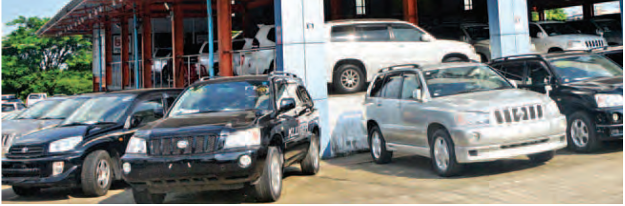
ရန်ကုန်မြို့ရှိ ယာဉ်ရောင်းဝယ်ရေးစင်တာတစ်ခုကို တွေ့ရစဉ်။

ရန်ကုန် ဇန်နဝါရီ ၈ ပြည်ပမှတင်သွင်းခွင့်ပြုသော ယာဉ်များ၏ ထုတ်လုပ်သည့်ခုနှစ် (Model Year) သတ်မှတ်ချက် မူဝါဒအပြောင်းအလဲများကြောင့် ကားဈေးကွက်အတွင်း အရောင်းမဝင်မှုရှိသလောက်ဖြစ်သွားကာ ဈေးကွက်အခြေအနေအပေါ် လေ့လာစောင့်ကြည့်မှုများသာရှိနေကြောင်း ကားဈေးကွက်အတွင်းမှ သိရသည်။ စာမျက်နှာ ၃ ကော်လံ ၁ သို့ ❖