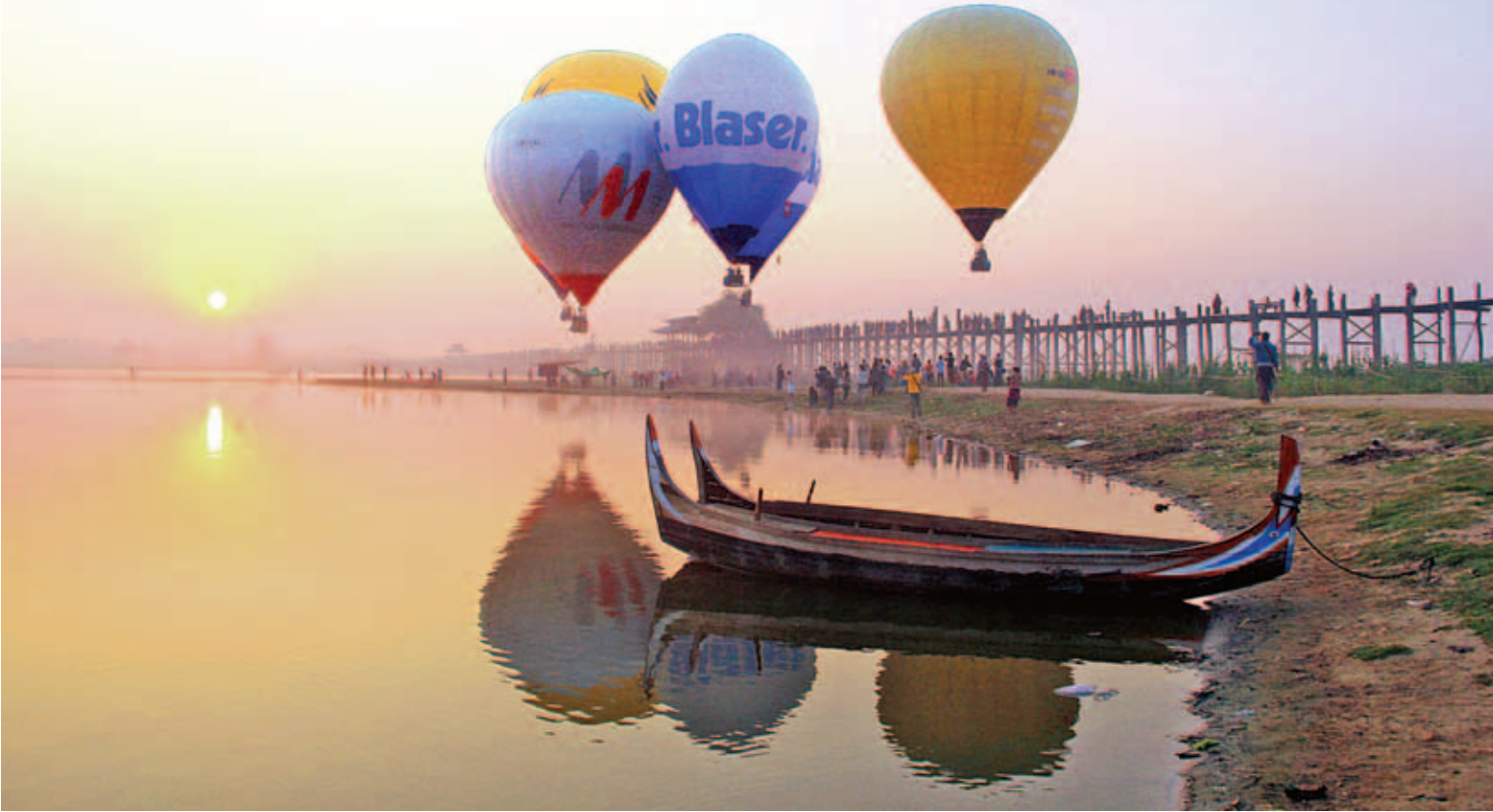
(၁၇)ကြိမ်မြောက် မီးပုံးပျံစုပေါင်းပျံသန်းပွဲတော်တွင် မန္တလေးမြို့ရှိ တောင်သမန်အင်းဝဟောင်း စုပေါင်းပျံသန်းလေ့လာခဲ့ကြသည့် မီးပုံးပျံများ။