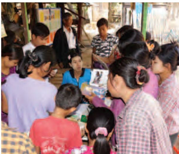
ကွင်းဆင်းဆောင်ရွက်ပေးပြီး စာကြည့်တိုက်အသင်းဝင်ချင်သူများကိုလည်း အသင်းဝင်ကတ်ပြားများ ပြုလုပ်ပေးလျက်ရှိကြောင်း သိရသည်။

ဇူလိုင်လ ၈ ရက်နေ့ ပြန်ကြားရေးနှင့် ပြည်သူ့ဆက်ဆံရေးဦးစီးဌာနအနေဖြင့် တဲကြီးကုန်းကျေးရွာနှင့် ဂုံမင်းအင်းကျေးရွာများသို့ အပတ်စဉ်ကြာသပတေးနေ့တိုင်း