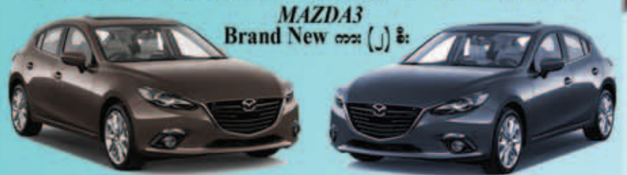
MAZDA3 Brand New ကား (၂) စီး

၅ကျပ်သား ရွှေဆွဲကြိုး (၄)ကုံး ၊ iphone (၂၀)လုံး Samsung Note 5 (၁၅)လုံး ၊ ipad (၁၅)လုံး