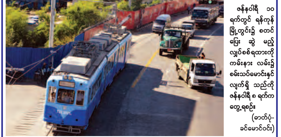
ဇန်နဝါရီ ၁၀ ရက်တွင် ရန်ကုန် မြို့တွင်း၌ စတင် ပြေး ဆွဲ မည့် လျှပ်စစ်ရထားကို ကမ်းနား လမ်း၌ စမ်းသပ်မောင်းနှင် လျက်ရှိ သည်ကို ဇန်နဝါရီ ၈ ရက်က တွေ့ရစဉ်။

ပြင်ဆင်ဖတ်ရှုပါရန် ဇန်နဝါရီ ၇ ရက်ထုတ် ကြေးမုံ သတင်းစာ စာမျက်နှာ ၁၀ တွင် ဖော်ပြပါရှိသော “မြန်မာနိုင်ငံမီးပြ တိုက်အက်ဥပဒေကို ပြင်ဆင်သည့် ဥပဒေ” ပုံဒီမ ၂၊ ၄၊ ၆၊ ၇၊ ၈၊ ၉၊ ၁၀၊ ၁၂၊ ၁၃နှင့်၁၄ တို့တွင် ပါရှိ သည့် Myanmar ဆိုသည့် စကား ရပ်များအားလုံးကို Myanma ဆို သည့် စကားရပ်ဖြင့် ပြင်ဆင်ဖတ်ရှု ပါရန်။