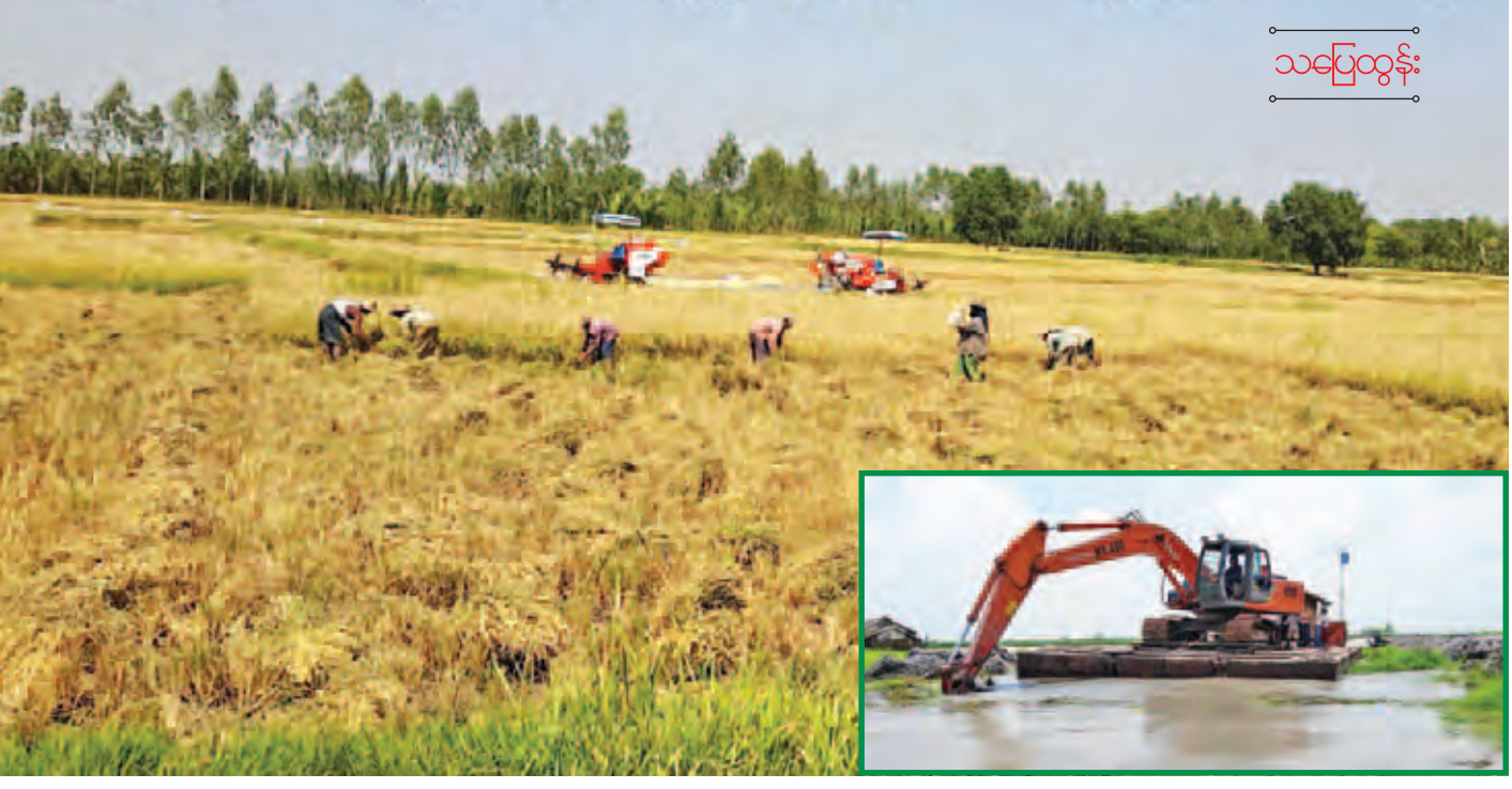
သပြေကန်-သိမ်ကုန်းဧရိယာအတွင်းရှိ နွေစပါးခင်းများ ရိတ်သိမ်းနေမှုနှင့် ကေးဂု-သိန္နီမြောင်းတူးဖော်ခြင်းလုပ်ငန်းအား စက်ဖြင့်ဆောင်ရွက်နေမှု(ပုံသေး)ကို တွေ့ရစဉ်။

မုံရွာ ဇန်နဝါရီ ၈ မြန်မာ့များ၏ ရိုင်းပင်းကူညီမှုနှင့် ချစ်စရာလေ့များကြောင့် ၁၉၉၉ ခုနှစ်မှစတင်၍ မီးပုံးပျံပွဲတော်(မီးပုံးပျံစုပေါင်း ပျံသန်းသည့်ပွဲတော်)ကို (၁၈)ကြိမ်မြောက်အထိ နှစ်စဉ် ဆွစ်ဇာလန်နိုင်ငံသားများသည် မြန်မာနိုင်ငံတို့တယ်နှင့် ခရီးသွားလာရေး လုပ်ငန်းဝန်ကြီးဌာန၏ အကူအညီနှင့် Golden Eagle Ballooning ၏ ဝန်ဆောင်မှုဖြင့် ၁၈ နှစ်ဆက်တိုက် ပျံသန်းလေ့လာလျက် ရှိကြောင်း Golden Eagle မှ ဒါရိုက်တာ ကိုတောင်းဆက်ဖော်ထုတ် သိရသည်။