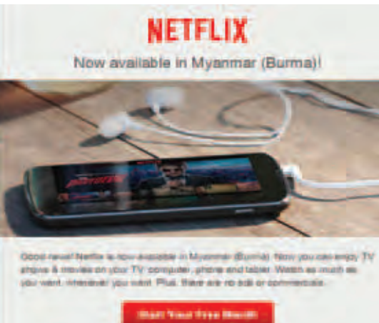
(ငြိမ်းချမ်း)

ကမ္ဘာ့ထိပ်တန်း အွန်လိုင်းရုပ်သံလွှင့်လိုင်းဖြစ်သည့် Netflix အား မြန်မာနိုင်ငံတွင် အသုံးပြုနိုင်ပြီဖြစ်ကြောင်း သိရသည်။ Netflix ရုပ်သံလွှင့်လိုင်းမှတစ်ဆင့် ရုပ်ရှင်ဇာတ်ကားများ၊ Documentary များ၊ ရုပ်သံဇာတ်လမ်းတွဲများ၊ နိုင်ငံတကာမှ ထုတ်လွှင့်လျက်ရှိသော ရုပ်သံအစီအစဉ်များစွာကို စမတ်တီဗီများ၊ ကွန်ပျူတာများ၊ စမတ်ဖုန်းနှင့် တက်ဘလက်များ၊ Play Stations, Xbox ,Chromecast, Apple TV စသည်တို့မှ ကြည့်ရှုနိုင်မည်ဖြစ်သည်။ ကွန်ပျူတာများတွင် Netflix.com မှကြည့်ရှုနိုင်သကဲ့သို့ စမတ်ဖုန်း၊ တက်ဘလက်များနှင့် စမတ်တီဗီများတွင် Netflix apps ကိုတင်၍ ကြည့်ရှုနိုင်မည်ဖြစ်သည်။ Netflix account ပြုလုပ်ကာ Basic , Standard နှင့် Premium plan များကို ရယူနိုင်ကြမည်ဖြစ်ပြီး Basic plan အတွက် လစဉ်ကြေး USD 7.99 , Standard plan အတွက် လစဉ်ကြေး USD 9.99 နှင့် Premium အတွက် လစဉ်ကြေး USD 11.99 ကျသင့်မည်ဖြစ်သည်။အဆိုပါ ဈေးနှုန်းများသည် ယခုနှစ် ဖေဖော်ဝါရီ ၇ ရက်နေ့ မတိုင်မီ ဈေးနှုန်းများဖြစ်သည်။ မိမိရယူထားသော plan များကို upgrade လုပ်နိုင်သလို owngrade လည်း လုပ်နိုင်မည်ဖြစ်သည်။ မြန်မာပြည်မှ Netflix plan များကို ရယူလိုပါက https://www.netflix.com/getstarted, locale=en-MM တွင်ဝင်ရောက်ပြီး ရယူအသုံးပြုနိုင်မည်ဖြစ်သည်။