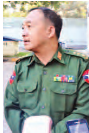
ဗိုလ်မှူးကြီးဝဏ္ဏအောင်။