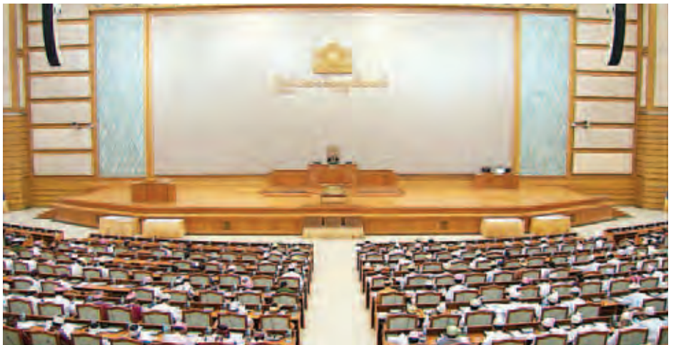
ပထမအကြိမ် ပြည်ထောင်စုလွှတ်တော် (၁၃) ကြိမ်မြောက် ပုံမှန်အစည်းအဝေး(၂၇)ရက်မြောက်နေ့ ကျင်းပစဉ်။ (သတင်းစဉ်)

ယင်းသို့ ရှင်းလင်းတင်ပြရာတွင် ဒုတိယကာလတို(၅) နှစ်စီမံကိန်း အကောင်အထည်ဖော်နိုင်မှုအပေါ် စိစစ်သုံး သပ်ခြင်း၊ ဒုတိယကာလတို (၅) နှစ်စီမံကိန်း မဟာဗျူဟာ နှင့် နည်းဗျူဟာ၊ ရည်မှန်းချက်နှင့် ရှုမြင်ချက်၊ စီမံကိန်းများ အတွက် ဘဏ္ဍာငွေရရှိနိုင်မှု ဖော်ပြချက်၊ စီးပွားရေးကဏ္ဍများ၊ စက်မှုဖွံ့ဖြိုးမှုကို အားကောင်းစေသော ကဏ္ဍများ၊ လူမှုရေး ကဏ္ဍများ၊ လူမှုစီးပွားဖွံ့ဖြိုးတိုးတက်ရေးအတွက် ကဏ္ဍ များအချင်းချင်း ချိတ်ဆက်ဆောင်ရွက်မည့် မဟာဗျူဟာ၊ အချိုးကျမျှတစွာ ဖွံ့ဖြိုးတိုးတက်ရေးနှင့် ဒေသန္တရစီမံကိန်း၊ ပြည်နယ်နှင့် တိုင်းဒေသကြီးစီမံကိန်းများ၊ မြန်မာနိုင်ငံ၏ နှစ်အလိုက် နိုင်ငံခြားကုန်သွယ်မှု မှတ်တမ်းဆိုင်ရာများ၊ အမျိုးသား ဘက်စုံဖွံ့ဖြိုးတိုးတက်မှု စီမံကိန်းဆိုင်ရာများ၊