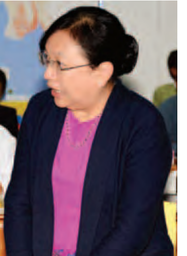
ပြည်ထောင်စုဝန်ကြီး ဒေါက်တာ ဒေါ်ခင်စန်းရီ။

ယင်းနောက် အကြံပေးအဖွဲ့အတွင်းရေးမှူး ဒေါက်တာဇော်ဦးက ရေကြီးရေလျှံမှုနှင့် မြေပြိုမှုများ၊ ဇုန်လိုအပ်ချက်များဆန်းစစ်ချက်အစီရင်ခံစာ ရေးဆွဲခဲ့မှုနှင့် ရေရှည်တည်တံ့သည့် ပြန်လည်ထူထောင်ရေးဆိုင်ရာ မူဘောင်တစ်ရပ်ရေးဆွဲရန် ဆောင်ရွက်နေမှု အခြေအနေများကိုလည်းကောင်း၊ စီမံခန့်ခွဲမှုကော်မတီအတွင်းရေးမှူး ဒုတိယဝန်ကြီး ဦးဘုန်းဆွေက ၂၀၁၅ ခုနှစ်က ဖြစ်ပွားခဲ့သည့် ရေကြီးရေလျှံမှုများနှင့် မြေပြိုမှုများတွင်