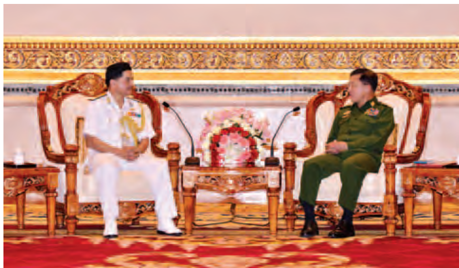
တပ်မတော်ကာကွယ်ရေးဦးစီးချုပ် ဗိုလ်ချုပ်မှူးကြီးမင်းအောင်လှိုင် အိန္ဒိယသမ္မတနိုင်ငံ အိန္ဒိယကမ်းခြေစောင့်တပ်ဖွဲ့မှ ညွှန်ကြားရေးမှူးချုပ် Vice Admiral HCS Bisht, AVSM အား လက်ခံတွေ့ဆုံစဉ်။ (မြဝတီ)

ကိုယ်ခန္ဓာ ပွံ့ဖြိုးစေဖို့ ကျန်းမာ သန်စွမ်းစေဖို့ ဉာဏ်ရည်ဉာဏ်သွေး ကောင်းစေဖို့ အသားအရည် လှပစေဖို့ ကျောင်းနေအရွယ် သင့်ကလေးကို နွားနို့တိုက်ပါဖို့