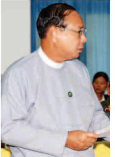
ပြည်ထောင်စုဝန်ကြီး ဦးဝဏ္ဏမောင်လွင်။

ဆက်လက်၍ လုပ်ငန်းကော်မတီဥက္ကဋ္ဌ နိုင်ငံခြားရေးဝန်ကြီးဌာန ပြည်ထောင်စုဝန်ကြီး ဦးဝဏ္ဏမောင်လွင်က သဘာဝဘေးဒဏ်သင့်ဒေသများ အမြန်ပြန်လည်ထူထောင်ရေးအတွက် နိုင်ငံတကာမှ နည်းပညာနှင့်