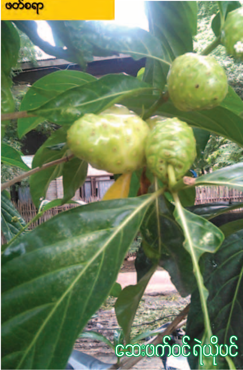
ဆေးဖက်ဝင် ရဲယိုပင်

ကောင်း၊ ဟာပိုင်ယိုကျွန်းတွင် နော်နီ (Noni) ဟု လည်းကောင်း ခေါ်ဝေါ်ကြ သည်။ နော်နီ(ဝါ) ရဲယိုသည် ပြင်သစ်ပိုလီနီရှားကျွန်းစုများ၊ မာရှယ် ကျွန်းစုများနှင့် ပစိဖိတ်ကျွန်းစုများတွင် ပေါက် ရောက်သော ဒေသမျိုးရင်းအပင်တစ်မျိုးဖြစ်ကာ ယင်းဒေသခံများ၏ တိုင်းရင်းဆေးအပင်ဟု သိရ သည်။