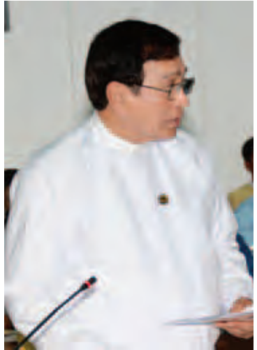
ပြည်ထောင်စုဝန်ကြီး ဦးကျော်လွင်။

ဒေသသည် ယခင်က ရေလွှမ်းမိုးမှုပုံမှန် ဖြစ်လေ့ရှိသဖြင့် လူသန်းရာပေါင်းများစွာကို အိုးမဲ့အိမ်မဲ့ဖြစ်စေကာ လူမှုစီးပွားဘဝများ ပျက်စီးခဲ့ကြရပါကြောင်း၊ ၁၉၉၄ ခုနှစ်တွင် ယန်စီမြစ်ဝှမ်းထိန်းသိမ်းရေး (Yangtze River water conservancy commence) ကော်မရှင်ဖွဲ့စည်း၍ မြစ်ကျဉ်းသုံးသွယ်စီမံကိန်းကို ဆောင်ရွက်ခဲ့ရာ ၂၀၁၂ ခုနှစ်တွင် လုံးဝပြီးစီးခဲ့ပြီး ရေလွှမ်းမိုးမှုကာကွယ်ရေးကို အောင်မြင်စွာ ဆောင်ရွက်နိုင်ခဲ့ပါကြောင်း၊ ယင်းစီမံကိန်းကြောင့် မြစ်ကြောဒေသများတွင် ရေလွှမ်းမိုးမှုဒဏ်ကို ကာကွယ်နိုင်ခဲ့သည့်အပြင် ရင်းနှီးမြှုပ်နှံသူများ ပိုမိုဆွဲဆောင်နိုင်ခဲ့ခြင်း၊ လျှပ်စစ်ဓာတ်အား ထုတ်လုပ်နိုင်ခြင်း၊ ရေကြောင်းသွားလာမှု ပိုမိုအဆင်ပြေစေခြင်းနှင့် မိုးခေါင်ရေရှားမှုကို လျော့ပါးစေခြင်း စသည့်အကျိုးကျေးဇူးများ ရရှိခဲ့စားခဲ့ပြီး လူနေထုထပ်သော ရေအရင်းအမြစ် အကြွယ်ဝဆုံးနှင့် တရုတ်နိုင်ငံ၏ စီးပွားရေးဖွံ့ဖြိုးမှု အရှိဆုံးသော