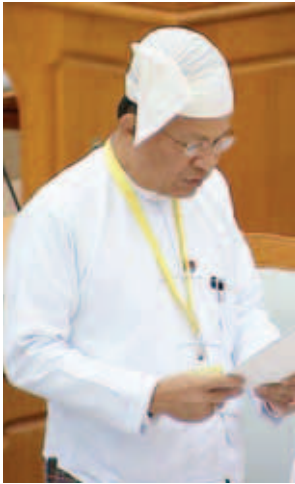
ပြည်ထောင်စုဝန်ကြီး ဒေါက်တာကဏ္ဍ

ရှေးဦးစွာ ၂၀၁၆-၁၇ ဘဏ္ဍာနှစ် အမျိုးသားစီမံကိန်းဥပဒေကြမ်းနှင့် စပ်လျဉ်း၍ ဥပဒေကြမ်းပူးပေါင်းကော်မတီ၏ လေ့လာတွေ့ရှိချက်နှင့် သဘောထားမှတ်ချက် အစီရင်ခံစာကို ကော်မတီ တွဲဖက်အတွင်းရေးမှူး