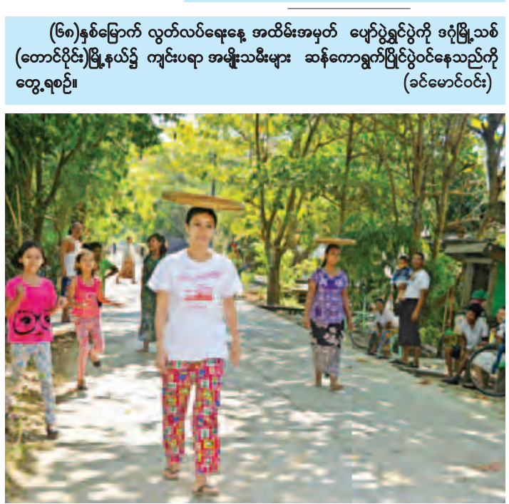
(၆၈)နှစ်မြောက် လွတ်လပ်ရေးနေ့ အထိမ်းအမှတ် ပျော်ပွဲရွှင်ပွဲကို ဒဂုံမြို့သစ် (တောင်ပိုင်း)မြို့နယ်၌ ကျင်းပရာ အမျိုးသမီးများ ဆန်ကောရွက်ပြိုင်ပွဲဝင်နေသည်ကို တွေ့ရစဉ်။ (ခင်မောင်ဝင်း)