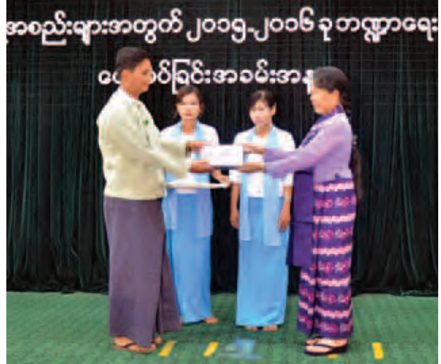
၆ ဒသမ ၃ သိန်း၊ မော်လမြိုင်ခရိုင်အတွင်းရှိ ကိုယ့်အားကိုယ်ကိုးမူလတန်း ကြိုကျောင်း ၃၂ ကျောင်းအတွက် ၁၉၂ သိန်း စုစုပေါင်း ၁၀၃၆ ဒသမ ၃၆ သိန်းကို သက်ဆိုင်သူများထံ ထောက်ပံ့ပေးအပ်သည်။ ဆက်လက်၍ ပြည်ထောင်စုဝန်ကြီးသည် အိမ်တွင်းမှုသက်မွေးပညာသင် ကျောင်း၌ သင်တန်းများပို့ချနေမှုကို ကြည့်ရှုစစ်ဆေးသည်။ ထို့နောက် ပြည်နယ်ကယ်ဆယ်ရေးရုံးဒေါက်တာ စစ်ဆေးပြီး ပြည်နယ်ဦးစီးမှူးရုံး တည်ဆောက်မည့်မြေနေရာကို ကြည့်ရှုစစ်ဆေး၍ လိုအပ်သည်များမှာကြားကာ ကျိုက်ထီးရိုးဆံတော်ရှင်ဘုရား၌ အလှူငွေများလှူဒါန်းခဲ့ကြောင်း သိရသည်။ (သတင်းစဉ်)

ဦးအတွက် ၂၃ ဒသမ ၉၄ သိန်း၊ ချောင်းဆုံမြို့နယ်အတွင်းရှိ အဘိုး အဘွား ၁၈၉ ဦးအတွက် ၃၄ ဒသမ ၀၂ သိန်း၊ မုဒုံမြို့နယ်အတွင်းရှိ အဘိုး အဘွား ၂၇၃ ဦးအတွက် ၄၉ ဒသမ ၁၄ သိန်း၊ မော်လမြိုင်မြို့နယ်အတွင်းရှိ အဘိုး အဘွား ၁၂၂ ဦးအတွက် ၂၁ ဒသမ ၉၆ သိန်း၊ ရေးမြို့နယ်အတွင်းရှိ အဘိုး အဘွား ၁၁၉ ဦးအတွက် ၂၁ ဒသမ ၄၂ သိန်း၊ သံဖြူဇရပ်မြို့နယ်အတွင်းရှိ အဘိုး အဘွား ၁၅၀ အတွက် ၂၇ သိန်း၊ ကျိုက်ထိုမြို့နယ်အတွင်းရှိ အဘိုး အဘွား ၁၀၀ အတွက် ၁၈ သိန်း၊ ပေါင်မြို့နယ်အတွင်းရှိ အဘိုး အဘွား ၁၁၄ ဦးအတွက် ၂၀ ဒသမ ၅၂ သိန်း၊ ဘီးလင်းမြို့နယ်အတွင်းရှိ အဘိုး အဘွား ၁၀၀ အတွက် ၁၈ သိန်း၊ သထုံမြို့နယ်အတွင်းရှိ အဘိုး အဘွား ၁၀၂ ဦးအတွက် ၁၈ ဒသမ ၃၆ သိန်းတို့ကို ပေးအပ်ပြီး မွန်ပြည်နယ်ဝန်ကြီးချုပ် ဦးအုန်းမြင့်က ကျိုက်ထိုမြို့နယ် ဆိပ်ဖူးတောင်လူငယ်ဖွံ့ဖြိုးရေး ပရဟိတဂေဟာ အတွက် ၁၉၄ ဒသမ ၅ သိန်း၊ ဘီးလင်းမြို့နယ်အတွင်းရှိ သော်ကမြောင် လူငယ်ဖွံ့ဖြိုးရေးပရဟိတဂေဟာအတွက် ၈၄ ဒသမ ၀၆ သိန်းနှင့် တိုင်းရင်းသား လူငယ်ဖွံ့ဖြိုးရေး ပရဟိတဂေဟာအတွက် ၇၄ ဒသမ ၆ သိန်း၊ သထုံမြို့နယ် အတွင်းရှိ ဘုရားခြောက်ဆူလူငယ်ဖွံ့ဖြိုးရေးပရဟိတဂေဟာအတွက် ၂၃ ဒသမ ၃၆ သိန်းနှင့် သထုံဘိုးဘွားရိပ်သာအတွက် ၂၃ ဒသမ ၃၁ သိန်း၊ သထုံခရိုင်အတွင်းရှိ ကိုယ့်အားကိုယ်ကိုးမူလတန်းကြိုကျောင်း ၁၉ ကျောင်းအတွက် ၁၁၄ သိန်း၊ မော်လမြိုင်မြို့နယ်အတွင်းရှိ တောင်ပိုင်း ဘိုးဘွားရိပ်သာအတွက် ၄၀ ဒသမ ၈၃ သိန်းနှင့် အမျိုးသမီးဂေဟာအတွက် ၁၇ ဒသမ ၃၄ သိန်း၊ မုဒုံမြို့နယ်အတွင်းရှိ ရေတောင်လူငယ်ဖွံ့ဖြိုးရေး ပရဟိတဂေဟာအတွက် ၁၀ ဒသမ ၄ သိန်းနှင့် မုဒုံဘိုးဘွားရိပ်သာအတွက်