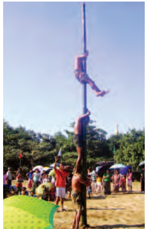
(၆၈)နှစ်မြောက် လွတ်လပ်ရေးနေ့အထိမ်းအမှတ် အားကစားပြိုင်ပွဲများကို ရန်ကုန်တောင်ပိုင်းခရိုင် သန်လျင်မြို့ ဘုရားကုန်းကျေးရွာအုပ်စု ဘုရားကြီးဖေး အနောက်ဘက်ဘောလုံးကွင်းတွင် ချောတိုင်တက်ပြိုင်ပွဲ ကျင်းပစဉ်။ (နေသစ်ဦး)

ယနေ့ကျရောက်သည့် (၆၈)နှစ်မြောက် လွတ်လပ် ရေးနေ့တွင် နံနက်ပိုင်းမှစတင်ကာ ရန်ကုန်တိုင်းဒေသကြီး မြို့နယ်များရှိ ရပ်ကွက်များတွင် တာဝေး၊ တာနီး အပြေး ပြိုင်ပွဲများ၊ ဂုဏ်နိဒါတ်ပွဲပြိုင်ပွဲများ၊ အာလူးကောက် ပြိုင်ပွဲများ၊ ဘောင်းဘီဝတ်ပြိုင်ပွဲများ၊ ခေါင်းအုံးရိုက်ပြိုင်ပွဲ၊ ဘောလုံးပြိုင်ပွဲများ၊ ချောတိုင်တက်ပွဲ၊ ထုပ်ဆီးတိုးပြိုင်ပွဲ များကို ရပ်ကွက်အလိုက် စည်ကားသိုက်မြိုက်စွာ ကျင်းပ ခဲ့ကြသည်။ (မင်းသစ်) (နေသစ်ဦး)