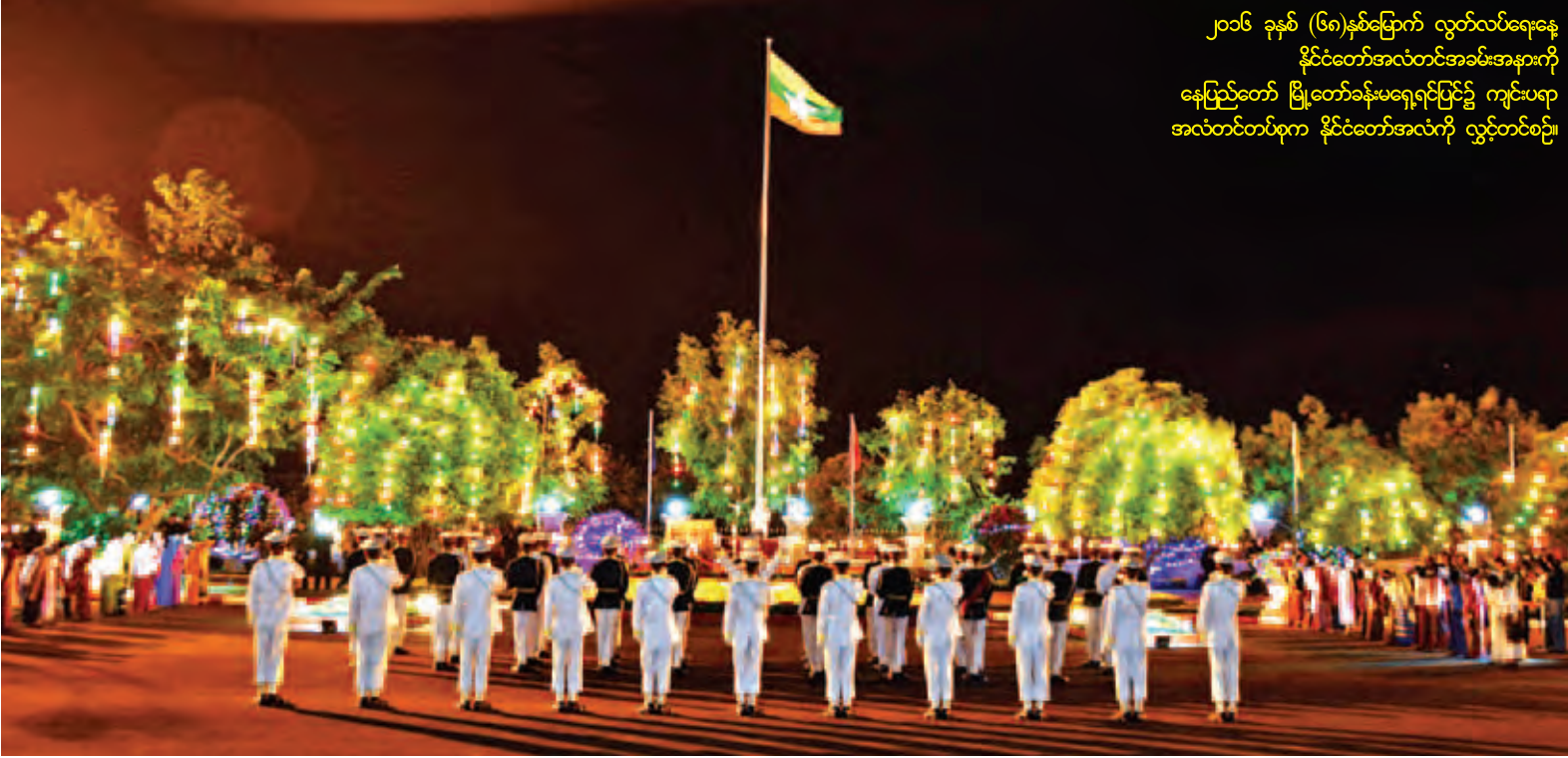
၂၀၁၆ ခုနှစ် (၆၈)နှစ်မြောက် လွတ်လပ်ရေးနေ့ နိုင်ငံတော်အလံတင်အခမ်းအနားကို နေပြည်တော် မြို့တော်ခန်းမရှေ့ရင်ပြင်၌ ကျင်းပရာ အလံတင်တပ်ဖွဲ့က နိုင်ငံတော်အလံကို လှူတင်စဉ်။

နေပြည်တော် ဇန်နဝါရီ ၄ - ပြည်ထောင်စုတိုင်းရင်းသားအားလုံး ပြည်ထောင်စုကြီးအတွင်း၌ ဥမကွဲ သိုက်မပျက် အတူတကွ ရာသက်ပန် ပူးပေါင်းနေထိုင်ရေး၊ ပြည်ထောင်စု မပြိုကွဲရေး၊ တိုင်းရင်းသားစည်းလုံး ညီညွတ်မှုမပြိုကွဲရေးနှင့် အချုပ်အခြာ အာဏာ တည်တံ့ခိုင်မြဲရေးတို့အတွက် တိုင်းရင်းသားအားလုံး စုစည်းထိန်း သိမ်းကာကွယ်ရေး၊ တစ်နိုင်ငံလုံး ပစ်ခတ်တိုက်ခိုက်မှုရပ်စဲရေး သဘော တူညီချက်နှင့်အတူ ထာဝရငြိမ်းချမ်း ရေးရရှိရန် ကြိုးပမ်းဆောင်ရွက်ရေး၊ ခေတ်မီဖွံ့ဖြိုးတိုးတက်သော စည်းကမ်း ပြည့်ဝသည့် ဒီမိုကရေစီနိုင်ငံတော် သစ်ကို ပြည်သူ့စွမ်းအားဖြင့် ကြိုးပမ်း အကောင်အထည်ဖော် ဆောင်ရွက် ရေးဟူသော အမျိုးသားရေးဦးတည် ချက် (၄)ရပ်နှင့်အညီ အနှစ်သာရ ပြည့်ဝစွာ ကျင်းပသည့် ၂၀၁၆ ခုနှစ် (၆၈)နှစ်မြောက် လွတ်လပ်ရေးနေ့ စာမျက်နှာ ၈ ကော်လံ ၁ သို့