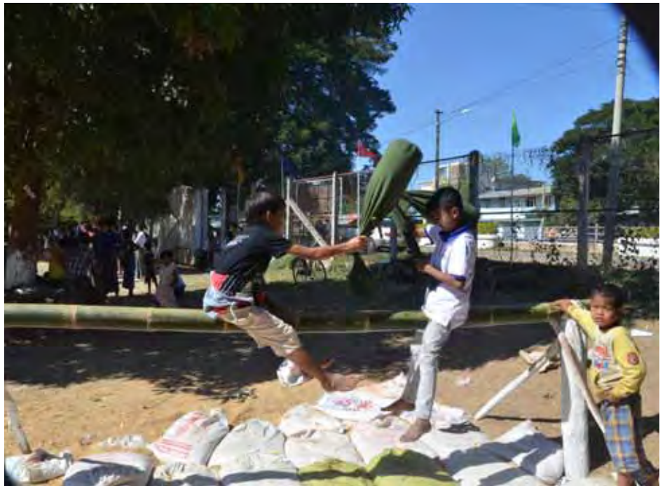
အလက(ခွဲ)-၃ နေပြည်တော်တွင် (၆၈)နှစ်မြောက် လွတ်လပ်ရေးနေ့အထိမ်းအမှတ် ပျော်ပွဲရွှင်ပွဲများ ကျင်းပလျက်ရှိသည်ကို တွေ့ရစဉ်။ (သတင်းစဉ်)