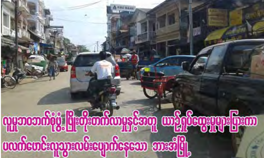
လူမှုဘဝဘက်စုံဖွံ့ဖြိုးတိုးတက်လာမှုနှင့်အတူ ယာဉ်ဂွပ်ထွေးမှုများပြားကာ ပလက်ဖောင်းလူသွားလမ်းပျောက်နေသော ဘားအံမြို့