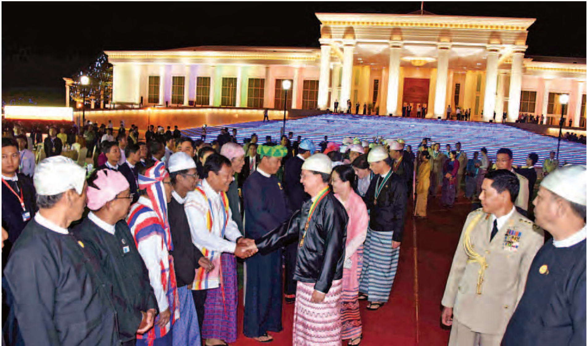
နိုင်ငံတော်သမ္မတ ဦးသိန်းစိန်နှင့် ဇနီး ဒေါ်ခင်ခင်ဝင်း (၆၈)နှစ်မြောက် လွတ်လပ်ရေးနေ့အထိမ်းအမှတ် ညွှိမ့်ပွဲနှင့် ညစာစားပွဲအခမ်းအနားသို့ တက်ရောက်လာသူများအား ရင်းရင်းနှီးနှီး နှုတ်ဆက်စဉ်။ (သတင်းစဉ်)

နိုင်ငံတော်သမ္မတ ဦးသိန်းစိန်နှင့် ဇနီးတို့သည် (၆၈)နှစ်မြောက် လွတ်လပ်ရေးနေ့အထိမ်းအမှတ်ညွှိမ့်ပွဲနှင့် ညစာစားပွဲအခမ်းအနား ကျင်းပသည့် နိုင်ငံတော်သမ္မတအိမ်တော် ဥပစာမြက်ခင်းပြင်သို့ ညနေ ၆ နာရီခွဲတွင် ရောက်ရှိ လာကြပြီး ညစာစားပွဲသို့ တက်ရောက်လာသူများအား ရင်းရင်းနှီးနှီးနှုတ်ဆက်သည်။ အဆိုပါ လွတ်လပ်ရေးနေ့အထိမ်းအမှတ် ညွှိမ့်ပွဲနှင့် ညစာစားပွဲသို့ ဒုတိယသမ္မတ ဒေါက်တာစိုင်းမောင်ခမ်း နှင့် ဇနီး ဒေါ်နန်းရွှေမျှော်၊ ဒုတိယသမ္မတ ဦးညက်ထွန်းနှင့်ဇနီး ဒေါ်ခင်အေးမြင့်၊ စာမျက်နှာ ၃ ကော်လံ ၁ သို့