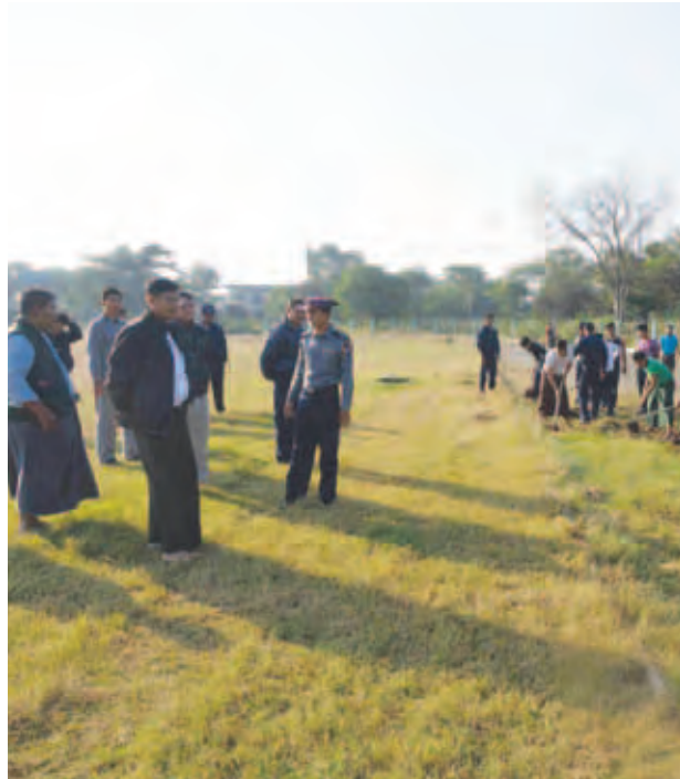
မြင်းမြဲ ဇန်နဝါရီ ၄

မန္တလေးတိုင်းဒေသကြီး မြင်းခြံခရိုင် မြင်းခြံမြို့နယ် အားကစားပြိုင်ကွင်းအတွင်း ဇန်နဝါရီ ၂ ရက် နံနက် ၈ နာရီက သန့်ရှင်းရေးများပြုလုပ်ခဲ့ကြောင်း သိရသည်။