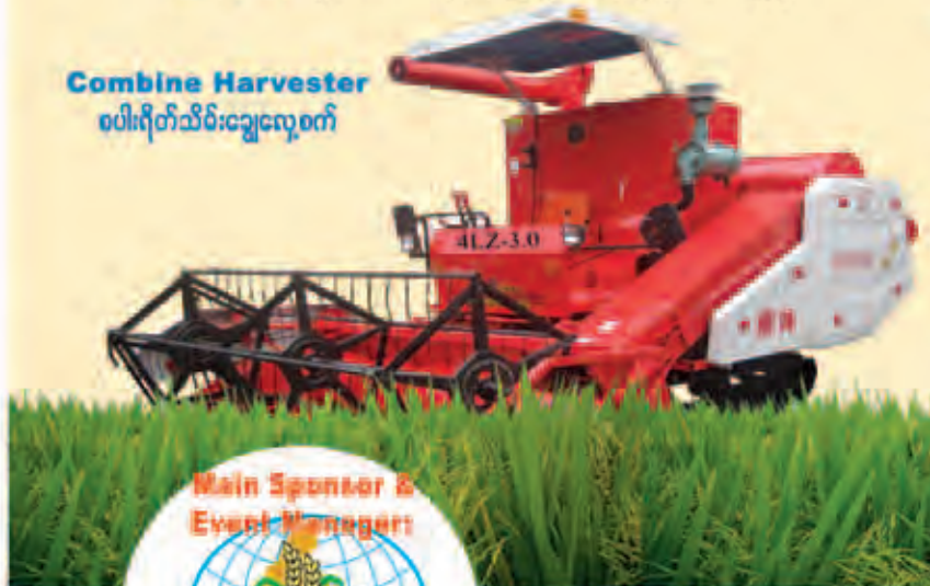
Combine Harvester ပေါ့ရိတ်သိမ်းချွေလှေ့စက်

Stand a chance to win the Grand Prize TRACTOR and many more items in our lucky draw!