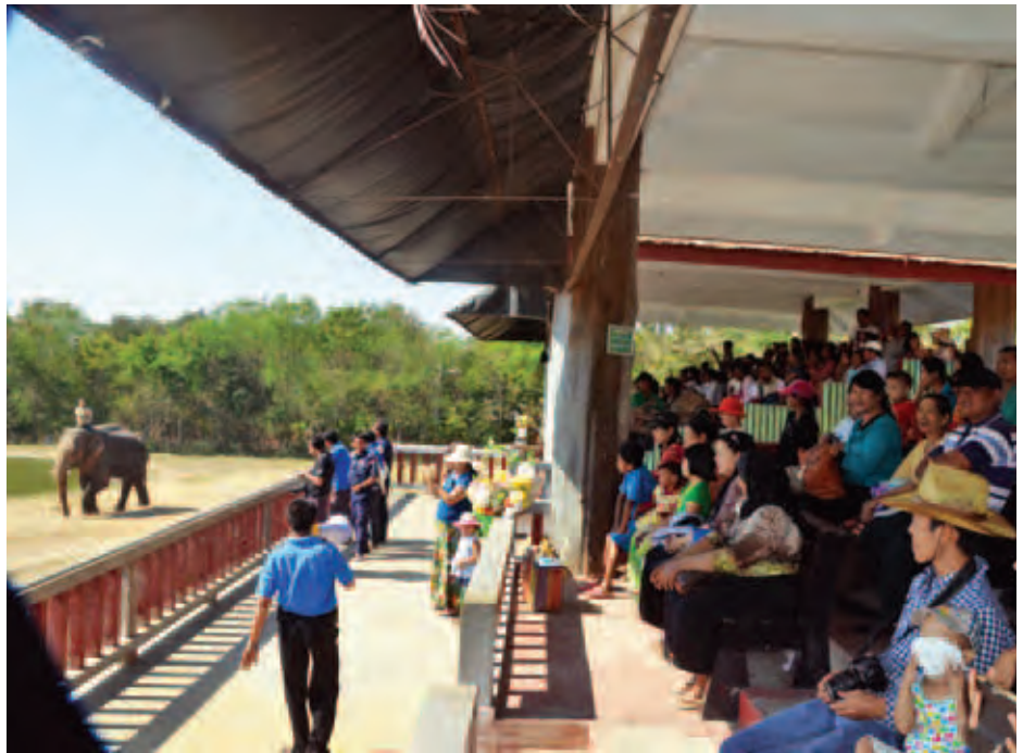
နေပြည်တော် တိရစ္ဆာန်ဥယျာဉ်တွင် လွတ်လပ်ရေးနေ့က လာရောက်အပန်းဖြေသူများဖြင့် စည်ကားလျက် ရှိသည်ကို တွေ့ရစဉ်။