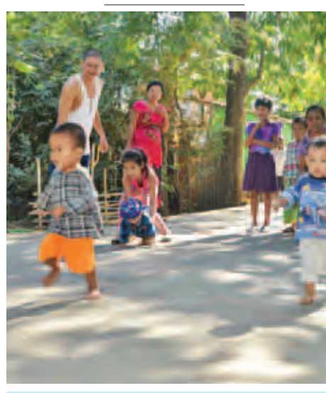
(၆၈)နှစ်မြောက် လွတ်လပ်ရေးနေ့အထိမ်းအမှတ် ပျော်ပွဲရွှင်ပွဲများကို ဒဂုံမြို့သစ်(တောင်ပိုင်း)မြို့နယ် အောင်ရတနာလမ်း၌ ကျင်းပရာ ကလေးငယ်များ အပြေးပြိုင်ပွဲဝင်နေသည်ကို တွေ့ရစဉ်။