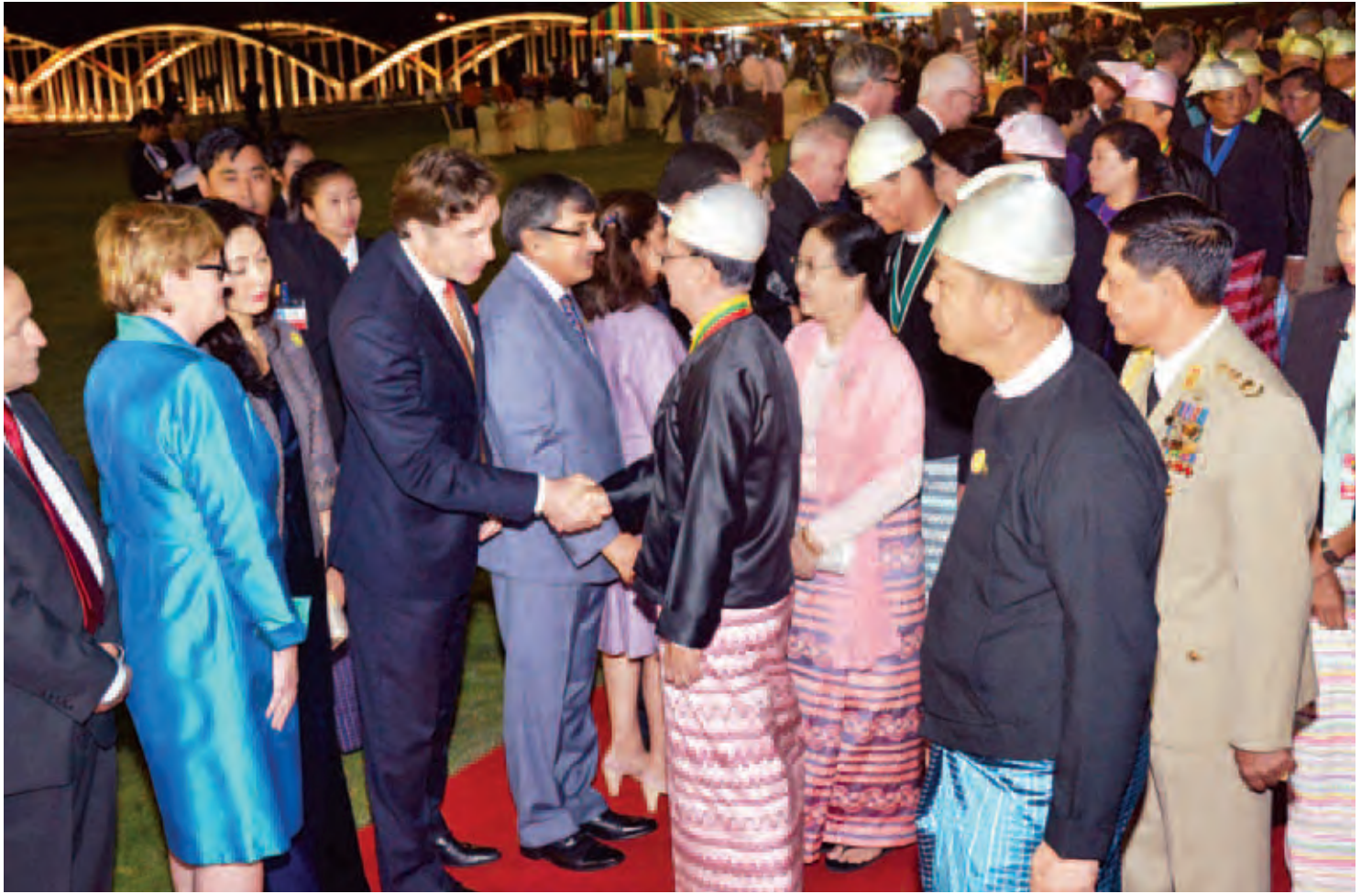
နိုင်ငံတော်သမ္မတ ဦးသိန်းစိန်နှင့် ဇနီးဒေါ်ခင်ခင်ဝင်း (၆၈)နှစ်မြောက် လွတ်လပ်ရေးနေ့ အထိမ်းအမှတ် ညွှန်ပုံနှင့် ညစာစားပွဲအခမ်းအနားသို့ တက်ရောက်လာကြသော သံအမတ်ကြီးများနှင့် ဇနီးများ၊ ကုလသမဂ္ဂအဖွဲ့အစည်းများမှ ဌာနကိုယ်စားလှယ်များနှင့် ဇနီးများအား ရင်းရင်းနှီးနှီးဆက်စဉ်။ (သတင်းစဉ်)

(၆၈)နှစ်မြောက် လွတ်လပ်ရေးနေ့ အထိမ်းအမှတ်ညွှန်ပုံနှင့် ညစာစားပွဲတွင် မီးရှူး မီးပန်းများဖြင့် ပစ်ဖောက်ဂုဏ်ပြုကြပြီး ညစာမသုံးဆောင်မီနှင့် သုံးဆောင်နေစဉ်အတွင်း တေးသံရှင်များက မြန်မာ့အသံခေတ်ပေါ်တေးဂီတအဖွဲ့နှင့် တွဲဖက်၍ တေးသီချင်းများဖြင့် ညွှန်ပုံဖော်ပြေတင်ဆက်ကြသည်။ (သတင်းစဉ်)