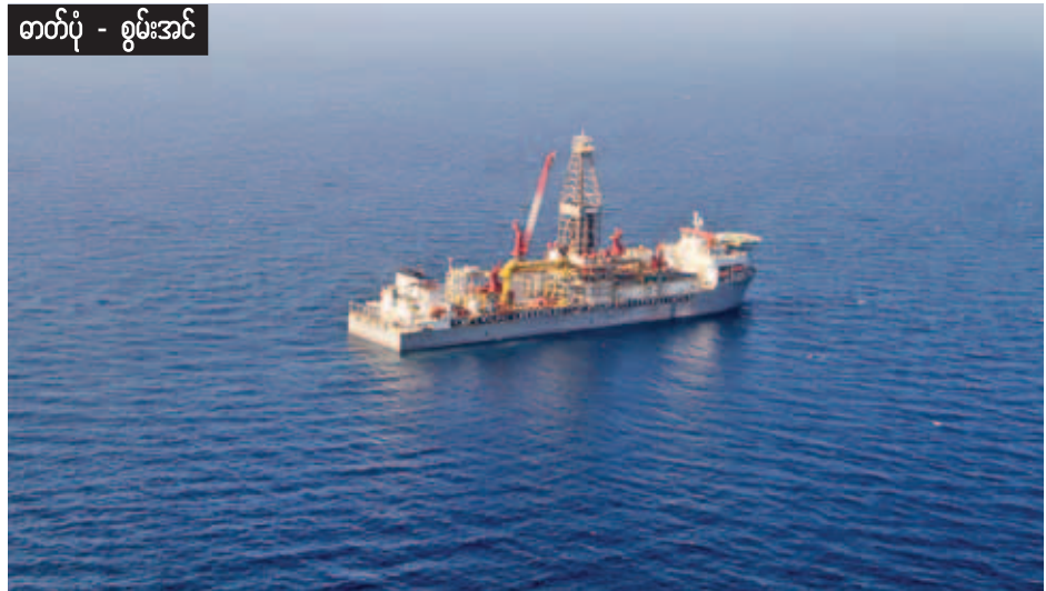
ဓာတ်ပုံ - စွမ်းအင်

ဒေသကြီး အနောက်ဘက် ငွေ့ဆောင်ကမ်းခြေမှ မိုင် ၃၀ ခန့်အကွာ ကမ်းလွန်ပင်လယ်တွင် ရေနံအနက် ၂၀၃၃ မီတာနေရာ၌ တည်ရှိပြီး ၎င်းမှ ပင်လယ်ကြမ်းပြင်အောက် အနက် မီတာ ၅၀၀၀ ခန့်ရှိ Saung အမည်ရ လွှာတွင် ရှိ (Anticline Structure)အတွင်း တူးဖော်သက်တမ်း (Pliocene) သက်တမ်းရှိ သဲကျောက်လွှာများအထိ တူးဖော်ခဲ့ခြင်းဖြစ်သည်။ ၂၀၁၅ ခုနှစ် နိုဝင်ဘာ ၂၆ ရက်က သဲကြောစမ်းသပ် တိုင်းတာခြင်း(Wireline Log)ဆောင်ရွက်ခဲ့ရာ အနက် ၄၂၉၇ မီတာ၊ အနက် ၄၃၅၆ မီတာနှင့် အနက် မီတာ ၄၄၀၀ ရှိ သဲကြောသုံးခုအတွင်း သဘာဝဓာတ်ငွေ့များ ခိုအောင်းဖြစ်တည်နေကြောင်း တိုင်းတာတွေ့ရှိခဲ့သည်။ အဆိုပါတိုင်းတာတွေ့ရှိမှုများအရ ဘင်္ဂလားပင်လယ်