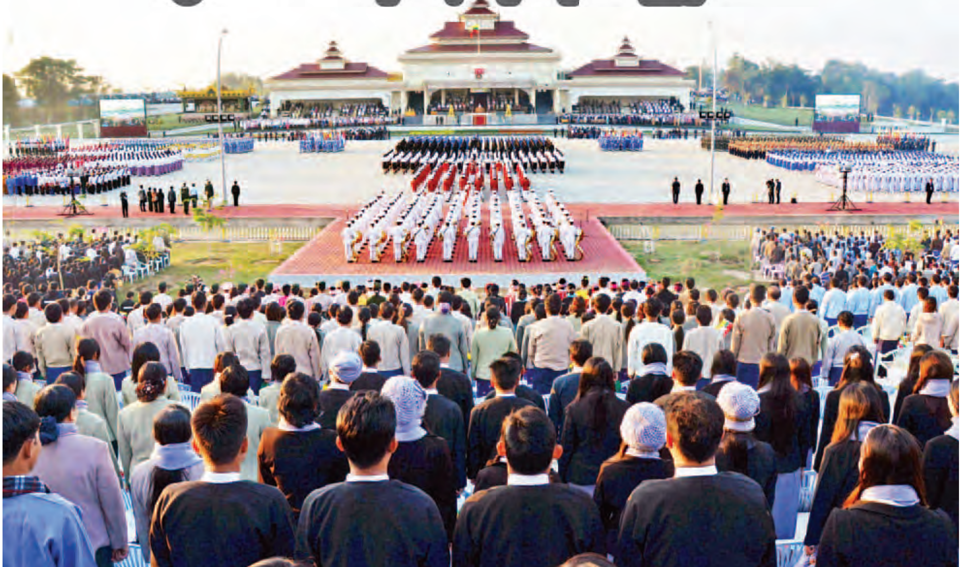
(၆၇) နှစ်မြောက် လွတ်လပ်ရေးနေ့ ဗိုလ်ရှစ်အခမ်းအနားကို ၂၀၁၅ ခုနှစ် ဇန်နဝါရီ ၄ ရက်နေ့က နေပြည်တော်တွင် ဤကဲ့သို့ ခမ်းနားထည်ဝါစွာကျင်းပခဲ့သည်။