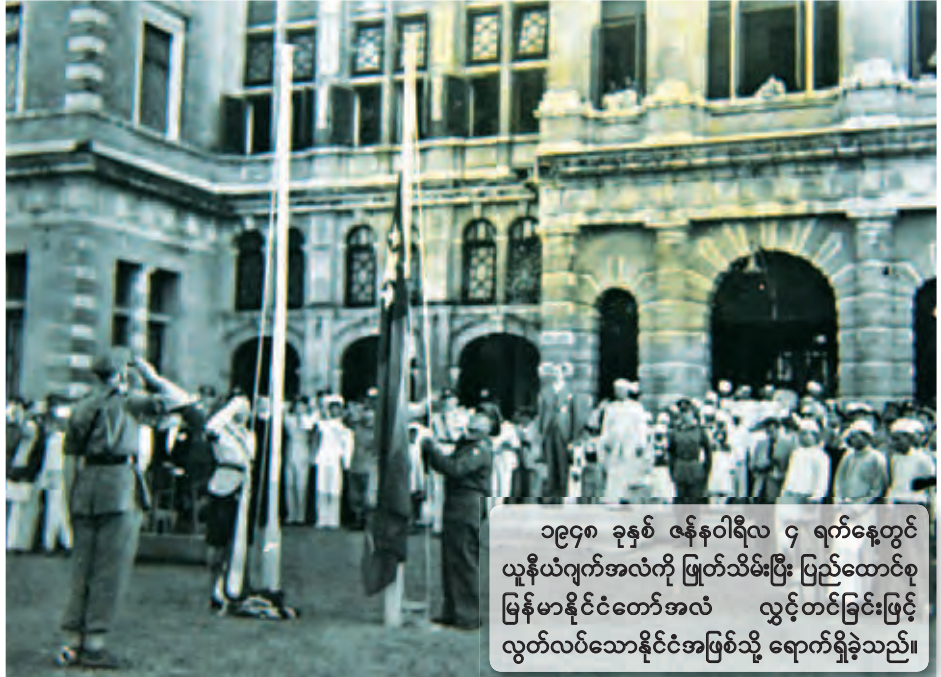
၁၉၄၈ ခုနှစ် ဇန်နဝါရီလ ၄ ရက်နေ့တွင် ယူနိုက်တက်အလံကို ဖြုတ်သိမ်းပြီး ပြည်ထောင်စု မြန်မာနိုင်ငံတော်အလံ လွှင့်တင်ခြင်းဖြင့် လွတ်လပ်သောနိုင်ငံအဖြစ်သို့ ရောက်ရှိခဲ့သည်။