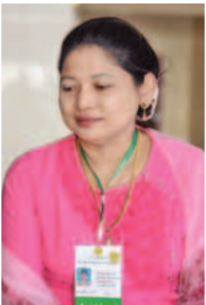
ဒေါ်ငြိမ်းငြိမ်းသော်။