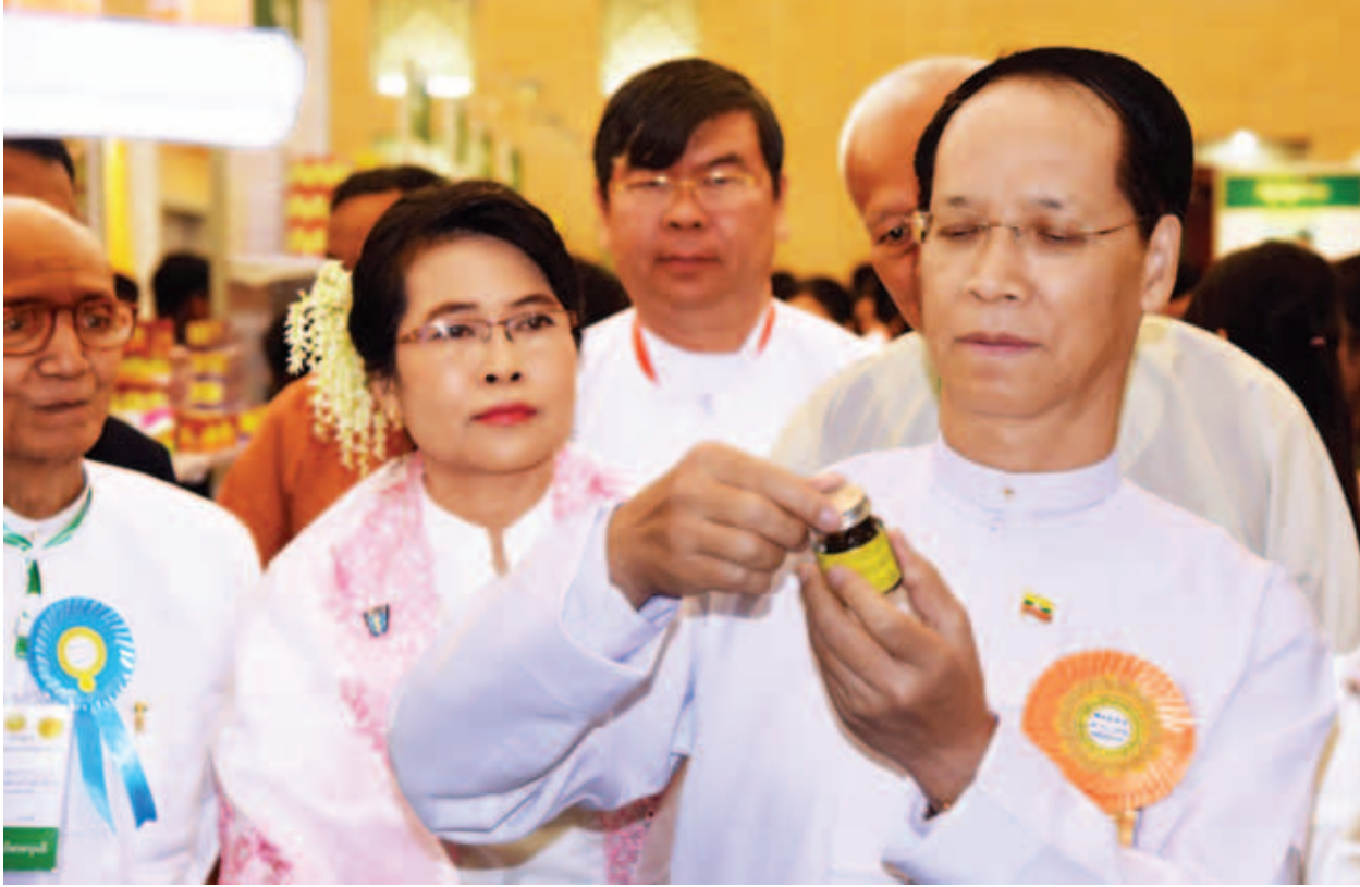
ဒုတိယသမ္မတ ဒေါက်တာစိုင်းမောက်ခမ်း ညီလာခံကျင်းပသည့်ခန်းမအတွင်း ခင်းကျင်းပြသထားသည့် တိုင်းရင်းဆေးဝါးများကို ကြည့်ရှုစဉ်။(သတင်းစဉ်)

(၁၆)ကြိမ်မြောက် မြန်မာ့တိုင်းရင်းဆေးသမားတော်များညီလာခံဖွင့်ပွဲ အခမ်းအနားကို ယနေ့နံနက် ၉ နာရီတွင် နေပြည်တော်ရှိ မြန်မာအပြည်ပြည် ဆိုင်ရာ ကွန်ဗင်းရှင်းဗဟိုဌာန(၂)၌ကျင်းပရာ ဒုတိယသမ္မတ ဒေါက်တာ စိုင်းမောက်ခမ်း တက်ရောက်အမှာစကားပြောကြားသည်။ အဆိုပါအခမ်းအနားသို့ ပြည်ထောင်စုဝန်ကြီးများ၊ ဒုတိယဝန်ကြီးများ၊ တိုင်းဒေသကြီးနှင့် ပြည်နယ်များမှ တိုင်းရင်းဆေးသမားတော်ကြီးများ၊ တိုင်းရင်း ဆေးကောင်စီနှင့်အသင်းအဖွဲ့များမှ ကိုယ်စားလှယ်များ၊ တိုင်းရင်းဆေးဝါး ထုတ်လုပ်ရေးမှ တာဝန်ရှိသူများ တက်ရောက်ကြသည်။ အခမ်းအနား၌ ဒုတိယသမ္မတက အမှာစကားပြောကြားရာတွင် မြန်မာ့ တိုင်းရင်းဆေးသမားတော်များညီလာခံကို နှစ်စဉ်ကျင်းပခဲ့သည်မှာ ယခုနှစ် ဆိုလျှင် (၁၆)ကြိမ်မြောက် ရှိပြီဖြစ်ပါကြောင်း၊ ညီလာခံကို တစ်နှစ်တစ်ကြိမ် ကျင်းပနိုင်မှုဖြင့် ကျေနပ်တင်းတိမ်မနေကြဘဲ ညီလာခံအဆက်ဆက်၌ ခေတ် ကာလနှင့် လိုက်လျောညီထွေမှုရှိသည့် အဆိုပြုချက်၊ ထောက်ခံချက်၊ ဆွေးနွေး ချက်များပြုလုပ်ပြီး ချမှတ်ပေးသည့်လုပ်ငန်းစဉ်များကို အပြည့်အဝ အကောင် အထည်ဖော်နိုင်အောင် စုပေါင်းအားထုတ်ကြရန်လိုအပ်ပါကြောင်း။ မြန်မာ့တိုင်းရင်းဆေးပညာဖွံ့ဖြိုးတိုးတက်လာမှုအဆင့်ဆင့်ကို ပြန်ကြည့် မည်ဆိုပါက ၁၉၅၃ ခုနှစ်တွင် တိုင်းရင်းဆေးမြှင့်တင်ရေးရုံးကို ကျန်းမာရေး ဦးစီးဌာနအောက်တွင် စတင်ဖွင့်လှစ်ခဲ့ပြီး ၁၉၈၉ ခုနှစ်တွင် ကျန်းမာရေးဝန်ကြီး ဌာန၌ တိုင်းရင်းဆေးပညာဦးစီးဌာနကို သီးခြားဌာနအဖြစ် ဖွဲ့စည်းနိုင်ခဲ့ပါ ကြောင်း။ ၁၉၇၆ ခုနှစ်တွင် တိုင်းရင်းဆေးပညာရှင်များ လေ့ကျင့်မွေးထုတ်ပေးနိုင်ရေး အတွက် မန္တလေးတိုင်းရင်းဆေးသိပ္ပံကျောင်းကို ဖွင့်လှစ်ပြီး ဒီပလိုမာအဆင့် ပညာရှင်များ မွေးထုတ်ပေးနိုင်ခဲ့ပါကြောင်း၊ ၂၀၀၀ ပြည့်နှစ်တွင် တိုင်းရင်းဆေး ကောင်စီဥပဒေကို ပြဋ္ဌာန်းနိုင်ခဲ့ပြီး