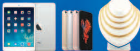
အမှန်တကယ်ဆုပေးမည့် မရည်များသည် မကြော်ငြာသွင်းခေါ်ပြုထားသောမရည်များနှင့် အနည်းငယ်သာခြားပွဲနိုင်ပါသည်