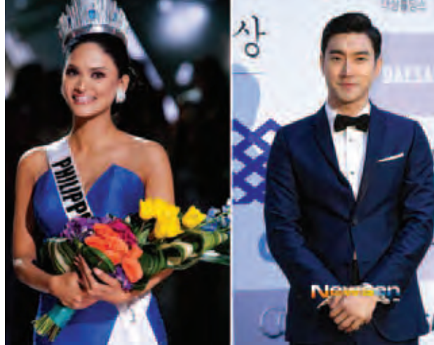
အေးပြည့် - စုစည်းသည်

ဓာတ်ပုံလွဲမှားမှုအတွက် တောင်းပန် ၂၉-၁၂-၂၀၁၅ ရက်နေ့ထုတ် ကြေးမုံသတင်းစာ စာမျက်နှာ ၁၂ တွင် ဖော်ပြပါရှိသော “Marco Polo ရုပ်ရှင်သစ်ရဲ့ ရိုက်ကူးရေးလုပ်ငန်းကို စတင်နေပြီဖြစ်တဲ့ မိရိုလ်ယို” သတင်း၌ ပါရှိသည့် သတင်းဓာတ်ပုံ လွဲမှားဖော်ပြခဲ့မှုအတွက် အနူး အညွတ် တောင်းပန်အပ်ပါသည်။ (စာတည်း)