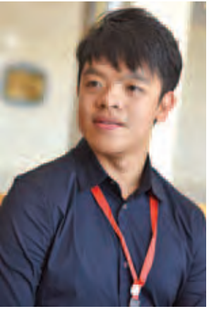
မောင်ကံသာညို။