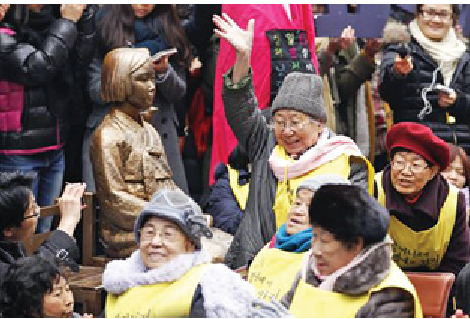
ယင်းသို့ ရုပ်ပိုင်းဆိုင်ရာသာမက စိတ်ပိုင်းဆိုင်ရာကိုပါ ထိခိုက်မှုရှိခဲ့သည့် လုပ်ရပ်အတွက် ဝန်ကြီးချုပ် ရှင်ဇီအဘေးသည် အလွန်အမင်းဝမ်းနည်းလျက်ရှိပါ ကြောင်း ဝန်ကြီး ခိုင်ရီဒါက ဆက်လက်ပြောသည်။

ဂျပန်နှင့် တောင်ကိုရီးယားနှစ်နိုင်ငံဆက်ဆံရေးကို ထိခိုက်လျက်ရှိသော ဒုတိယကမ္ဘာစစ်အတွင်း ဂျပန် တပ်ဖွဲ့က တောင်ကိုရီးယားအမျိုးသမီးများအား လိင် ကျေးကျွန်ပြုမှုနှင့်ပတ်သက်ပြီး နှစ်နိုင်ငံအစိုးရအနေ ဖြင့် ဆွေးနွေးညှိနှိုင်းမှုများ အကြိမ်ကြိမ်ပြုလုပ်ခဲ့ပြီးနောက် ယခုအကြိမ်တွင် သဘောတူညီမှုရရှိခဲ့ပြီဖြစ်ကြောင်း သိရ သည်။