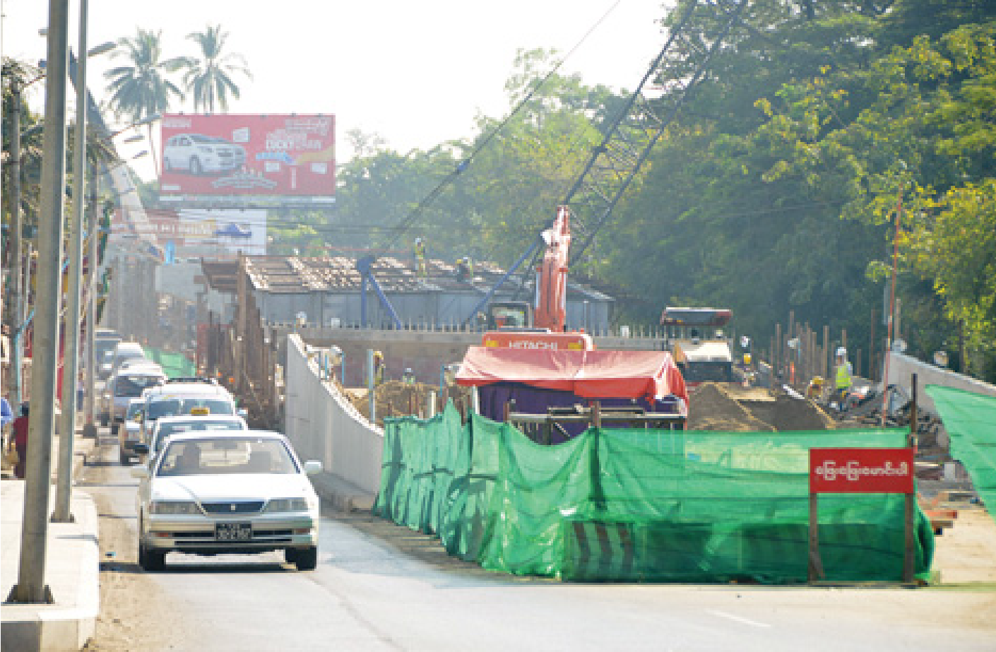
တည်ဆောက်ဆဲကုက္ကိုင်းခုံးကျော်တံတား စီမံကိန်းလုပ်ငန်းခွင်အား တွေ့ရစဉ်။ [ဓာတ်ပုံ-ခင်မောင်ဝင်း]

ရန်ကုန်မြို့တွင် တည်ဆောက်ဆဲ ခုံးကျော်တံတား များအနက် ကုက္ကိုင်း မီးပွိုင့်လမ်းဆုံ ခုံးကျော်တံတား စီမံ ကိန်းကို ယခုဘဏ္ဍာနှစ်အတွင်း ပြီးစီးအောင် ဆောင်ရွက် နေကြောင်း သိရသည်။ ရန်ကုန်မြို့ ကမ္ဘာအေးစေတီလမ်းနှင့် တက္ကသိုလ် ရိပ်သာလမ်း မီးပွိုင့်လမ်းဆုံတွင် အကောင်အထည်ဖော် တည်ဆောက်နေသည့် ကုက္ကိုင်းခုံးကျော်တံတား စီမံကိန်း ရာခိုင်နှုန်းအတော်များများ ပြီးစီးနေပြီဖြစ်ပြီး ယခု ဘဏ္ဍာ နှစ်အတွင်း ပြီးစီးနိုင်ရန် အကောင်အထည်ဖော်သွားမည် ဟု သိရသည်။ “ကုက္ကိုင်းခုံးကျော်တံတားနဲ့ ရှစ်မိုင်ခုံးကျော် တံတားတို့က သတ်မှတ်ချက်အတိုင်း ပြီးနိုင်ပြီး လာမယ့် ဖေဖော်ဝါရီ မတ်လလောက်မှာ ဖွင့်နိုင်မှာပါ။ ကုက္ကိုင်း ခုံးကျော်တံတားကို ဖေဖော်ဝါရီ ၁၂ ရက် (ပြည်ထောင်စုနေ့) မှာ ဖွင့်နိုင်ဖို့ ရည်ရွယ်ထားပါတယ်။ တာမေ့ "V" ပုံသဏ္ဍာန် ခုံးကျော်တံတားကတော့ ဒီတံတားတွေထက် နောက်ကျဖို့ ရှိတယ်။ တစ်နှစ်ခွဲအတွင်း အပြီးဆောင်ရွက်ဖို့ လျာထားပါ တယ်။ ဆောက်လုပ်ခဲ့တဲ့ ခုံးကျော်တံတားတွေနဲ့ အခု ဆောက်လုပ်ဆဲ ခုံးကျော်တံတားတွေမှာ ဘုရင့်နောင် နှစ်ထပ် ခုံးကျော်တံတားက ဆောက်လုပ်မှုကုန်ကျစရိတ် အများဆုံးပဲ ဖြစ်ပါတယ်” ဟု ရန်ကုန်မြို့ရှိ ခုံးကျော်တံတား တည်ဆောက်ရေးလုပ်ငန်းများနှင့် ပတ်သက်၍ တိုင်းဒေသကြီး တာဝန်ရှိသူတစ်ဦးက ပြောသည်။ လက်ရှိတွင် ရန်ကုန်မြို့၌ ကားလမ်းကူး ခုံးကျော် တံတားများ၊ မြစ်ကူးချောင်းကူးတံတားများကို တည်ဆောက် လျက်ရှိရာ ကားလမ်းကူးခုံးကျော်တံတားများဖြစ်သော ရှစ်မိုင်လမ်းဆုံ ခုံးကျော်တံတား၊ ကုက္ကိုင်းလမ်းဆုံ ခုံးကျော် တံတား၊ စာမျက်နှာ ၃ ကော်လံ ၅ သို့