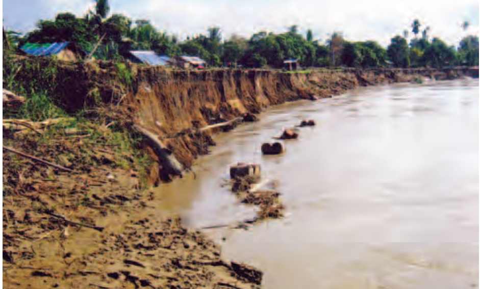
ရေတိုက်စားခံနေရသော မြစ်သာမြစ်ကမ်းဘေးမှ နတ်နန်းရွာ။

ယခုအခါ ရွာဟောင်းတွင် အိမ်ခြေ ၃၀ ခန့်၊ ရွာသစ် တွင် အိမ်ခြေ ၈၀ ခန့် ပြောင်းရွှေ့နေထိုင်လျက်ရှိကြပါ သည်။ မြစ်သာမြစ်ရေကား နှစ်ပေါင်း ၁၁၉ နှစ် အကြာ တွင် နတ်နန်းရွာကလေးအား ရွာသစ်နှင့် ရွာဟောင်းဟူ၍ နှစ်ရွာဖြစ်ပေါ်စေကာ ရွာနှစ်ခြမ်းကွဲသွားခဲ့ပါကြောင်း မှတ်တမ်းပြုရေးသားလိုက်ရပါသည်။ ။