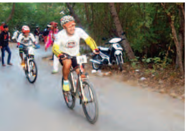
ပထမဆုကျပ်သုံးသိန်း၊ ဒုတိယဆု ကျပ်နှစ်သိန်း၊ တတိယဆုကျပ် တစ်သိန်း၊ စတုတ္ထဆုကျပ်ခုနစ် သောင်း၊ ပဉ္စမဆုကျပ်ငါးသောင်း အသီးသီးချီးမြှင့်ပြီး ပြိုင်ပွဲဝင် ငါးဦး အား နှစ်သိန်းဆုအဖြစ် ငွေကျပ်သုံး သောင်းစီချီးမြှင့်ခဲ့သည်။ အသက် ၂၀ သိန်းတန် BMW (၆၀) နှစ်အထက် ပြိုင်ပွဲဝင် ၁၇ ဦး နှင့် အမျိုးသမီးပြိုင်ပွဲဝင် ၁၃ ဦးတို့ ကို အား အမှတ်တရ ဂုဏ်ပြုလက်ဆောင်

ပြောကြားသည်။ ထို့ပြင် အသက်(၆၀)နှင့် အထက် ပြိုင်ပွဲတွင် ဝင်ရောက်ယှဉ်ပြိုင်ခဲ့ သည့် ကနေဒါနိုင်ငံသားတစ်ဦး က “ပြိုင်ပွဲကျင်းပဖို့ ကြေညာထားတဲ့ ပိုစတာကိုဖတ်မိပြီး ဝင်ပြိုင်တာပါ။ မြန်မာနိုင်ငံကို ပထမဆုံးအကြိမ် ရောက်လာပြီး မန္တလေးမြို့မှာ ဒီပြိုင်ပွဲကို ဝင်ရောက်ယှဉ်ပြိုင်ခွင့်ရလို့ ပျော်ရွှင်ရပြီး အမှတ်တရလည်း ဖြစ်သွားပါတယ်။ နောက်နှစ်တွေ လည်း ဒီပြိုင်ပွဲကို ယှဉ်ပြိုင်ဖို့လာ ခဲ့ပါဦးမယ်”ဟု ပြောကြားသည်။ ထို့နောက် နံနက် ၉ နာရီတွင် Down Hill ပြိုင်ပွဲကို နိုင်ငံတကာ အဆင့်မီကျင်းပနိုင်ရန် စီစဉ်ဖောက် လုပ်ထားသည့် မီတာ(၁၅၀၀) အရှည်ရှိ အားကစားကွင်းတွင် ကျင်းပသည်။ ပြိုင်ပွဲများအပြီး ဆုချီးမြှင့်ခြင်းကို နံနက် ၁၁ နာရီတွင် ကျင်းပရာ ပြိုင်ပွဲအမျိုးအစားအလိုက် အစောဆုံး ပန်းဝင်သူ ၁၀ ဦးကို ရွေးချယ်၍