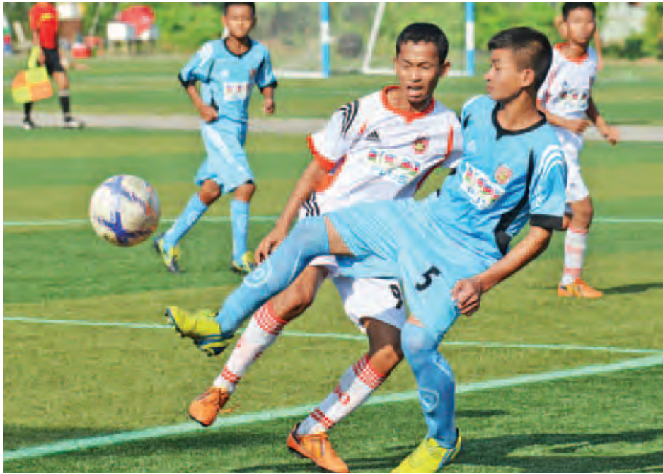
ဧရာဝတီအကယ်ဒမီအသင်းနှင့် မန္တလေးအကယ်ဒမီ(ခ) အသင်းတို့ ယှဉ်ပြိုင်ကြစဉ်။