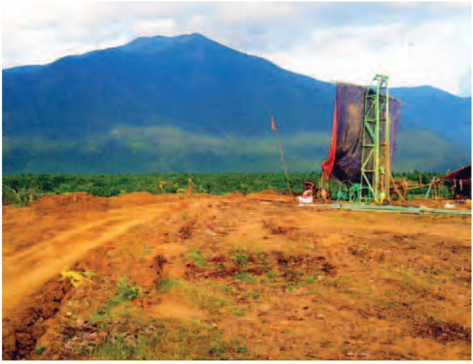
ပြောင်းရွှေ့နေရာချပေးထားသည့် နတ်ချောင်းရွာအနီး ဝေဘူလတောင်ခြေရှိ နတ်နန်းရွာသစ်တွင် နိုင်ငံတော်အစိုးရမှ အတိစီတိုင်းတူးပေးနေစဉ်။

ထိုနေရာမှ အရှေ့သို့တက်သွားသောအခါ သစ်တုံးအမှိုက် သရိုက်ဒိုက်များထူထဲစွာ တင်နေသည့် အိမ်ဝင်းများကို တွေ့ရသည်။ အချို့မှာ အိမ်ကိုဖျက်ပြောင်းနေကြဆဲဖြစ်