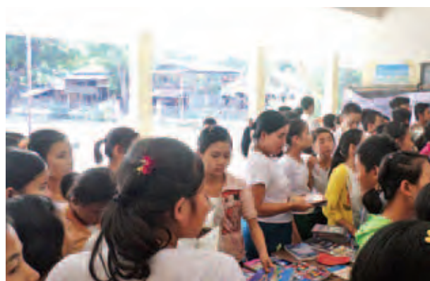
ဓာတ်ပုံမှတ်တမ်းများအား စိတ်ဝင်စား ပြည်သူများအား ပြင်ပ စာပေဗဟုစွာ လေ့လာကြည့်ရှုခဲ့ကြသည်။ အဆိုပါ ဟောပြောပွဲနှင့် နယ်လှည့်စာကြည့်တိုက် ဆောင်ရွက်ပေးခြင်းဖြင့် ကျောင်းနေအရွယ် ကလေးများနှင့်