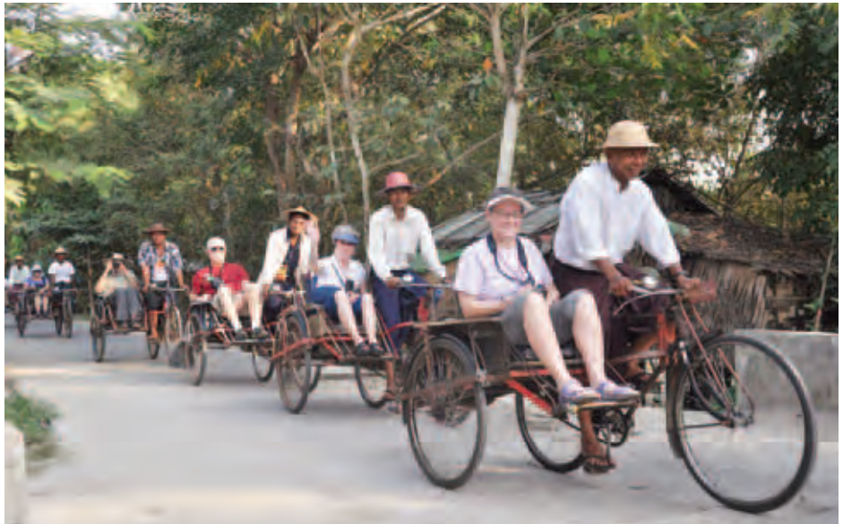
ဒလမြို့နယ်အတွင်း ကမ္ဘာလှည့်ခရီးသည်များ အဖွဲ့လိုက် လည်ပတ်လေ့လာနေသည်ကို ဒီဇင်ဘာ ၂၆ ရက်က တွေ့ရစဉ်။

တိပိဋကဓရ ရွေးချယ်ရေး စာမေးပွဲကြီး စတင် ကျင်းပခဲ့သည်မှစ၍ ၁၉၉၈ ခုနှစ်အထိ နှစ်ပေါင်း ၅၀ ကာလအတွင်း ပိဋကသုံးပုံကို အာဂုံဆောင်နိုင်ပြီး ပါဠိ တော်အပြင် အဋ္ဌကထာ ဋီကာနှင့်တကွ ခဲရာခဲဆစ် သဘောရေးဖြေကိုပါ အောင်မြင်တော်မူသည့် တိပိဋက ကောဝိဒအောင် သာသနာ့အာဇာနည် အရှင်မြတ် ရှစ်ပါး ပေါ်ထွန်းခဲ့ပြီး တိပိဋကကောဝိဒ အောင်မြင်ပြီး၍ အနည်းဆုံးကာလ ငါးနှစ်သက်တမ်းပြည့်မြောက်လျှင် ဆက်ကပ်သည့် တိပိဋကဓရ ဓမ္မဘဏ္ဍာ ဂါရိက ဘွဲ့တံဆိပ် တော်ရ သာသနာ့အာဇာနည် အရှင်မြတ်တို့မှာလည်း ၂၀၁၅ ခုနှစ်အထိ ရှစ်ပါး ပေါ်ထွန်းခဲ့ပြီးဖြစ်ကြောင်း သိရသည်။ (သတင်းစဉ်)