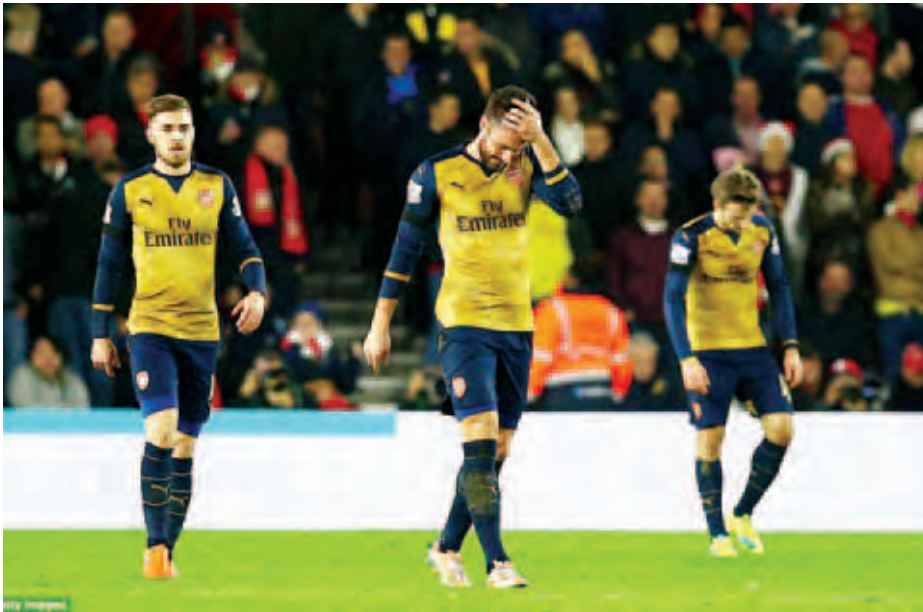
ကြောင့် အမှတ်ပေးဇယားကို ဦးဆောင်နိုင်ခွင့်နှင့် လွဲခဲ့ရ သည်။ ထို့ကြောင့် ပွဲစဉ်(၁၈)အပြီးတွင် လက်စတာစီးတီး အသင်းသည် ရမှတ် (၃၈) မှတ်ဖြင့် အမှတ်ပေးဇယားကို

အဆိုပါပွဲစဉ်တွင် ဆောက်သမ်တန်အသင်းအတွက် သွင်းဂိုးများကို မာတီနာကတစ်ဂိုး၊ ရှိန်းလောင်းက နှစ်ဂိုး နှင့် ဖွန်တီက တစ်ဂိုးသွင်းယူပေးခဲ့ခြင်းဖြစ်သည်။ ပွဲစဉ် (၁၈)အဖြစ် တစ်ရက်တည်းကစားခဲ့သည့် လက်စတာ စီးတီးအသင်းသည် လီဗာပူးအသင်းကို တစ်ဂိုး-ဂိုးမရှိဖြင့် ရှုံးနိမ့်ခဲ့ပြီး ယင်းရှုံးနိမ့်မှုကို အခွင့်ကောင်းယူကာ အာဆင်နယ်အသင်း အမှတ်ပေးဇယားကို ဦးဆောင်နိုင် မည်ဖြစ်သော်လည်း အာဆင်နယ်အသင်းသည် ဆောက်သမ်တန်အသင်းကို လေးဂိုးပြတ်ရှုံးပွဲကြုံခဲ့ခြင်း