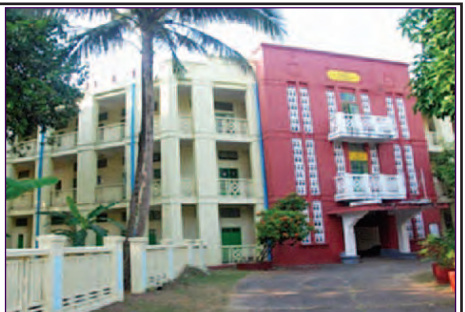
ကျောင်းဆောင်ကြီးများ ပြုပြင်ပြီးစီးနေမှုကို တွေ့ရစဉ်။

ပြည်ထောင်စုသမ္မတ မြန်မာနိုင်ငံတော်အစိုးရ လက်ထက်၌ မွမ်းမံပြင်ဆင်မှုများ နိုင်ငံတော်သမ္မတ ဦးသိန်းစိန်၏ လမ်းညွှန်မှုဖြင့် သာသနာရေးဝန်ကြီးဌာနက အောက်ပါလုပ်ငန်းများကို ပြုပြင်မွမ်းမံဆောင်ရွက်ခဲ့ပါသည်-