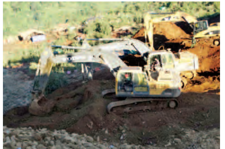
ပူးပေါင်းပြီး ကျောက်စိမ်းတူးဖော်ရေးကုမ္ပဏီ ရေးလုပ်ငန်းများ ဆက်လက်ဆောင်ရွက်လျက် ရှိကြောင်း သိရသည်။ (မြဝတီ)

အဆိုပါ မြေစာပုံများ ဖယ်ရှားရှင်းလင်း ခြင်းနှင့် ရှာဖွေခြင်းလုပ်ငန်းများကို တပ်မတော် သားများ၊ မီးသတ်တပ်ဖွဲ့ဝင်များ၊ ကြက်ခြေနီ တပ်ဖွဲ့ဝင်များနှင့် ဌာနဆိုင်ရာတာဝန်ရှိသူများ