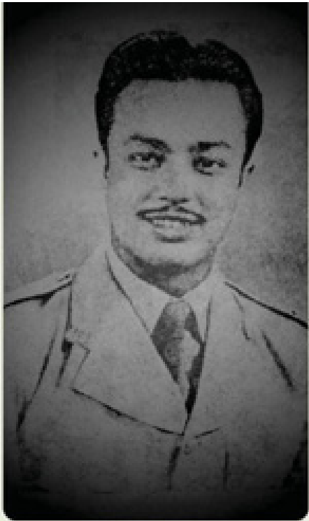
ရုပ်ရှင် မင်းသားကြီး မောင်မောင်တာ

ဒပ်ပလင်တက္ကသိုလ်မှ PHD ဂုဏ်ထူးဆောင် ဒေါက်တာဘွဲ့ကို ဆွတ်ခူးရရှိခဲ့သော နိုင်ငံကျော်ရုပ်ရှင်မင်းသားကြီး ဒေါက်တာ ဒေါက်တာမောင်မောင်တာ၏ ဖခင်ဘက်မှ အဘိုး ခန့်ဆွာဟိပ်-ခန့်ပဟာဒူရ်အာဂါအလီ အတ္တပရိရိုရာဇိမှာ မြန်မာနိုင်ငံဆိုင်ရာ ပါရှားနိုင်ငံ(အီရန်)ကောင်စစ်ဝန်(၁၉၂၀-၁၉၂၉) မြေပိုင်ရှင်၊ မီးတိုင်အုပ်၊ ကုန်သည်ကြီး၊ အစိုးရကန်ထရိုက်တာဖြစ်ပြီး မန္တလေးရွှေမြို့တော်၏ ပထမတန်းစားဂုဏ်ထူးဆောင် သမာဓိမြို့ဝန်မင်း၊ တရားသူကြီးလည်းဖြစ်သည်။ သူသည် ၁၉၂၉ ခုနှစ် (၆၃)နှစ်တွင် ရန်ကုန်မြို့၌ ကင်ဆာရောဂါဖြင့် ကွယ်လွန်ခဲ့သည်။