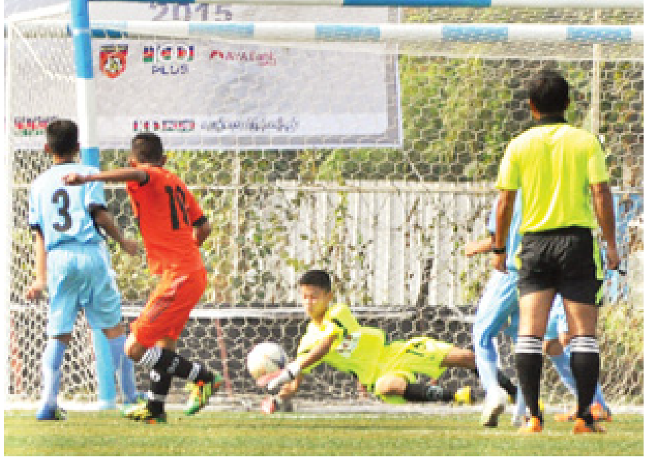
ဇွဲကပင်အကယ်ဒမီ(က)နှင့် မန္တလေးအကယ်ဒမီ(ခ)အသင်းတို့ ယှဉ်ပြိုင်နေစဉ်။

○ ကျော့ဖုံးမှ နှစ်ဂိုး-ဂိုးမရှိ၊ မန္တလေးအကယ်ဒမီ (က)အသင်းက ရတနာပုံအကယ်ဒမီ အသင်းကို ၁၀ ဂိုး-ဂိုးမရှိတို့ဖြင့် အနိုင် ရခဲ့ကြသည်။ ဒုတိယနေ့ ပွဲစဉ်များကို ဒီဇင်ဘာ ၂၇ ရက်တွင် ဆက်လက်ကျင်းပမည် ဖြစ်ပြီး နံနက် ၇ နာရီခွဲတွင် မန္တလေး အကယ်ဒမီ(ခ)အသင်းနှင့် ဧရာဝတီ က ရန်ကုန်အကယ်ဒမီအသင်းကို အကယ်ဒမီအသင်း၊ ဇွဲကပင်အကယ်ဒမီ (က)အသင်းနှင့် တပ်မတော် အကယ်ဒမီအသင်း၊ ညနေ ၃ နာရီခွဲ တွင် ဇွဲကပင်အကယ်ဒမီ(ခ)အသင်း နှင့် မန္တလေးအကယ်ဒမီ(က)အသင်း၊ ရန်ကုန်အကယ်ဒမီအသင်းနှင့် ရတနာပုံ အကယ်ဒမီအသင်းတို့ ယှဉ်ပြိုင်စာား ကြမည်ဖြစ်သည်။