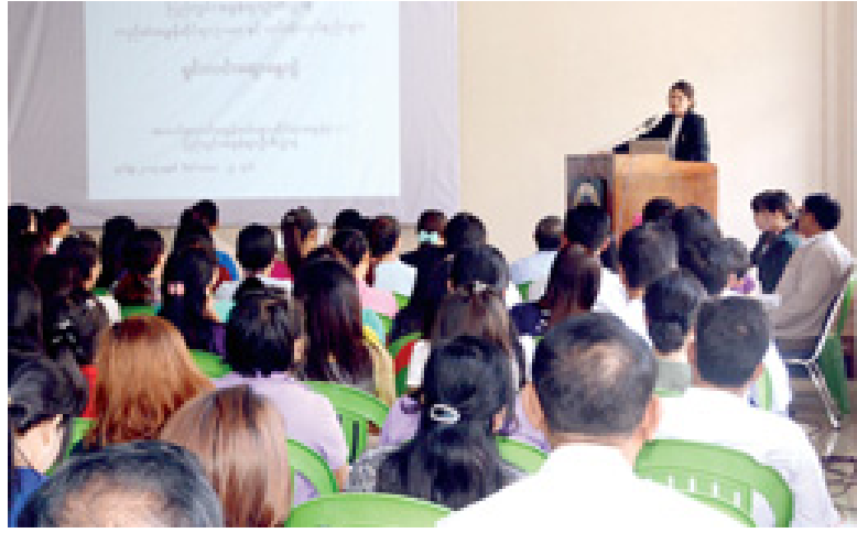
ပြည်တွင်းအခွန်ဦးစီးဌာန အလယ်အလတ်အခွန်ထမ်းများဆိုင်ရာအခွန်နံ(၁)၏ အခွန်ထမ်း ကုမ္ပဏီလုပ်ငန်းရှင်များအား တည်ဆဲအခွန်ဆိုင်ရာဥပဒေ၊ လုပ်ထုံးလုပ်နည်းများနှင့်စပ်လျဉ်း၍ အခွန်ဆိုင်ရာဆွေးနွေးပွဲကို ဒီဇင်ဘာ ၁၁၊ ၁၄၊ ၁၈၊ ၂၁ ရက်နှင့် ၂၄ ရက်တို့တွင် အလယ် အလတ်အခွန်ထမ်းများဆိုင်ရာ အခွန်နံ(၁)၏ ပထမထပ်အစည်းအဝေးခန်းမ၌ ပြုလုပ်နေစဉ်။