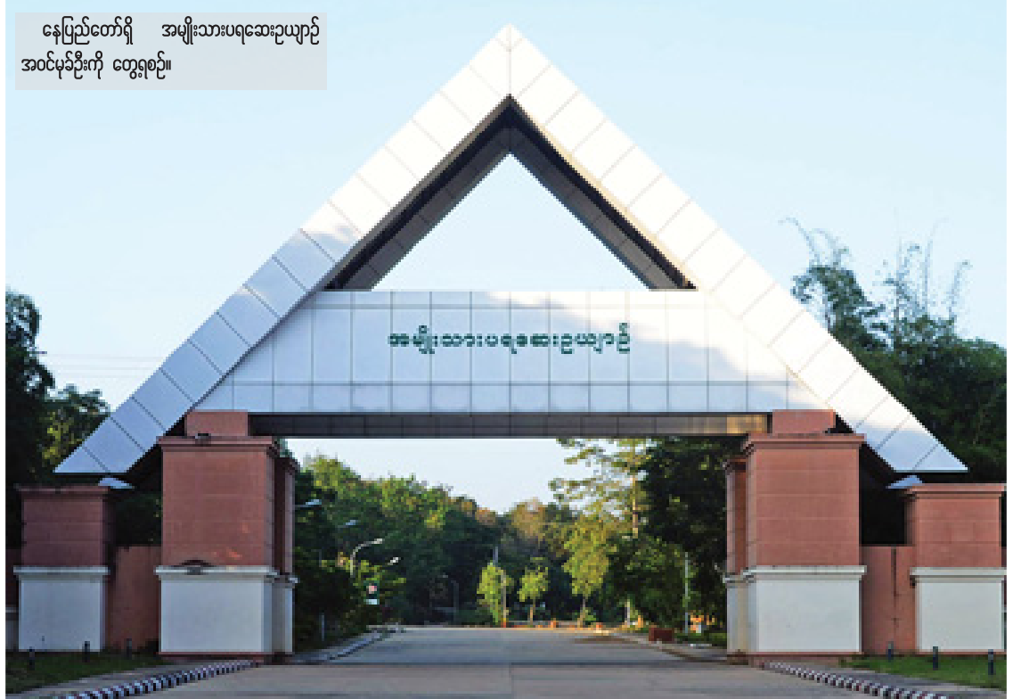
နေပြည်တော်ရှိ အမျိုးသားပရဆေးဥယျာဉ် အဝင်မုခ်ဦးကို တွေ့ရစဉ်။

ထိန်းသိမ်းစောင့်ရှောက်၍ ဖွံ့ဖြိုးတိုးတက်အောင် ကြိုးပမ်းဆောင်ရွက်ရန်၊ နဝရက်ကတိသစ္စာနှင့် ကျင့်ဝတ်သိက္ခာကို စွဲမြဲစွာနှလုံးသွင်းစောင့်ထိန်းပြီး စည်းလုံးညီညွတ်သည့် မြန်မာ့တိုင်းရင်းဆေးသမားတော်များအဖွဲ့ဖြစ်စေရေး ဝိုင်းဝန်းထိန်းသိမ်းကာကွယ်စောင့်ရှောက်ရန်၊ မြန်မာ့တိုင်းရင်းဆေးပညာကို အရည်အသွေးမီ တတ်မြောက်ကျွမ်းကျင်သည့် ပညာရှင်အဆက်ဆက်အား မွေးထုတ်ပေးနိုင်သော လေ့ကျင့်သင်ကြားရေးစနစ်ကို ခိုင်ခိုင်မာမာ တည်ဆောက်ရန်၊ မြန်မာ့တိုင်းရင်းဆေးပညာရပ်ကို ပဏာမကျန်းမာရေးစောင့်ရှောက်မှုတွင် ကဏ္ဍတစ်ခုအနေဖြင့် ဆောင်ရွက်ပြီး လူတိုင်းလက်လှမ်းမီနိုင်သည့် သာတူညီမျှ ကျန်းမာရေးလွှမ်းခြုံမှုစနစ်တွင် ပါဝင်ဖြည့်ဆည်းပေးရေးဝိုင်းဝန်းကြိုးပမ်းဆောင်ရွက်ရန်၊ အာဆီယံတိုင်းရင်းဆေးနယ်ပယ်တွင် မြန်မာ့တိုင်းရင်းဆေး၏ အခန်းကဏ္ဍအဆင့်အတန်း မီမီ၊ တက်ကြွစွာ ပါဝင်နိုင်ရေး ဝိုင်းဝန်းကြိုးပမ်း ပြင်ဆင်ဆောင်ရွက်ရန် ကိစ္စရပ်များအား တက်ရောက်လာသော ကိုယ်စားလှယ်များက ဆွေးနွေးခဲ့ကြရာ မြန်မာ့တိုင်းရင်းဆေးပညာ ဖွံ့ဖြိုးတိုးတက်ရေးအတွက် များစွာအထောက်အကူပြုနိုင်ခဲ့ပါကြောင်း၊ ယခု ၂၀၁၅ ခုနှစ်တွင်လည်း (၁၆)ကြိမ်မြောက် မြန်မာ့တိုင်းရင်းဆေးသမားတော်များညီလာခံနှင့် နီးနှောဖလှယ်ပွဲကို အောက်ပါရည်ရွယ်ချက်များဖြင့် မကြာမီကာလ ဒီဇင်ဘာ ၂၉ ရက်နှင့် ၃၀ ရက်တို့တွင် နေပြည်တော်၌ ကျင်းပတော့မည် ဖြစ်ပါကြောင်း၊ အဆိုပါ (၁၆)ကြိမ်မြောက် မြန်မာ့တိုင်းရင်းဆေးသမားတော်များ ညီလာခံ၏ ရည်ရွယ်ချက်များအဖြစ်-