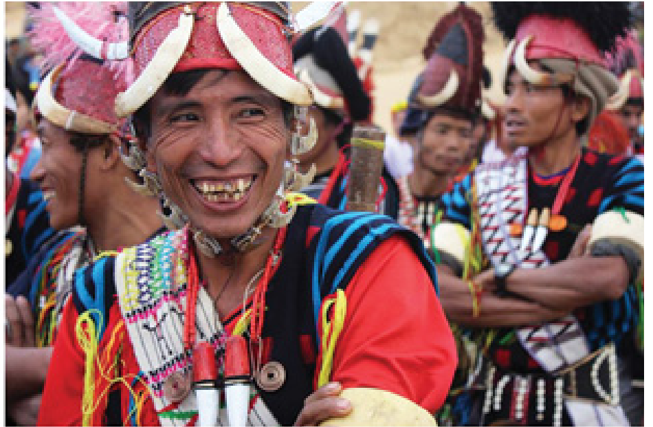
ယနေ့ခေတ် နာဂတို့၏ ဝတ်စားဆင်ယင်ပုံ။