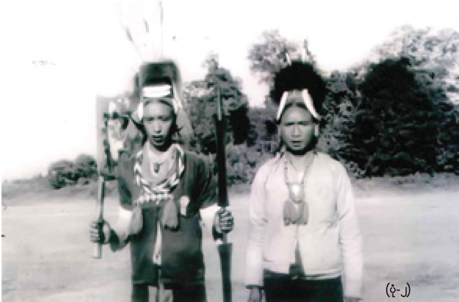
၁၉၆၈ ခုနှစ်ဝန်းကျင်က လဟယ်နာဂတို့၏ ဝတ်စားဆင်ယင်ပုံ။