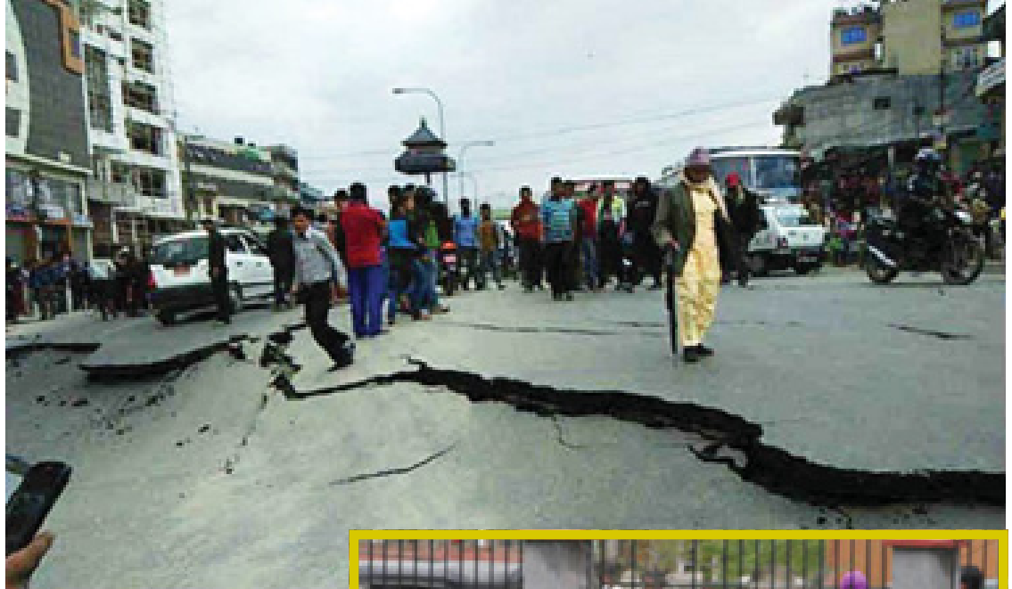
ပါကစ္စတန်နိုင်ငံ အစ္စလာမာဘတ် မြို့တွင် ငလျင်လှုပ်ခတ်ခဲ့ပြီးနောက် ဖျက်စီး နေသည့်လမ်းကို တွေ့ရစဉ်။ (အပေါ်ပုံ) ငလျင်လှုပ်ခတ်မှုကြောင့် ဝမ်းနည်း ပူဆွေးနေသည့် ဒေသခံများကို တွေ့ရစဉ်။ (ယာဝုံ)

ငလျင်လှုပ်ခတ်မှုကြောင့် ကာကာကိုရစ် အဝေးပြေးလမ်းမပေါ်တွင် မြေပြိုမှုများ ဖြစ်ပွားကာ ဖော်တော်ယာဉ်များ လမ်းပေါ်တွင် သောင်တင်လျက်ရှိကြောင်း အဝေးပြေးလမ်း အာဏာပိုင်များကဆိုသည်။