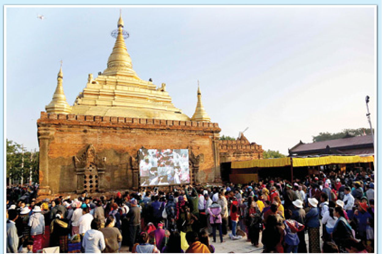
ဒီဇင်ဘာ ၂၆ ရက် (နတ်တော်လပြည့်နေ့)က ပုဂံယဉ်ကျေးမှုနယ်မြေရှိ အလိုတော်ပြည့်ဘုရား ပုဒ္ဂုဗ္ဗနိယပွဲတော်တွင် ဘုရားဖူးများဖြင့် စည်ကားလှုပ်ရှားသည့်ကို တွေ့ရစဉ်။ သတင်းစာမျက်နှာ >> ၃