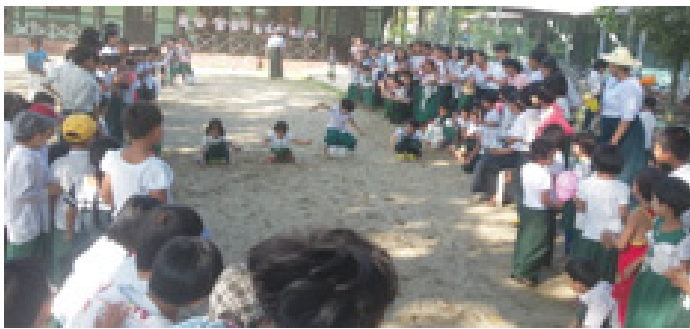
ညောင်တုန်းမြို့ကျောင်းများတွင် အားကစားပြိုင်ပွဲများကျင်းပ