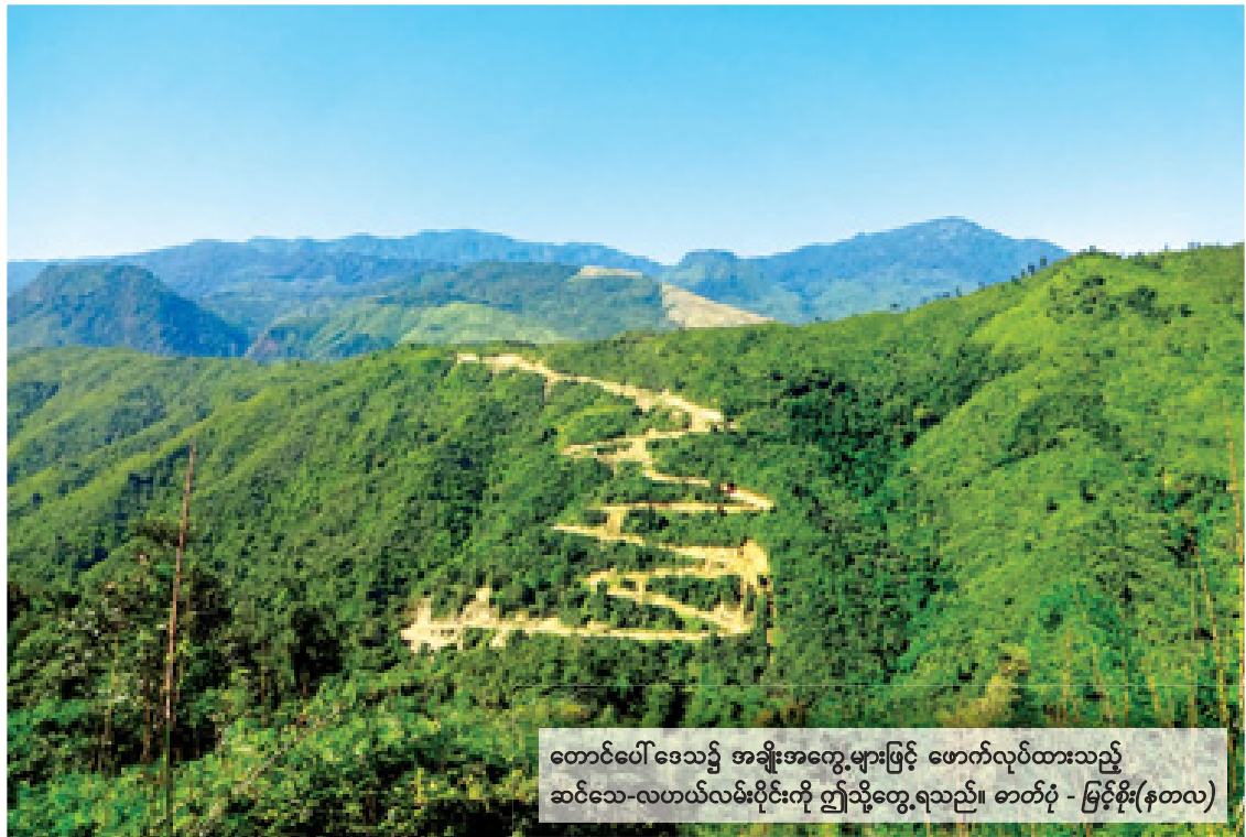
တောင်ပေါ်ဒေသ၌ အချိုးအတွေ့များဖြင့် ဖောက်လုပ်ထားသည့် ဆင်သေ-လဟယ်လမ်းပိုင်းကို ဤသို့တွေ့ရသည်။

လမ်းပန်းဆက်သွယ်ရေး လမ်းတွေတော့ ကိုလိုနီခေတ်က ဖောက်ခဲ့တဲ့ ကားလမ်းနဲ့ နာဂများသုံးတဲ့ ရွာချင်းဆက်တဲ့ လူသွားလမ်းတွေသာရှိပါ တယ်။ တော်လှန်ရေးအစိုးရတက်ခါစမှာ ခန္တီးတစ်ဖက်ကမ်းက ဆင်သေရွာမှ လဟယ်၊ ထမံသီရွာမှ လေရှိုးကို ကားလမ်းစဖောက် ပေမယ့် လဟယ်လည်းမရောက်။ လေရှိုး လည်း မရောက်တဲ့ မည်ကမဟုတ် မြေသားလမ်း တစ်ဝက်တစ်ပျက်နဲ့ ရပ်ဆိုင်းသွားပါတယ်။ ကျွန်တော်ရှိတဲ့ ကာလတစ်လျှောက်လုံး ကား လမ်းတွေ ဆက်မဖောက်ကြပါဘူး။ ဆင်သေ-လဟယ် ကားလမ်းက ခုနစ် ရက်ခနီးပါ။ ဆရာမြင့်စိုးက ကားနဲ့ နေ့ချင်း ပြန် လဟယ်သွားပြီး ရုံးကိစ္စဆောင်ရွက်ခဲ့ ကြောင်း ဖတ်ရတော့ ထမံသီ-လေရှိုး ကား လမ်းလည်း လဟယ်ကားလမ်းလိုပဲ ကောင်း လိမ့်မယ်။ မြို့နယ်တွင်းမှာလည်း ကားလမ်းတွေ ရှိလိမ့်မယ်လို့ တွေးပြီးဝမ်းသာမိပါတယ်။ ဘာသာရေး လဟယ်မြောက်ပိုင်း ဒုံဟီးရွာမှာ ကျွန်တော်တို့တပ်စခန်းရှိပြီး ရွာရဲ့တောင်ဘက် တစ်ရက်ခနီးမှာ ရန်စီနာဂရွာကြီးရှိပါတယ်။ ရွာအပြင်ဘက်က တောင်စွယ်လေးမှာ သာသနာလာပြုတဲ့ ဆရာတော်တစ်ပါး တည် ခဲ့တဲ့ စေတီငယ်တစ်ဆူရှိပါတယ်။ ဆရာတော် ဖျားနာပြီး ပျံလွန်တော်မူပြီးနောက် သာသနာပြု ဆရာတော် အစားထိုးမရောက်လာတော့ဘူး တဲ့။ ရန်စီရွာက နတ်ကိုးကွယ်ဆဲပါပဲ။ ကျွန်တော်လည်း ပွင့်လင်းရာသီ ဒုံဟီး စခန်းကို လားဝန်တင်များနဲ့ ရိက္ခာစုပုံ တဲ့အခါမှာ မဖောက်ထိုးပေးပို့ပေးပါတယ်။ ရဲဘော်များက စေတီကို ထိုးသတ်နန်းကပ်ကြ ပါတယ်။ နောက်ပိုင်းမှာ ရန်စီရွာထဲက နာဂအိမ်တစ်အိမ်ရဲ့ ဝက်ခြံထဲမှာတွေ့တဲ့ ရှေးဟောင်းယွန်းဆင်းတုတော်တစ်ဆူကို ပို့လာလို့ ကျွန်တော်ကိုးကွယ်ထားပါတယ်။ ပျံလွန်တော်မူတဲ့ ဆရာတော်ကိုးကွယ်တဲ့ ဘုရားဖြစ်ပါလိမ့်မယ်။ ဆင်းတုတော်က “ဘူမိ ဖဿမုဒြာ”ဖြစ်ပြီး