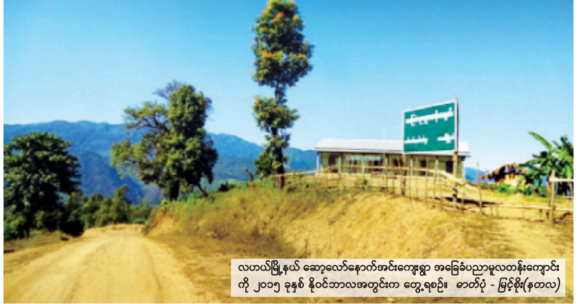
လဟယ်မြို့နယ် ဆော့လော်နောက်အင်းကျေးရွာ အခြေခံပညာမူလတန်းကျောင်းကို ၂၀၁၅ ခုနှစ် နိုဝင်ဘာလအတွင်းက တွေ့ရစဉ်။

ဆရာမေတီတောင်ရဲ့ ဒေသအမည် ဆရာမေတီအမည်ဟာ ဒေသအမည် မဟုတ်ပါဘူး။ အိန္ဒိယဘက်ကခေါ်တဲ့ အမည်ပါ။ ချင်းတွင်းမြစ်ဝှမ်းက ရှမ်းများက “နွယ်ဖောက်တောင်”လို့ ခေါ်ကြပါတယ်။ စစ်သုံး မြေပုံတွေမှာ နာမည်နှစ်မျိုးလုံး ရေးထားပါတယ်။ အင်္ဂလိပ်ကိုလိုနီခေတ်ကတည်းက ပထဝီဖတ်စာအုပ်တွေမှာ “ဆရာမေတီတောင်”လို့သာ ရေးခဲ့ကြတယ်။ ၂၀၀၀ ခုနှစ်က ထုတ်ဝေတဲ့ “ပြည်နယ်နှင့်တိုင်း မြေပုံများ” စာအုပ်မှာလည်း “စာရာမေတီ ၁၂၅၇၃”လို့