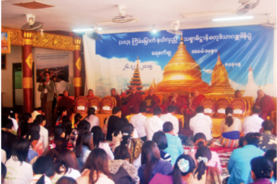
ကြီးကို အခမဲ့ကျွေးမွေးတာကို ပထမဆုံးမြင်ဖူးခြင်းပါ။ ကျွန်မတို့နိုင်ငံမှာ ဒီလိုမရှိပါဘူး။ စားနေတဲ့သူတွေနဲ့ လှူဒါန်းသူတွေရဲ့ အပြုံးမျက်နှာတွေကိုမြင်ရတော့ ကျွန်မ တို့ပါ ဝမ်းသာတယ်။ ကျွန်မတို့ နိုင်ငံကို ပြန်ရောက်ရင် မြန်မာနိုင်ငံမှာ ဒီလိုအဖြစ်အပျက်မျိုးရှိတယ်ဆိုတဲ့ အတွေ့ အကြုံကို ပြန်လည်မျှဝေသွားမှာပါ”ဟု ပြောသည်။