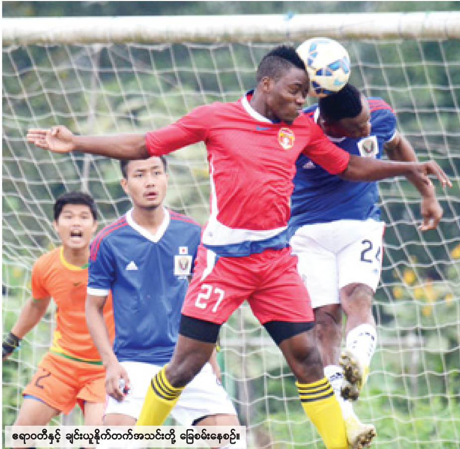
ဧရာဝတီနှင့် ချင်းယူနိုက်တက်အသင်းတို့ ခြေစမ်းနေစဉ်။