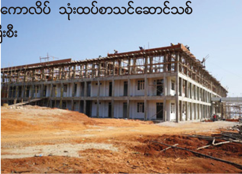
လားရှိုးပညာရေးကောလိပ် သုံးထပ်စာသင်ဆောင်သစ်၏ လုပ်ငန်းခွင်တစ်နေရာကိုတွေ့ရစဉ်။

လားရှိုး ဒီဇင်ဘာ ၂၆ ရှမ်းပြည်နယ် (မြောက်ပိုင်း)၏ ပထမဆုံးသော ပညာရေးကောလိပ်ဖြစ်ပြီး ၂၀၁၃ ခုနှစ် ဒီဇင်ဘာလတွင် သင်တန်းသား သင်တန်းသူ ၂၀၀ ဖြင့် စတင်ဖွင့်လှစ်ခဲ့သည့် လားရှိုးပညာရေးကောလိပ်တွင် သင်တန်းသား သင်တန်းသူများအတွက် လိုအပ်ချက်ဖြစ်သော ပေ ၄၃၀x ၃၆ ပေ (၃)ထပ် (RC) စာသင်ဆောင်သစ်ကို ဆောက်လုပ်လျက်ရှိရာ ၇၀ ရာခိုင်နှုန်း ပြီးစီးနေပြီဖြစ်ကြောင်း သိရသည်။ အဆိုပါ ကျောင်းဆောင်သစ်ကို ပညာရေးဝန်ကြီးဌာန၏ ခွင့်ပြုငွေကျပ် သိန်း ၁၀၅၀၀ ဖြင့် ယခုနှစ် ဩဂုတ်လအတွင်းက စတင်တည်ဆောက်ခဲ့ခြင်းဖြစ်ပြီး ၂၀၁၅-၂၀၁၆ ဘဏ္ဍာရေးနှစ်တွင် အပြီးဆောင်ရွက်မည် ဖြစ်ကြောင်းသိရသည်။