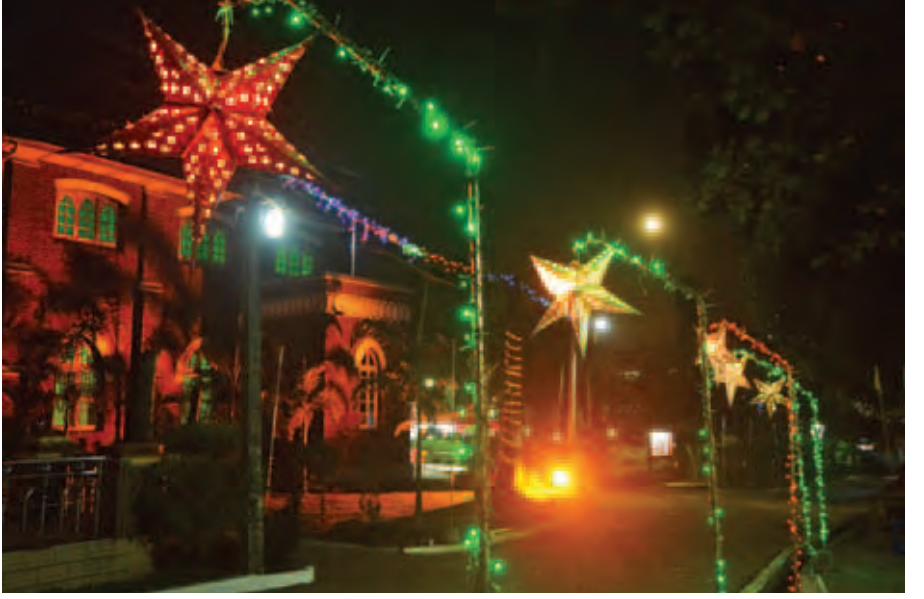
တာမွေမြို့နယ် ကျိုက္ကဆံလမ်းရှိ စိန်ပရန့်စစ်အစီစီဘုရားရှိခိုးကျောင်း၌ ခရစ္စမတ်နေ့ညက ရောင်စုံမီးများ ထွန်းညှိထားသည်ကို တွေ့ရစဉ်။