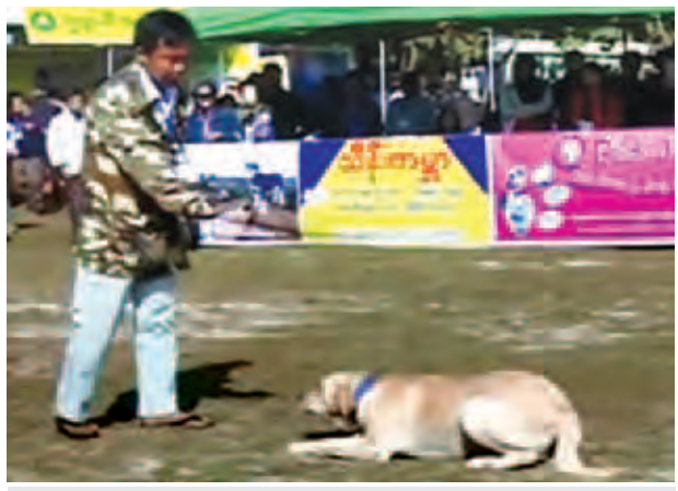
အိမ်မွေးခွေးတစ်ကောင် ပြင်ပွဲဝင်နေစဉ်။

အလှမွေးမွေးပြင်ပွဲတွင် ဝင်ရောက်ယှဉ်ပြိုင်ရန်အတွက် လေ့ကျင့်ပြင် ဆင်ထားပုံနဲ့ ပတ်သက်ပြီး အိမ်မွေးခွေးပိုင်ရှင်တစ်ဦးက ကျွန်တော့်အနေနဲ့ ဝါသနာအရ မွေးမြူတာပါ။ စီးပွားဖြစ်တော့မဟုတ်ပါဘူး။ ဒါပေမယ့် သူတို့ကို ကောင်းကောင်းထားမယ်၊ ကောင်းကောင်းကျွေးမယ်။ ဒီပြင်ပွဲမှာပဲ ပထမ ဦးဆုံးအကြိမ် ဝင်ပြိုင်ဖူးပါတယ်။ အိမ်မှာတော့ မွေးမြူထားတဲ့ ခွေးငါးကောင် ရှိပါတယ်။ အဲဒီထဲမှာ အလှဆုံးလို့ ယူဆရတဲ့ခွေးကို ဝင်ရောက်ယှဉ်ပြိုင် တာဖြစ်ပါတယ်။ ဒီခွေးက အလှသက်သက်ပဲ။ မျိုးရိုးကောင်းတဲ့အတွက် ခန္ဓာကိုယ်အချိုးအစားလှပမှုနဲ့ ဝင်ရောက်ယှဉ်ပြိုင်ခြင်းဖြစ်ပါတယ်” ဟု တင်မောင်လွင်(မြန်မာ့အလင်း)