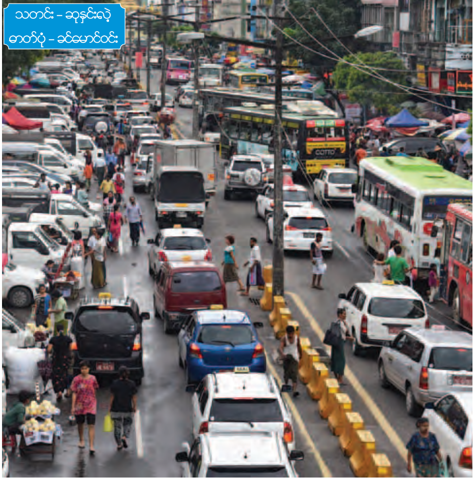
သတင်း - ဆုန်းလှ ဓာတ်ပုံ - သင်မောင်ဝင်း