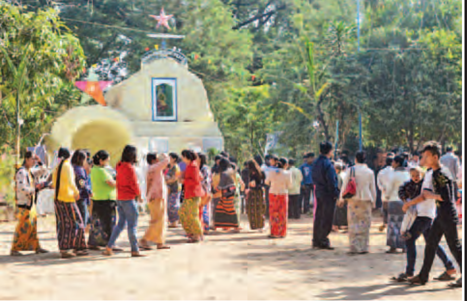
နေပြည်တော် ပျဉ်းမနား မြို့မနစ်ခြင်းအသင်းတော် မေခန်းမ၌ကျင်းပသော ခရစ္စမတ်နေ့ အခမ်းအနားသို့ တက်ရောက်လာသူများအား တွေ့ရစဉ်။ (သတင်းစဉ်)