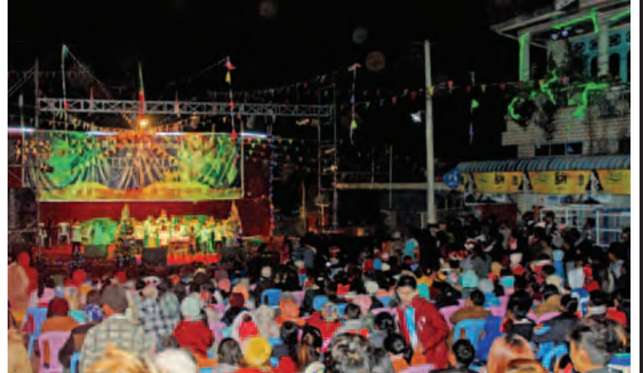
လာရှိုးမြို့ ရပ်ကွက်(၁)ရှိ ပင်မ'ဝ' နှစ်ခြင်းခရစ်ယာန်အသင်းတော်၌ ၂၀၁၅ ခုနှစ် ခရစ္စမတ်ပွဲတော်ကို စည်ကားသိုက်မြိုက်စွာ ကျင်းပစဉ်။