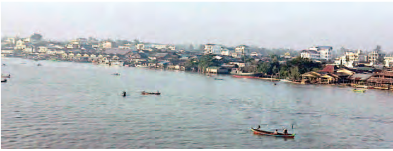
ဖျာပုံမြို့၏ နံနက်ခင်း မြင်ကွင်းအလှကို တွေ့ရစဉ်။

ဖျာပုံခရိုင် ဖျာပုံမြို့နယ်သည် မြန်မာနိုင်ငံတောင်ပိုင်း မြစ်ဝကျွန်းပေါ်ဒေသတောင်ဘက်အကျဆုံးနေရာတွင် တည်ရှိပြီး အရှေ့လောင်ဂျီတွဒ် ၉၀ ဒီဂရီ ၃၀ မိနစ်မှ ၉၅ ဒီဂရီ ၄၅ မိနစ်အတွင်းနှင့် မြောက်လတ္တီတွဒ် ၁၅ ဒီဂရီ ၃၀ မိနစ်မှ ၁၆ ဒီဂရီ ၂၅ မိနစ်အတွင်းတည်ရှိကာ ဧရာဝတီတိုင်းဒေသကြီး ဖျာပုံခရိုင်၌ပါဝင်ပြီး အရှေ့ဘက်တွင် ဖျာပုံမြစ်ခြားလျက် ဒေးဒရိုမြို့နယ်၊ အနောက်ဘက်တွင် ဘိုကလေးမြို့နယ်၊ တောင်ဘက်တွင် မုတ္တမပင်လယ်ကွေ့နှင့် မြောက်ဘက်တွင် ကျိုတာမြစ်ခြားလျက် ကျိုက်လတ်မြို့နယ်၊ ဘိုကလေးမြို့နယ်များနှင့် ဆက်စပ်လျက်ရှိသည်။ ဧရိယာစတုရန်းမိုင် ၂၆၇ ဒဿ ၇၀၊ ဧကအားဖြင့် ၁၇၁၃၃၀၊ အရှေ့နှင့်အနောက် ၁၃ ဒဿ ၀၆၈ မိုင်၊ တောင်နှင့်မြောက် ၂၈ ဒဿ ၉၇၇ မိုင်ခန့်ရှိကြောင်း ၂၀၁၂ ခုနှစ်ထုတ်