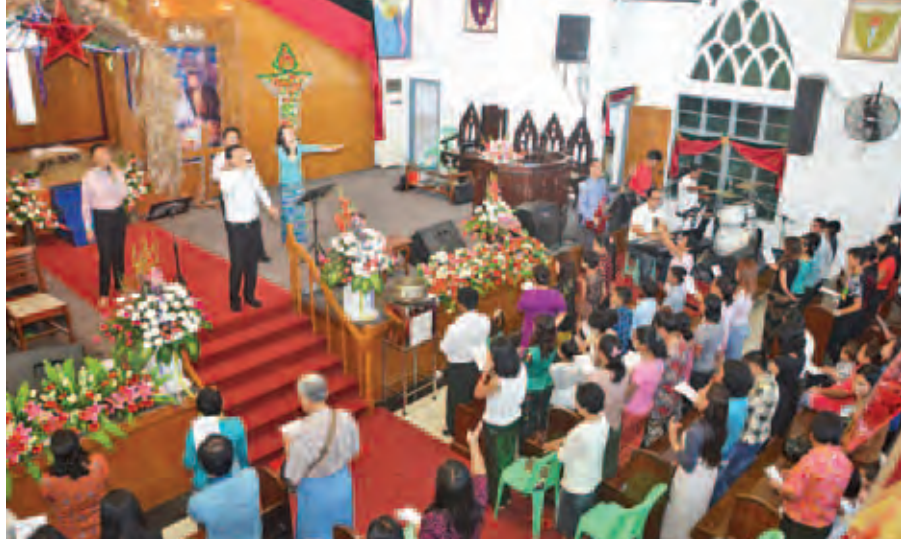
ခရစ္စမတ်နေ့အထိမ်းအမှတ် ကျောက်တံတားမြို့နယ် ဧမာနွေလဘုရားရှိခိုးကျောင်း၌ ဓမ္မတေးသီချင်း သီဆိုကြစဉ်။