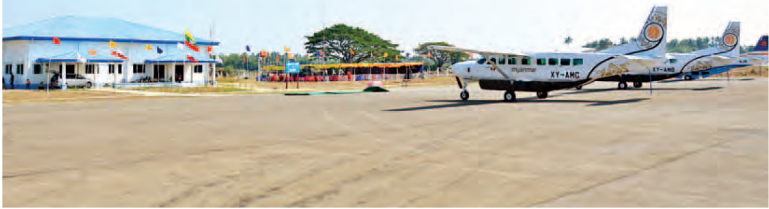
ရခိုင်ပြည်နယ် မာန်အောင်(စပုံတဲ) လေယာဉ်ကွင်းနှင့် မြန်မာအမျိုးသားလေကြောင်းမှ လေယာဉ်များကို တွေ့ရစဉ်။