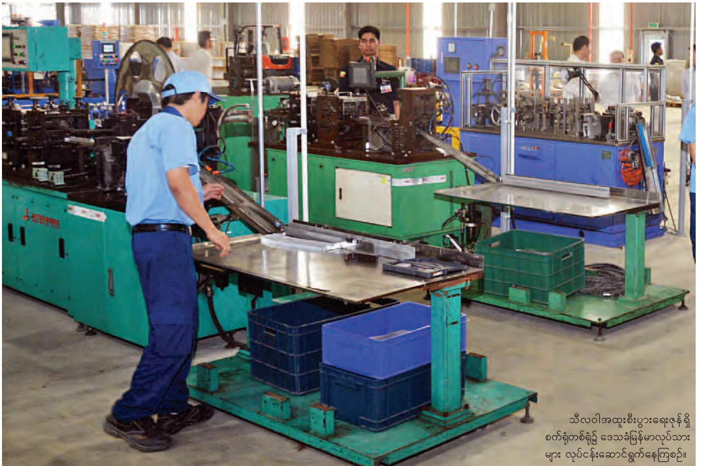
သီလဝါအထူးစီးပွားရေးဇုန်ရှိ စက်ရုံတစ်ရုံ၌ ဒေသခံမြန်မာလုပ်သားများ လုပ်ငန်းဆောင်ရွက်နေကြစဉ်။