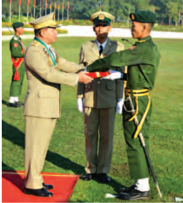
တပ်မတော်ကာကွယ်ရေးဦးစီးချုပ် ဗိုလ်ချုပ်မှူးကြီးမင်းအောင်လှိုင် လေ့ကျင့်ရေးထူးချွန်ဆုရရှိသူ သင်တန်းသား နှင်းကိုအား ဆုချီးမြှင့်စဉ်။