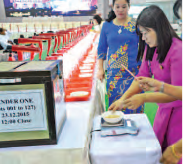
ပုလဲအတွဲပေါင်း ၁၁၅ တွဲကို ရောင်းချခဲ့ရပြီး စုစုပေါင်း ပုလဲအတွဲ ၂၂၄ တွဲရောင်းချခဲ့ကြောင်း သိရ တွင် အတွဲပေါင်း ၁၀၉ တွဲကို

ပုလဲရောင်းချပွဲတွင် အတွဲပေါင်း ၃၇၆ တွဲကို တင်ဒါစနစ်ဖြင့် ရောင်းချ သွားမည်ဖြစ်ရာ တင်ဒါတင်သွင်းသူ များ၊ ပုလဲအတွဲများကြည့်ရှုသူများဖြင့် စည်ကားလျက်ရှိသည်။ ယနေ့တွင် ပုလဲအတွဲ (၁)မှ (၁၂၇) ကို မွန်းတည့် ၁၂ နာရီတွင် တစ်ကြိမ်၊ ပုလဲအတွဲ (၁၂၈) မှ (၂၅၃) ကို ညနေ ၄ နာရီ တွင် တစ်ကြိမ် အိတ်ဖွင့်တင်ဒါစနစ်ဖြင့် ရောင်းချခဲ့သည်။ ပုလဲအတွဲ (၁)မှ (၁၂၇)ထိတွင်