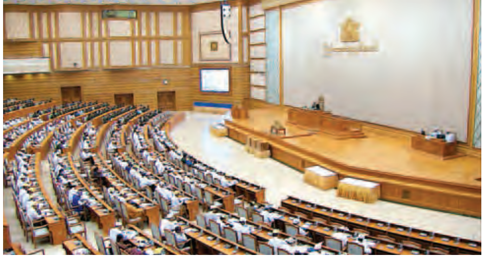
ပထမအကြိမ် ပြည်ထောင်စုလွှတ်တော် (၁၃)ကြိမ်မြောက် ပုံမှန်အစည်းအဝေး ၁၉ ရက်မြောက်နေ့ ကျင်းပစဉ်။