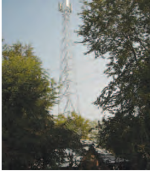
နေကြကာ ဆဲလ်ဖုန်းတာဝါတိုင်များကိုလူနေရပ်ကွက်များထဲမှ သက်ဆိုင်ရာကအမြန်ဆုံးဖယ်ရှား ရှင်းလင်းပေးရန် ဒေသခံများလိုလားနေကြသည်။

ယခုအခါ သာစည်မြို့ပေါ်ရှိ ရပ်ကွက်ကြီးများအတွင်း လူနေအိမ်ပိုင်းများထဲတွင် ဆဲလ်ဖုန်းတာဝါတိုင်များကို ကုမ္ပဏီကြီးများက ရပ်ကွက်လူထုသို့ ထင်သာမြင်သာ ချပြဆွေးနွေးခြင်း မရှိဘဲ ၎င်းတို့၏ဆန္ဒဖြင့် မြေပိုင်းပိုင်ရှင်များနှင့် ညှိနှိုင်းပြီး မြေထွက်များ ငှားရမ်းခအဖြစ် တစ်လကို ကျပ်နှစ်သိန်းမှ သုံးသိန်းအထိပေးပြီး သုံးနှစ်စာ စာချုပ်-ချုပ်ဆိုငှားရမ်း၍ တည်ဆောက်နေကြသဖြင့် ဒေသခံရပ်ကွက်လူထုတို့မှာ ကျန်းမာရေးရှုထောင့်မှ စဉ်းစားပြီး စိတ်ဓာတ်များကျဆင်းနေကြကာ ဆဲလ်ဖုန်းတာဝါတိုင်များကိုလူနေရပ်ကွက်များထဲမှ သက်ဆိုင်ရာကအမြန်ဆုံးဖယ်ရှား ရှင်းလင်းပေးရန် ဒေသခံများလိုလားနေကြသည်။