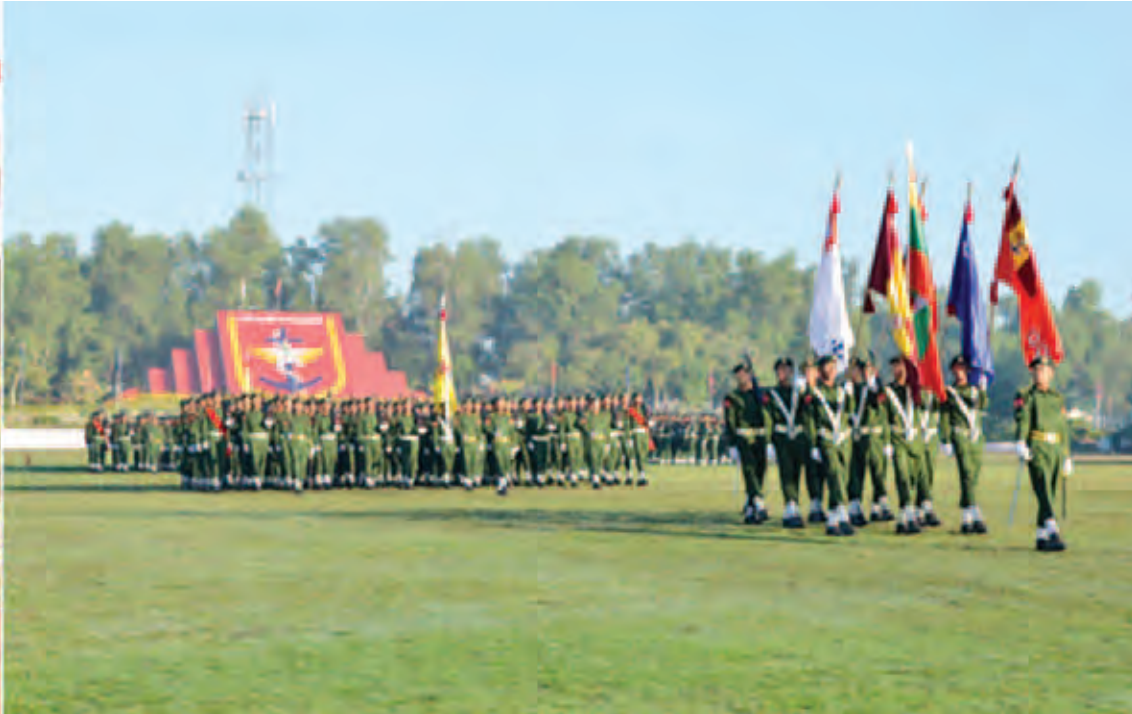
တပ်မတော်ကာကွယ်ရေး ဦးစီးချုပ် ဗိုလ်ချုပ်မှူးကြီးမင်းအောင်လှိုင် တပ်မတော်သူနာပြုနှင့် ဆေးဘက်ပညာတက္ကသိုလ် သူနာပြုနှင့် ဆေးဘက်ပညာသိပ္ပံဘွဲ့ သင်တန်းအမှတ်စဉ်(၁၃) သင်တန်းဆင်း ဂုဏ်ပြုစစ်ရေးပြအခမ်းအနားတွင် သင်တန်းတပ်ခွဲများ၏ အလေးပြုခြင်းကို ခံယူစဉ်။ (မြဝတီ)

နေပြည်တော် ဒီဇင်ဘာ ၂၃ တပ်မတော်သားများနှင့် မိသားစု ဝင်များအတွက် ရောဂါပြုစုကုသရေး၊ ရောဂါရှာဖွေရေး၊ ရောဂါတားဆီး တာကွယ်နှိမ်နင်းရေး၊ ကျန်းမာရေး ဖြင့်တင်မှုနှင့် လူနာများ ပြန်လည် ထူထောင်ရေးလုပ်ငန်းစဉ်များတွင် စံပြုထိုက်သည့်သူနာပြုများ၊ ဆေးဘက် ပညာသည်များဖြစ်စေရန်၊ တစ်မျိုး သားလုံးကျန်းမာကြံ့ခိုင်ရေးအတွက် လည်း အထောက်အကူပြုနိုင်သူများ ဖြစ်စေရန်နှင့် အမျိုးသား ကျန်းမာရေးစောင့်ရှောက်မှု လုပ်ငန်း များတွင် လူပုဂ္ဂိုလ်တစ်ဦးချင်း၊ မိသားစု တစ်စုချင်းမှသည် ဒေသအလိုက် တိုင်းရင်းသားပြည်သူများ၏ ကျန်းမာ ရေးအသိပညာပေး လုပ်ငန်းများကို လည်း ကျယ်ကျယ်ပြန့်ပြန့်ဆောင်ရွက် ကြရန်လိုကြောင်း တပ်မတော်ကာကွယ် ရေးဦးစီးချုပ် ဗိုလ်ချုပ်မှူးကြီး သရေစည် သူမင်းအောင် လှိုင် က ယနေ့နံနက် ၇ နာရီခွဲတွင် ရန်ကုန်မြို့ စာမျက်နှာ ၅ ကော်လံ ၁ သို့