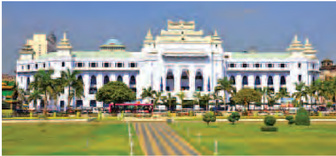
ရန်ကုန်မြို့တော်ခန်းမအား ခွဲညားထည်ဝါစွာ တွေ့ရစဉ်။

“ကျွန်တော်အိမ် ပြန်ပြင်ဆောက်ဖို့အတွက် မြေပုံကူးဖို့ စည်ပင်ကိုလျှောက်တယ်။ အပြင်မှာပြောနေကြတာက နှစ်လတိကြာမယ်။ အမြန်လိုချင်ရင် ပိုက်ဆံပေးရတယ်တဲ့။ ကျွန်တော်ကလည်း အင်တာနက်သုံးတတ်နေတော့ စည်ပင်ရဲ့ဝက်ဘ်ဆိုက်ကိုဝင်ကြည့်ပြီး အွန်လိုင်းကနေ အချက်အလက်တွေဖြည့်ပြီး