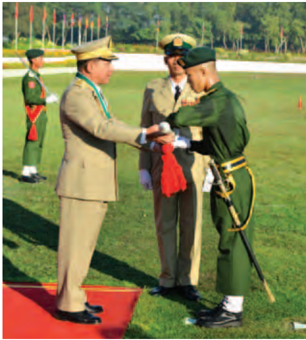
တပ်မတော်ကာကွယ်ရေးဦးစီးချုပ် ဗိုလ်ချုပ်မှူးကြီးမင်းအောင်လှိုင် အကောင်းဆုံးသင်တန်းသားဆုရရှိသူ သင်တန်းသား ခန့်ထက်ကျော်အား ဆုချီးမြှင့်စဉ်။ (မြဝတီ)