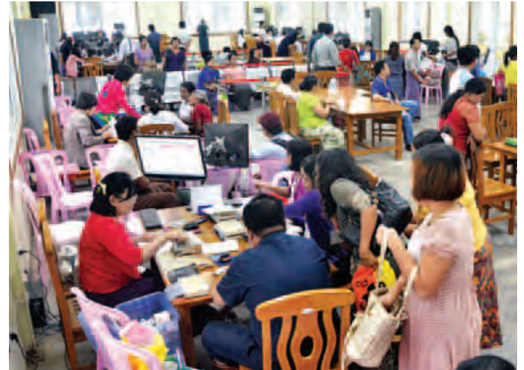
မြို့ပြစီမံကိန်းနှင့် မြေစီမံခန့်ခွဲမှုငှာနတွင် ဆောင်ရွက်နေသည့် OSS ခန်းမကို တွေ့ရစဉ်။

“နောက်ပိုင်းမှာ ရန်ကုန်တစ်မြို့လုံးအတွက် လမ်းတံတားဆိုင်ရာတွေနဲ့ ရေသွယ်မှုဆိုင်ရာတွေကို သတင်းအချက်ပြည့်စုံဖို့အတွက် ပထဝီမြေပုံ (GPS) စနစ်တွေ တပ်ဆင်မှာပါ။ ဥပမာပြောရရင် အိမ်ဆောက်မယ့်သူတစ်ဦးအတွက် ရေပိုက်သွယ်တန်းမယ့်အနေအထား၊ လမ်းတံတားနဲ့သက်ဆိုင်တဲ့ အချက်အလက်တွေအပြင် မြေအောက်ရေစနစ်၊ မိလ္လာစနစ်စတာတွေကိုလည်း မြင်တွေ့တွက်ချက်နိုင်ဖို့ ကြိုးပမ်းသွားမှာပါ။ အမှိုက်သိမ်းယာဉ်တွေမှာလည်း GPS တွေ တပ်ထားပြီး အမှိုက်ကားတွေရဲ့ လုပ်ငန်းဆောင်ရွက်မှုအခြေအနေကို ထိန်းကျောင်းသွားမှာ ဖြစ်ပါတယ်။ အွန်လိုင်းကနေ ဝန်ဆောင်မှု