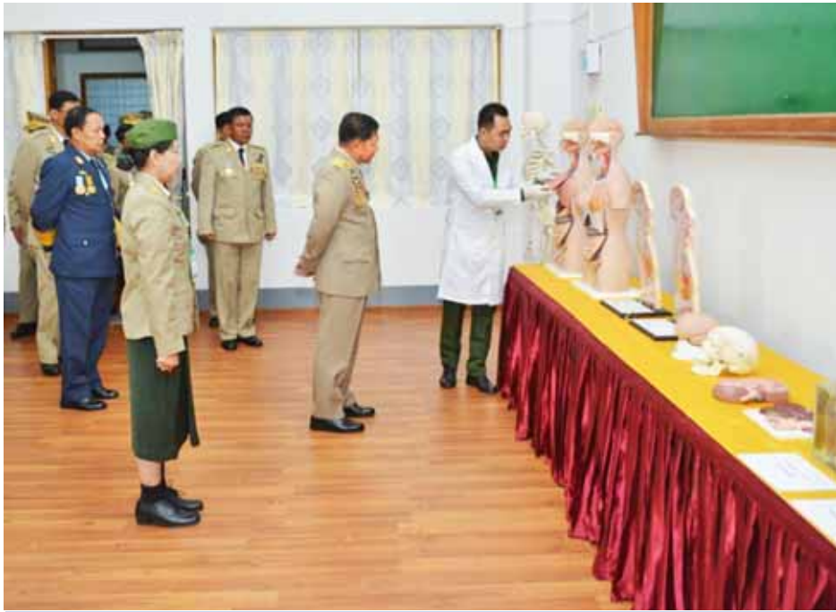
တပ်မတော်ကာကွယ်ရေးဦးစီးချုပ် ဗိုလ်ချုပ်မှူးကြီး သရေစည်သူမင်းအောင်လှိုင် ဆေးပညာသင်ကြားမှုဆိုင်ရာ အထောက်အကူပြုပစ္စည်းများအား ကြည့်ရှုစစ်ဆေးစဉ်။ (မြဝတီ)

နိုင်ငံတော်ကို ကာကွယ်ရမည့် စစ်သည်များသည် ကျန်းမာကြံ့ခိုင်ရန်လိုအပ်သလို နိုင်ငံတော်ဖွံ့ဖြိုးတိုးတက် ရန်အတွက် ကျန်းမာကြံ့ခိုင်ပြီး ဉာဏ်ရည်မြင့်မားသည့် လူသားအရင်းအမြစ်များ အများအပြားလိုအပ်ခြင်း ကြောင့် ကျန်းမာရေးစောင့်ရှောက်မှုလုပ်ငန်းမှတစ်ဆင့် နိုင်ငံတော်နှင့် တပ်မတော်အတွက် ထိရောက်သော အထောက်အကူဖြစ်စေရန် စေတနာထားဆောင်ရွက်သွား