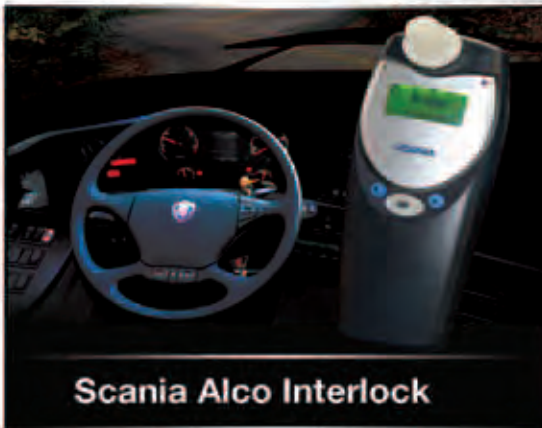
Scania Alco Interlock