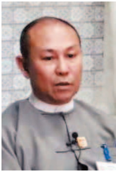
ဦးဆောင်ညွှန်ကြားရေးမှူး ဦးဆောင်ညွှန်ကြားရေးမှူး