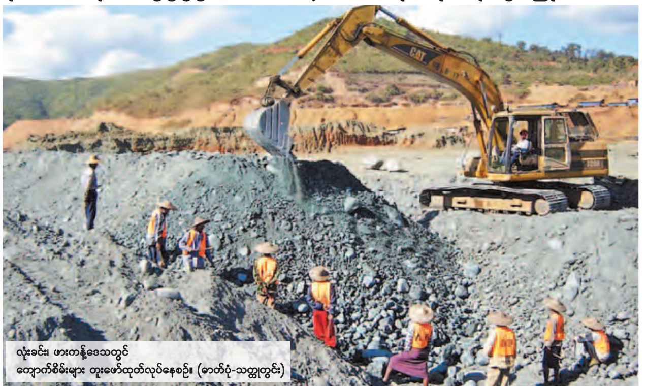
လုံးခင်း၊ ဖားကန့်ဒေသတွင် ကျောက်စိမ်းတူးဖော်ထုတ်လုပ်နေစဉ်။