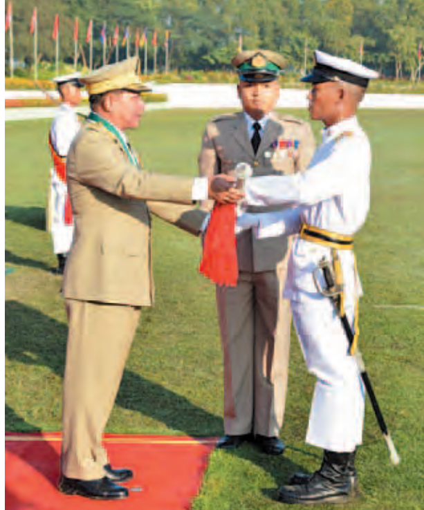
တပ်မတော်ကာကွယ်ရေးဦးစီးချုပ် ဗိုလ်ချုပ်မှူးကြီး သရေစည်သူ မင်းအောင်လှိုင် အောင်စစ်သည်ဆုနှင့် လေ့ကျင့်ရေးထူးချွန်ဆုရရှိသူ ဗိုလ်လောင်းပြည့်ဖြိုးအောင်အား ဆုပေးအပ်ချီးမြှင့်စဉ်။