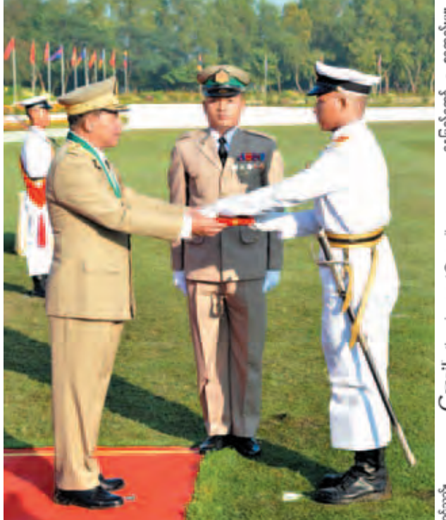
တပ်မတော်ကာကွယ်ရေးဦးစီးချုပ် ဗိုလ်ချုပ်မှူးကြီး သရေစည်သူ မင်းအောင်လှိုင် စာပေးထူးချွန်ဆုရရှိသူ ဗိုလ်လောင်းပိုင်စိုးဦးအား ဆုပေးအပ် ချီးမြှင့်စဉ်။ (မြဝတီ)