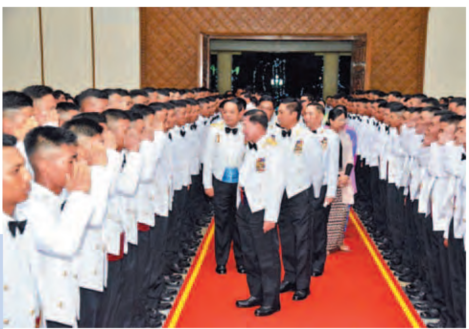
တပ်မတော်ကာကွယ်ရေးဦးစီးချုပ် ဗိုလ်ချုပ်မှူးကြီး မင်းအောင်လှိုင် သင်တန်းဆင်းအရာရှိများအား ရင်းရင်း နှီးနှီး နှုတ်ဆက်စဉ်။ (မြဝတီ)

ဆေးတက္ကသိုလ် စစ်တီးပိုင်းတို့က တီးခတ်ဖျော်ဖြေကြပြီး တပ်မတော် ကာကွယ်ရေးဦးစီးချုပ်က ဂုဏ်ပြုဆု ငွေ ပေးအပ်ချီးမြှင့်သည်။ သင်တန်းဆင်းဂုဏ်ပြုညစာစားပွဲ အပြီးတွင် တပ်မတော်ကာကွယ်ရေး ဦးစီးချုပ်နှင့်အဖွဲ့ဝင်များ၊ ကျောင်းဆင်း အရာရှိများနှင့် မိဘဆွေမျိုးများသည် ဘွဲ့နှင့်သဘင်ခန်းမဆောင်၌ မြဝတီ တေးဂီတအဖွဲ့နှင့် မြဝတီအငြိမ့်အဖွဲ့ တို့၏ ဖျော်ဖြေတင်ဆက်မှုများကို ကြည့်ရှုအားပေးကြသည်။ (မြဝတီ)