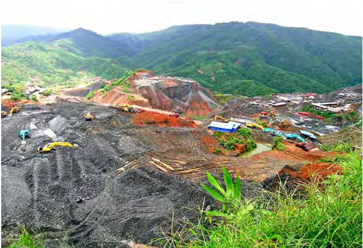
လုံးခင်း၊ ဖားကန့်ဒေသတွင် ကျောက်စိမ်းများ တူးဖော်ထုတ်လုပ်နေစဉ်။ (ဓာတ်ပုံ-သတ္တုတွင်း)

၂၀၀၀ပြည့်နှစ်မှာ နိုင်ငံတော်နဲ့ အကျိုးတူ တူးဖော်မှုစနစ်ကို ဆောင်ရွက်ခဲ့ပါတယ်။ ရောင်းချရတဲ့တန်ဖိုးကနေ ကောက်ခံရမယ့် အခွန်အခတွေကို နတ်ယူပြီး ကျန်ပမာဏအပေါ်မှာ နိုင်ငံတော်က ၂၅ ရာခိုင်နှုန်းနဲ့ လုပ်ငန်းရှင်က ၇၅ ရာခိုင်နှုန်းနဲ့ ခွဲဝေခံစားတဲ့စနစ်နဲ့ ဆောင်ရွက် ခြင်းဖြစ်ပါတယ်။