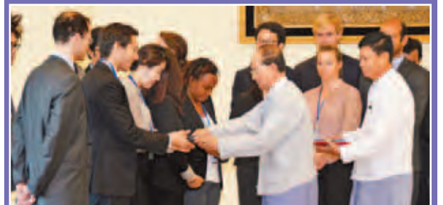
နိုင်ငံတော်သမ္မတ ဦးသိန်းစိန် အမေရိကန်နိုင်ငံ စတန်းဖို့ဒ်တက္ကသိုလ်မှ ညွှန်ကြားရေးမှူးချုပ် ဦးစိုးဝင်းနှင့် ပြည်ထောင်စုငြိမ်းချမ်းရေးညီလာခံ အဖွဲ့ဝင်များအား ညီလာခံအဖွဲ့ဝင်အဖြစ် ခန့်အပ်ခြင်းပေးရာတွင် ဦးစိုးဝင်းက ဦးစီးဆောင်ရွက်ခဲ့ခြင်းကို ဖော်ပြရန် ရုပ်ရှင်ရိုက်ကူးခဲ့ခြင်းဖြစ်သည်။

(ပုံ) သိန်းစိန် နိုင်ငံတော်သမ္မတ ပြည်ထောင်စုသမ္မတမြန်မာနိုင်ငံတော်