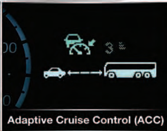
Adaptive Cruise Control (ACC)