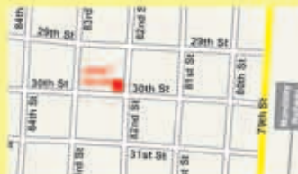
TMW Tower (မန္တလေး) Ph : 02-72580-4

Wai Yan Electronics ဆိုင်ခွဲများအားလုံး ဝိလ်အောင်ကျော် ၀၁-၃၉၈၅၇၀ တောင်ကြီး ၀၈၁-၂၀၀၅၇၁ ပန်းဆိုးတန်း ၀၁-၂၅၀၅၉၇ ပြည် ၀၅၃-၂၄၀၄၀ ကမ္ဘာအေး ၀၁-၄၀၁၄၁၆ နေပြည်တော် ၀၆၇-၈၁၀၈၀၉ အင်းစိန် ၀၁-၆၄၂၆၇၈ ပဲခူး ၀၉-၂၆၀၆၃၂၅၂၅ လားရှိုး ၀၉-၂၅၂၃၃၇၇၃၃