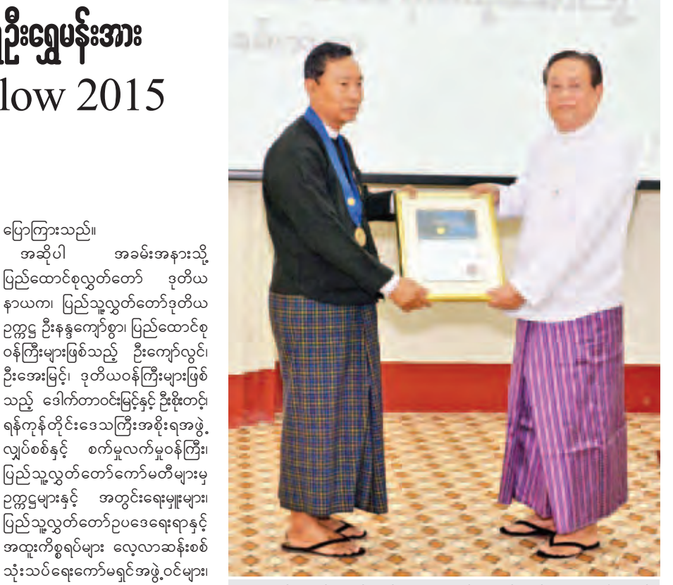
ပြည်ထောင်စုလွှတ်တော်နာယက၊ ပြည်သူ့လွှတ်တော်ဥက္ကဋ္ဌ သူရဦးရွှေမန်း အား မြန်မာနိုင်ငံအင်ဂျင်နီယာအသင်းဥက္ကဋ္ဌ ဦးဝင်းခိုင် AFEO Distinguished Honorary Fellow 2015 ဂုဏ်ထူးဆောင်ဘွဲ့တံဆိပ်ပေးအပ်စဉ်။ (သတင်းစဉ်)

နေပြည်တော် ဒီဇင်ဘာ ၁၇ ပြည်ထောင်စုလွှတ်တော် နာယက၊ ပြည်သူ့လွှတ်တော်ဥက္ကဋ္ဌ သူရဦးရွှေမန်းအား အာဆီယံအင်ဂျင်နီယာအသင်း များအဖွဲ့ချုပ်(ASEAN Federation of Engineering Organisations-AFEO)က ချီးမြှင့်သော AFEO Distinguished Honorary Fellow 2015 ဂုဏ်ထူးဆောင်ဘွဲ့တံဆိပ် ချီးမြှင့်ပေးအပ်ပွဲအခမ်းအနားကို ယနေ့ နံနက် ၈ နာရီတွင် နေပြည်တော် လွှတ်တော်ဝင်းအတွင်းရှိ ဇေယျာဝိသုဒ္ဓိဆောင်၌ ကျင်းပသည်။ ရှေးဦးစွာ မြန်မာနိုင်ငံအင်ဂျင်နီယာ အသင်းဥက္ကဋ္ဌ ဦးဝင်းခိုင်က AFEO Distinguished Honorary Fellow 2015 ဂုဏ်ထူးဆောင်ဘွဲ့တံဆိပ် ချီးမြှင့်ပေးအပ်ခြင်းနှင့်စပ်လျဉ်း၍ ရှင်းလင်းတင်ပြသည်။ ထို့နောက် အာဆီယံအင်ဂျင်နီယာ အသင်းများအဖွဲ့ချုပ်(AFEO)ဥက္ကဋ္ဌ ကိုယ်စား မြန်မာနိုင်ငံအင်ဂျင်နီယာ အသင်းဥက္ကဋ္ဌက ပြည်ထောင်စု လွှတ်တော်နာယက၊ ပြည်သူ့လွှတ်တော် ဥက္ကဋ္ဌအား AFEO Distinguished Honorary Fellow 2015 ဂုဏ်ထူးဆောင်ဘွဲ့တံဆိပ်ပေးအပ်သည်။ ယင်းနောက် ပြည်ထောင်စု လွှတ်တော်နာယက၊ ပြည်သူ့လွှတ်တော် ဥက္ကဋ္ဌ သူရဦးရွှေမန်းက ကျေးဇူးတင် စကား ပြန်လည်ပြောကြားရာတွင် ဂုဏ်ထူးဆောင်ဘွဲ့တံဆိပ် ချီးမြှင့်သည့်အတွက် မြန်မာနိုင်ငံအင်ဂျင်နီယာ အသင်းမှတစ်ဆင့် အာဆီယံအင်ဂျင် နီယာအသင်းများအဖွဲ့ချုပ်(AFEO) ကို ကျေးဇူးအထူးတင်ရှိပါကြောင်း၊ အဆိုပါ ဂုဏ်ထူးဆောင်ဘွဲ့တံဆိပ်ကို တစ်သီးပုဂ္ဂလ ဂုဏ်ပြုခြင်းထက်