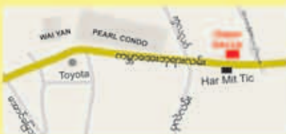
TMW Complex (မဟာစည်) Ph : 01-555996

နှစ်စဉ်နှစ်တိုင်း အားလုံးသိပြီးဖြစ်တဲ့ TMW Complex အပြင် အောက်ပါနေရာများတွင်လည်း တိုးချဲ့ရောင်းချပေးနေပါပြီ။