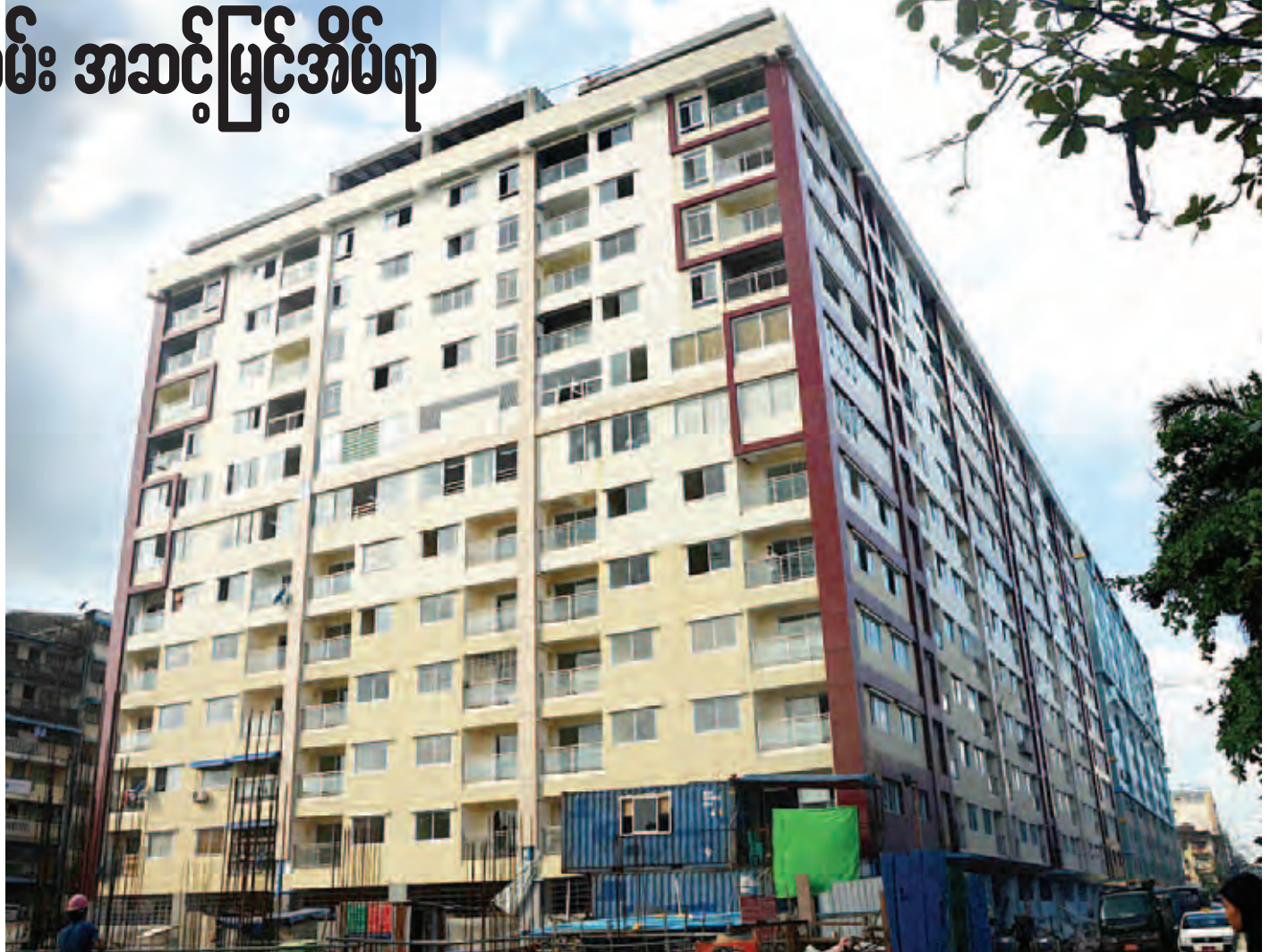
ရန်ကုန်မြို့၊ ဗိုလ်တထောင်မြို့နယ် ၅၁ လမ်း အဆင့်မြင့်အိမ်ရာအဆောက်အအုံကို တွေ့ရစဉ်။

လက်ရှိအစိုးရအဖွဲ့ တာဝန်ယူစဉ် ငါးနှစ်တာကာလအတွင်း အိမ်ရာပြန်လည်ဖွံ့ဖြိုးရေးစီမံကိန်းများ ဆောင်ရွက်ခဲ့ရာတွင် “၅၁ လမ်းအိမ်ရာပြန်လည်ဖွံ့ဖြိုးရေးစီမံကိန်း” သည် စာမျက်နှာ ၈ ကော်လံ ၁ သို့