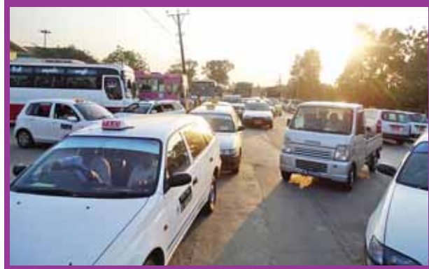
စည်းကမ်းမဲ့ယာဉ်များအား အွန်လိုင်းမှ ပိုက်ဘာဖြင့် ပြည်သူများ တိုင်ကြားမှုဖြင့်တက် စာမျက်နှာ - ၅