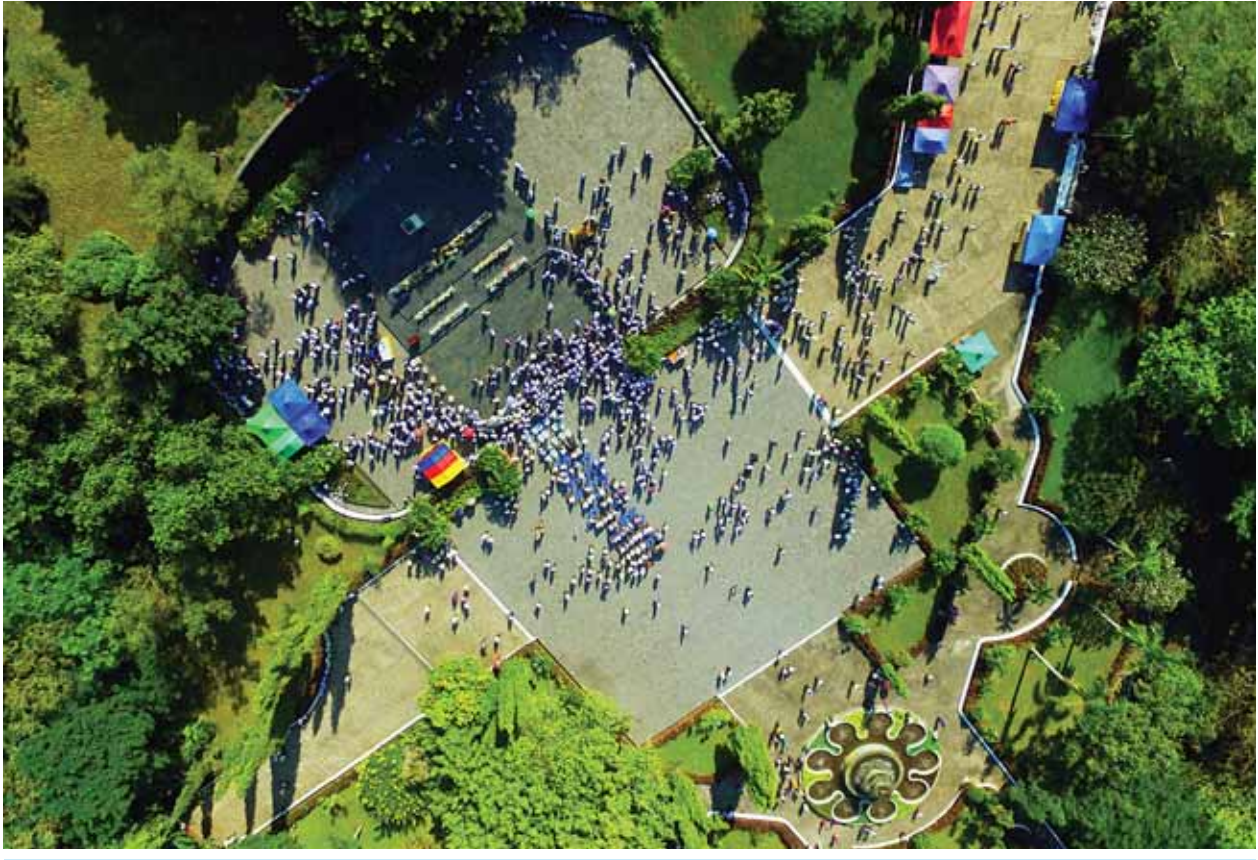
ကျဆုံးခဲ့ရသည့် အညတရစစ်သည်များအား ဂုဏ်ပြုအခမ်းအနားကို အာဇာနည်ခေါင်းဆောင်ကြီးများ၏ ဂုဏ်မာန်အနီးရှိ သူရဲကောင်းစစ်သည်ဗိမာန် တွင် ကျင်းပစဉ်။