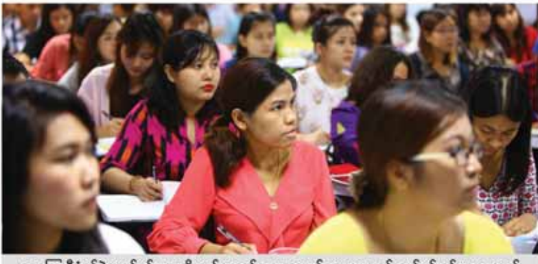
ငွေကြေးစီမံခန့်ခွဲမှုလုပ်ငန်းများကို လုပ်ဆောင်နေသော မန်နေဂျာများနှင့် လုပ်ငန်းရှင်များအတွက်