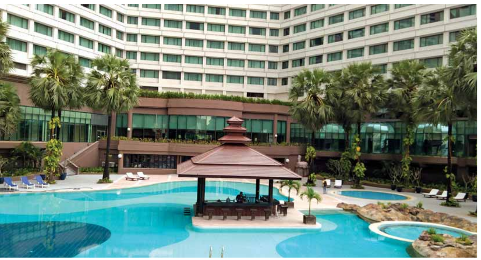
ရန်ကုန်မြို့ရှိ ဆီဒိုးနားဟိုတယ်ကို တွေ့ရစဉ်။

ရန်ကုန် ဒီဇင်ဘာ ၆ မြန်မာနိုင်ငံ၏ ဟိုတယ်နှင့် စီးပွားရေး အဆောက်အအုံပိုင်းဆိုင်ရာ နိုင်ငံခြားရင်းနှီးမြှုပ်နှံမှုတွင် ဒေသတွင်း ခရီးသွားအပြင်အဆိုင် ဆွဲဆောင်ရာ နိုင်ငံများဖြစ်သည့် စင်ကာပူနှင့် ဗီယက်နမ်နိုင်ငံတို့က အများဆုံး လာရောက် ရင်းနှီးမြှုပ်နှံထားကြောင်း ဟိုတယ်နှင့် ခရီးသွားလာရေးလုပ်ငန်း ဝန်ကြီးဌာနမှ တရားဝင်ထုတ်ပြန်ခဲ့ သည့်စာရင်းများအရ သိရသည်။ လက်ရှိ အစိုးရသစ်မတိုင်မီက ခရီးသွားလုပ်ငန်း ဖွံ့ဖြိုးမှုနည်းပါးခဲ့ပြီး ငါးနှစ်တာ ကာလအတွင်းတွင် ခရီးသွားကဏ္ဍ ဖွံ့ဖြိုးတိုးတက်ရေးနှင့် ဟိုတယ်လုပ်ငန်းများ ပြန်လည် အကောင်အထည်ဖော်ရေးကို ပံ့ပိုး ဆောင်ရွက်ခဲ့ရာ ၂၀၁၅ ခုနှစ် နိုဝင်ဘာလအထိ နိုင်ငံခြားရင်းနှီး မြှုပ်နှံမှု ဟိုတယ်စီမံကိန်း ၄၇ ခုနှင့် ရင်းနှီးမြှုပ်နှံမှုတန်ဖိုး အမေရိကန် ဒေါ်လာ ၂၆၄၀ ဒသမ ၃၀၀ သန်း အထိရှိခဲ့ပြီး နိုင်ငံအလိုက် ရင်းနှီး မြှုပ်နှံမှုများတွင် ဒေသတွင်းအာဆီယံ နိုင်ငံများဖြစ်သော စင်ကာပူနိုင်ငံမှ စာမျက်နှာ ၁၀ ကော်လံ ၁ သို့ ❖