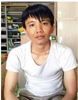
ဓာတ်ပုံဆရာ ကိုကျော်သာ။

ဖြေ။ ကျွန်တော်က ဓာတ်ပုံဆရာဆိုတော့ တောင်တက်နည်းပညာတွေနဲ့ ပတ်သက်ပြီးတော့ မကျွမ်းကျင်ပါဘူး။ တောင်တက်ပစ္စည်းအပြည့်အစုံ