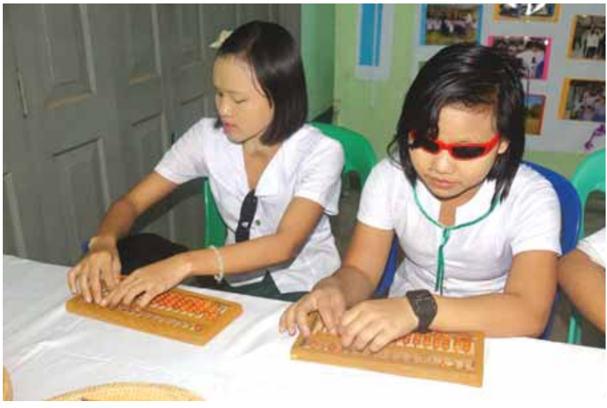
မိုးရမ်း(မုံရွာ)

ယင်းနောက် မုံရွာ၊ စစ်ကိုင်းမြို့ မျက်မမြင်ကျောင်းများမှ တေးသီချင်းများကို တီးခတ်ဖျော်ဖြေကြပြီး တိုင်းဒေသကြီးဝန်ကြီးချုပ်နှင့် တာဝန်ရှိသူများက ဂုဏ်ပြုဆုငွေများ ပေးအပ်ချီးမြှင့်ခဲ့ကြောင်း သိရသည်။