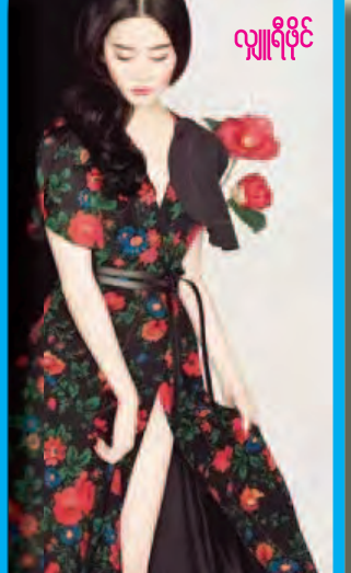
လျှို့ဝှက်