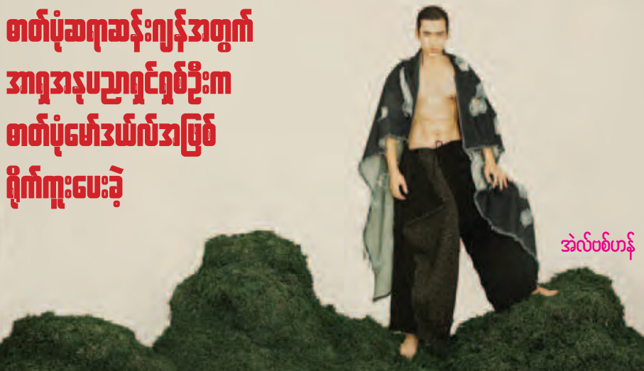
အဲလ်ဗစ်ဟန်