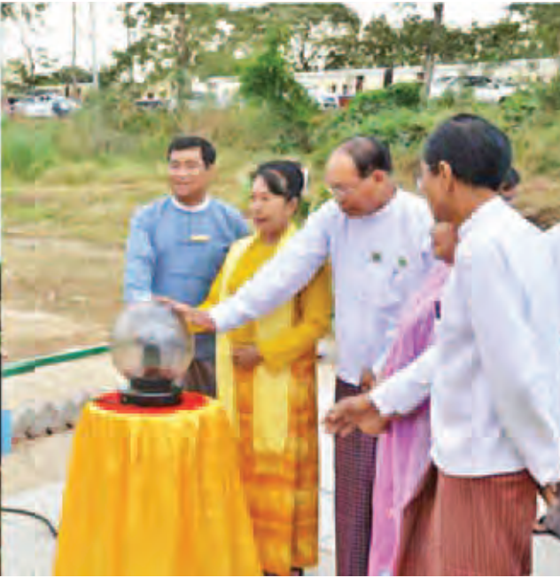
လူမှုဝန်ထမ်း၊ ကယ်ဆယ်ရေးနှင့် ပြန်လည်နေရာချထားရေးဝန်ကြီးဌာန ပြည်ထောင်စုဝန်ကြီး ဒေါက်တာဒေါ်မြတ်မြတ်အုန်းခင်နှင့် တာဝန်ရှိသူများ သဘာဝဘေးအန္တရာယ်စီမံခန့်ခွဲမှု သင်တန်းကျောင်းအောင်ဆိုင်းဘုတ်အား စက်ခလုတ်နှိပ်ဖွင့်လှစ်ပေးစဉ်။

သော ဧရာဝတီတိုင်းဒေသကြီး အတွင်းမှ လူငယ်စုစုပေါင်း ၆၀ ကို ၁၂ ရက်ကြာ သင်ကြားပေးမည် ဖြစ်ပါကြောင်း၊ နောင်အနာဂတ်တွင် Certificate ပေးအပ်သည့် သင်တန်း များသာမက ခြောက်လသင်တန်း၊ တစ်နှစ်သင်တန်း စသည်ဖြင့် Diploma ပေးအပ်နိုင်မည့် သင်တန်း များ၊ ဘွဲ့ကြိုသင်တန်းများ၊ ဘွဲ့လွန်