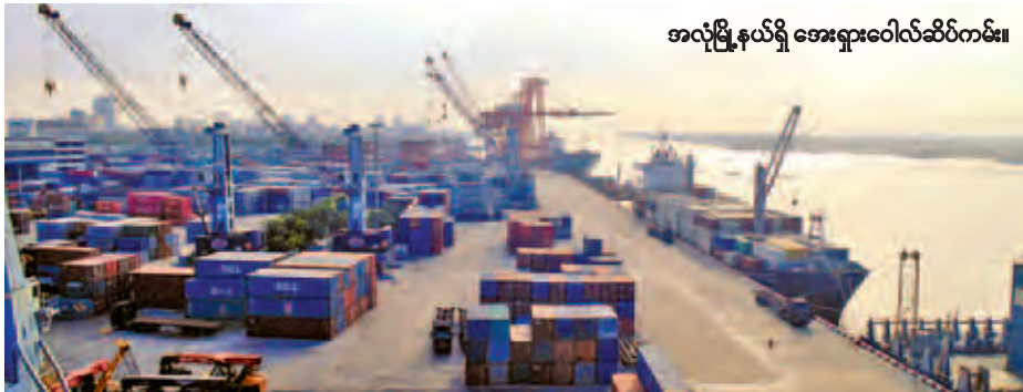
အလုံခြုံနယ်ရှိ အေးရှားဝေါလ်ဆိပ်ကမ်း။

တိုင်းရင်းဆေးတွေမှာ ဖော်စပ် အသုံးပြုတဲ့ ပရဆေးကုန်ကြမ်းတွေ ဖြစ်တဲ့ နံ့သာနီနဲ့ ဒန္တကူးနီတို့မှာ အနီရောင်ဆိုးဆေးပါ။ မပါ စစ်ဆေး တာပါ။ အပြင်မှာသံသယနဲ့ပြောဆိုနေ ကြတာရှိပါတယ်။ ဒီနံ့သာနီတို့ ဒန္တကူး တို့မှာ အရည်အသွေးပိုမိုကောင်းမွန် အောင် အနီရောင်ဓာတ်ဆိုးဆေးတွေ သုံးထားတယ်။ သုံးနိုင်တယ်ဆိုတဲ့ သံသယတွေကို တကယ်ဟုတ်၊ မဟုတ် ဈေးကွက်ထဲမှာရှိတဲ့ ကုန်ကြမ်းတွေကို နမူနာယူပြီးတော့ ဓာတ်ခွဲခန်းမှာလက်တွေ့လေ့လာ စစ်ဆေးလိုက်တော့ ဓာတ်ဆိုးဆေးတွေဆိုးမထားဘူးဆိုတာကို စမ်းသပ်အတည်ပြုနိုင်ခဲ့ပါတယ်။ ဒီကုန်ကြမ်းတွေမှာသဘာဝအတိုင်း အရောင်ပါဝင်မှုရှိတယ်ဆိုတာကို တွေ့ရှိ ခဲ့ရပါတယ်။ (ကြေးမုံ)