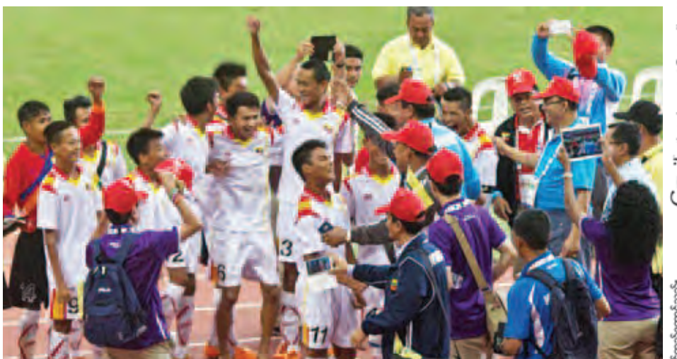
မြန်မာအသင်း အနိုင်ရရှိအပြီး အောင်ပွဲခံနေစဉ်။

စင်ကာပူနိုင်ငံ၌ ကျင်းပလျက် ရှိသည့် အာဆီယံမသန်စွမ်းအားကစား ပြိုင်ပွဲ၏ ခုနစ်ယောက်ဘောလုံး ပြိုင်ပွဲကို ယနေ့ဆက်လက်ကျင်းပရာ မြန်မာအသင်းမှာ အိမ်ရှင် စင်ကာပူကို အနိုင်ယူပြီး နိုင်ပွဲဆက်ခဲ့သည်။ မြန်မာအသင်းမှာ အိမ်ရှင် စင်ကာပူအသင်းကို ငါးဂိုး-သုံးဂိုးဖြင့် အနိုင်ရရှိခဲ့ခြင်းဖြစ်သည်။ အိမ်ရှင် ပရိသတ်များနည်းတူ စင်ကာပူနိုင်ငံ ရောက် မြန်မာပရိသတ်များမှာလည်း တစ်ခဲနက်အားပေးခဲ့ကြသည်။ မြန်မာ အသင်းမှာ ပထမပိုင်းတွင် နှစ်ဂိုး-တစ်ဂိုးဖြင့်သာ အနိုင်ရနေသော်လည်း ဒုတိယပိုင်းအစတွင် သုံးဂိုးဆက်