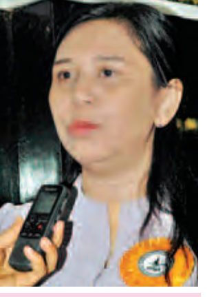
ဒေါ်လတ်လတ်စိုး