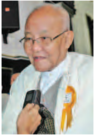
ဦးအုန်းကြိုင်

နေတဲ့အချိန်မှာ လုပ်နိုင်သလောက် ဆရာသမားကြီးတွေရဲ့ သာရေး၊ နာရေး၊ လူမှုရေးတွေကိုလုပ်ပါမယ်။ မြန်မာနိုင်ငံသတင်းစာဆရာအသင်း အနေနဲ့ နိုင်ငံတကာ ပြည်တွင်းပြည်ပ သတင်းသမားတွေနဲ့ ပူးပေါင်းပြီးတော့ ရှေ့ဆက်လုပ်ဆောင်သွားဖို့တွေရှိပါတယ်။ ဦးလူမင်း(မြန်မာနိုင်ငံရုပ်ရှင် အစည်းအရုံးဥက္ကဋ္ဌ)