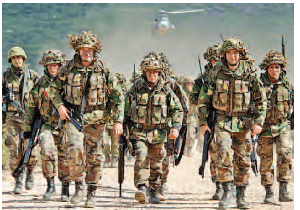
အာဖဂန်နစ္စတန်နိုင်ငံတွင် စစ်သွေးကြွများအား ချေမှုန်းနေသည့် အမေရိကန်တပ်ဖွဲ့ဝင်များကို တွေ့ရစဉ်။

ယင်းစစ်ဆင်ရေးတွင် အာဖဂန် အထူးတပ်ဖွဲ့ဝင်များက မြေပြင်တွင် တိုက်ခိုက်ခဲ့ပြီး အမေရိကန် အထူး တပ်ဖွဲ့က ရဟတ်ယာဉ်များ အသုံးပြု တိုက်ပွဲဝင်ခဲ့သည်။ အာဖဂန်နစ္စတန် တပ်ဖွဲ့များက တာလီဘန်များ၏ ဖမ်းဆီးခြင်းခံထားရသော အာဖဂန်ရဲ အာဖဂန်အမျိုးသား ကြည်းတပ်နှင့် နယ်ခြားစောင့်ရဲများ ပါဝင်သည့် အကျဉ်းသား ၄၀ ခန့်အား လွတ်မြောက် စေခဲ့ကြောင်း အာဖဂန်နစ္စတန်ရှိ အမေရိကန်တပ်ဖွဲ့၏ ထုတ်ပြန်ချက် တွင် ဖော်ပြထားသည်။