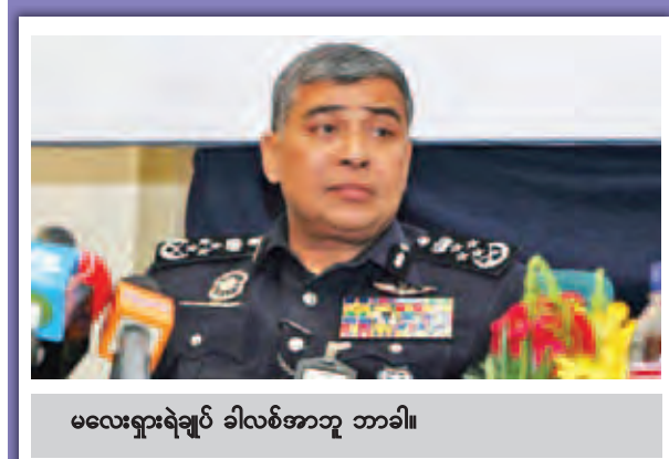
မလေးရှားရဲချုပ် ခါလစ်အာဘူ ဘာခါ။