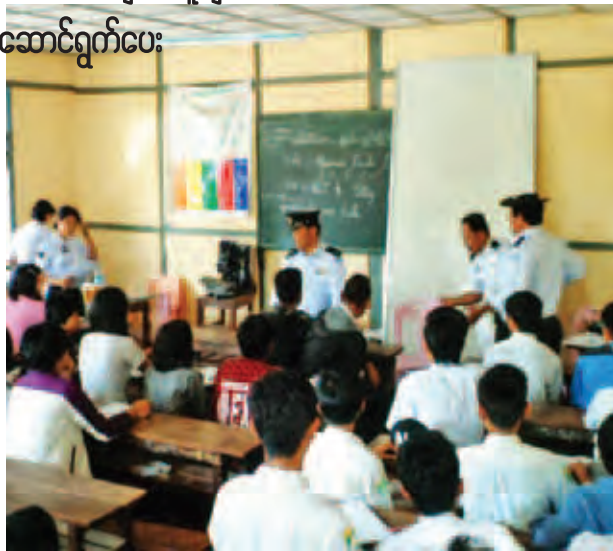
ကြည့်ရှု စစ်ဆေးခဲ့ပြီး ကျောင်းသား ပေးခဲ့ကြောင်း သိရသည်။