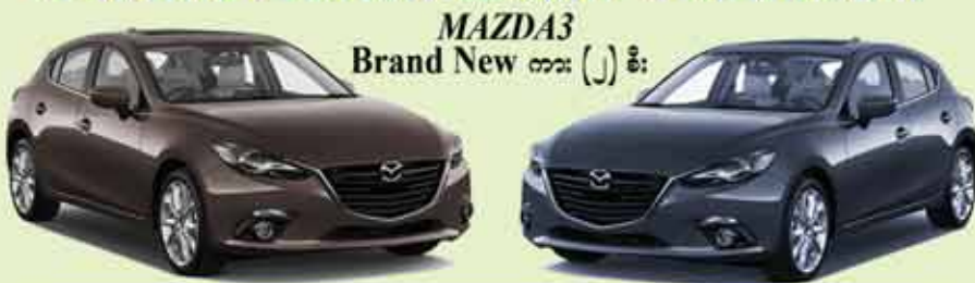
MAZDA3 Brand New ကား (၂) စီး