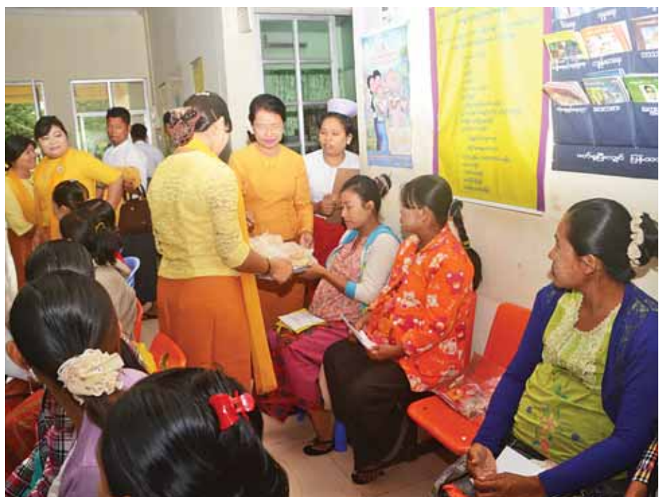
ပြန်ကြားရေးဝန်ကြီးဌာန မိခင်နှင့်ကလေးစောင့်ရှောက်ရေးအသင်းမှ ကိုယ်ဝန်ဆောင်မိခင်များအား အာဟာရဖြစ်စေမည့် အစားအစာများ ကျွေးမွေးထောက်ပံ့စဉ်။ (သတင်းစဉ်)

လွှတ်တော်၏ ပြင်ဆင်ချက်များ အတိုင်း အတည်ပြုသည်။ ထို့ပြင် ပြည်သူ့လွှတ်တော်က ပြင်ဆင်ချက်ဖြင့် အတည်ပြုပေးပို့လာသည့် မြန်မာနိုင်ငံယစ်မျိုးအက် ဥပဒေကို ပြင်ဆင်သည့် ဥပဒေကြမ်းနှင့် ရထားပို့ဆောင်ရေးလုပ်ငန်း ဥပဒေကြမ်းတို့ကို အမျိုးသားလွှတ်တော်က ပြည်သူ့လွှတ်တော်၏ ပြင်ဆင်ချက်များအတိုင်း အတည်ပြုခဲ့ကြသည်။ (သတင်းစဉ်)