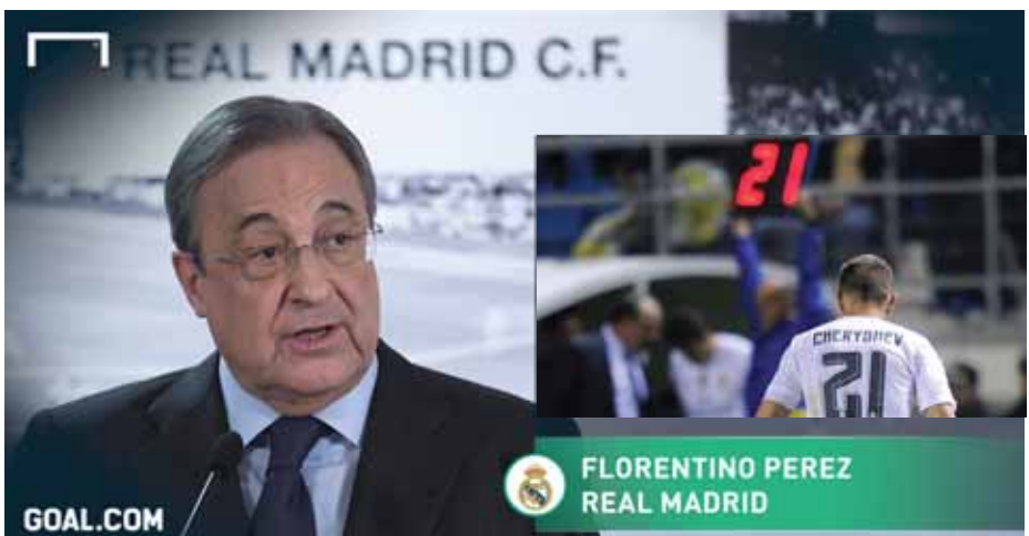
FLORENTINO PEREZ REAL MADRID

ရိုးယံလ်ဥက္ကဋ္ဌကြီးပီရက်င်က ပြီးခဲ့တဲ့ ဒီဇင်ဘာ ၃ ရက်မှာ ကစားခဲ့တဲ့ ကိုပါဒယ်ရေးဖလားပြိုင်ပွဲက အဖြစ် အပျက်နဲ့ပတ်သက်ပြီး သတင်းစာရှင်းလင်းပွဲ တစ်ခုပြုလုပ် ကာ မီဒီယာတွေကတစ်ဆင့် ရိုးယံလ်ရဲ့ လက်ရှိအခြေ အနေကိုရှင်းလင်းမှုပြုခဲ့ပါတယ်။ ပီရက်င်က ရိုးယံလ် အသင်းအနေနဲ့ ဘာအမှားမှမလုပ်ခဲ့သလို သူ့ကိုယ်တိုင် တောင် ချီရစ်ရှက်ဖ်အနေနဲ့ ပွဲပယ်ပြစ်ဒဏ်ကျခံရတာကို မသိပါဘူးလို့ဆိုပါတယ်။ ပြီးခဲ့တဲ့ ဒီဇင်ဘာ၃ရက်နေ့က ရိုးယံလ်နဲ့ ကာဒင်စ်တို့ ယှဉ်ပြိုင်ကစားခဲ့တဲ့ ကိုပါဒယ်ရေး စတုတ္ထအဆင့်(၃၂ သင်းပတ်လည်) ပွဲစဉ်မှာ ရိုးယံလ်က သုံးဂိုး-တစ်ဂိုးနဲ့ အနိုင်ရရှိခဲ့ပါတယ်။ ဒီပွဲစဉ်မှာ ရိုးယံလ် အတွက် အဖွင့်ဂိုးသွင်းသူ ချီရစ်ရှက်ဖ်ဟာ မနှစ်က ဝီလာ ရိုးယံလ်မှာ အငှားနဲ့ သွားရောက်ကစားနေစဉ်အတွင်း အဝါကတ်သုံးကတ်ထိထားတာကြောင့် တစ်ပွဲပယ်ပြစ်ဒဏ် ကျခံထားရသူဖြစ်ပါတယ်။