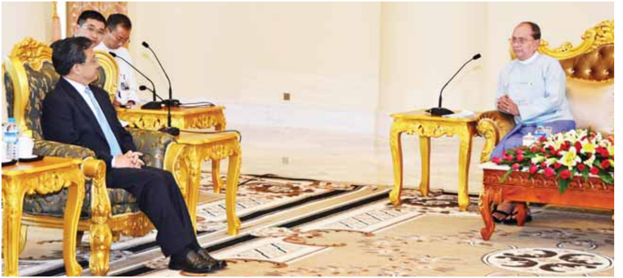
နိုင်ငံတော်သမ္မတ ဦးသိန်းစိန် တရုတ်ပြည်သူ့သမ္မတနိုင်ငံ နိုင်ငံခြားရေး ဝန်ကြီးဌာန ဒုတိယဝန်ကြီး မစ္စတာ လျှိုကျန်းမင် ဦးဆောင်သည့် ကိုယ်စား လှယ်အဖွဲ့အား လက်ခံတွေ့ဆုံစဉ်။ (သတင်းစဉ်)

ထိုသို့လက်ခံတွေ့ဆုံရာတွင် နိုင်ငံတော်သမ္မတနှင့်အတူ ပြည်ထောင်စု ဝန်ကြီး ဦးဝဏ္ဏမောင်လွင်၊ ဦးစိုးသိန်း၊ ဦးရဲထွဋ်နှင့် တာဝန်ရှိသူများ တက်ရောက်ကြသည်။ (သတင်းစဉ်)