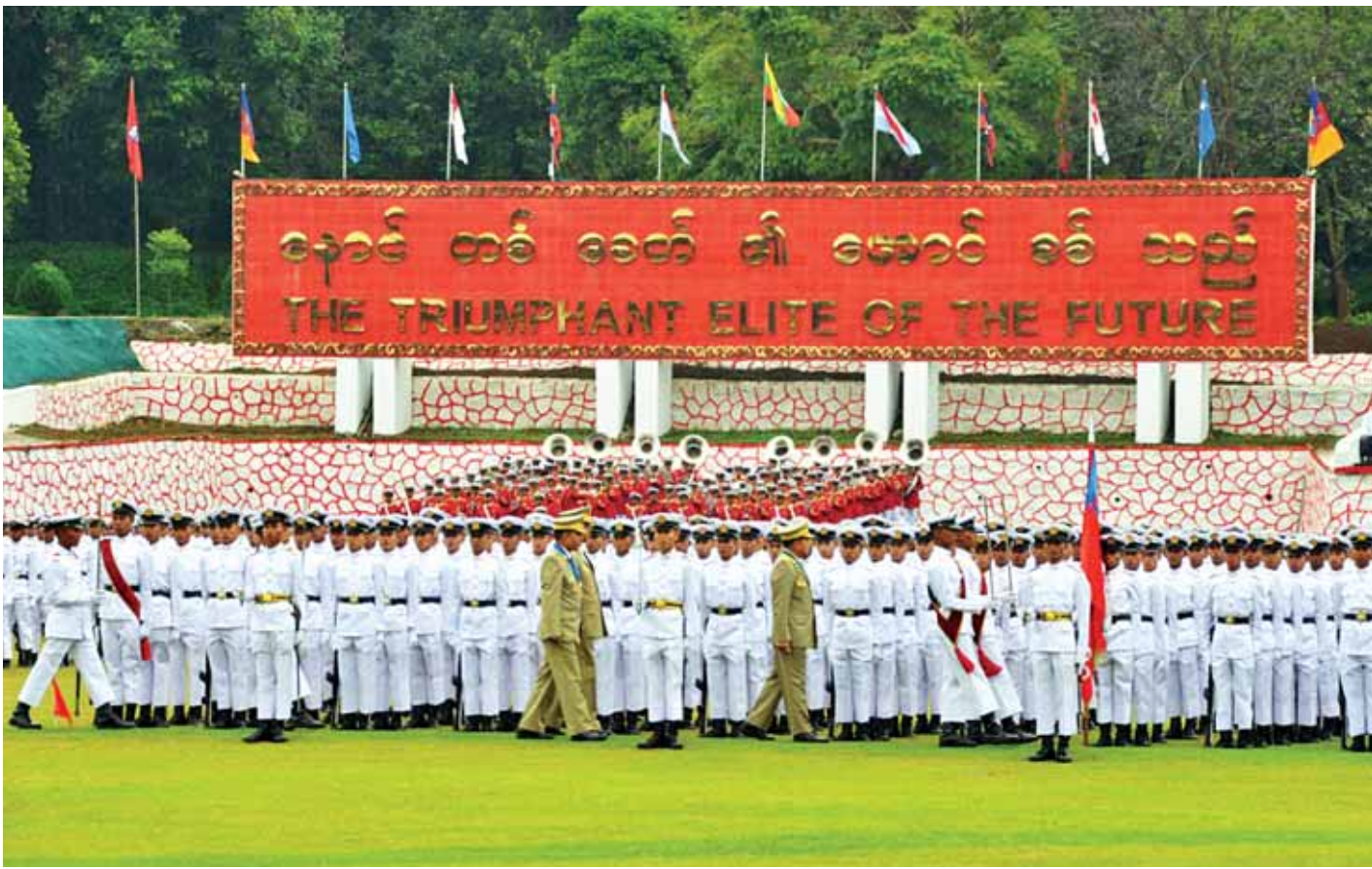
စစ်တက္ကသိုလ်ဗိုလ်လောင်းသင်တန်းအမှတ်စဉ်(၅၇) သင်တန်းဆင်းဂုဏ်ပြုစစ်ရေးပြအခမ်းအနားတွင် တပ်မတော်ကာကွယ်ရေးဦးစီးချုပ် ဗိုလ်ချုပ်မှူးကြီး သရေစည်သူ မင်းအောင်လှိုင် ကျောင်းဆင်းဗိုလ်လောင်းတပ်ရင်းများကို စစ်ဆေးစဉ်။