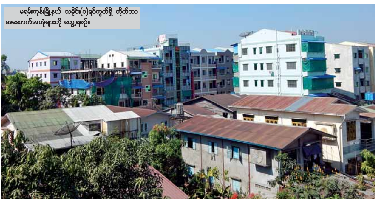
မရမ်းကုန်းမြို့နယ် သမိုင်း(၁)ရပ်ကွက်ရှိ တိုက်တာ အဆောက်အအုံများကို တွေ့ရစဉ်။

ရန်ကုန် ဒီဇင်ဘာ ၄ စီးပွားရေးဖွံ့ဖြိုးတိုးတက်လာမှုများ ဖြစ်ပေါ်လာတော့မည့် မြန်မာနိုင်ငံ အတွင်း အာဆီယံစီးပွားရေးအသိုက် အဝန်းများ(ASEAN ECONOMIC COMMUNITY) အပြိုင်အဆိုင် ဝင်ရောက်လာပြီဆိုလျှင် အိမ်၊ ခြံ၊ မြေ ဈေးကွက်များ ပြန်လည်လှုပ်ခတ် လာတော့မည်ဖြစ်ကြောင်း မြန်မာ နိုင်ငံ အိမ်၊ ခြံ၊ မြေ ဝန်ဆောင်မှု အသင်း(ဗဟို)မှ သိရသည်။ ပြည်နယ်နှင့် တိုင်းဒေသကြီးများ အတွင်းရှိ မြို့နယ်များအလိုက် ပြီးခဲ့ သည့် ၂၀၁၄ ခုနှစ် ဇွန်လပိုင်းက တည်းက အိမ်၊ ခြံ၊ မြေ ဈေးကွက်များ အေးလာခဲ့ခြင်းဖြစ်ပြီး တိုက်ခန်းများ နှင့် လုံးချင်းအငှားပိုင်းဆိုင်ရာများသာ အားကောင်းခဲ့ကြောင်း၊ ရွေးကောက်ပွဲ စာမျက်နှာ ၃ ကော်လံ ၁ သို့ ၀