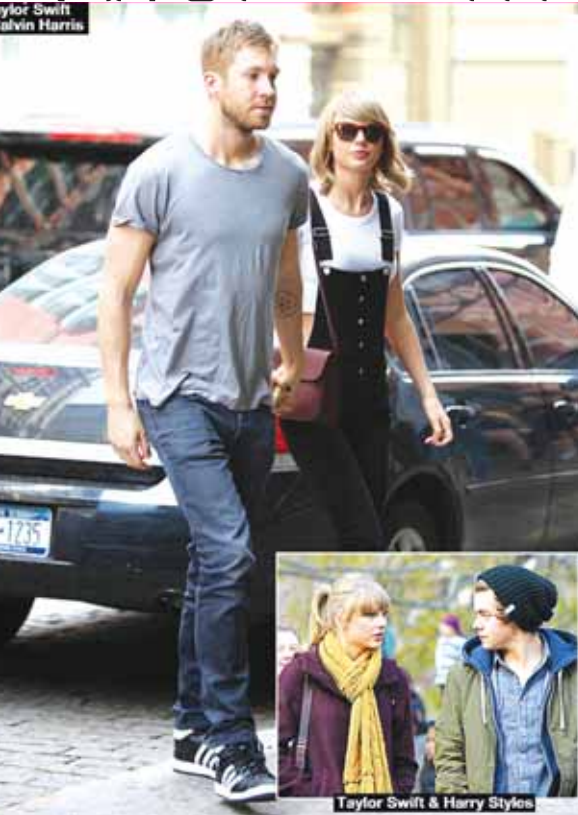
Taylor Swift & Calvin Harris