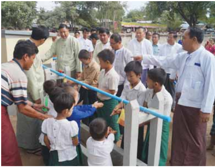
ပေးခဲ့သည်။

ယင်းသို့ဆောင်ရွက်ထားရှိပေးရာတွင် မြိုင်မြို့နယ် ညောင်ကျေးရွာတွင် ယူနိုက်တက်မှ ကျပ်သိန်း ၂၅၀ တန်ဖိုးရှိသော ပိုက်အမျိုးမျိုးနှင့် မိုနိုပန့် (Element) များ၊ ပြည်သူထည့်ဝင်ငွေကျပ်သိန်းပေါင်း ၆၈၂ ဒသမ ၅ သိန်း စုစုပေါင်းကျပ်သိန်း ၉၃၃ ဒသမ ၅ တို့ဖြင့် ကျေးလက်ဒေသဖွံ့ဖြိုးတိုးတက်ရေးဦးစီးဌာနက နည်းပညာပိုင်းဆိုင်ရာများကို ကူညီပံ့ပိုး