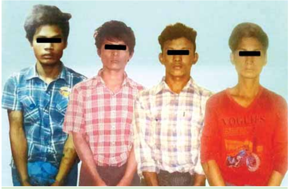
ဒဂုံမြို့သစ် (မြောက်ပိုင်း)မြို့နယ်အတွင်း အငှားယာဉ်မောင်းအား လူသတ်လုယက်သူများကို ဖော်ထုတ် ဖမ်းဆီးရမိစဉ်။ (ရန်ကုန်တိုင်းဒေသကြီးရဲတပ်ဖွဲ့)