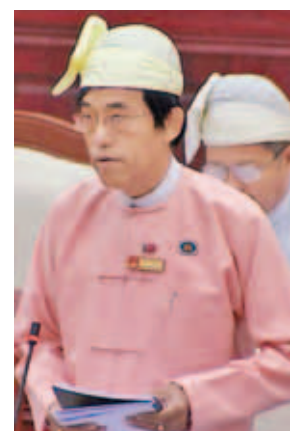
ဦးခိုင်မောင်ရည်

အစည်းအဝေးတွင် ပြည်သူ့လွှတ်တော် ပြည်သူ့ရေးရာစီမံခန့်ခွဲမှုကော်မတီနှင့် ပြည်သူ့လွှတ်တော် ပို့ဆောင်ရေး၊ ဆက်သွယ်ရေးနှင့်ဆောက်လုပ်ရေးဆိုင်ရာ ကော်မတီတို့က အစီရင်ခံစာများကို တင်သွင်းကြရာ ယင်းအစီရင်ခံစာများနှင့် စပ်လျဉ်း၍ ဆွေးနွေးလိုသည့် လွှတ်တော်ကိုယ်စားလှယ် အမည်စာရင်း တင်သွင်းနိုင်ကြောင်း ကြေညာသည်။