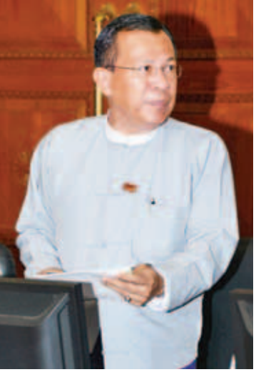
ပြည်ထောင်စုဝန်ကြီး ဒေါက်တာကဇော်။