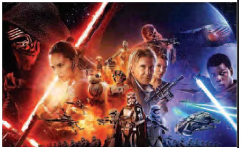
မြိုးစန္ဒာမြင့် - ရေးသားသည်

ဒီဇာတ်ကားမှာ ဝါရင့်အမေရိကန်သရုပ်ဆောင်တွေဖြစ်တဲ့ ဟယ်ရီဆင်ဖီးဒ်၊ မာဒါဟမေးလ်နဲ့ မင်းသမီးကယ်ရီးဖစ်ရှာတို့က အဓိကပါဝင်သရုပ်ဆောင်ထားပါတယ်။ ဒါရိုက်တာ ဂျေဂျေအာ ဘစ်ရဲလက်ရာဖြစ်တဲ့ ဒီဇာတ်ကားသစ်ကို ဝေါ့သ်ဒစ်စနောကနေ ဖြန့်ချိထားတာပါ။