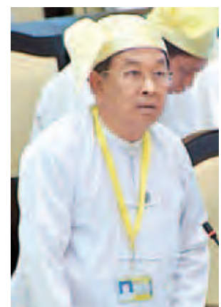
ဒုတိယဝန်ကြီး ဦးထင်အောင်

ပထမအကြိမ် အမျိုးသားလွှတ်တော် (၁၃)ကြိမ်မြောက် ပုံမှန်အစည်းအဝေး ဒသမနေ့ကို ယနေ့နံနက် ၁၀ နာရီတွင် ကျင်းပရာ မြန်မာနိုင်ငံသားများ ရင်းနှီးမြှုပ်နှံမှု ဥပဒေကိုပြင်ဆင်သည့် ဥပဒေကြမ်းအပါအဝင် ဥပဒေကြမ်း ၅ ခု ဆွေးနွေးခြင်း၊ အစီရင်ခံစာဖတ်ကြားခြင်းနှင့် အတည်ပြုခြင်းတို့ကို ဆောင်ရွက်ကြသည်။