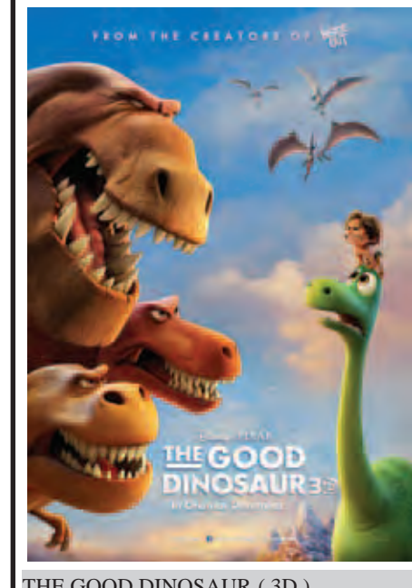
THE GOOD DINOSAUR ( 3D )

တကယ်လို့ ကမ္ဘာကြီးပေါ်ကို လွန်ခဲ့တဲ့နှစ်သန်းပေါင်းများစွာက ဥက္ကဋ္ဌခဲကြီးသာ ဝင်မတိုက်ခိုက်ခဲ့ရင် ကမ္ဘာကြီးပေါ်မှာ ယခုတိုင် ခိုင်နိမ့်ဆောသတ္တဝါကြီးတွေ ရှိနေနိုင်ပြီး မလားဆိုတာ လူတိုင်းသိချင်ကြမှာပါ။