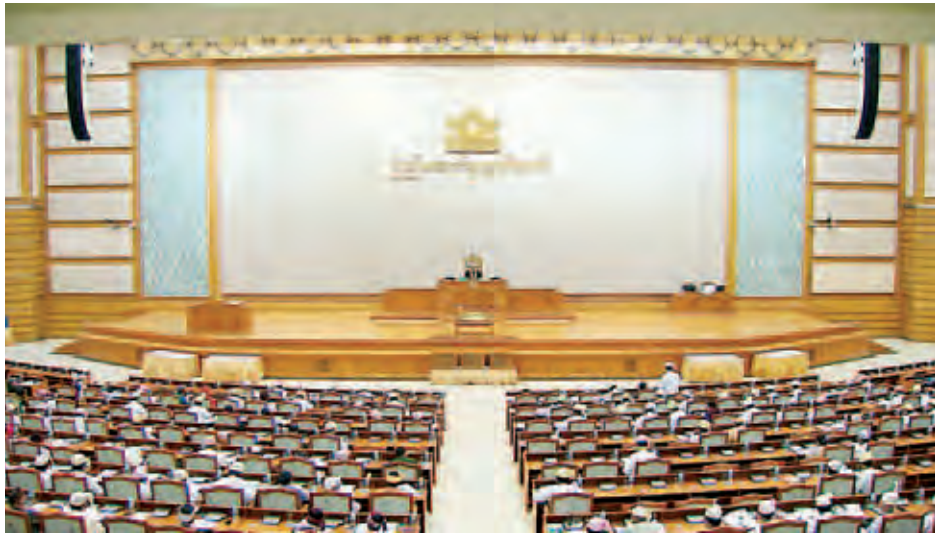
ပထမအကြိမ် ပြည်ထောင်စုလွှတ်တော် (၁၃)ကြိမ်မြောက် ပုံမှန်အစည်းအဝေး အငြိမ်းစားနေ့ကို (သတင်းစဉ်)

ပထမအကြိမ်ပြည်ထောင်စုလွှတ်တော် (၁၃)ကြိမ်မြောက်ပုံမှန်အစည်းအဝေး အငြိမ်းစားနေ့ကို ယနေ့မနက် ၁ နာရီခွဲတွင်ကျင်းပရာ နောက်ထပ်ဘဏ္ဍာငွေ ခွဲဝေသုံးစွဲရေး ဥပဒေကြမ်းအား ရှင်းလင်းဆွေးနွေးခြင်း၊ ကျောက်ဖြူ အထူးစီးပွားရေးဇုန်အဖြစ် သတ်မှတ်ကြေညာသည့် အမိန့်ကြော်ငြာစာထုတ်ပြန်နိုင်ရေးကိစ္စရှင်းလင်းခြင်းနှင့် ခရီးသွားလုပ်ငန်း ပူးပေါင်းဆောင်ရွက်မှု ပိုမိုခိုင်မာရေး သဘောတူစာချုပ်ချုပ်ဆိုခြင်း မြန်မာနိုင်ငံက ပါဝင်လက်မှတ်ရေးထိုးရေးကိစ္စနှင့်စပ်လျဉ်း၍ ဆွေးနွေးပြီး အဆုံးအဖြတ် ရယူခြင်းတို့ကို ဆောင်ရွက်ကြသည်။