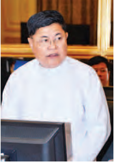
ပြည်ထောင်စုဝန်ကြီး ဦးစိုးသိန်း။