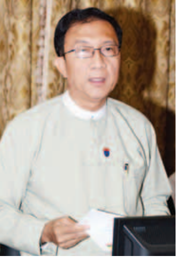
ပြည်ထောင်စုဝန်ကြီး ဦးဝင်းရိန်။

ကြည့်ရှုဆန်းစစ်နိုင်မည့် နိုင်ငံခြားအကူအညီ အထောက်အပံ့ သတင်းအချက်အလက်စနစ် (Aid Information Management System)ကိုလည်း တည်ထောင်နိုင်ခဲ့သည့် အတွက် အပြည်ပြည်ဆိုင်ရာ အဖွဲ့အစည်းများ ၏ ယုံကြည်မှုကို ပိုမိုရရှိလာခဲ့ပါကြောင်း။