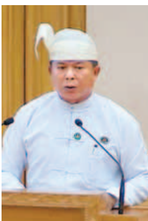
ဦးတင်မောင်ဦး

ပထမအကြိမ် ပြည်သူ့လွှတ်တော် (၁၃)ကြိမ်မြောက်ပုံမှန်အစည်းအဝေး (၁၁)ရက်မြောက်နေ့ကို ယနေ့နံနက် ၁၀ နာရီတွင် ကျင်းပရာ အစီရင်ခံစာ (၂)ခု တင်သွင်းပြီး အစီရင်ခံစာ(၁)ခု လွှတ်တော်၏ အတည်ပြုချက်ရယူခြင်း၊ ဥပဒေကြမ်း(၄)ခု လွှတ်တော်၏ အဆုံးအဖြတ်ရယူခြင်းတို့ ဆောင်ရွက်ကြသည်။